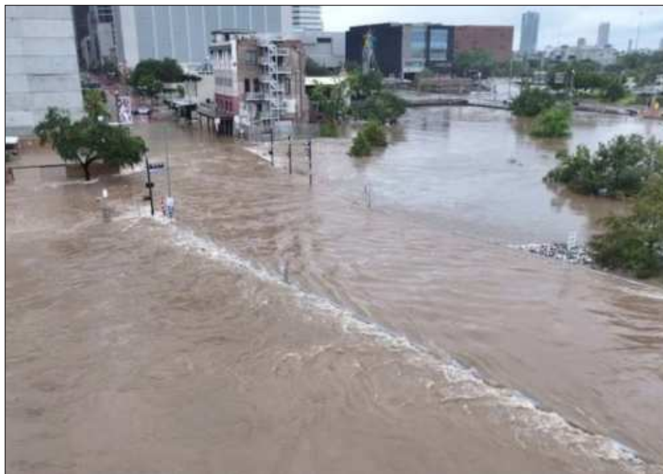
▲ Ocho víctimas se suman a las 10 que Beryl dejó la semana pasada en el Caribe: tres en Granada, dos en San Vicente y las Granadinas, tres en Venezuela y dos en Jamaica.

El fenómeno climático, que tras azotar Texas tomó rumbo noreste en territorio estadounidense, causó una muerte más en la localidad