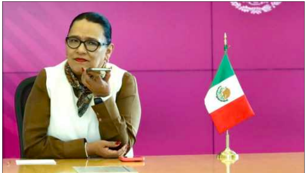
▲ El presidente López Obrador subrayó que conoce a la funcionaria desde hace 34 años, cuando ella era periodista, y que se trata de “una mujer excepcional, con principios, ideales, que viene de abajo”.

“Y de una vez lo digo: soy un presidente naco , chinto y chairo ”, afirmó. “Pertenezco al pueblo y al pueblo raso. Que quede claro. Y no soy fifi ”.