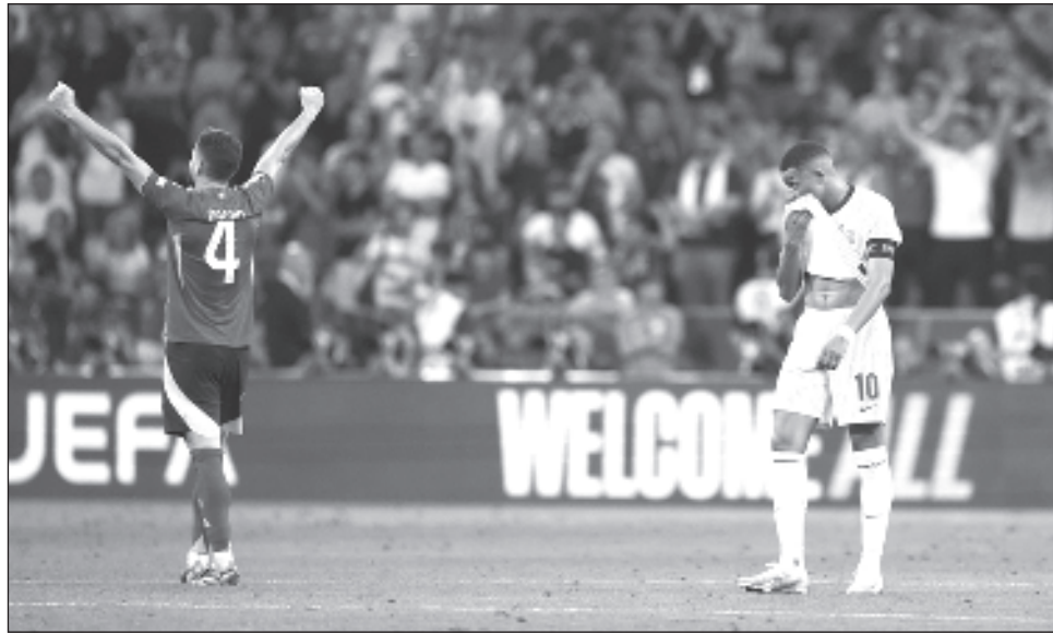
▲ Kylian Mbappé se lamenta mientras Nacho festeja tras la semifinal en Múnich.

España, que busca un cuarto título de la Euro, jugará contra Países Bajos o Inglaterra en la final en Berlín