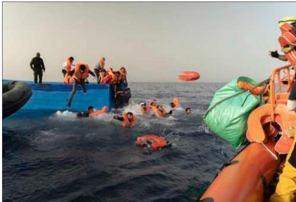
▲ Los hechos ocurrieron en aguas internacionales, a decenas de millas de las costas de Libia, en un incidente poco habitual, cuando “llegaron a la escena dos lanchas” conducidas por dos hombres con pasamontañas de los cuales la ONG no pudo determinar la identidad.

Estas dos personas, “con el rostro cubierto”, abordaron la barca de madera con los migrantes aún a bordo, lo que “generó el pánico”.