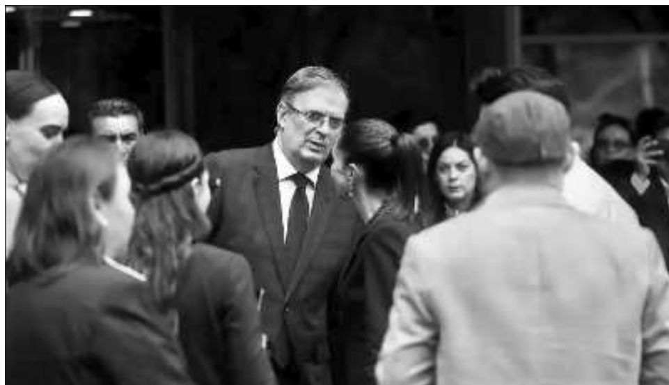
▲ Marcelo Ebrard expuso que estuvieron representantes de bancarias, financieras, especialistas en inversión. “La doctora Sheinbaum presentó las prioridades del próximo gobierno”.

“Es una cifra muy alta si se compara con lo que ha sido históricamente la tasa de inversión extranjera en México”, y abarca no sólo las regiones centro y norte del país, sino también el sur, afirmó en conferencia de prensa, al término de la participación de Sheinbaum en la Reunión Anual de la International Monetary Conference, con 150 banqueros de diferentes partes del mundo.