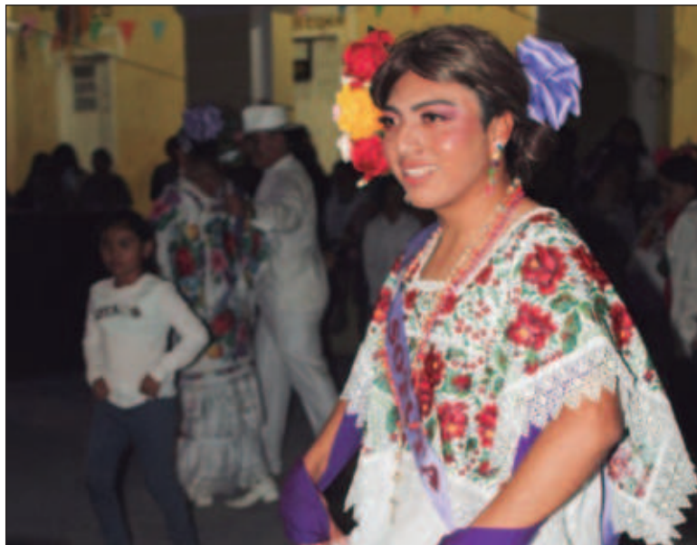
▲ “Es maravilloso ver que en una sociedad tan rígida como la yucateca ya sea posible visualizar parejas de hombres gay o mujeres lesbianas acudiendo a las vaquerías y bailando sin miedo a los prejuicios”.

En estos lugares, los conceptos referidos a la sexualidad fueron impregnados por los prejuicios religiosos cristianos; numerosas voces y expresiones mayas contemporáneas son ofensivas y denigrantes. Afortunadamente, muchos jóvenes mayas nos hemos apropiado de ellas y hemos ido resignificando estos calificativos. Las palabras siis óol (corazón frío), siis tuuch (ombligo frío) y siisk'ab (mano fría) tienen una connotación de malestar y se asocian a la mala suerte, se considera que una persona siisk'ab , con la mano fría, nace con un defecto que provoca calamidades (la más conocida es