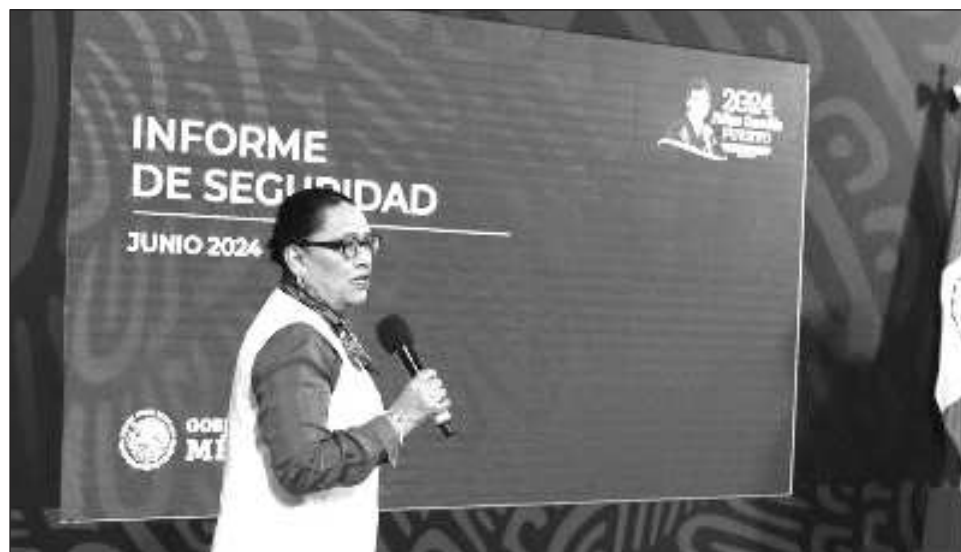
▲ Cifras presentadas por la funcionaria indican que aún con el incremento, el promedio diario de asesinatos ha tenido una baja acumulada de 18% respecto a la cifra observada en 2018.

Cifras presentadas por la funcionaria indican que aún con el incremento observado, el promedio diario de asesinatos ha tenido una baja acumulada de 18 por ciento respecto a la cifra en 2018 al inicio de este gobierno. Señaló que en lo que va del año