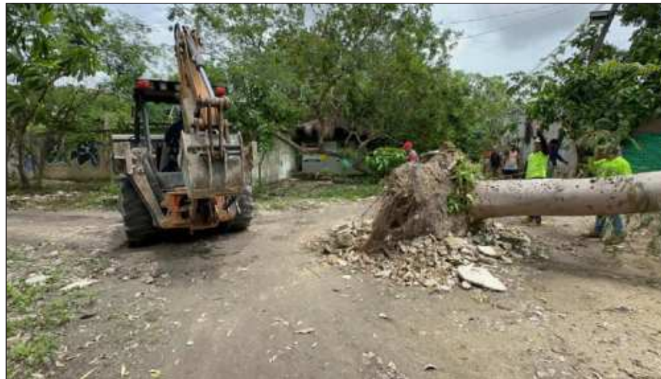
▲ La iniciativa surgió tras una campaña de recaudación de fondos y se centró en la preservación y reubicación de vegetación crucial para el entorno local.

“La ceiba, conocida por su imponente presencia y significado cultural, es considerada un árbol divino por los mayas, simbolizando la conexión entre