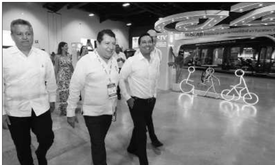
▲ Al inaugurar el encuentro, el gobernador Mauricio Vila llamó a aprovechar estos tres días para regresar a casa con una visión más amplia del desarrollo sostenible.

Se trata de un evento organizado por Pronus y enca-