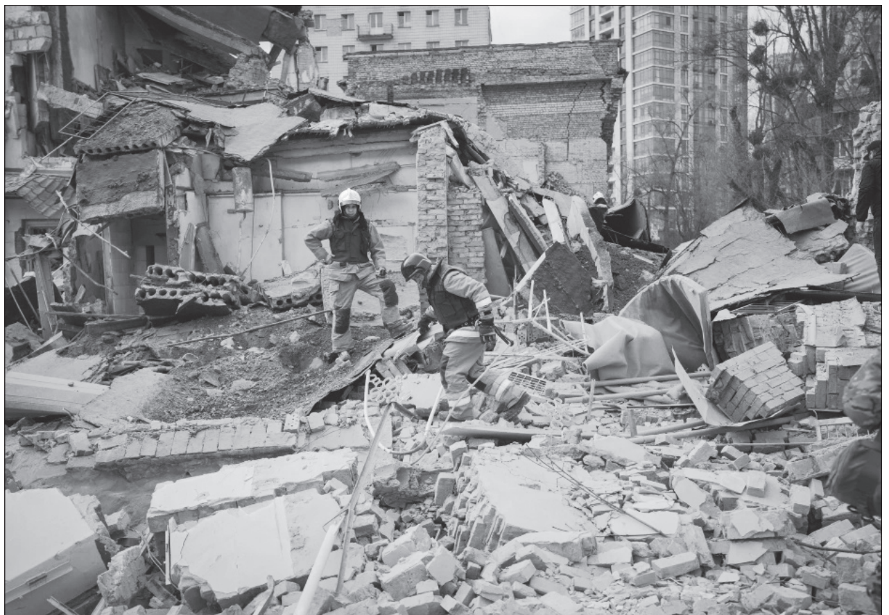
▲ La OTAN subrayó en su informe que, "además del sufrimiento humano, la invasión ha tenido efectos climáticos y medioambientales devastadores, con consecuencias de gran alcance en toda Ucrania y más allá de sus fronteras".

El informe responde al compromiso de la OTAN de aumentar la comprensión de los aliados sobre el impacto del cambio climático en su seguridad, y contribuirá a la adaptación de la Alianza a este nuevo entorno estratégico y operativo, aseguró la organización.