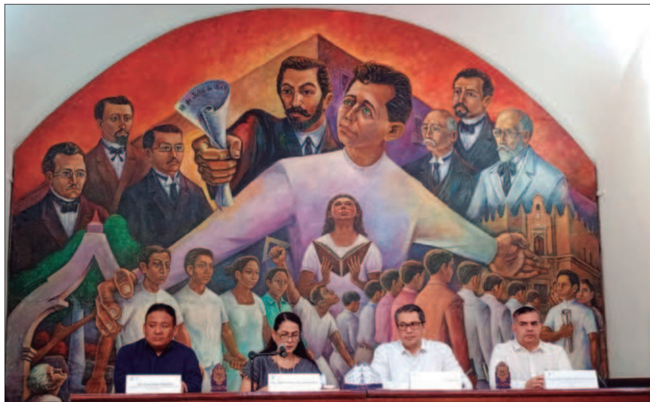
▲ De acuerdo con la directora general de la Filey, "el premio tiene una historia que empezó en el año 2013, en ese año se le entregó a José Emilio Pacheco, se acordó con él que el premio llevara su nombre, y que él vendría a entregarlo, sólo que falleció al año siguiente".

Pueden nominar asociaciones de carácter académico, civil, cultural o editoriales que estén debida-