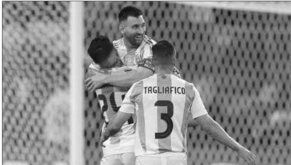
▲ Lionel Messi y Argentina están en otra final, donde serán favoritos para conquistar una nueva corona.

En el libro de récords, Messi nada más es superado por los 130 tantos de Cris-