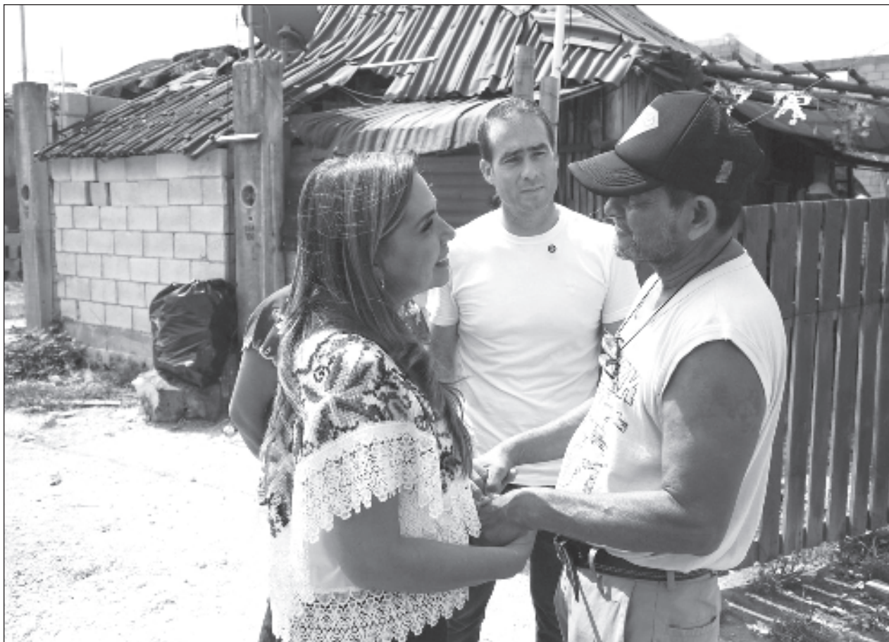
▲ La gobernadora Mara Lezama y el alcalde Diego Castañón recorrieron las colonias Sac Bé y 2 de Octubre, que resultaron afectadas por el huracán Beryl y entregaron más de mil apoyos alimentarios.

Diego Castañón expuso que esta jornada de ayuda es parte de un esfuerzo continuo por parte de las autoridades locales y estatales para mitigar los efectos del desastre natural y garantizar el bienestar de la población en tiempos de crisis.