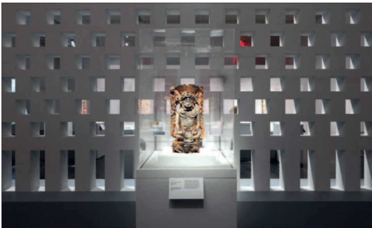
▲ Aquí en el Met, las piezas prehispánicas son obras de arte, dijo Max Hollein, director del Museo Metropolitano de Arte, quien adelantó que en septiembre de este año abrirá una muestra de grabados de Posada, Rivera y Orozco, entre otros.