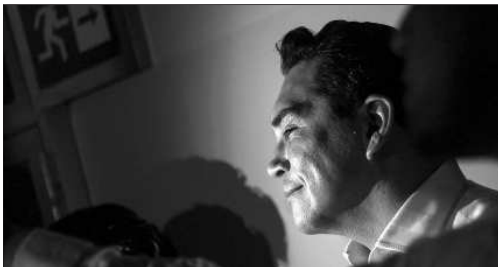
▲ La respuesta de Alito ha sido la descalificación y las acusaciones, ya sea llamándolos "priistas de Polanco" o vinculándolos al asesinato de Luis Donald Colosio.

La tensión dentro del PRI es también histórica. Ahí se han dado enfrentamientos entre "tecnócratas" y "populistas", que no es más que la reducción de uno de los grandes debates políticos que ha tenido México sobre qué tipo de gobierno es el que le resultaría más apropiado. Sin duda, veremos un nuevo conflicto interno en ese partido.