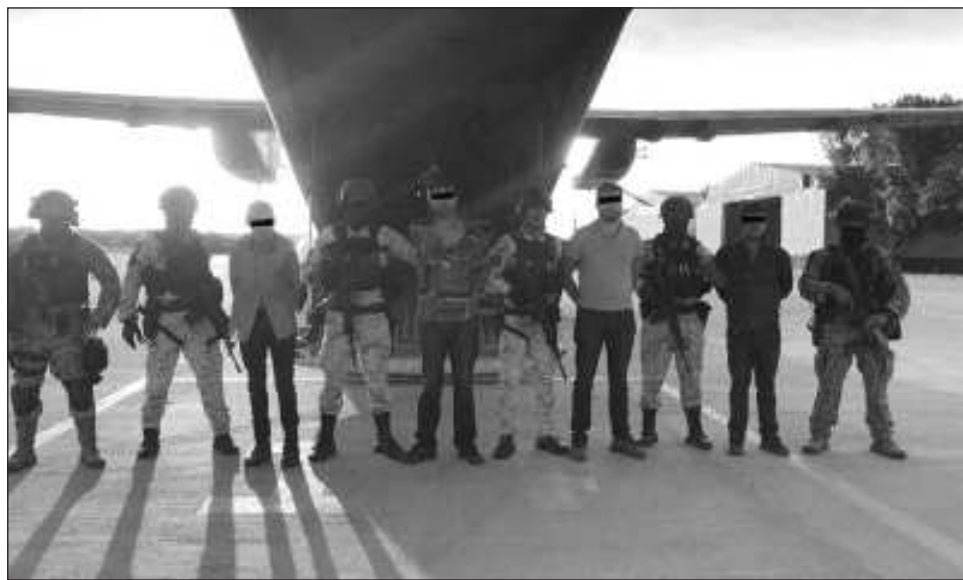
▲ Los datos proporcionados por la Sedena señalan que El R-8 era el encargado de la coordinación de la seguridad y la adquisición del equipo táctico y armamento del hermano de El Chapo .

Luis N es identificado por las autoridades federales como integrante del primer círculo de seguridad de Aureliano Guzmán Loera, líder del grupo conocido como