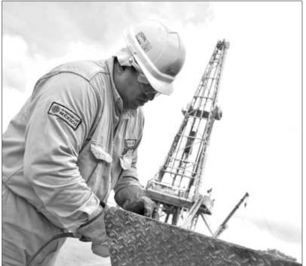
▲ El presidente del Clúster de Energía dijo que con estos pagos, las micro y medianas empresas han comenzado a superar las adversidades y los compromisos financieros que registraban.

“Es importante destacar que también las empresas que registraban retrasos en sus pagos a sus empleados, lo han regularizado, en beneficio de las familias carmelitas”, concluyó.