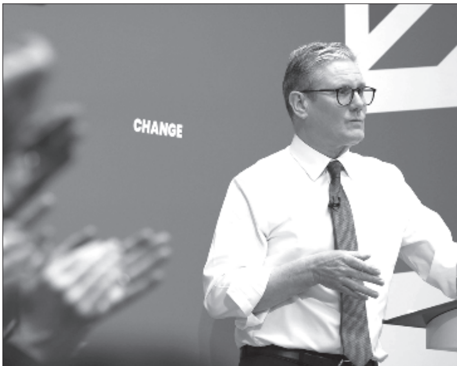
▲ Keir Starmer se dirigió por primera vez a la Cámara baja tras la rotunda victoria del Partido Laborista en los comicios del pasado jueves, cuando ganó 412 escaños.

Una vez constituido el nuevo Parlamento, el rey Carlos III inaugurará oficialmente el periodo de sesiones el 17 de julio.