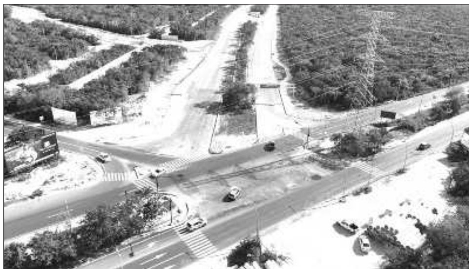
▲ El presidente de la Federación Mexicana de Colegios de Ingenieros Civiles, Carlos Ernesto Fierros Pacheco, puntualizó que “es muy importante que el país ya tenga trabajos de planeación, no es nuevo, ya en alguna época se realizó”.

Encaminados en esta propuesta formal, dio a conocer que se están tomando ya ejemplos de operatividad en otros países, como Chile y Gran Bretaña, donde ellos llevan un proceso de planeación de cuatro a cinco años, lo que