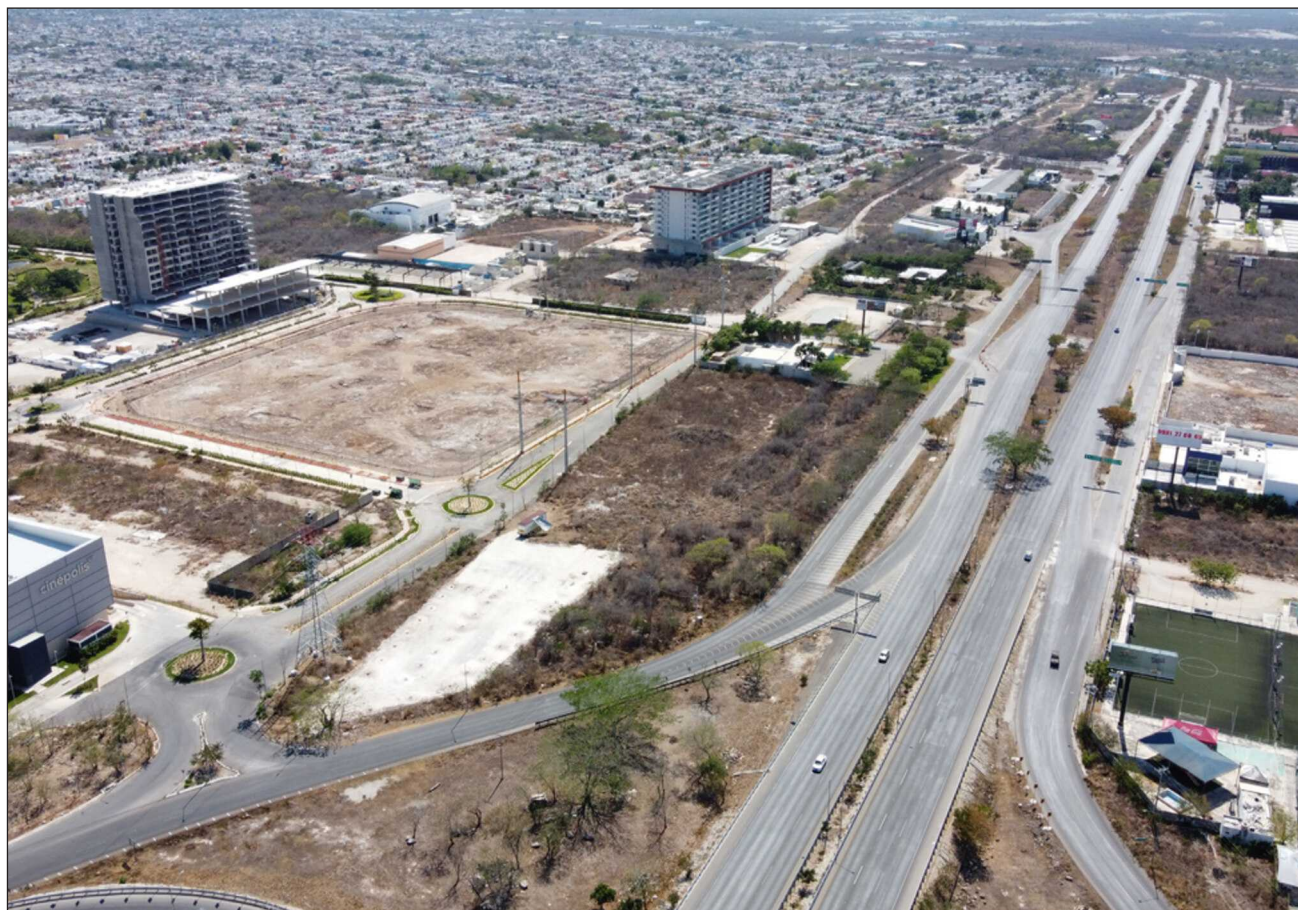
▲ Entre los primeros diagnósticos del Plan Renacimiento para Mérida, se alertó sobre el aumento de la población en la capital yucateca y el crecimiento del parque vehicular, situaciones que han incrementado el impacto en la infraestructura y accidentes viales.

La tercera fase de este Plan se llevará a cabo del 20 de julio al 10 de agosto con la sistematización de las propuestas y la elaboración del documento base para finalmente, en una cuarta fase dar a conocer el proyecto completo con las prioridades validadas.