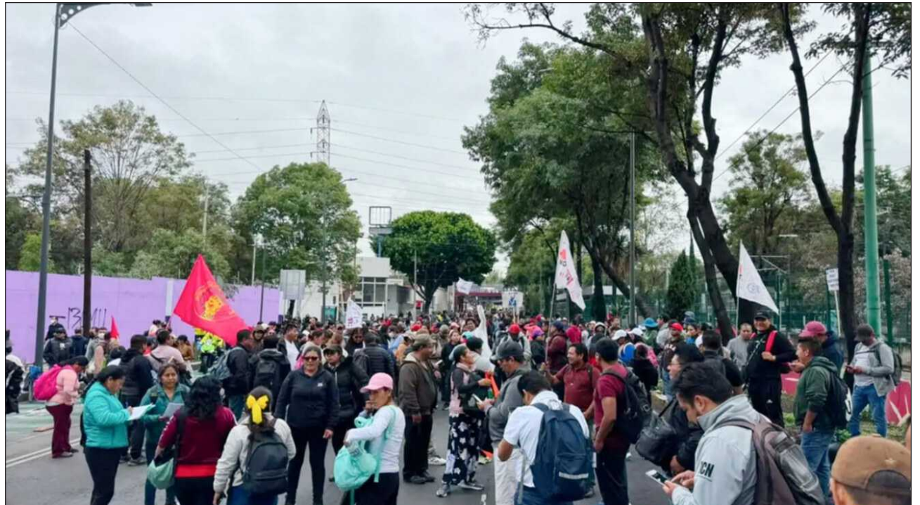
▲ Desde poco antes de las 10 horas de este martes, cientos de profesores comenzaron a concentrarse en esta vialidad, a la altura de Taxqueña, para exigir una mesa de diálogo con la presidenta Sheinbaum.

Durante el trayecto de la manifestación, vecinos salieron de sus casas a mostrarles apoyo con aplausos y levantando los puños. Como respuesta, los docentes respondieron con “ese apoyo si se ve, ese apoyo si se ve”.