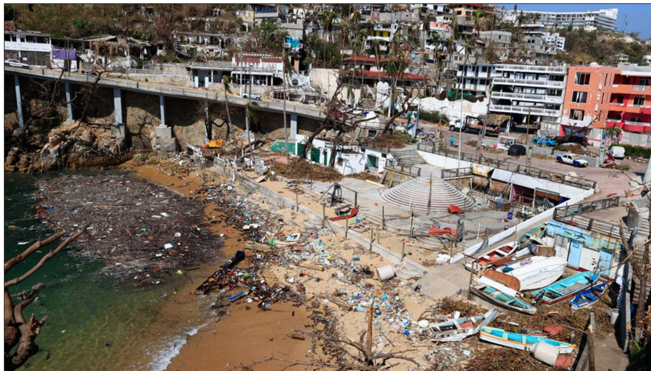
▲ El seguro fue diseñado para garantizar una respuesta financiera oportuna ante catástrofes de alta severidad.

“Su cobertura abarca todo el territorio nacional ante sismos, erupciones volcánicas, huracanes e inundaciones de severidad media alta, con vigencia del 5 de junio de 2026 al 5 de mayo de 2027”, detalló la dependencia al dar a conocer el contrato con Agroasemex, S.A.