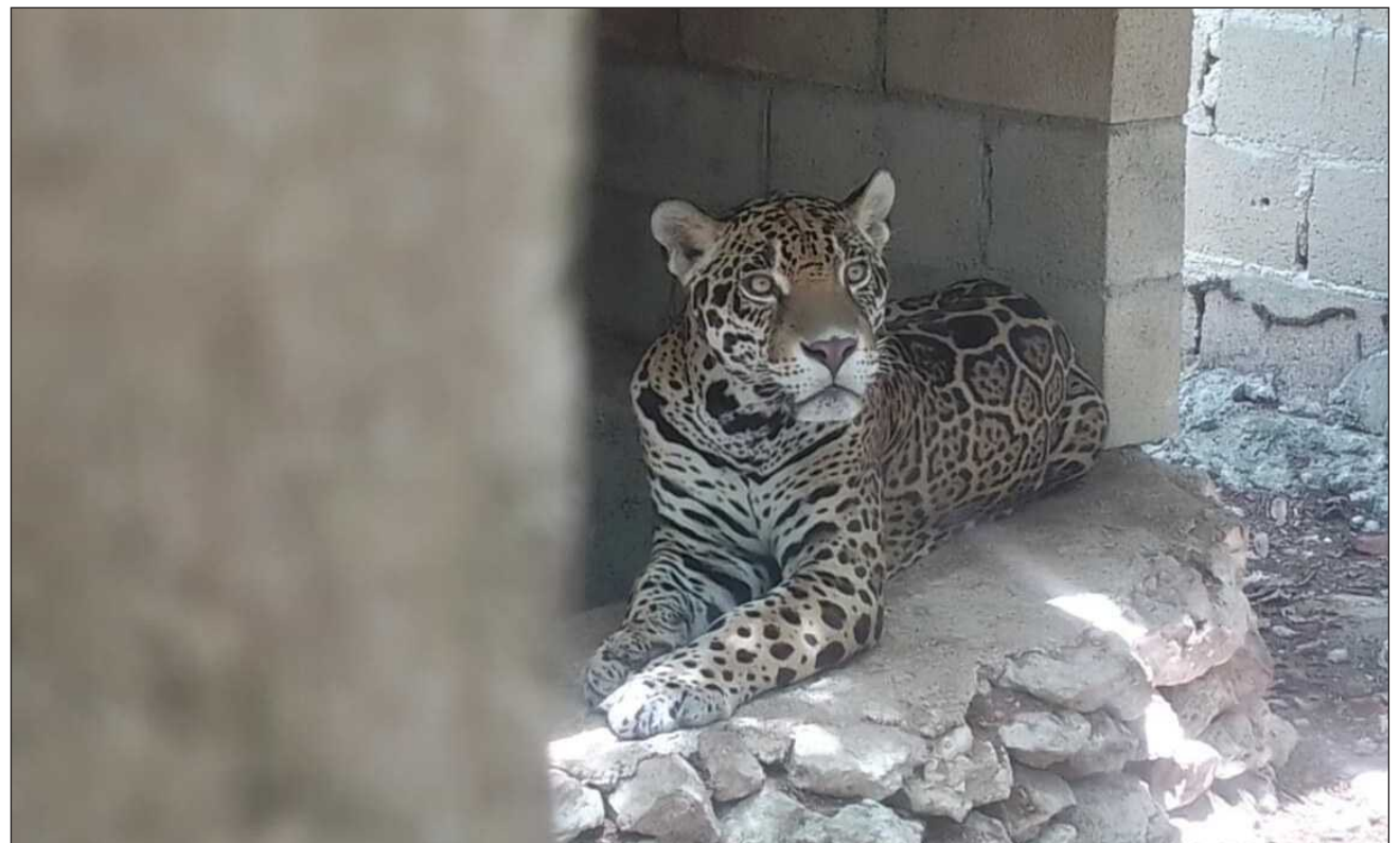
▲ La acción fue en el predio de 60 hectáreas, ubicado en Playa del Carmen.

Esta acción, en la que contaron con apoyo de la Procuraduría Federal de Protección al Ambiente y Secretaría de Medio Ambiente de Quintana Roo, tuvo lugar en