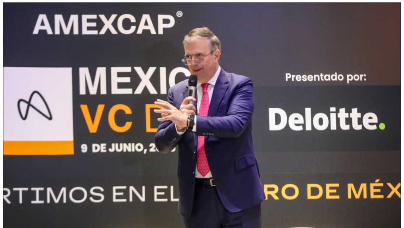
▲ El funcionario explicó que México paga actualmente un arancel de alrededor de 3.6% para ingresar al mercado de EU, mientras que sus competidores más dinámicos enfrentan tasas considerablemente más altas.

Ebrard dijo que la política comercial de Washington generará condiciones para que México crezca