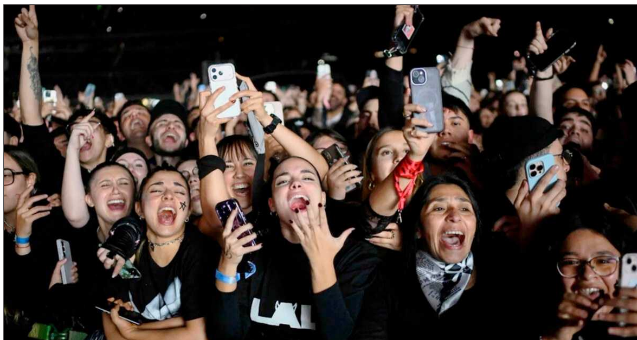
▲ Los especialistas afirman que los tapones para los oídos solo reducen el volumen, no lo apagan. Y cada vez más jóvenes los están adoptando, dando un paso sencillo para proteger sus oídos de cara a muchos conciertos más.