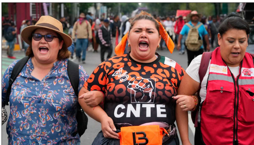
▲ Si la CNTE obedece a una estrategia para proyectar una imagen de caos e inestabilidad en el país, y la organización está a la espera de un acto de represión, esto ya lo anticipó el gobierno.

Pero con el decreto de suspensión de clases, y los servidores públicos desde el home office, el ambiente festivo previsto para el juego inaugural entre México y Sudáfrica ya no será. Millones han quedado excluidos de este Mundial, y lo deportivo ha quedado ya muy detrás de lo político en el negocio del fútbol.