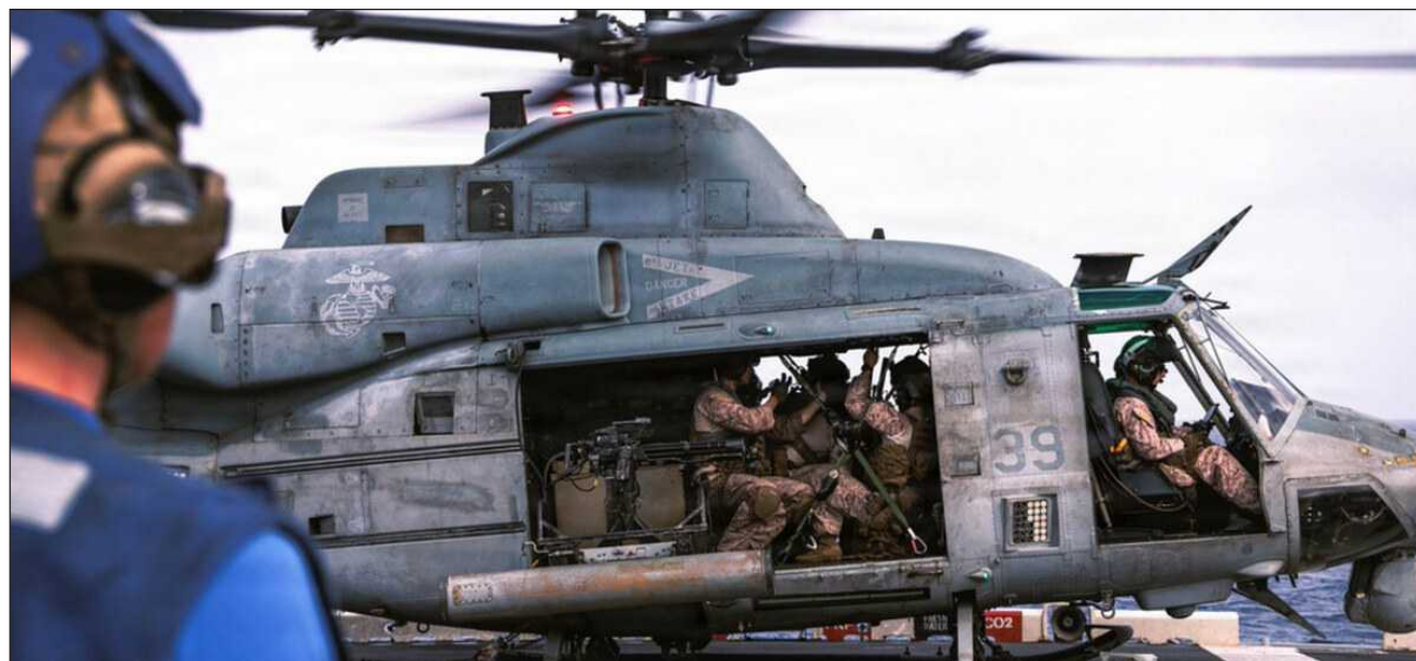
▲ El presidente, Donald Trump, escribió en Truth Social que fue informado por las fuerzas armadas de que Irán derribó un helicóptero Apache de alta tecnología mientras sobrevolaba por el estrecho de Ormuz.

Las causas del accidente seguían sin estar claras este martes por la mañana en Medio Oriente, que aún se recuperaba del intercambio de fuego entre Irán e Israel en la víspera, en el mayor golpe,