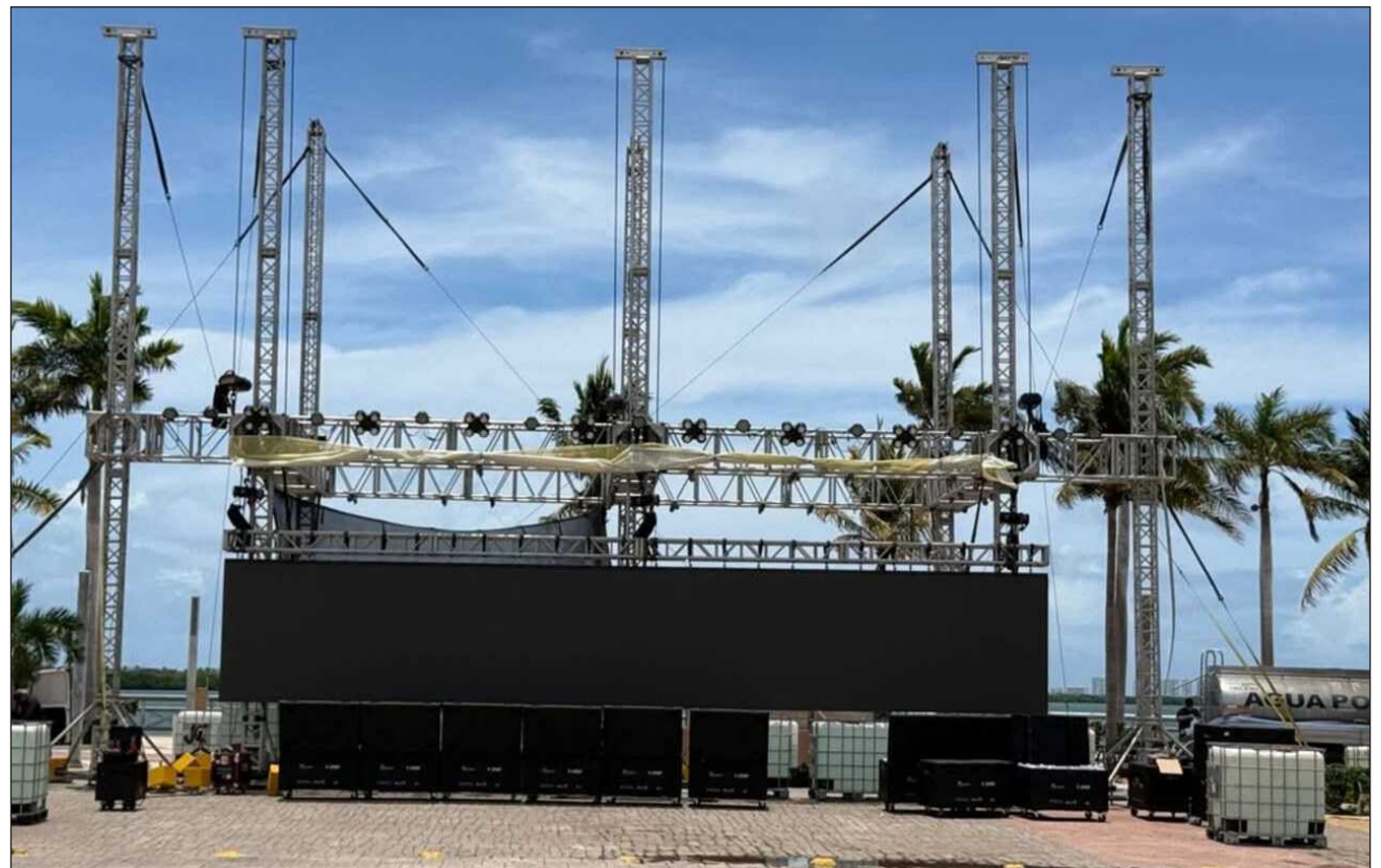
▲ La transmisión de partidos también se realizará en los municipios de Bacalar, Tulum, Cozumel e Isla Mujeres. En total serán 50 partidos, de los 104 que tendrá el Mundial, los que podrán verse gratuitamente en el Caribe Mexicano

La transmisión de partidos también se realizará en