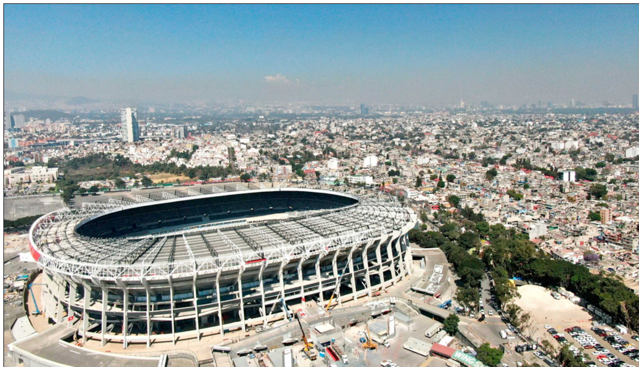
▲ En el decreto oficial publicado por el gobierno federal, se destaca que estas medidas buscan agilizar la movilidad exclusivamente para la inauguración del mundial para este 11 de junio. La Presidenta subrayó que no se trata de una obligación, sino un exhorto.

La presidenta Claudia Sheinbaum precisó que en el caso de la iniciativa privada no se trata de una obligación, sino de un exhorto. Podría haberse hecho de otra manera y que fuera obligatorio, pero no se pretende obligarlos a reducir actividades, sino exhortarlos a