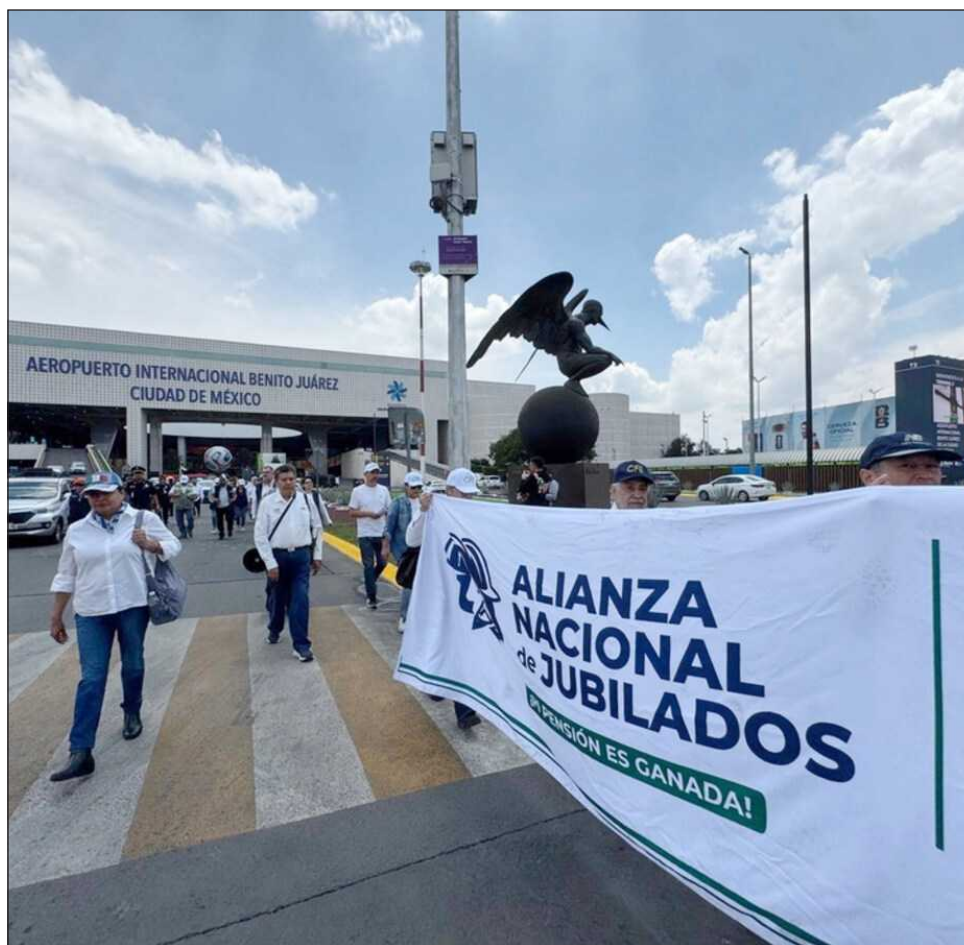
▲ La Alianza Nacional agrupa a jubilados de la Comisión Federal de Electricidad, Luz y Fuerza del Centro, así como Banrural y también Nafin.

“Hoy más que nunca hacemos un llamado a mantener la unidad, la