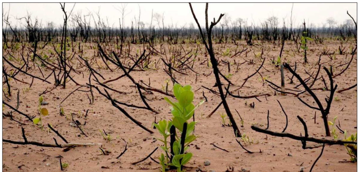
▲ "Hay muchas personas que siguen pensando que proteger y conservar la naturaleza atenta contra su interés, y que es legítimo su interés por acumular con que consideran riqueza sin considerar los efectos del deterioro".

Es verdad que hay algunas noticias alentadoras: nacen unos cuantos lobos, se reproducen unos pocos bisontes, se detiene al menos por el momento la explotación depredadora de los humedales de Mahahual, se suspende la construcción de infraestructura portuaria en Loreto, y se detiene la construcción de un gasoducto en el norte del país. No puedo sin embargo deshacerme de la sensación e que es poco, disperso y tardío. Al ver los mensajes, "memes", carteles y anuncios que han hecho diversas organizaciones para recordarnos la conmemoración de este día mundial del medio ambiente, me ha llamado la atención encontrarme con que, fuera de la ONU, nadie ha hecho eco del lema que este año nos propuso. Parece ser que, a ojos de quienes hoy dedican sus mejores esfuerzos a la protección de la naturaleza, la idea de "Nuestro poder. Nuestro planeta" no alcanza a generar entusiasmo alguno.