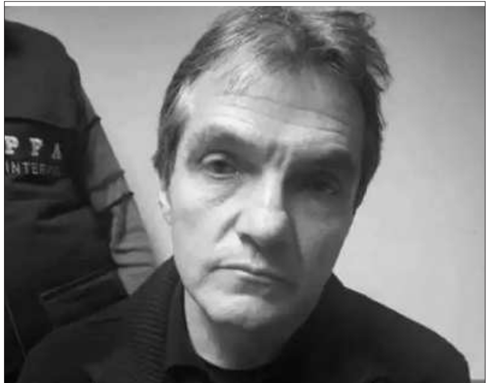
▲ La defraudación fiscal equiparada por la que autoridades mexicanas buscan a Ahumada, asciende a un millón 647 mil 236 pesos en agravio a las delegaciones Gustavo A. Madero y Tláhuac.

De acuerdo con el SNM de Panamá, se confirmó que dentro de la base de datos de la Secretaría General de la Organización Internacional de Policía Criminal Interpol en Lyon, Francia, mantiene notificación Roja y es requerido por las autoridades de México por el delito de fraude genérico y fraude continuado.