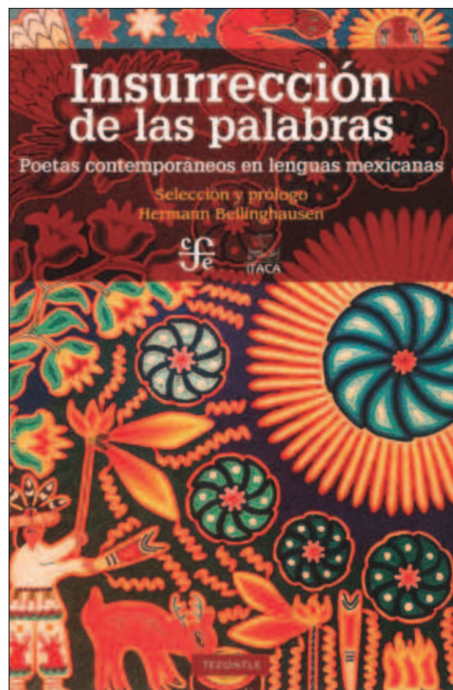
▲ La segunda edición de la antología tiene su origen en la labor de 30 años del suplemento Ojarasca , publicado por La Jornada y dirigido por Hermann Bellinghausen. Foto Facsímil

Aunque celebró que cada vez más autores indígenas escriban en sus lenguas, lo consideró insuficiente, pues en su opinión aún hace falta conocer el sonido de éstas, por lo que urgió también a grabarlas.