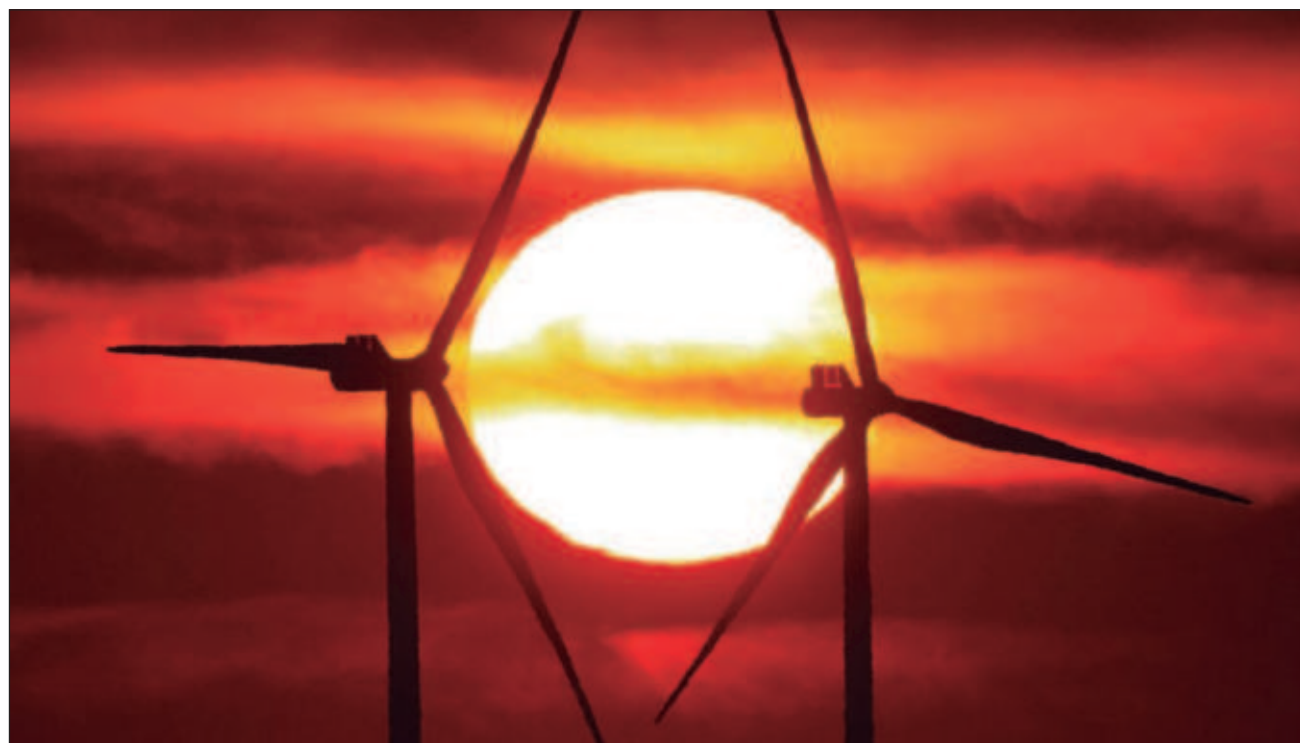
▲ La carga más pesada de este retraso energético la padecen los países en desarrollo, los cuales tienen una capacidad limitada para mitigar la volatilidad de los precios de la energía, apuntó la experta de la UNAM.

Para revertir esta situación, la especialista se pronunció por emprender planes para ampliar las renova-