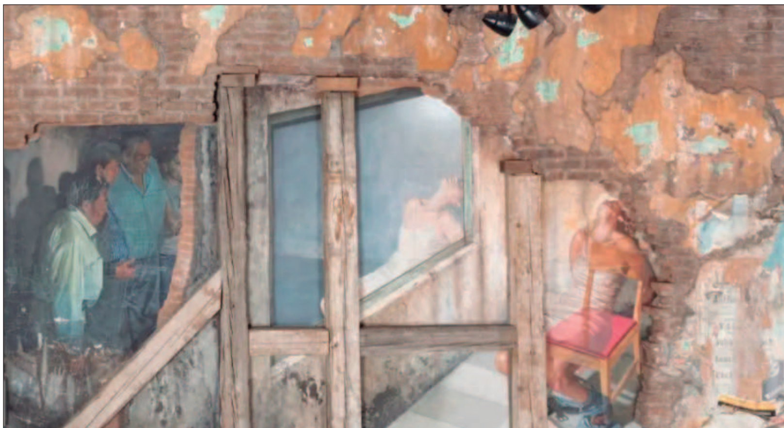
▲ En esas paredes se refleja “la discusión que Cauduro tuvo con los magistrados de la época en la que pintó y advirtió que no iba a respaldar a la institución (...) sino que abordaría esos problemas reales que todos los días vemos los mexicanos comunes y corrientes”, sostuvo el curador Carlos Molina.

La muestra está disponible en la página del repositorio digital Memórica México , haz memoria: https://memoricamexico.gob.mx/es/memorica/Rafael_Cauduro