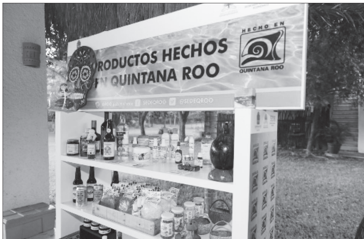
▲ La secretaria de Desarrollo Económico en Quintana Roo, Karla Almanza, convocó a todas las y los emprendedores a que se anoten en el padrón de empresas para tener una base completa en el estado.

Pero además, invitó a todas las y los emprendedores a que se anoten en el padrón de empresas para tener una base completa en el estado, de momento son seis inscritos y servirá para aumentar el networking.