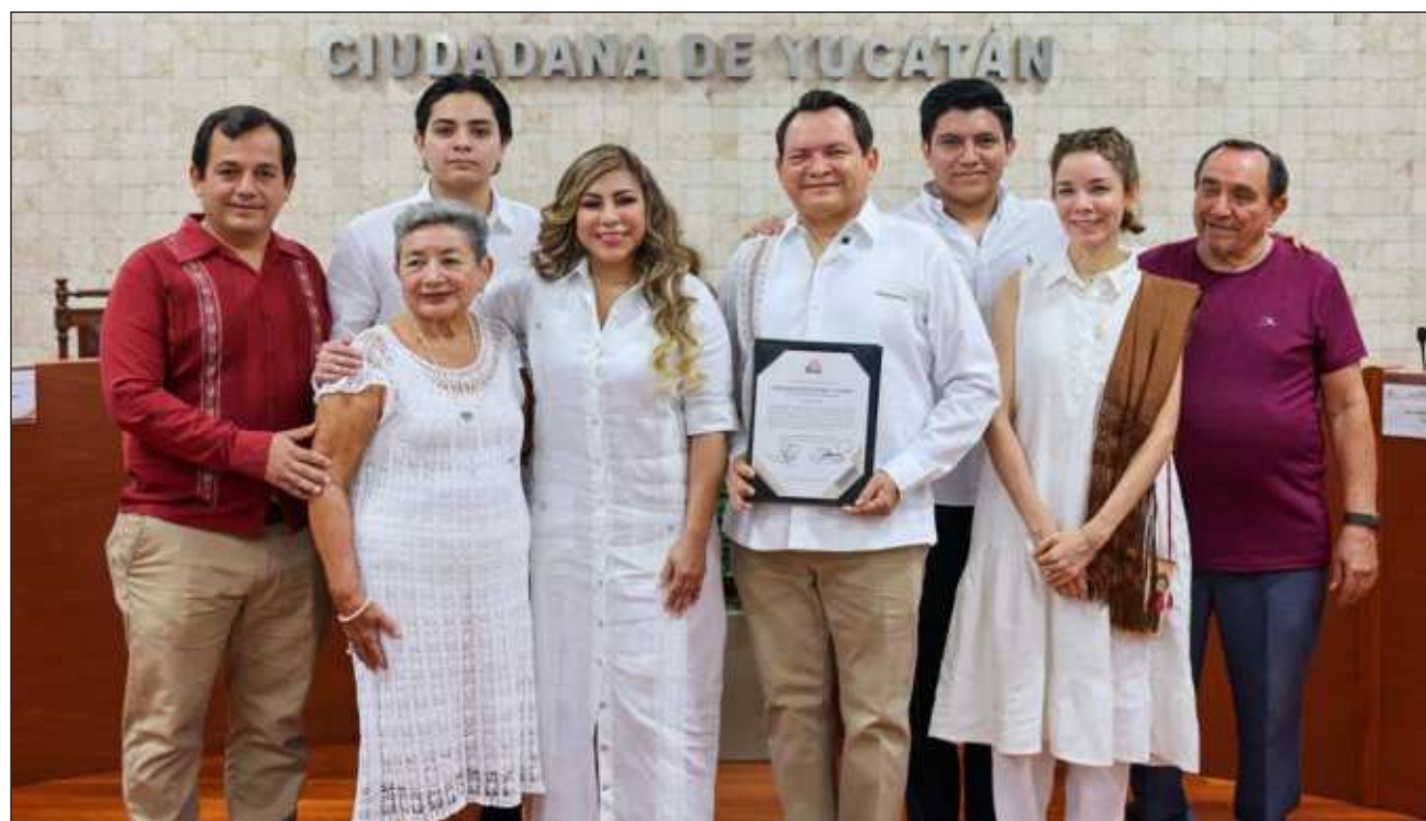
▲ "Tengo fe y tengo esperanza de que juntos, pueblo y gobierno, vamos a hacer realidad un gobierno del estado con humanismo", subrayó el gobernador electo de Yucatán, Joaquín Díaz Mena.

Acompañado de su familia y de los diputados y diputadas del PT, PVM y Morena que resultaron electos, Joaquín Díaz Mena recordó el inicio y el final de su campaña, donde en ambos momentos sufrió accidentes que lo pusieron en riesgo. A su vez, el próximo gobernador del estado recordó los