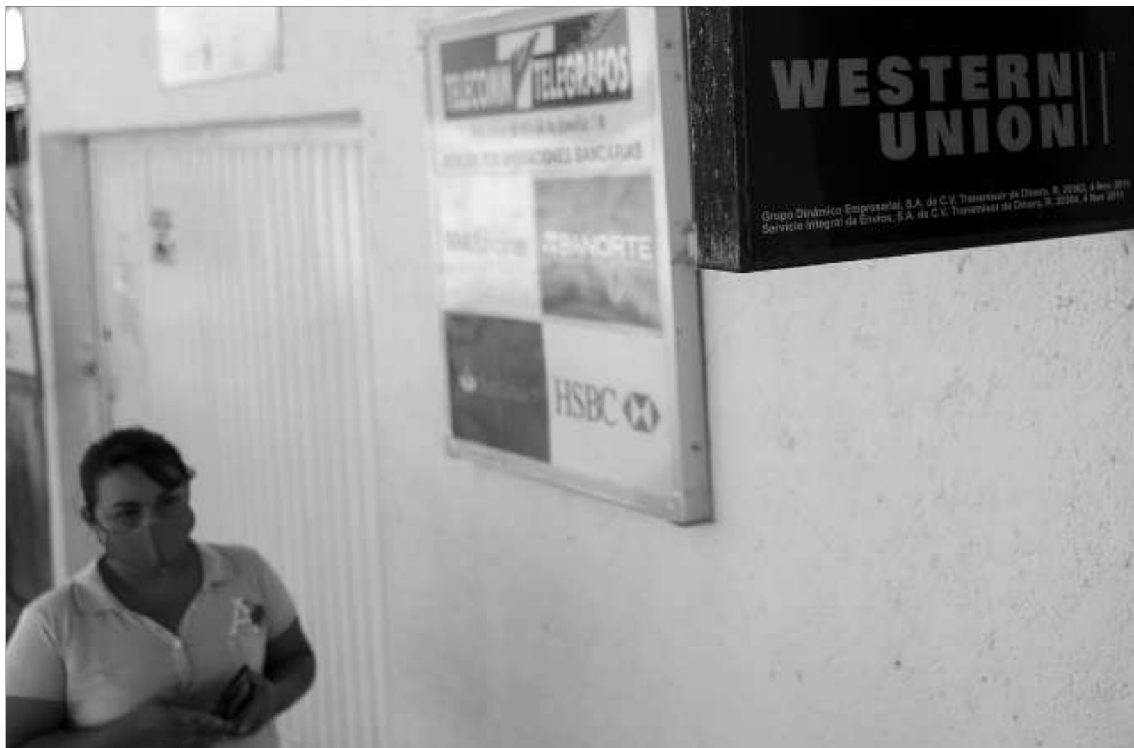
▲ El volumen reportado por el BdeM en el primer trimestre de 2024 se trata del más alto desde que existen registros, es decir, desde 1993.

El incremento se da en un contexto en el que desde 2018 se comenzaron a formar caravanas de migrantes que usan a México como territorio de paso para llegar a EU, situación que se agravó a raíz de la pandemia con la incorporación de otras naciones como Haití, Venezuela y Cuba, entre otros.