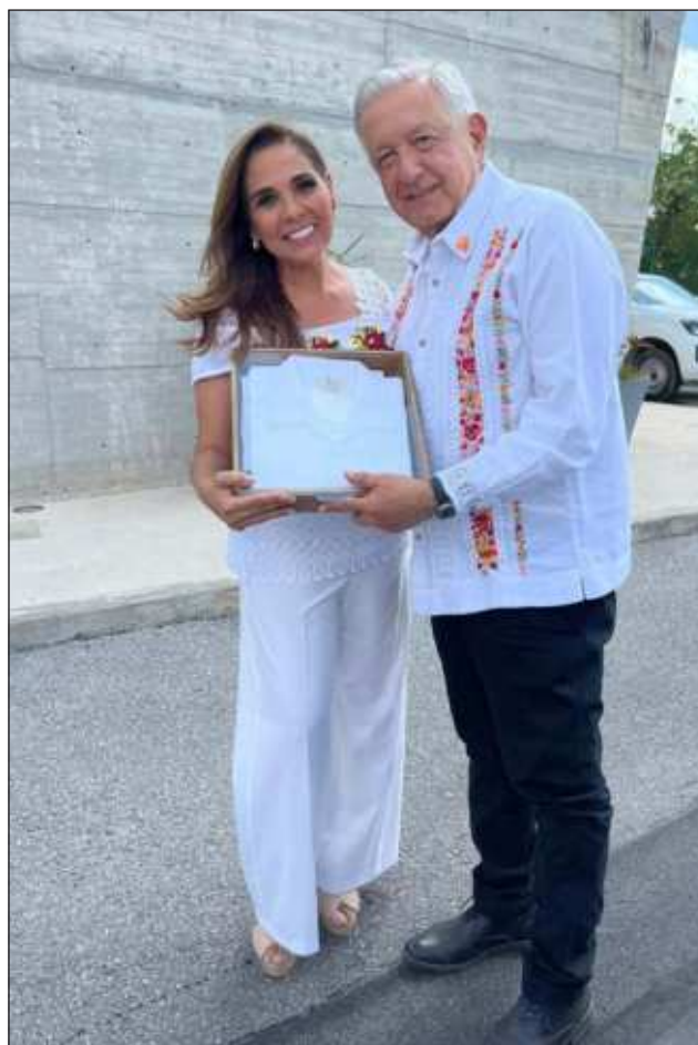
▲ Sobre el proceso electoral del pasado 2 de junio, el Presidente señaló que “se volvió a demostrar que el pueblo es bueno, es generoso, no es malagradecido”.

Sobre la virtual presidenta electa de México, dijo: “Claudia hasta a mí me cepilló, 36 millones de votos (de diferencia entre ambos) la primera mujer presidenta en 200 años del México independiente, además bien merecido porque es una mujer trabajadora, muy inteligente y honesta. Va a ayudar a todos, va a ayudar mucho a las mujeres”.