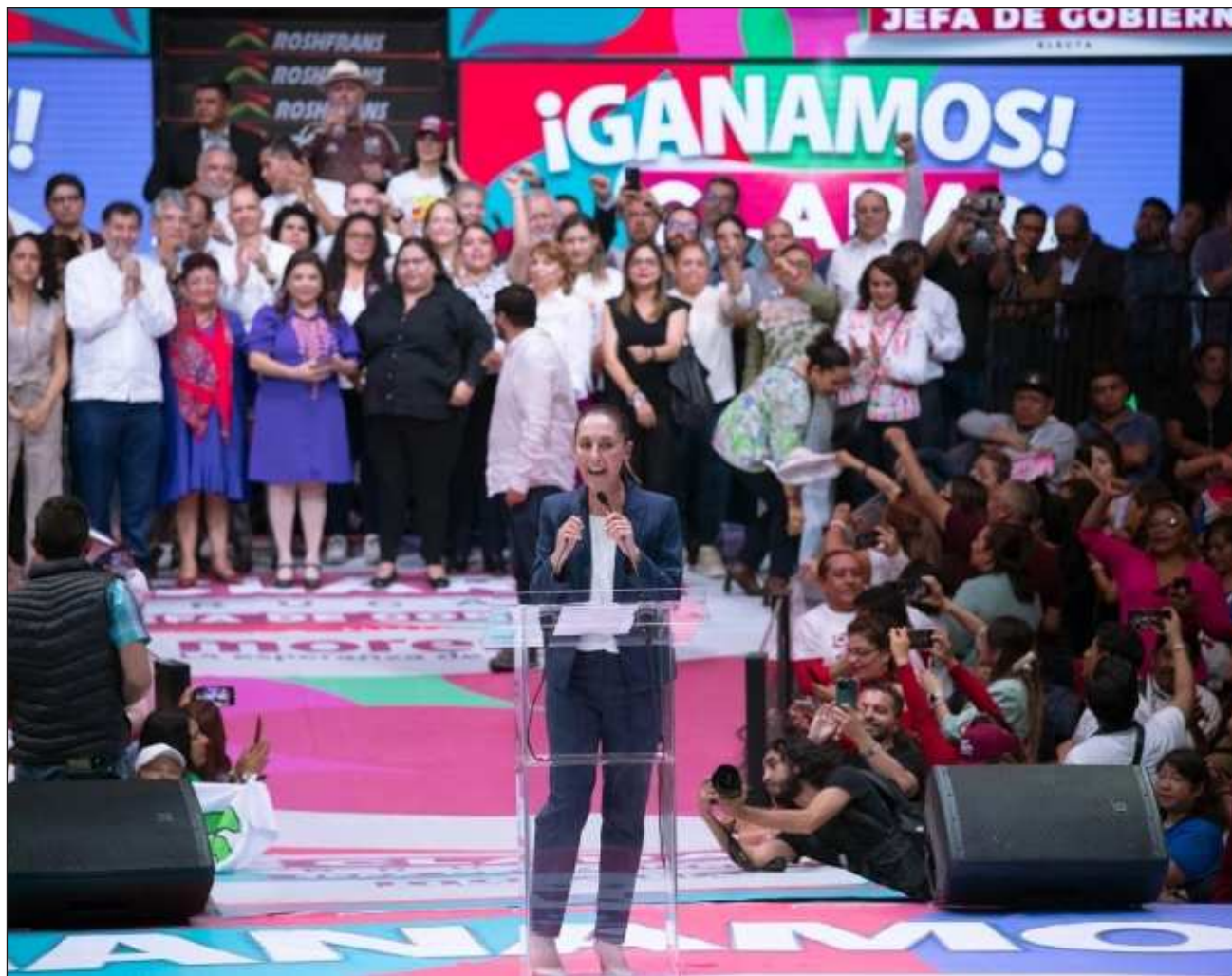
▲ De acuerdo con los datos del cómputo, con 61.04 por ciento de participación ciudadana, Claudia Sheinbaum obtuvo 35 millones 924 mil 519 votos, es decir, 59.7594 por ciento de los sufragios.

De acuerdo con los datos del cómputo, Sheinbaum obtuvo 35 millones 924 mil 519 votos, es decir, 59.7594 por ciento de los sufragios.