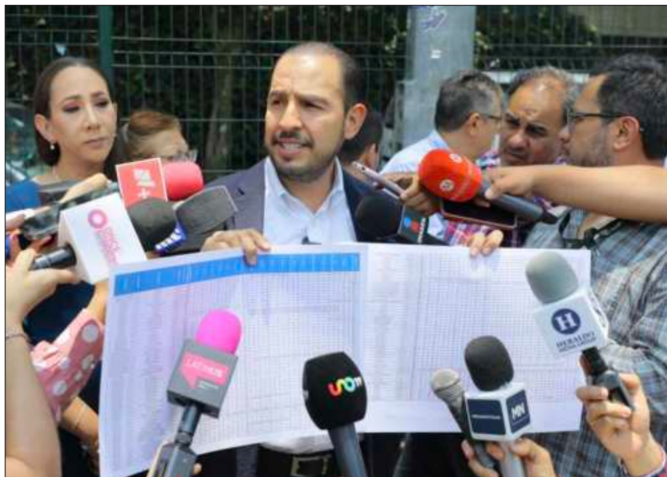
▲ Cortés Mendoza resaltó en un comunicado, que durante cinco años el presidente López Obrador, usó sin límite los recursos públicos para intervenir en la elección.

“En su momento, serán el Instituto Nacional Electoral y la Sala Superior del Tribunal Electoral los que