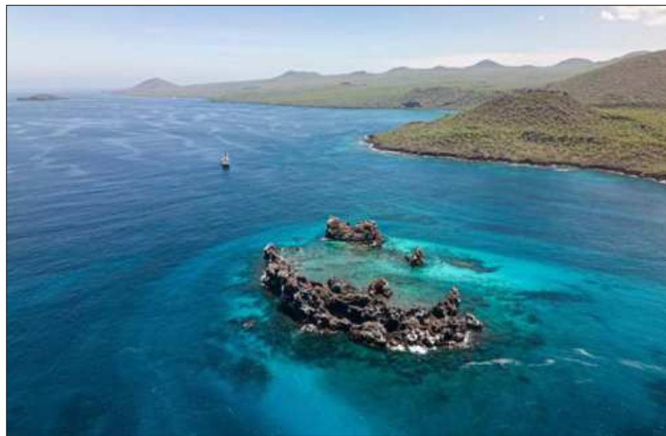
▲ El canciller costarricense, Arnoldo André, subrayó durante su participación que “el océano ya no puede soportar más nuestro maltrato e indiferencia. Por eso, en Costa Rica hemos decidido que ya es hora de que (le) declaremos la paz”.

“Estamos comprometidos a ampliar las acciones transformadoras del océano, para apoyar economías positivas para la naturaleza basadas en la mejor ciencia e información científica dis-