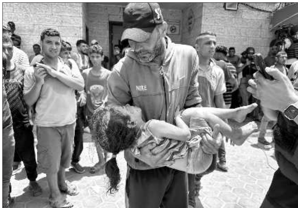
▲ A esos militares intoxicados de odio y despojados del último resto de empatía es a quienes el primer ministro, Benjamin Netanyahu, describe como el “ejército más moral del mundo”.

Es cierto que algunos gobiernos occidentales han dado pasos para desmarcarse de esta barbarie. Por ejemplo, España, Irlanda y Noruega reconocieron de manera plena al Estado palestino, un gesto que honra a sus impulsores y exhibe al resto del autodenominado “mundo libre”. Pero en tanto se queden en el plano de lo simbólico y excluyan medidas orientadas a limitar las capacidades bélicas de Tel Aviv, las naciones desarrolladas, con Estados Unidos a la cabeza, serán corresponsables de la mayor afrenta contra la humanidad cometida en el presente siglo.