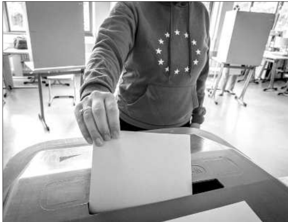
▲ La elección de los 720 diputados del Parlamento Europeo abre un nuevo ciclo en la UE, y los nuevos legisladores designarán al nuevo presidente de la Comisión Europea.

La elección de los 720 diputados del Parlamento Europeo abre un nuevo ciclo en la UE, y los nuevos legisladores designarán al nuevo presidente de la Comisión Europea, el brazo ejecutivo del bloque.