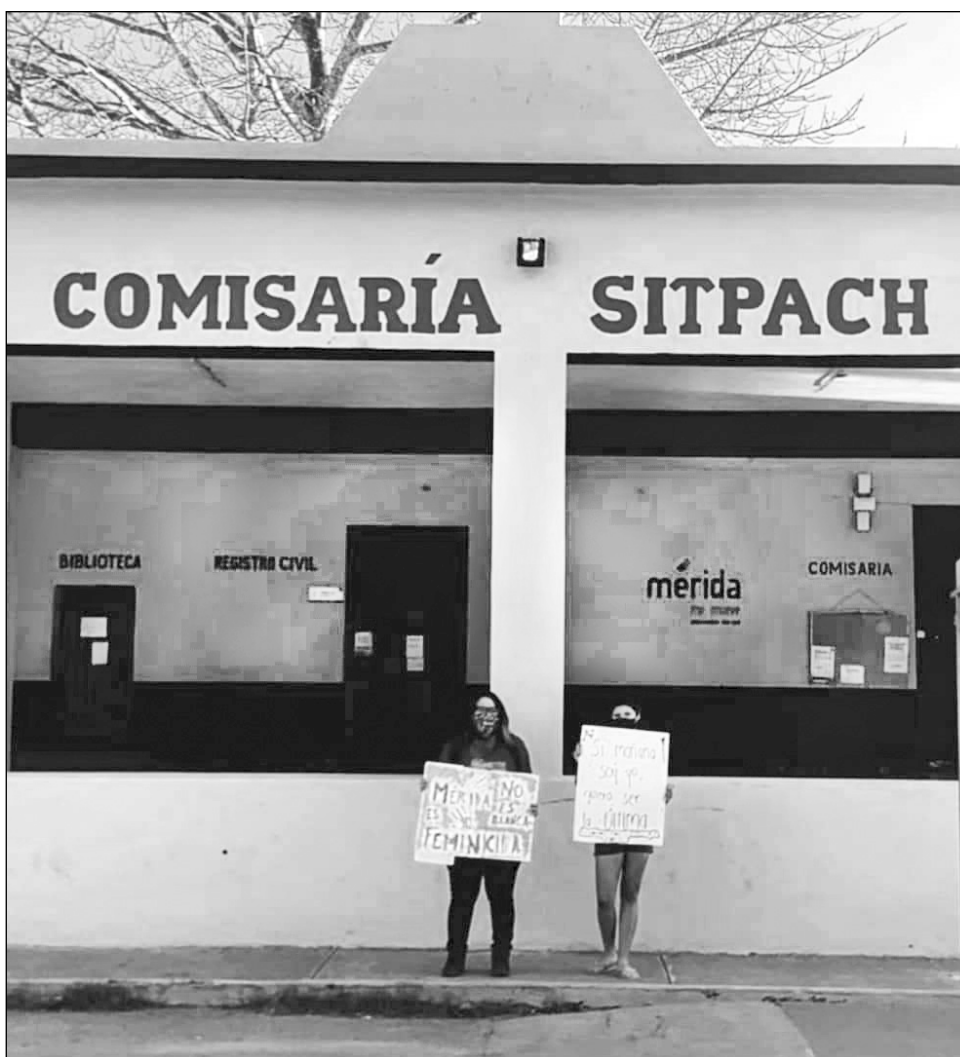
▲ Las autoridades municipales tienen poca o nula reacción en casos de violencia de género, acusaron las mujeres.

Mientras que la paridad de género aún es tema pendiente, señalaron que es urgente que se haga realidad en la elección de nuestras comisarías.