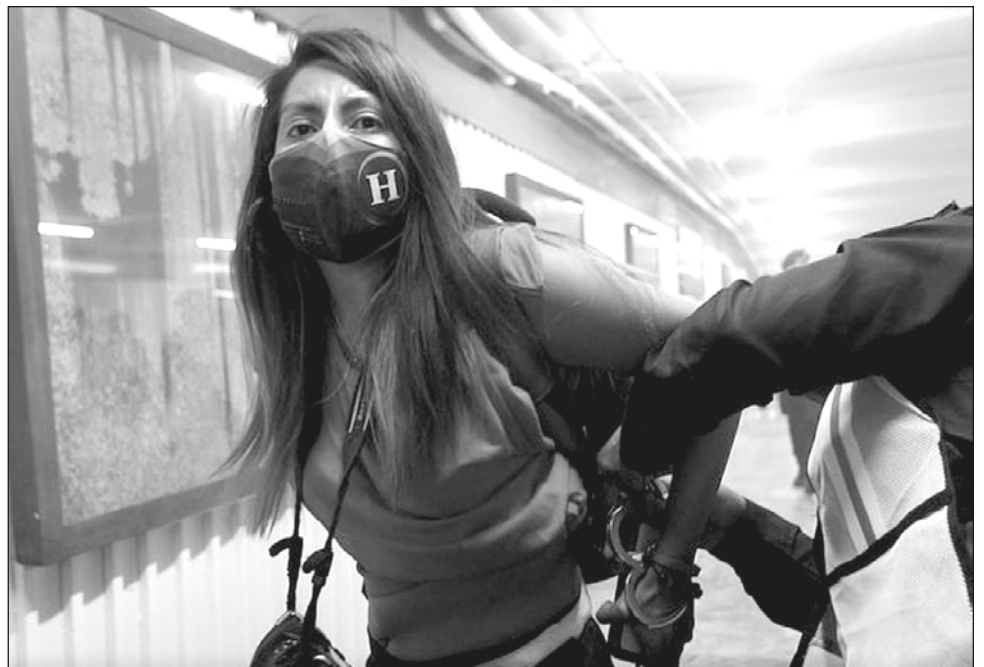
▲ Las reporteras fueron retenidas en las instalaciones del Sistema de Transporte Colectivo Metro, cuando se trasladaban para realizar la cobertura de la marcha con motivo del Día Internacional de la Mujer.

La comisión enfatizó que "ante el contexto de violencia que los periodistas continúan enfrentando en el país, las