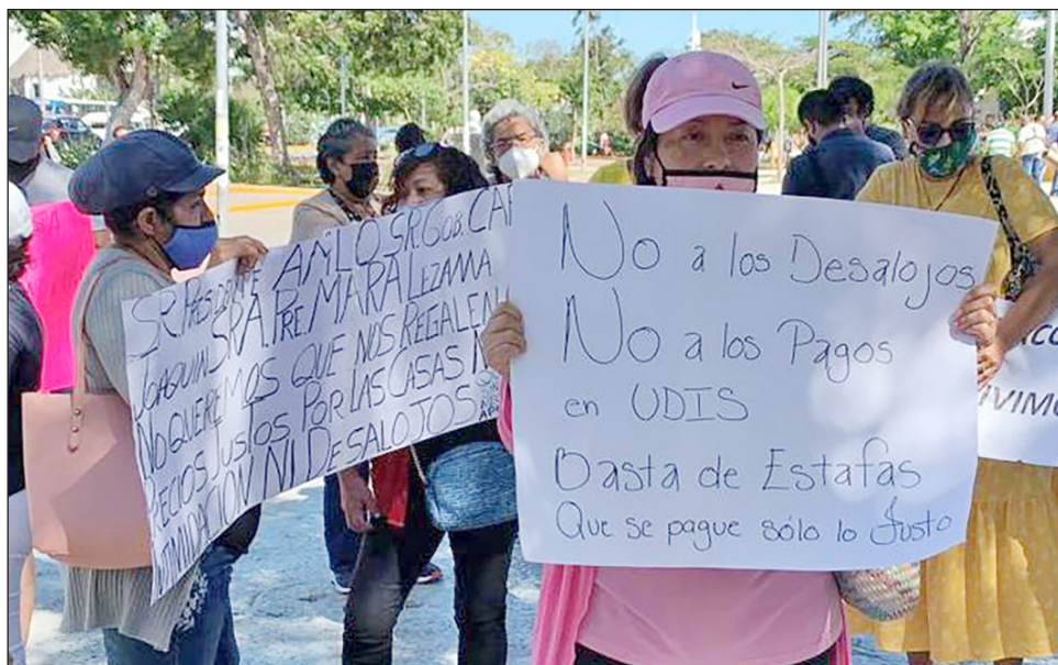
▲ Vecinos de varias colonias de Benito Juárez se manifestaron en la plaza de la Reforma, en donde denunciaron haber sido víctimas de este tipo de fraudes.

Estos bancos, dijeron los inconformes, incrementaron el costo de la vivienda al grado de hacer impagables las mensualidades, y en caso de impago proceden a desalojarlos de sus hogares. Solicitaron la intervención