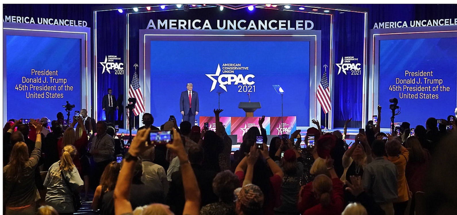
▲ When Donald Trump emerged in 2015, he opened the door for many to bring their secret lives to the surface.