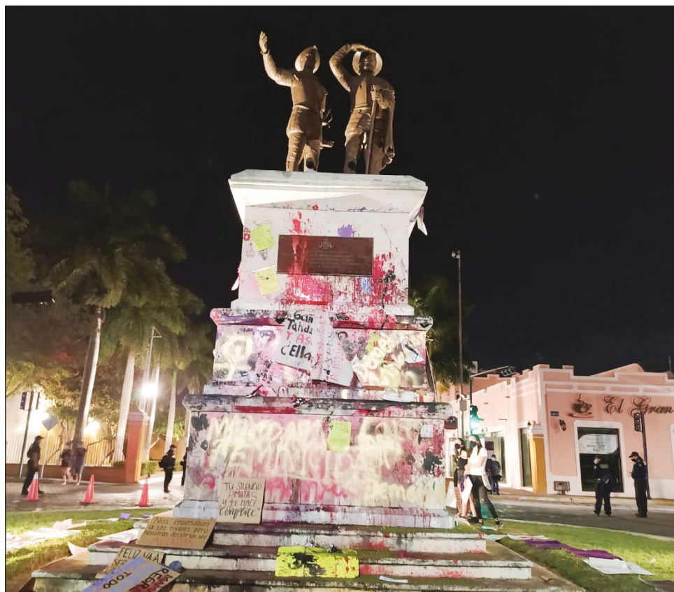
▲ Los Montejo, de acuerdo con Falú Balam, representan el pacto patriarcal.

Balam aclaró que el término “aliado” lo otorga quien lucha, es decir, no es algo que pueda autoproc-