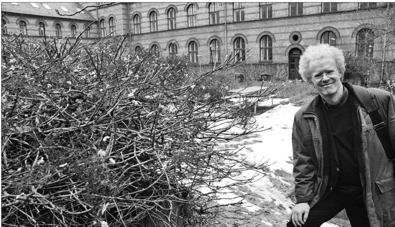
▲ Erik Olin Wright deseaba ofrecer un libro de divulgación, accesible y novedoso, fácil de leer y que diera respuestas a un lector medio, crítico del sistema pero fuera de los circuitos académicos hacia los cuales siempre se había dirigido.