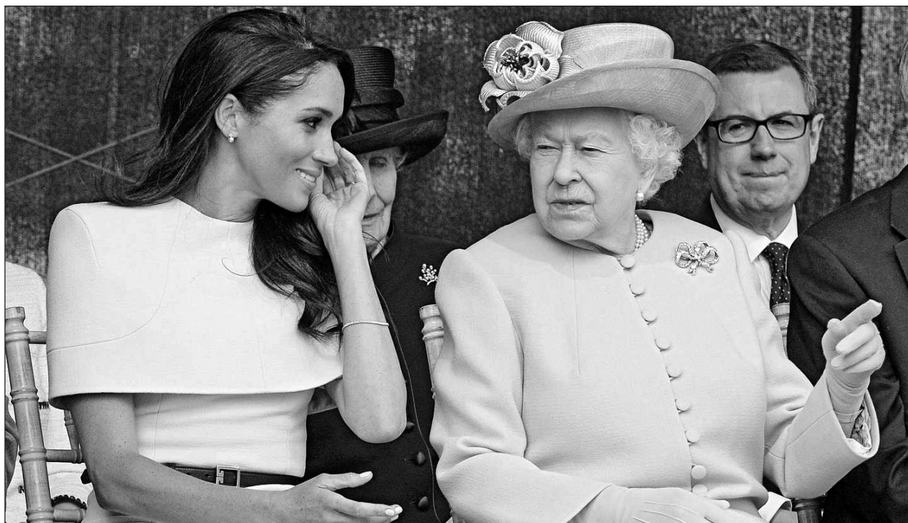
▲ En la entrevista con Oprah Winfrey, Meghan y Harry alegaron que no se les ofreció apoyo en materia de salud mental.

“Harry, Meghan y Archie siempre serán miembros de la familia muy queridos”, indica el texto difundido.