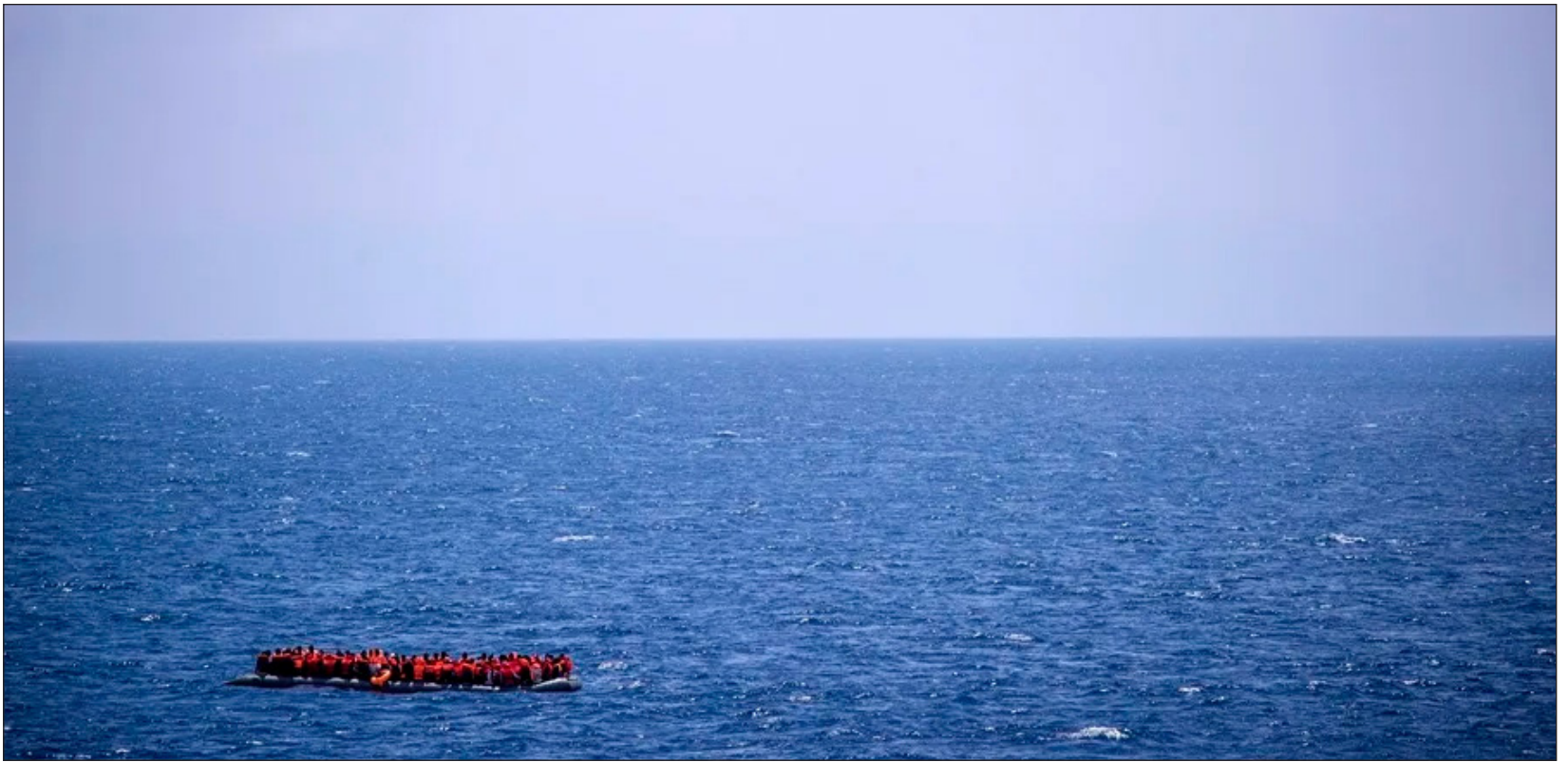
▲ Según los testimonios de los sobrevivientes, la embarcación salió de Zauia, cerca de Trípoli, el 5 de febrero en la noche, y naufragó seis horas más tarde.