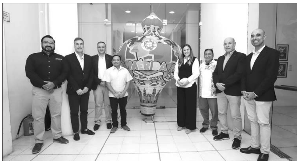
▲ Las becas estarán dirigidas a estudiantes que no han concluido el bachillerato, para cursar carreras técnicas o para universitarios que tienen la intención de especializarse en biotecnología y biomedicina, entre otras opciones.

“Es lo que buscamos como ayuntamiento, siempre darle oportunidades a nuestras juventudes, a todos los meridianos, de crecimiento y estamos convencidos que a través del aprendizaje y de la educación es como se transforma vidas y hoy estos jóvenes transfor-