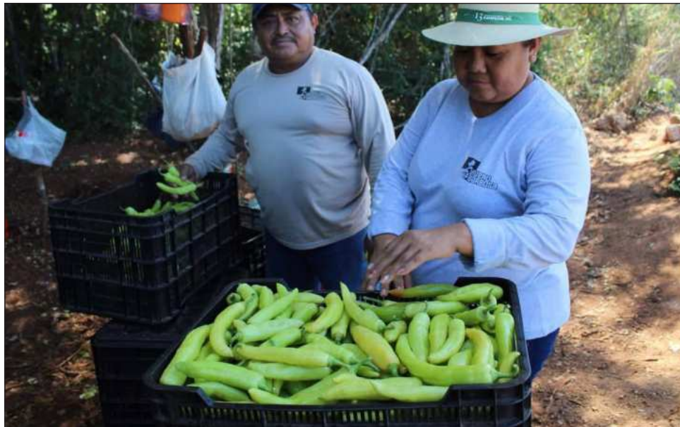
▲ El proyecto de la alianza entre productores, gobierno del estado y el IMPI toma en cuenta a 54 municipios de Yucatán, encabezados por Muna, y contempla la posibilidad de incluir a seis municipios más ubicados en los estados de Campeche y Q. Roo.