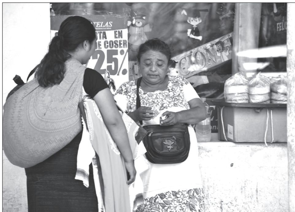
▲ En Campeche, 24 por ciento de las mujeres en edad productiva labora en la informalidad, lo que las hace vulnerables ante autoridades o arrendatarios.

Dentro de sus peticiones a los gobiernos municipales y estatal, destacó la creación de comités de igualdad de género y que los puestos