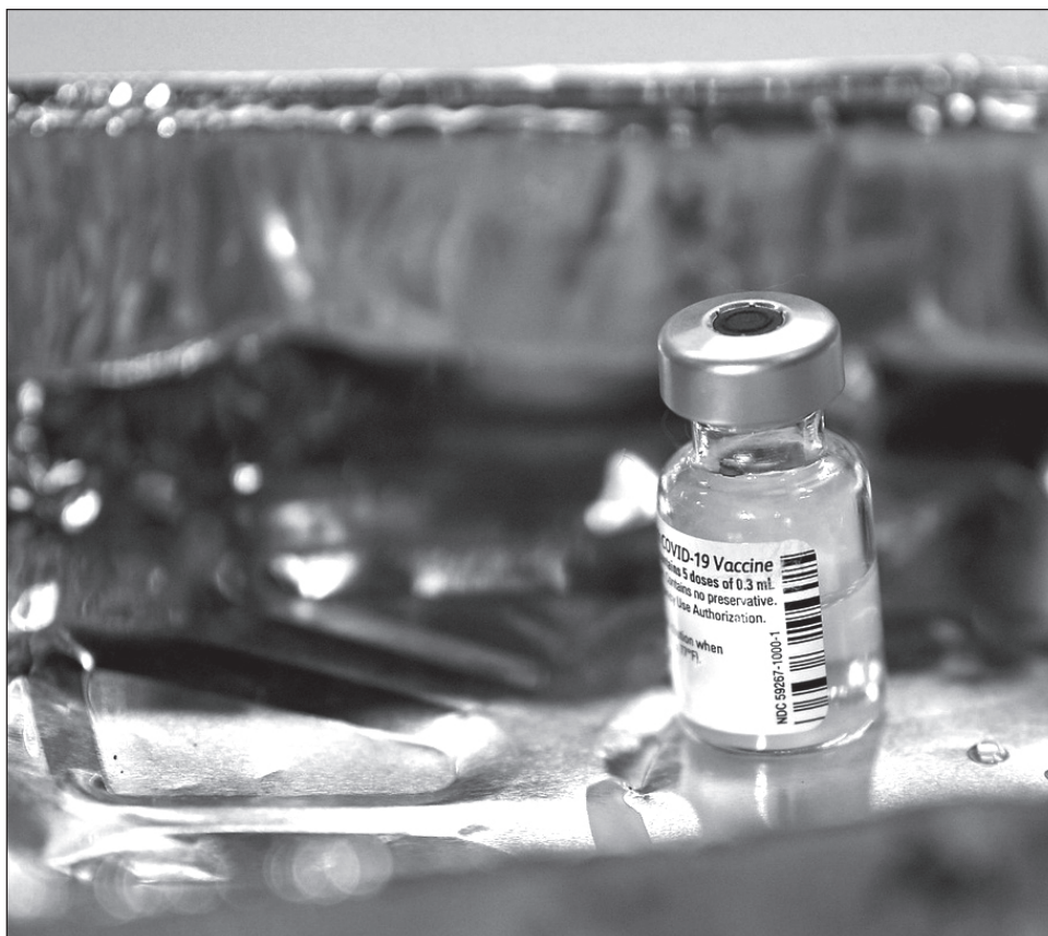
▲ El inmunológico requiere temperaturas muy bajas para su almacenamiento, por lo que las autoridades sanitarias planean la estrategia para hacerla llegar a toda la población.

“Nos va a corresponder definir la estrategia. Ahora por ser una vacuna que requiere de bajas temperaturas y por ser el primer envío (el de Pfizer) se está pensando en muy pocos centros para la vacunación, pero en la medida en que se vaya a llevando a cabo se va a ampliar y se va a vacunar en todas partes.”