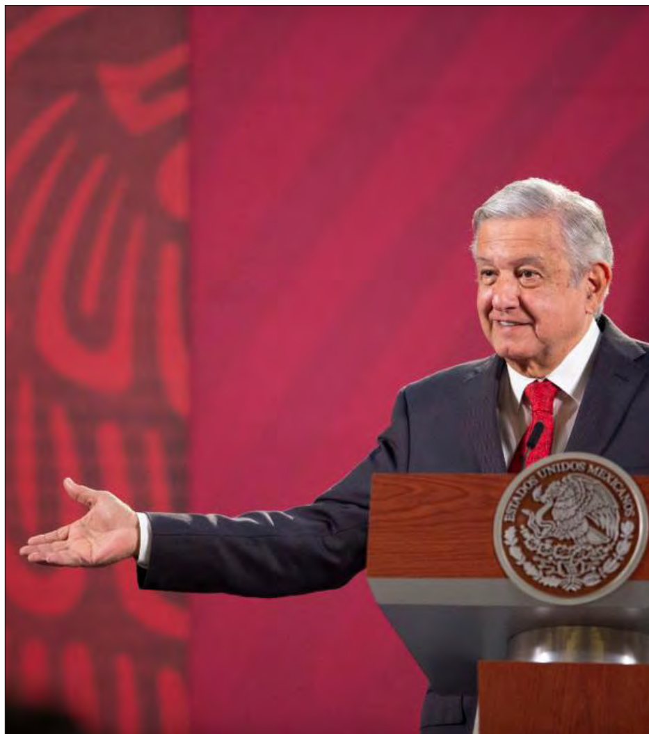
▲ Hay muchos intereses inmiscuidos en todo lo que hacemos de obras, aseveró López Obrador, durante su conferencia matutina..

Reconoció que no conoce el fondo del asunto asociado con ese recurso legal “pero es probable que este vinculado con propósitos político electorales. Tenemos que estar brincando obstáculos pero se cumple con la legalidad”.