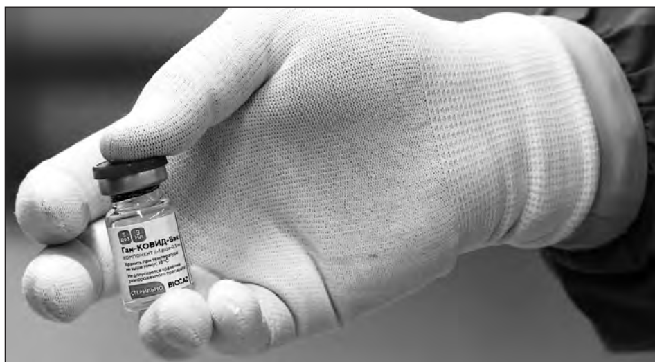
▲ La Sputnik-V es uno de los catorce proyectos de inmunológicos que en este momento se están desarrollando en Rusia.

Para que Rusia siga a la cabeza de la carrera por ocupar mejores posiciones en el mercado mundial de las vacunas -un negocio que el primer año puede alcanzar más de 40 mil millones de dólares, según algunas estimaciones-, el titular del Kremlin, Vladimir Putin, ordenó la semana pasada comenzar sin demora la vacunación con Sputnik-V de los llamados grupos de riesgo: médicos y maestros, en primer lugar,