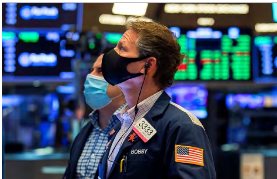
▲ El vital líquido fue valorado en 486.53 dólares por 1.233 metros cúbicos, según el índice Nasdaq.

Según CME Group, los nuevos contratos permiti-