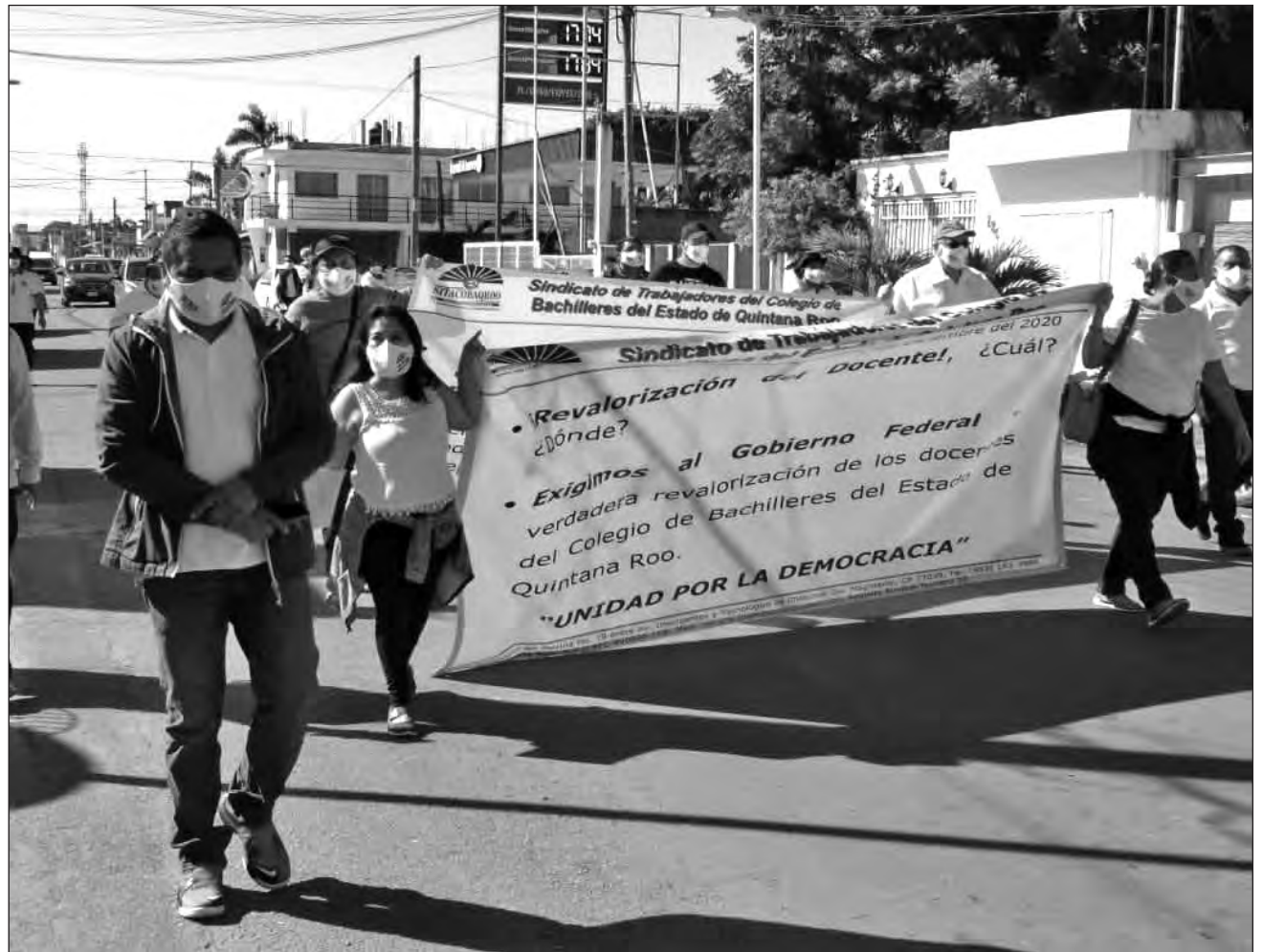
▲ Miembros del Sindicato de Trabajadores del Colegio de Bachilleres marcharon este martes para protestar por los adeudos del incremento salarial de este año y el retroactivo.

"Regresamos a dar clases, pero seguimos con la presión de trabajo con el direc-