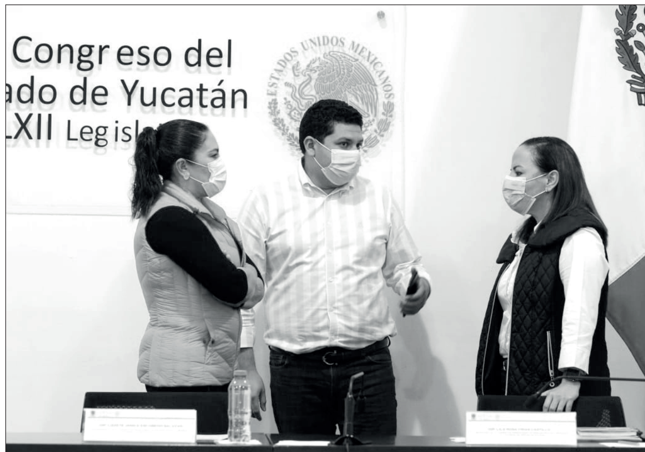
▲ Para proceder penalmente contra el Presidente de la República, se deberá hacer a través de una acusación ante la Cámara de Senadores.

Estas reformas establecen que, para proceder penalmente contra el Presidente de la República, sólo habrá lugar a acusarlo ante la Cámara de Senadores en los términos del Artículo 110, y para ello, los integrantes