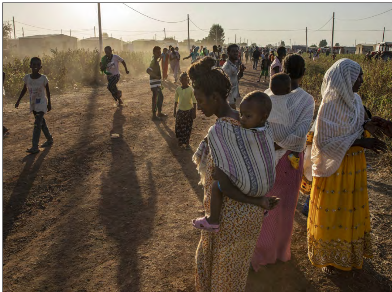
▲ La semana pasada, el Gobierno etíope y la ONU llegaron a un acuerdo para permitir el acceso humanitario sin restricciones a Tigray.

Una tercera persona indicó que fuentes de seguridad regionales también han visto a soldados eritreos en las carreteras que llevan desde la frontera de Eritrea a las localidades de Adwa y Adrigat, en el norte de Tigray.