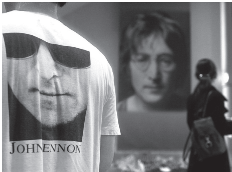
▲ John ha pasado a la historia como el provocador de la banda, por ejemplo con el terrible escándalo de la época, cuando dijo que los Beatles eran más conocidos que Cristo.

"En Lennon hay un lado 'teddy boy' (movimiento cultural juvenil surgido en Londres en los años 1950, con una estética asociada al rock y a la insatisfacción social), es alguien que también tuvo un Rolls en un