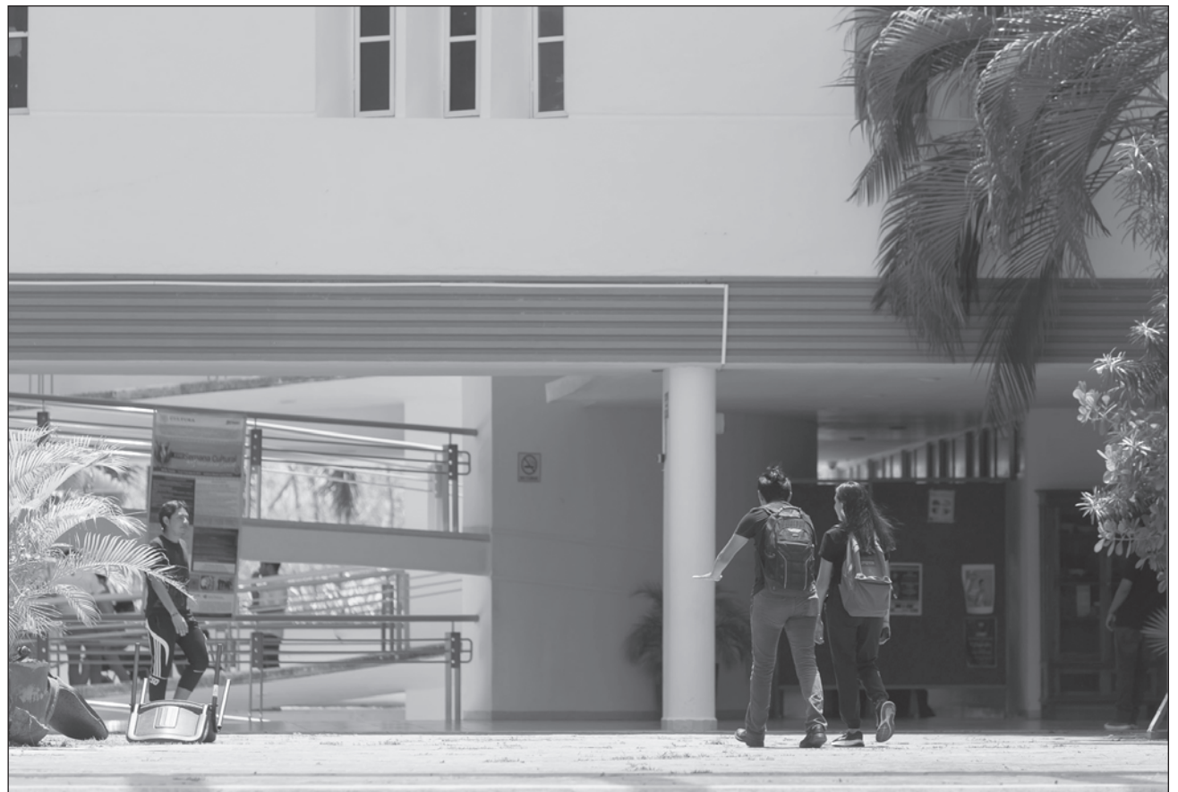
▲ Derecho, Medicina, Arquitectura, Contaduría y Psicología son las carreras que tienen mayor número de estudiantes dentro de la UADY.

El funcionario precisó que el registro para presentar el examen de admisión se hizo antes de la pandemia y éste fue programado para mayo, pero lo tuvieron que posponer e incluso abrieron la opción de que fuera en línea, pero al final se hizo de manera presencial durante el mes de agosto.