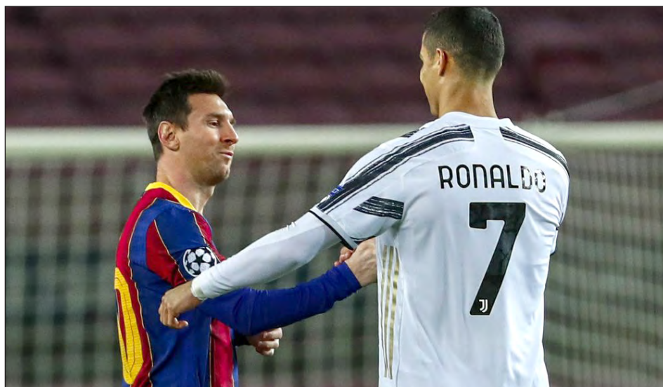
▲ Lionel Messi y Cristiano Ronaldo, previo al partido de ayer en Barcelona.

En la capital francesa, el encuentro entre París Saint-Germain y Basaksehir de Estambul se interrumpió luego que los jugadores alegaron que el cuarto árbitro profirió un insulto racista hacia el entrenador asis-