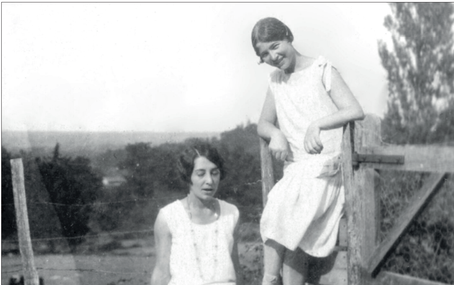
▲ Zaza es el objeto de la pasión de Sylvie (Simone de Beauvoir), una pasión contenida, como debe hacer una niña formal, al darse cuenta de que no es correspondida en la carne. En la imagen, Zaza (izquierda) y Simone.