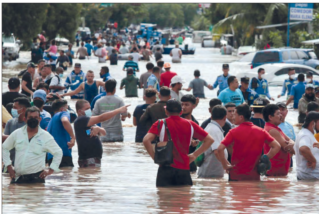
▲ A los damnificados por los huracanes Eta e Iota en Guatemala, Honduras y Nicaragua, hay que sumar a los que han perdido sus medios de subsistencia.

Los huracanes Eta e Iota, que azotaron varios países de Centroamérica y partes del territorio mexicano en semanas recientes, dejaron a su paso un grave saldo de destrucción, especialmente en las zonas más deprimidas y marginadas de Guatemala, Honduras y Nicaragua. Se calcula que en las naciones mencionadas los fenómenos climáticos provocaron el desplazamiento de alrededor de 500 mil personas, las cuales perdieron sus viviendas, sus sembradíos e incluso sus tierras.