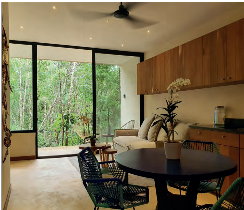
▲ Glass House es una casa de cristal en medio de la selva maya con arquitectura vanguardista.

Fueron galardonadas con medallas de plata: Brava Estudio, Huachinango 36, Aldea KAA, Hotel Casa Agape y Casa MP. Las categorías participantes incluyeron diseño de interiores, arquitectura sustentable, edificio vertical de uso mixto, vivienda multifamiliar, hotelería y vivienda unifamiliar en proyectos y obras ubicadas en Cancún, Tulum y Puerto Morelos.