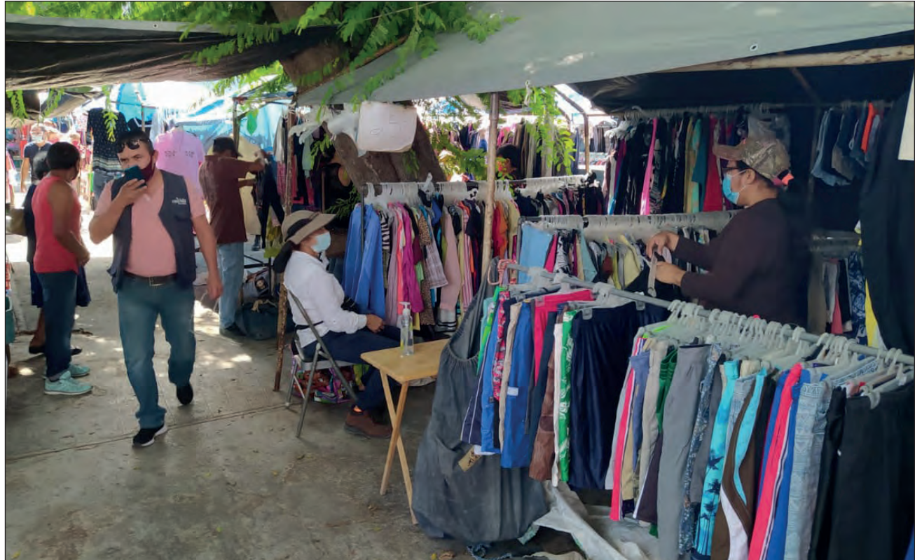
▲ En estos bazares callejeros es posible encontrar un poco de todo, sin embargo, destacan los puestos que ofrecen prendas de vestir.

Las y los tianguistas ven con buenos ojos la medida y se dijeron dispuestos a cumplir cabalmente con los protocolos de sanidad. De otro