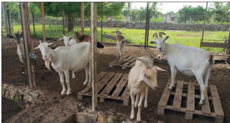
▲ La leche de cabra que producen en la Granja Carpian El regalo es muy solicitada por su alto contenido nutrimental, refiere Pedro Chay.