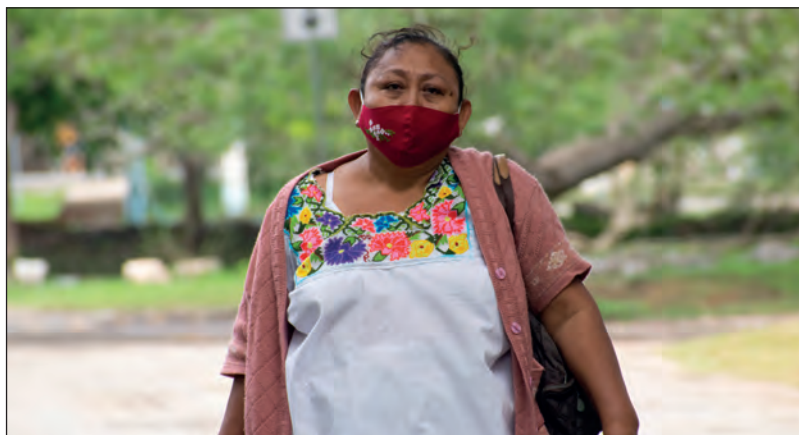
▲ Los productores de Cuxtal reciben apoyo del Ayuntamiento meridano a través del programa Círculo 47 .