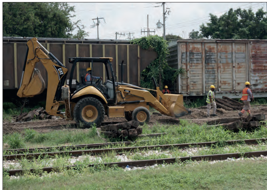
▲ El amparo concedido a las comunidades afectadas por el proyecto implica la realización de obras nuevas a lo largo del tramo 2 del Tren Maya.

Esto quiere decir que esas comunidades -donde aún están discutiendo la viabilidad y el impacto que