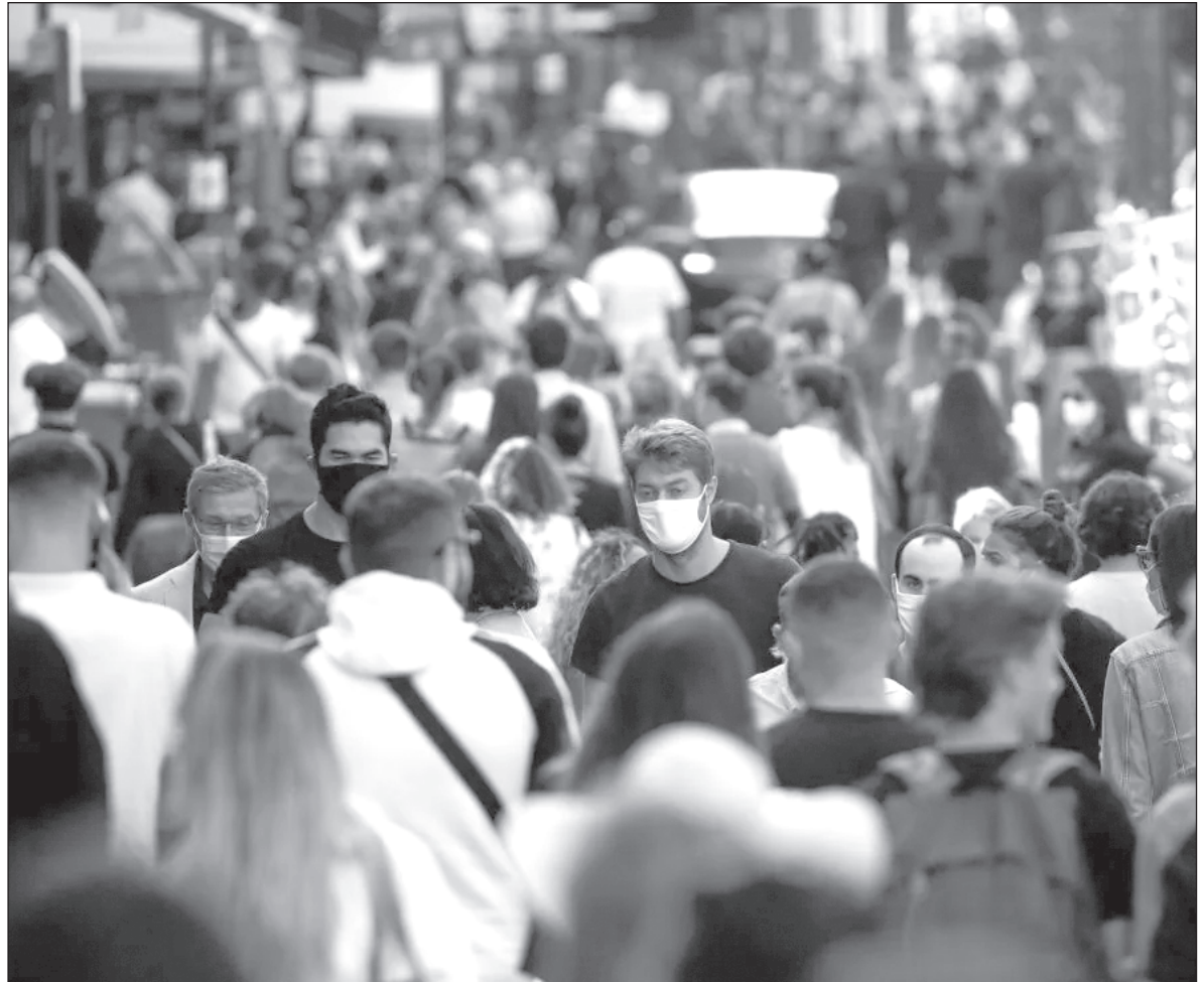
▲ I think about the society of complainers that we are becoming. Complaining about wearing masks, about social distancing and complaining about staying at home.

JOHN F. KENNEDY once said that the Chinese character for crisis is composed of two elements: one signifying danger, the other, opportunity.