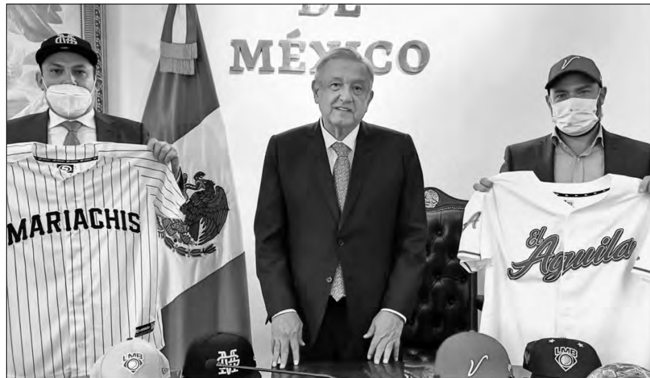
▲ El presidente López Obrador recibió en Palacio Nacional al presidente de la Liga Mexicana de Beisbol, Horacio de la Vega, acompañado de los propietarios de las dos nuevas franquicias de expansión, Guadalajara y Veracruz.

En su intervención, De la Vega recordó que eran 16 equipos y a partir del