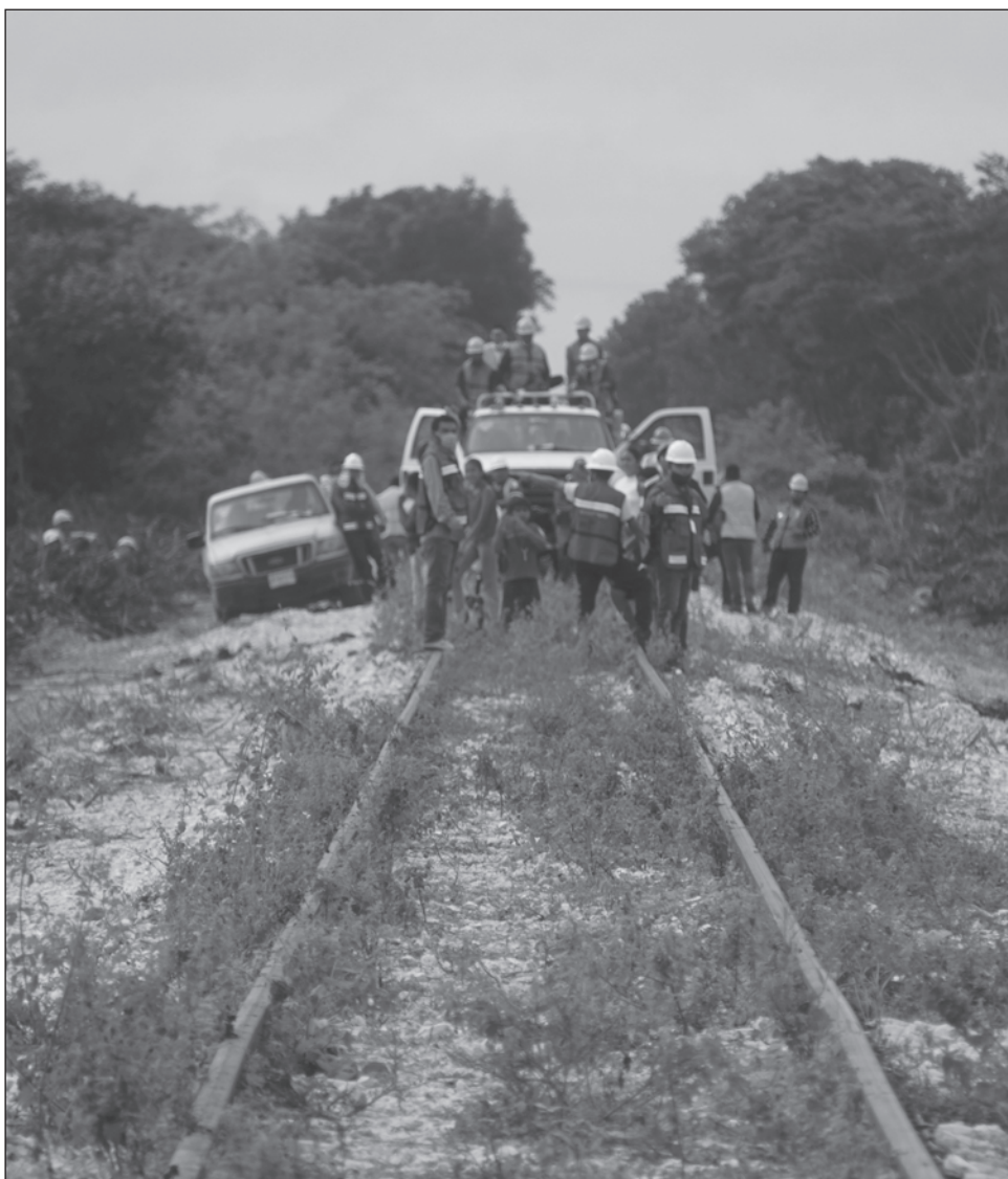
▲ Con el Tren Maya podrían abrirse nuevos esquemas de conservación.

Es indiscutible que el sureste del país posee una gran cantidad de recursos naturales y culturales que deben ser valorados y conservados, expresó, pero también es importante que éstos representen un beneficio para las comunidades locales.