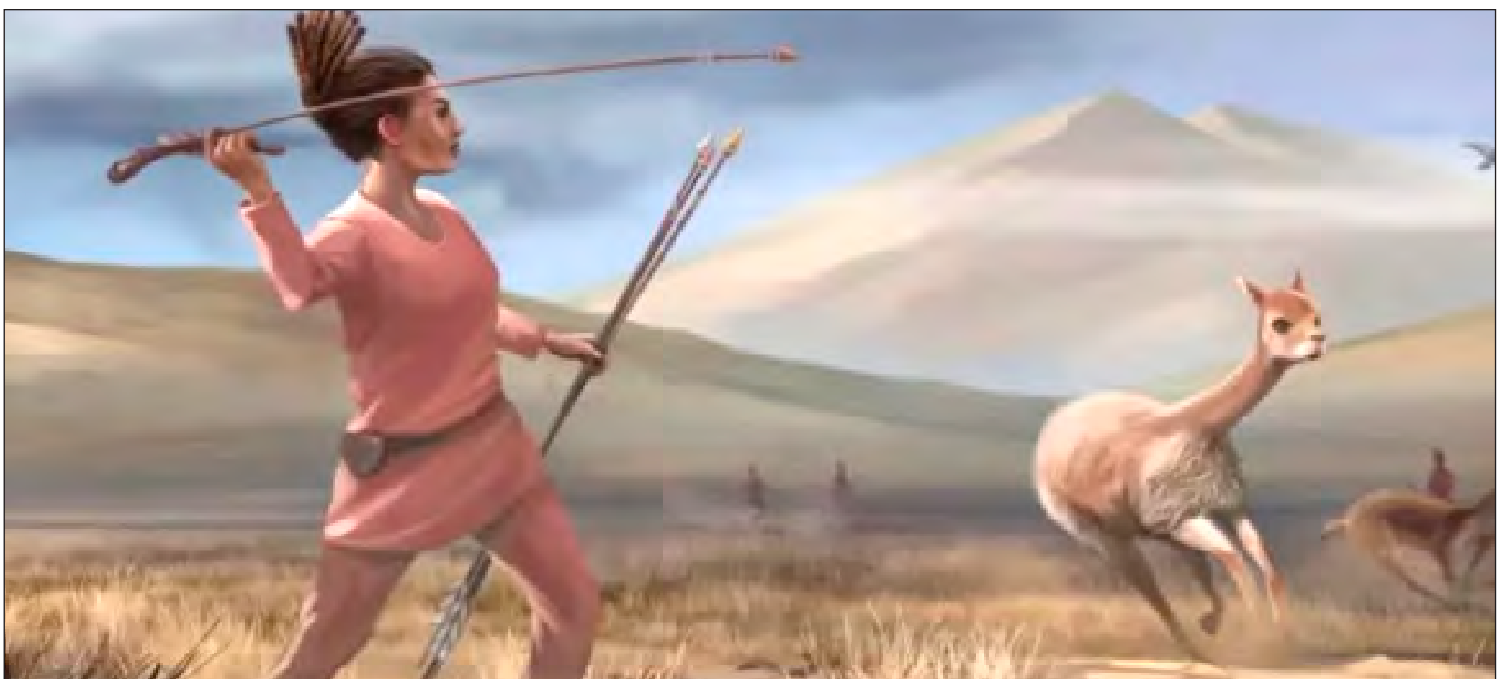
▲ Junto a los restos de la cazadora, los investigadores encontraron propulsor que permitía aumentar la velocidad y la distancia de las lanzas.