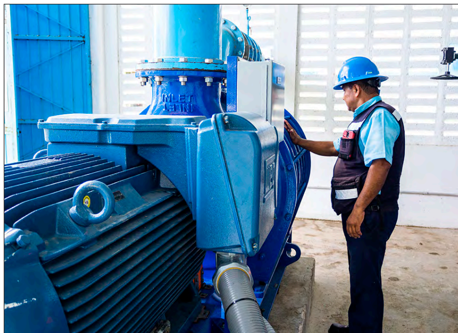
▲ La concesionaria ha trabajado en la aplicación de programas y procesos ambientales que permiten el control y la gestión oportuna de permisos ambientales.

Dicha certificación se refrenda cada dos años y es muestra de la responsabilidad de la empresa para brindar la máxima calidad en los servicios de agua potable, drenaje sanitario y saneamiento, los cuales tienen efectos directos so-