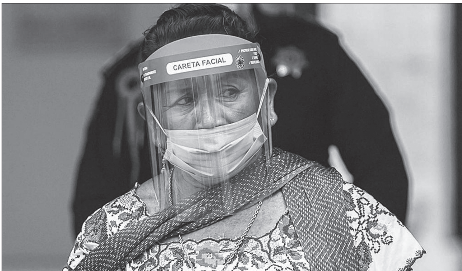
▲ Yucatán es la entidad federativa con el mayor número de casos confirmados y defunciones de población que se reconoce como indígena.