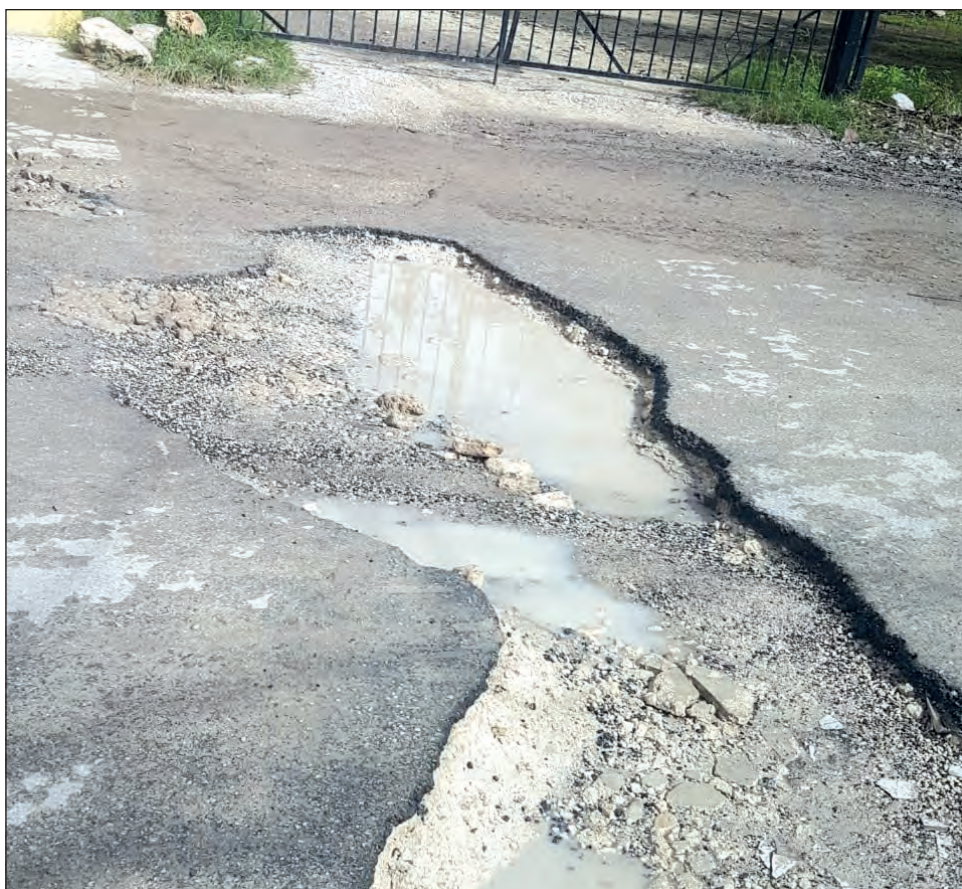
▲ En Benito Juárez, las quejas de ciudadanos en las redes sociales acusan daños a sus vehículos al circular por calles y avenidas muy afectadas.