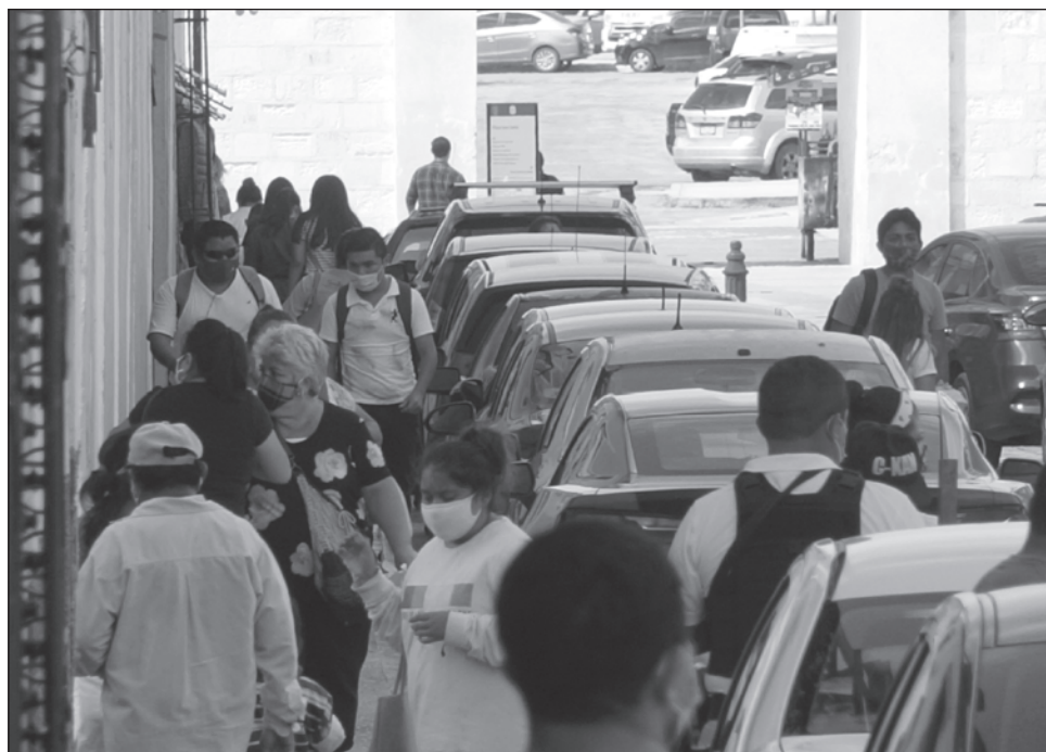
▲ Un leve aumento en el índice de contagios de COVID-19 ha encendido las alertas en el sector empresarial.

El dirigente agregó que de la misma manera hay muchos sectores de la economía en la isla que no han podido alcanzar los niveles que presentaban en febrero, ante de las medidas restrictivas por la pandemia.