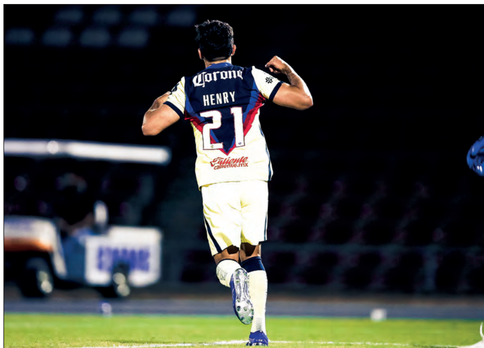
▲ El yucateco y seleccionado nacional Henry Martín tenía anoche siete goles, la máxima cifra entre nacidos en México en el torneo Guardianes 2020 de la Liga Mx.

León se quedó corto por un punto de igualar su mejor marca en torneos cortos, impuesta en el Clausura 2019, y a tres del registro histórico de 43 que el América alcanzó en