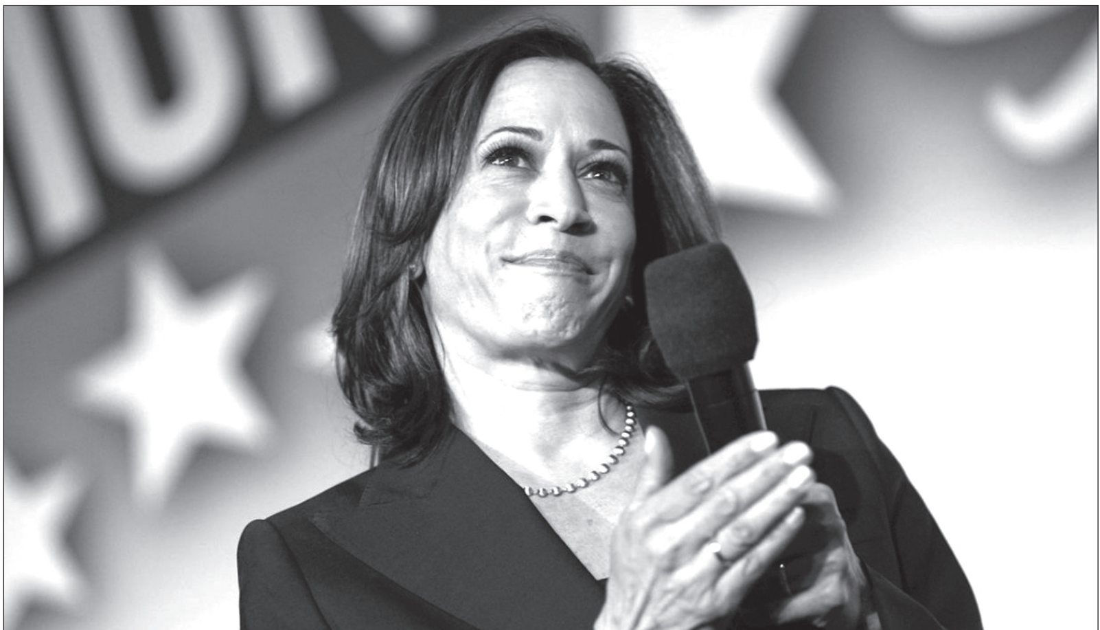
▲ La experiencia de Kamala Harris como activista por los derechos de las minorías será una pieza clave para acabar -o al menos intentarlo- con las manifestaciones en Estados Unidos.