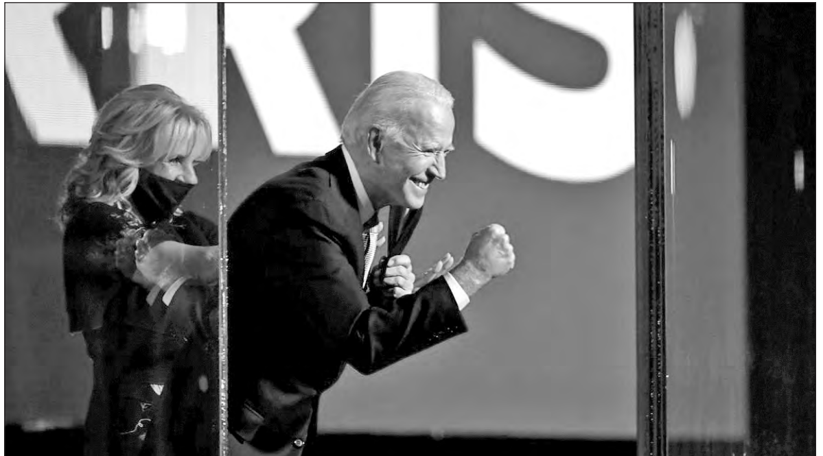
▲ Joe Biden pronto mostrará lo que realmente esconde tras su sonrisa de buen chico americano.

Ya lo dijo Biden: volveremos a firmar el Tratado de París sobre el cambio climático, el que abandonó Trump, aunque obligue escasamente a los Estados Unidos en materia de calentamiento global, pues la nación sistemáticamente se ha negado a reconocer su responsabilidad histórica en el cambio climático y a asumir sus responsabilidades, sea con Demócratas o con Republicanos.