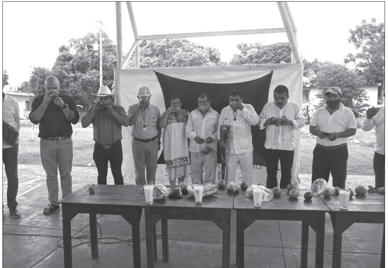
▲ En Hecelchakán se reunieron representantes del Fondo Nacional para el Fomento al Turismo (Fonatur) y del Tren Maya.

Hizo énfasis en el valor del producto, sobre todo cuando hay zonas del Camino Real en donde practican el desarrollo de esta actividad de manera orgánica, "aprovechando las posibilidades de carga del Tren Maya, la miel podría moverse directamente desde Campeche hacia zonas de embarque para que sean da-