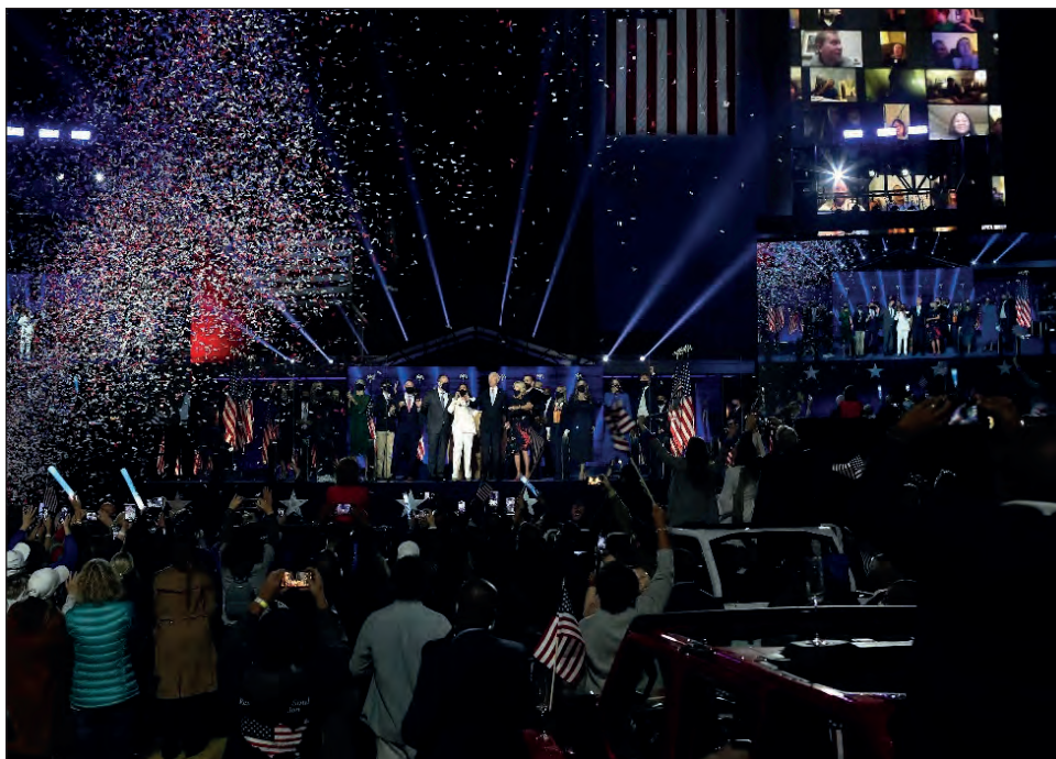
▲ Biden ofreció su primer discurso como presidente electo, y pidió unidad para hacer de Estados Unidos la nación que saben que pueden ser.

"Esta noche todo el mundo esta viendo a Estados Unidos" al cual llamo "un