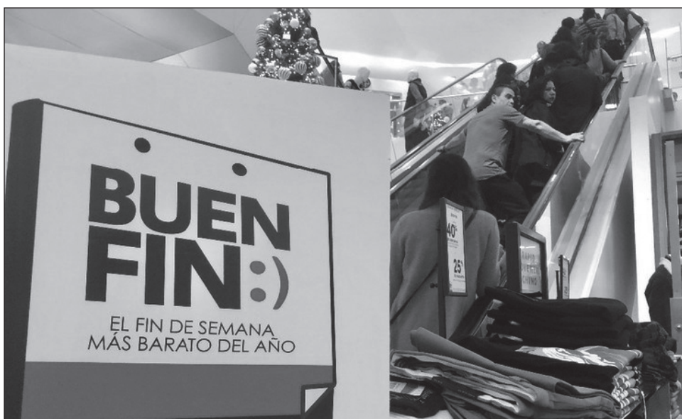
▲ En esta ocasión, y debido a la contingencia sanitaria, El Buen Fin durará dos semanas.

Agregó que el alza en el número de contagios observados en Chihuahua y Ciudad de México, así como el confinamiento en Durango y Jalisco inhibirán el comportamiento del consumo en estas casi dos semanas.