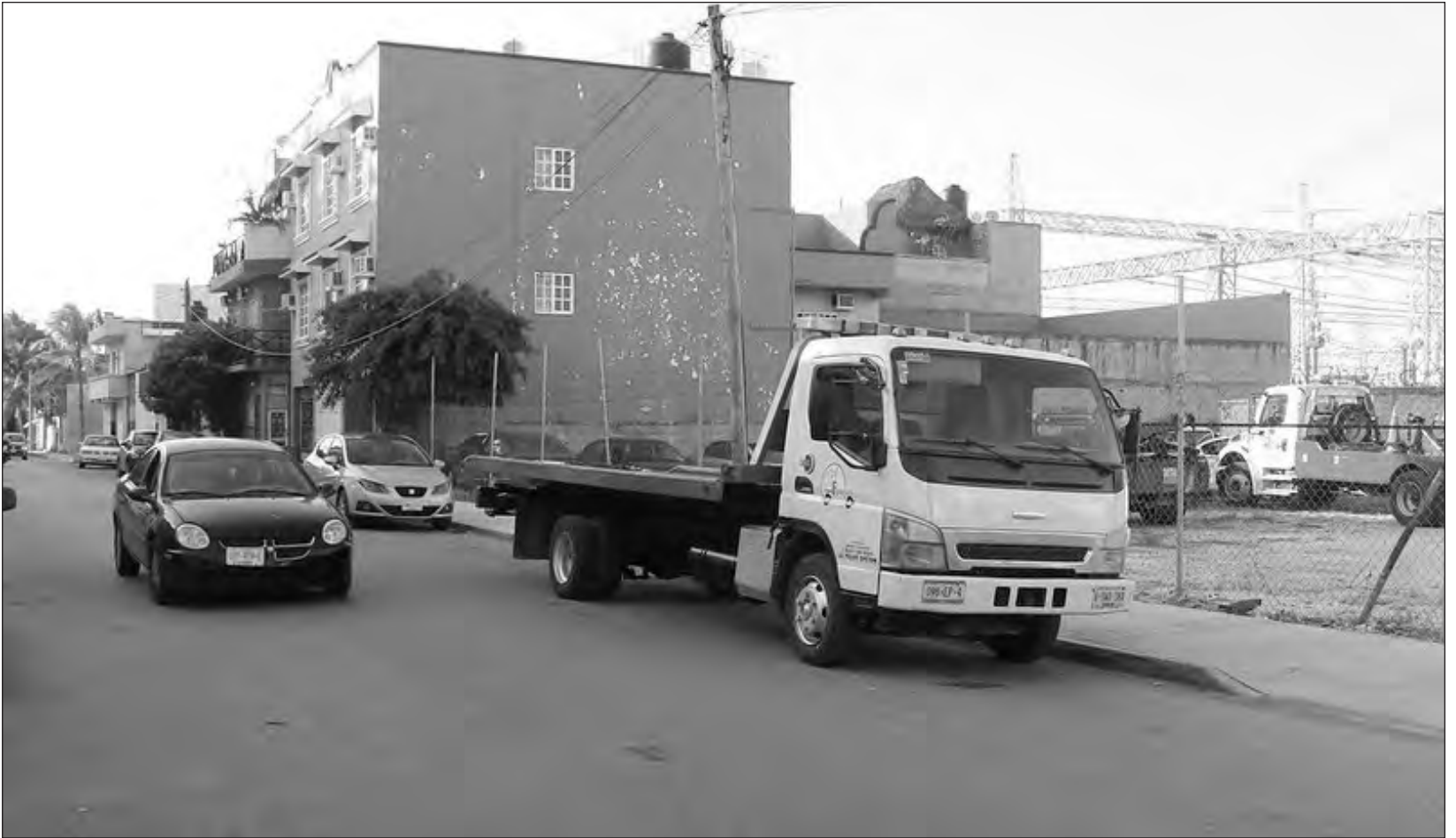
▲ La mayor parte de las unidades móviles se concentran en la zona norte del estado, específicamente en Benito Juárez, Solidaridad y Cozumel.