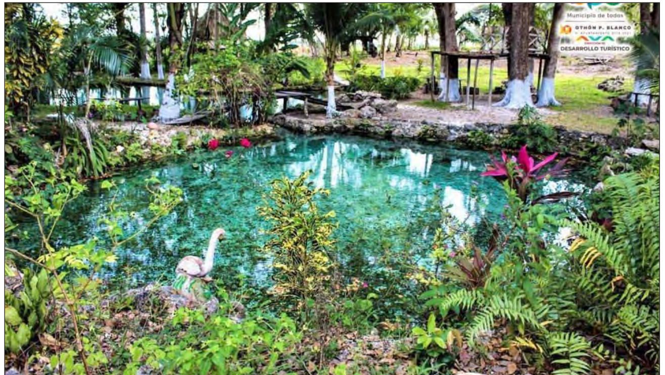
▲ En el sur de Quintana Roo no se ha podido recuperar la ocupación hotelera desde el inicio de la pandemia.

Sostuvo que en el sur de Quintana Roo no se ha podido recuperar la ocupación hotelera desde el inicio de la pandemia, motivo por el que muchos empresarios han te-