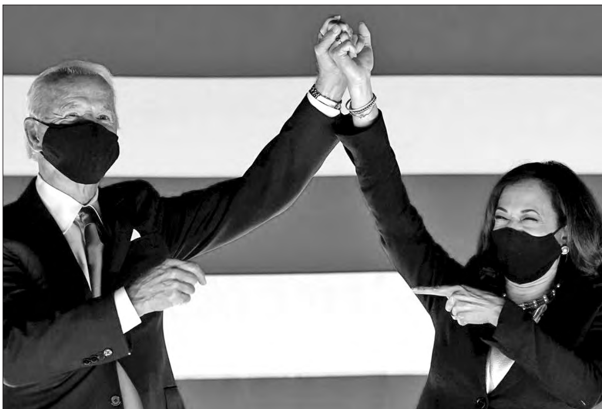
▲ Biden and Harris have a tremendous task ahead of them.

AUTHORITARIAN LEADERS OFTEN govern on the basis of divide and rule. They also count on the inability of opposition groups to unite and opposition leaders to set aside personal ambition and coalesce behind one leader in order to win.