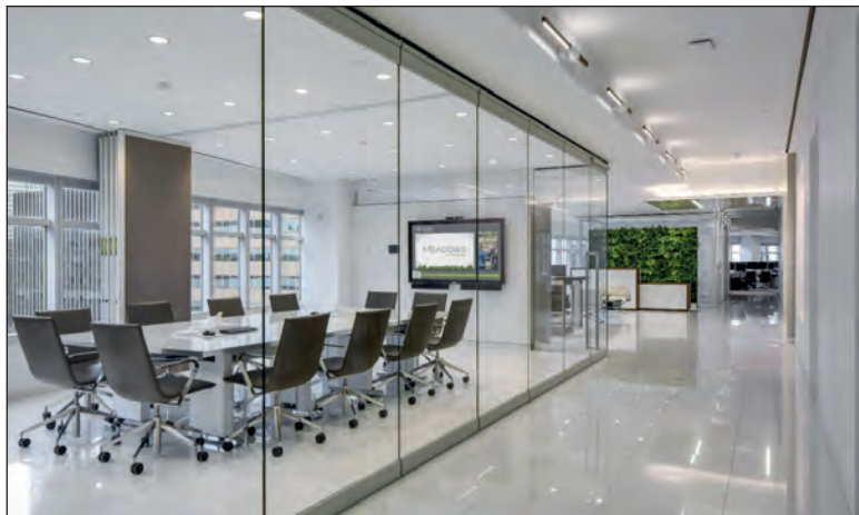
▲ Diseño cosmopolita y un entorno natural inigualable, para satisfacer todos los estilos de vida

Esto está contemplado por la certificación LEED, ya que para obtenerla, es necesario planificar un desarrollo verdaderamente inteligente desde su ubicación y accesibilidad, además del aprovechamiento de espacios, la protección del hábitat, uso eficiente del agua y de la energía, la utilización de materiales locales, ecológicos o con certificaciones verdes, así como la innovación en el diseño.