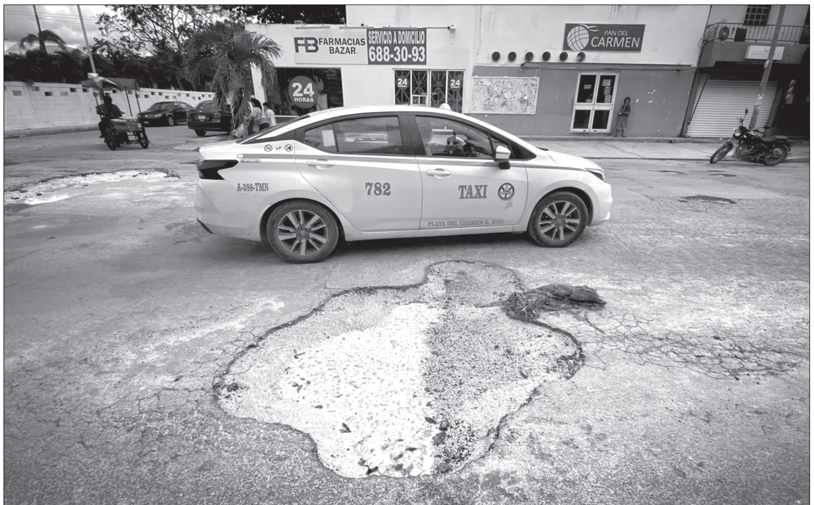
▲ La Ley de Responsabilidad Patrimonial obliga a la autoridad a pagar indemnizaciones si los automotores sufren algún desperfecto causado por baches.

"Son las personas que se han acercado a la CAPA, presentando evidencia y presupuesto de los daños, por lo regular una fotografía de la zanja y la ubicación. Una vez que se verifica, la dependencia realiza la gestión con la empresa responsable de los trabajos para la reposición de los daños", informó una fuente al interior de la comisión.