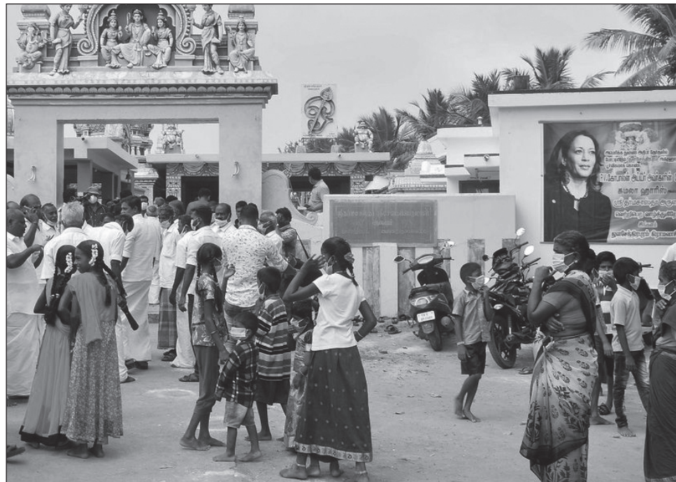
▲ En Nueva Delhi, los habitantes aclamaron los orígenes indios de la familia de Harris.