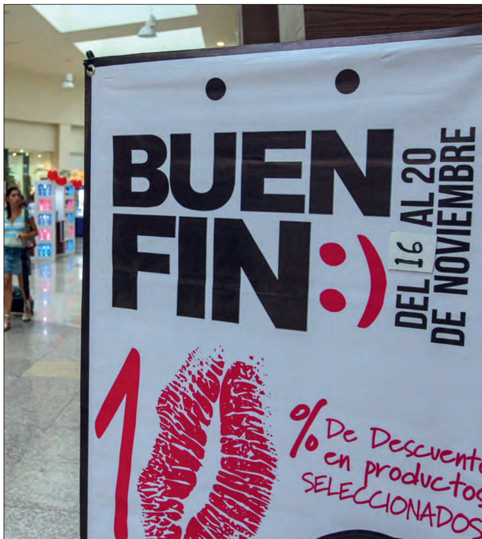
▲ La dirección de Prevención y Promoción de la Salud recordó que los empresarios ya saben las normas y las consecuencias de cualquier arbitrariedad.

Hizo énfasis en que las medidas deben ser adoptadas por los servicios y dependencias de gobierno, que también pueden recibir algún tipo de recomendación y/o amonestación en caso de brindar algún servicio sin las medidas de prevención y sanidad necesarias.