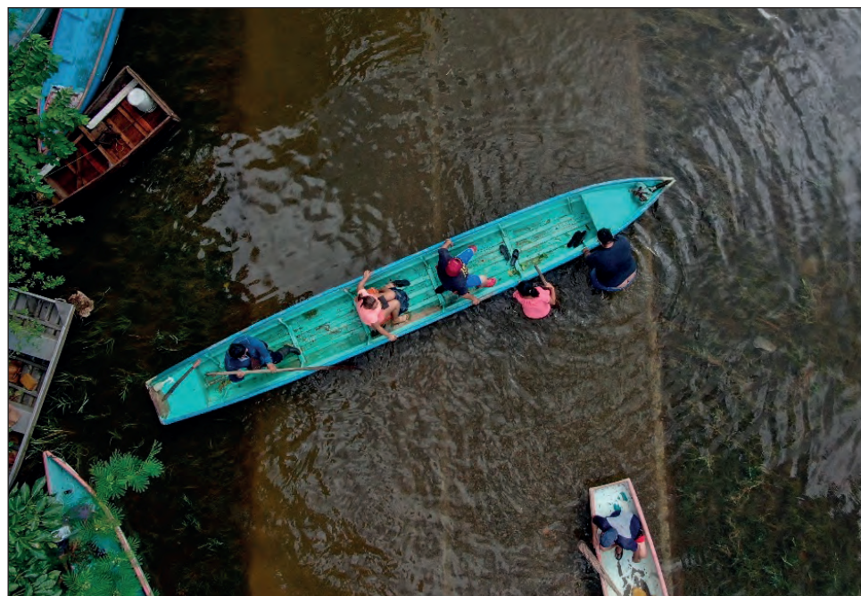
▲ La crecida del río Grijalva dejó miles de damnificados, pero hasta el momento no ha cobrado ninguna víctima.

“Hemos batallando para que no haya más aumento de agua, yo creo que vamos a poder salir adelante sin que se padezca de la inundación en Villahermosa. Ya está mas controlada la presa Peñitas porque ha dejado de llover y hay pronóstico de que no va a llover estos días”, aseguró en un video en redes sociales, antes de viajar a la Ciudad de México en vuelo comercial, pasadas las 11 de la mañana.