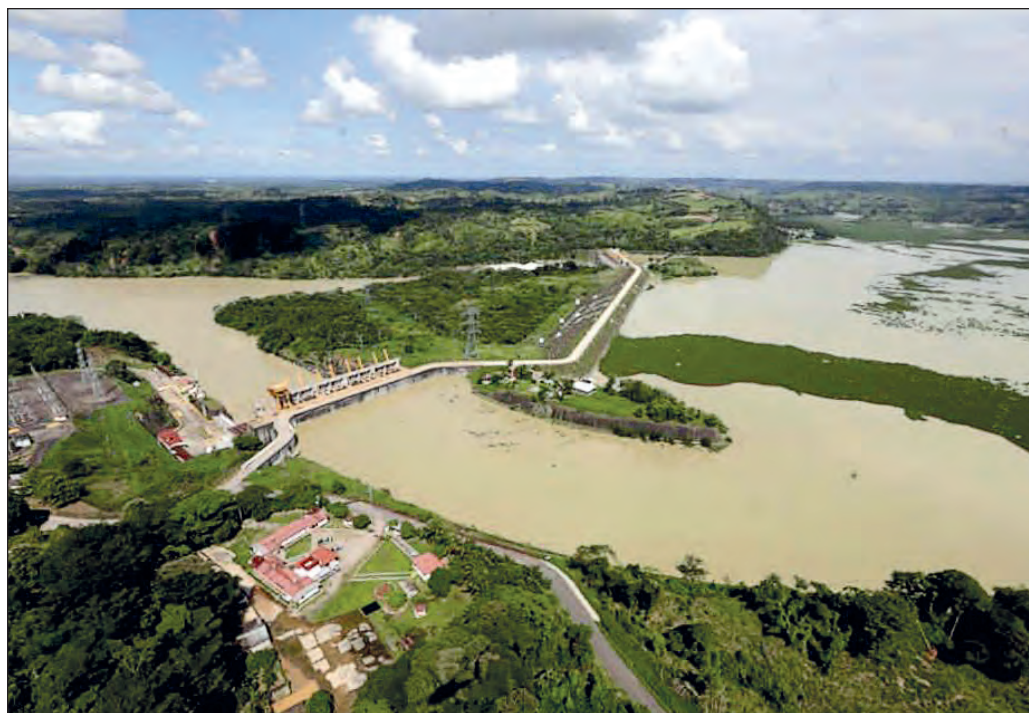
▲ Los llamados "desastres naturales" siempre tienen un componente social, y las inundaciones en Tabasco no son la excepción.

Nombre del diario: La Jornada Maya , año 6, número 1355