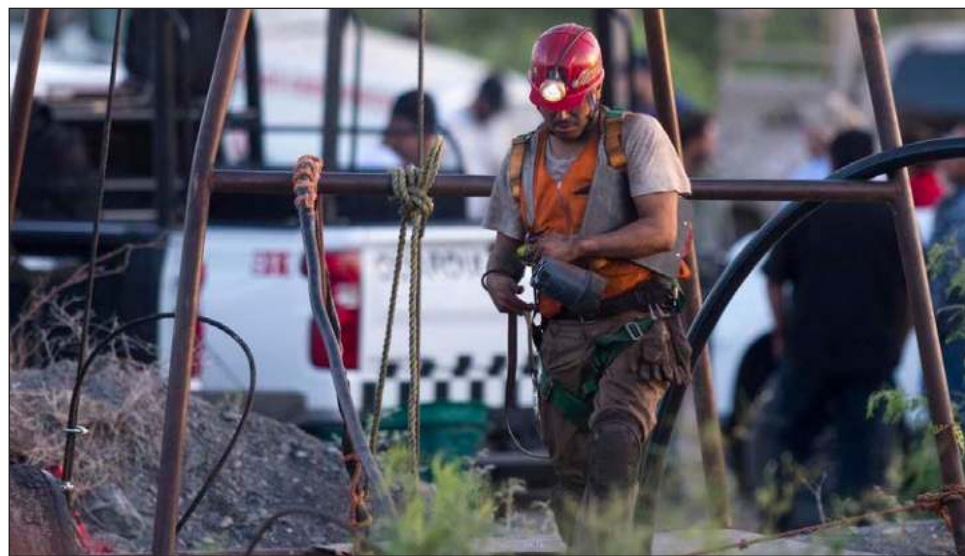
▲ Las autoridades preparan este lunes un operativo para que buzos rescatistas puedan ingresar a la mina de carbón inundada, donde diez obreros permanecen atrapados.

"El día de hoy se estará trabajando con un dron submarino que hizo llegar la Marina", dijo la titular del organismo, Laura Velázquez, durante la conferencia de