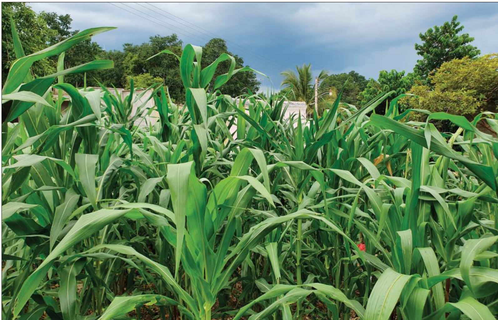
▲ La milpa Maya cumple con los requisitos de ser paisaje natural impresionante (también se considera un sistema agroforestal), tiene prácticas agrícolas que generan medios de vida en áreas rurales, y combinan biodiversidad, resiliencia, tradición e innovación de manera única.