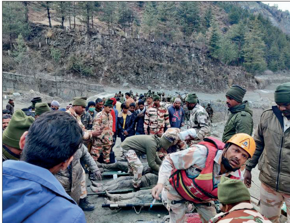
▲ En la represa de Richiganga todavía hay unos 200 desaparecidos.

Doce personas fueron socorridas el domingo en