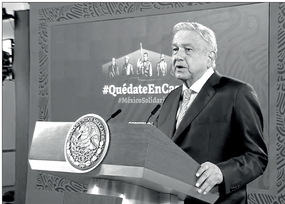
▲ El Presidente adelantó que esta semana acudirá a la ceremonia de la Marcha de la Lealtad. El fin de semana irá a Oaxaca.

“Afortunadamente salí adelante, aquí estamos para continuar luchando; agradecer a muchos amigos del extranjero, y a todo el pueblo de México que expresaron su deseo de que me recuperara y saliera adelante. Sus bendiciones, sus rezos, sus buenas vibras a todos. Como decía a José Martí: ‘Amor con amor se paga’.