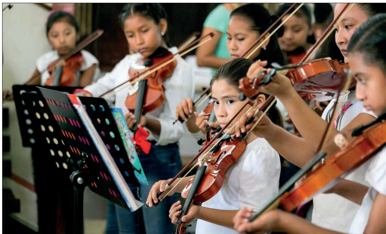
▲ Después del horario escolar, los niños continúan con su clase de música. Ocho maestros se encargan de dar seguimiento a uno o dos alumnos cada vez.

Desde 2001 perteneció a diferentes proyectos de iniciación musical en Yucatán. Algunos de sus alumnos han sido solistas en orquestas sinfónicas y confiesa siempre preferir a los niños: “Me he especializado en los niños, tuve muchos maestros que decían que si no estaba bien todo desde el inicio, es decir, con los niños, nada iba a estar bien. Los adultos tienen cargas emocionales que no nos dejan ser, siempre estamos pensando en qué van a decir de mí si fallo y tendemos a tener miedo a que la gente se burle, y con los niños no”.