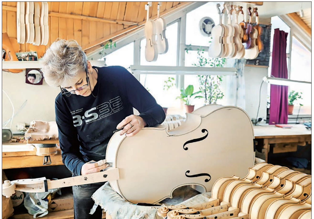
▲ Laudereros, hombres y mujeres, pegan, alinean y verifican la manufactura de violines y chelos fabricados en el taller de Vasile Gliga, ubicado en Reghin, ciudad rumana en la que en cada calle hay uno o dos locales dedicados a la creación de instrumentos de cuerda.

En esta ciudad de 30 mil habitantes del centro de Rumania, “prácticamente en cada calle hay uno o dos talleres”, señala Virgil Bandila.