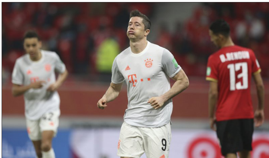
▲ Robert Lewandowski comandó la cómoda victoria del Bayern ayer.

Bayern saldrá en busca de su sexto título en 12 meses, luego del doblete liga-copa en Alemania, la