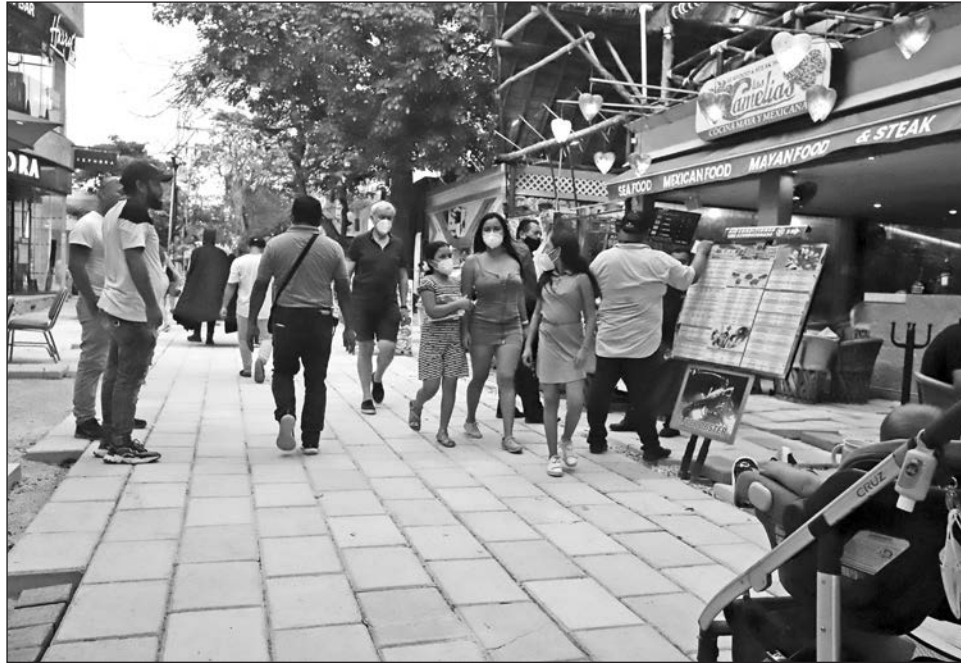
▲ Desde el año pasado se abrió la posibilidad de que bares y cantinas laboren como restaurantes, ya que en semáforo en naranja está prohibida la venta de alcohol sin alimentos.

En conferencia de prensa, Pino Murillo indicó que la Cofepris realiza operativos de verificación, sobre todo en restaurantes, hoteles, transporte público, locales de eventos sociales, y fiestas clandestinas que se organizan principalmente en la región norte del estado.