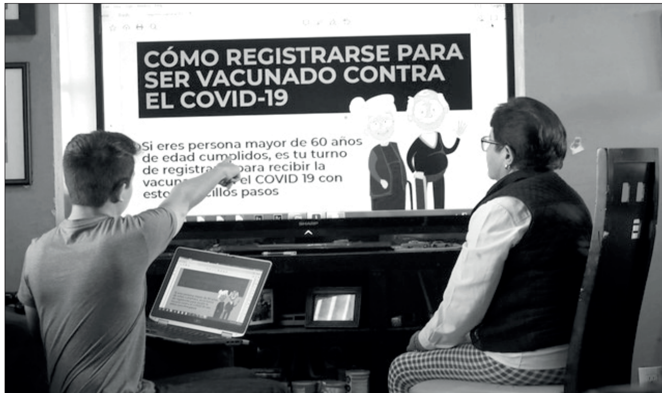
▲ Antes de salir al campo, los estudiantes deberán acreditar un curso de capacitación en aplicación y manejo de vacunas.

Según la convocatoria podrán participar los estudiantes del IPN que cursen la carreras de médico cirujano y partero, médico cirujano y homeópata, además de las licenciaturas en enfermería, enfermería y obstetricia, optometría, odontología, sicología, trabajo social, nutrición, químico farmacéutico industrial, químico bacteriólogo parasitólogo, biología,