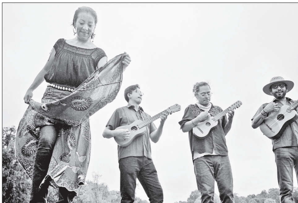
▲ La agrupación demoró siete años para cristalizar su más reciente producción discográfica.

Participaron cerca de 55 músicos de diversas procedencias y estilos; estuvieron involucrados en este