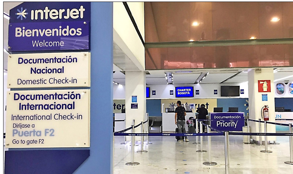
▲ En junio de 2020 la aerolínea realizó un aumento de su capital social, el cual fue aportado por HBC Internacional, sin embargo, actualmente enfrenta problemas financieros.

Según el organismo antimonopolios, las empresas reconocieron que debieron notificar previamente y esperar la autorización antes de concentrarse; asimismo proporcionaron todos los elementos necesarios para el análisis de concentración pertinente.