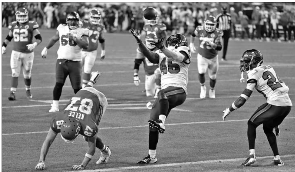
▲ La defensiva de Tampa Bay no dio tregua al poderoso ataque de Kansas City.

La buena noticia para los monarcas de la Conferencia Americana es que la próxima campaña tendrán intacto el núcleo que los llevó a dos finales de la NFL consecutivas, además de que una línea ofensiva diezmada por lesiones y bajas, que fue abrumada