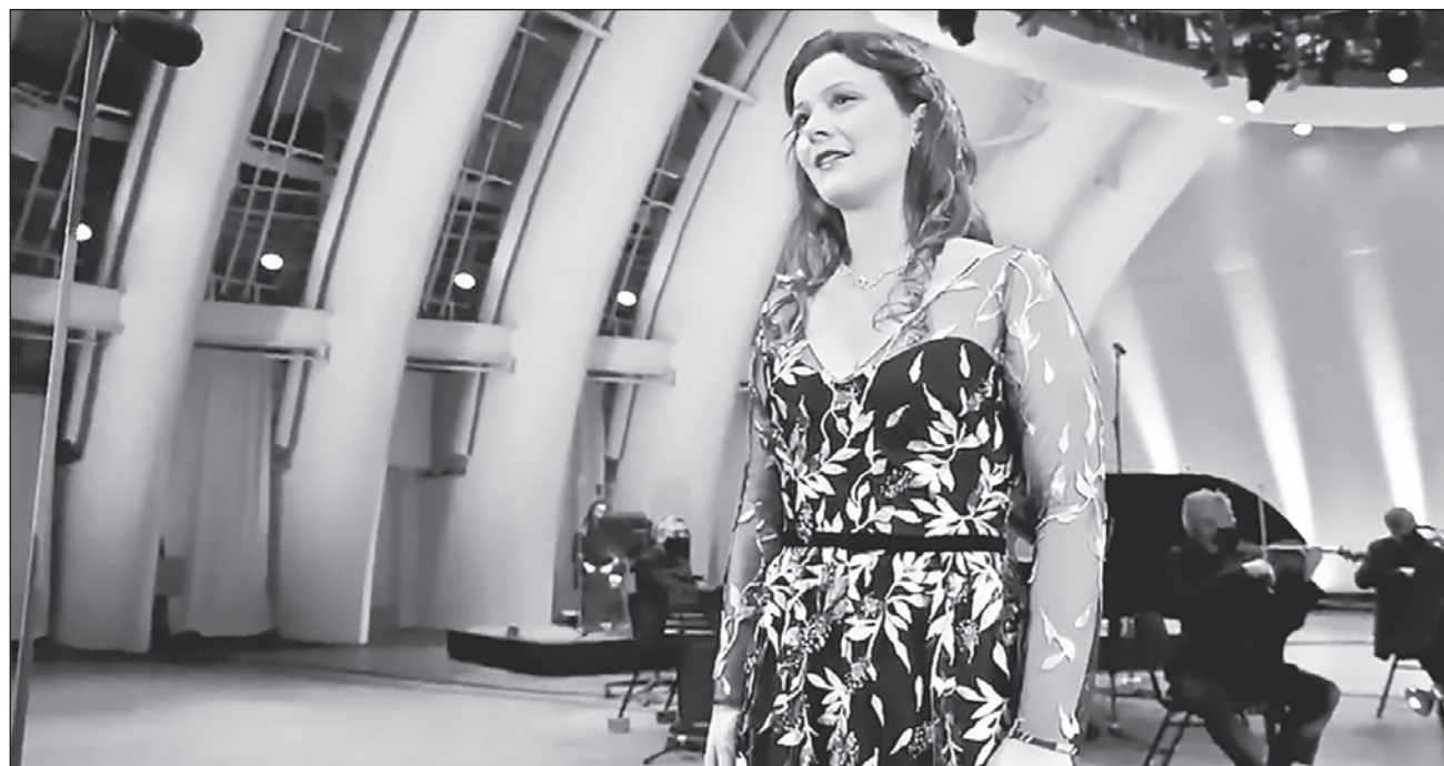
▲ Pedimos a varios iconos culturales que nos compartan la música que los inspira, ya que ésta es la fuerza motriz que impulsa nuestras mejores ideas, nos motiva a actuar y nos mueve a crear cosas maravillosas, mencionó Dudamel.

En el solo de la pianista china, la conocida pieza de Márquez evoca la nostalgia por el baile, el recuerdo de las noches tumultuosas mientras los cuerpos danzan acompañados. Ahora el lugar de esa pasión.