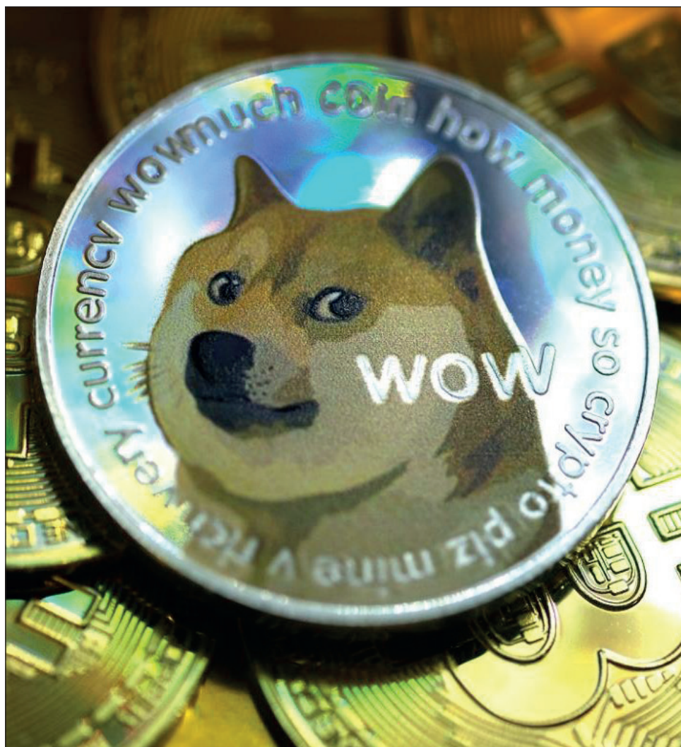
▲ El fin de semana, Elon Musk, Gene Simmons y Snoop Dogg tuitearon a favor de la criptomoneda, elevando su valor.

La criptomoneda, también llamada memecoin, se enfila a alcanzar el valor de un dólar.