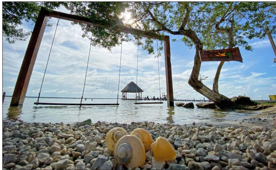
▲ En la península de Yucatán, 98.5 por ciento del agua que se utiliza en la zona es subterránea.

Frente a dicha omisión, residentes de Cancún y