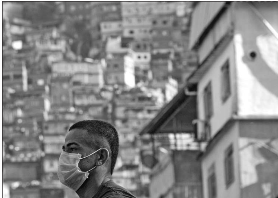
▲ En los países hispanoamericanos el empleo permanece por debajo de los niveles previos a la crisis.

De acuerdo con los estimados actualizados el 26