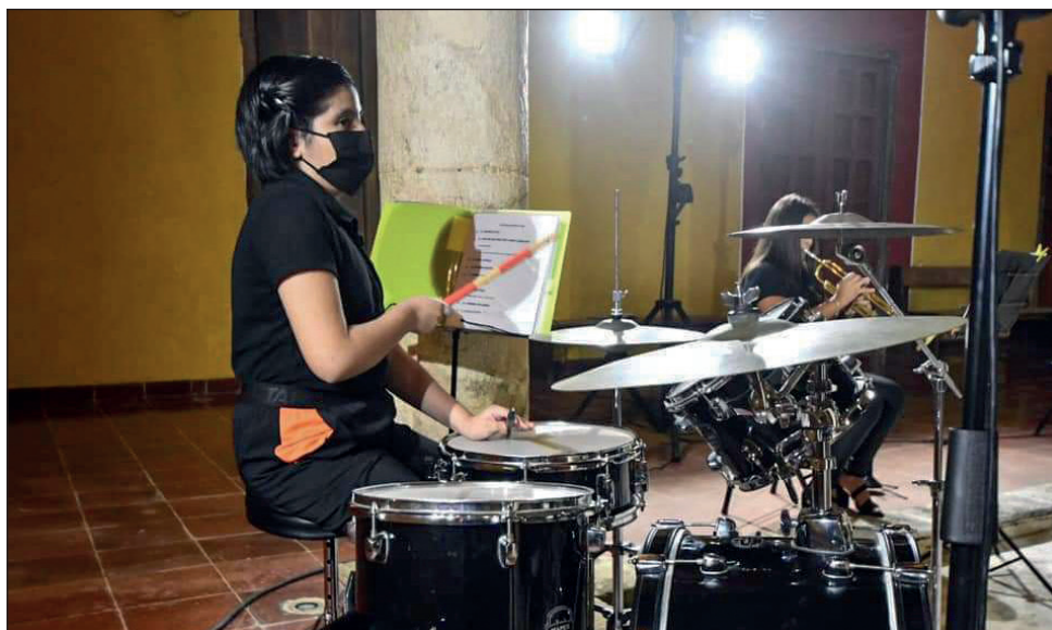
▲ Siempre vi la batería de mi papá, imaginaba para qué servía hasta que le pregunté a mi mamá y le dije que quería aprender a tocar.

Admite que, siendo mujer, no conoce a una mujer baterista famosa; admira a Lars Ulrich, baterista de la banda estadounidense Metallica, haciendo especial énfasis en que su género preferido es el rock pesado, pero que no por ello va a cerrar su repertorio en ese estilo; con otros colegas ha ensayado canciones de estilos muy diferentes.