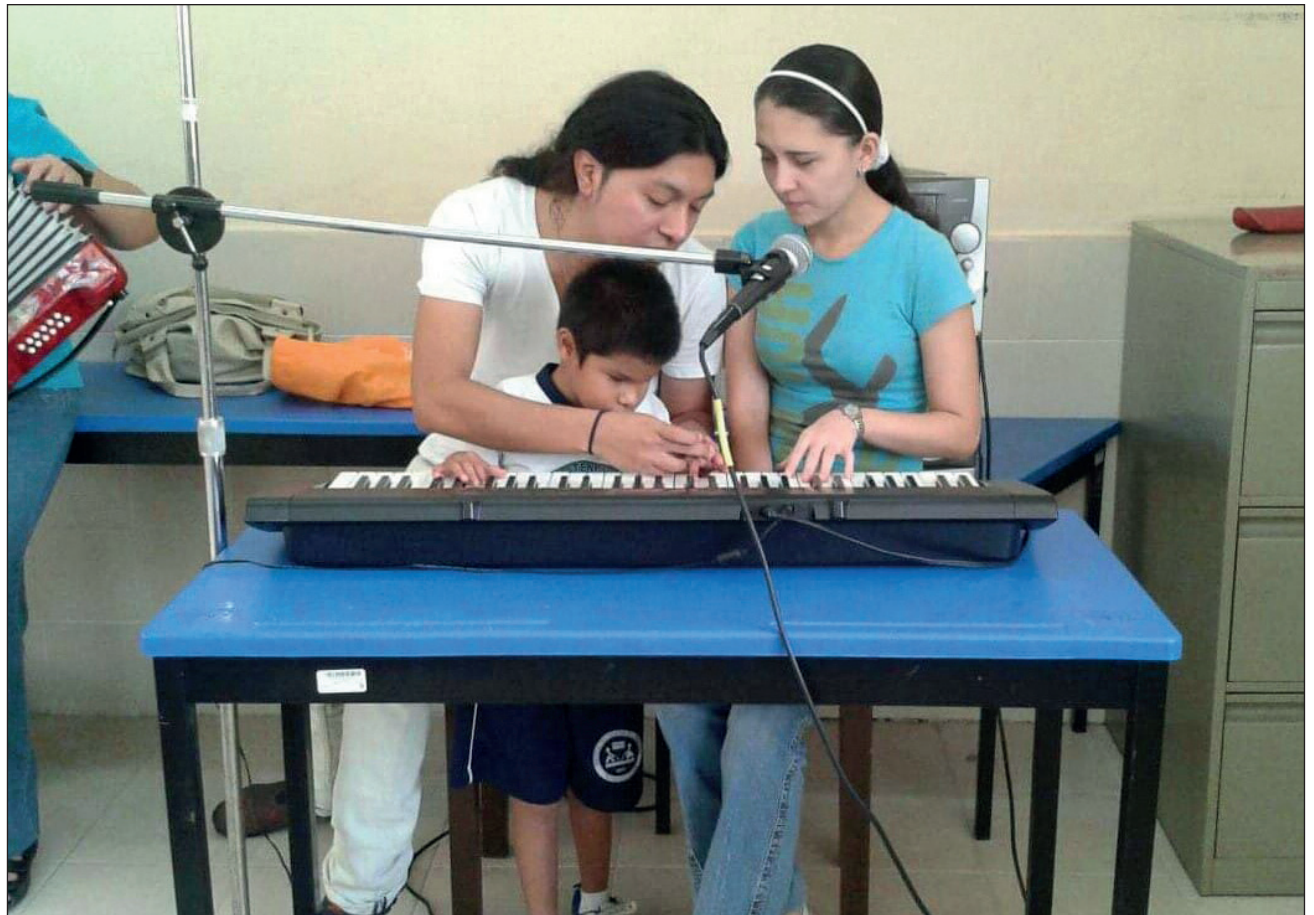
▲ Al igual que en la escuela, el aprendizaje musical se complica cuando no se puede trabajar de manera presencial y sin el contacto directo con el docente

Al estar en contacto con la música me siento muy feliz, apasionado; me siento orgulloso y entusiasmado