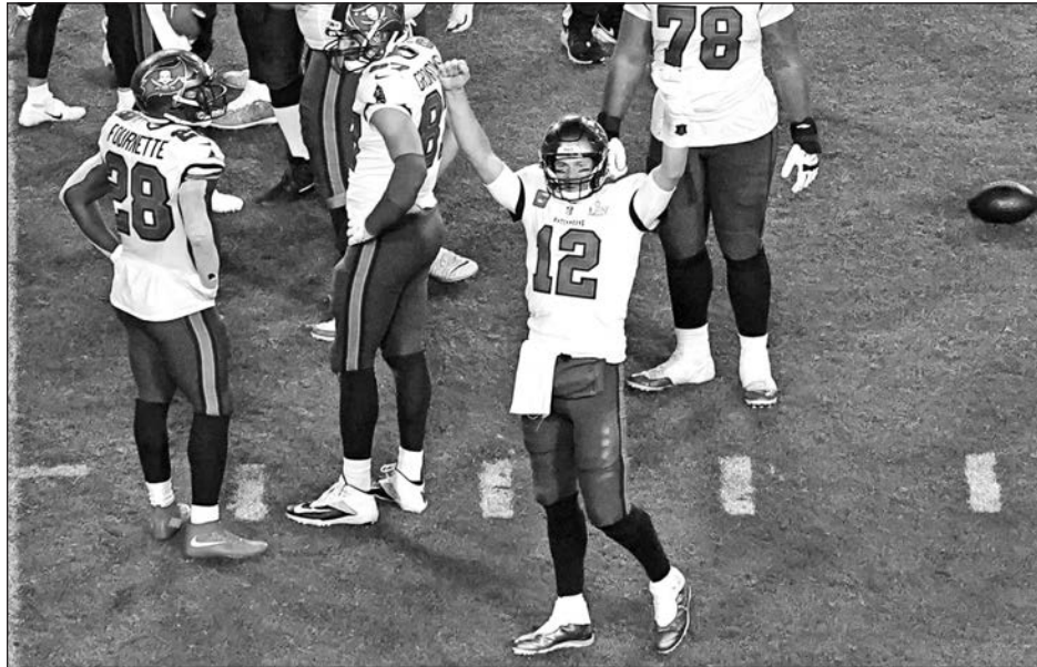
▲ Tom Brady disputó 10 Súper Tazones, ganó siete y en cinco fue nombrado el Jugador Más Valioso.

Y échenle la culpa a Brady por amargar tantas fiestas de “Super Bowl” de gente que simplemente no