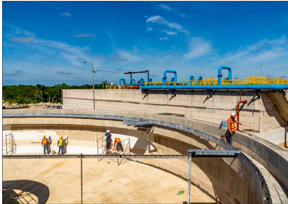
▲ En Solidaridad están programadas más de 20 obras para optimizar el servicio.

En la ciudad de Cancún, donde se ha presentado una explosión demográfica considerable, año con año se implementan obras estratégicas para mantener la cobertura del 100%, por lo que durante este año y en atención a este crecimiento; específicamente en la zona sur de la ciudad como parte del plan preventivo para continuar con la correcta recolección y saneamiento de las aguas residuales, se trabajará en la construcción del colector de aguas residuales para con-