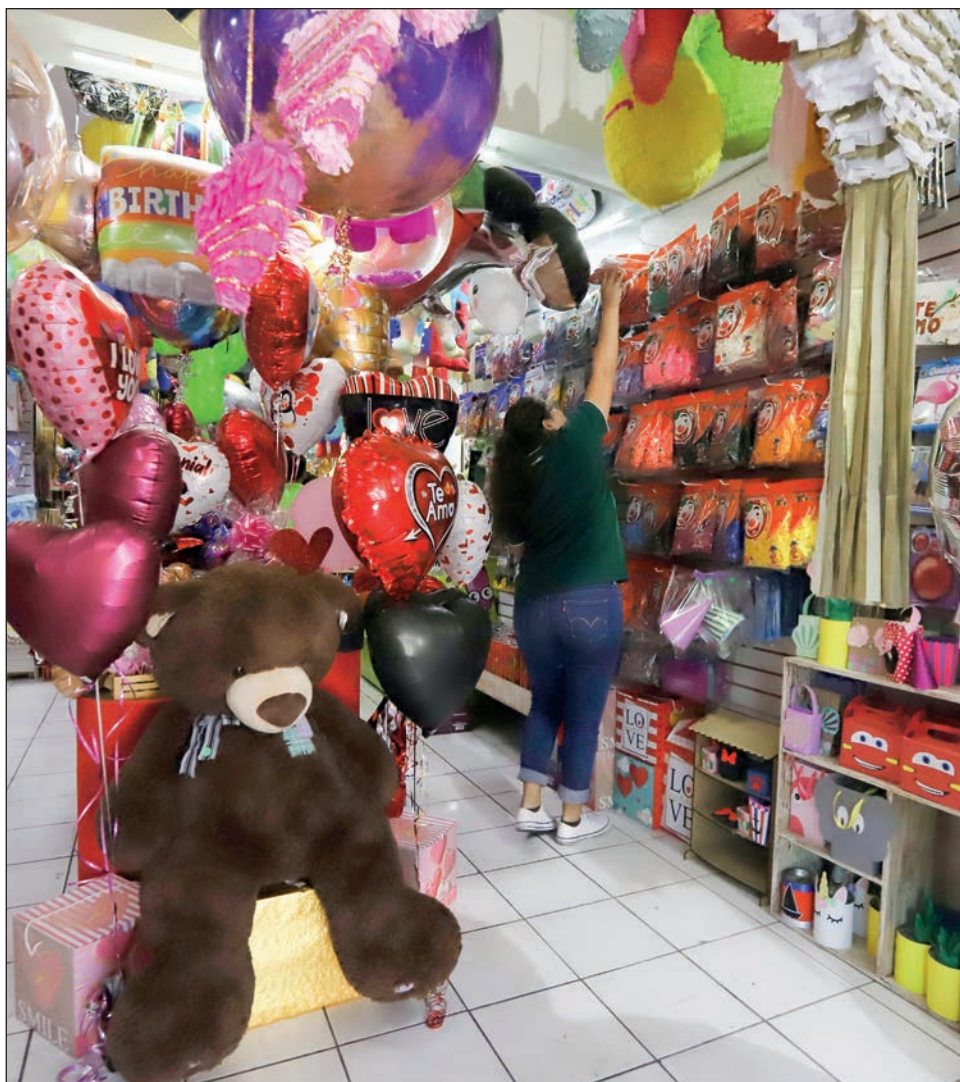
▲ Como es tradición, los globos con forma de corazón son de los productos más demandados en el Día del Amor y la Amistad.

"Ellos no quieren arriesgarse a que les pongan una multa de 5 mil pesos, así que invitamos a las autoridades correspondientes a que se les dé la facilidad de introducir su producto y no tengan pérdidas como hasta el momento han tenido", concluyó el líder empresarial.