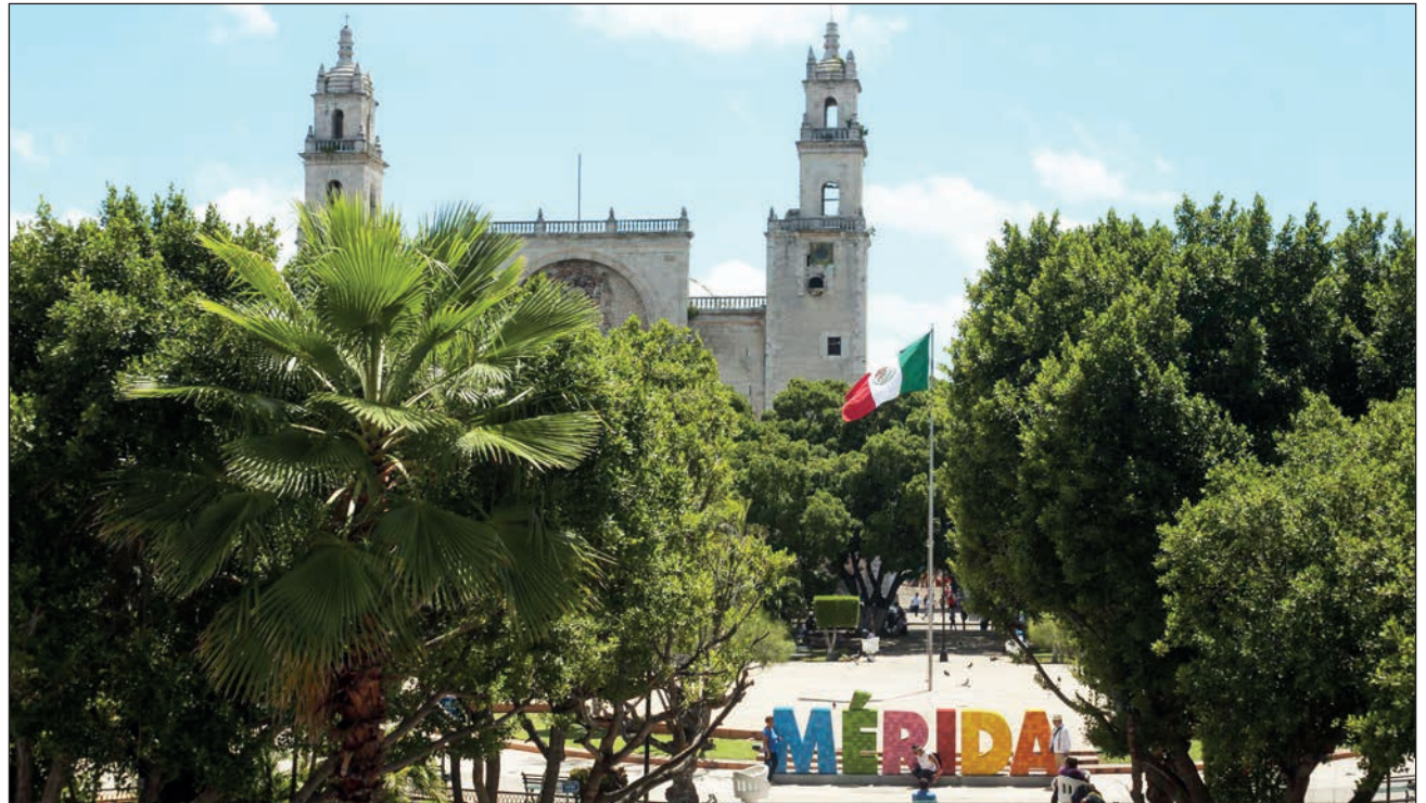
▲ Ichil u nu'ukts'íibil Vivir Mérida, ku tso'olol jayp'eel k'a'ana ba'alo'ob unaj u yojéeltik máax'ob ku kóojolo'ob kajtal tu noj kaajil Jo'e', ikil u kaxta'al ma' talamchajal ti' máak kéen p'áatak te'e lu'uma'.