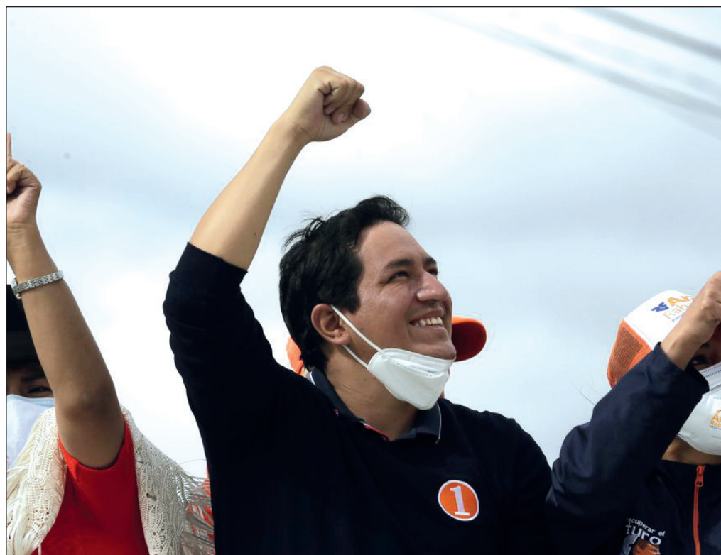
▲ El electorado ecuatoriano se decantó mayoritariamente por dos corrientes de izquierda: la de Revolución Ciudadana y la de los movimientos indígenas y ambientalistas

En el terreno continental, resulta esperanzadora la posibilidad de un retorno de Ecuador al programa soberanista y social de la Revolución Ciudadana. Argentina ha superado el breve retroceso que significó el gobierno derechista de Mauricio Macri (2015-2019) y Bolivia logró superar el cruento golpe de Estado de noviembre de 2019 y ratificar en las urnas el respaldo social al Movimiento al Socialismo (MAS). Si esa posibilidad se concreta, será posible dar nueva vitalidad a organismos como la Unión de Naciones Suramericanas (Unasur) y la Comunidad de Estados Latinoamericanos y Caribeños (Celac) y marginar la perversa y antidemocrática influencia de la Organización de Estados Americanos (OEA) en la región. Por el bien de los ecuatorianos y de toda América Latina, cabe esperar que así sea.