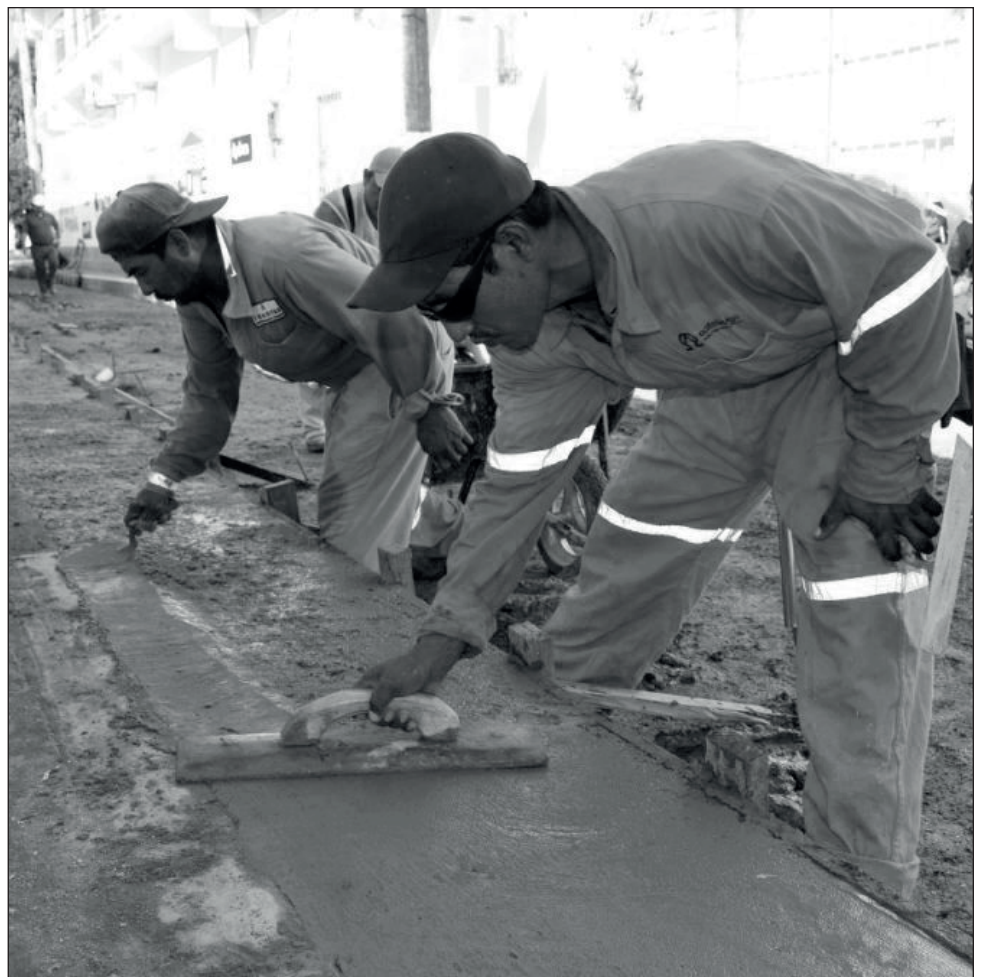
▲ Está proyectada la pavimentación de más de 15 kilómetros de arterias, con concreto hidráulico o asfáltico, según las características del suelo.

Calderón Calderón dijo que el alcalde, Óscar Román Rosas González ha girado instrucciones para que se lleven a cabo obras que no sólo cambien el rostro de la ciudad, sino también de las comunidades rurales, mejorando el nivel de vida de sus habitantes.