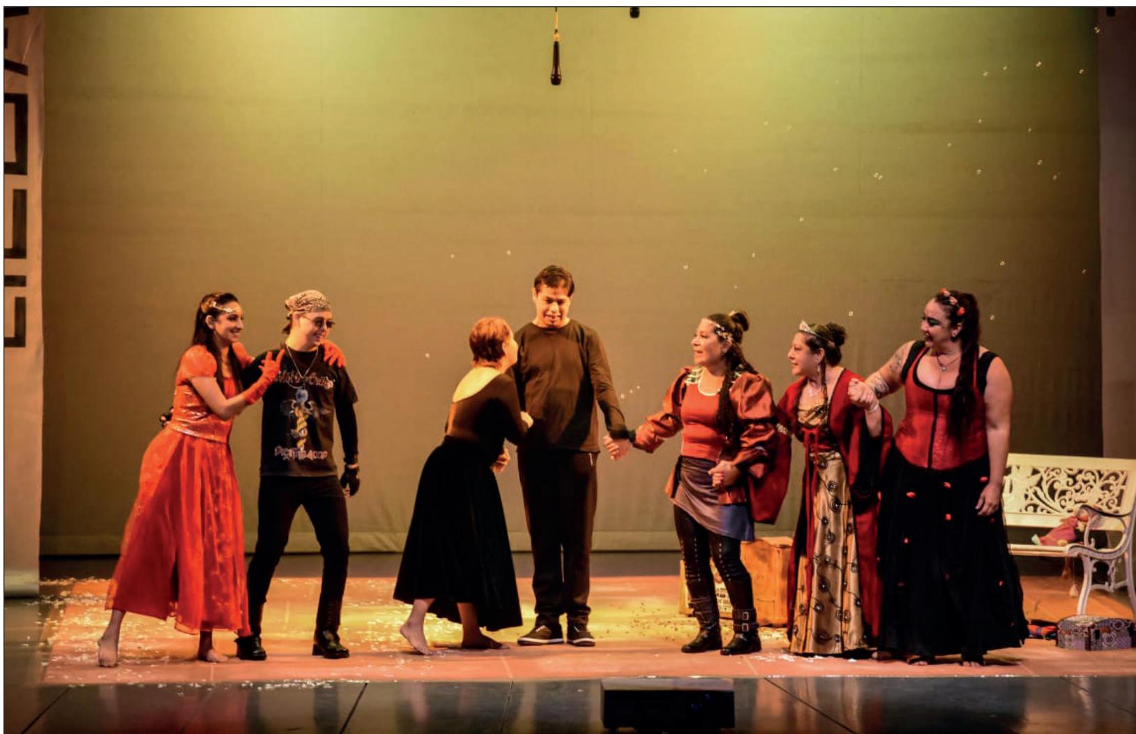
▲ El reparto de Ritual se entrega al trabajo, es un goce estar, ensayar y salir a escena