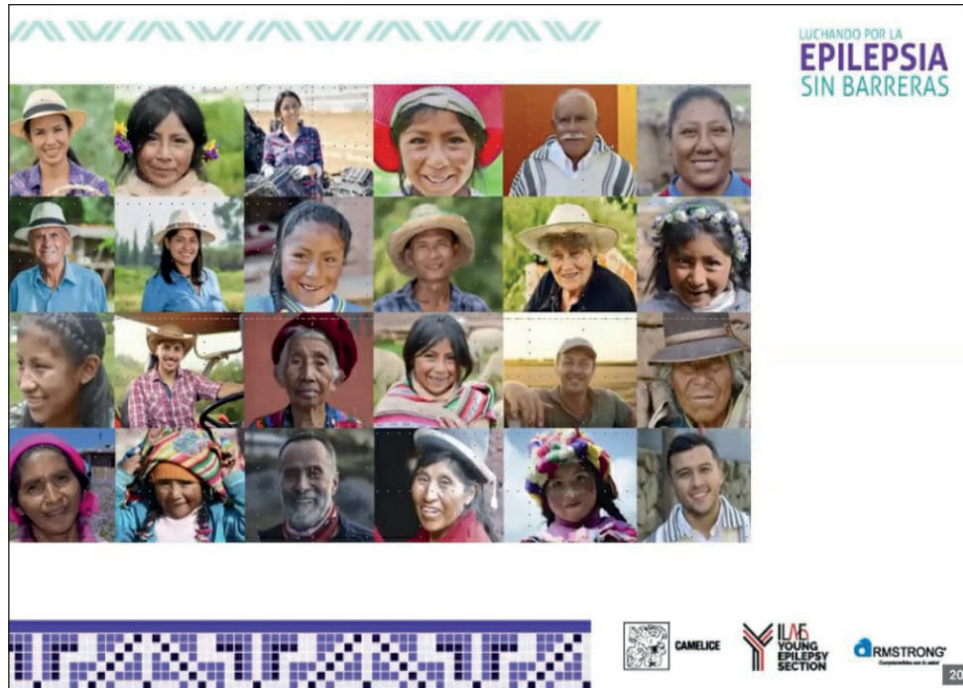
▲ Con el acuerdo, los involucrados pretenden cortar la brecha lingüística de las personas indígenas que tengan epilepsia para lograr una atención oportuna.

Los contenidos fueron creados con ayuda de traductores, para contribuir al conocimiento y desmitifica-