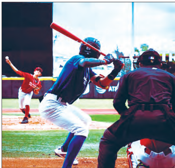
▲ La LPM está en su recta final y los playoffs comienzan el próximo martes 15.