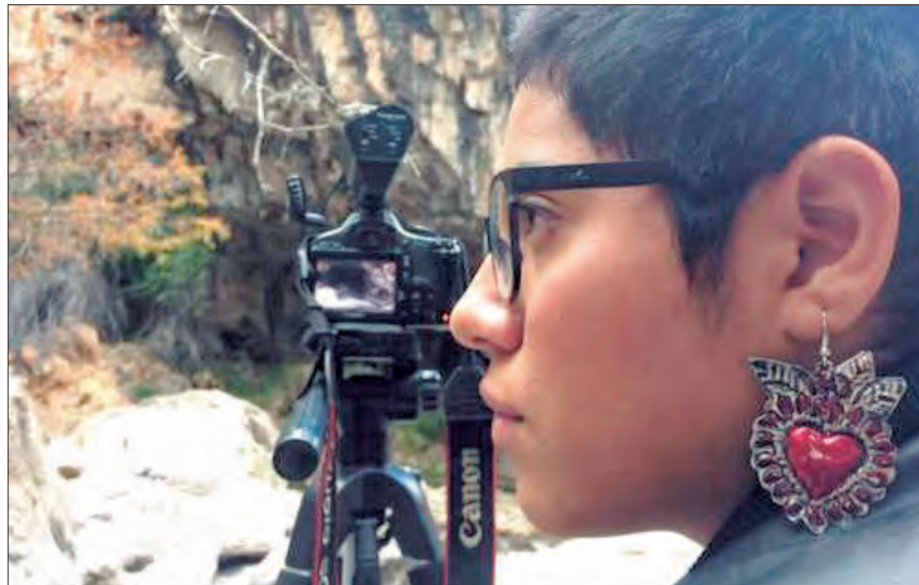
▲ La cinefotógrafa considera que las producciones deben regresar a las raíces, a la naturaleza.

La joven oaxaqueña afirma que contar las historias de los pueblos a través del cine es lo que le ha dado un valor humano a sus filmes, porque es justamente lo que se ha olvi-