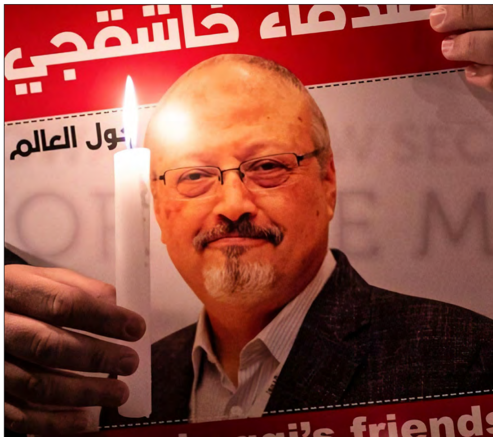
▲ El asesinato del periodista Jamal Khashoggi, en Turquía, provocó protestas internacionales.

Fiscal saudita ha realizado un nuevo acto en esta parodia de justicia, señala Agnès Callamard