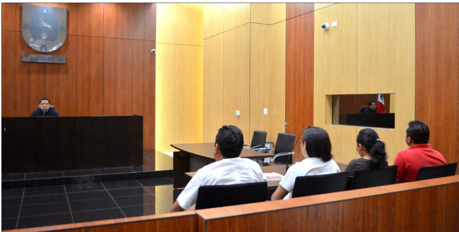
▲ El juez Mugarte tenía apenas 46 años de edad, amén de estar casado con su profesión a la que defendía con coraje, honor y vergüenza.