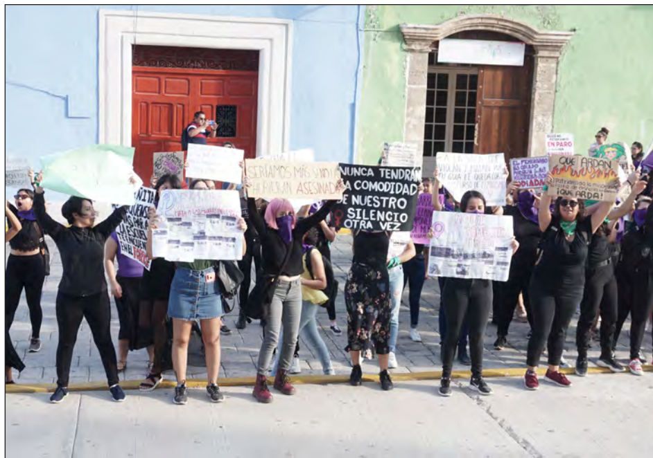
▲ Desde 2015 hay una recomendación de la CNDH para que las fiscalías estatales, transparenten el proceso informativo de los casos de desaparición de mujeres y niñas.

"Hay tres secuencias de edades importantes: de 12 a 15 años, de 16 a 20 y de 21 a 25, siendo las menores de edad las que tienen un mayor índice de desaparición, y aunque no lo queramos ver, hemos estigmatizado como algo normal esa violencia machista, al señalar que escaparon con el novio o que no tarda y regresa, etcétera; desde las primeras horas de sospecha de desaparición