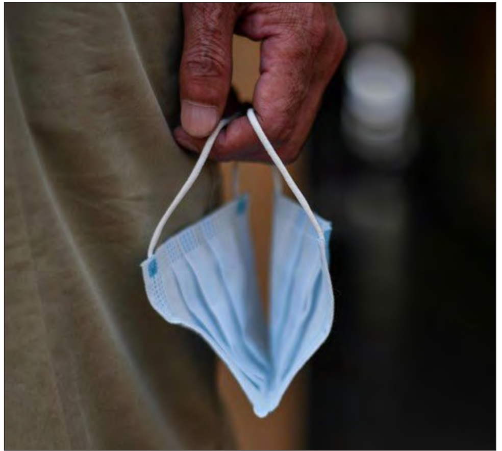
▲ China ha sido acusada por Estados Unidos de reaccionar tarde ante el COVID.

El desarrollo en el país de una o más vacunas contra el COVID-19 permitiría a Pekín contrarrestar esta mala imagen.