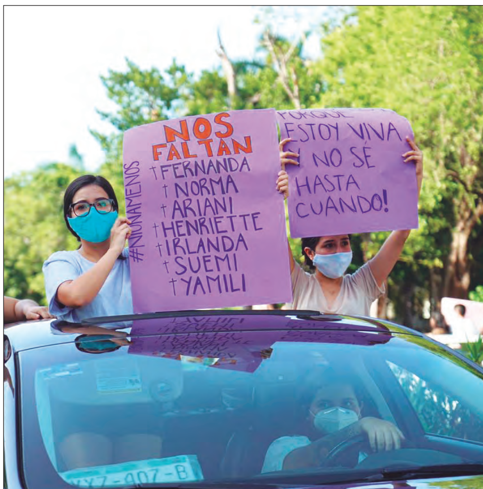
▲ Los asesinatos de Fernanda y Norma han movilizado a los meridianos en marchas para exigir justicia.

Refrendó su compromiso de trabajar “hasta el límite” y con los recursos disponibles para cumplir con estos desafíos.