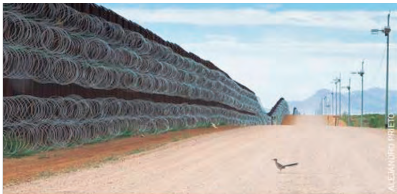
▲ Uno de los temas que aborda la exposición es el del medio ambiente y los desastres naturales, sobre el cual destaca la fotografía del mexicano Alejandro Prieto que muestra a un correccaminos en la frontera con Estados Unidos, imagen que mereció el segundo lugar en la categoría Naturaleza.

Ubicado en avenida Hidalgo 45, Centro Histórico, los horarios del museo son de martes a viernes de 11 a 16 horas y sábado y domingos, de 11 a 17 horas.