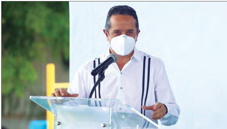
▲ El evento no tendrá invitados ni habrá concentración de personas.