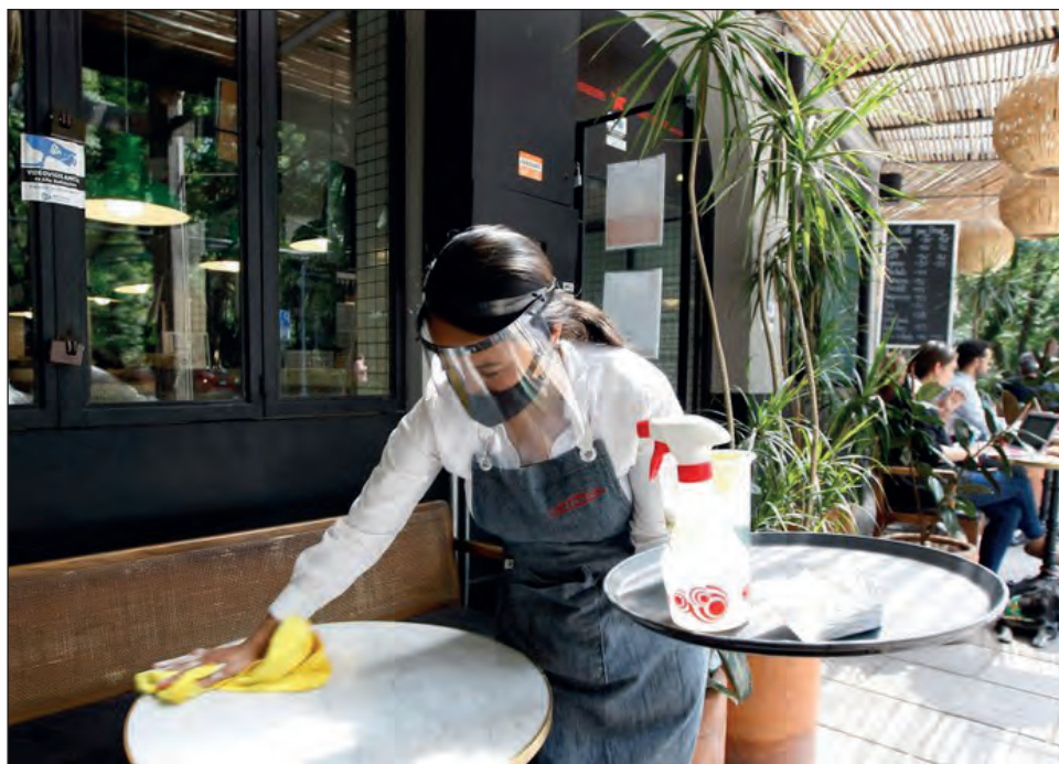
▲ Las mujeres reciben menor remuneración que los hombres, incluso en la misma condición de estudios y ocupación.

Para la sociodémografa, que no se realizaran acciones efectivas para cerrar las brechas de género en cuanto a la participación de las mujeres en el mercado laboral y el trabajo no remunerado