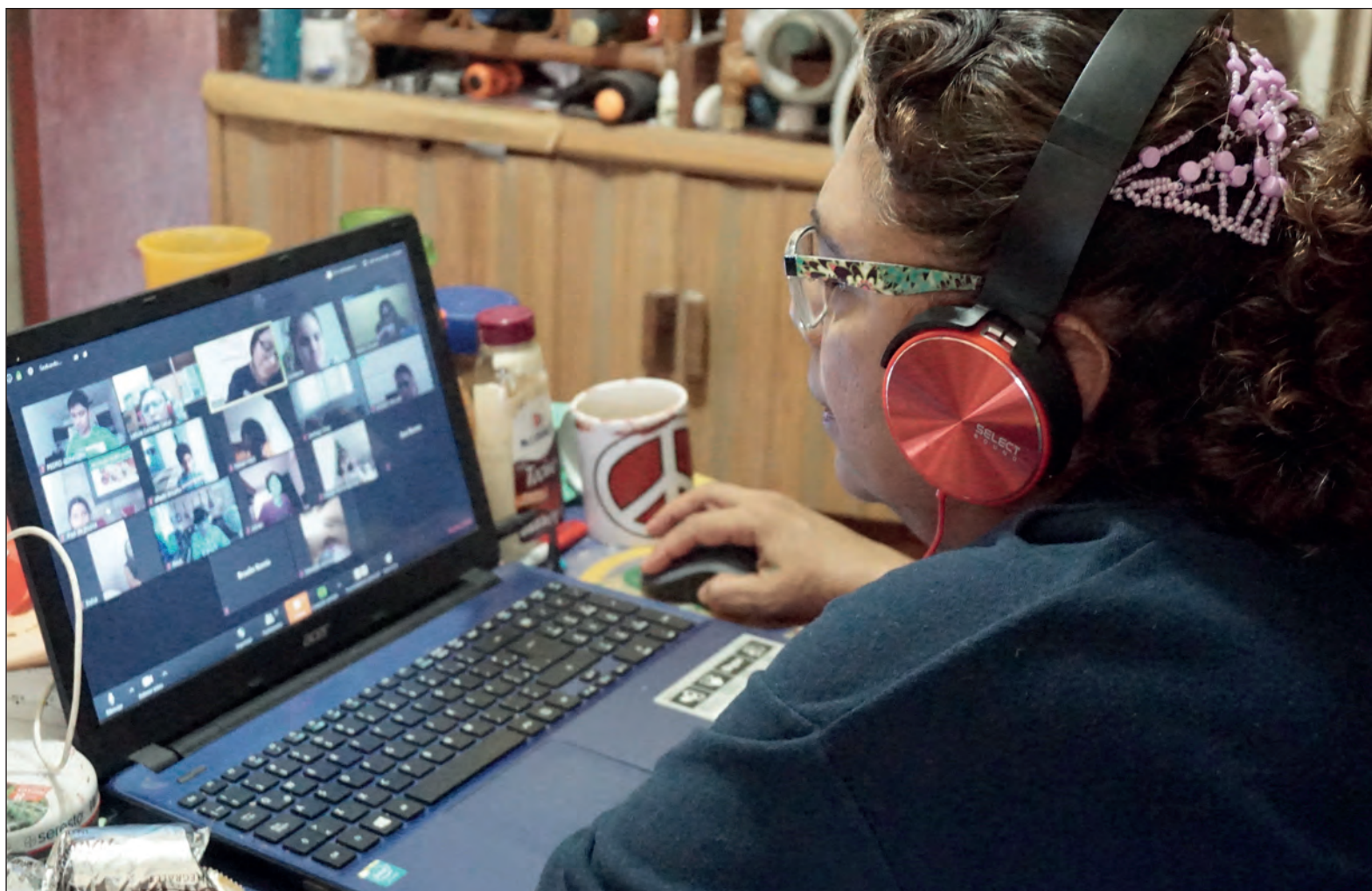
▲ Usar celular o medios sociales como el mecanismo para las clases en línea tiene inconvenientes. ¿No se está violando la ley de protección de datos personales?