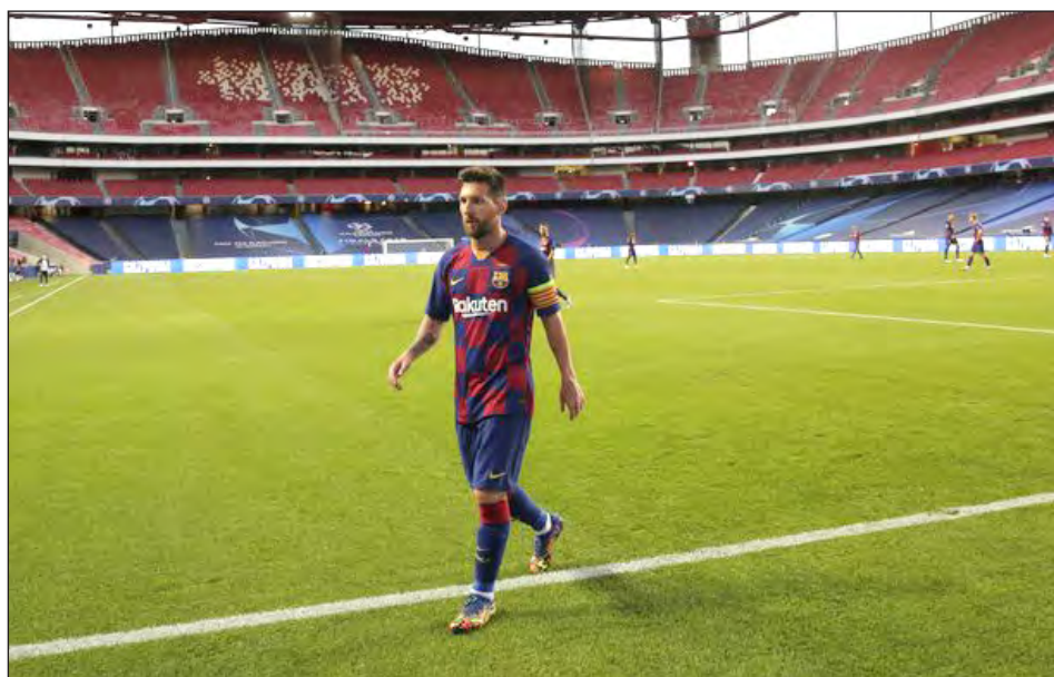
▲ Lionel Messi se desplaza en la cancha durante el partido contra el Bayern Múnich por los cuartos de final de la Liga de Campeones en Lisboa.

ferencia el 25 de agosto y no se apersonó para tomarse las pruebas obligatorias de COVID-19 hace una semana. Tampoco se presentó a la puesta en marcha de los entrenamientos. Fue el primero en llegar a la ciudad deportiva del club ayer.