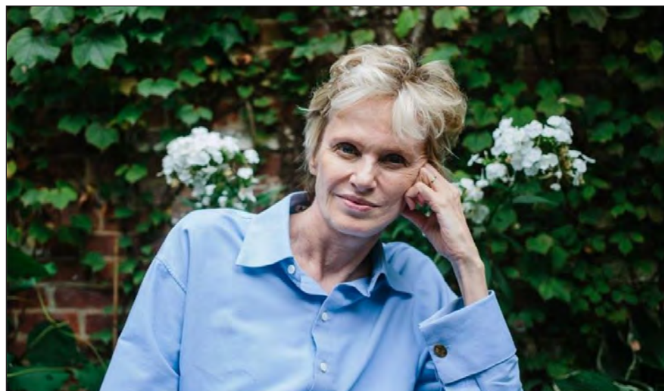
▲ Siri Hustvedt recomendó que entre las autoras que deben de ser leídas por las mujeres del mundo se encuentran la mexicana Elena Poniatowska y la británica Emily Brontë.

Entrevistada por la escritora mexicana Elvira Liceaga, Siri Hustvedt consideró que, en términos de género, es muy laxa la inclusión de las demandas de la comunidad LGBT dentro de las enarboladas por las mujeres y tengo que decir que queda claro que el sistema reproductivo femenino se requiere para la gestación y