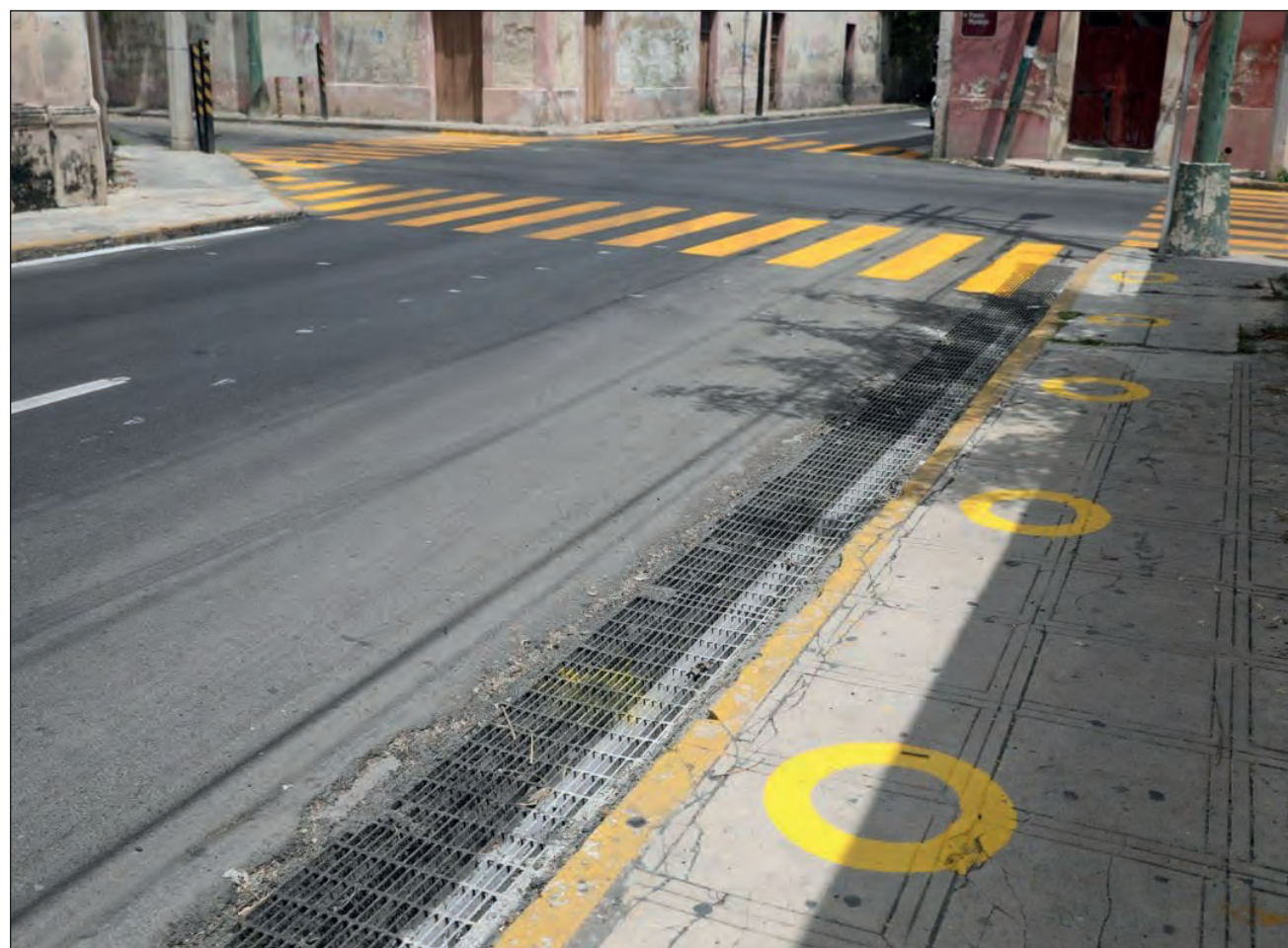
▲ Las acciones del plan de movilidad comprenden la delimitación de los cajones donde se reubicarán las áreas de ascenso y descenso de pasajeros y marcas de distanciamiento sobre las aceras para que los usuarios del transporte público mantengan la sana distancia.

Asimismo, este proyecto contribuirá a la reducción del ruido; así como de la exposición de los peatones, habitantes y residentes a