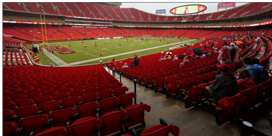
▲ La casa de los campeones Jefes será sede del duelo inaugural de la NFL.

“Vamos a tener que ser flexibles y adaptables”, dijo el doctor Allen Sills, jefe médico de la liga, quien en 2020 será probablemente el ejecutivo más visible de la NFL, por una buena razón. “Pienso que esto es algo que seguiremos rastreando y monitoreando. Si esto nos ha enseñado algo es que hacer proyectos con tres o cuatro semanas de adelanto puede ser algo dañino”. Los equipos entraron a la