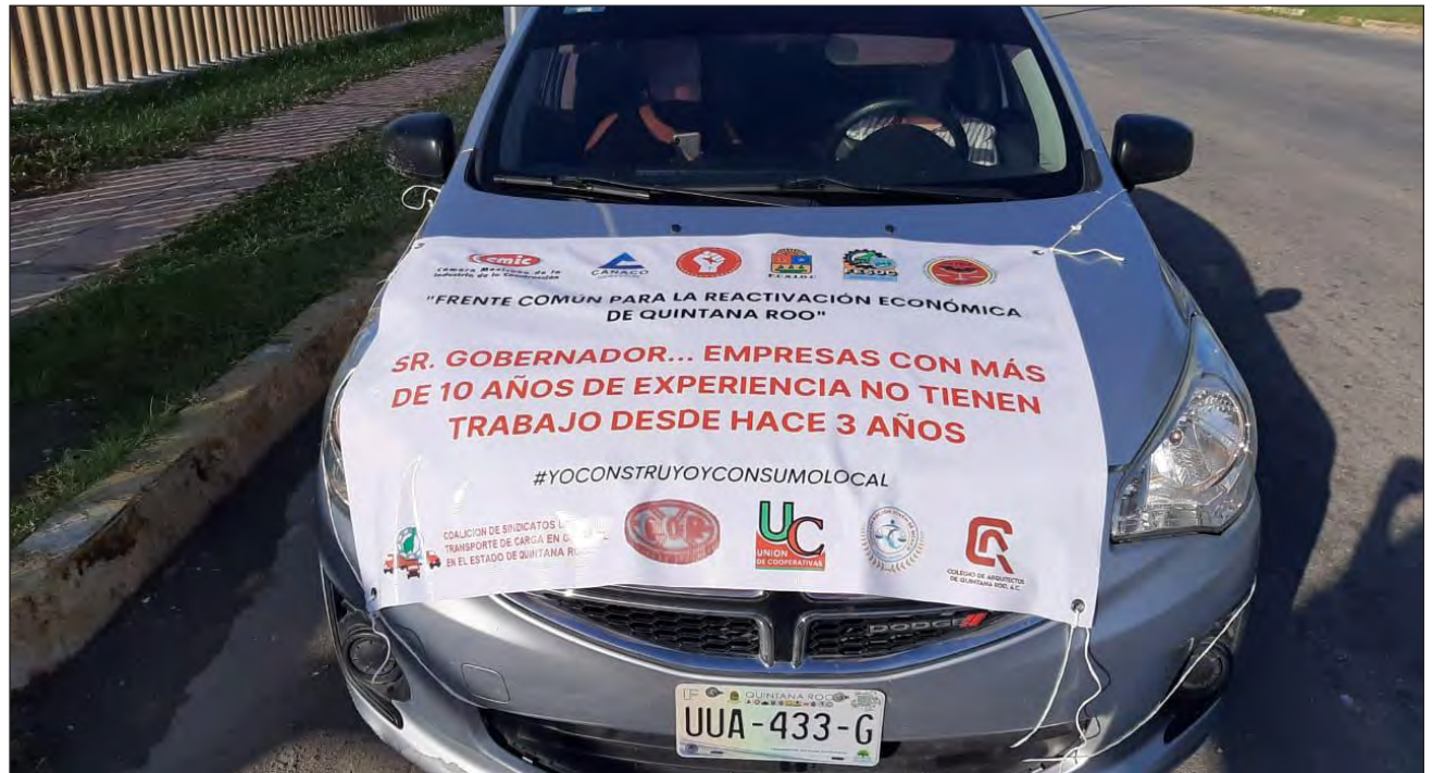
▲ Los inconformes realizaron una marcha pacífica en sus vehículos, y llamaron a las autoridades a contratar empresas locales en obra pública.

Transportados en volquetes, camiones y vehículos particulares partieron