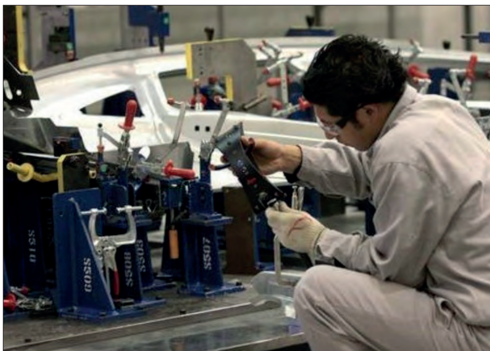
▲ En abril y mayo la manufactura de vehículos y autopartes estuvieron suspendidas a la par del cierre económico en Estados Unidos.