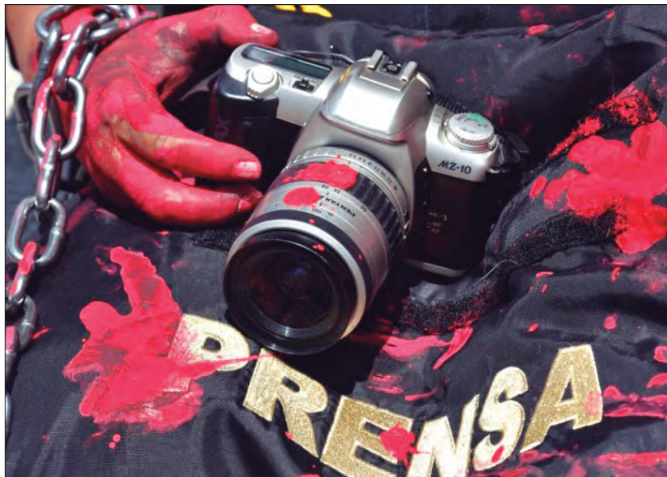
▲ De acuerdo con datos de Artículo 19 , aproximadamente cada 15 horas un comunicador es agredido en México.

estados más peligrosos para la prensa y lo ha sido en distintos niveles, pero desde 2016 hubo un salto de agresiones que se han mantenido”.