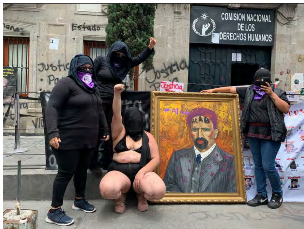
▲ Las áreas tomadas son centros de recepción y atención de quejas abiertos a la ciudadanía.

Provoca extrañeza que se recurra a este tipo de medidas de presión en un contexto de absoluta disposición de las autoridades para atender los reclamos y articular canales de diálogo, apertura que permitiría encauzar las justas demandas por vías institucionales. En cambio, se asiste a la inédita situación de que sean las autoridades quienes buscan el diálogo y los manifestantes quienes rehúsan entablarlo. No queda sino llamar al grupo que ocupa la sede de la CNDH a transitar hacia los espacios de diálogo que se encuentran abiertos, vía idónea para procesar todo conflicto.