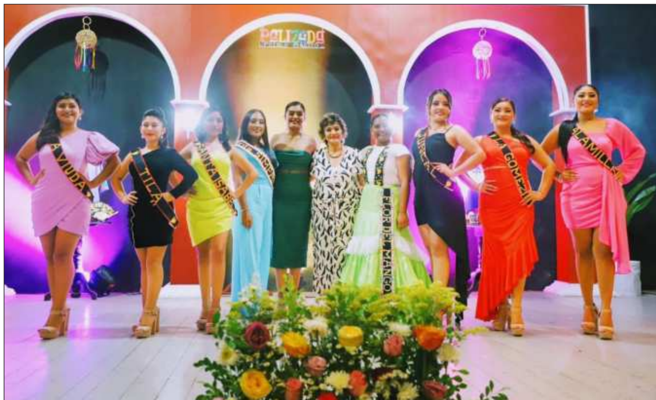
▲ Las jóvenes, una a una, fueron presentándose y realizando la tradicional pasarela, durante la cual saludaron a la concurrencia y recibieron a su vez aplausos, esto como muestra de apoyo por parte de sus seguidores y familiares.