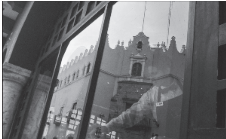
▲ "La UADY podría crear diversas empresas que brinden servicios de salud, asesoría agrícola, servicios de ingeniería".

PARTO DE LA premisa de que, si las universidades desean el apoyo del público, deben ofrecer bienes y servicios tangibles a cambio de este apoyo.