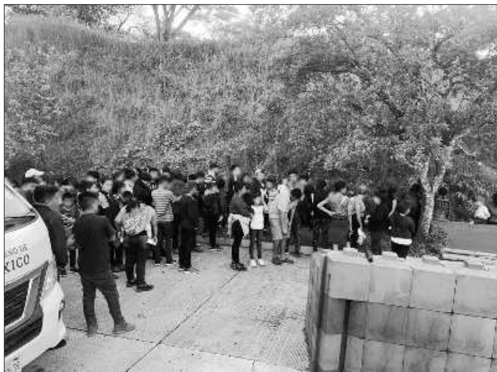
▲ Los pasajeros eran procedentes de Guatemala, El Salvador y Honduras.

El chofer del autobús, que intentó darse a la fuga por una ventana, fue puesto a disposición de las autoridades competentes junto con el vehículo.