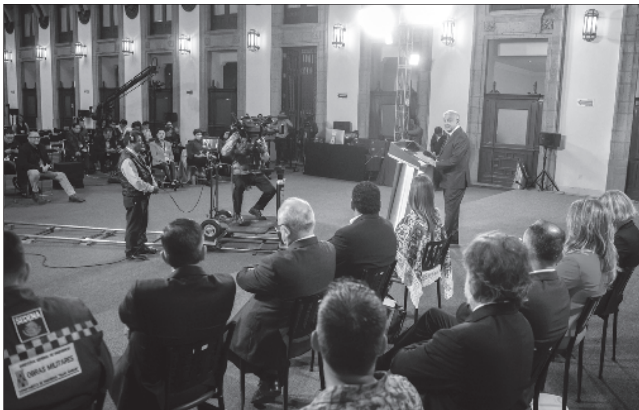
▲ En su conferencia mañanera , el presidente Andrés Manuel López Obrador mostró algunos extractos de la resolución que le atribuyen ciertas frases que descartó haber dicho como “es un pelele, un títere, una empleada de la oligarquía”.

Mostró algunos extractos de la resolución que le atribuyen ciertas frases que el Presidente descartó