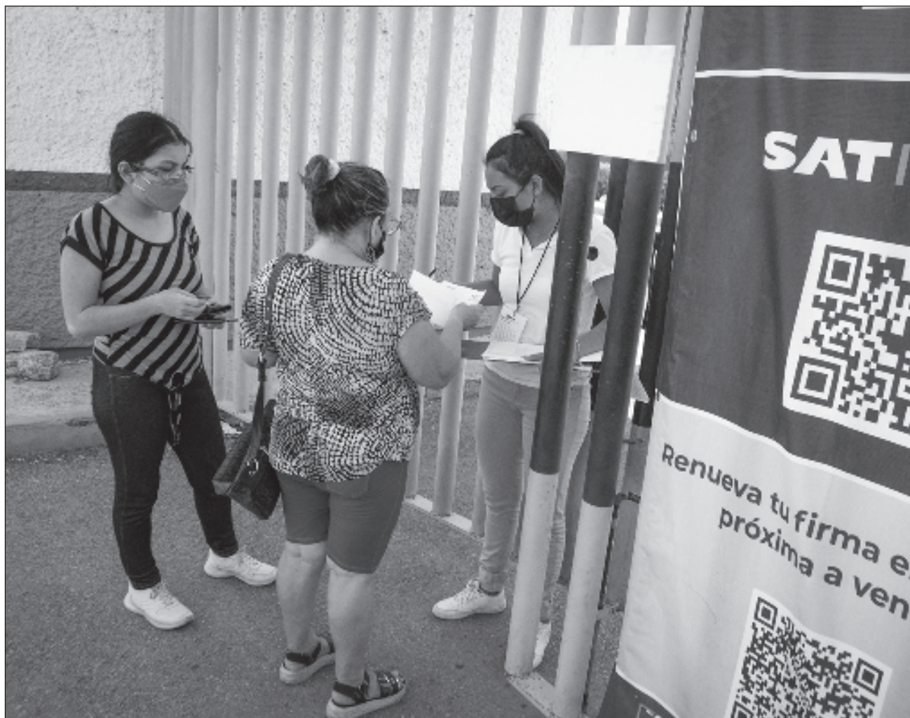
▲ El SAT recuperó parcialmente los datos presentados por el presidente Andrés Manuel López Obrador en su conferencia mañanera del pasado 2 de agosto, donde se exhibió la caída en el impuestos al valor agregado.

La recaudación acumulada de enero a julio de 2023 alcanzó 2 billones 641 mil 428 millones de pesos, monto mayor al billón 833 mil 151 millones de pesos recaudado en el acumulado de enero a julio de 2018, último año de la pasada administración.