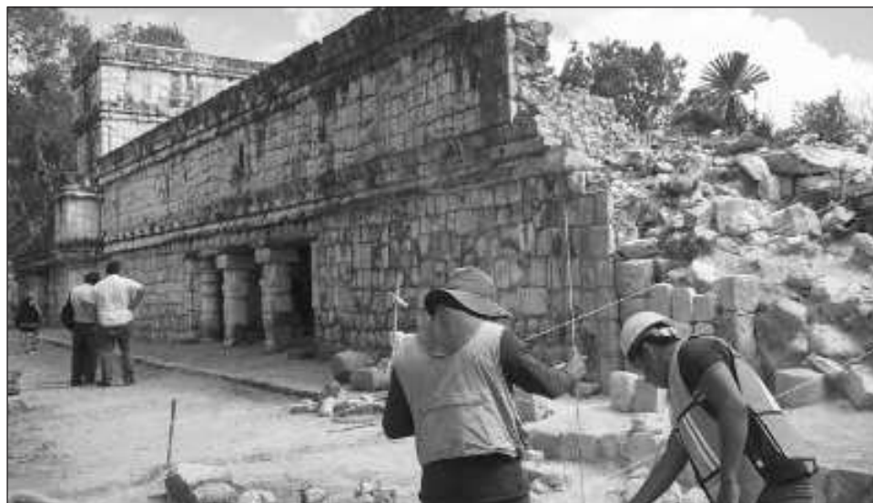
▲ En esta zona también llamada Serie Inicial se encuentran alrededor de 25 estructuras, entre las cuales destacan el Castillo de los Falos y la Casa de los Caracoles.

ser el área habitacional de la élite maya que registró asentamientos humanos desde el 650 de Nuestra