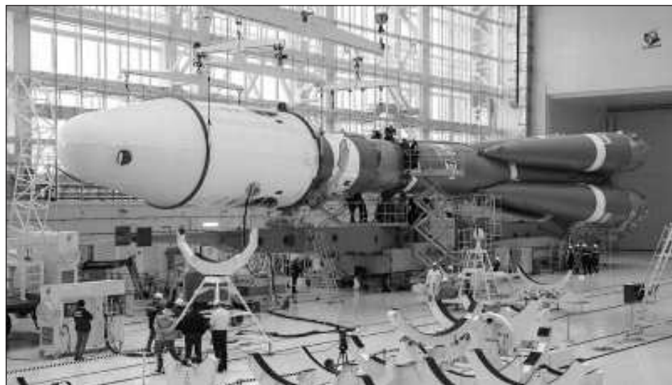
▲ Desde la caída de la URSS, Moscú se enfrenta a una serie de dificultades para innovar en el sector, en el que han surgido nuevas iniciativas privadas, como Space X del multimillonario Elon Musk.

Roscosmos indicó además que un Soyuz -cohetehabía sido "ensamblado" en la base espacial de Vostochni, en el extremo oriente del país, para el despegue de Luna-25 , que deberá descender cerca del polo sur de la Luna, un "terreno difícil".