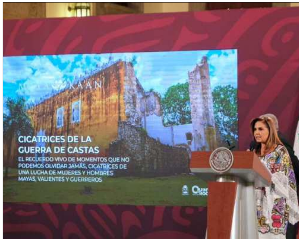
▲ En la conferencia mañanera del presidente López Obrador, la gobernadora Mara Lezama explicó que Maya Ka'an es un destino turístico conformado por los municipios Felipe Carrillo Puerto y José María Morelos, ubicados en el centro del estado.

Maya Ka'an, explicó la gobernadora, es un destino turístico conformado por los municipios Felipe Carrillo Puerto y José María Morelos, ubicados en la zona centro de Quintana Roo y donde habita la mayoría de la población maya del estado. Abarca 76 loca-