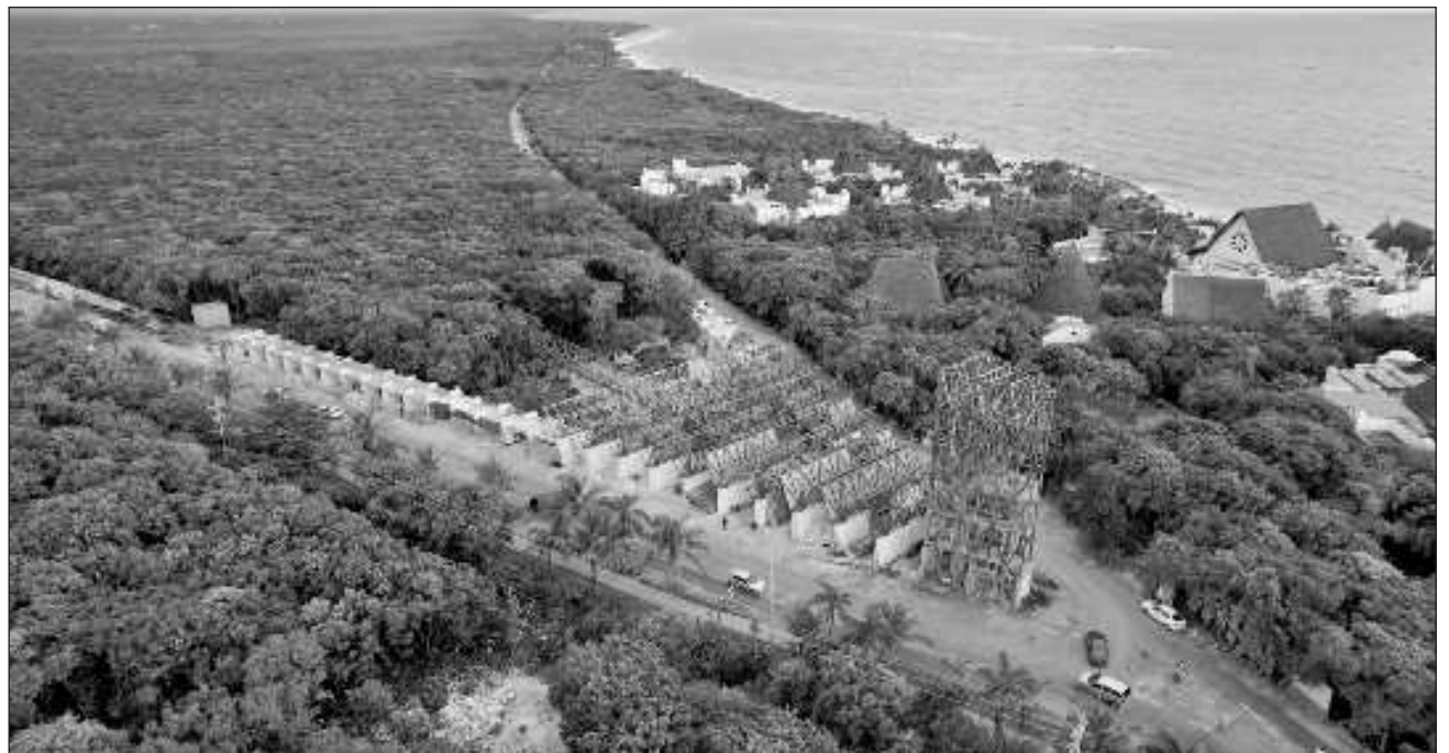
▲ En las zonas arqueológicas que están siendo intervenidas se realizan trabajos de investigación y conservación, señalética e infraestructura. En el tramo 5 se trabaja en El Meco, Tulum, Cobá, Muyil y el Corredor Ecoarqueológico Paamul II.

“Es sin duda alguna en estos tramos donde hemos encontrado la mayor cantidad de vestigios por lo que respecta a bienes inmuebles, albarradas, caminos, plataformas, unidades habitacionales, palacios y otra clase de construcciones que nos permiten asegurar que hubo una inmensa densidad de población en estos territorios y que ahora estamos recuperando materiales que nos habrán de ayudar a dar una visión nueva sobre el devenir de la civilización maya en nuestro territorio”, concluyó Diego Prieto.