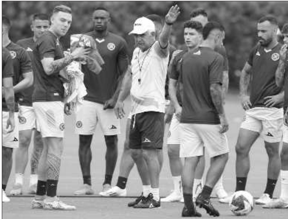
▲ El Cruz Azul comenzó mal en la Liga Mx y fue eliminado rápidamente en la Leagues Cup.

El equipo señaló que, por el momento, Joaquín