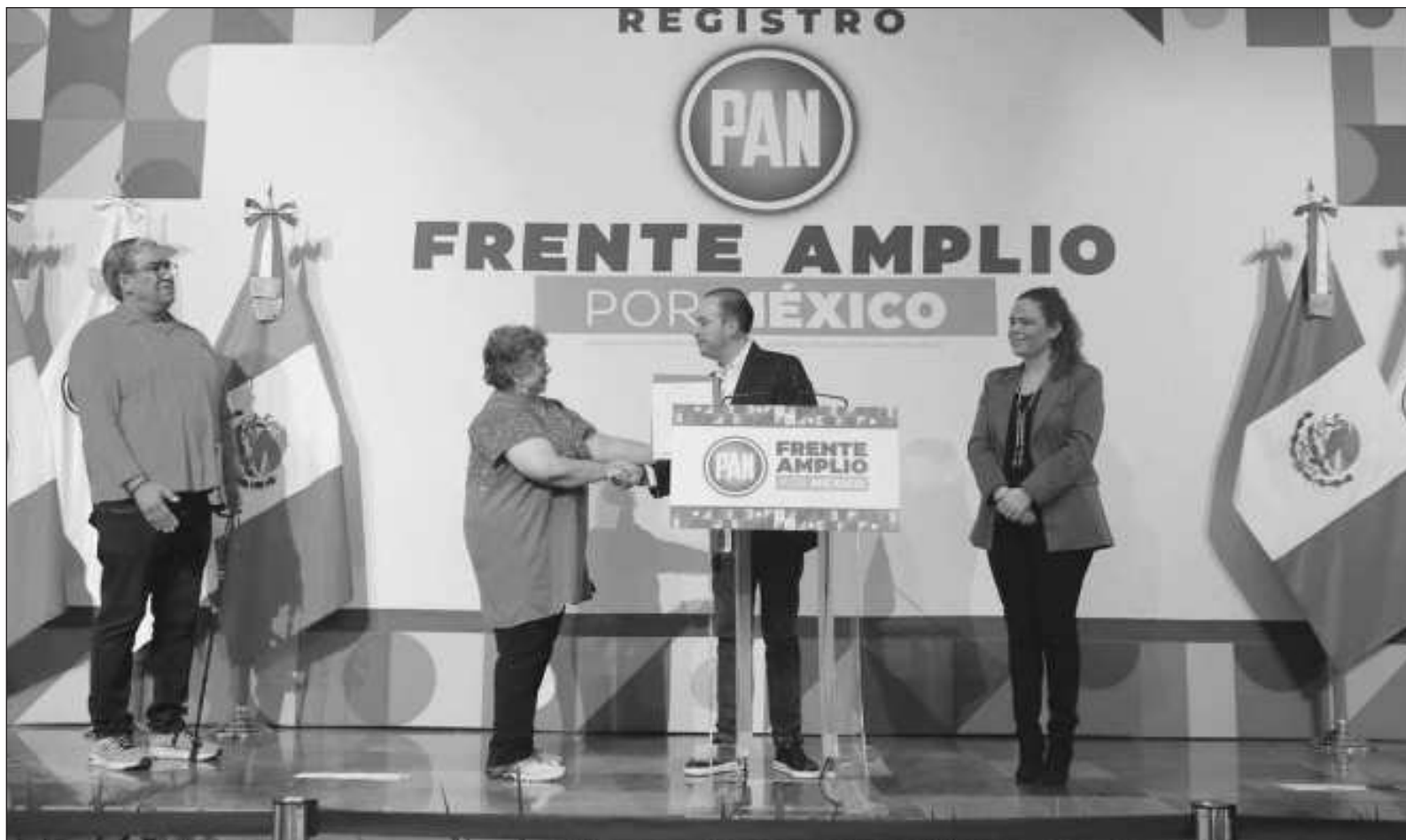
▲ “La Doble X, que es la verdadera apuesta empresarial, mediática y litigiosa contra el obradorismo, ha producido las pioneras muestras de desacuerdos inocultables.”