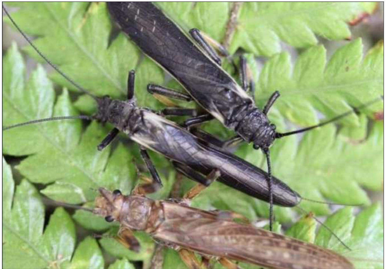
▲ Ajxaak'alo'obe' tu jach xak'alto'ob ba'ax yaan u yil yéetel jenoomikoo ba'al ti'al u na'atiko'ob bix u k'exik u boonilo'ob. .

Ti' jump'éel meyaj jts'a'ab k'ajóoltbil Molecular Ecology, a'alab tumen u ajxaak'alilo'ob u kúuchil Departamento de Zoología, ti' u noj najil xook Universidad de Otago, tu chíikbesajo'obe' yaan juntúul