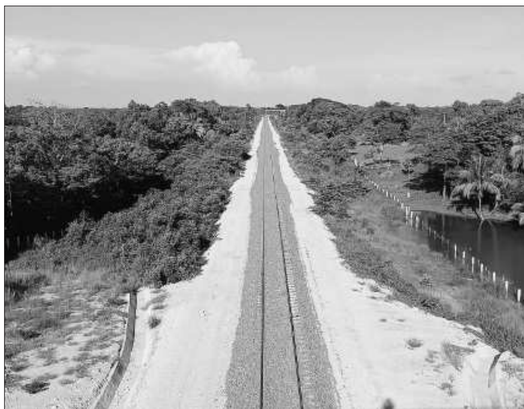
▲ El desarrollo de la obra se ha convertido en una carrera a contrarreloj. Era algo esperado, pues el menor avance se tiene en los tramos 5, 6 y 7, que atraviesan Quintana Roo y el sur de Campeche.

Se completa el círculo: de la obra ferroviaria se llega al impulso a la investigación histórica y arqueológica; de la publicidad de los hallazgos surge la demanda por visitar tanto las antiguas urbes mayas como los museos, y si el impulso es correcto, resultará fortalecido también el turismo comunitario, y entonces el beneficio del tren llegará hasta el presente, después de siglos de olvido y carencia de justicia social.