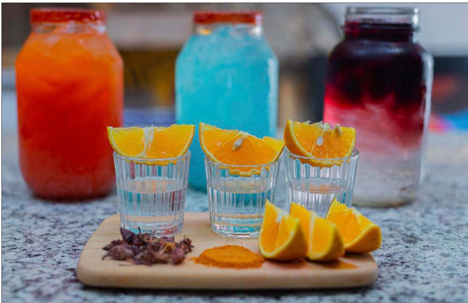
▲ Aparte de su coctelería particular, La Fundación Mezcalería ha adoptado una política de "cero acoso" en el establecimiento.