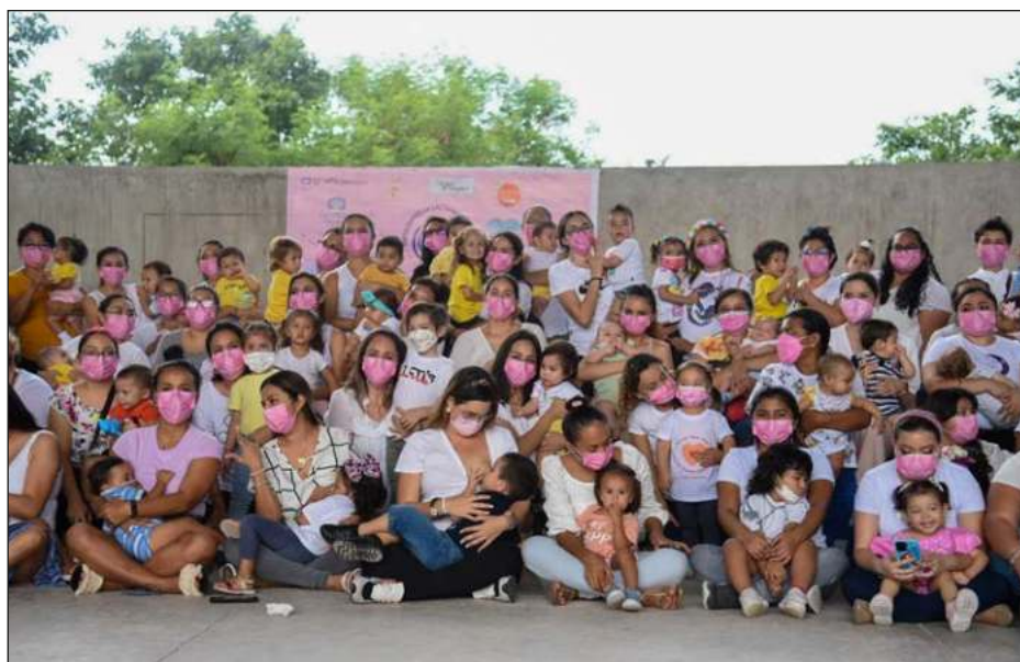
▲ Con motivo a la Semana Mundial de la Lactancia, madres e infantes formaron parte este sábado de la Tetada Masiva en el auditorio de Los Paseos Henequenes, Francisco de Montejo.

Decenas de mujeres lactantes se dieron cita con el objetivo de visibilizar dicha acción y crear conciencia sobre la importancia de la difusión temprana de "dar chuchú".