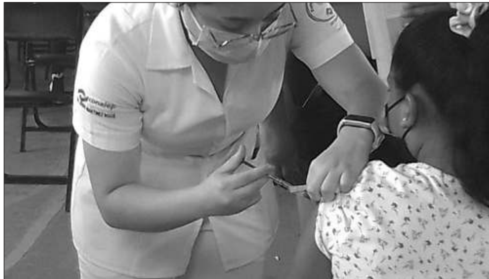
▲ La participación de este sector de la población no ha sido tan elevada como muchos esperaban ya que coincidió con la temporada de vacaciones.

La jornada se reanudará hoy lunes 8 de agosto. Estimó que la participación no ha sido tan elevada como muchos esperaban porque se está en temporada vacacional, por lo que es muy probable que una vez que se tengan las cifras finales decidan organizar una jornada más.