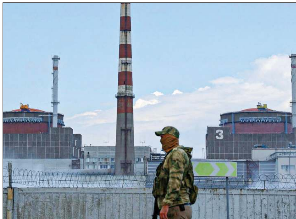
▲ Los cohetes rusos alcanzaron el sitio de la instalación de almacenamiento en seco de la planta, donde se concentraban 174 contenedores con combustible nuclear gastado.

“Tres sensores de monitoreo de radiación alrededor del sitio de la planta de energía nuclear de Zaporíyia resultaron dañados. En consecuencia, la detección y respuesta oportunas en caso de un deterioro en la situación de radiación o