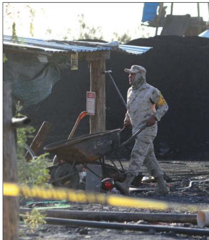
▲ Las empresas mineras pequeñas demuestran que existe muy poca o nula vigilancia sobre el sector y por lo mismo los trabajadores corren grandes riesgos al bajar por cualquier socavón.

De nueva cuenta, la tragedia se instala en la zona carbonífera coahuilense, aunque en una mina de la que aparentemente