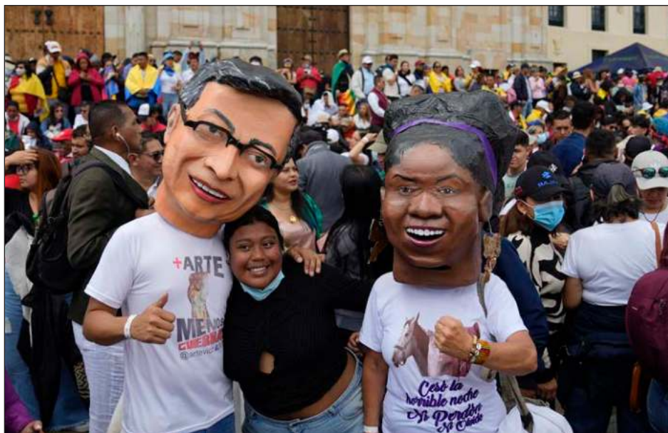
▲ Durante su discurso, al jurar como el primer presidente de izquierda en la historia de Colombia, Gustavo Petro aseguró que es momento de cambiar la política antidrogas.

Petro encarna a una izquierda que ha sido marginada y en ocasiones estigmatizada por el peso de más de cinco décadas de un conflicto armado interno que dejó 50 mil 770 secuestrados, 121 mil