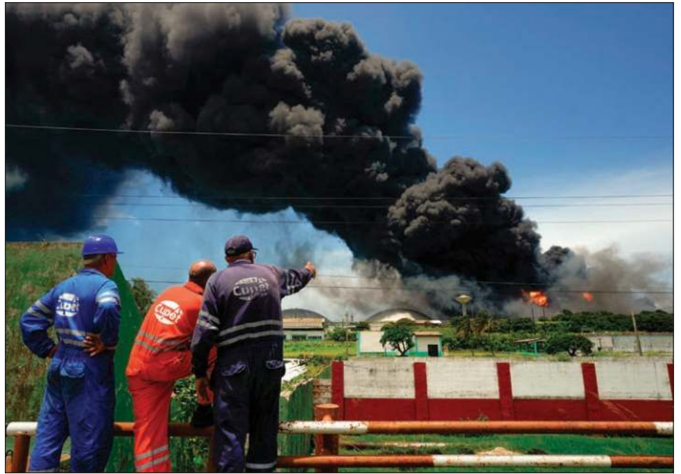
▲ El domingo el gobernador provincial Sabines indicó se habían evacuado 4 mil 946 personas. Fuerzas especializadas contra incendios comenzaron a llegar con sus equipamientos desde México y Venezuela, que enviaron aviones y helicópteros.

La víspera el vicescanciller de Carlos Fernández de Cossío informó que Estados Unidos había ofrecido ayuda