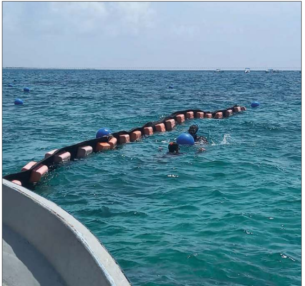
▲ La idea es que una vez colocadas las barreras, una embarcación también entre en operación para ir recogiendo el sargazo que se retenga en el mar.

El funcionario municipal comentó que este proyecto está en proceso de conformarse y cuando se haya concretado lo darán a conocer.