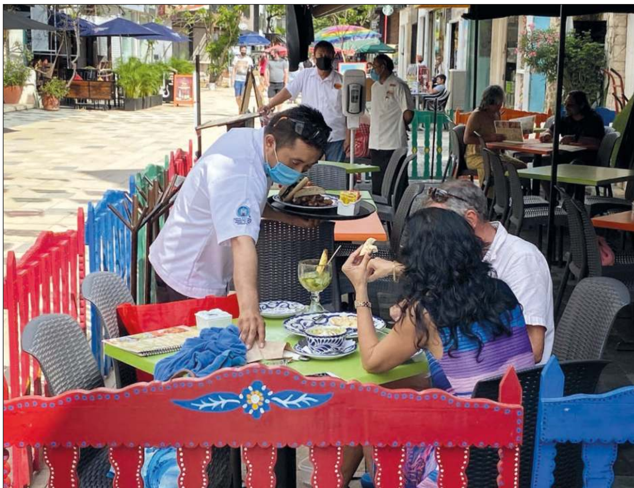
▲ Las actividades terciarias incluyen los sectores dedicados a la distribución de bienes.

La empresa tiene pendiente un juicio más, con expediente 676/2022, donde acusa a la Secretaría de la Defensa Nacional (Sedena) de realizar sobrevuelos, despegues y aterrizajes constantes en sus terrenos.