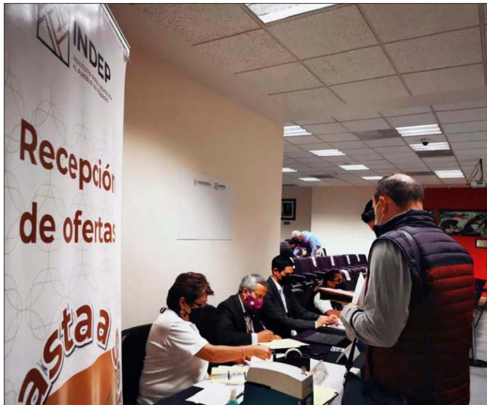
▲ La subasta tendrá lugar este 11 y 12 de agosto y los participantes deberán presentar su oferta en un sobre sellado por el inmueble de su interés.

El Instituto para Devolver al Pueblo lo Robado es un organismo descentralizado de la administración pública federal con personalidad jurídica y patrimonio propios.