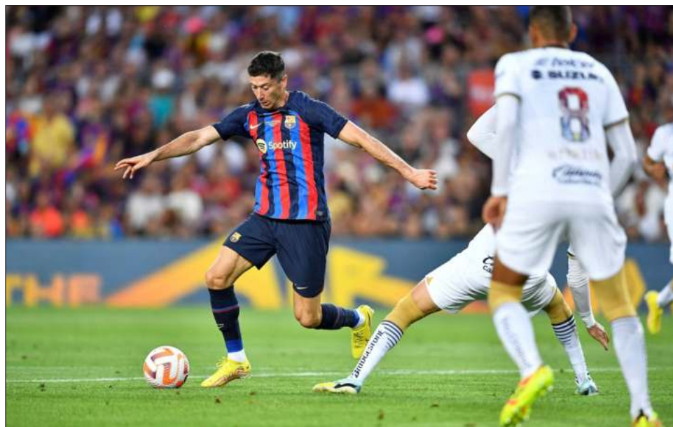
▲ Robert Lewandowski marcó el primer gol ante los Pumas, en duelo por el Trofeo Joan Gamper.

Horas antes, Alves había publicado en redes sociales un mensaje para la afición del Barcelona. "Una primera vez me fui, intenté volver, lo conseguí y otra vez me fui. Pero el destino me trajo de vuelta una vez más. Pero no quiero despedirme de ustedes. Quiero verles otra vez, quiero