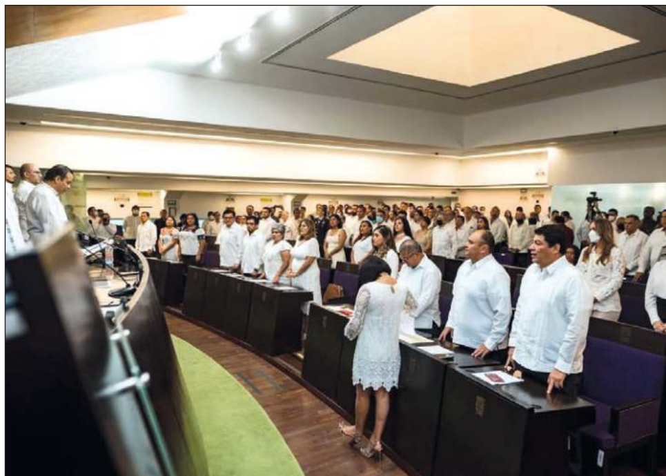
▲ Ante la ausencia de Layda Sansores San Román debido a un viaje, el secretario de Gobierno hizo la entrega del informe escrito ante en Congreso.

Así, en cumplimiento a lo que dispone la Constitución Política del Estado de Campeche, el secretario de Gobierno,