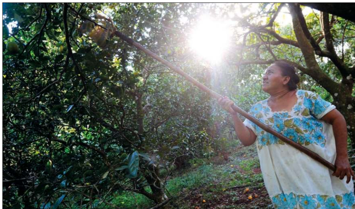
▲ "En América Latina las mujeres están en primera línea por la defensa del territorio y de sus formas de vida, esto se ve reflejado en movilizaciones y luchas contra actividades como la minería, la deforestación, la agroindustria, entre otros que afectan su región; el debate es amplio".

EN ESTE CONTEXTO , es importante considerar la transformación de la agricultura industrial a una agricultura alternativa o tradicional. Esto implicaría otorgar reconocimiento al papel histórico de las