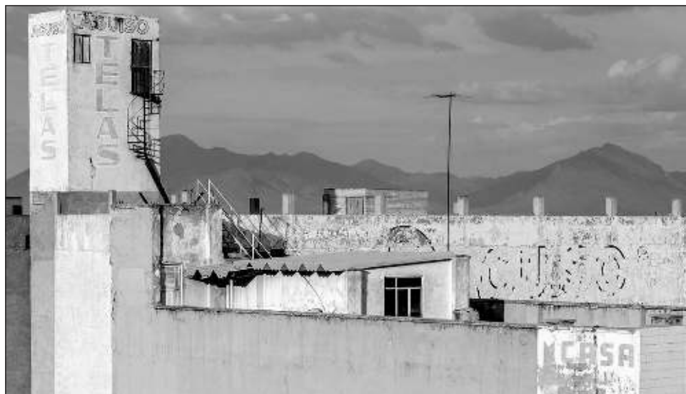
▲ A la programación de Fotoseptiembre 2022 se suma el Festival Internacional de Fotografía de México, que organizan el Centro y la Red de la Imagen.

Con el tema Territorio , en marzo pasado se abrió una