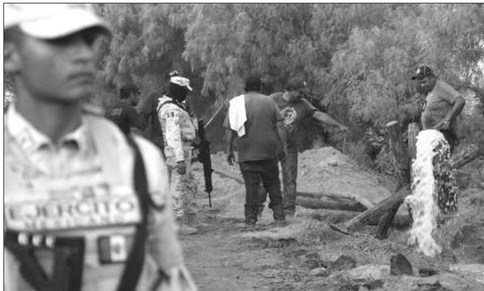
▲ El sábado se incrementó la capacidad de bombeo y ante los 350 litros por segundo que se extraen, entre la noche del sábado y la mañana del domingo fue notoria la disminución de los niveles del líquido.

También requirió a distintas dependencias federales y estatales información sobre los diversos expedientes relacionados con la empresa que explota la mina,