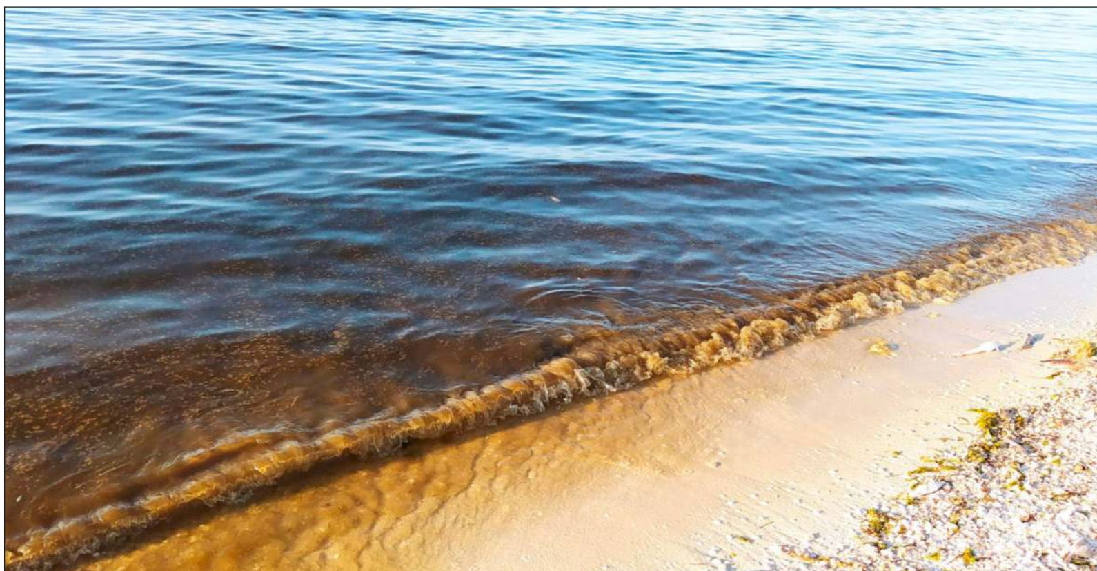
▲ "Todos saben que la marea roja es un alga o microalga, pero nadie lo asoció a la eutroficación y al calentamiento de las aguas marinas".