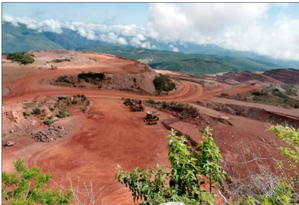
▲ Los mineros detallaron que, de manera ilegal, la empresa Grupo México mantiene cerrada las fuentes de trabajo de los obreros de Taxco, Sombrerete y Cananea.

Mencionaron que el pasado 30 de Julio cumplieron ya 15 años de haber estallado su huelga “la historia se encarga de juzgar a los gobiernos ilegítimos, neoliberales, conservadores, rastroeros (Fox, Calderón, Peña), que le fallaron a México; les fallaron a los trabajadores y con argucias, artimañas y conciencias compradas, fueron cómplices del Grupo México, y de German La-