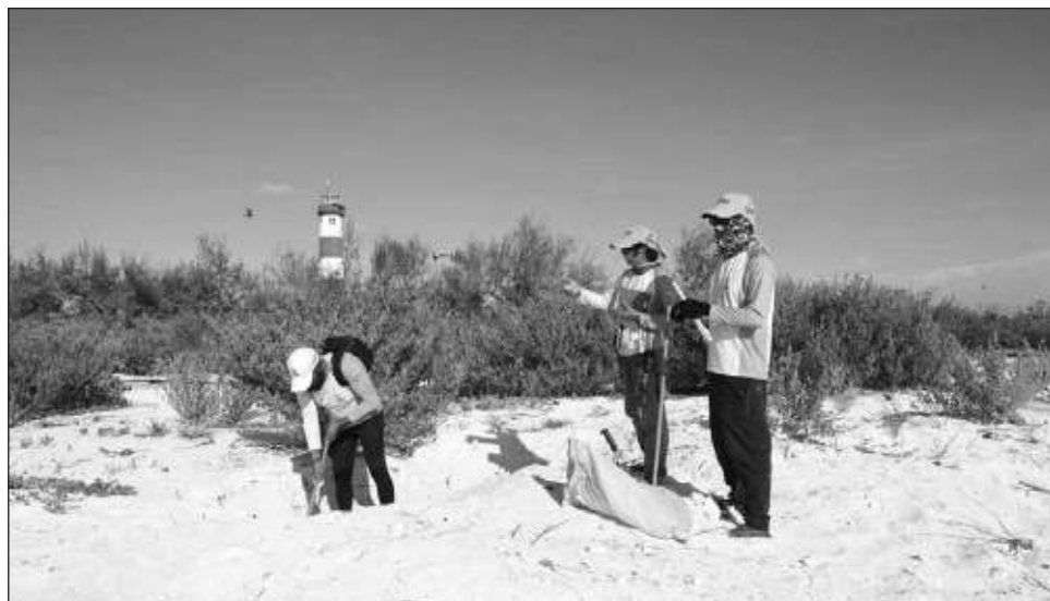
▲ Los guardaparques del gobierno de Yucatán realizan labores de vigilancia en coordinación con la Secretaría de Marina y la Comisión Nacional de Áreas Naturales Protegidas.

Los guardaparques del gobierno realizan labores de vigilancia en coordinación con Semar y Conanp; revisión de llegadas de embarcaciones desde el faro; recorridos terrestres en Isla Pérez y de supervisión en las cinco islas que conforman el sitio; registro de barcos sin permiso de pesca comercial, y retiro de boyas que indican presencia de caracol blanco.