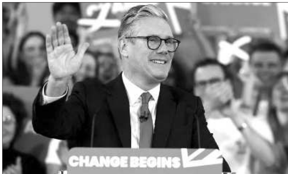
▲ La gira para mejorar las relaciones en todo el Reino Unido forma parte de la misión de Starmer de trabajar para servir a las personas mientras aborda una montaña de problemas.

El primer ministro se propuso visitar a los mandatarios de los gobiernos regionales en el Reino Unido luego de la