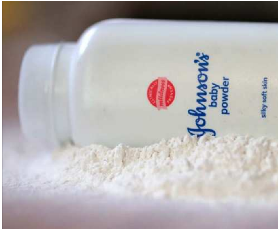
▲ El talco, un mineral natural, se extrae en muchas regiones del mundo. La exposición a éste se produce en entornos ocupacionales durante la extracción y molienda o procesamiento del talco, o durante la producción de productos que contienen talco.

En animales de experimentación, el tratamiento con talco provocó un aumento de la incidencia de