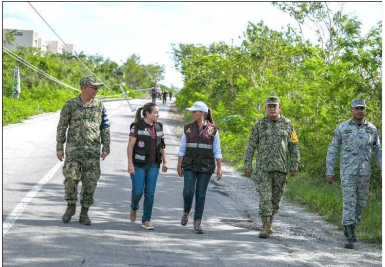
▲ La gobernadora Mara Lezama sigue atendiendo los reportes de daños en todos los municipios de Q. Roo.

Como se recordará, el pasado jueves 4 y viernes 5 de julio se suspendieron las clases en todo el estado como medida preventiva para asegurar la protección y el bienestar de estudiantes, docentes y personal administrativo, debido a la llegada del fenómeno hidrometeorológico.