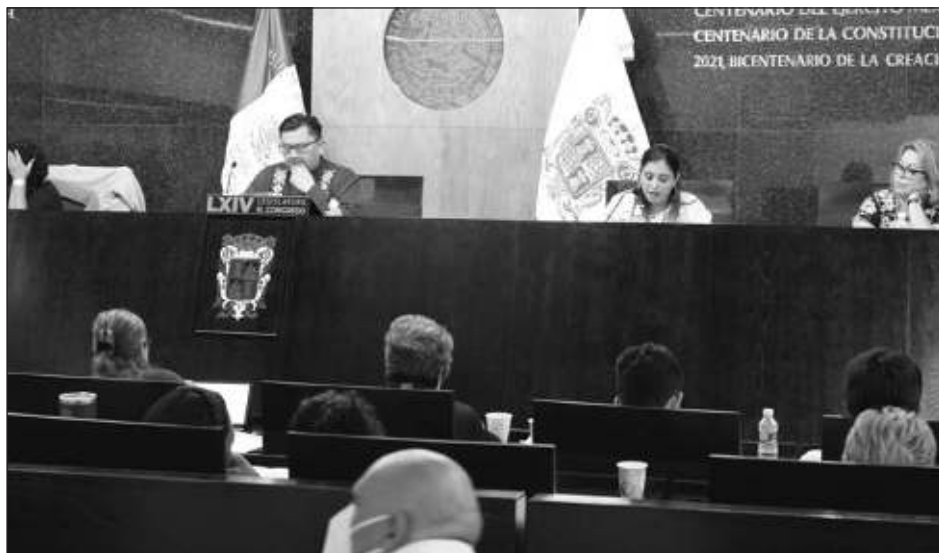
▲ Los diputados de Morena indicaron que contra la decisión de renuncia por parte de la exfiscal Anticorrupción no es posible hacer algo y no había razón para llamarla.

Este martes a la medianoche se hizo efectiva la renuncia que Moguel Ortiz ingresó a la LXIV Legislatura bajo el argumento de "cuestiones personales", luego de declarar públicamente que el ex alcalde de Campeche, Eliseo "N", no tenía alguna orden de aprehensión u observación por 50 millones de pesos como había mencionado la gobernadora, Layda Elena Sansores San Román, así