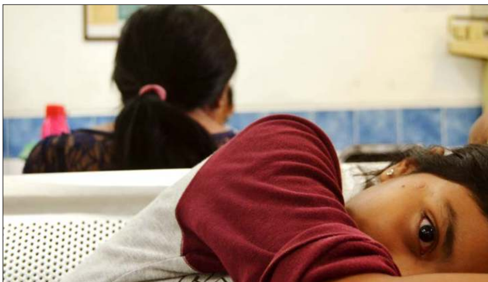
▲ El reporte La infancia cuenta en Yucatán indica que la violencia, abusos sexuales y feminicidios ocurren en un contexto de aparente paz social que normaliza la situación.

Entre 2019 y 2020 la cantidad de niñas y niños, entre uno y 17 años, que fueron atendidos en hospitales por