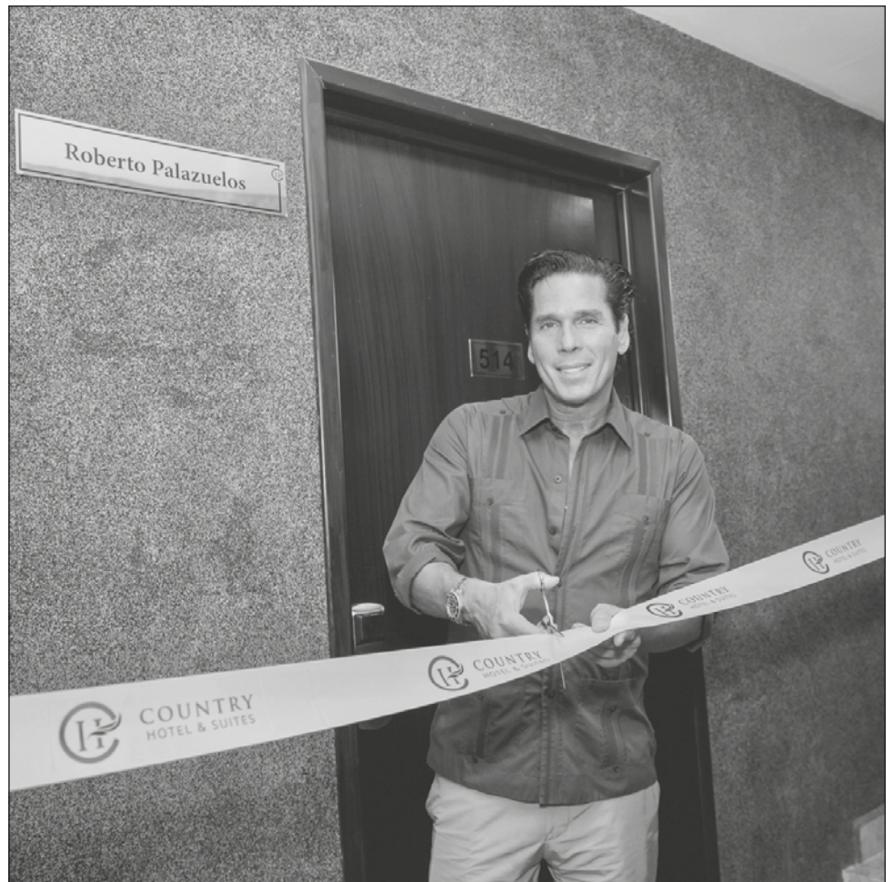
▲ El empresario motivó a los jóvenes universitarios a tomar riesgos para emprender.

A los empresarios del ramo turístico de la ciudad los invitó a hacer equipo para consolidar alianzas que permitan tomar decisiones en conjunto.