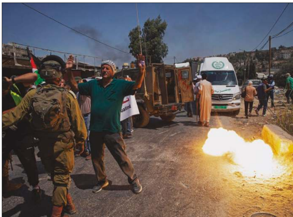
▲ Para denunciar la publicación, una veintena de estudiantes y reservistas del ejército israelí se manifestaron el martes delante de la sede de las Naciones Unidas.

"Aunque no encuentre al amor de mi vida vivo, tienen que ser hallados", imploró.