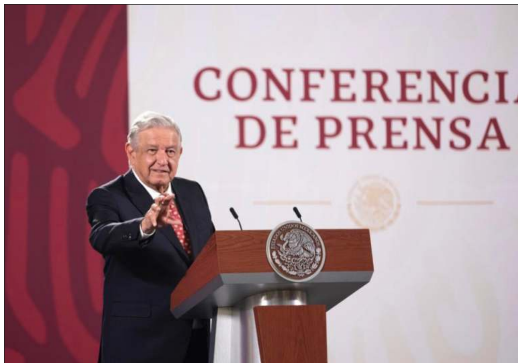
▲ La postura del mandatario mexicano, secundada por sus pares Luis Arce de Bolivia, y Xiomara Castro de Honduras, representa un auténtico parteaiguas en las relaciones hemisféricas.

En este contexto, la decisión de no asistir personalmente al encuentro continental representa la inauguración de una nueva era en las relaciones entre América Latina y Washington, una en la que no se olvida la importancia de la colaboración y el entendimiento para abordar los problemas comunes, pero se marca sin ambages un alto a las imposiciones indebidas y a la idea de la superpotencia como un "hermano mayor" con la facultad de tutelar a sus vecinos.