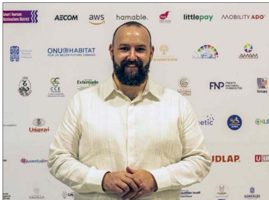
▲ El objetivo es aproximarse al turismo sustentable, señaló la canciller Victoria Alzina, quien pretende hermanar a estas dos regiones a través de convenios.

En su caso, ya han implementado el desarrollo urbano sustentable y espacios seguros para transeúntes, dijo, y por eso, quieren saber qué busca Yucatán y hacia dónde va para que, a partir de ahí, cuenten cómo lo han logrado.