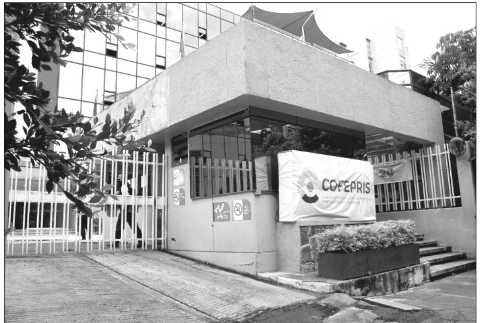
▲ La relevancia de esta agencia mexicana es de tal magnitud, que de cada diez pesos que se gastan en el país, 4.5 de ellos son en productos regulados por ella misma.

"El que pagaba más podía asegurar ganancias millonarias o multimillonarias debido a la falta de competencia en el mercado. El mal manejo administrativo, caracterizado por la discrecionalidad y la falta de claridad en los procedimientos, abrió