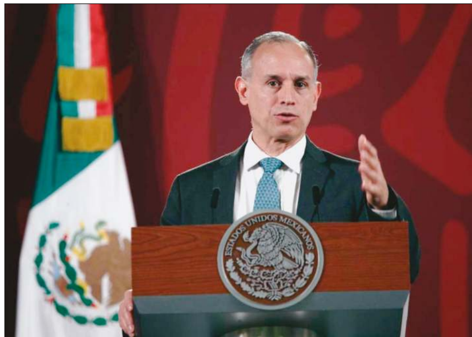
▲ El subsecretario de Prevención y Promoción de la Salud señaló que gracias a la vacunación, la gravedad de la enfermedad no es alta y menos aún la hospitalización.

Lo anterior lo aclaró López-Gatell tras una pregunta ante la preocupación que se