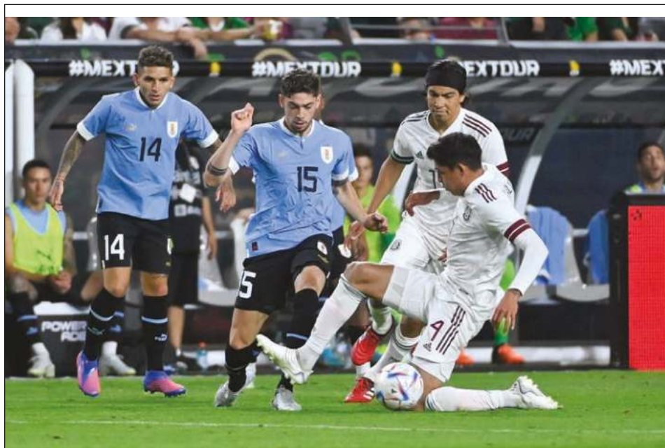
▲ La selección nacional fue de más a menos bajo el mando de Gerardo Martino.

El ex mediocampista campeón del mundo habla del “Tata” con respeto porque lo considera un gran entrenador, “un hombre al que le gusta jugar bien al fútbol y que es respetado por todos los argentinos”.