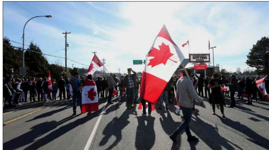
▲ "I would like to believe that Canada will create a broad-enough political space in which all can fit".

ENGLISH CANADIANS BASE their concept of human rights on the rights