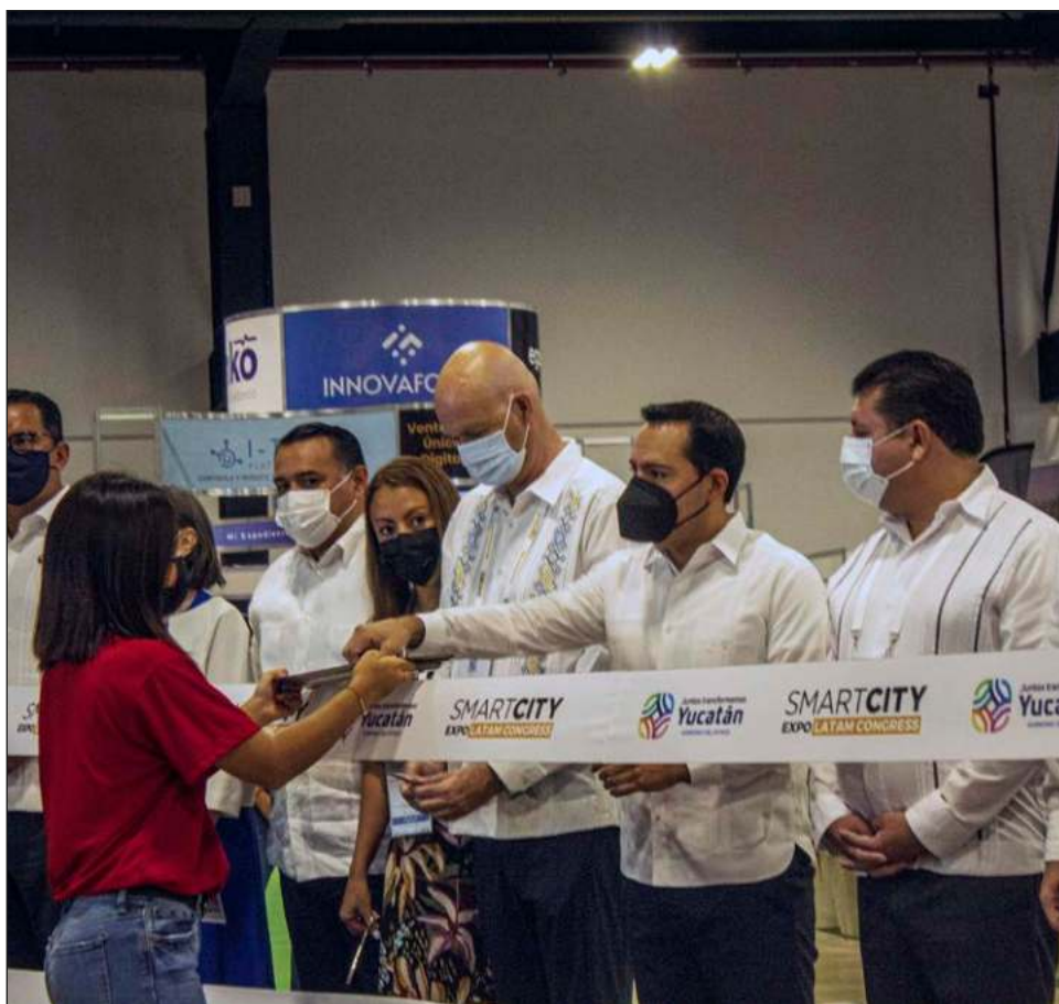
▲ En la inauguración de la Expo LATAM 2022, el gobernador Mauricio Vila adelantó que este jueves dará un anuncio sobre el sistema de transporte Va y Ven.

Volver a la presencialidad en este evento, tiene un objetivo “acelerar la transformación de las ciudades de América Latina”, dijo Pilar Conesa Santamaría, curadora de Smart City Expo World Congress y Smart City Expo Latam Congress.