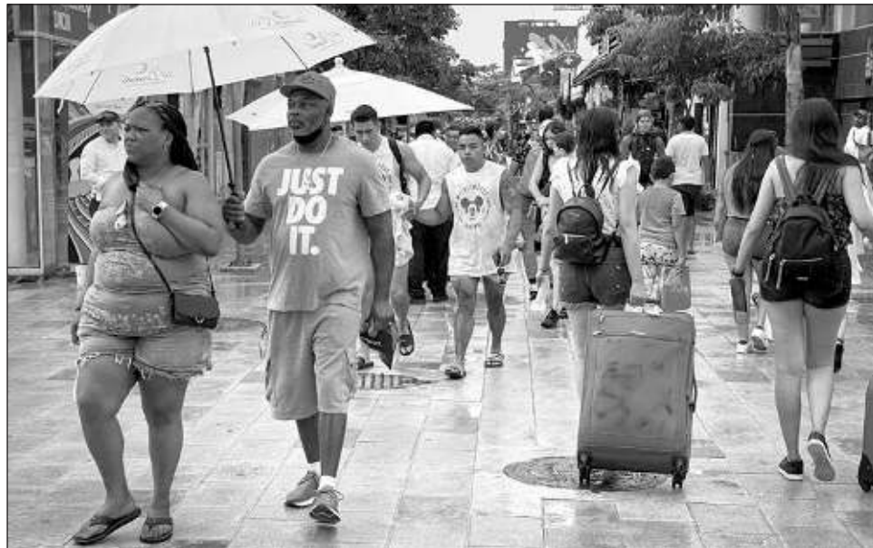
▲ De acuerdo a las previsiones del WTTC, México será el país con uno de los mejores escenarios en indicadores de recuperación y trabajo.

De acuerdo a las previsiones, México será el país con uno de los mejores escenarios en indicadores de recuperación y trabajo, generándose 2.7 millones de nuevos empleos, además de un crecimiento anual de 3.2%, superior al que reporta la economía tras la pandemia, de 2%. El turismo representará 14.7% del total de la economía nacional.