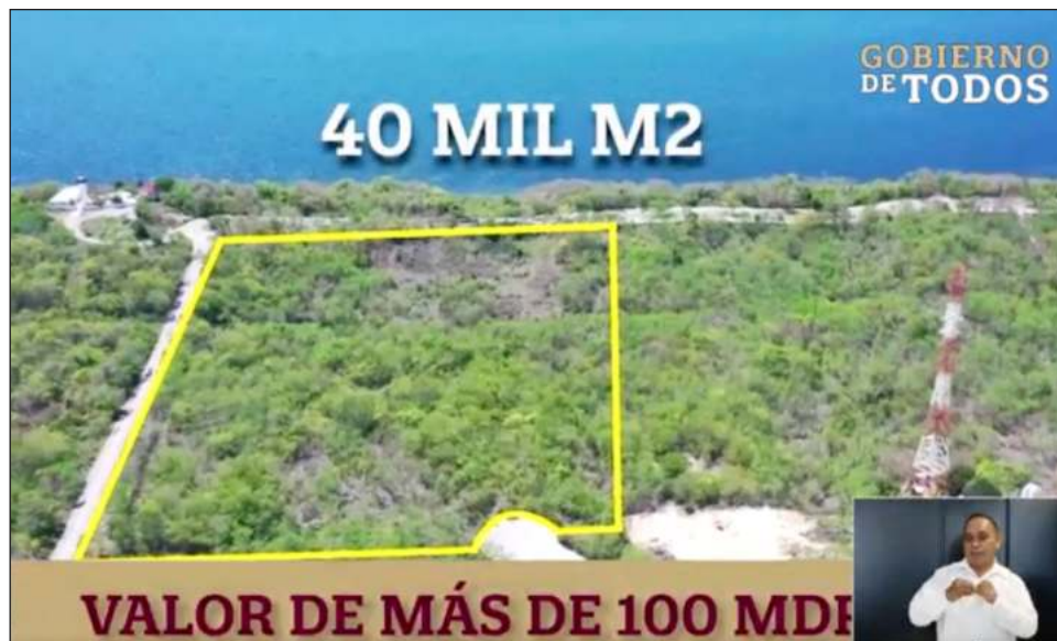
▲ La gobernadora reveló que también fue ubicado un terreno de 40 mil metros cuadrados, adquirido en 3.5 pesos por hectárea, y se localiza en el complejo Campeche Hills.