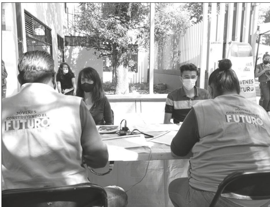
▲ Este viernes, en California, Marcelo Ebrard dará el banderazo de salida al programa Jóvenes Construyendo el Futuro .

Marcelo Ebrard lleva tareas específicas a la reunión de Los Ángeles y sobre ellas argumenta: "Hay una nueva realidad geopolítica, quieras o no, y no se trata de un tema que México vaya a imponer ahí. No se puede negar. Es como sostener que el cambio climático no existe. La nueva realidad geopolítica lo que busca son acuerdos, hallar un sistema diferente al anterior, y lo que lo impide ahora, es el bloqueo a Cuba".