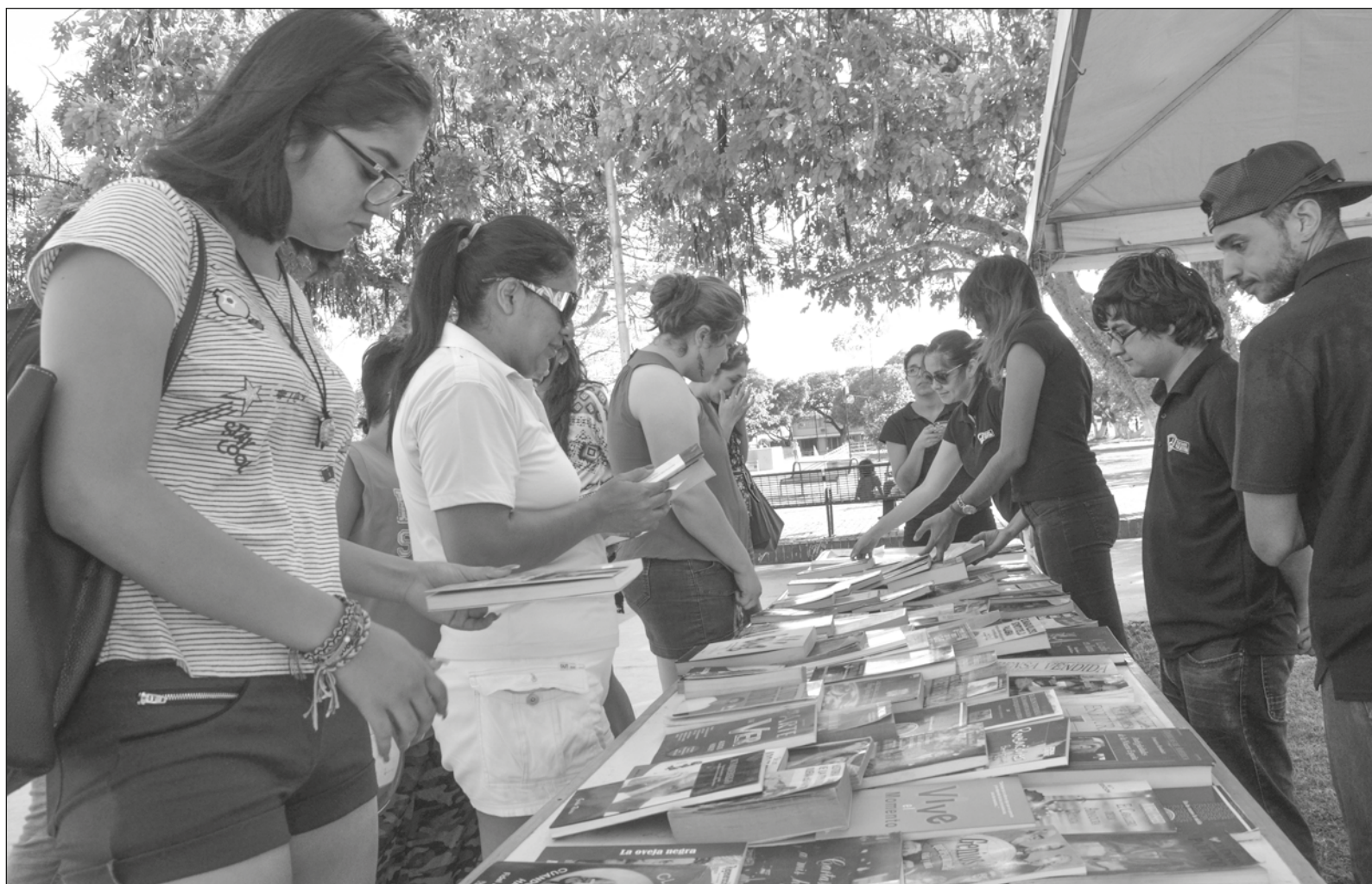
▲ "Mi madre, que como todas las madres es conocedora del remedio para cada mal de sus hijos, me regaló, como salvavidas, tres libros, que una vida y

Espero que estos remedios le sirvan, como me sirvieron a mí en su oportunidad. Tal vez no espanten la tristeza, pero le ayudarán a hacerla llevadera; a domesticarla. Son tres diccionarios de sentimientos para esas emociones inaugurales de su corta vida, cartografías de un mundo que aún comienza a navegar.