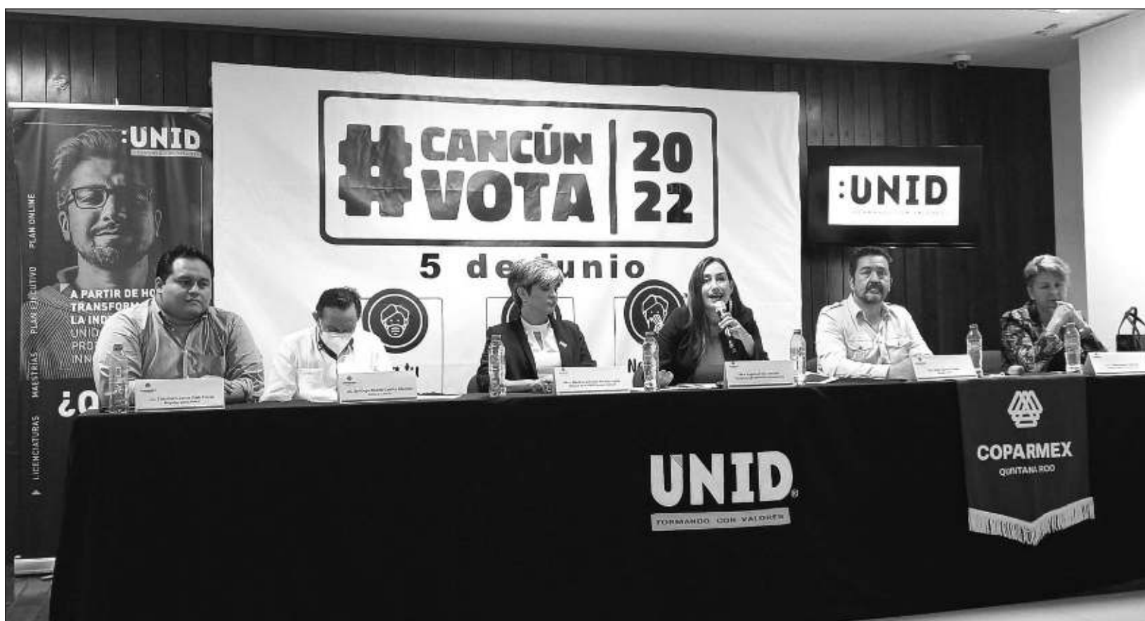
▲ La Coparmex destacó la urgencia de una campaña permanente que recuerde a los quintanarroenses sobre la importancia de votar.