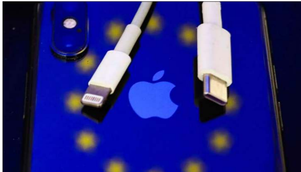
▲ "Si Apple o cualquier otro quiere comercializar sus productos en nuestro mercado interno, tendrá que acatar las reglas y su dispositivo deberá tener un puerto USB-C", advirtió la UE.

La normativa legal aún deberá ser formalmente ratificada por el Parlamento Europeo y los 27 estados del bloque para que pueda entrar en efecto.