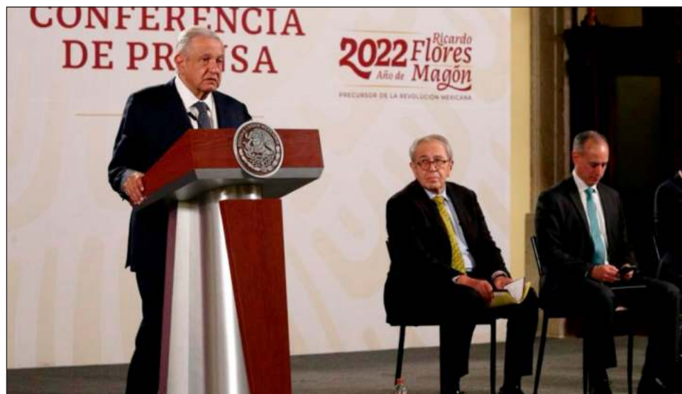
▲ Durante su conferencia matutina, el presidente López Obrador insistió en que el bloqueo económico de Estados Unidos a Cuba impacta negativamente en la población isleña.

“Ya cambiaron las cosas, vamos a buscar integrarnos, hermanarnos, vamos a buscar complementarnos; ya