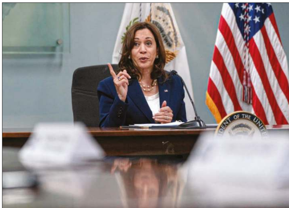
▲ La vicepresidenta estadounidense también anunció una iniciativa con el sector privado que pretende formar a más de 500 mil mujeres y niñas en habilidades laborales.

Las promesas forman una parte importante del plan del presidente Joe Biden para abordar las "causas fundamentales" de la migración desde Guatemala, Honduras y El Salvador, una región conocida como el Triángulo del Norte.