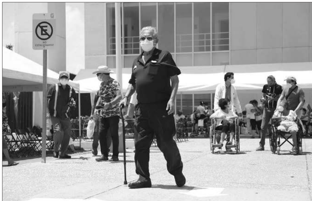
▲ Junto a otros estados, Quintana Roo presenta en los últimos días una "tendencia discreta" hacia arriba en los contagios de coronavirus, de acuerdo a cifras de la Secretaría de Salud federal.

La tendencia va al alza desde la semana pasada. Hasta el 1 de junio habían 92 mil 628 casos positivos, 51 más que el 31 de mayo, día que fueron confirmados 92 mil 577. El 2 de julio se