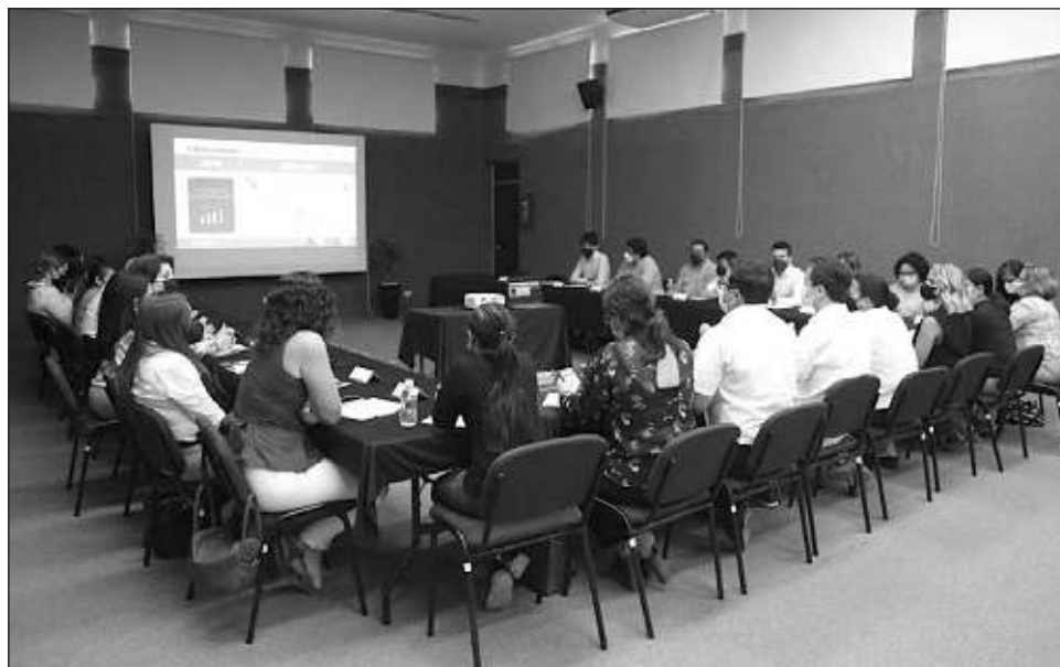
▲ Al inicio de la actual administración, el gobierno del estado adquirió nueve compromisos en la materia; actualmente, cinco presentan avances del cien por ciento.