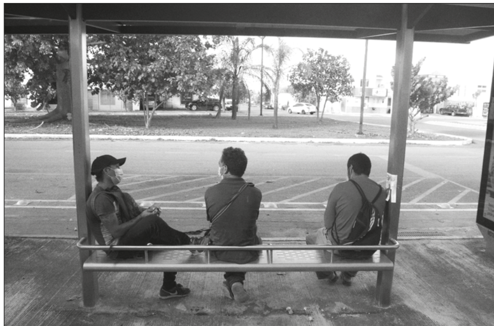
▲ Este miércoles inicia el foro de movilidad urbana, que organiza el Imdut como parte de la cooperación internacional para la urbanización en ciudades inteligentes.

Las ponencias iniciarán a las 10 horas y ten-