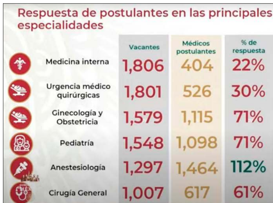
▲ Según presentó el director del IMSS en la conferencia matutina, seis especialidades concentraron el 63 por ciento de las solicitudes para contratos.

Robledo dijo que el sector salud citará a los aspirantes a partir del próximo sábado para que entreguen su documentación e iniciar la contratación. Detalló que en los casos donde haya más de un postulante la asignación de plaza se definirá a partir de criterios como el mejor desempeño académico en las especialidades.