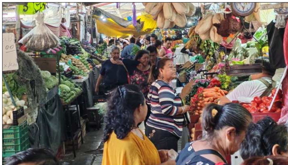
▲ La encuesta explica que 41% de los mexicanos aseguran que gastaron más de lo que debían en Navidad, 24% consideran que el alza de precios es el factor que más afecta su presupuesto.

Entre otras causas, los mexicanos atribuyen su situación financiera a no administrar de forma adecuada el aguinaldo, no haber recibido esta prestación o que fue menor a la percibida en años anteriores, además de gastos realizados durante El Buen Fin, según la encuesta.