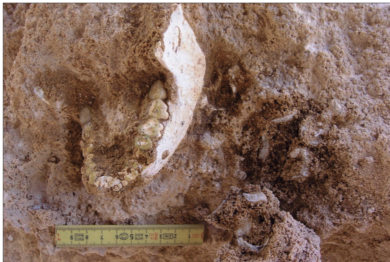
▲ Estos fósiles son similares en edad a los de Homo antecessor , pero morfológicamente distintos, mostrando una combinación de rasgos primitivos y derivados que recuerdan a los homínidos arcaicos euroasiáticos.

La evidencia paleogenética sugiere que el último ancestro común de los humanos actuales, los neandertales y los denisovanos vivió hace alrededor de 765-550 mil años. Sin embargo, tanto la distribución geográfica como