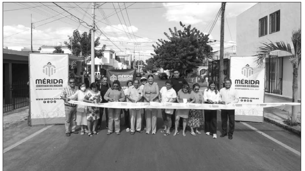
▲ Como parte del orden de la ciudad, la alcaldesa dijo que 100 millones de pesos fueron asignados al cierre del año para iniciar más obras en el mes de enero.

pago de su predial, es que se pueden hacer más obras y acciones, haciendo más con menos y construyendo juntos, una Mérida mejor y más ordenada.