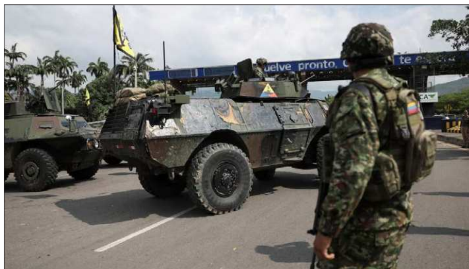
▲ "Le dije a Trump que quienes habían afectado la relación bilateral son políticos narcotraficantes que buscan sembrar de violencia el país", subrayó el presidente Petro.

Petro, además, divulgó que su canciller Yolanda Villavi-