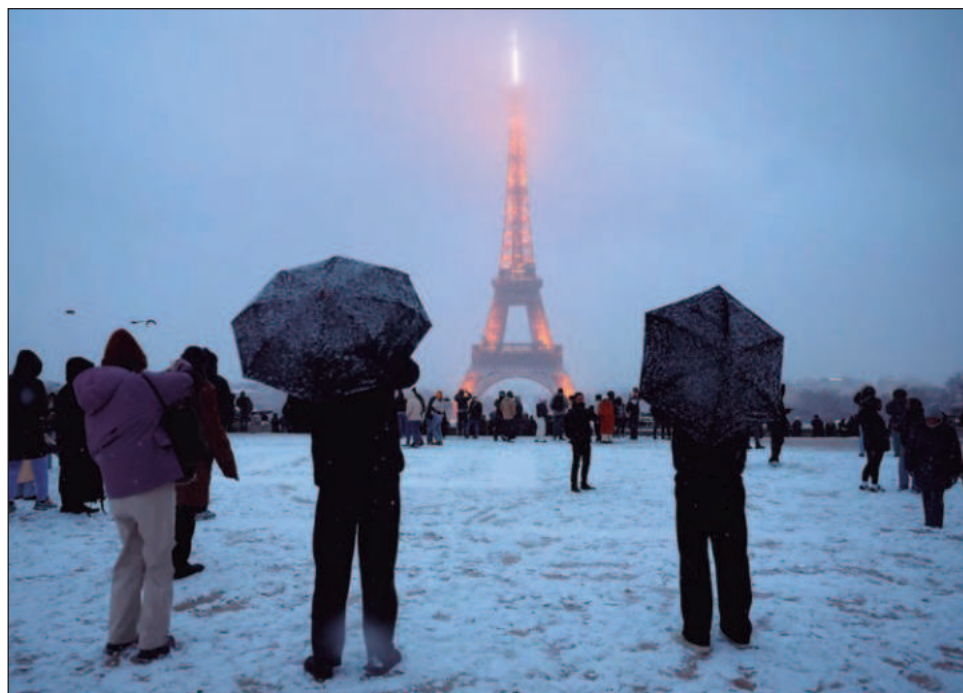
▲ Ajenos al caos, los turistas en París disfrutaban del manto blanco y lo immortalizan en fotografías paseando por lugares emblemáticos como la Torre Eiffel.

Seis personas han muerto en accidentes relacionados con el clima. Cinco de ellas fueron confirmadas en Francia el martes, mientras que una mujer murió en Bosnia debido a las fuertes nevadas y lluvias que provocaron inundaciones y cortes de energía en los Balcanes.