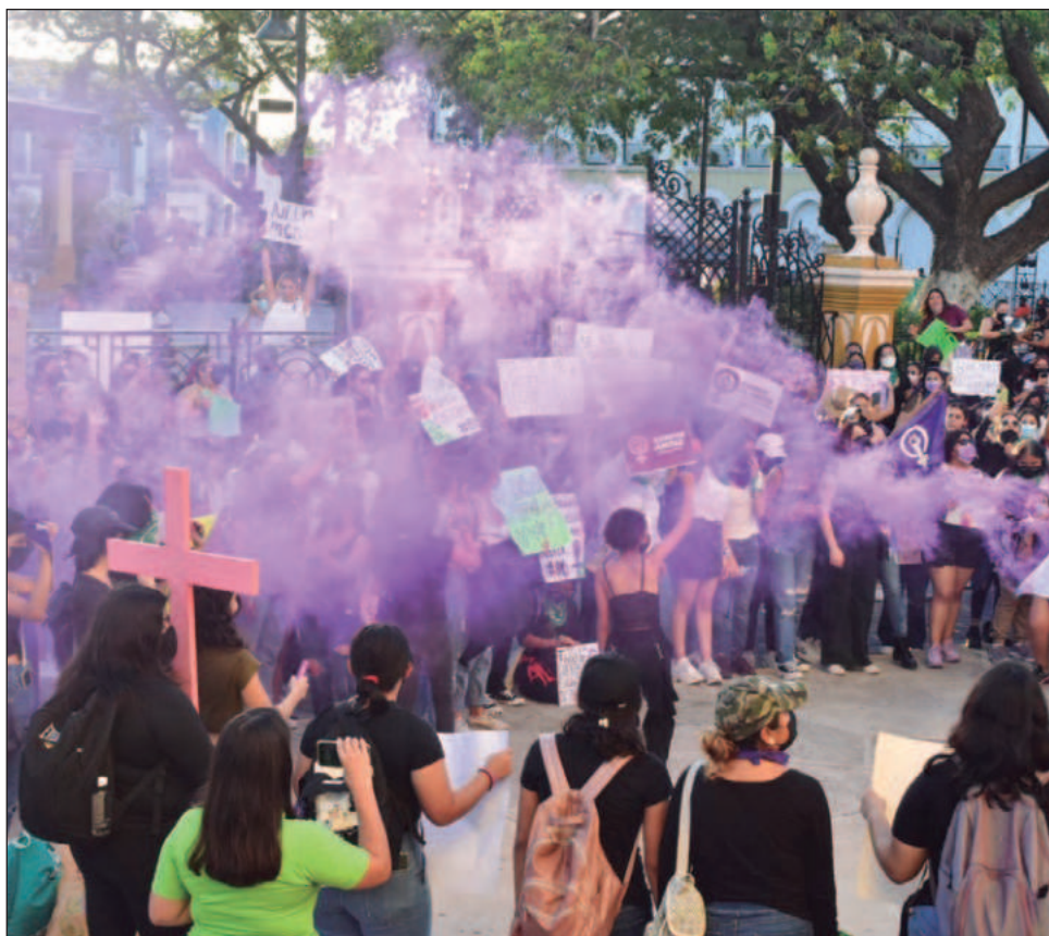
▲ En el delito de violación simple y equiparada Quintana Roo y Campeche se posicionan en segundo y tercer lugar, con 656 y 246 casos respectivamente.

En llamadas de emergencia por hostigamiento y acoso sexual Quintana Roo tiene 399 casos, Yucatán 209 y Campeche 47 hasta noviembre.