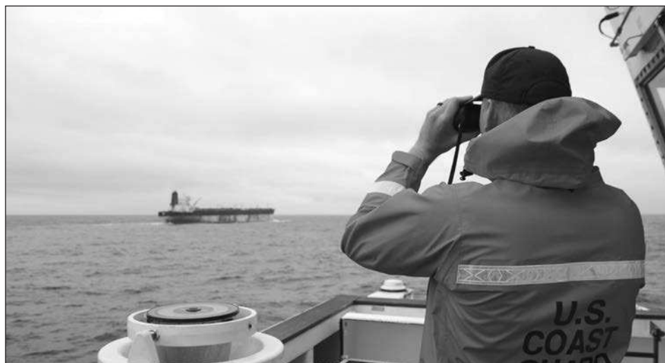
▲ Los dos barcos tomados el miércoles se unen al menos a otros dos tomados por fuerzas estadounidenses el mes pasado, el Skipper y el Centuries .

Tal control sobre las mayores reservas probadas de crudo del mundo podría dar a Estados Unidos un domi-