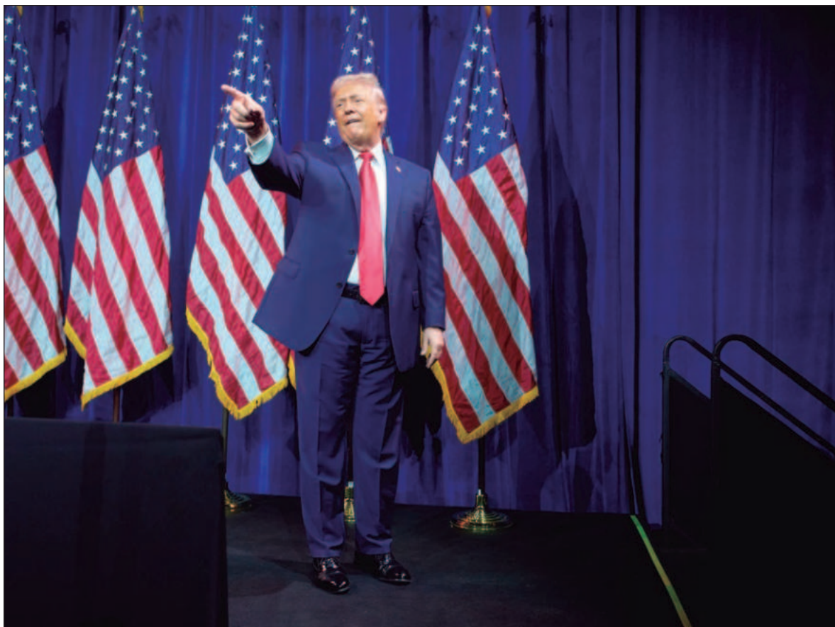
▲ "El fortalecimiento de las posiciones favorables a Trump y el avance de sus intereses en América Latina pone en riesgo a todas las demás naciones que la conforman, aunque la amenaza sigue permeando a todo el planeta".

No puede negarse la crudeza de la realidad política del mundo ni la presencia del conflicto en la historia, pero los daños que gravitan sobre la humanidad junto con todos los organismos vivos son inconmensurables. Y aunque el espacio para albergar siquiera un optimismo moderado sea cada vez más reducido, sólo queda actuar con responsabilidad e invocar la lucidez que anida lejos del prejuicio, ante los poderes que alientan este panorama sombrío.