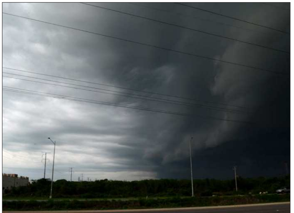
▲ Debido a que persiste la influencia de un sistema anticiclónico y el ingreso de aire marítimo procedente del Mar Caribe, para este miércoles hubo tiempo estable en la mayor

parte de Yucatán. Sin embargo, Protección Civil Yucatán informó que se esperan lluvias ligeras aisladas principalmente en los municipios del oriente y sur.