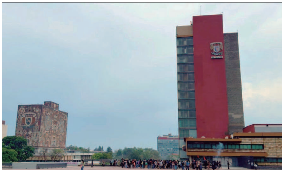
▲ “El principal activo de la UNAM es su capital humano, mismo que va acompañado de un capital material de enorme valor. Facultades como Derecho, Economía o Ingeniería pueden ofrecer consultorías a empresas y gobiernos”.

El principal activo de la UNAM es su capital humano, mismo que va acompañado de un capital material de enorme valor. Facultades como Derecho, Economía o Ingeniería pueden ofrecer consultorías a empresas y gobiernos. Laboratorios como los de las Facultades de Química, Medicina, Veterinaria, etc. pueden brindar servicios de certificación y