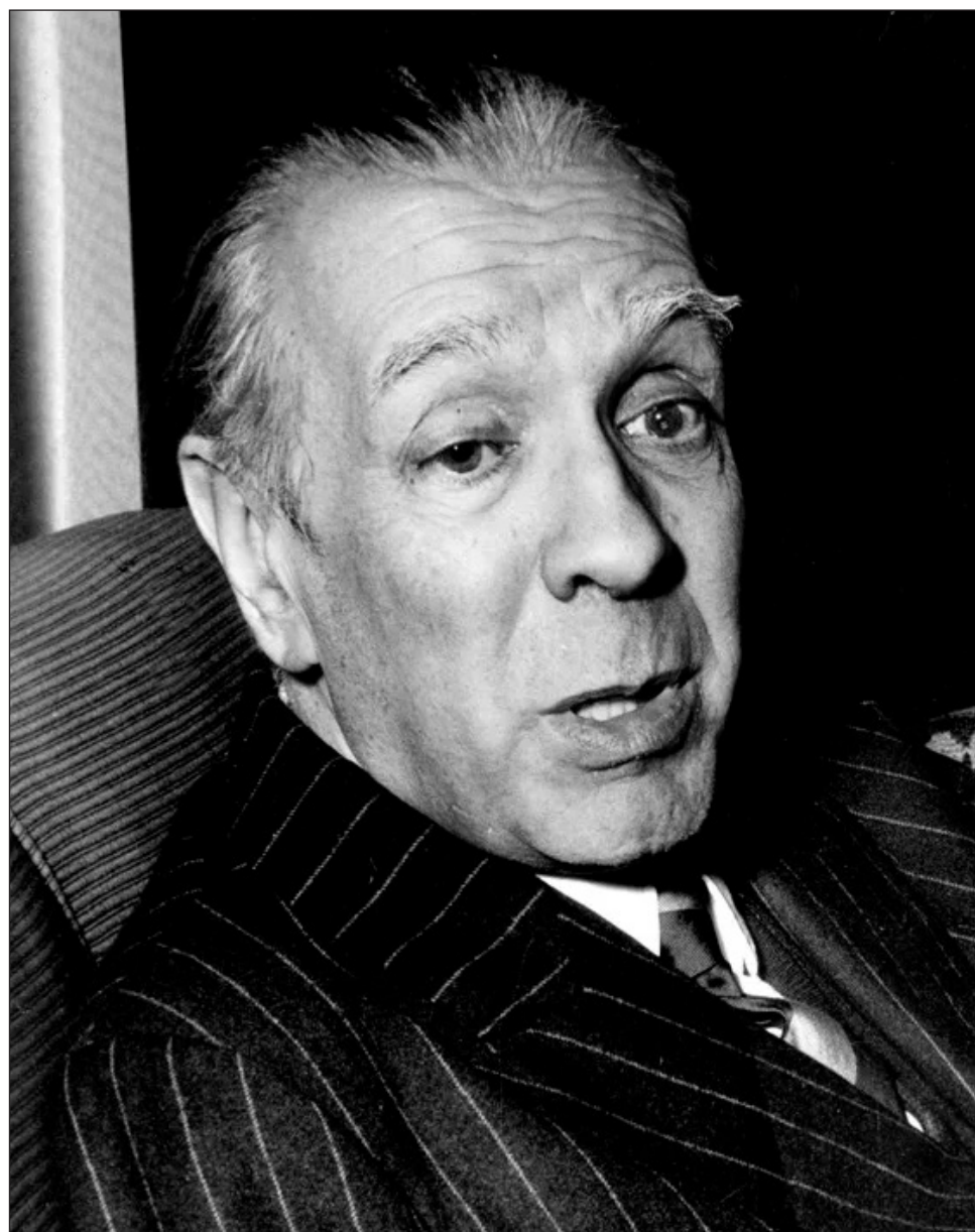
▲ En opinión de especialistas, Borges crea en sus relatos un universo literario que no busca explicar la realidad, sino interrogarla, entrelazando la lógica y la fantasía.

En opinión de especialistas, Borges crea en sus relatos un universo literario que no busca explicar la realidad, sino interrogarla. Bibliotecas infinitas, laberintos, tigres y sueños son algunos de los elementos que conforman este mundo único, donde la lógica y la fantasía se entrelazan.