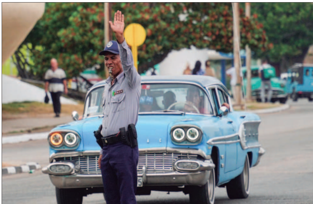
▲ La mandataria nacional aseveró que México envía crudo a Cuba ya sea por compromisos derivados de contratos con el gobierno de ese país, pero también como parte de la ayuda humanitaria que se manda a la isla.

Durante su conferencia de prensa, Claudia Sheinbaum aseveró que México envía crudo a Cuba ya sea por compromisos derivados de contratos con el gobierno de ese país pero también se realizan envíos como parte de la ayuda humanitaria que otorga nuestro país ante la situación que prevalece en la isla.