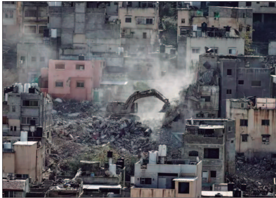
▲ “Los palestinos continúan siendo sometidos a confiscaciones masivas de tierras y a la privación de acceso a recursos”, subrayó Volker Türk, jefe de la oficina de Derechos Humanos.

“Ya sea para acceder al agua, a la escuela, acudir al hospital, visitar a familia-