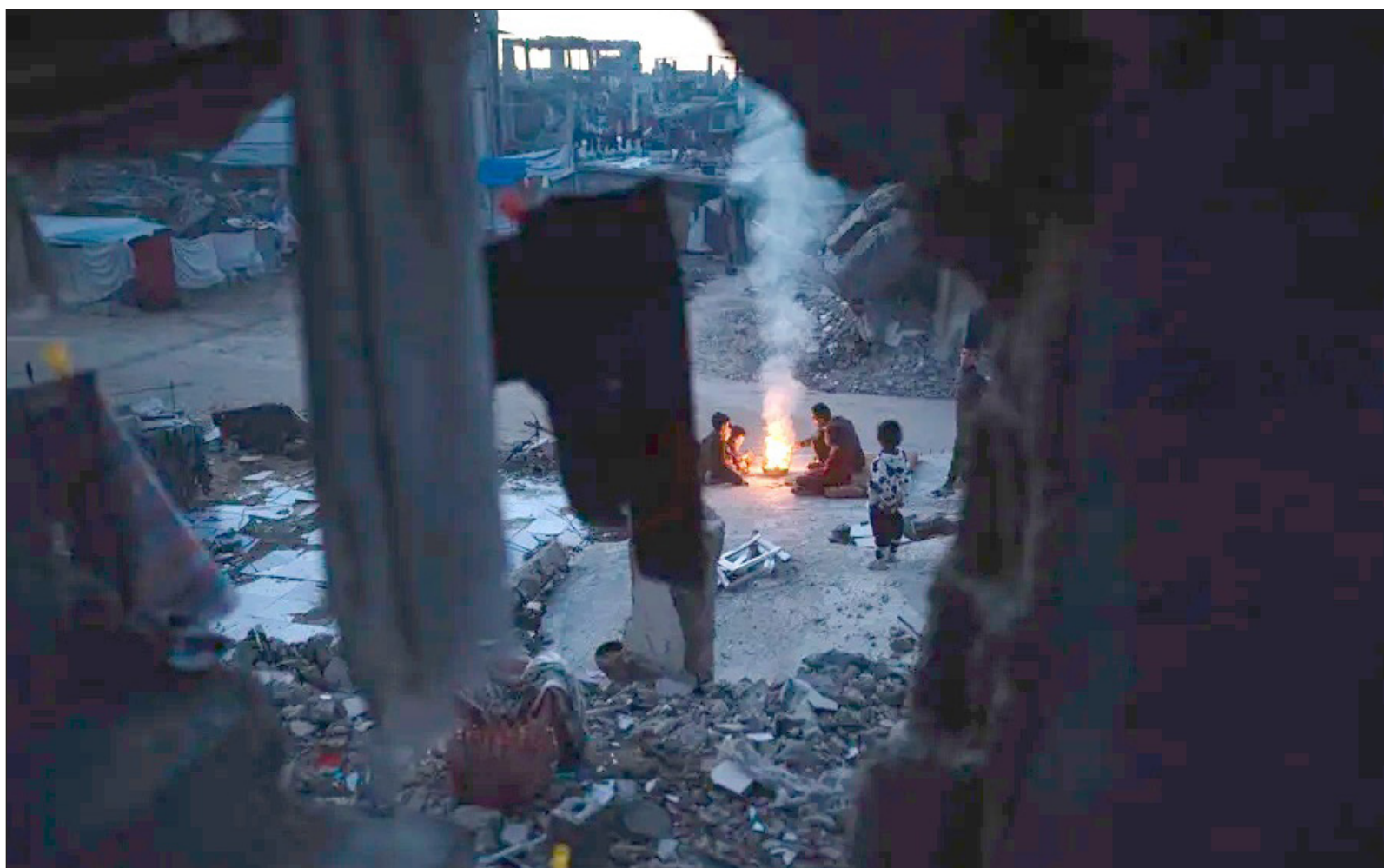
▲ "La voluntad que siempre ha prevalecido en la ONU es la de EU, por mucho que la aplastante mayoría de países del mundo voten para que se sancione a Israel".