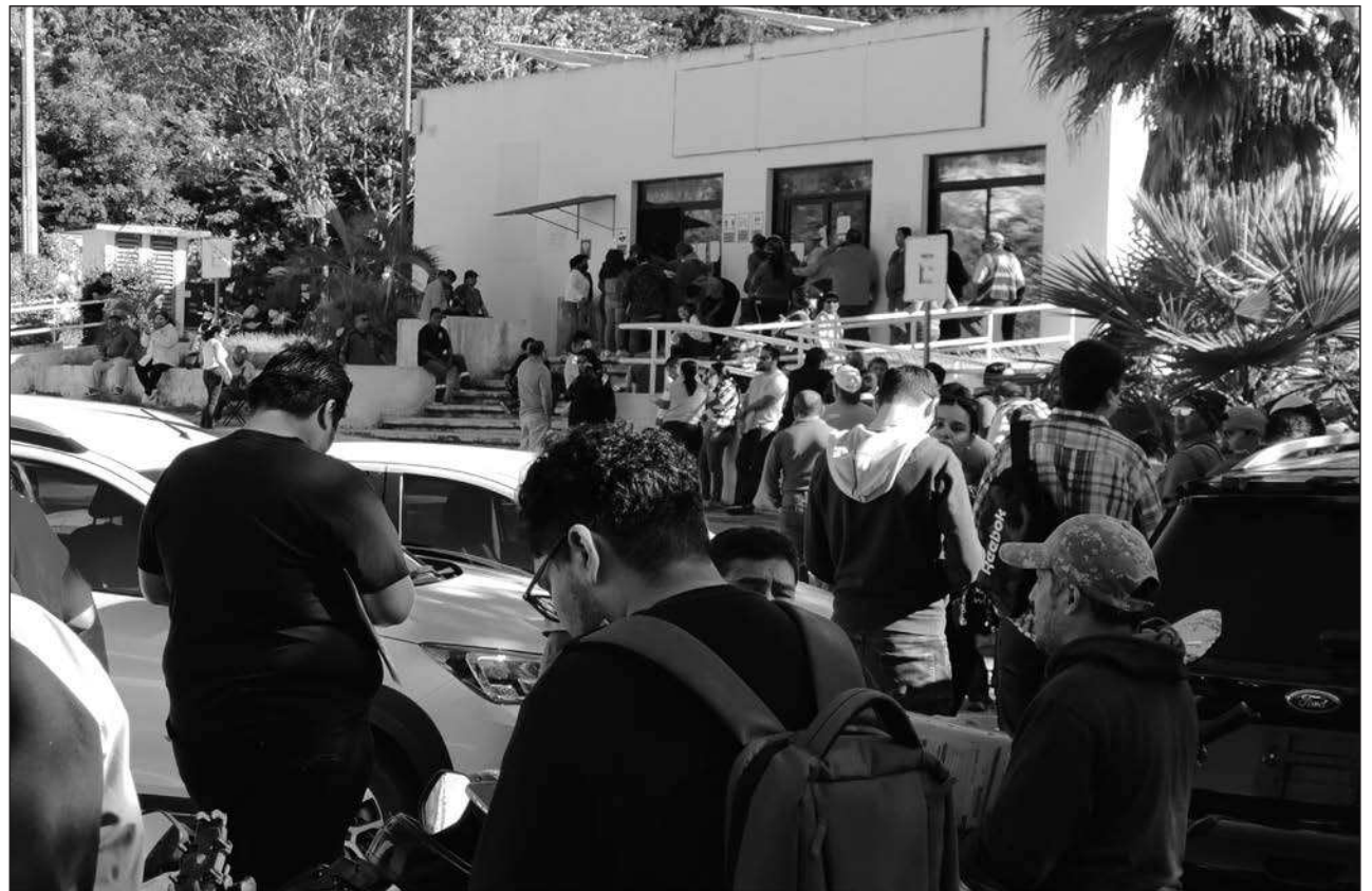
▲ El límite para realizar el trámite será hasta el 31 de marzo, ya que posteriormente aplicarán multas.

Así, para que sea más ágil y fluido el cambio de placas se instalará el mó-