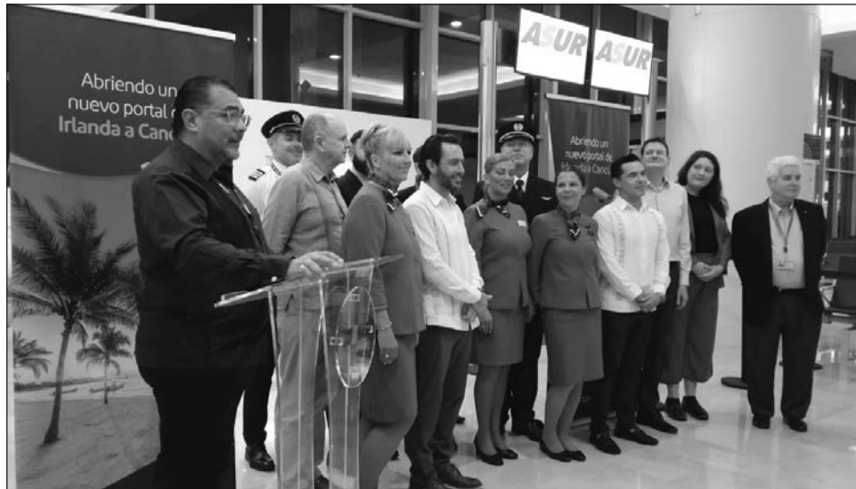
▲ Esta baja afluencia estaba prevista, derivada principalmente de factores externos, como la desaceleración en el crecimiento de la industria aeronáutica internacional.

De acuerdo con Aeropuertos del Sureste, al destino de Cancún llegaron 29 millones 345 mil 538 pasajeros, mientras que en 2024 la cifra fue de 30 millones 411 mil 520 pasajeros.