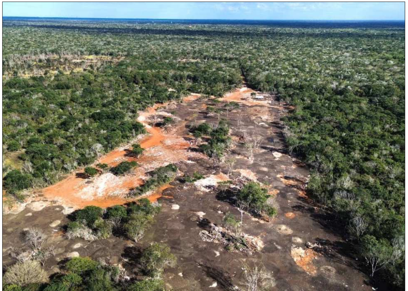
▲ Al momento de la inspección no se localizó a persona responsable de las actividades observadas, aunque se realizó el aseguramiento precautorio de un remolque tipo góndola metálico, utilizado presuntamente para el transporte del material orgánico.

En el sitio se identificaron diversas áreas afectadas, entre ellas superficies destinadas a caminos de acceso para el tránsito de vehículos de carga, zonas para actividades agrícolas y un área de mayor extensión utilizada para la dispo-