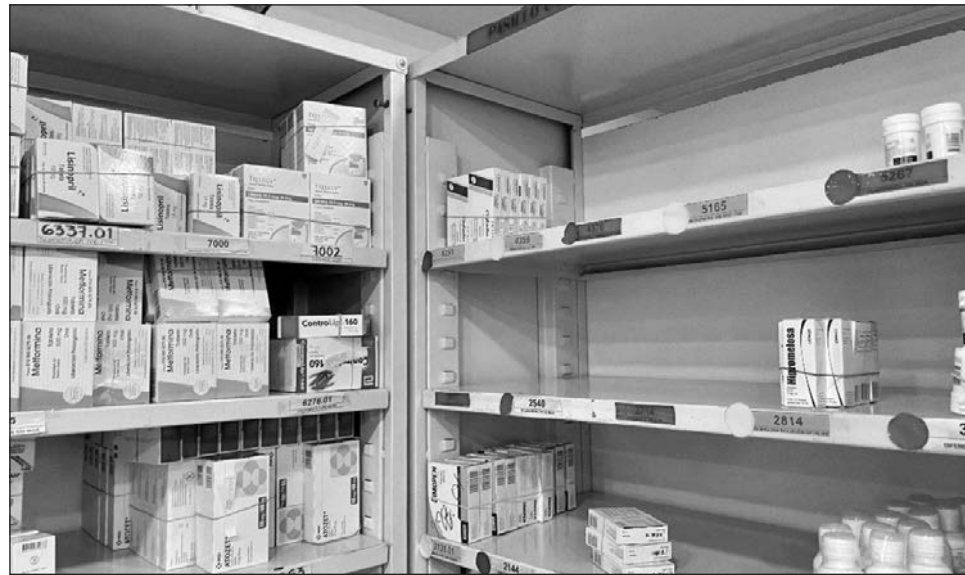
▲ El programa institucional de Birmex reconoce que las carencias de medicamentos y tratamientos esenciales se han originado por deficiencias en procesos de compra y distribución.

Entre las actividades contenidas en cinco objetivos, está la de promover la vinculación, transferencia tecnológica, de conocimiento e innovación entre instituciones y sectores, para la modernización y nuevas líneas de producción.