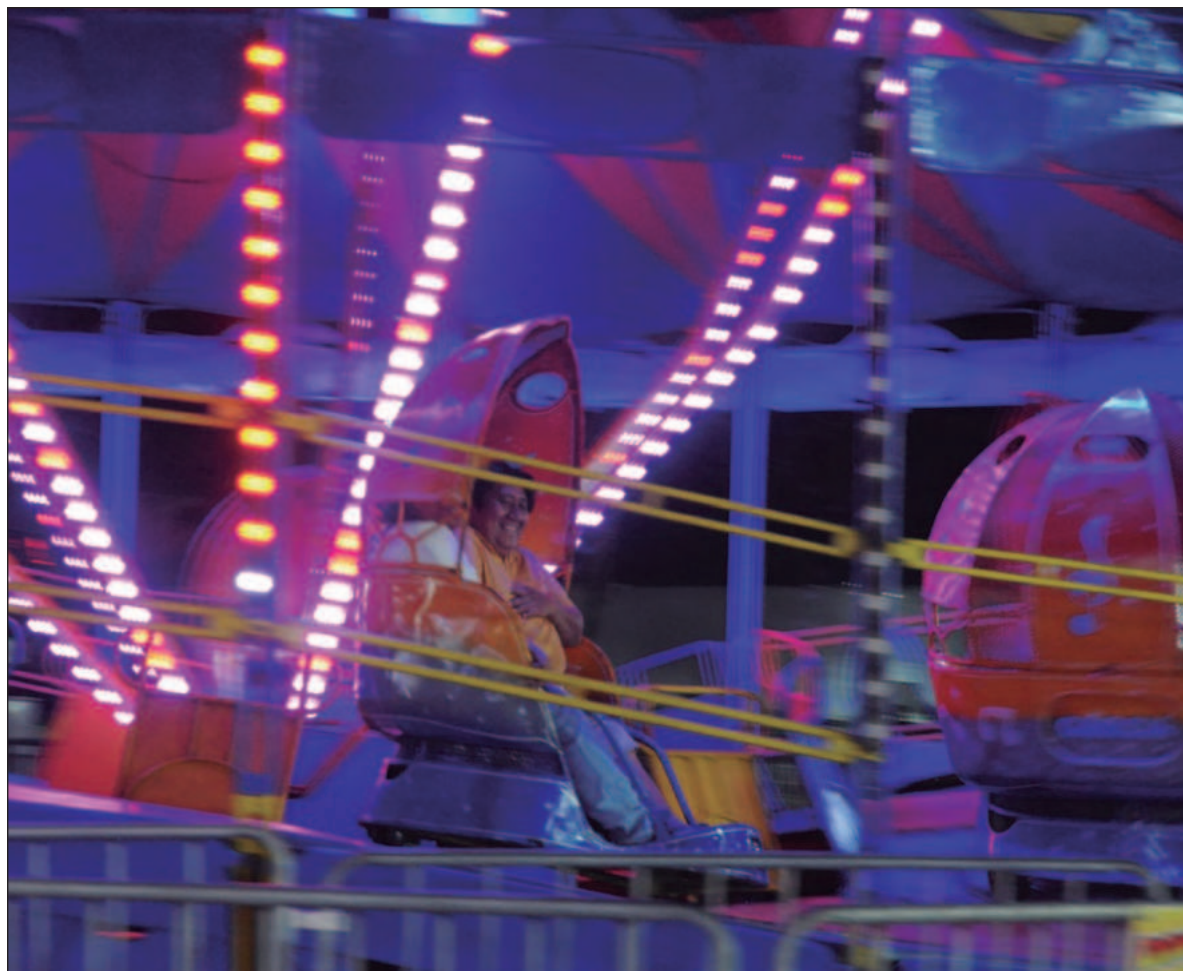
▲ "Nos hemos acostumbrado a vivir en tensión porque, de alguna manera, el estrés y la ansiedad nos dan una sensación de movimiento, de existencia. El silencio, la calma y la pausa nos resultan incómodos".