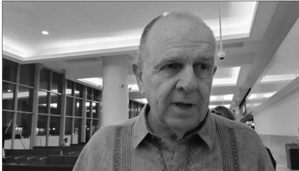
▲ Son varias las agencias de viajes, dijo Liman, que ya están por su cuenta armando paquetes hacia el destino mexicano, por lo que el aumento de turistas podría ser inmediato.

Son varias las agencias de viajes, dijo, que ya están por