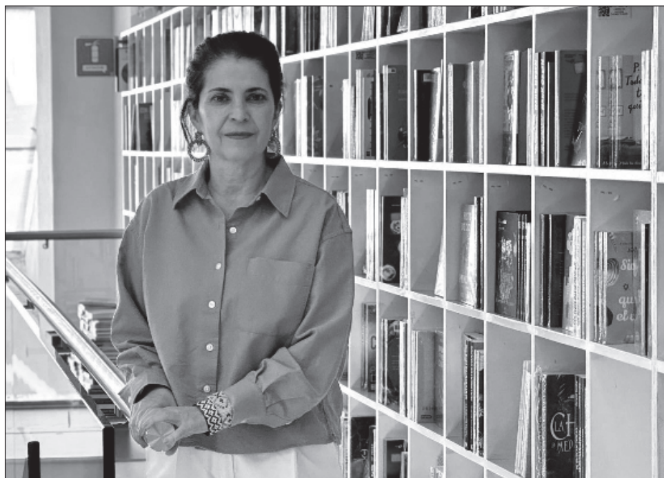
▲ El sonido del rugido de la onza contrapone el conocimiento amazónico con la grandilocuencia del colonialismo europeo y desarrolla una segunda trama en el Brasil contemporáneo.

“Una universalización de la ciencia debería tener una mirada más compasiva no sólo para nosotros, sino para nuestros hermanos los animales y las plantas, porque este mundo no sólo es nuestro. Lo habitamos en conjunto con otros se-