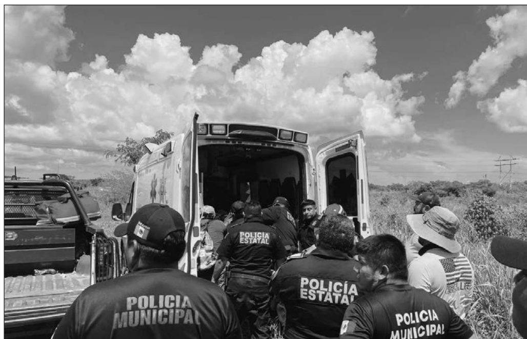
▲ En Dzilam González, un ataque armado dejó tres víctimas.

A esto, debe sumarse que la policía estatal, dependiente de la Secretaría de Seguridad Pública, sigue siendo una de las corporaciones que más confianza inspiran en la población, con un muy alto 71.1 por ciento según cifras del Consejo Nacional de Seguridad. El reto es, entonces, la preparación de los denominados guardianes del orden para anticiparse a los delincuentes. Esto implica entrenamientos, adquisición de conocimientos, equipo táctico y armamento, así como infraestructura y apoyo de vigilancia, algo que se ha venido haciendo pero que por ningún motivo puede descuidarse; a menos que queramos acostumbrarnos al ruido de las balas y a ver a profesoras de preescolar dando la instrucción de "pecho a tierra" mientras cantan "si las gotas de lluvia fueran de chocolate".