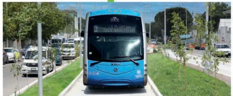
Construcción de vías en donde transitarán las unidades del IETRAM, además de construcción de banquetas y guarniciones, señalética, sistema de iluminación y pozos pluviales.