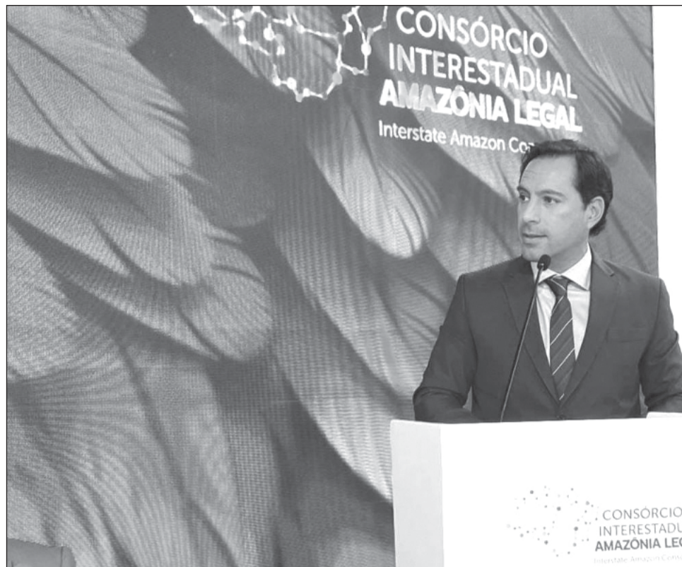
▲ En el panel de la COP28, el gobernador reiteró que se han asumido compromisos más ambiciosos, estableciendo que el estado alcance emisiones cero para 2050.

“Uno de nuestros principales enfoques ha sido la transición del sector del transporte hacia un modelo bajo en carbono, enfatizando la movilidad sustentable y la equidad social a través de la iniciativa de Transporte Justo. Los esfuerzos incluyen un enfoque en la movilidad sustentable que promueve la