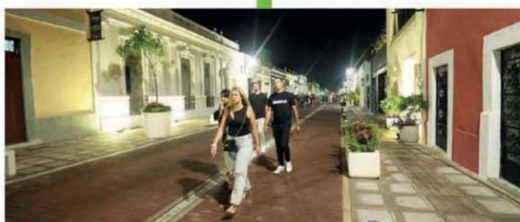
Estamos realizando el Corredor Turístico - Gastronómico de la calle 47 y 60 para conectar a la Plaza Grande, el Parque de Santa Lucía y de Santa Ana con el nuevo Parque la Plancha, en conjunto con el Ayuntamiento de Mérida.