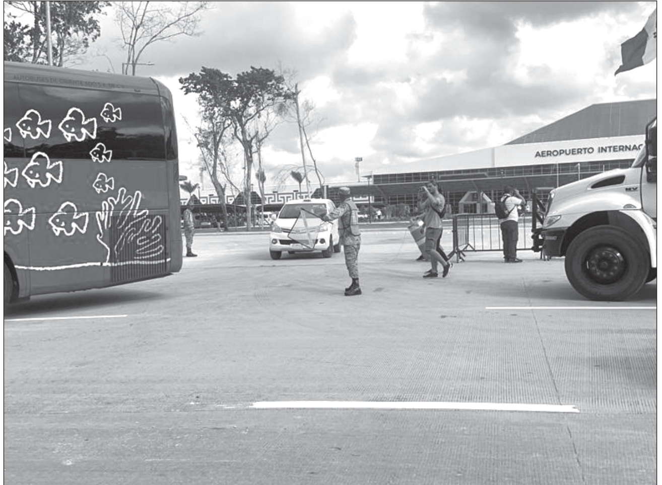
▲ El ADO ofrece el servicio de transporte desde la terminal aérea por menos de 300 pesos.

Hasta ahora llegan al destino un máximo de tres vuelos diarios (dos de la Ciudad de