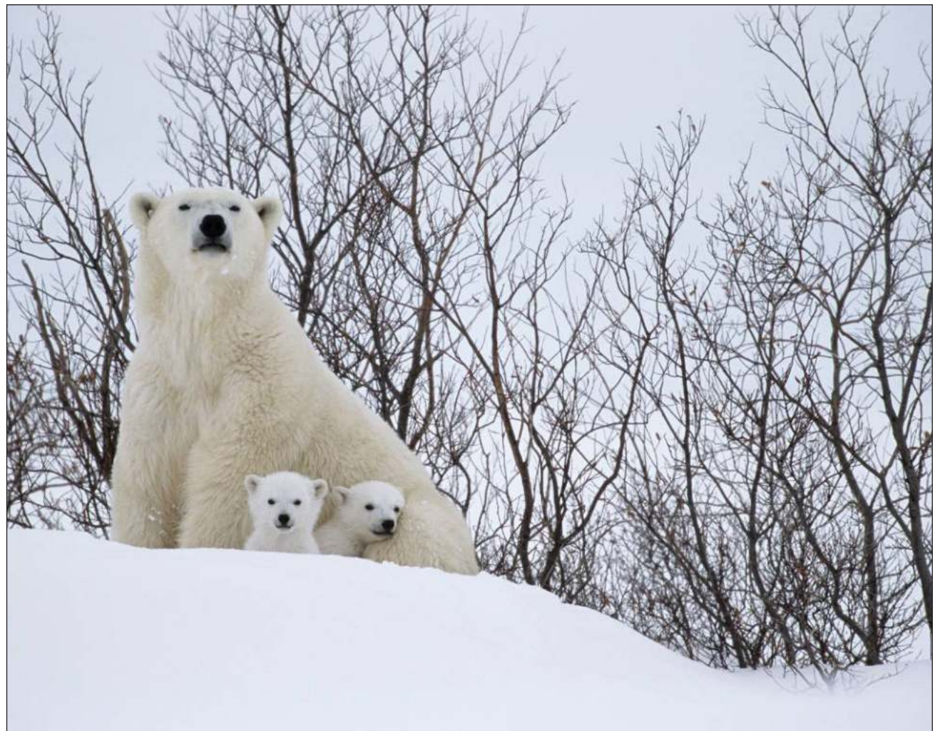
▲ Yóok'lal ba'ax ku seen beeta'al tumen wiinike', ku xchukul k'éexel yóok'ol kaab ts'o'oke' ma' tu yantal u k'iinil u na'atik ba'alche' ba'ax k'a'abéet u beetik ti'al ma' u k'íimil.

Ba'ale', kex tumen yanchaj chi'ichnakil yóok'lal le ba'alche'oba' -káaj u chuíkpajal u k'aaba' tsoolil ba'alche'ob sajbe'entsil yanik u kuxtalo'ob ikil tu k'éexel u