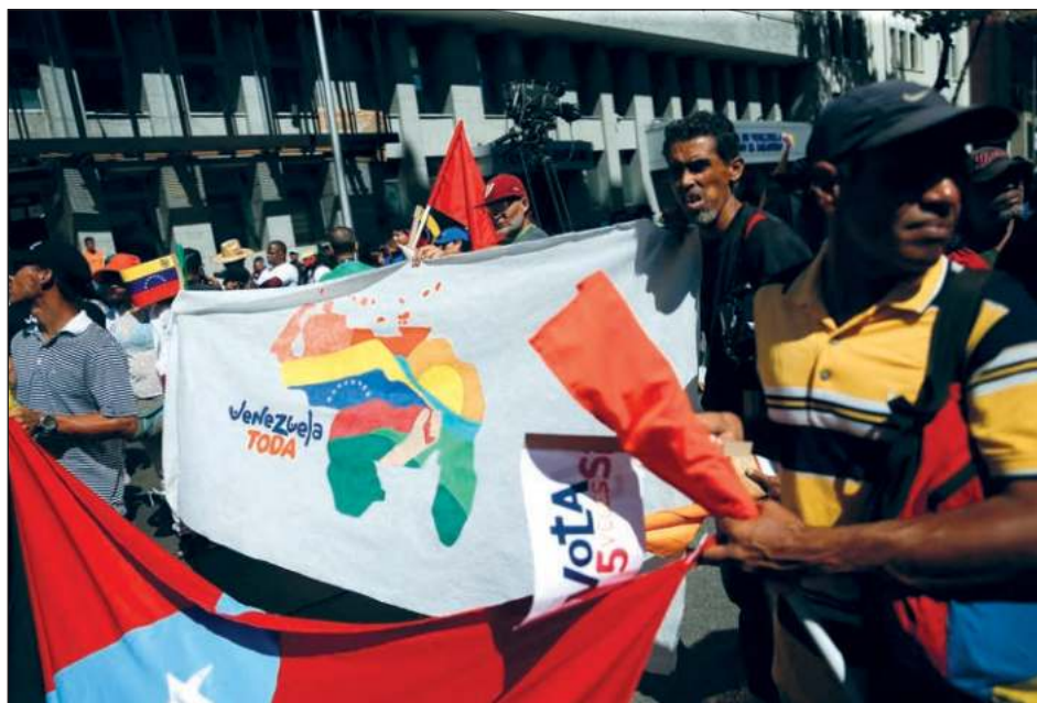
▲ El presidente de Guyana, Irfaan Ali advirtió que nada de lo que haga Venezuela impedirá que Guyana proceda con el caso ante la Corte Internacional de Justicia.

Este plan incluye el otorgamiento de licencias para la explotación petrolera y despliegues mili-