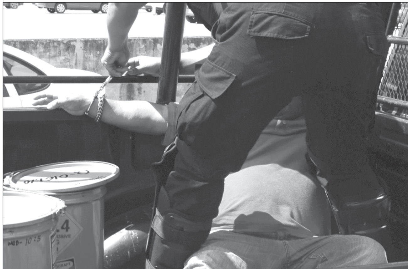
▲ En la CDMX y el Estado de México, seis de cada 10 personas privadas de su libertad fueron víctimas de un acto corrupto en algún momento de su proceso penal, los niveles más altos que se reportan en el país.

El Inegi informó dichos datos en un comunicado basado en los programas de información estadística: Encuesta Nacional de Calidad e Impacto Gubernamental (ENCIG), Encuesta Nacional de Población Privada de la Libertad (ENPOL), Encuesta Nacional de Victimización y Percepción sobre Seguridad Pública (ENVIPE), Censo Nacional de Gobierno Federal (CNGF) y Censo Nacional de Gobiernos Estatales (CNGE).