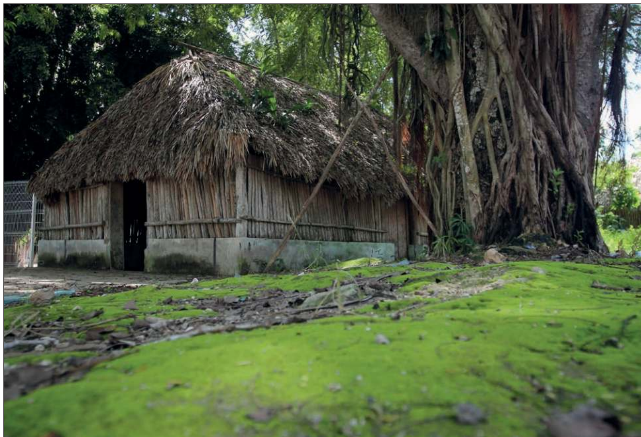
▲ El turismo de bajo impacto ha revitalizado el interés en las casas tradicionales en el estado.

Recientemente algunos miembros de otras cooperativas rurales viajaron a Francia para participar en uno de los eventos más importantes para el sector turístico, lo que ha permitido que el número de visitantes vaya incrementando poco a poco. Si bien no