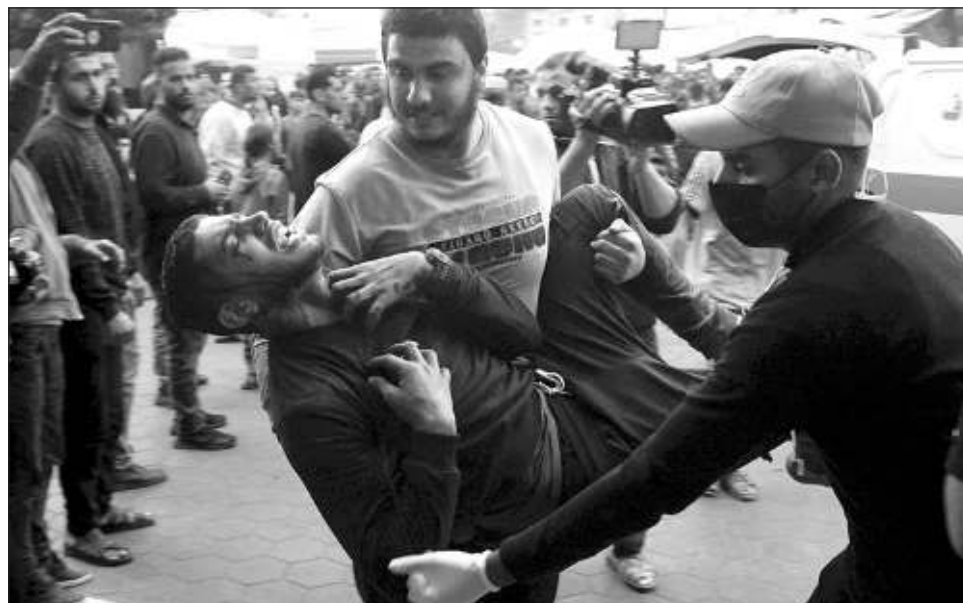
▲ El secretario general de la ONU, António Guterres, invocó el artículo 99 de la Carta, que le permite “llamar la atención del Consejo” sobre una cuestión que “pueda poner en peligro el mantenimiento de la paz y la seguridad internacionales”.

“Podría producirse una situación aún peor, incluidas epidemias y una mayor presión para el desplaza-