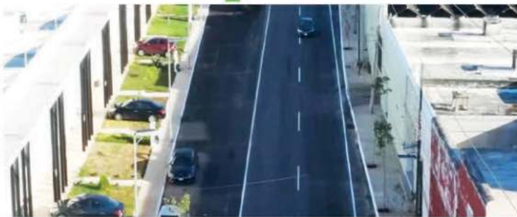
Construcción y repavimentación de más de 3.8 kilómetros de calles que abarcan la 46, 43 y 55. Adicionalmente se realizará la construcción de banquetas y guarniciones, señalética, sistema de iluminación y pozos pluviales.