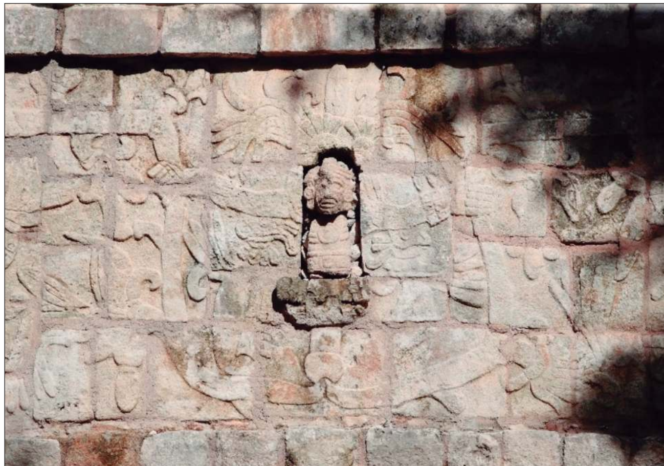
▲ El muestreo de más de mil 525 km da para decenas de años de estudio, enfatizó el responsable del salvamento.

De igual forma, afirmó que durante las obras se detectaron zonas de singular valor arqueológico, lo que hizo necesario modificar en más de una veintena de ocasiones el trazo del tren.