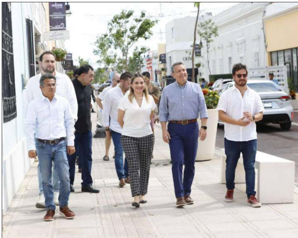
▲ El alcalde de Mérida recorrió el lugar en compañía de empresarios del sector restaurantero provenientes de Izamal, Umán y Progreso.

La empresaria agregó que cuando existe una buena sinergia entre autoridades de gobierno, la iniciativa privada y la sociedad, surgen proyectos como el Corredor Turístico y Gastronómico de la calle 47 y la calle 60, que junto con el Gran Parque de La Plancha será un fuerte atractivo para la atracción de más visitantes tanto locales como extranjeros, lo que dejará una mayor derrama económica para la ciudad.