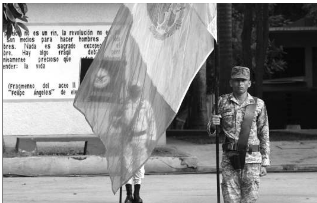
▲ Llama la atención que figuren en la lista la Guardia Nacional, con 44.6 y el Ejército y Marina como instituciones consideradas corruptas, con 44.6 y 37.3 por ciento, respectivamente.

Llama la atención que figuren en la lista la Guardia Nacional, con 44.6 y el Ejército y Marina como instituciones consideradas corruptas, con 44.6 y 37.3 por ciento, respectivamente. Todavía a inicios de este sexenio, los segundos se encontraban entre los más confiables, mientras que la Guardia se formó precisamente para detener la corrupción que imperaba en la Policía Federal. Esta es una percepción que debiera preocupar en serio porque también son instituciones que han tomado un papel protagónico en estos últimos cinco años. Es cierto que lo que se observa todos los días está sujeto al escrutinio público, pero cuando se trata de instituciones de seguridad, normalizar la idea de que en ellas impera la corrupción conduce a un Estado fallido.