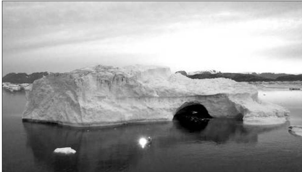
▲ Una de las preocupaciones principales reside en saber si las capas de hielo de la Antártida occidental y de Groenlandia se derretirán, “nadie está lo bastante seguro”, apuntó Tim Lenton.

El documento advierte que cinco de esos procesos parecen estar llegando a su límite, como el derretimiento de los hielos, que amenaza con provocar un catastrófico aumento del nivel del mar, o