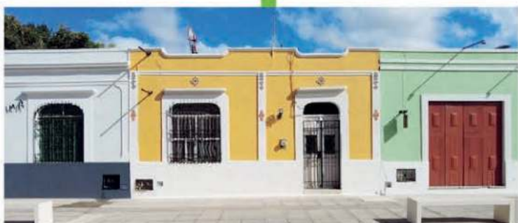
El Ayuntamiento de Mérida invirtió en la pintura en las fachadas de las viviendas que rodean al Parque de la Plancha.