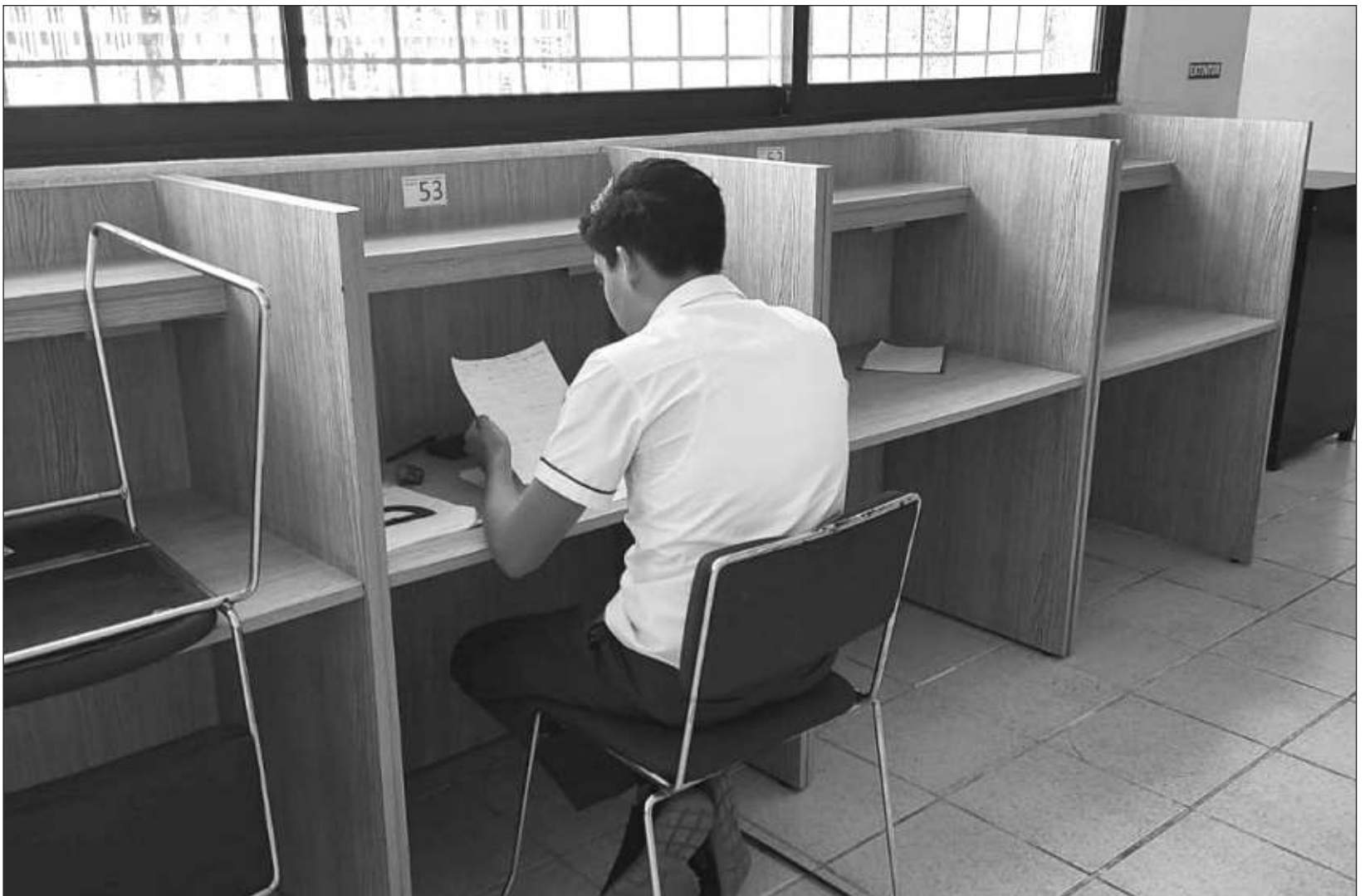
▲ El director del Cobacam señaló que uno de los logros académicos más significativos es la reducción de los índices de reprobación.

En el trimestre que se informa, el Cobacam ha trabajado en la implementación de la Nueva Escuela Mexicana, que busca transformar la educación en México mediante un enfoque crítico, humanista y comunitario para formar estudiantes con una visión integral, adquiriendo valores éticos y democráticos.