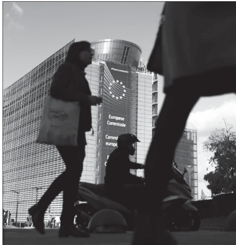
▲ "Today, the now twenty-seven states of the European Union (EU) face new challenges that risk spoiling the dream".

IN 2022 THE EU suspended structural assistance to Budapest over "rule of law" issues. Since coming to power in 2010, Orban has decried the idea of an even closer union, emphasizing that family values, national sovereignty, and national culture are essential to Hungarian society. The EU has challenged Hungarian views at the European Court of Justice on the grounds that the Orban government was