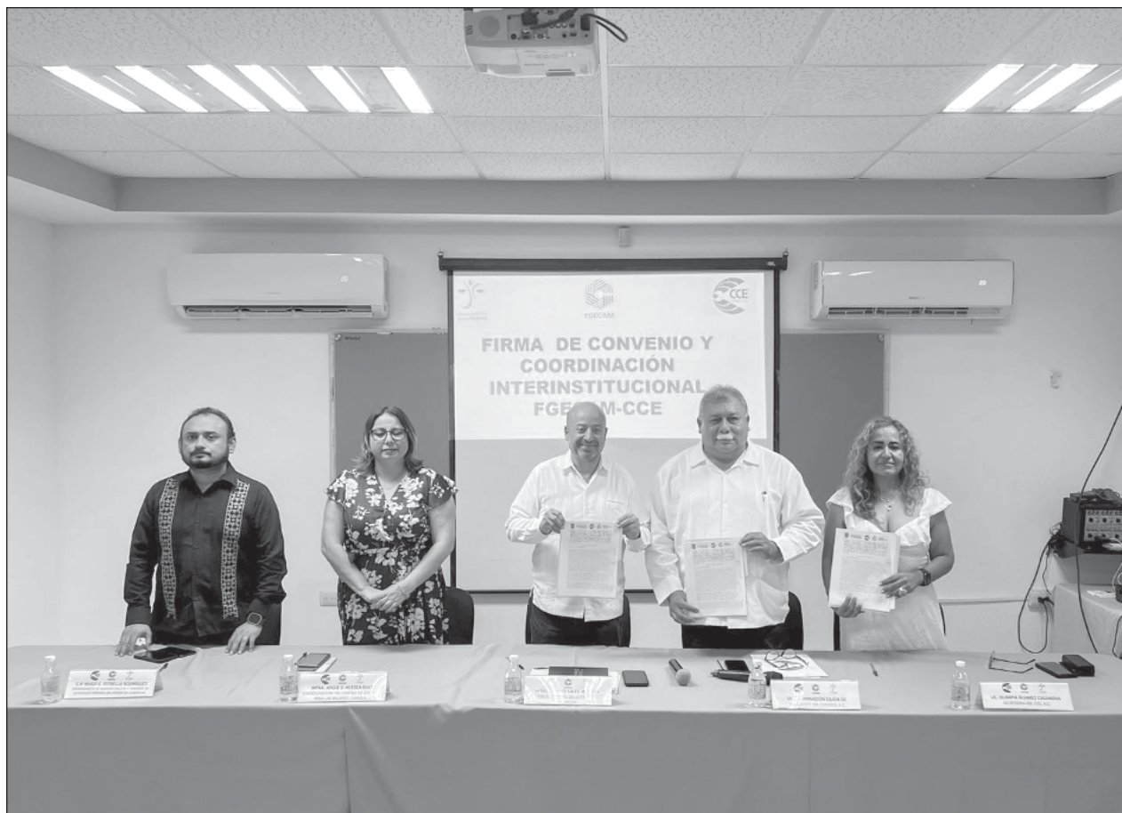
▲ La firma de este acuerdo es el primero en su tipo que se conforma en el estado con la mira en impulsar acciones que lleven a erradicar y castigar la violencia en contra de las mujeres.

En el caso de Campeche, Biby Rabelo de la Torre dio a conocer que primeramente hubo un recorte de participaciones y por eso su ley de Ingresos bajó 3.9 por ciento con respecto a la del año pasado de mil 870 millones de pesos aproximadamente, para pasar a unos mil 800 millones de pesos según la baja.