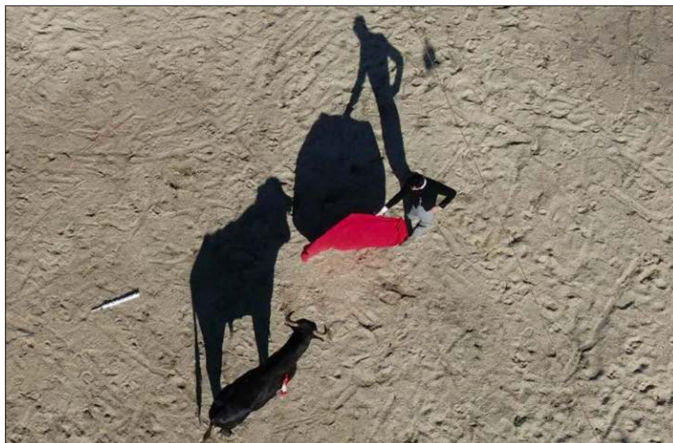
▲ La decisión de la SCJN no resuelve el fondo del asunto, sólo permitirá reanudar las corridas de toros en tanto el juzgado de origen concluye con el juicio de amparo.

Agrega que la suspensión concedida en primera instancia afectaba los derechos legales de las empresas y personas que se dedican a este espectáculo.