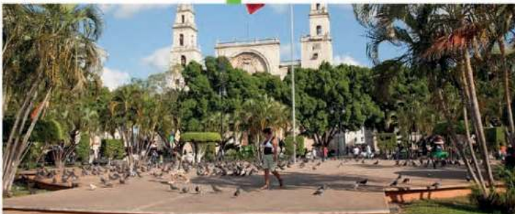
Realizaremos la remodelación de la Plaza Grande