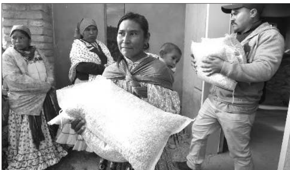
▲ Se han detectado 67 casos de infantes de cinco años con desnutrición en Chihuahua.