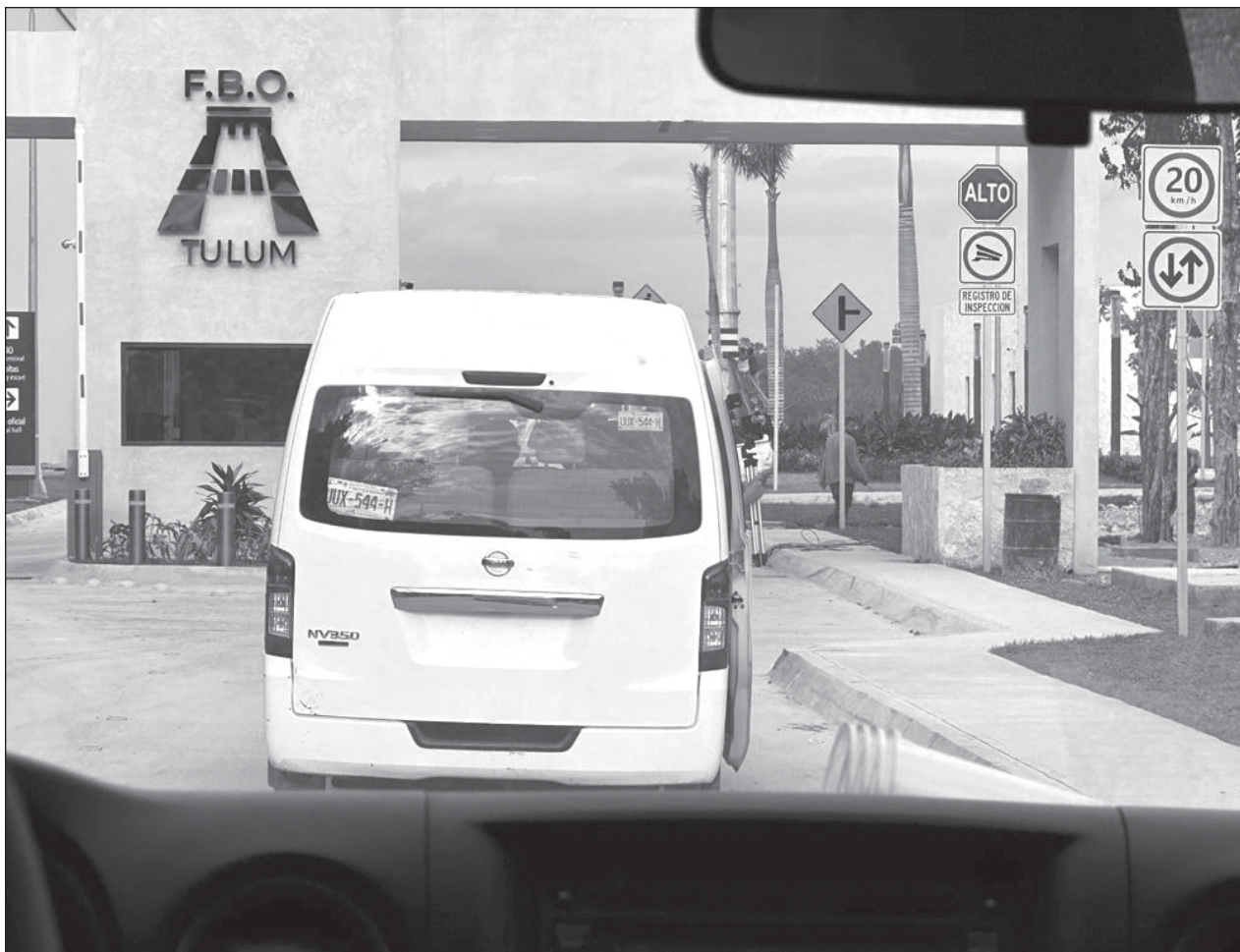
▲ El Fixed-Base Operator u Operador de Base Fija. se compone de dos áreas: la primera es una terminal aérea privada para el embarque y desembarque de los pasajeros y la segunda la conforman los servicios aeronáuticos.

La agencia del Ministerio Público contará con una Ventanilla Única de Atención con el propósito de proporcionar orientación e información a las personas que requieran un servicio de la Fiscalía General de la República.