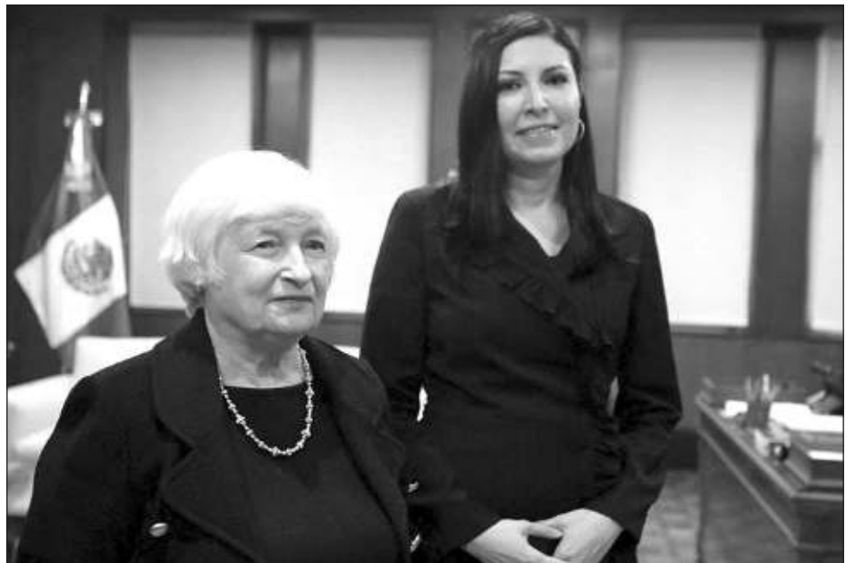
▲ Durante su visita al país, la secretaria de Tesoro estadounidense, Janet Yellen, resaltó la relación de México y EU a lo largo de un bicentenario.

"Creemos que el trabajo coordinado es la mejor manera para enfrentar desafíos como el crimen organizado, que representa un peligro