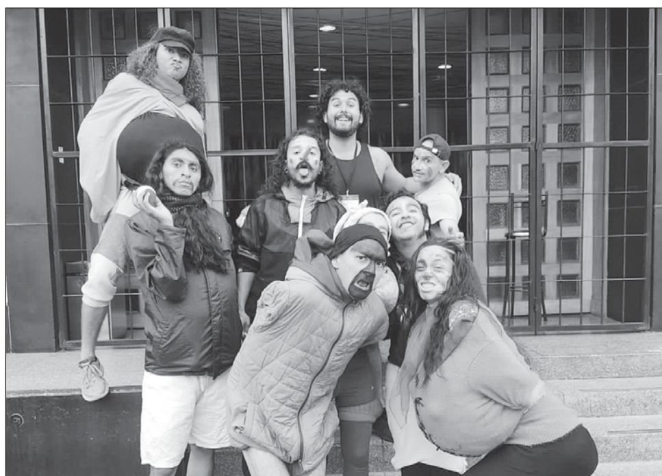
▲ La Cabra Salvaje Teatro Laboratorio alista un curso intensivo del 8 al 19 de enero en Mérida para quienes estén interesados en las técnicas clown y bufón .