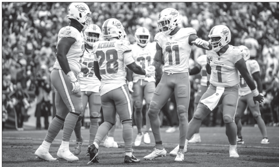
▲ Con una explosiva ofensiva y una defensiva que va de menos a más, los Delfines lucen como un equipo muy peligroso en la Conferencia Americana.

El equipo de la estrella solitaria llega al choque ante el campeón de la Nacional con una racha de cuatro triunfos; los "Eagles" vienen de ser apaleados 19-42 por San Francisco en la semana 13, derrota que exhibió una alarmante fragilidad en el grupo de apo-