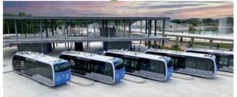
Se construye la estación del IETRAM en el Parque la Plancha, para 3 rutas de este transporte público 100% eléctrico y único en su tipo en Latinoamérica.