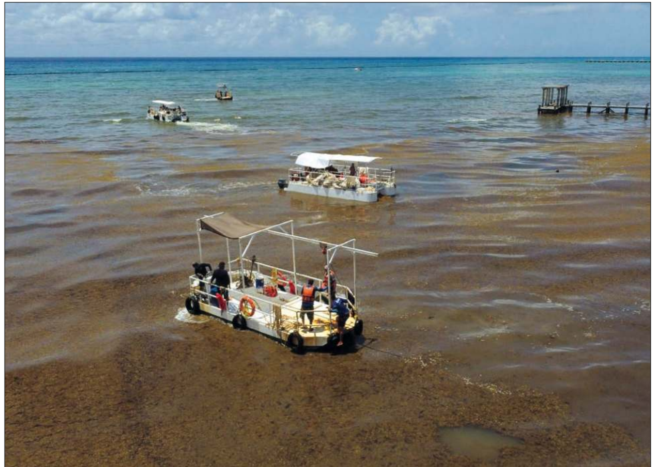
▲ Aún se desconoce el origen de los recales masivos, pero hay algunas hipótesis, como el incremento de la temperatura del mar por el cambio climático y el aumento de nutrientes en los ríos Orinoco, Amazonas y Congo.

Las afluencias de sargazo son recurrentes y muestran una gran variabilidad estacional e interanual. Aún se desconoce el origen de los recales masivos, pero hay algunas hipótesis, que son: el incremento de la temperatura del mar por el cambio climático, aumento de nutrientes en los ríos Orinoco, Amazonas y Congo, que desembo-