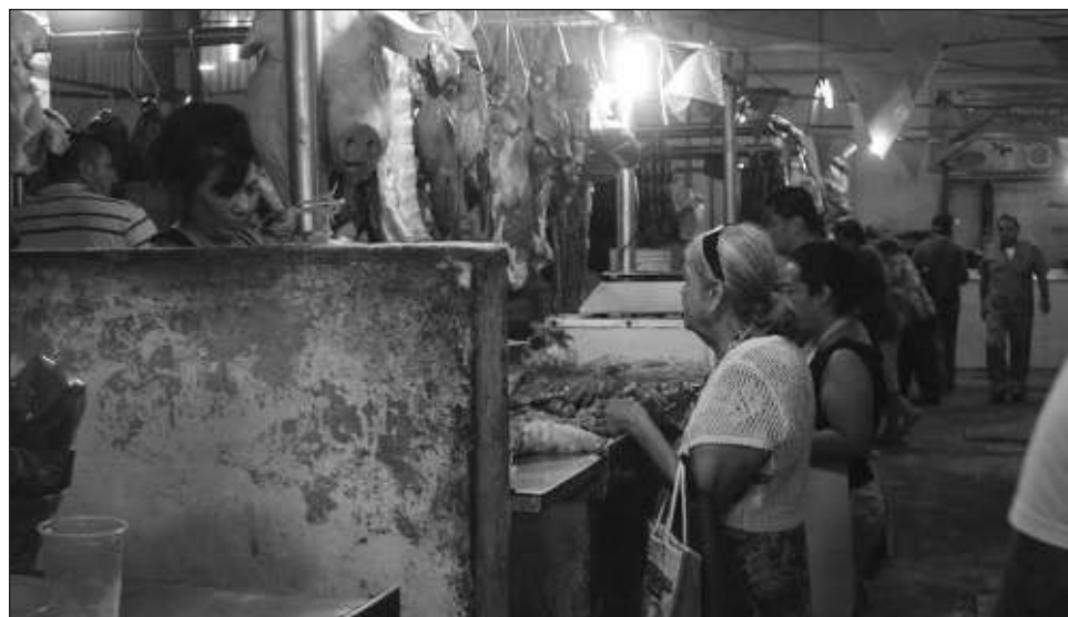
▲ Los tablajeros acusaron al administrador de sacar del rastro la carne decomisada, entre las que se encuentra una res que presentaba tuberculosis: "con lo que está exponiendo a la población.

Los manifestantes aseguraron que pese a que estos problemas han sido notifi-