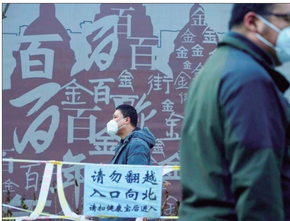
▲ A pesar de que las fuerzas de seguridad chinas actuaron para mitigar las protestas, videos publicados el martes en redes sociales y geolocalizados por AFP mostraron una multitud de alumnos reunida en la Universidad Tecnológica de Nanjing el lunes por la noche.

Numerosas universidades chinas siguen bajo regímenes de confinamiento en los que los estudiantes deben presentar una petición oficial para salir y las visitas están prohibidas.