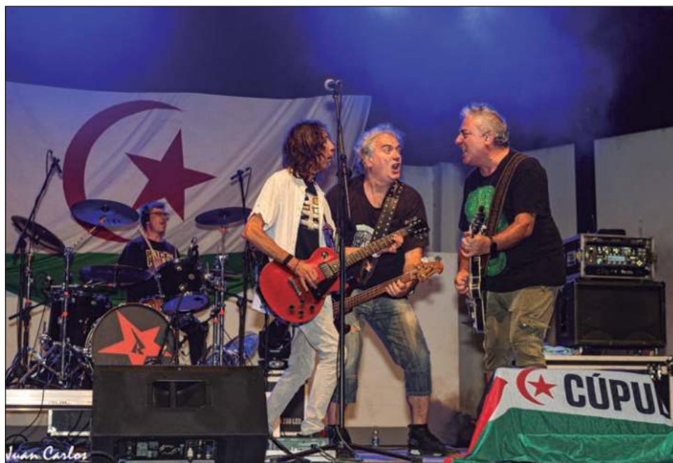
▲ Para el vocalista de Reincidentes, a pesar de los intentos que ha habido, se sigue manteniendo en la música que hacen un espíritu de rebeldía como con el que fue iniciado su estilo. “El rock como parte de la cultura popular”, concluyó.