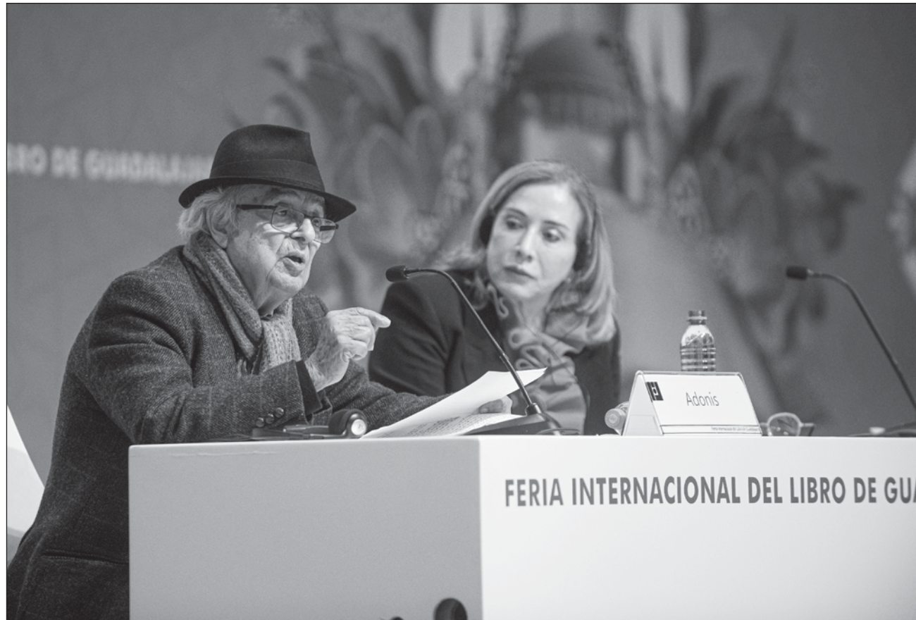
▲ El poeta de 92 años, y constante candidato al Premio Nobel de Literatura, refirió que los creadores en el mundo islámico "viven en una cárcel al aire libre, en el lugar donde se escribió el primer poema de amor".

El autor de Adoniada sostuvo: "Una mujer que ha remplazado la religión por la poesía es digna de llamarse mujer libre. Enaltecí la importancia de la escritura