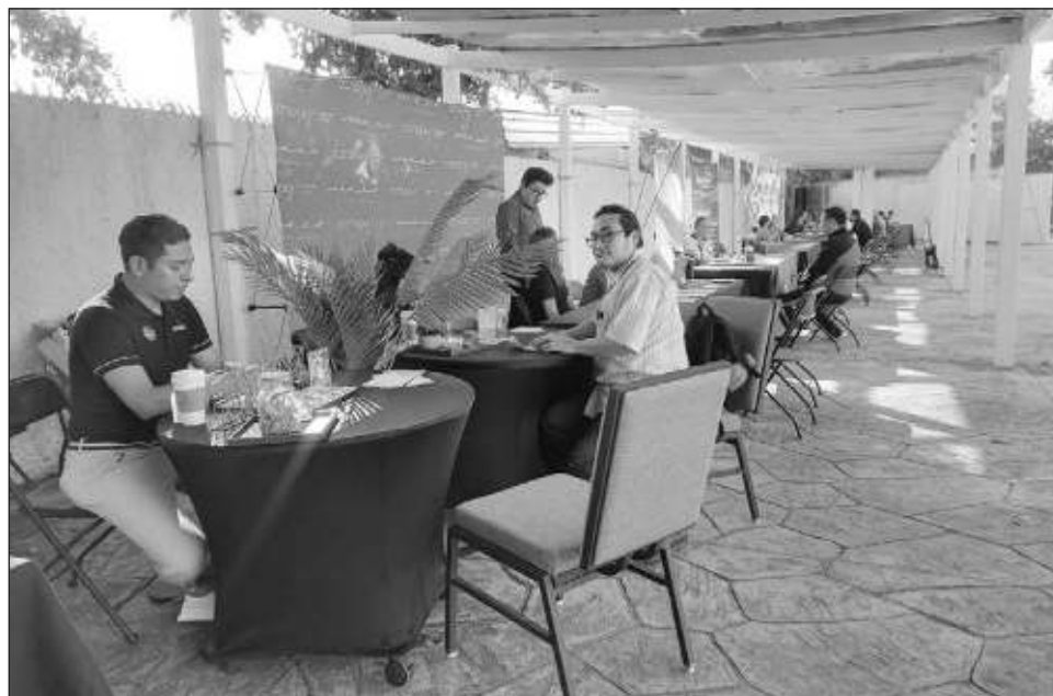
▲ Las edades buscadas fueron desde los 18 hasta los 65 años y participaron aproximadamente 20 hoteles en la quinta edición de la feria organizada por la AHCPM & IM.

"Se están ofertando 450 vacantes, más o menos se ha tenido esa tendencia en todas las ferias y habitualmente llegan más de 200 personas, muchas veces aplican para uno o dos pue-