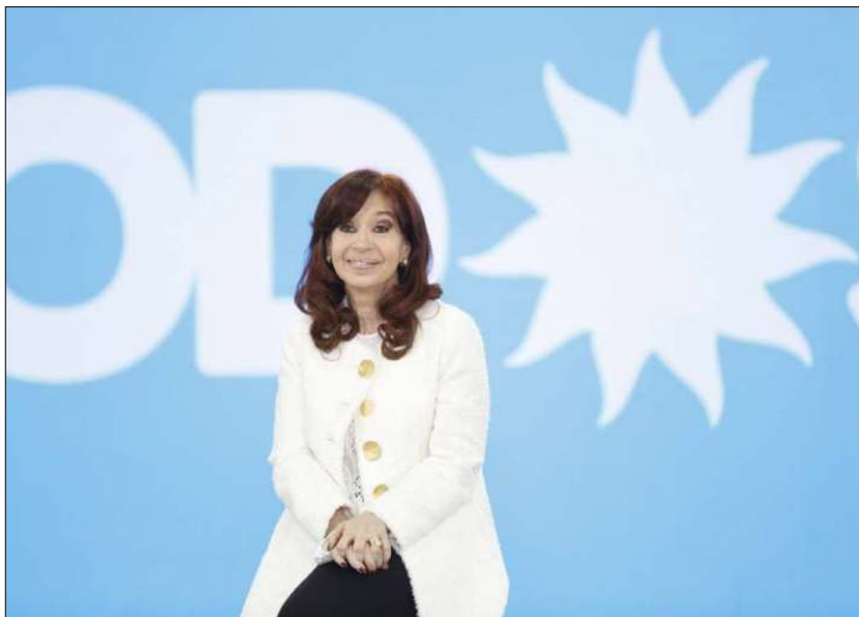
▲ La vicepresidenta fue condenada este martes a seis años de prisión en un juicio por irregularidades en la concesión de obras viales durante su presidencia.

Este es el primer juicio a Fernández y el primer pedido de condena en su contra. Otras investigaciones judiciales han sido cerradas y varias por distintos delitos