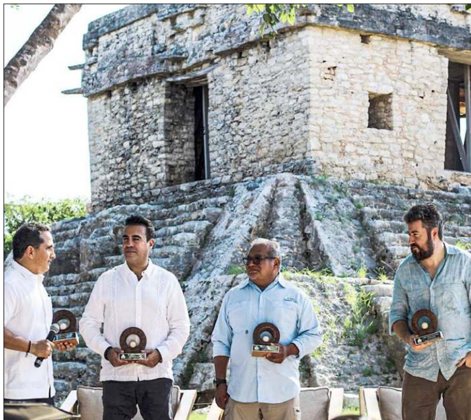
▲ La zona arqueológica Dzibilchaltún fue sede ayer del foro Turismo Sustentable, organizado por el Consejo Empresarial Turístico (CETUR), en conjunto con el INAH.

"Sin comunidad y sin territorio, no hay turismo comunitario", sensibilizó, por lo cual, son las propias comunidades las que están luchando por la defensa del territorio, resaltando que es necesario integrar incluso a ejidatarios en los modelos de negocios y evitar el modelo de extracción.