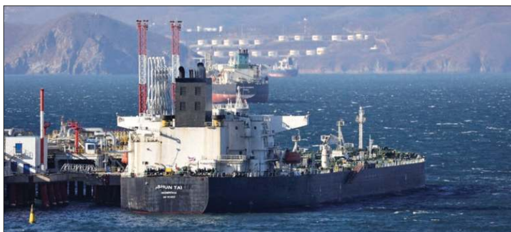
▲ Es necesario que los integrantes de la UE y de la Organización para el Tratado del Atlántico Norte reconozcan que es tiempo de cambiar de estrategia.

Es necesario, en suma, que los integrantes de la UE y de la Organización para el OTAN reconozcan que es tiempo de cambiar de estrategia y que en lugar de arrojar gasolina al incendio centren sus esfuerzos en llevar a Ucrania y a Rusia a la mesa de negociaciones, porque todo indica que tarde o temprano, y con más o menos muertes y destrucción, es allí donde habrá de ponerse fin a la guerra en curso.