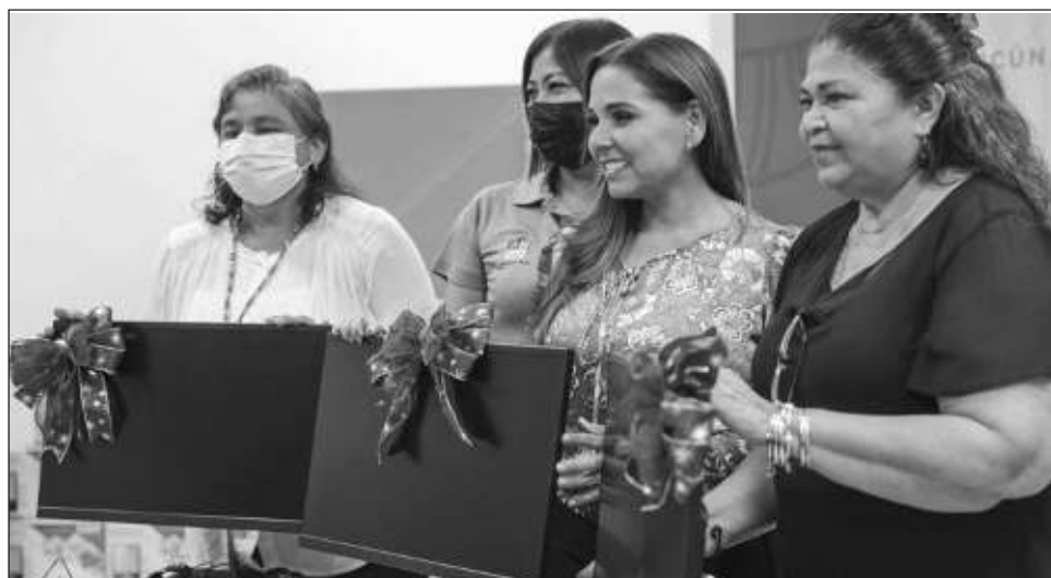
▲ Una de las principales peticiones de los directores de escuelas de Quintana Roo es contar con computadoras para realizar el trabajo administrativo. El gobierno del estado invirtió 17.5 millones de pesos para dotar a los planteles de este equipo.

Por ello, afirmó que no quitará el dedo del renglón, defenderá el presupuesto que envió al Congreso de Quintana Roo porque se necesitan