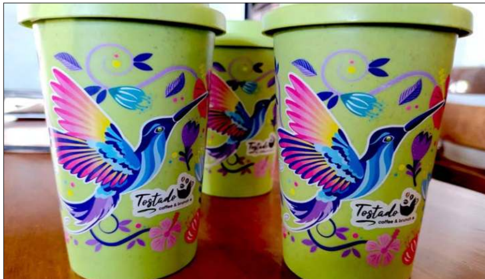
▲ Es la segunda vez que Proyecto Santa María y Tostado Coffee and Brunch trabajan juntos en pro de las aves yucatecas; esa ocasión lograron reunir cerca de 10 mil pesos.

Fernando Guevara reiteró que se trata de la segunda colaboración que Tostado Coffee and Brunch hace con Proyecto Santa María. Durante la primera recaudaron cerca de 10 mil