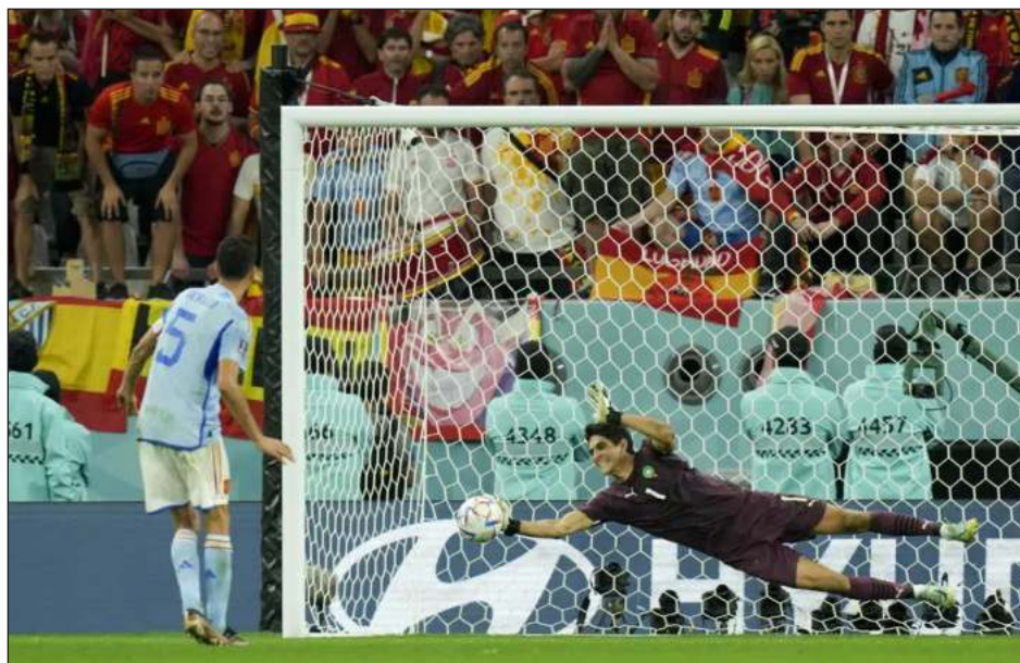
▲ El arquero marroquí Yassine Bounou tapa el penal ejecutado por Sergio Busquets.

Marruecos quedó como la única selección no europea o sudamericana entre