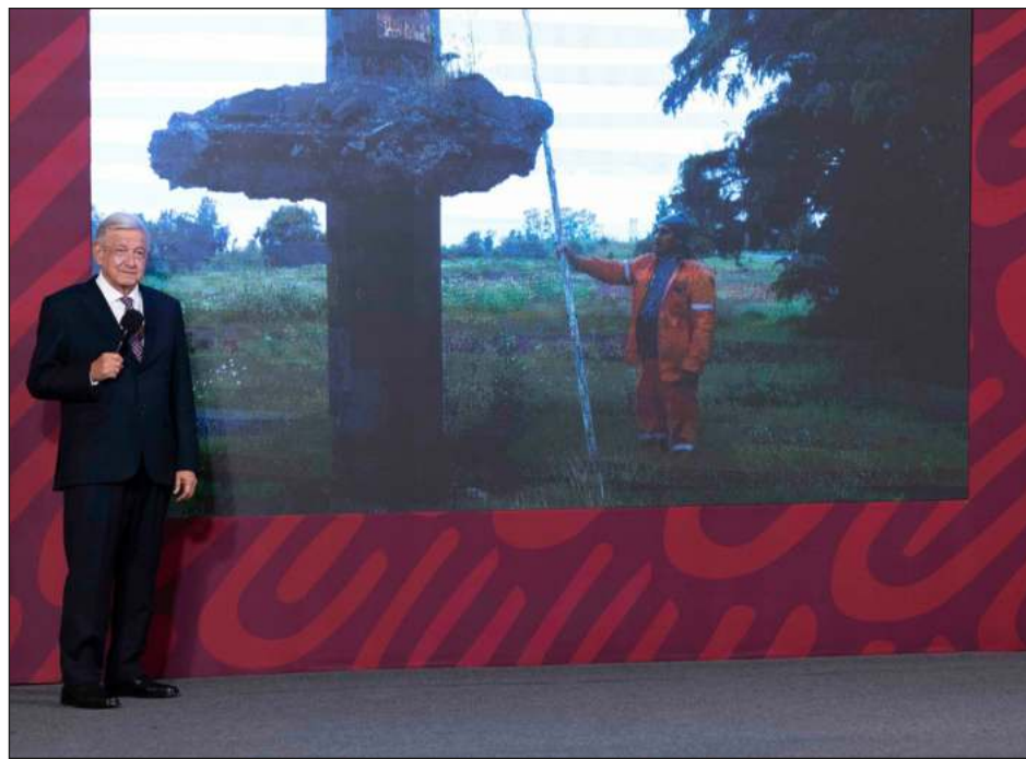
▲ En su conferencia diaria, el presidente López Obrador compartió imágenes del hundimiento en la zona de Texcoco, que le proporcionó el titular de la STIC.

Recordó que "cuando se licitó la obra, las grandes empresas constructoras querían que se aceptara su terminación hasta 2025, y dijimos: 'no, la tenemos que terminar a más tardar en el 2023', y es lo que está sucediendo".