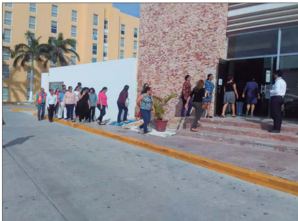
▲ Los opositores aseguraron que ellos “tienen otros datos”, y afirmaron que Carmen no es un pueblo fantasma como lo señaló la gobernadora Layda Sansores.

Obrador lamentó la demora para llevar las oficinas de Pemex a Carmen, y reiteró que cumpliría con dicho compromiso, sin embargo, ahora los diputados priistas exigen