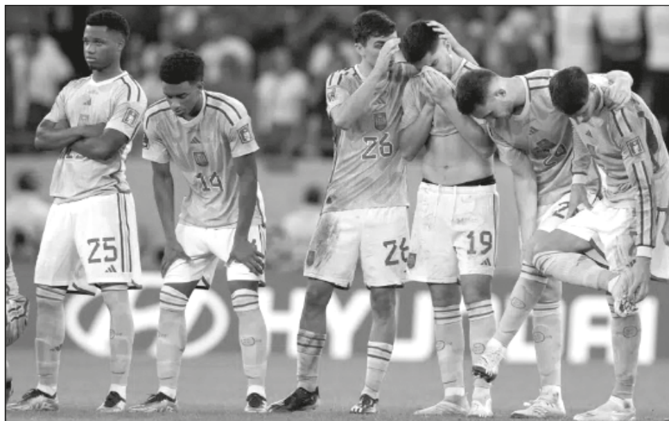
▲ Jugadores de España tras caer por penales ante Marruecos, en Rayán.

"Estoy más que satisfecho con lo que ha hecho mi equipo, que ha ejecutado a la perfección mi idea de fútbol", expresó el seleccionador tras la eliminación. "Estoy muy contento con el perfil de jugadores que tengo. Son los que yo he elegido y voy con ellos a muerte".