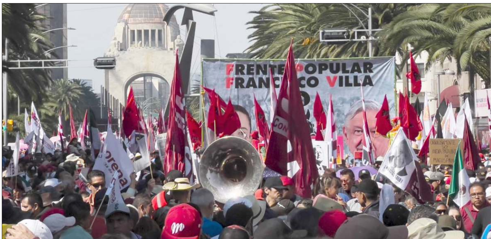
▲ "La izquierda no se encuentra en el mundo de los partidos políticos: la izquierda de veras, la tolerante y libertaria, diversa y progresista no cabe en los partidos".