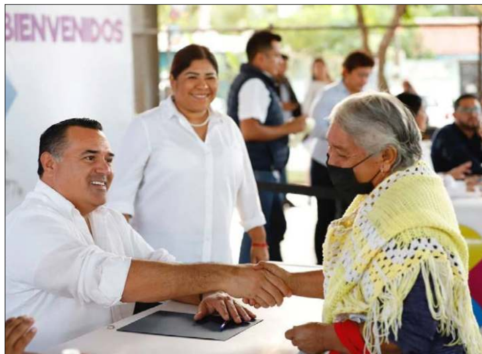
▲ El objetivo de la Semana de la Solidaridad, que concluirá el 11 de diciembre, es sumar voluntades para apoyar a los grupos más vulnerables.

Posteriormente, el viernes 9 y sábado 10 de diciembre se realizará la Jornada de Voluntariado "Manos a la Obra".