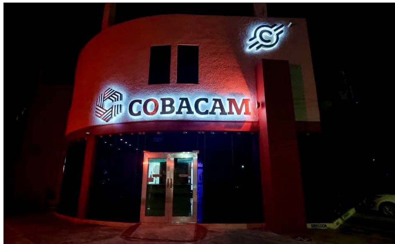
▲ La medida cautelar para los dos vinculados es una multa por mil pesos, firmas mensuales en lo que dura el proceso y tienen prohibido salir de la península de Yucatán y acercarse a trabajadores del Cobacam y/o testigos.

A la señalada la acusaron desde el Sindicato Único de Trabajadores del Cobacam por asignar plazas y horas a familiares y amigos de ella, así como a algunos por orden del gobierno del estado, en ese entonces