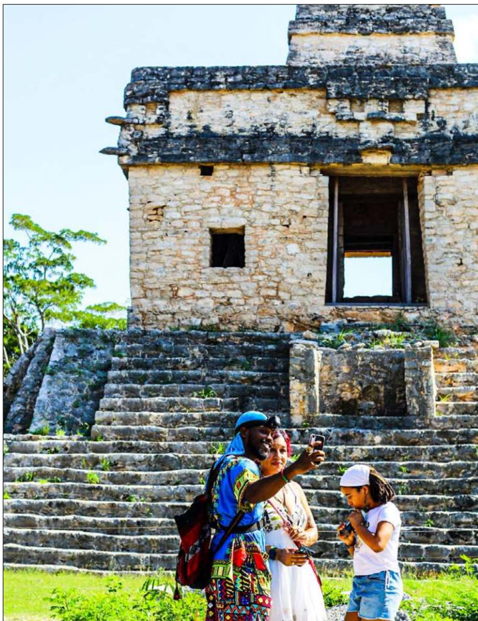
▲ U tuukulile' ka chíimpol'ta'ak u ba'alumbáaj kaaj ti'al u je'ets'el túumben ba'al ti' bix u k'a'amal máak xiinximbal. Te'ela', jump'éel u yoochel Dzibilcaltún.

Tu ya'alaj Tren Maya'e' yaan u yáantaj ti'al u k'uchul uláak' ajxiinximbalo'ob, le beetike' k'a'abéet u je'ets'el beyka'aj máak ku béeytal u k'uchul ti' lalaj jump'éel kúuchil, tu tsolaj. "Yaan