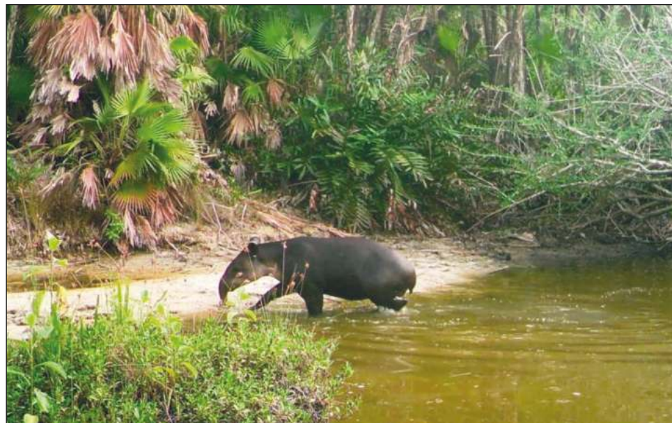
▲ El proyecto, reconocido en días pasados en el foro virtual Hacia la COP-15, fue llevado a cabo en la Reserva Estatal Santuario del Manatí, ubicada en la Bahía de Chetumal.