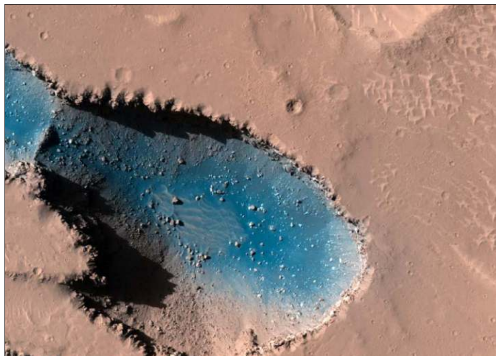
▲ La investigación de la Universidad de Arizona indica que Marte posee una zona de alrededor de 4 mil kilómetros de diámetro con actividad volcánica.

El resultado indica que el área estudiada alberga una zona con actividad volcánica que tiene un diámetro de unos 4 mil kilómetros.