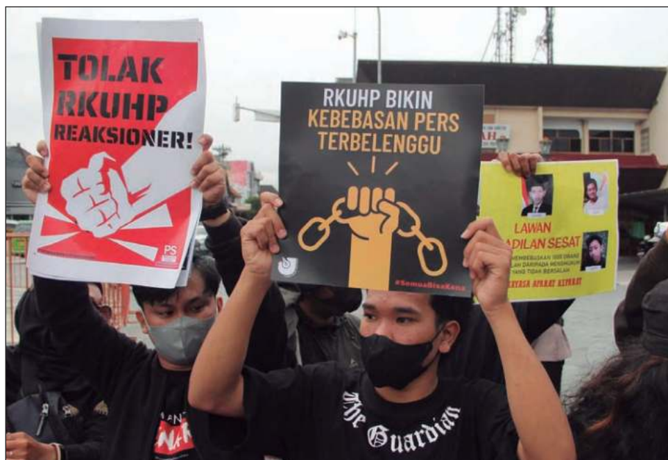
▲ El Congreso de Indonesia también restauró como crimen insultar a un presidente o vicepresidente en funciones, aunque esto debe ser denunciado por el mandatario. En la imagen, manifestación contra la nueva ley en Yogyakarta, realizada este martes.

Una copia del nuevo código penal a la que tuvo acceso The Associated Press incluye varios artículos revisados que convierten el sexo fuera del matrimonio en un delito punible con un