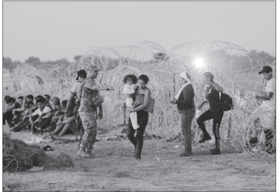
▲ El jefe diplomático estadounidense aseguró que la ayuda irá a parar a "las personas refugiadas, migrantes y otras poblaciones vulnerables", incluidos los desplazados en América Latina y el Caribe.

Más de 310 millones de dólares se desembolsarán a través de la Oficina de Población, Refugiados y Migración del Departamento de Estado y otros 174 millones a través de la Agencia de los Estados