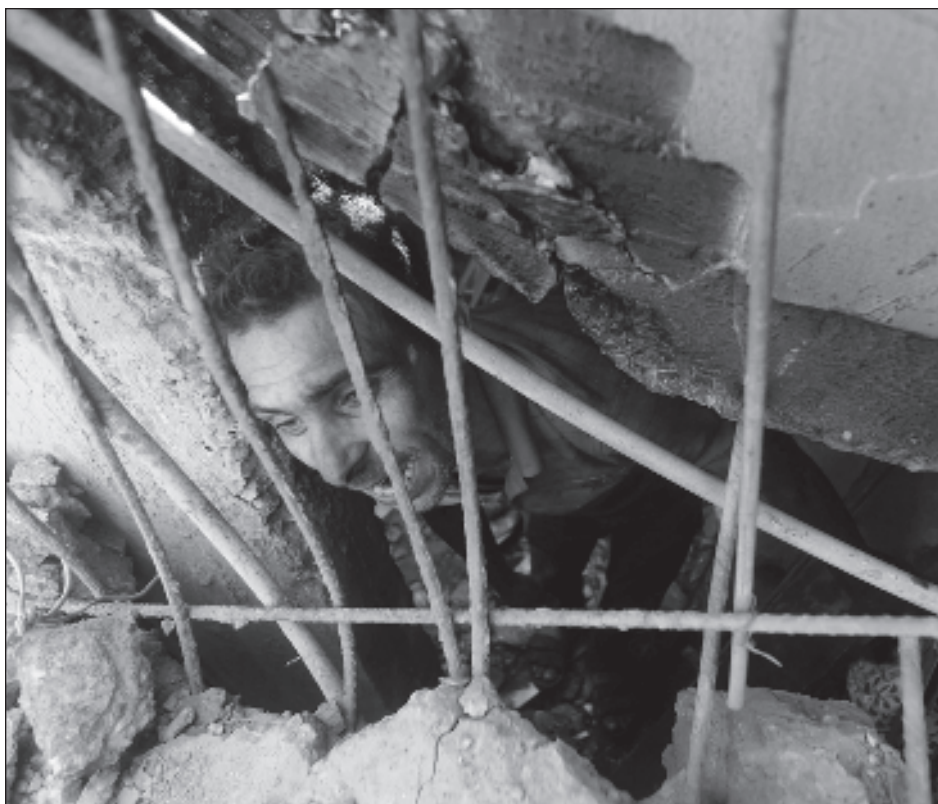
▲ El ejército israelí "continúa bombardeando y golpeando a los civiles, a hospitales, campos de refugiados, mezquitas, iglesias y edificios de la ONU", Hamas usa inocentes "como escudos humanos".

La guerra ha convertido barrios enteros de la Franja de Gaza en campos de ruinas y ha provocado el desplazamiento de 1,5 millones de personas, según la ONU.