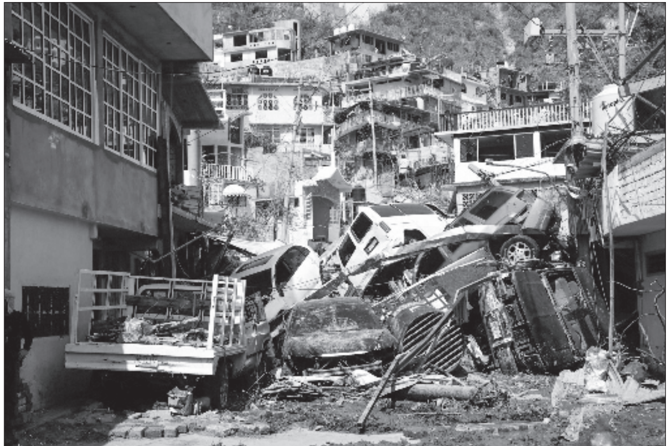
▲ El puerto de Acapulco no fue la única localidad afectada por el meteoro categoría cinco, sino también otras como Técpan de Galeana, Atoyac de Álvarez y Coyuca de Benítez, donde no viven del turismo, sino de la agricultura.

Por ejemplo, destacan datos recopilados por el Grupo Consultor de Mercados Agrícolas (GCMA), con un rendimiento de 194 mil toneladas anuales por un valor de mil 715 millones de pesos, Guerrero es el prin-