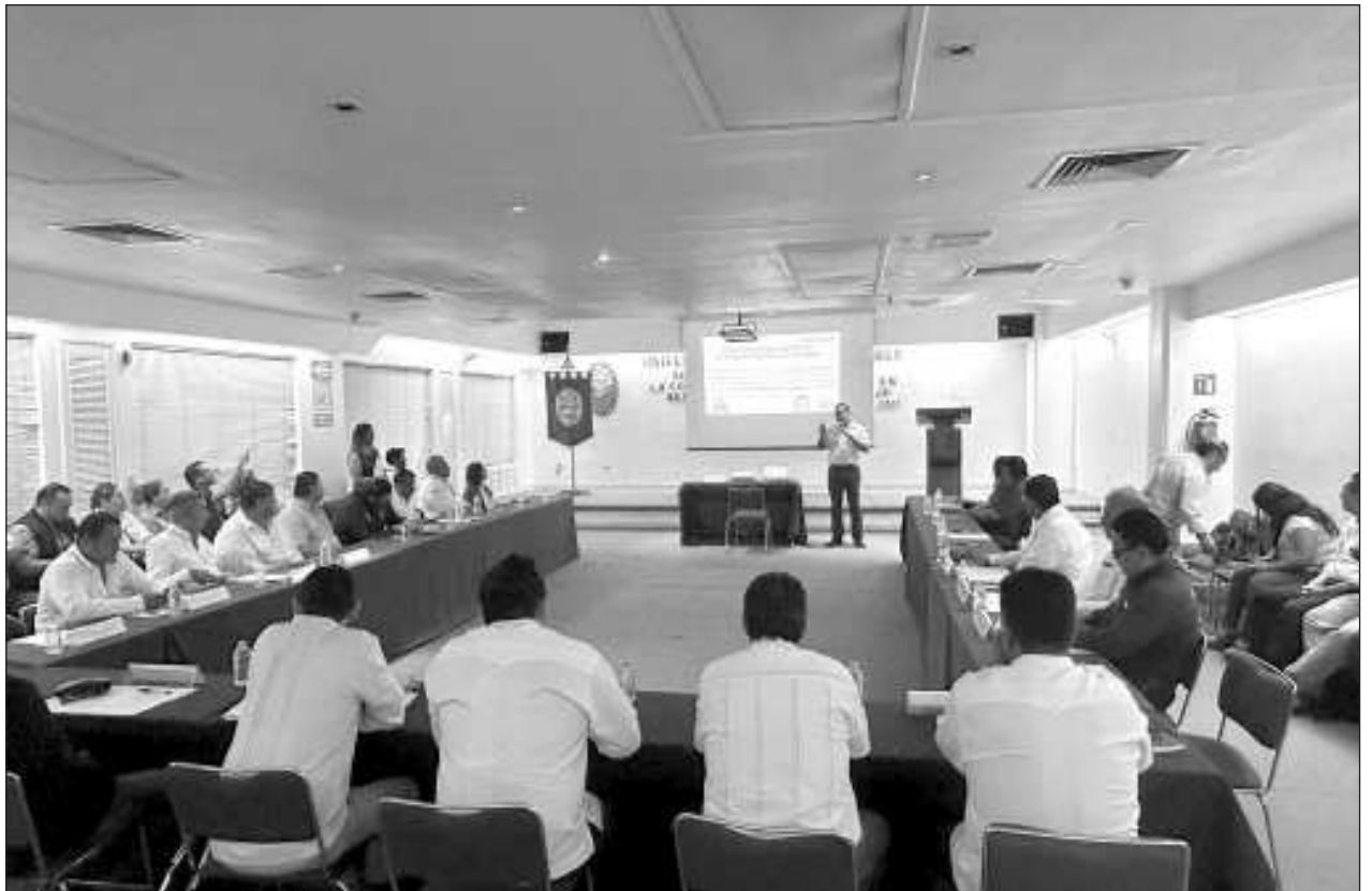
▲ El IMSS puntualizó que en el país, se tiene un registro de 9 mil 952 compañías que se han adherido al programa ELSSA, lo que permite beneficiar a 3 millones 278 mil 269 trabajadores.

Anunció también que la Mega Caravana Juguetón se realizará el próximo 26 de noviembre en el Centro de Atención Municipal (CAM) de 18 a 20:30 horas. Informó de igual forma los ciudadanos podrán ir donando desde el día 27 de noviembre en cualquiera de los cuatro centros de acopio, en las oficinas del DIF Municipal en calle 10 #331 entre 59 y 61 del Centro Histórico, en el Palacio Municipal, las oficinas de SMAPAC, y el CAM.