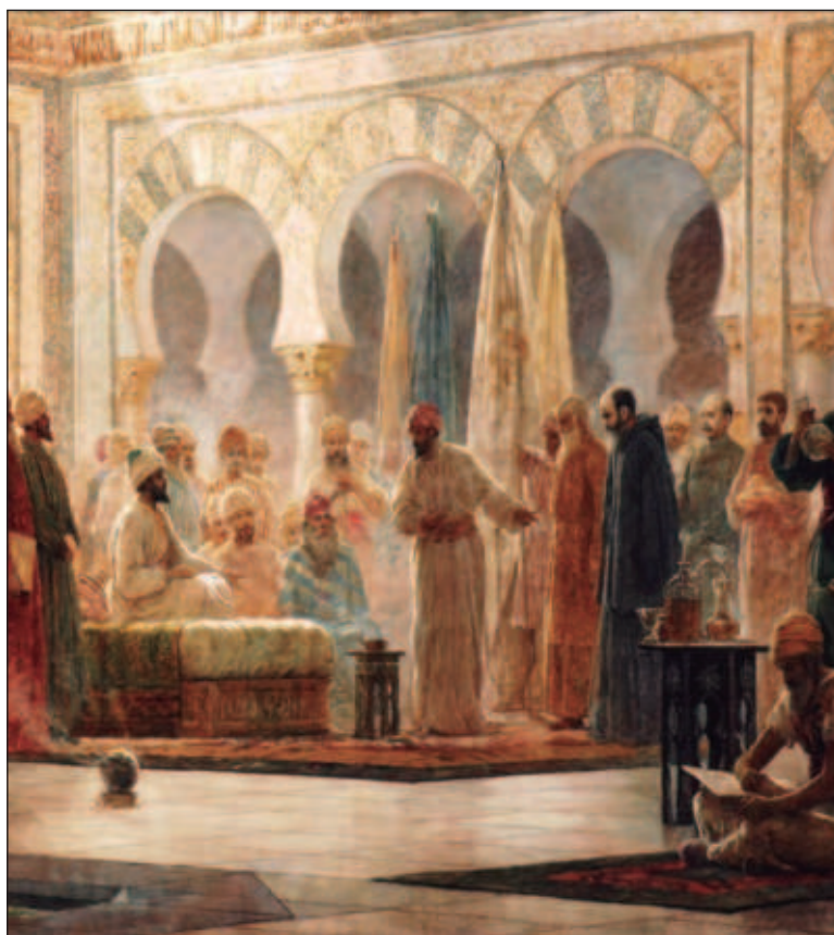
▲ “This corner of Europe was governed by Muslim caliphates from 711 until 1236 – a time during which Jews, Muslims and Christians lived in harmony under Arab rule”.

JEWISH SCHOLARS, SUCH as Moses Maimonides, made significant contributions to philosophy, medicine, and mathematics during this period.