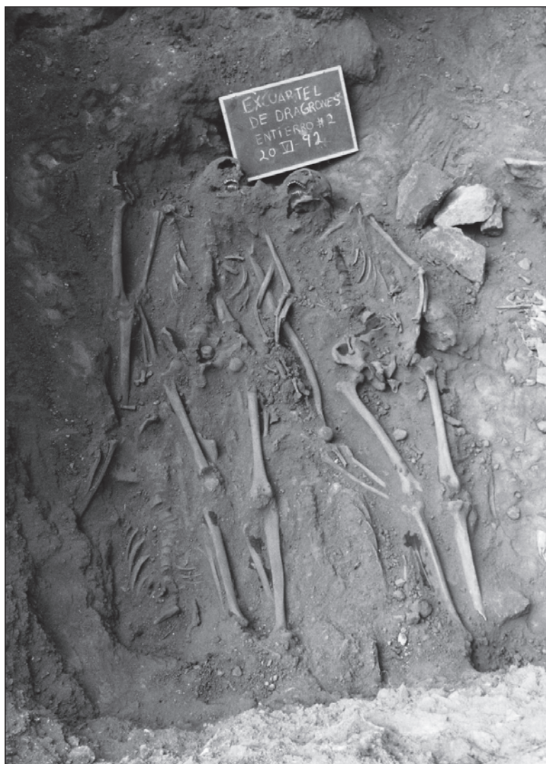
▲ "Durante la terrible epidemia de cólera de 1853, en este edificio se encontraban cientos de hombres acuartelados".

LA PRIMERA PARTE de la investigación consistió en el análisis del contexto arqueológico. Las