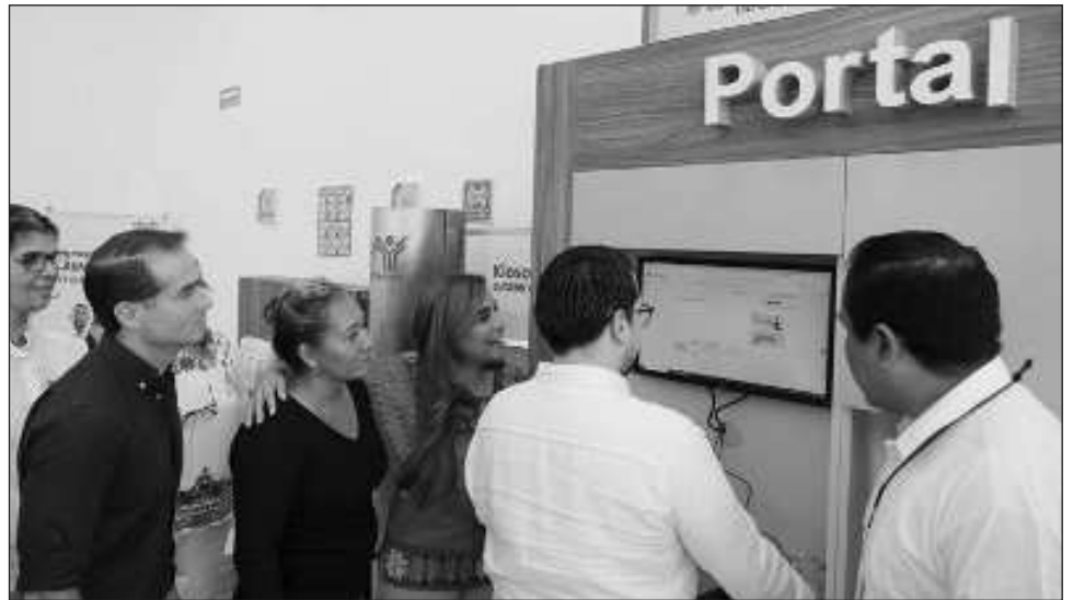
▲ El objetivo del nuevo Centro de Servicio es que los tulumenses puedan hacer sus trámites sin moverse de un lugar a otro como Playa del Carmen, Chetumal o Cancún.

El objetivo, externó, es que la gente pueda acercarse a hacer sus trámites, checar que su patrón pague lo que se tenga que pagar de acuerdo al salario