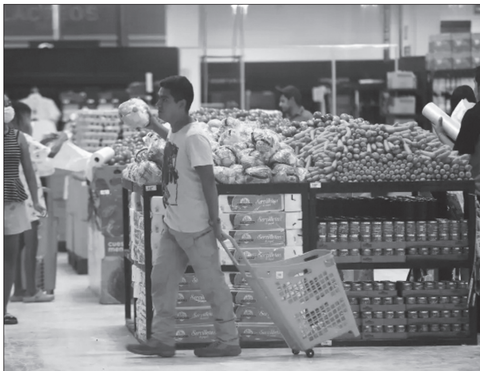
▲ En total, abrieron sus puertas las sucursales Acapulco, Centro, Cayaco y Diamante de Chedraui. Los principales productos que adquiere la población son botellas de agua, jugos, jabones líquidos, y algunos comestibles.

“Necesitamos productos de primera necesidad, como ropa, agua, atún, alimentos para toda la familia y llevábamos más de una semana sin poder comprarlos y nos llegó el rumor de que hoy abrirían la tienda, por lo que queríamos llegar temprano