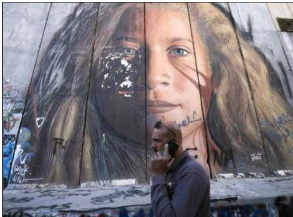
▲ Autoridades israelíes le atribuyen la publicación de un texto violento en redes sociales.

La Comisión de Asuntos para los Detenidos y Ex detenidos estima que unos 2 mil 150 palestinos han sido detenidos desde el 7 de octubre en Cisjordania a medida que avanzan las campañas de arresto por parte de las fuerzas israelíes.