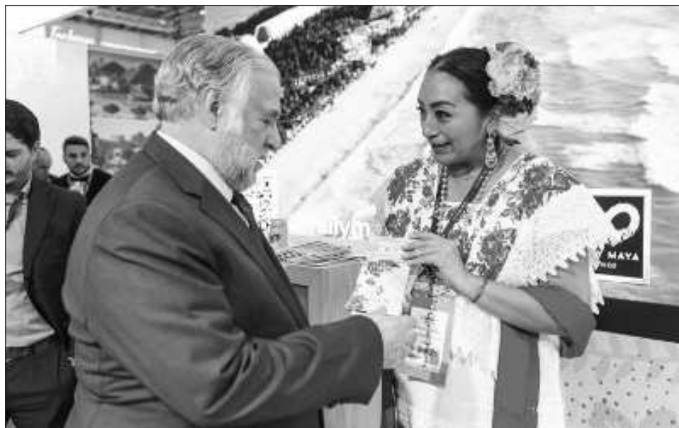
▲ El ayuntamiento de Tulum consolidó la invitación de importantes agencias para conocer el origen de Tulum, su historia, cultura y belleza natural.

Durante el evento se agradeció la hospitalidad y sinergia colaborativa del mi-