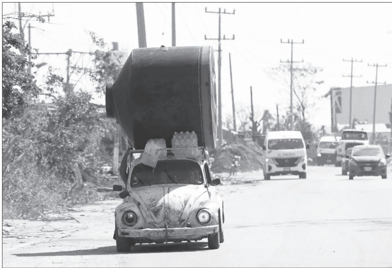
▲ De acuerdo con un documento de la Asociación de Bancos de México, los apoyos podrían representar un alivio financiero de hasta mil 716 millones de pesos para los acreditados que se vieron afectados por el paso del huracán, sobre todo en Acapulco.

El organismo cúpula también informó que ya tiene listo un programa especial para reactivar el comercio en el puerto de Acapulco, que va dirigido a otorgar fi-