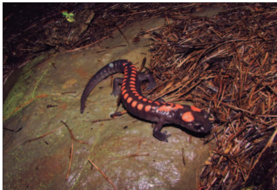
▲ La principal amenaza es el cambio de uso de suelo, pues la mayor parte de las especies son microendémicas; es decir, que su área de distribución total es muy pequeña y si se transforma el bosque a pastizales, básicamente desaparece el hábitat de la especie entera.

“Al analizar en conjunto a los anfibios de nuestro país, la principal amenaza es el cambio de uso de suelo, pues la mayor parte de las especies son microendémicas; es decir, que su área de distribución total es muy pequeña y si se transforma el bosque a pastizales, por ejemplo, básicamente desaparece el hábitat de la especie entera”, acotó. La experta del departamento de Zoología recordó que su labor en este trabajo inició en 1990 cuando se sumó al equipo internacional que revisa en el orbe las poblaciones de anfibios y forma parte del grupo de especialistas que estudian la presencia de un hongo parásito que afecta la piel de estos vertebrados.