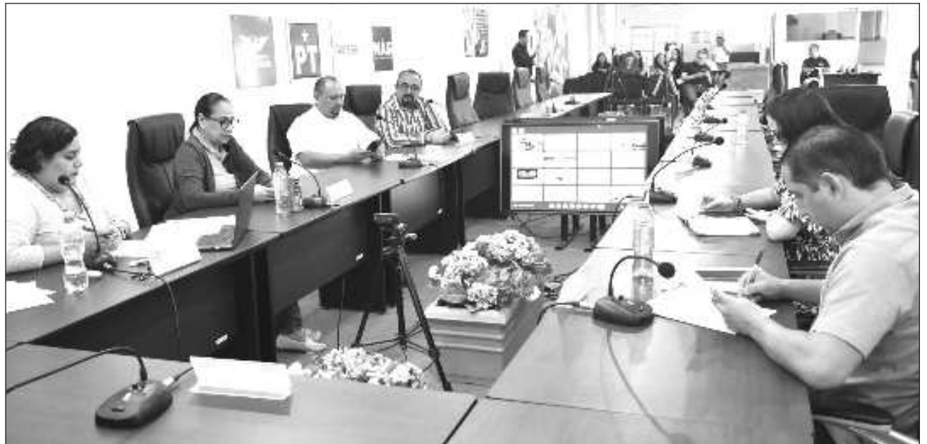
▲ Durante noviembre el Consejo General del Instituto Electoral de Quintana Roo aprobará los lineamientos, la convocatoria, así como la publicación para la candidatura independiente en las modalidades de diputaciones y miembros de los ayuntamientos.

Siguiendo con las fechas del calendario electoral, el 18 de enero es la fecha límite para notificar la intención de participar por vía de la reelección; el 26 de enero concluye el periodo para