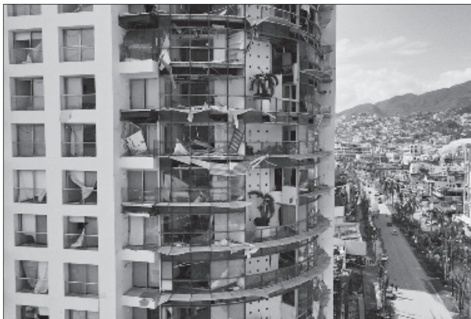
▲ El Presidente insiste que se cuenta con suficiente presupuesto para atender a los damnificados por el huracán Otis, así como la reconstrucción de las zonas afectadas.

El domingo, la legisladora Marcela Guerra Castillo insistió en su propuesta de crear un fondo para la reconstrucción de Acapulco, que se conformaría con los excedentes petroleros. De acuerdo a sus cálculos, con esto se podrían obtener alrededor de 80 mil millones de pesos para ayudar a los damnificados por el huracán Otis, y la reconstrucción de las zonas afectadas.