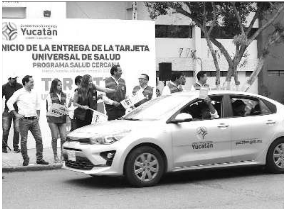
▲ El gobernador Mauricio Vila Dosal encabezó ayer el despliegue de las cuadrillas a cargo de entregar la Tarjeta Universal de la Salud.