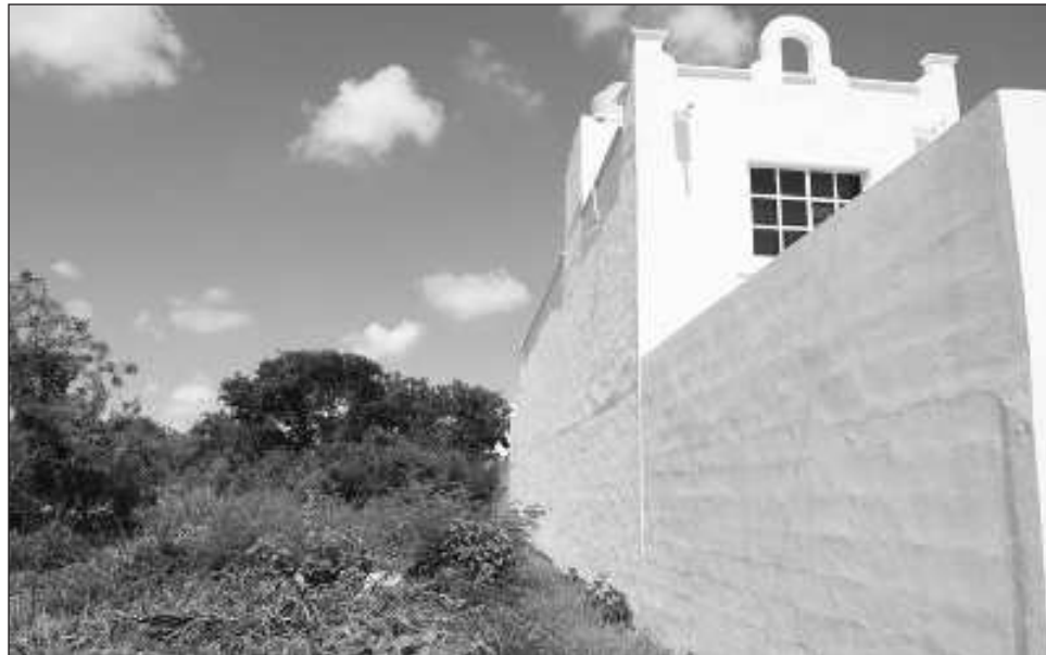
▲ Desde la AMPI impulsarán una campaña de mercadotecnia para que las y los compradores identifiquen con quién es más seguro asesorarse al adquirir un terreno o inmueble.

Recalcó que es importante que los asesores estén bien preparados para que brinden mejor información