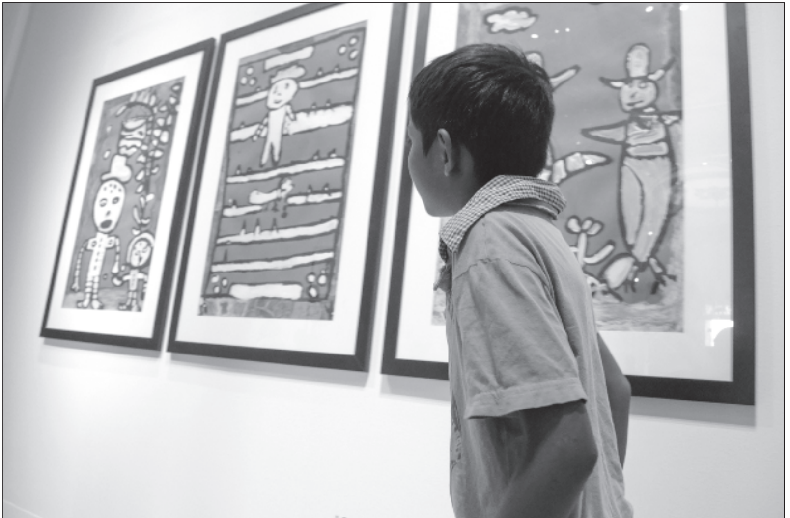
▲ "De acuerdo con los mayas, los aluxes tienen diferentes funciones, pero la principal es resguardar un área, sea de selva o de cultivo como la milpa".