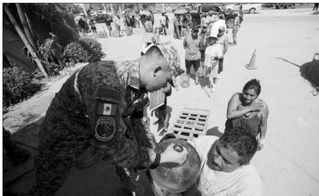
▲ Saber que Guerrero carece de un plan de emergencia da una idea muy concreta de qué tan importante ha sido la previsión para los gobiernos pasados y el actual.

Una ciudadanía que padece, además del paso de un huracán devastador, la falta de previsión y el distanciamiento de las autoridades por las que votó, termina hallando motivos para cuestionar la legitimidad de éstas. Como dejó ver el terremoto de 1985 en la Ciudad de México, la falta de respuestas lleva a movimientos sociales que pueden terminar por romper la inercia de la vida política nacional.