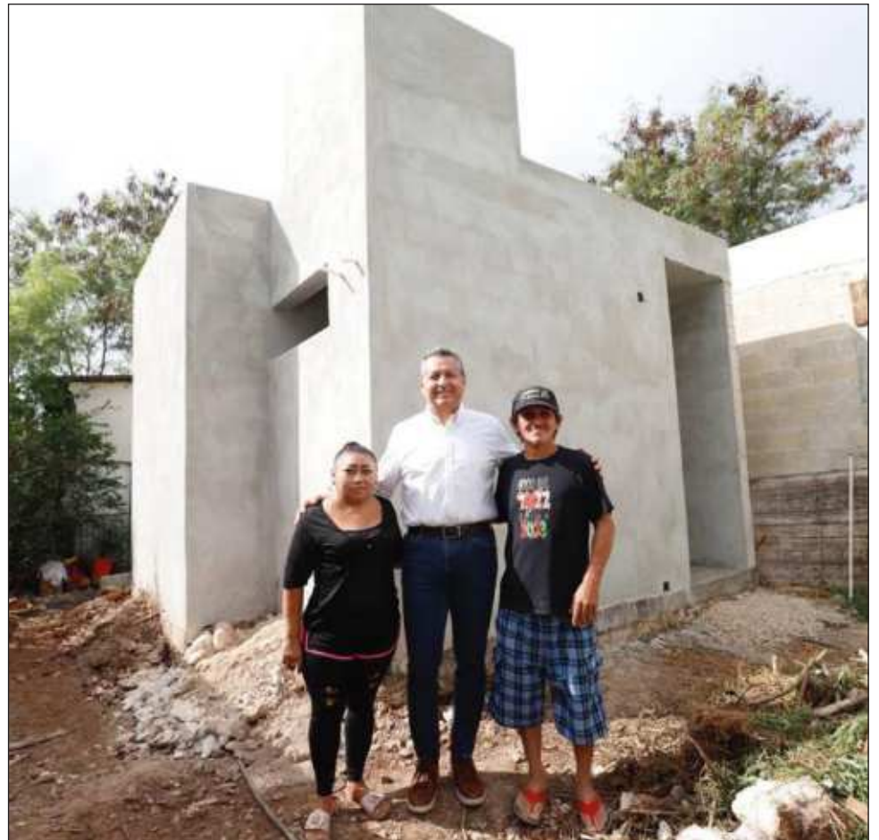
▲ Al visitar predios de los beneficiarios, Alejandro Ruz comentó que tan sólo en este último trimestre del 2023, la Comuna realizará 174 acciones de vivienda en zonas vulnerables.

Previo a la supervisión, el presidente municipal asistió a la ceremonia de izamiento de bandera con motivo del inicio de la Revolución Mexicana, que se realizó en la Plaza de la Independencia (Plaza Grande) de Mérida.