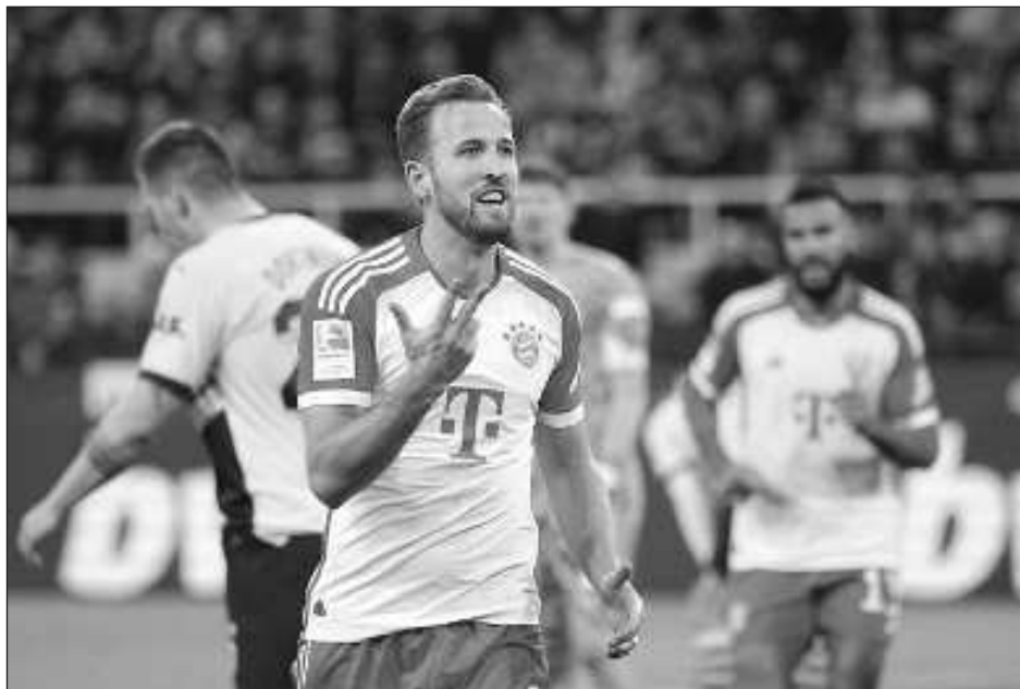
▲ El Bayern Múnich está imparabile en la Liga de Campeones. En la foto, el ariete Harry Kane.