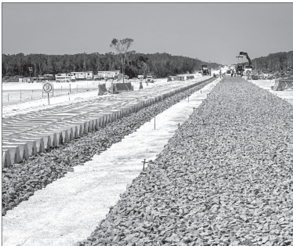
▲ Se destaca en la publicación oficial que la declaratoria se emite previo convenio de la Federación con los propietarios de los predios involucrados.

Se destaca que la declaratoria se emite previo convenio de la Federación con los propietarios de los predios involucrados.