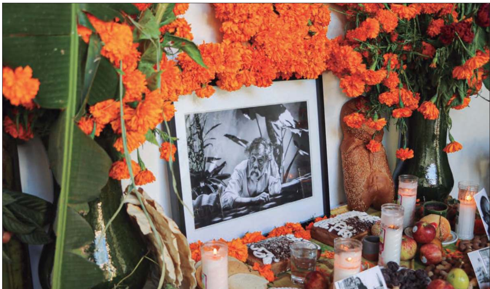
▲ "Toledo solía comenzar sus días en el taller de grabado desde las siete u ocho de la mañana, a las nueve y media ya estaba revisando proyectos. Muchas veces, mientras atendía llamadas, tenía una placa metálica a la que seguía rayando con un punzón".