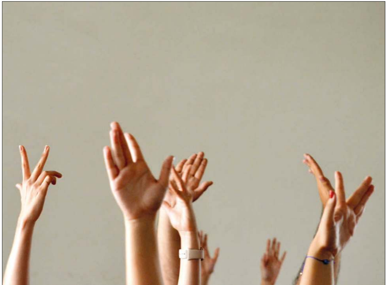
▲ El síndrome de túnel carpiano se caracteriza por ocasionar inflamación en los tejidos que rodean a los tendones flexores de los dedos de la mano, produciendo compresión y daño al nervio mediano y dolor en la zona.