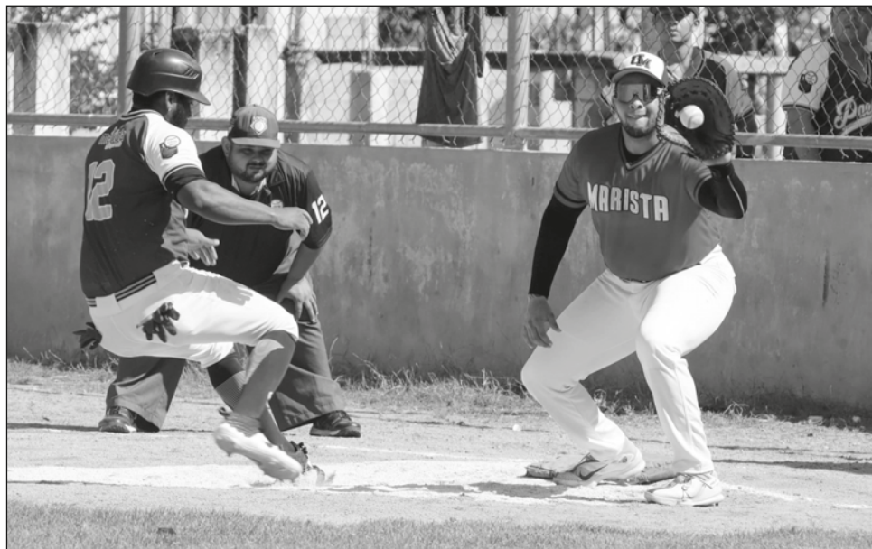
▲ Zorros y Venados chocaron ayer en Chichí Suárez, casa de la Universidad Marista.