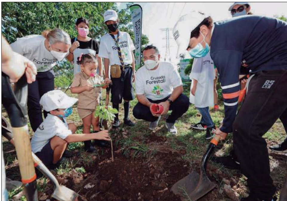
▲ La actualización del Plan Municipal de Infraestructura Verde propone, en primer lugar, que las infraestructuras o soluciones técnicas basadas en la naturaleza se puedan llevar a cabo en dos grandes dimensiones: ambiental y humana.

Asimismo, agregó que, para implementarlo de manera ordenada, se seguirán puntualmente cuatro grandes ejes estratégicos que son: estudios e indicadores, programas y proyectos, educación y cultura ambiental y política pública.