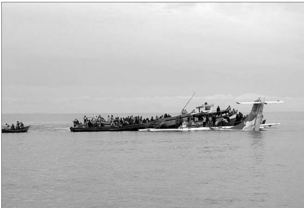
▲ Videos divulgados en los medios locales mostraban al avión parcialmente sumergido, mientras los rescatistas en el agua intentan salvar a los supervivientes. También se veía cómo intentan, con cables y grúas, levantar el avión y sacarlo fuera del agua.

A inicios de septiembre, Henry anunció que su administración ya no podía subsidiar la gasolina, lo que llevó a pronunciados aumentos de precios, que a su vez causaron enormes protestas.