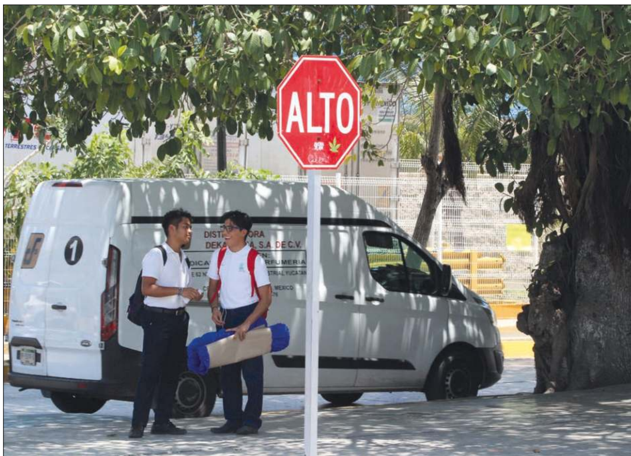
▲ El Cobacam ha logrado una matrícula de 10 mil 300 alumnos luego de la pandemia.

Para el próximo año se pretende implementar dentro del plan de estudios el servicio social, con el cual el Cobacam no cuenta actualmente, para que de esta forma los jóvenes puedan integrarse al mundo laboral y poder abonar a la economía de sus familias y del estado, concluyó.