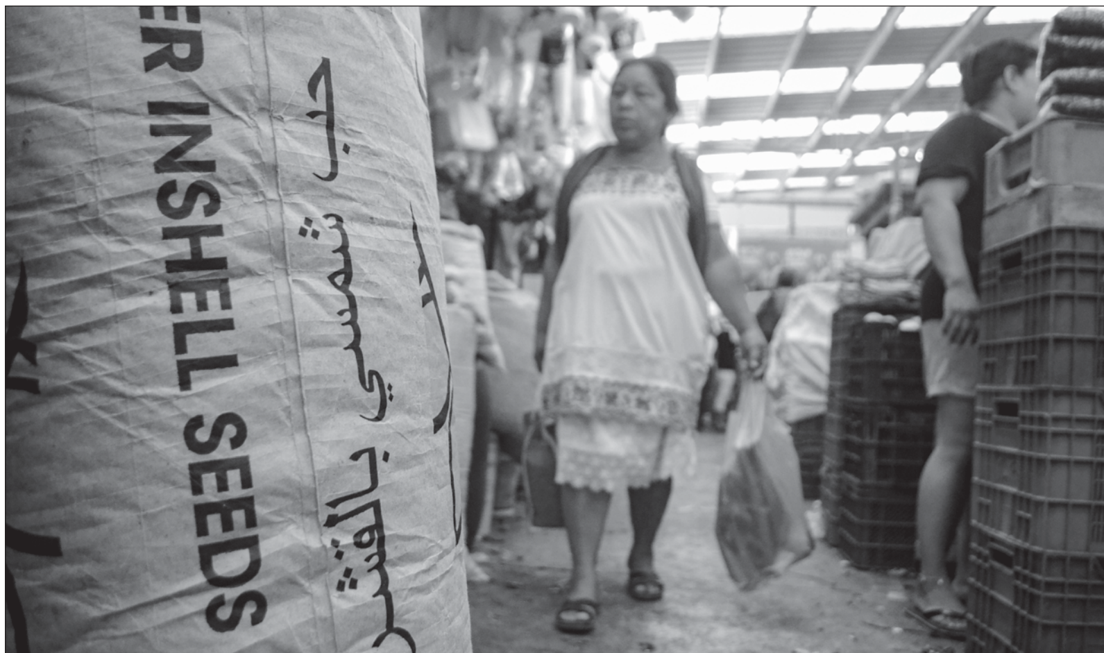
▲ “Los verdaderos influencers están a nuestro alrededor, en nuestra cotidianidad; son los optimistas que zurcen la esperanza”.