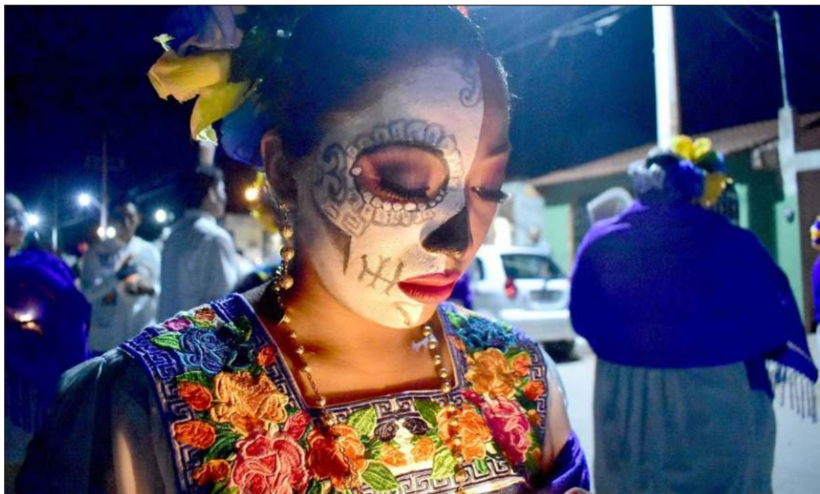
▲ “El hecho de conocer al otro durante una festividad otorga la oportunidad de generar tolerancia e intercambio; uno acude a las fiestas con la idea de divertirse y con apertura de espíritu”.

La realidad es que lo más parecido a esa escena personificada en 2015 por James Bond es lo que se conoce como el Paseo de las Ánimas en Mérida. Constituido de manera “oficial” por la alcaldía de Mérida en 2008, responde a una tradición de larga data en la cual vecinos de varios barrios de la ciudad exponen sus ofrendas a las afueras de su vivienda para que sus “ánimas” o “pixanes” puedan reconocer lo que en vida fue su hogar. Desde ese 2008 se instauró el recorrido que va desde la Ermita hasta el Cementerio General. Con el paso de los años el paseo encontró otros puntos de enlace y/o arranque. Por ejemplo, en la prepandemia hubo recorridos que arrancaron desde la Plaza Grande.