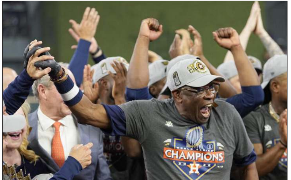
▲ Los Astros de Dusty Baker se llevaron emocionante final, que incluyó un juego sin hit.

"Solamente quiero vivir. Vivir y todo lo demás