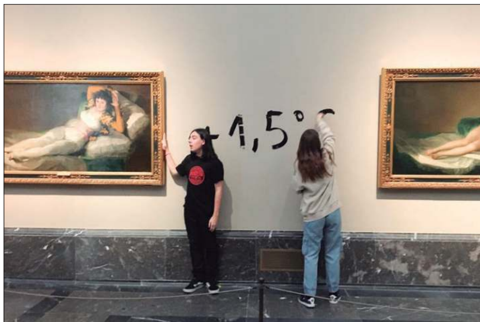
▲ Dos mujeres escribieron entre los cuadros: +1,5°C, en alusión al calentamiento global como consecuencia de las emisiones del efecto invernadero.

La Consejera de Cultura de la Comunidad de Madrid, la conservadora Marta Rivera, afirmó que los manifestantes no son activistas ecológicos. “Son dos personas sin respeto por el patrimonio cultural. Pido al Ministerio de Cultura que cuide especialmente la vigilancia en las salas de los grandes museos nacionales para proteger