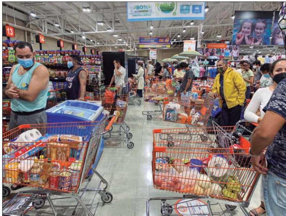
▲ Las empresas están esperanzadas de que el incremento de la inflación no sobrepase los 20 puntos porcentuales, que podría ser todavía una cifra manejable.

Cárnicos, lácteos, bebidas, percederos y prácticamente todas las botanas extranjeras, así como cerveza de importación, serían las que mayor impacto podrían tener en breve, con los in-