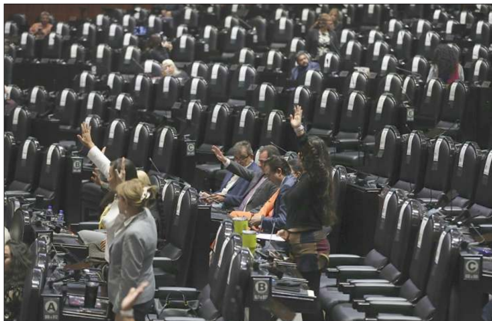
▲ Hoy lunes iniciará la discusión del proyecto de dictamen del Presupuesto de Egresos Federal, que ya fue circularizado a los diputados.

En el proyecto de dictamen que ya fue circularizado a los legisladores se plantea una reducción al INE de 4 mil 475 millones 501 mil 178 pesos en comparación