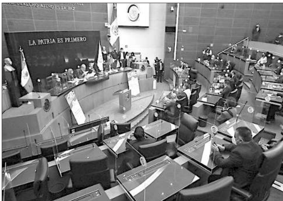
▲ El incremento histórico de 30 por ciento en el costo financiero de la deuda, respecto a lo presupuestado para ese fin en 2022, se debe a la escalada en las tasas de interés que se han registrado tanto en México como en las principales economías.