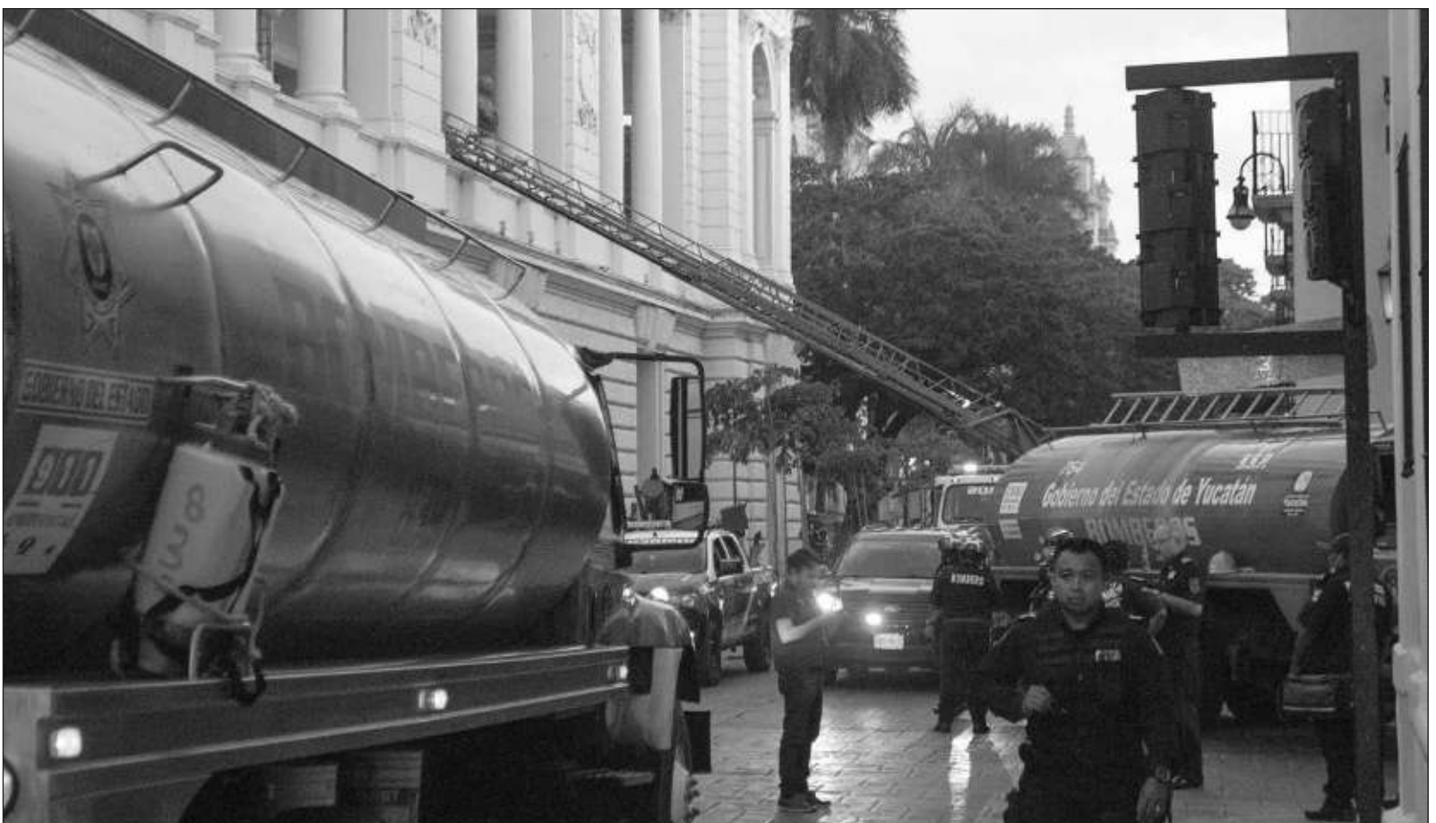
▲ "El Peón Contreras hace mucho que opera en el límite de lo que puede ser, este es el cruce de caminos ideal para una inversión financiera".