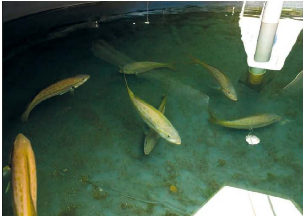
▲ Los retos del proyecto vendrán en la evaluación de la maduración de machos, así como mantener el lote y conocer la respuesta de la especie al cautiverio prolongado.

Como parte de este proyecto, surgió el Comité Consultivo del Mero, mismo que creó un plan de recuperación de la pesquería, creando una "veda natural",