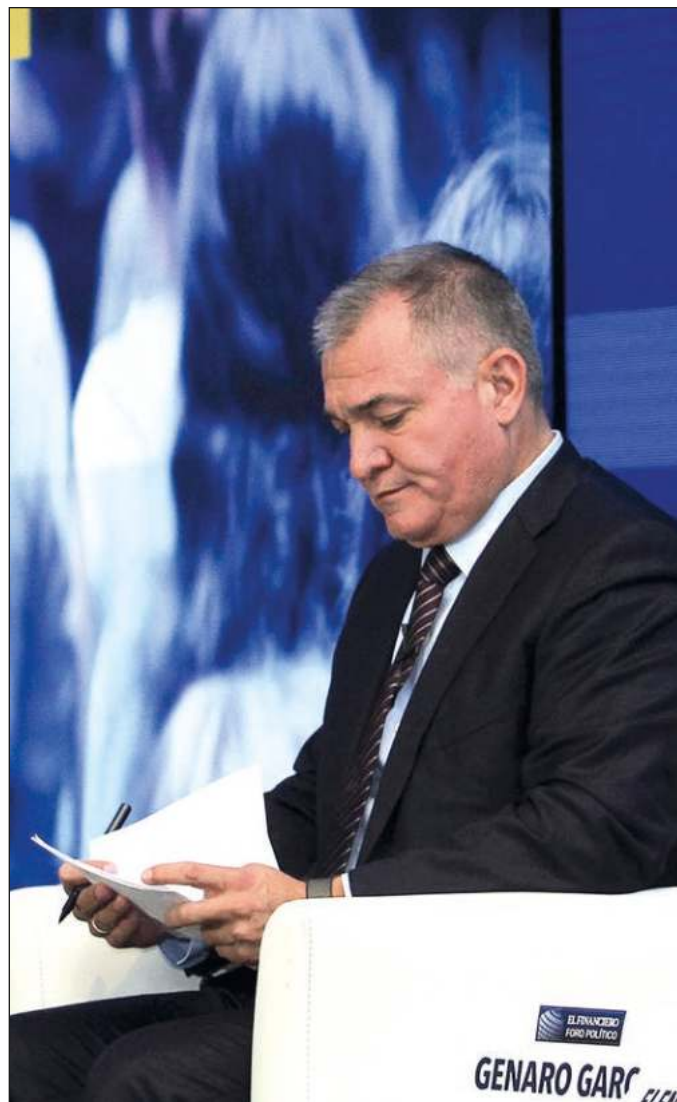
▲ Los fiscales afirman que el hombre fuerte del calderonismo conspiró con miembros del cártel de Sinaloa para importar grandes cantidades de narcóticos a Estados Unidos.

Es sumamente improbable que una actuación criminal de tan alto perfil haya podido mantenerse por tanto tiempo sin el conocimiento de otros integrantes de los gobiernos en los cuales García Luna ocupó puestos prominentes, así como de las instancias de inteligencia mexicanas y estadounidenses, por lo que parece obligado preguntarse hasta qué punto las administraciones de Vicente Fox, Felipe Calderón y Enrique Peña Nieto estuvie-