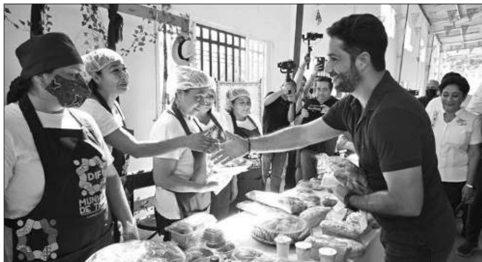
▲ Los platillos a base de camarón, como los empanizados, aguachiles, ceviches o al coco, se consideran emblemáticos del municipio de Carmen , según la Canirac.

En presencia de Gutiérrez Lazarus y del presidente