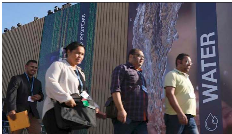
▲ Durante la conferencia sobre el cambio climático de la ONU, sostenida en Egipto, se recalzó la urgencia de reducir las emisiones de gases de efecto invernadero.

En su discurso de apertura, el responsable del comité de científicos climáticos de Naciones Unidas recalzó la urgencia de reducir las emisiones de gases de efecto invernadero y adap-