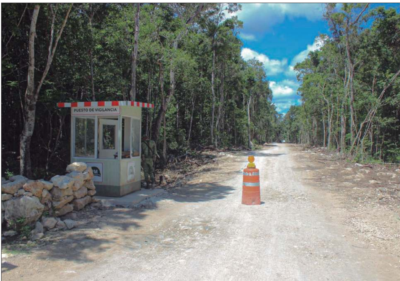
▲ La documentación entregada a la Secretaría de Medio Ambiente y Recursos Naturales consta de un proyecto ejecutivo y una Manifestación de Impacto Ambiental elaborada en conjunto por la Sedena y el Instituto de Ingeniería de la UNAM.

La documentación entregada a Semarnat consta de un proyecto ejecutivo y una MIA elaborada en conjunto por la Sedena y el Instituto de Ingeniería de la UNAM y puede ser consultada por el público en general en el portal de Semarnat con el número de proyecto 23QR2022V0050.