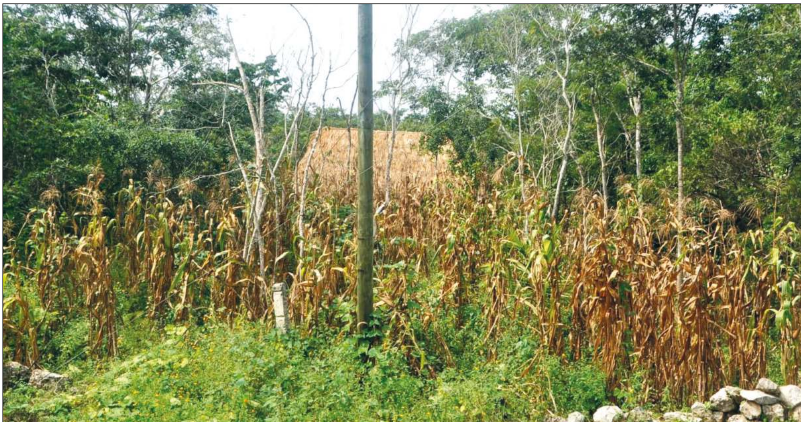
▲ Las tres especies vegetales nativas que se obtienen de la milpa, maíz, frijol y calabaza, contienen todos los nutrientes básicos.