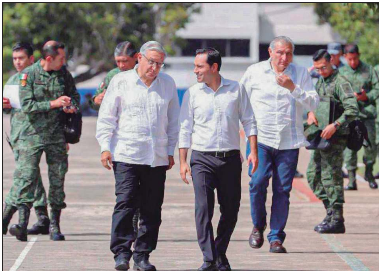
▲ En su visita número 10 del año al estado de Yucatán, el presidente López Obrador y el mandatario Mauricio Vila también dialogaron sobre los avances del proyecto de ampliación del Puerto de Altura de Progreso.

Durante la que vendría siendo su visita número 10 en lo que va de este 2022, Vila Dosal y el Presidente revisaron el progreso de planes para los yucatecos, que impulsan de la mano la federación y el gobierno estatal, tales como la construcción de los tramos 3 y 4 del proyecto del Tren Maya, las 2 plantas de generación de energía eléctrica de ciclo combinado, el Gran Parque de la Plancha y la ampliación del Puerto de Altura de Progreso.