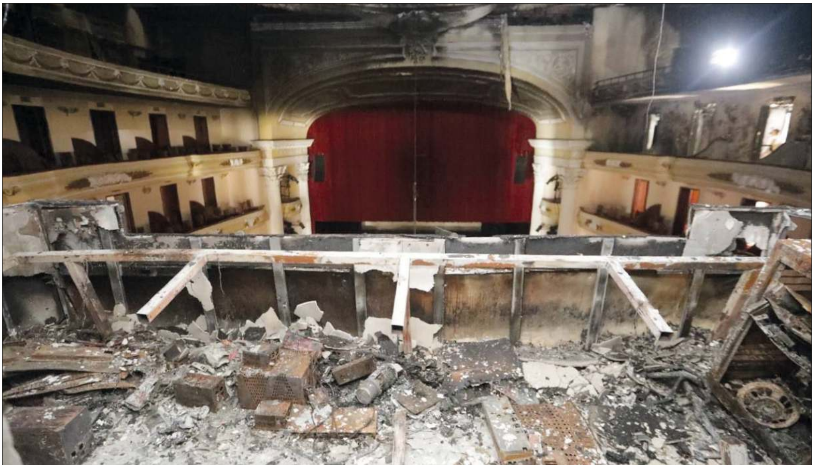
▲ Los artistas yucatecos coinciden en que el incendio en el Peón Contreras es una metáfora de las condiciones del arte en el estado.

“Algo de ineptitud hay en el manejo de los recursos para mantener los recintos históricos de la ciudad en óptimas condiciones de seguridad”, condenó. Además, agregó, los maceteros resultaron estorbosos ante una emergencia, situación que aseguró ya se había comentado públicamente.