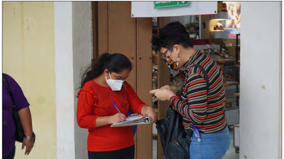
▲ Mujeres frente al parque principal, piden firmas de apoyo a la ley Olimpia.

Los legisladores, añadió Olimpia Coral, deben entender el objetivo y el concepto de lo que buscan y no colgarse de la iniciativa que ya están promoviendo.