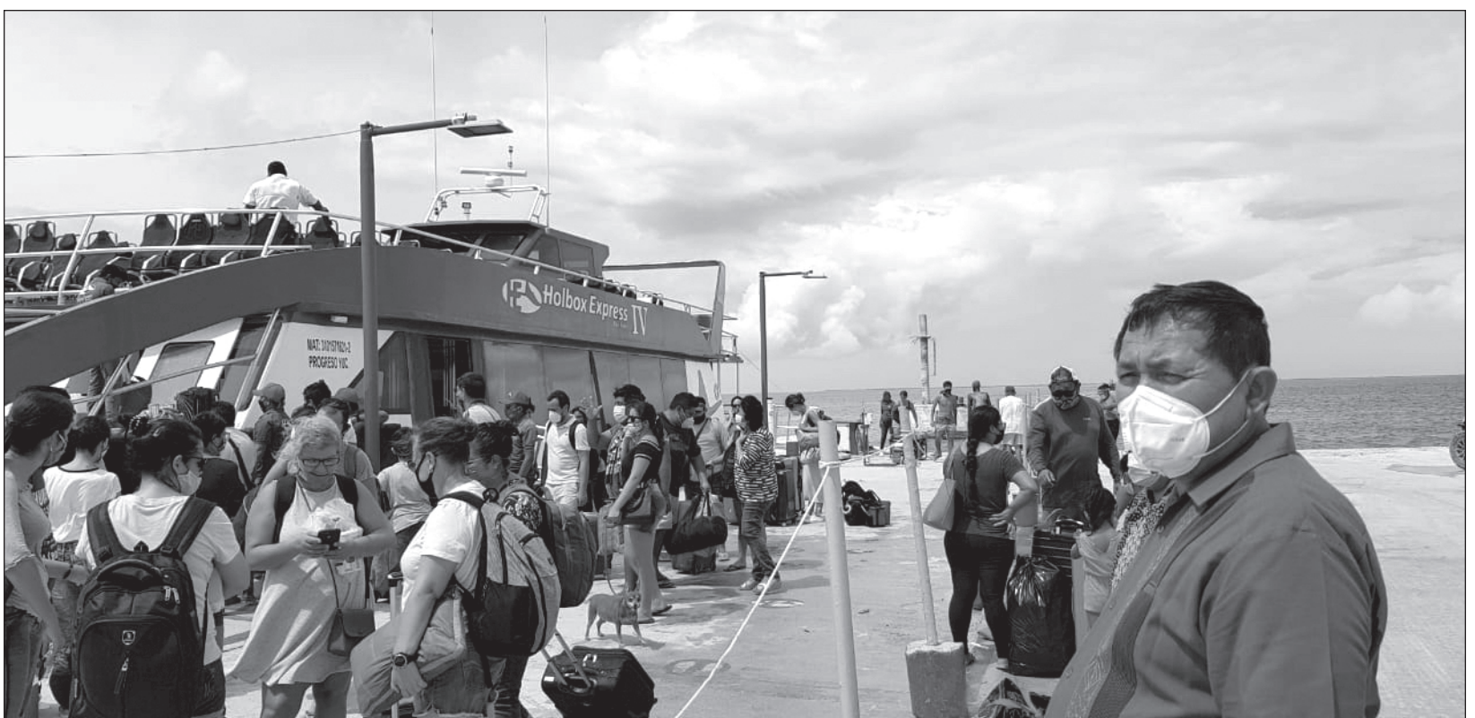
En Quintana Roo permanecen unos 40 mil 900 turistas, principalmente en los municipios de la zona norte. Ellos podrán recibir ayuda de los sistemas Guest Assist y Guest Locator .

Las personas fueron llevadas a la cabecera municipal, Kantunilkín. El Ayuntamiento de Lázaro Cárdenas avisó que habilitó refugios de las 36 comunidades del municipio.