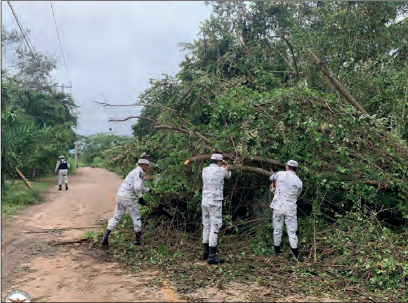
▲ Elementos de la Guardia Nacional ayudan con labores de remoción de árboles caídos y seguridad para las personas durante la contingencia por el paso del meteoro.