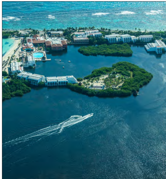
▲ La pretendida ruptura entre el gobierno que encabeza López Obrador y el sector empresarial es más un mito que una realidad.

Para la alicaída economía nacional el anuncio representa muy buena noticia; es indudable que se requieren acciones