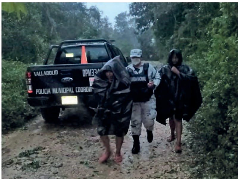
▲ Durante las siguientes horas continuarán las lluvias.