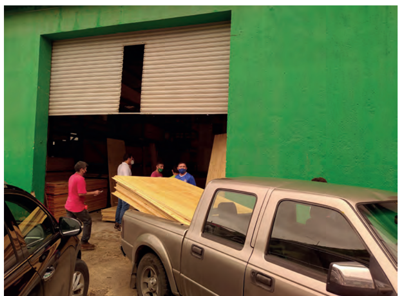
▲ En madererías y gasolineras las personas hicieron largas filas para abastecerse de combustible y materiales para proteger puertas y ventanas.