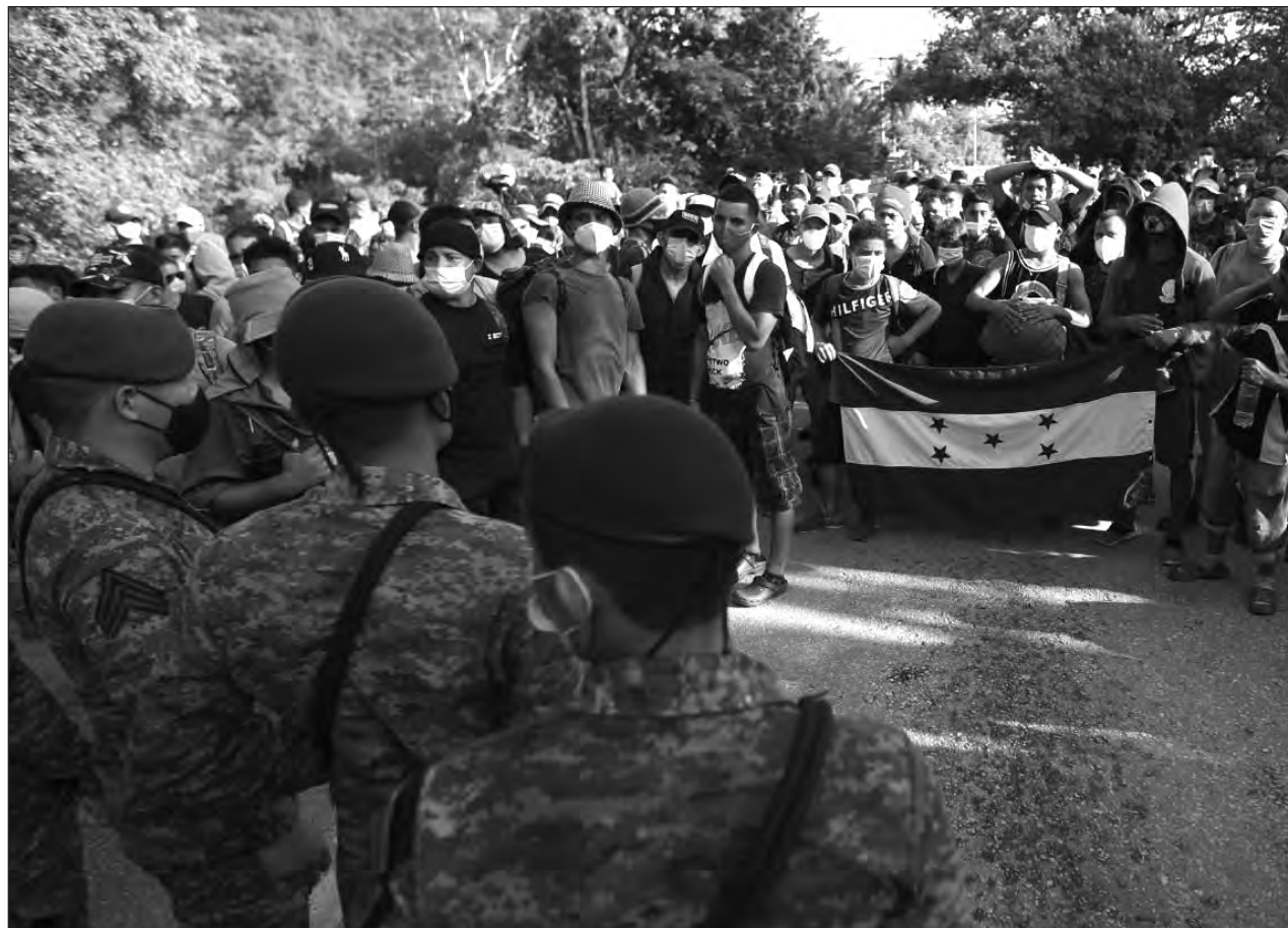
▲ Migrantes hondureños varados en Tecun Uman, Guatemala. Policías antimotines de ese país fueron desplegados en días pasados para frenar su avance hacia la frontera con México.

"Estimo que saldremos adelante, pero no es posible que por un asunto electoral se ponga en riesgo esa negociación", dijo.