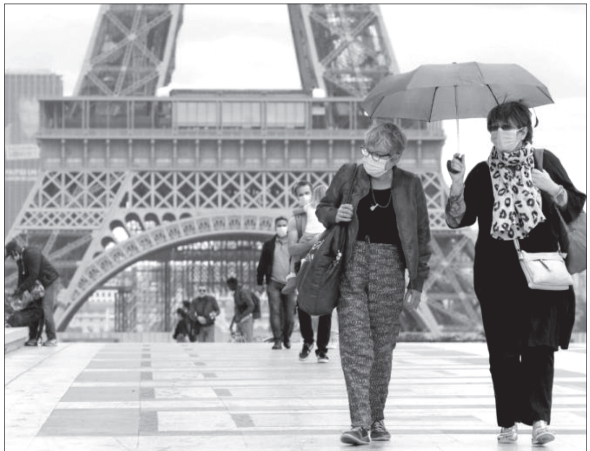
▲ La capital francesa y tres departamentos cercanos fueron declarados en alerta máxima por la expansión de la pandemia.

Twitter: @galvanochoa Facebook: galvanochoa galvanochoa@gmail.com