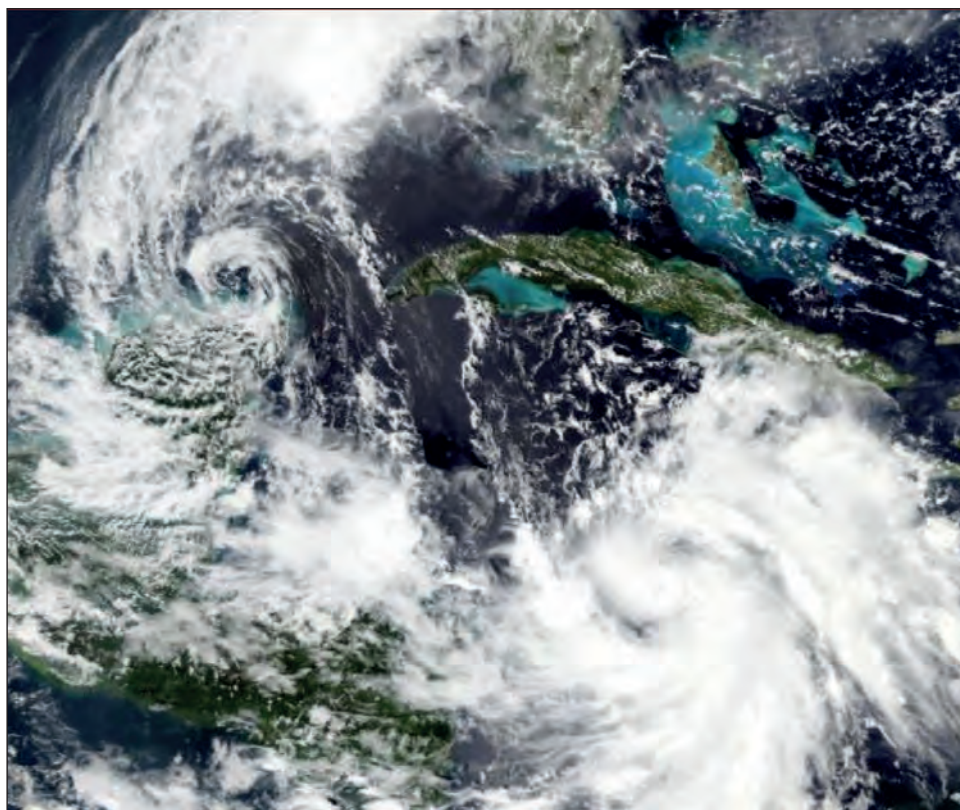
▲ Los principales efectos de la tormenta empezarán a sentirse desde la madrugada de este miércoles hasta la madrugada del jueves.