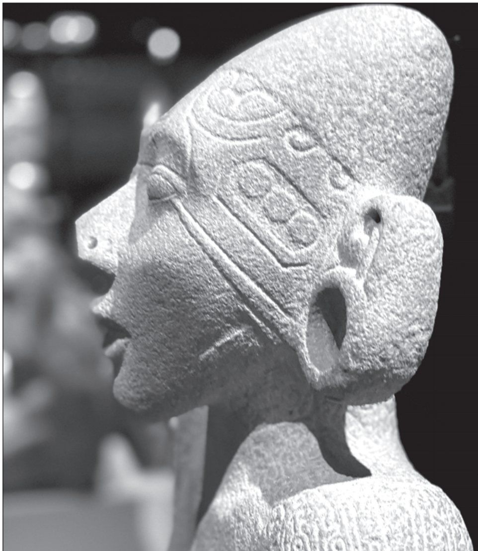
▲ El príncipe es la imagen principal de la publicidad diseñada para la exposición en París; la pieza pertenece al acervo del Museo de Antropología de Xalapa.

El recorrido cierra con La mujer escarificada de Tamtoc (San Luis Potosí) , pieza atípica hecha en arenisca y de formas sublimes, la cual revela la importancia de la mujer en las creencias y organización social de la Huasteca, detalló la SC.