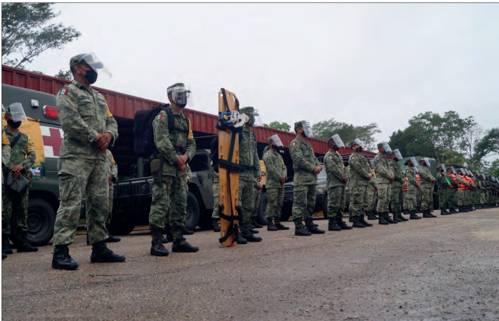
▲ La Sedena trae consigo una cocina comunitaria, un remolque cocina comedor, torres de iluminación, maquinaria y vehículos para la atención de quienes lo requieran.

Titulares de la Secretaría de Marina y Protección Civil se trasladan a la península