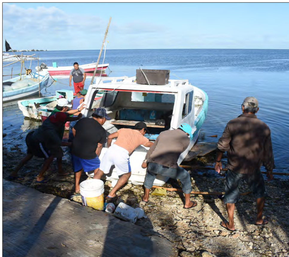
▲ Los pescadores se apuran a resguardar las lanchas de la zona marítima federal debido al movimiento de marea que han observado en las últimas horas.

Pescadores de toda la entidad sacaron las lanchas de la zona marítima federal debido al movimiento de marea que han observado en las últimas horas y desde Carmen hasta Isla Arena. Las embarcaciones ya están aseguradas a tierra para evitar daños, mientras tanto, en Isla Arena el agua de mar ha comenzado a invadir sus vialidades y piden la respuesta inme-