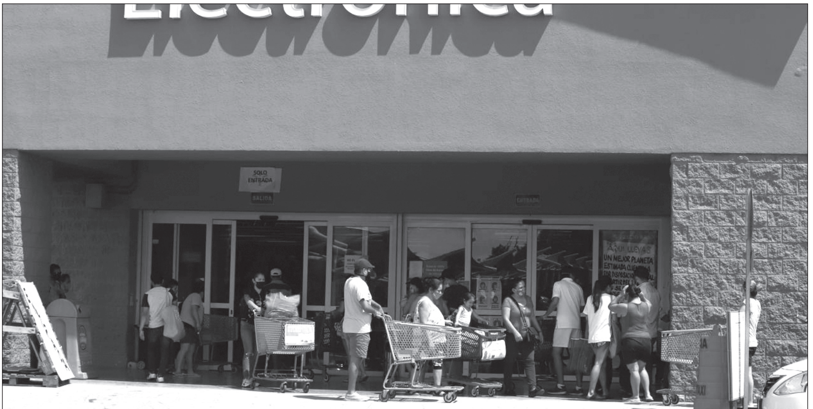
▲ La población se volcó a realizar compras de último minuto: combustible, madera triplay, cinta adhesiva, comida enlatada, entre otros insumos. Por este movimiento hubo desabasto de agua embotellada.