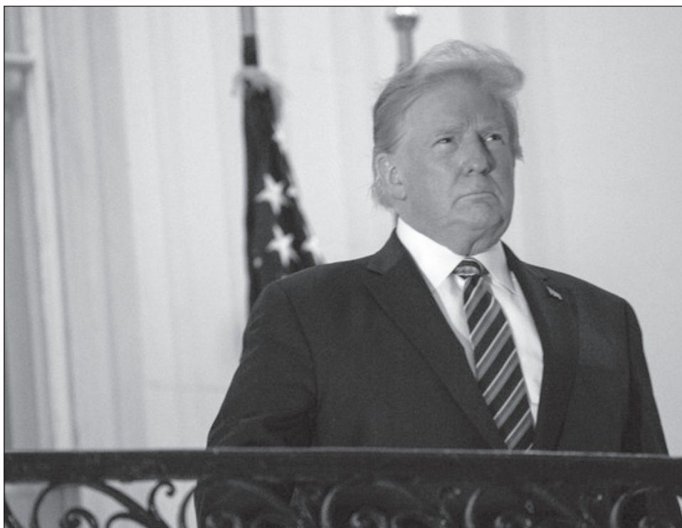
▲ El presidente Trump estuvo tres noches en el Centro Médico Walter Reed, tras dar positivo al COVID-19.

Durante la temporada de gripe 2019-2020, la gripe se asoció con 22 mil muertes, según los cálculos de los Centros para el Control y la Prevención de Enfermedades de Estados Unidos (CDC). ( https://bit.ly/30ByG1m )