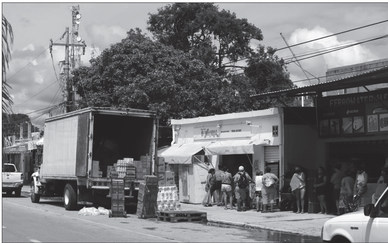
▲ El presidente de la Canacope-Servitur señaló que hasta los pequeños comercios como Dunosusa o Súper Willys recibieron a muchos compradores este martes.

Desde el mediodía y durante la tarde de este martes se vio a cientos de personas realizando compras