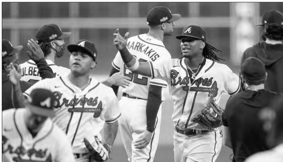
▲ El venezolano Ronald Acuña Jr. festeja con sus compañeros tras el primer juego de la serie divisional de la Liga Nacional, ante los Marlins, en Houston.

D'Arnaud aportó además un doble y un sencillo, para totalizar cuatro remolcadas.