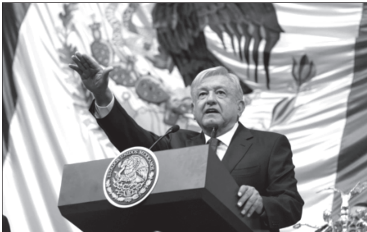
▲ A la salida de Andrés Manuel López Obrador de la presidencia de Morena para postularse por tercera ocasión a Palacio Nacional, ese partido quedó en una especie de orfandad semidisfrazada.

PERO LA VERDAD es que Morena no es un partido verdadero