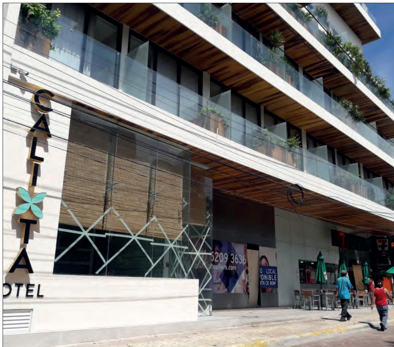
▲ Es probable que la velocidad de Delta vaya disminuyendo y se mantenga en categoría cuatro, pero se espera que sea un huracán peligroso.