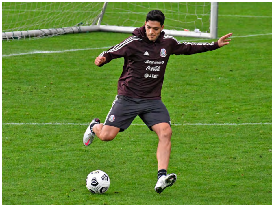
▲ Raúl Jiménez, la gran figura mexicana en el fútbol europeo, encabezará hoy el ataque tricolor.

El "Tata" Martino dijo que, a pesar del marcador de escándalo ante Argentina, México saldrá a proponer el juego ante los holandeses. "Vamos a pedir el protagonismo, pero sin cometer esos errores que hicieron que el partido (ante Argentina) terminase como terminase", señaló Martino en una videoconferencia. "Pero no vamos a renunciar