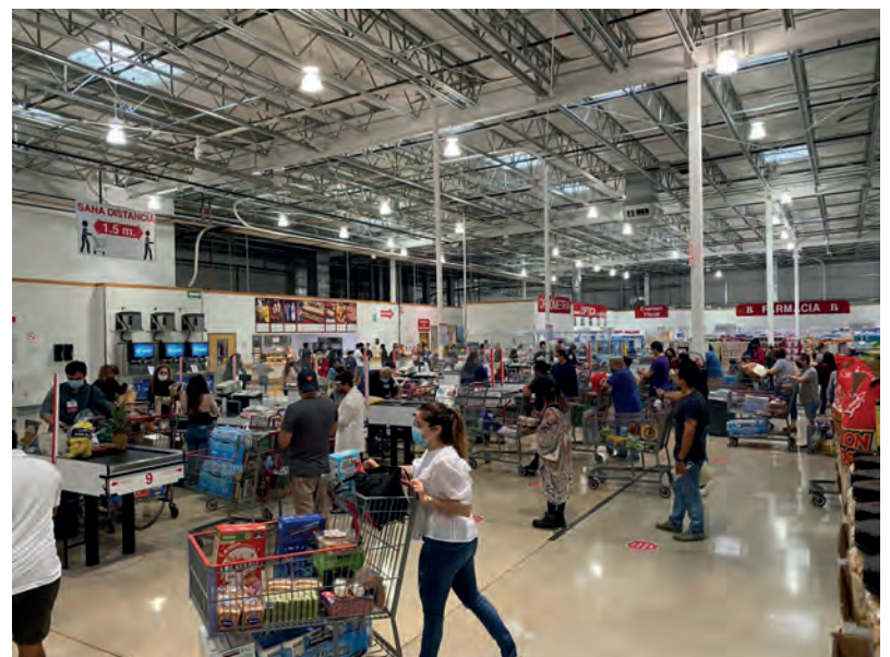
▲ Largas filas en supermercados por compras de pánico.