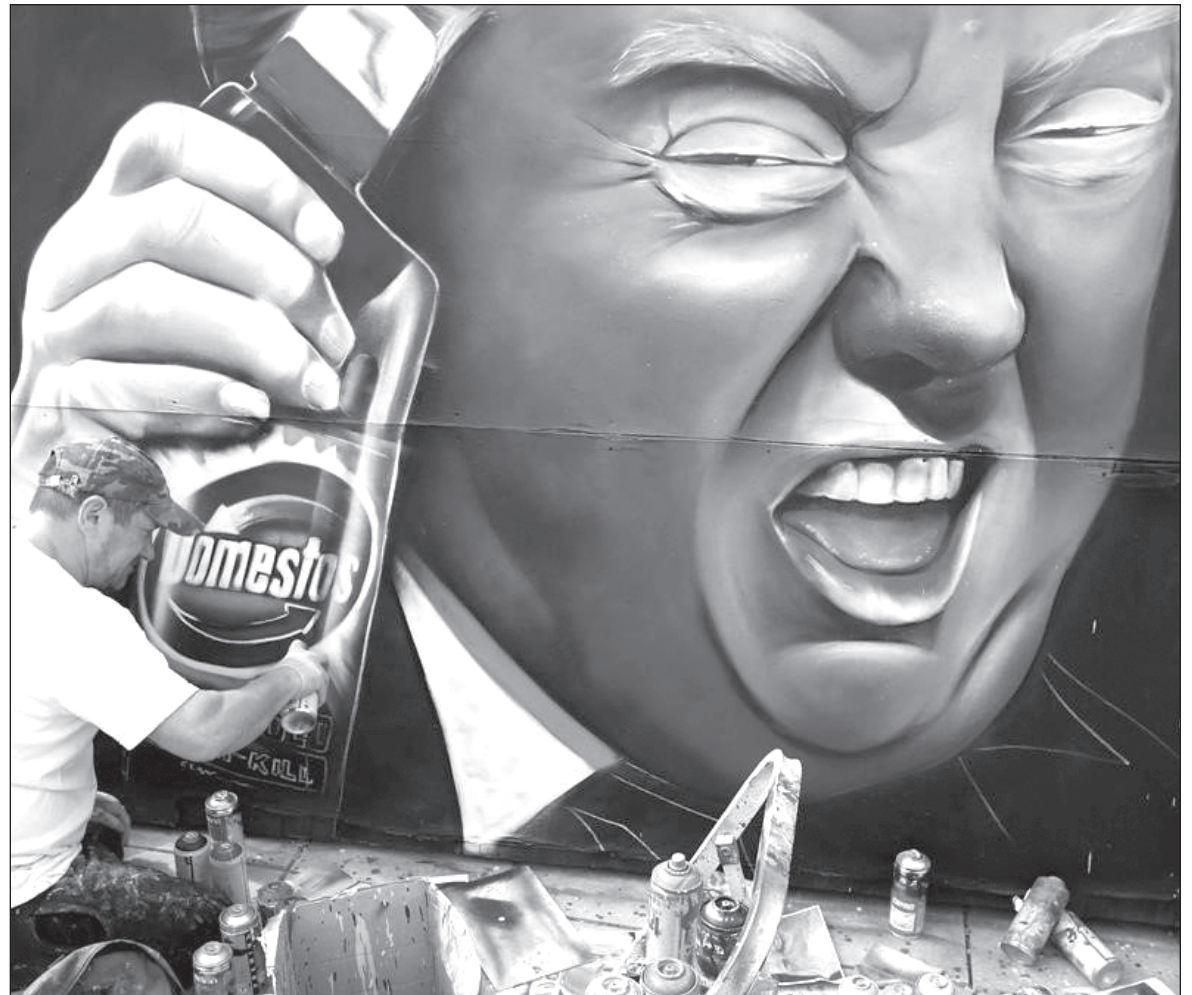
▲ Once again, and against all scientific and medical advice, Trump has missed an opportunity to send the right message to citizens who have lost so many loved ones and are not getting sympathy, empathy, comfort, or intelligent guidance from their president.

TRUMP SEEKS TO reinforce his hold over his base. What he doesn't