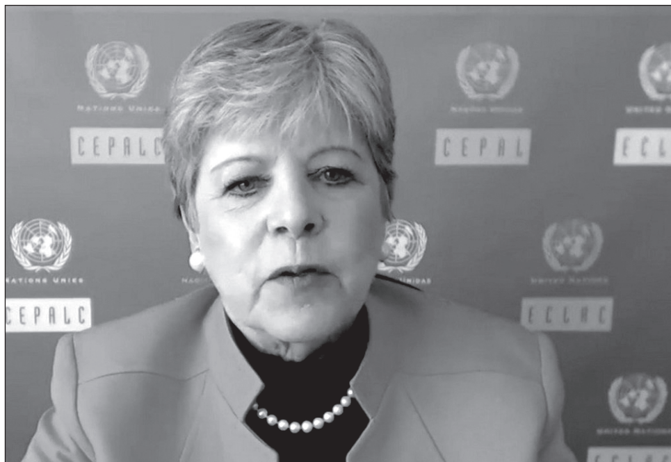
▲ Alicia Bárcena señaló que hay señales de recuperación para el país, como el empleo y el comercio exterior; sin embargo, México arrastra rezagos para cerrar la brecha tecnológica.

En este sentido, Bárcena dijo que entre las políticas que ha llevado a cabo la actual administración y que pueden abonar a crecer, se