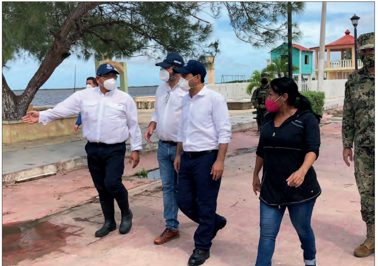
▲ En San Felipe, el gobernador Mauricio Vila supervisó la evacuación de personas vulnerables, que fueron trasladadas a refugios o a casas de familiares.

Por otra parte, el gobernador de Yucatán, Mauricio Vila Dosal anunció, a través de un video en sus redes sociales, la suspensión de labores a partir de las seis de la tarde para Mérida y el resto del estado, las que se reanudarán hasta nuevo aviso, debido al acercamiento del meteoro.