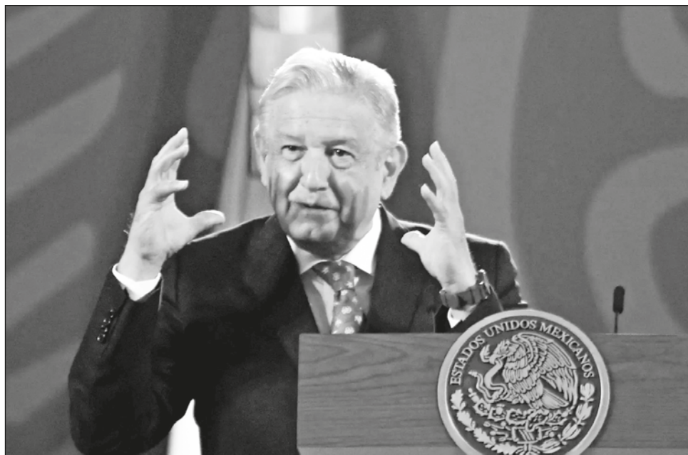
▲ “No voy a la cumbre porque no se invita a todos los países de América y yo creo en la necesidad de cambiar la política que se ha venido imponiendo desde hace siglos: la exclusión”.

Washington confirmó el lunes que no invitará al encuentro a los gobiernos de Cuba, Venezuela y Nicaragua. “Estados Unidos sigue manteniendo reservas sobre la falta de espacios democráticos y la situación de los derechos humanos en Cuba, Nicaragua y Venezuela”, dijo a la AFP un