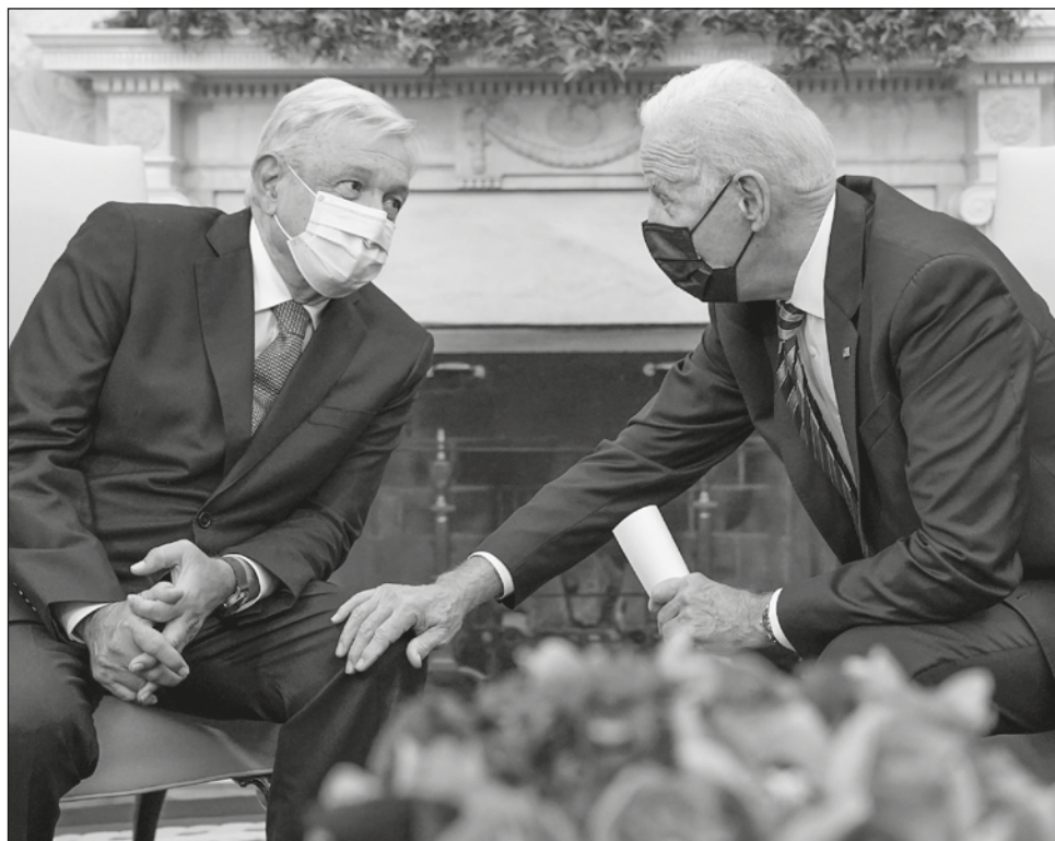
▲ La secretaria de Economía reveló que Andrés Manuel López Obrador y Joe Biden mantienen comunicación constante y la relación entre ambos países es muy fuerte. En la imagen, ambos presidentes en la reunión trinacional del 18 de noviembre de 2021.

Entrevistada en Palacio Nacional, tras salir de una reunión con el mandatario federal, la funcionaria detalló que será parte de la delegación de México y ella participará en un encuentro en el marco de la Cumbre convocado por el Banco Interamericano de Desarrollo (BID) en el que participarán sus contrapartes regionales a fin de analizar inversiones.