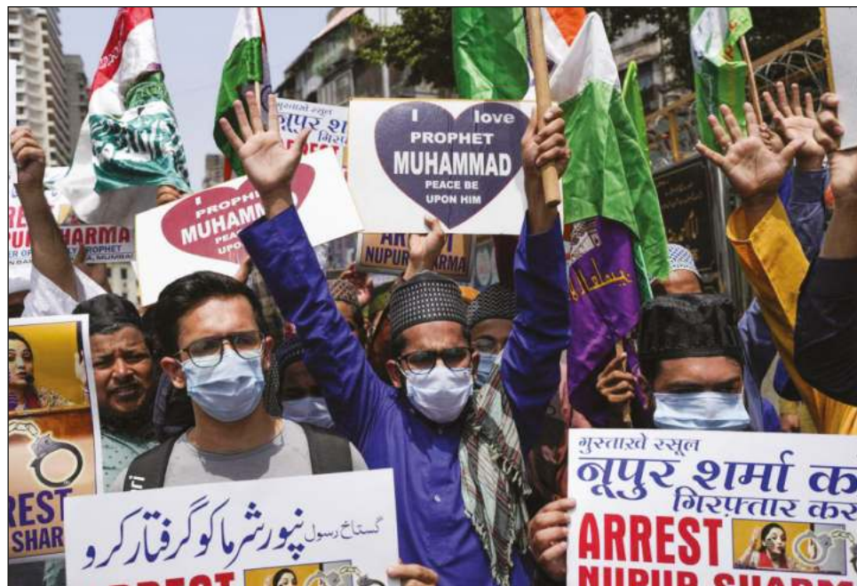
▲ Los insultos contra el profeta desataron una ola de ira dentro de la India, donde la minoritaria población musulmana encabezó protestas contra el gobierno de Modi.

A lo largo de los años, los musulmanes indios a menudo han sido blanco de todo, desde su comida y estilo de vestir hasta los matrimonios interreligiosos. Grupos de derechos humanos como Human Rights Watch y Amnistía Internacional han advertido que los ataques podrían escalar. También acusaron al partido gobernante de Modi de mirar hacia otro lado y, en ocasiones, permitir el discurso de odio contra los musulmanes, que representan el 14 por ciento de los mil 400 millones de habitantes de la India, pero aún son lo suficientemente numerosos como para ser la segunda población musulmana más grande de cualquier nación.