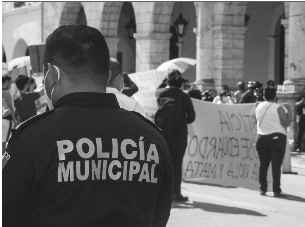
▲ La Policía Municipal de Mérida no ha parado en capacitaciones sobre derechos humanos.