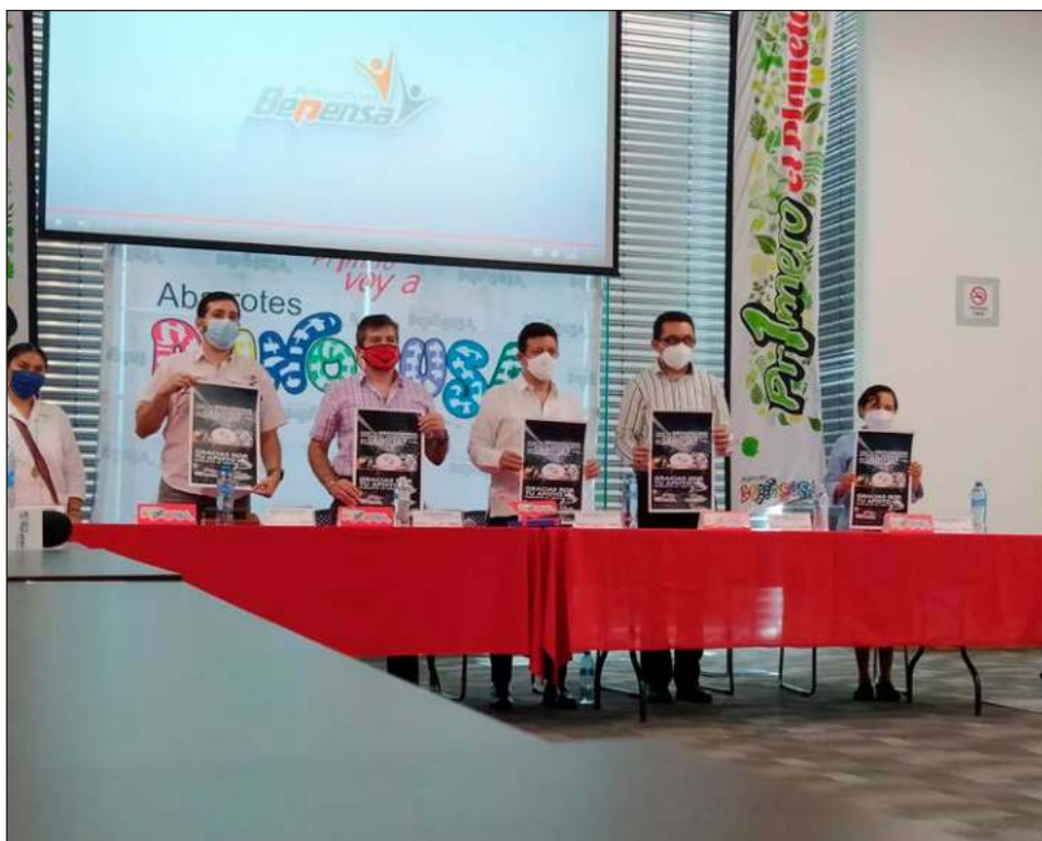
▲ Precisaron que el 50% de lo recaudado se destinará a la limpieza de cenotes en Yucatán; y el otro 50% será donado a la casa hogar Cesarita Esparza.

"Originalmente cada vez se apoyaba a una asociación, pero desafortunadamente hay muchas necesidades y varias solicitudes de apoyo, así que estamos combinándolos de dos en dos para apoyar a las más que se pueda", sentenció.