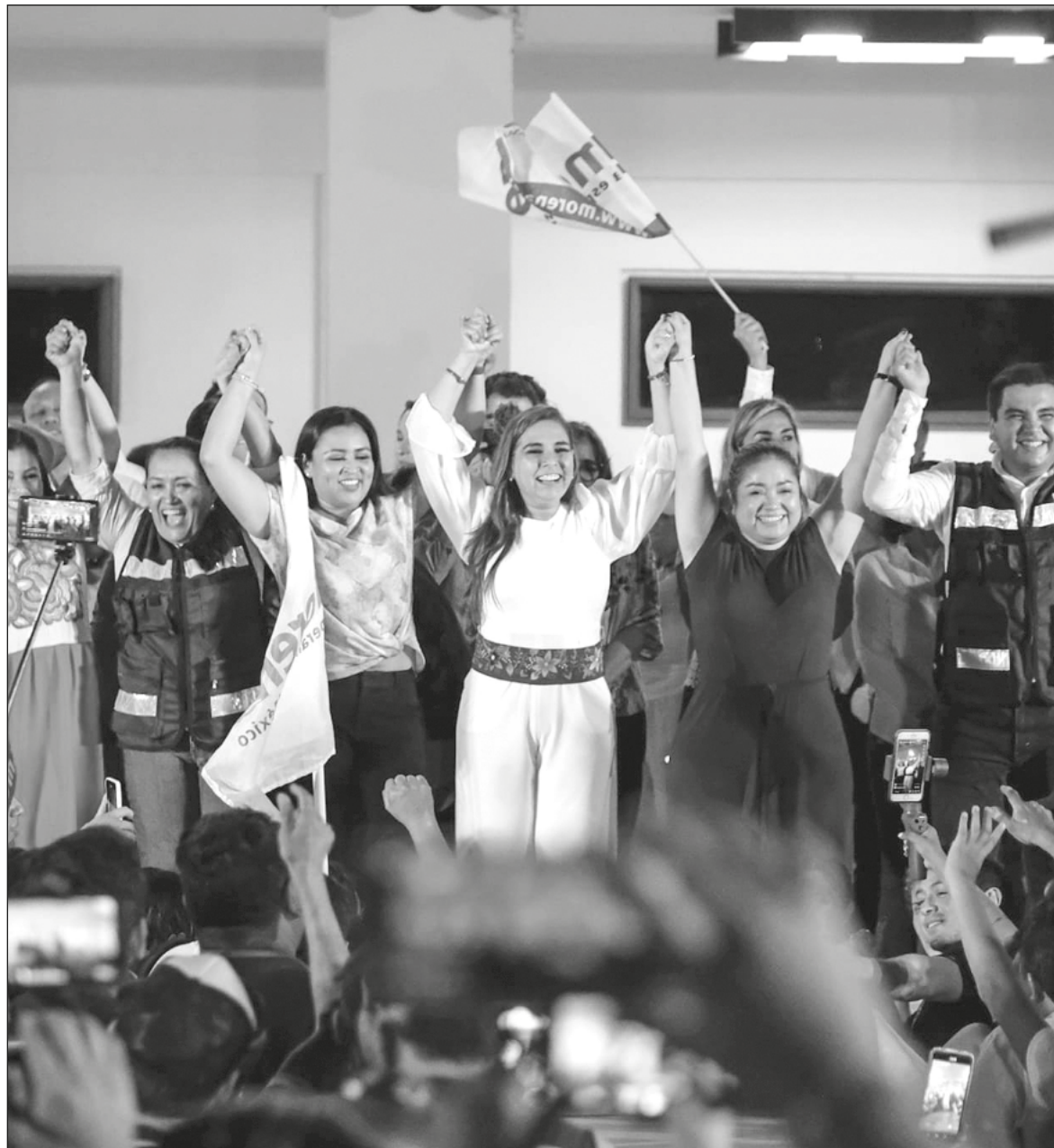
▲ "Entre un mundo de personas interesadas, la nueva gobernadora deberá distinguir y elegir capacidad, experiencia, formación y compromiso con la sociedad y con su gobierno".

No será fácil, absolutamente, pero tampoco debe ser imposible. Es el momento de filtrar entre las personas que la han acompañado, con o sin el genuino interés por el estado y no por intereses personales, y decidir quienes la van a acompañar en su gestión. Entre un mundo de personas interesadas, la nueva gobernadora