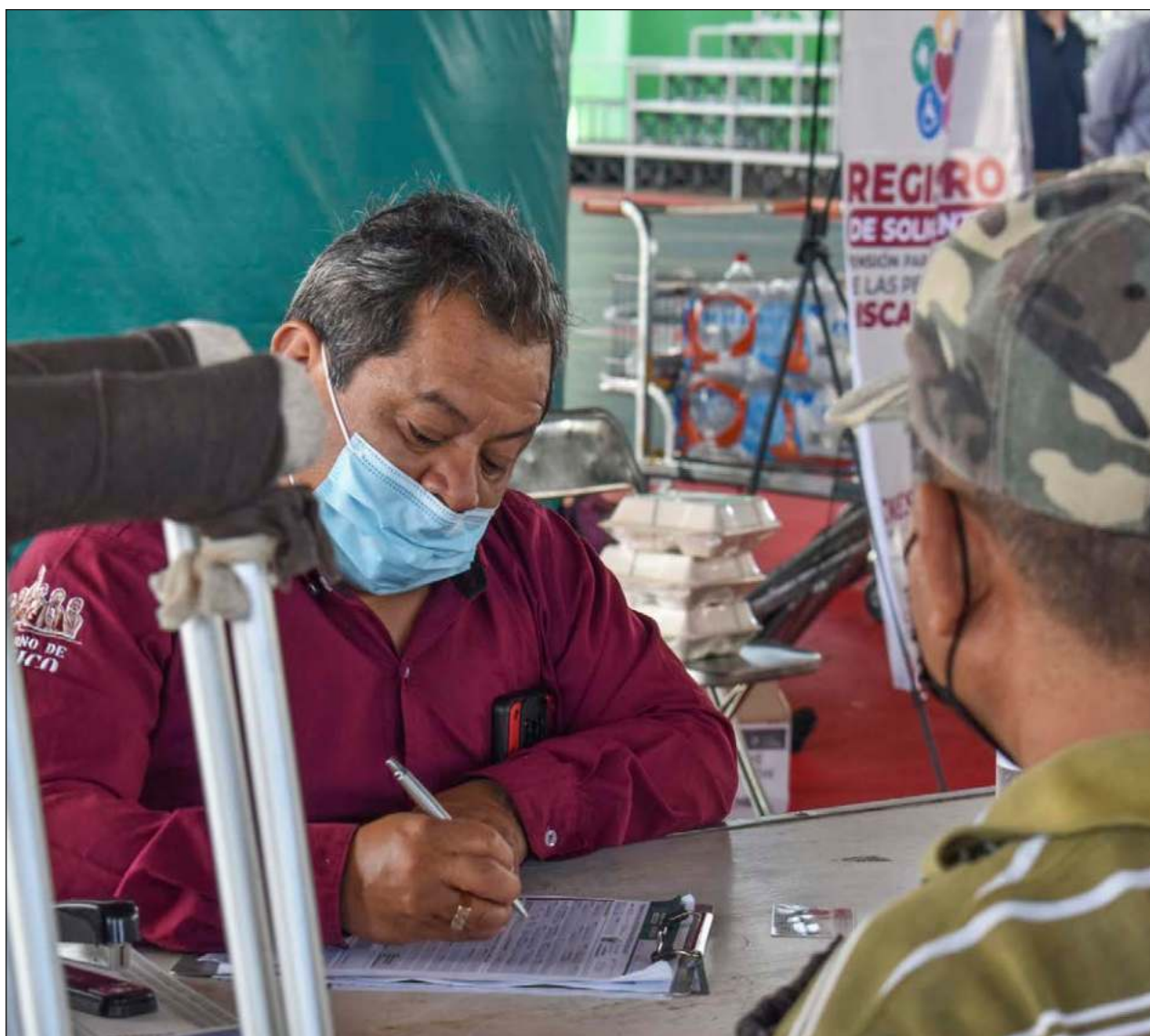
▲ De acuerdo con el Inegi, en Campeche hay 52 mil personas con discapacidad.

La Pensión para el Bienestar de Personas con Discapacidad actualmente consiste en 2 mil 800 pesos bimestrales y está dirigida para aquellas personas que tienen discapacidad intelectual, sicosocial, auditiva, motriz-física, visual. Los interesados pueden ubicar su módulo de atención en la página gob.mx/bienestar .