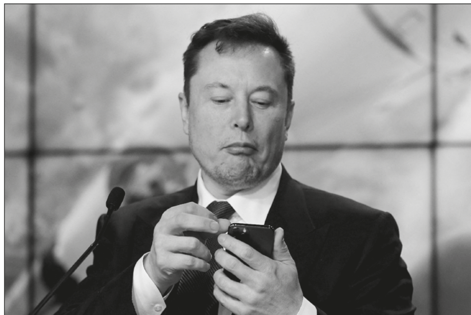
▲ La red social aseguró que seguirá compartiendo información de forma cooperativa con el multimillonario, aunque el viernes pasado venció el plazo.

Luego de presentar en abril una oferta de compra de la red social por 44 mil millones de dólares tras hacerse de más de 9 por ciento