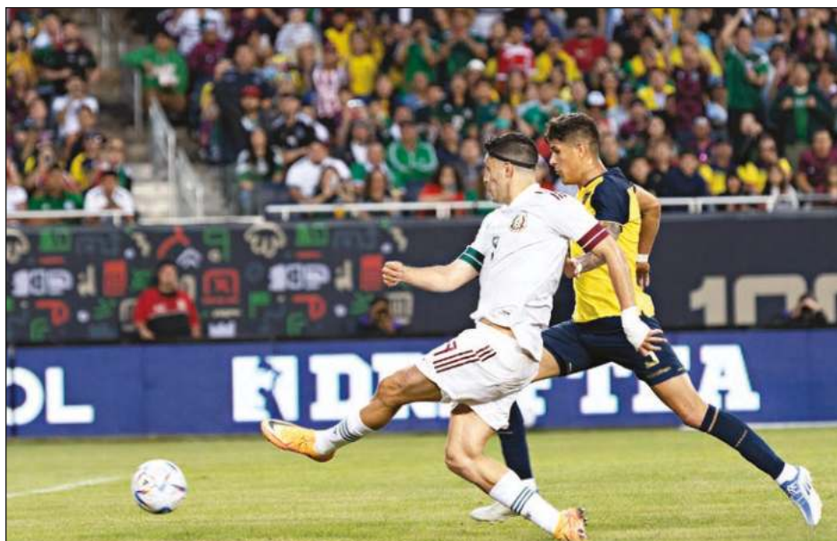
▲ Raúl Jiménez y el Tricolor no pasan por un buen momento.

El ataque tricolor apenas ha podido marcar un gol en ofensiva en sus últimos cuatro duelos. Previo a la gira disputó otro amistoso en el que empató ante Guatemala sin goles. Aunque México venció 2-1 a Nigeria, una de las anotaciones fue autogol del rival.