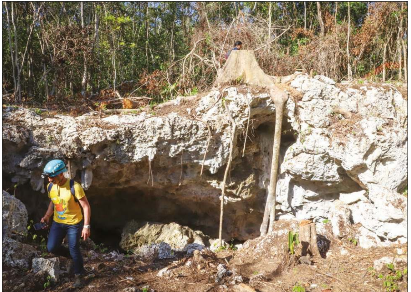
▲ De acuerdo con los ambientalistas, la Manifestación de Impacto Ambiental presentada por el gobierno de México confirma la inviabilidad de continuar construyendo en el tramo 5 por el tipo de suelo kárstico.

Fonatur presentó la MIA dos meses después de la destrucción de la selva, recuerdan las organizaciones