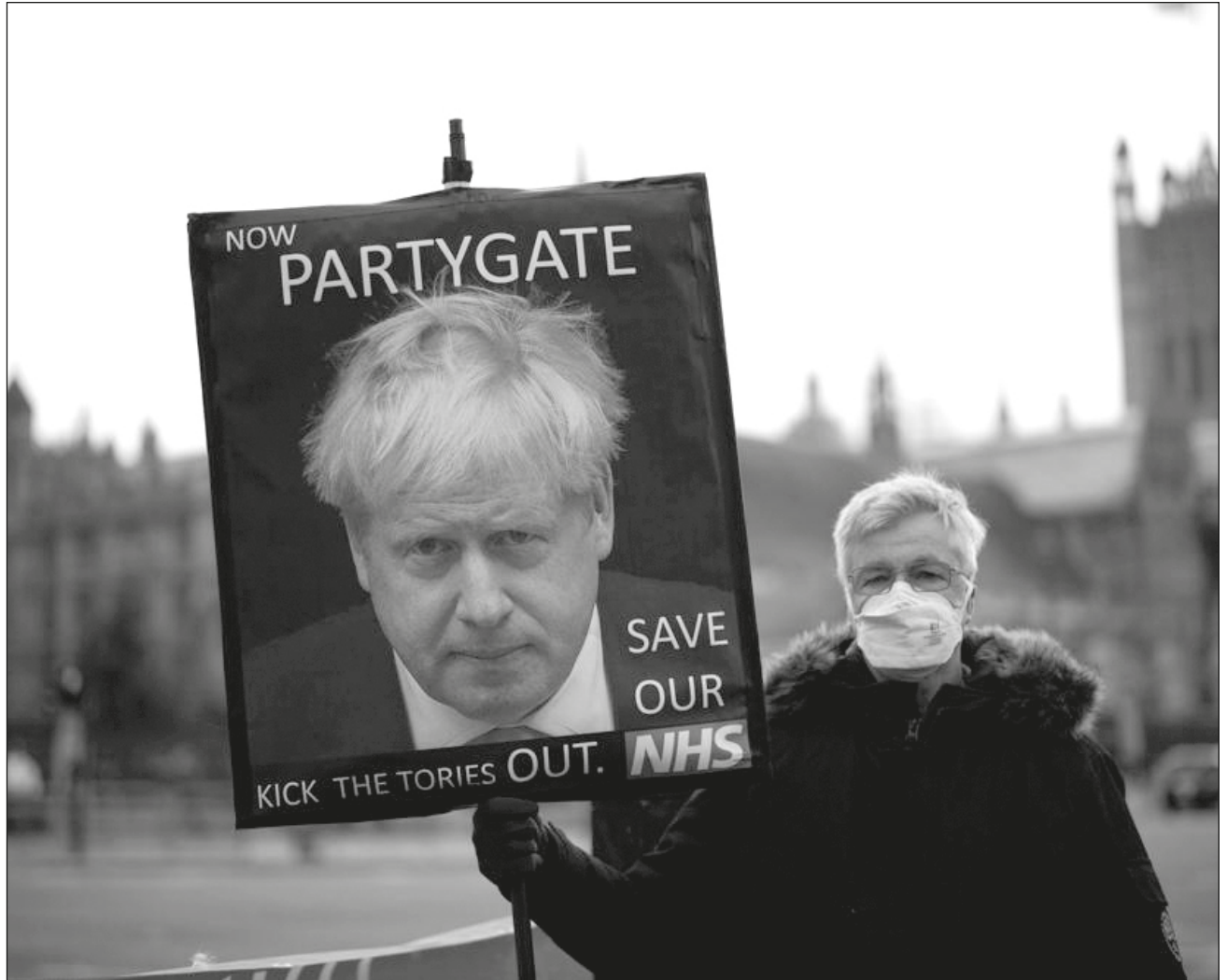
▲ El primer ministro del Reino Unido ha estado bajo creciente presión después de que él y su personal celebraron fiestas con alcohol en su oficina de Downing Street cuando el país estaba bajo estrictos confinamientos debido al Covid-19.

Johnson, que obtuvo una amplia victoria electoral en 2019, ha estado bajo creciente presión después de que él y su personal celebraron fiestas con alcohol en su oficina y residencia de Downing Street cuando el Reino Unido estaba bajo estrictos confinamientos debido al Covid-19.