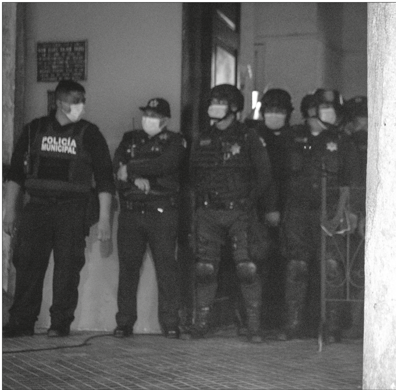
▲ El documento publicado de manera digital aporta datos y testimonios de 24 personas que han sido detenidas de manera arbitraria, y mediante abusos policiales documentados en la entidad.

Si bien la entidad se coloca como la más pacífica del país, esto ha provocado que otro tipo de violencias sean ignoradas e invisibilizadas, por ejemplo, los feminicidios y desapariciones