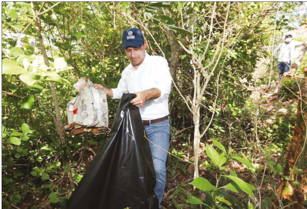
▲ Entre envases de plástico, cristal y colillas de cigarrillos, la campaña “Unidos limpiando Yucatán” reunió 300 toneladas de residuos sólidos, según dio a conocer de manera preliminar la Secretaría de Desarrollo Social.

Luego de llamar a sumar esfuerzos para un Yucatán, país y mundo, más verdes y sustentables, apuntó que “hoy, todos han puesto su granito de arena, porque toda esta basura que recolectaron se filtra al subsuelo y se va al