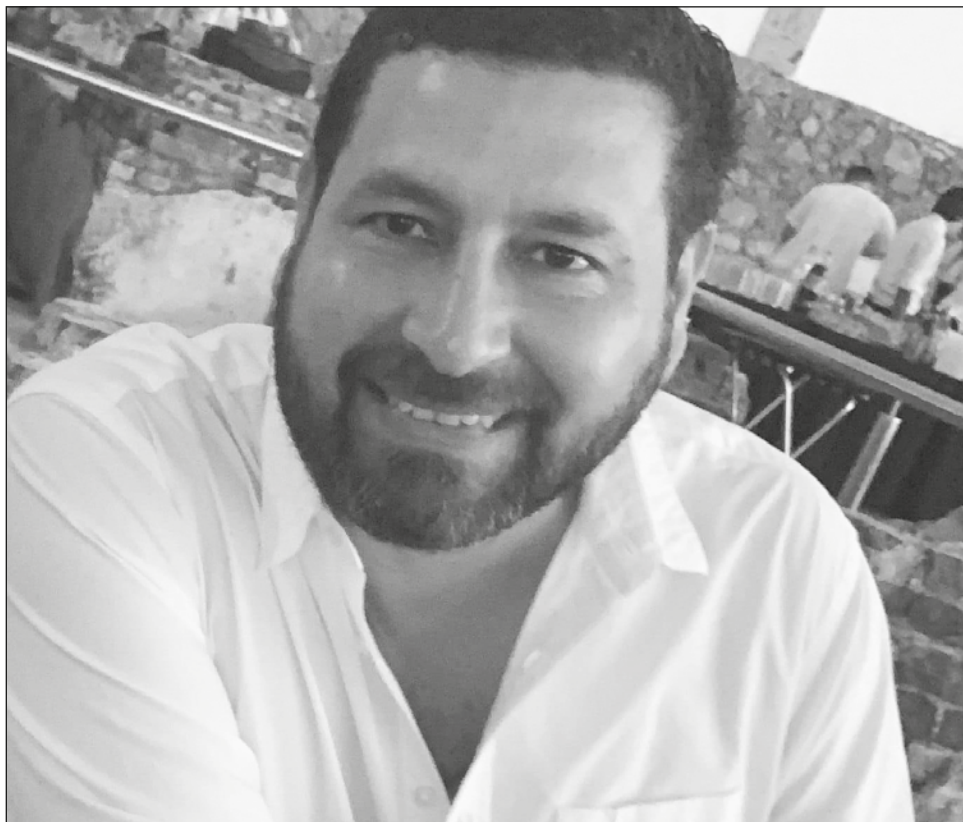
▲ De momento no se ha precisado si el cuerpo presenta huellas de violencia ni tampoco las causas de su muerte, pero al parecer fue por ahogamiento.

De momento no se ha precisado si el cuerpo presenta huellas de violencia ni tampoco las causas de su