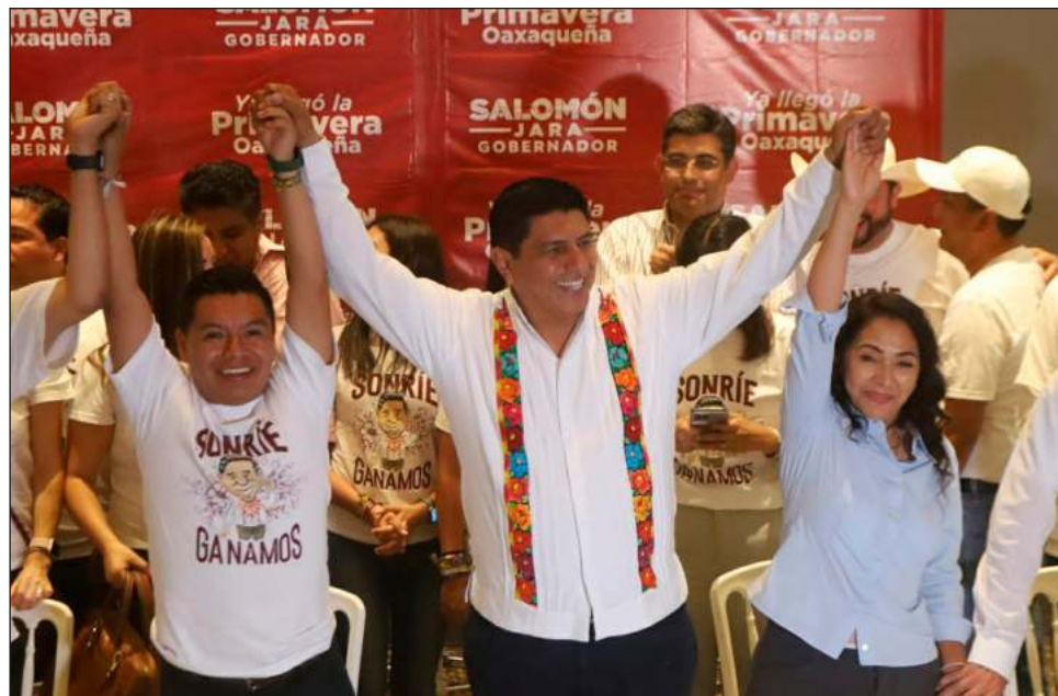
▲ La participación electoral este domingo fue la más baja registrada en Oaxaca desde 2010. Además, 22 casillas fueron quemadas, reveló el Iepac.

Antenoche, el Instituto Estatal Electoral y de Participación Ciudadana pre-