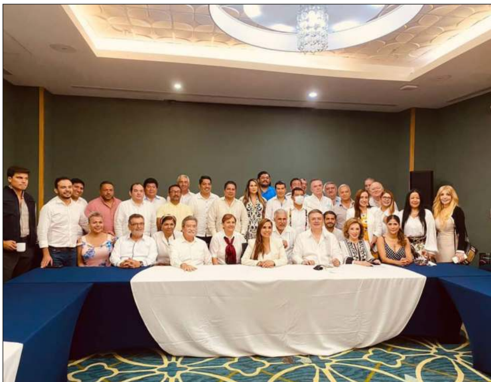
▲ A decir del sector empresarial, durante estos comicios se alcanzó un diálogo entre los candidatos y la iniciativa privada que no se había visto antes.

El miércoles 8 de junio sesionará el Ieqroo para hacer el cómputo final de la elección y declarar a los diputados electos, quienes recibirán su constancia al concluir el conteo. La XVII Legislatura se instalará el 3 de septiembre próximo y el 5 del mismo mes iniciará el periodo ordinario de sesiones.