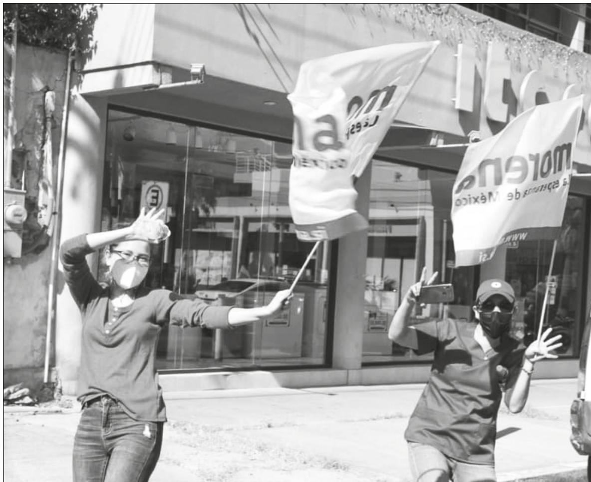
▲ “Hubo un duelo de estructuras no sólo ciudadanas, sino también aquellas aceitadas por poderes y finanzas locales y nacionales. Lo vivido este domingo no alienta la expectativa de que se estén superando añejas prácticas”.

LO QUE SUCEDA en ese año no estará definido sólo por popularidades, clientelismo e ideología, sino también por la realidad específica de las tesorerías y su capacidad de habilitar los respectivos ejércitos electorales. Un ejemplo de ese pragmatismo se ha dado justamente este domingo.