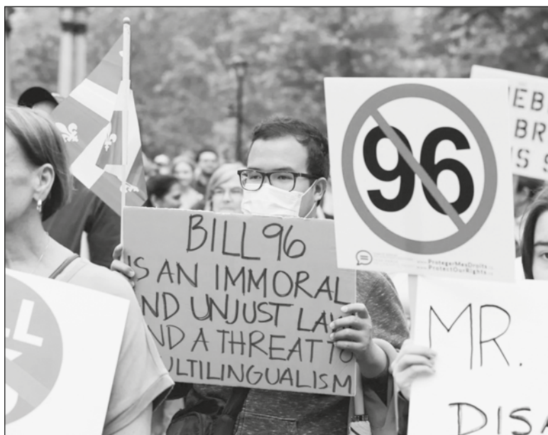
▲ "Any presence of English in Quebec is viewed as a threat to the future of the French majority and to their hard-fought control of the province".

ENGLISH RIGHTS HAVE never satisfied die-hard Quebec nationalists. In their view, Quebec is an island of French in a sea of English North America. Any presence of English in Quebec is viewed as a threat to the future of the French majority and to their hard-fought control of the province. They