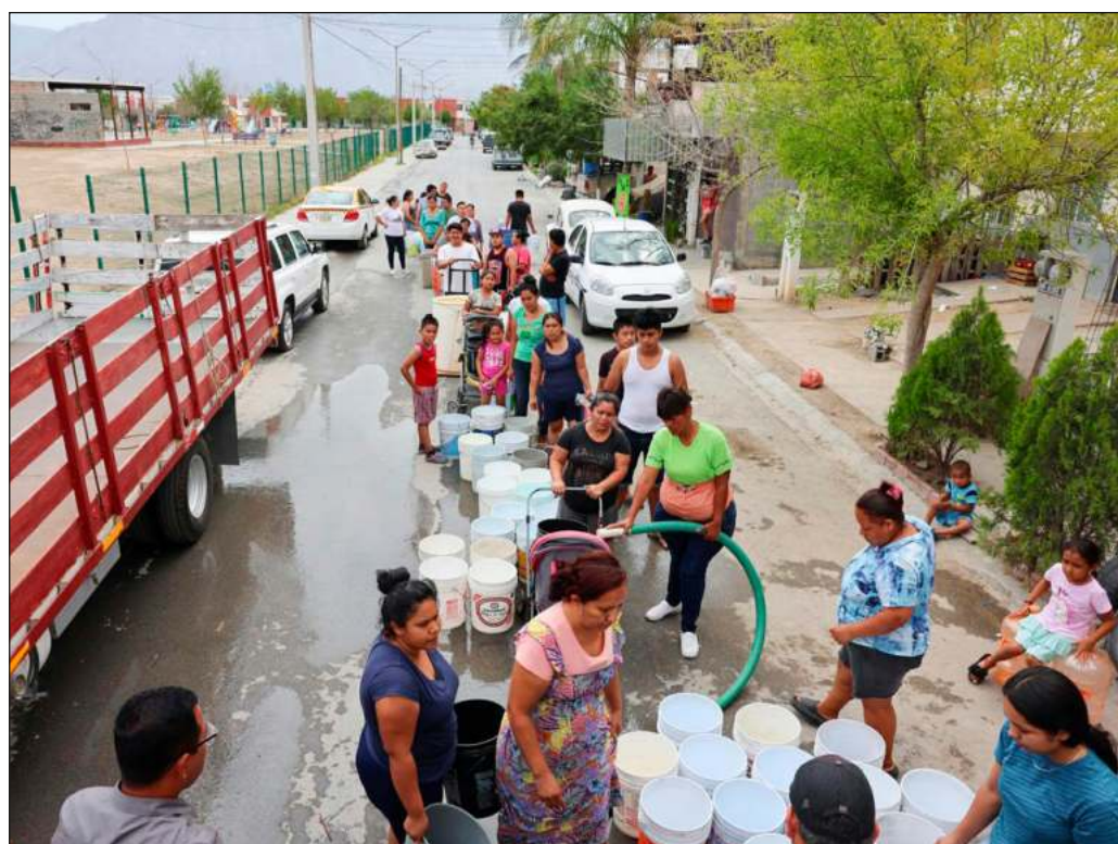
▲ La escasez de agua en Nuevo León ha disparado la especulación con pipas y garrafones. Estos últimos han aumentado su precio en más del doble.

Así pues, es erróneo y demagógico culpar a los fenómenos asociados con el cambio climático por la falta de agua en tuberías y canales de riego de Nuevo León. Esta carencia crítica es, en cambio, provocada por un modelo de desarrollo que lleva aparejados el privilegio a las grandes empresas, la desigualdad y el desdén a los sectores mayoritarios de la población.