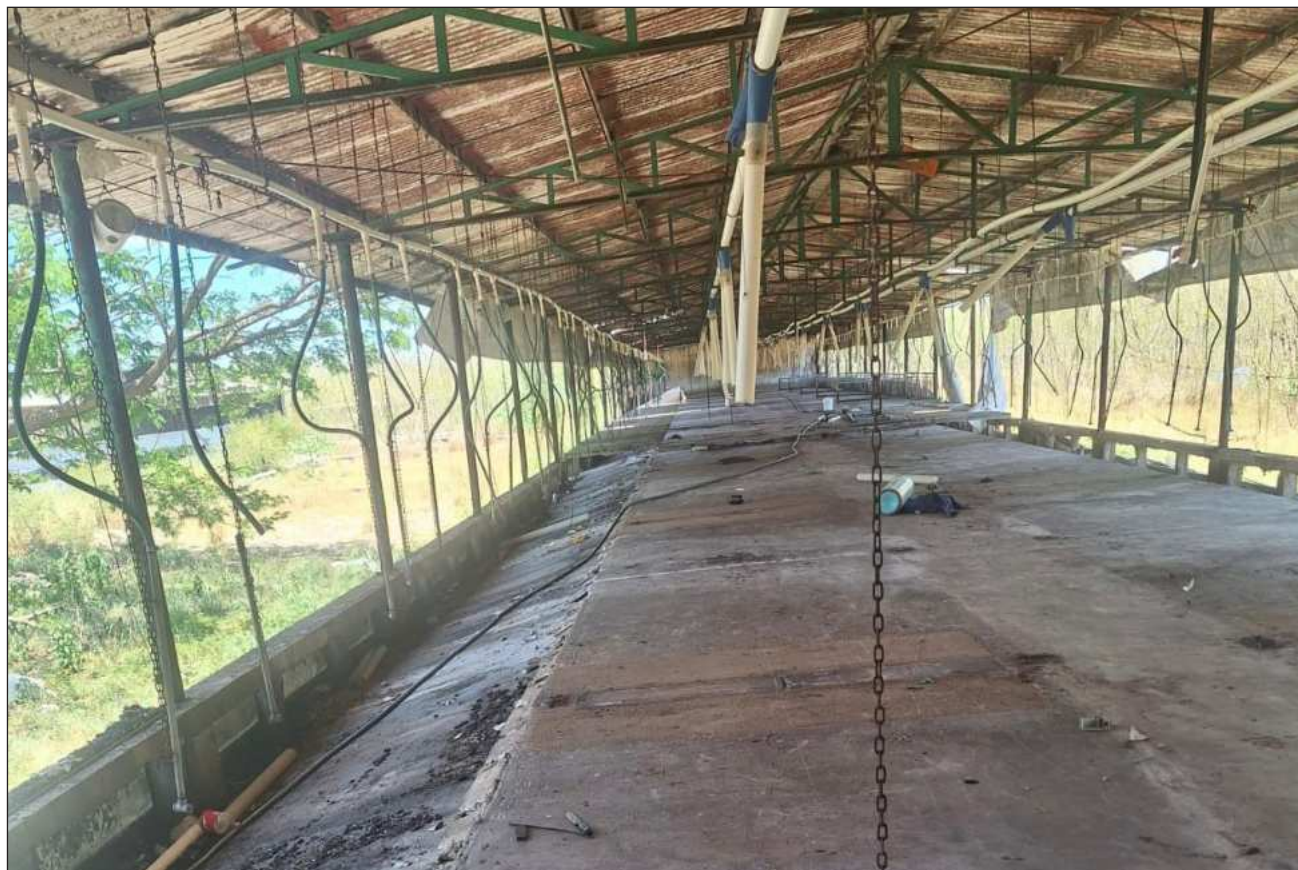
▲ El logro es producto de la lucha de la comunidad maya que denunció desde 2021 las afectaciones que causaba la granja.

La clausura definitiva fue determinada por la Procuraduría Federal de Protección al Ambiente (Profepa) el 4 de