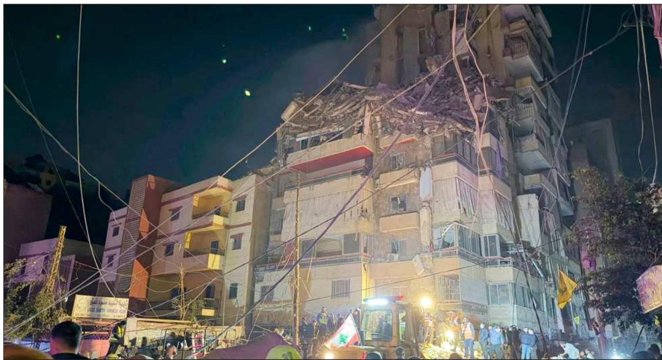
▲ Un ataque israelí en el valle de Bekaa, al este del Líbano, causó la muerte de cuatro personas el mismo día, mientras que el ejército israelí afirmó haber atacado objetivos de Hezbolá en el sur, tras advertir a los residentes de una docena de localidades que evacuaran.

El primer ministro israelí y prófugo de la CPI, Benjamin Netanyahu, afirmó que las Fuerzas de Defensa de Israel (FDI), tenían como objetivo al comandante, cuyo nombre no se ha revelado, de la