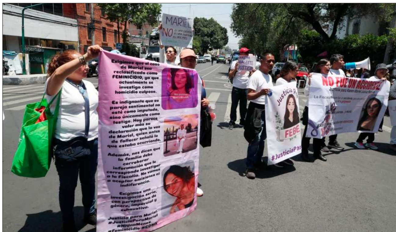
▲ Familiares de mujeres desaparecidas y de víctimas de feminicidio marcharon hacia la Fiscalía General de Justicia de la Ciudad de México, para exigir avances en sus carpetas de investigación, el 28 de abril del 2025.

Mientras no se haya una nueva legislación, siguen disposiciones actuales