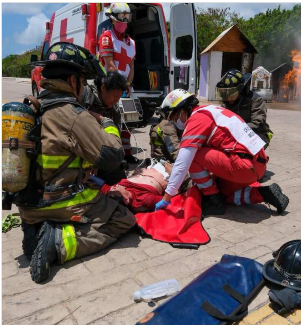
▲ Esta simulación en el Malecón Tajamar permitió que las fuerzas armadas y los cuerpos de emergencias pusieran en práctica sus protocolos de actuación.

En este ejercicio estuvieron involucrados y trabajando de manera coordinada, 60 elementos de diferentes institu-