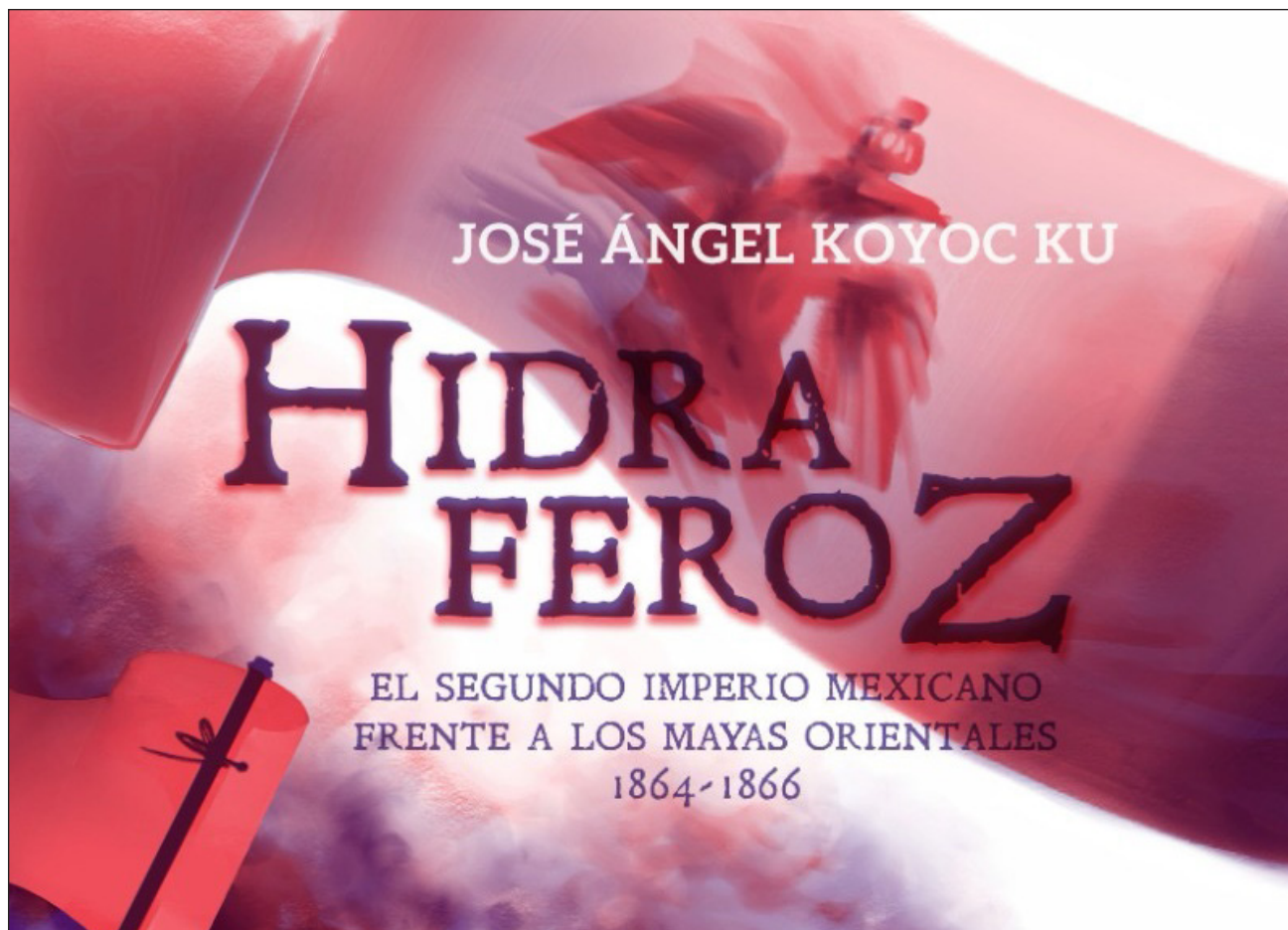
▲ Hidra feroz. Los mayas orientales frente al Segundo Imperio Mexicano recorre Kampocolché, Dzonot y Tihosuco.

La obra está disponible en Mérida en la librería Sempere y la cafetería Silvestre, y en Ciudad de México en Volcana.