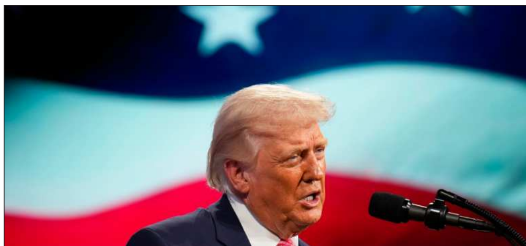
▲ Independientemente de quién figure al frente del país de las barras y las estrellas, ahí la máxima de ejercicio del poder es que toda política es interna, de manera que el grueso de la comunicación es para los estadounidenses y no necesariamente para el resto del país

De que existen los señalamientos, esto es innegable, pero la solicitud de la fiscalía federal estadounidense ha sido de detención con fines de extradición, para lo que existe un acuerdo entre ambos países. Por otra parte, la presidenta Claudia Sheinbaum ha visto bien el asunto desde la relación bilateral: ésta no ha cambiado, pues las bravuconadas de Trump han sido la constante fija. Mientras, su respuesta ha sido la que más respeto le ha ganado entre los líderes mundiales, porque también ha sido congruente desde que llegó a la Presidencia: "Siempre hay que tener la cabeza fría, analizar de dónde vienen las cosas y qué nos corresponde hacer".