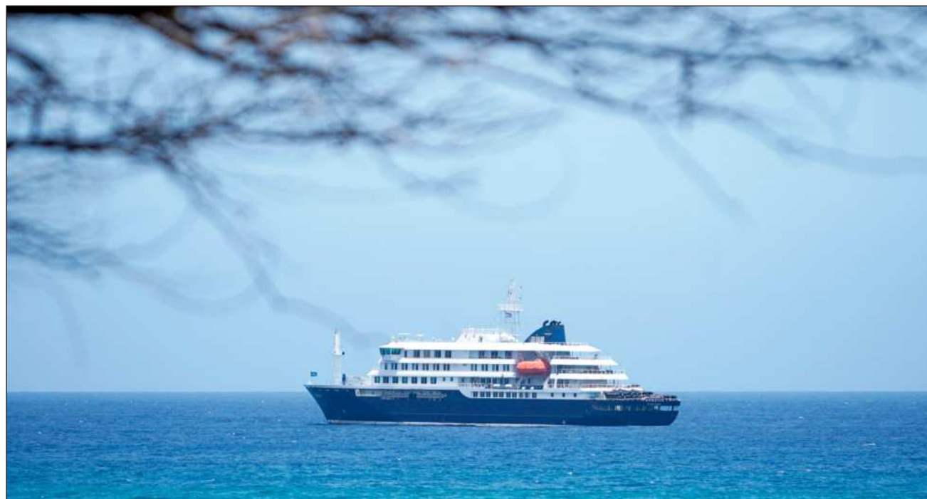
▲ Con esta evacuación ya no queda en el barco ninguna persona que presente síntomas de hantavirus entre los 146 pasajeros restantes.

Los tres pasajeros que resultaron contagiados fueron transportados vía aérea