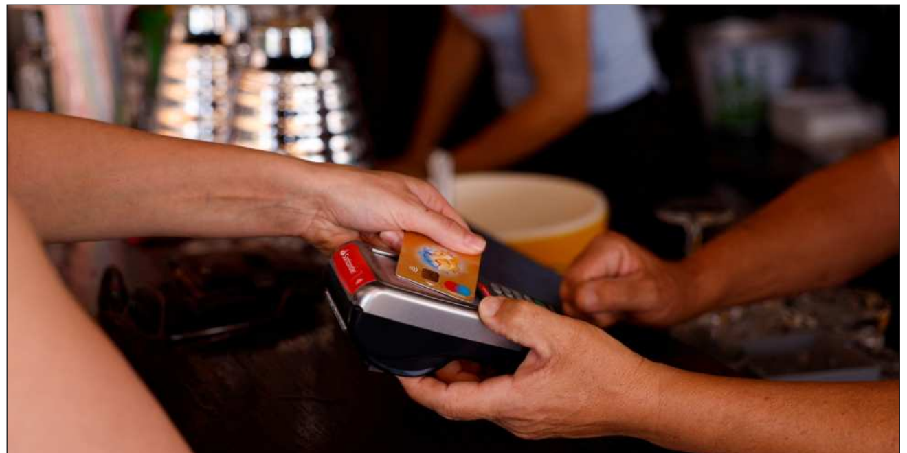
▲ El aumento en los niveles de morosidad observado en meses recientes responde a un ciclo natural del crédito.

“Sí está creciendo la morosidad del mercado en general. Ya estamos viendo quizás un punto asintótico donde ya estamos llegando pareciera ser que a donde debíamos ya de empezar a bajar. En Invex tenemos niveles bajos”, dijo el banquero.