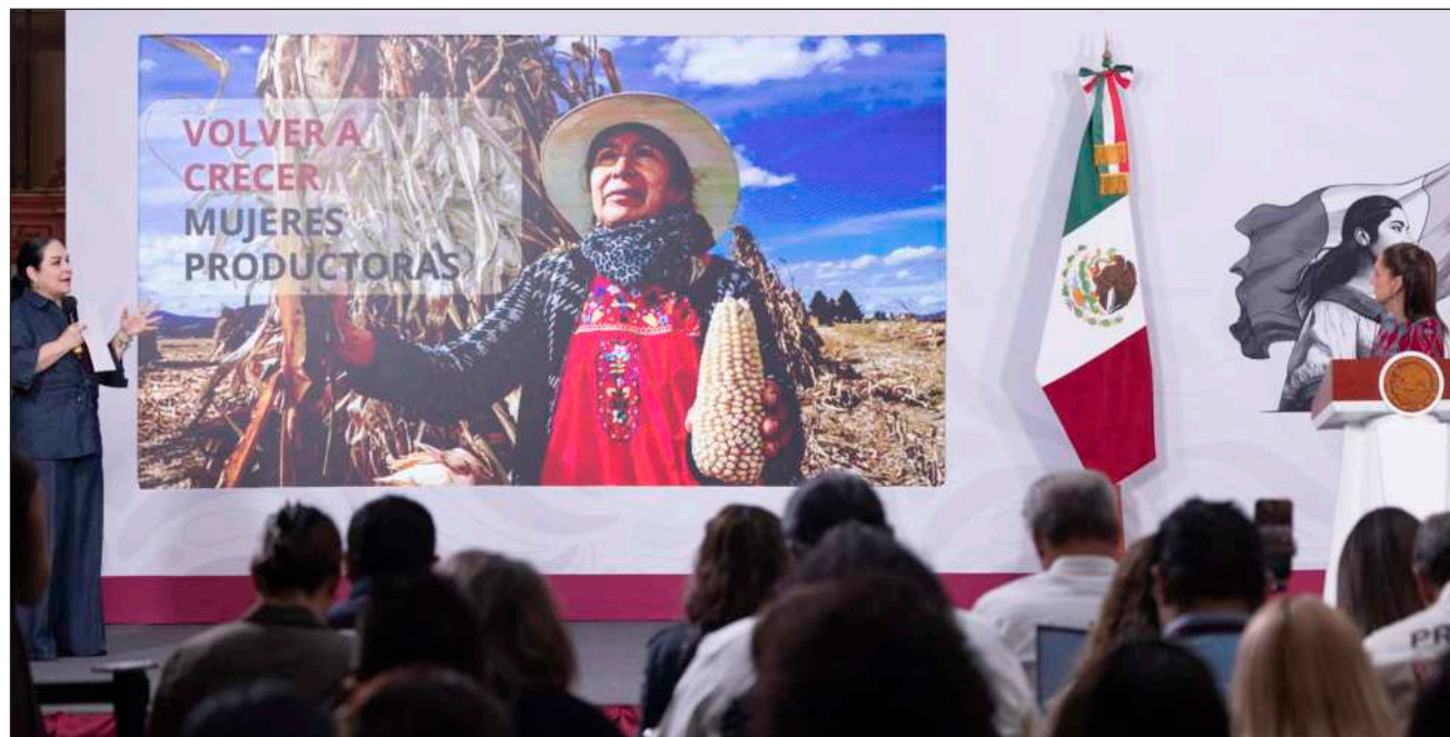
▲ Mónica Fernández Balboa dijo que con el apoyo, 99.9% de las mujeres productoras con créditos tendrán deudas liquidadas.

La Jefa del Ejecutivo Federal hizo un llamado a las y los productores a acercarse para renegociar sus deudas o para realizar su liquidación