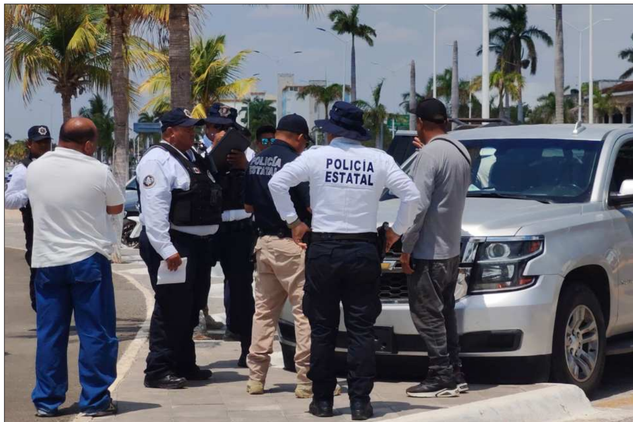
▲ Lo que sí se reportó en Campeche durante el primer trimestre del año fue el robo de motocicletas.

En todos los primeros trimestres desde 2015 hubo registro de robos de coches en Campeche, en 2023 fueron 35 o en 2022 alcanzaron 29, pero ahora el reporte 2026 fue de cero, a diferencia de los otros estados de la península que siempre han tenido registros de este tipo de robo.