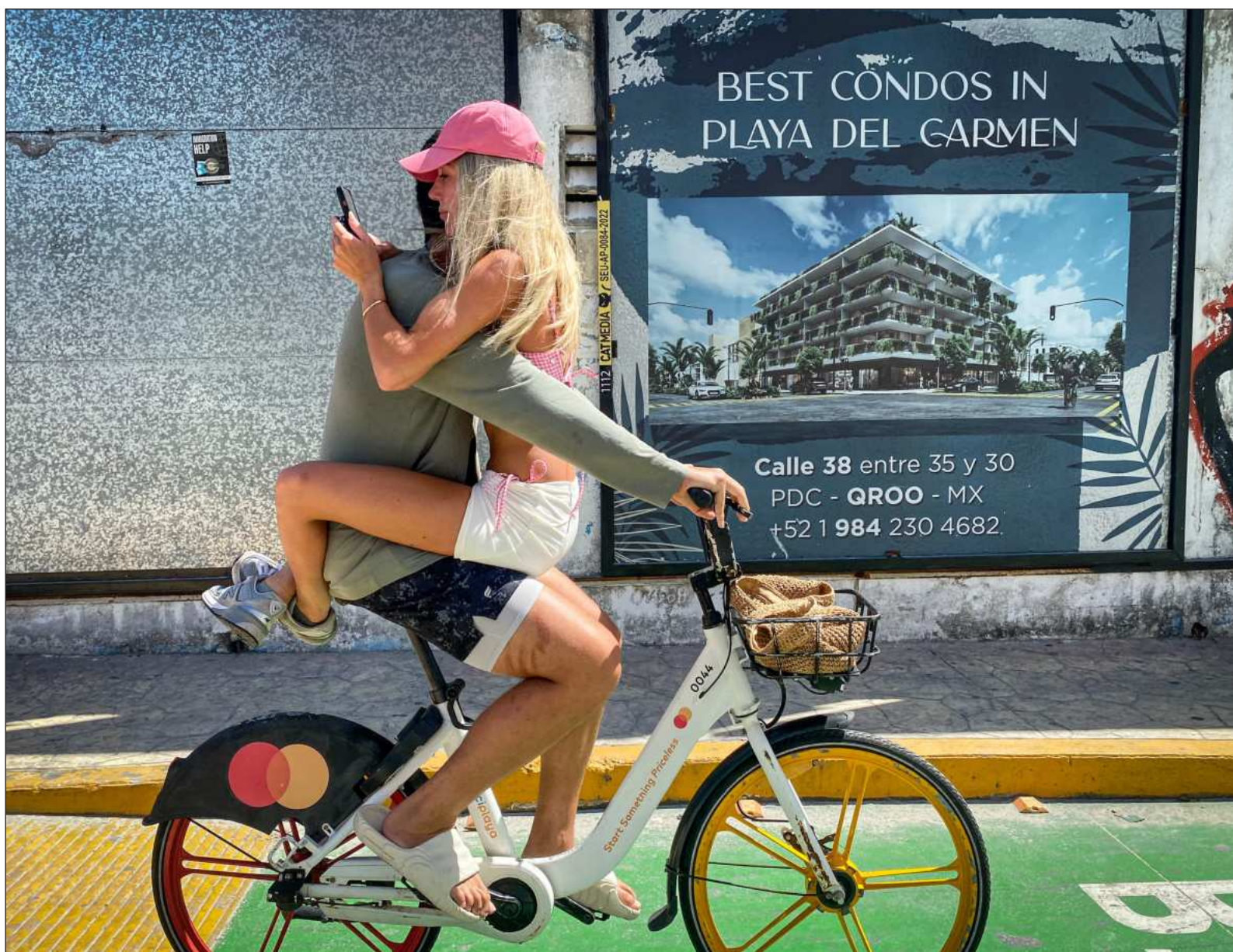
▲ "En una pareja ocurre algo parecido. Hay una molestia y no se nombra. En lugar de preguntar, cada uno se queda con su versión".

*También puedes leer el contenido de Lourdes Álvarez en Substack.