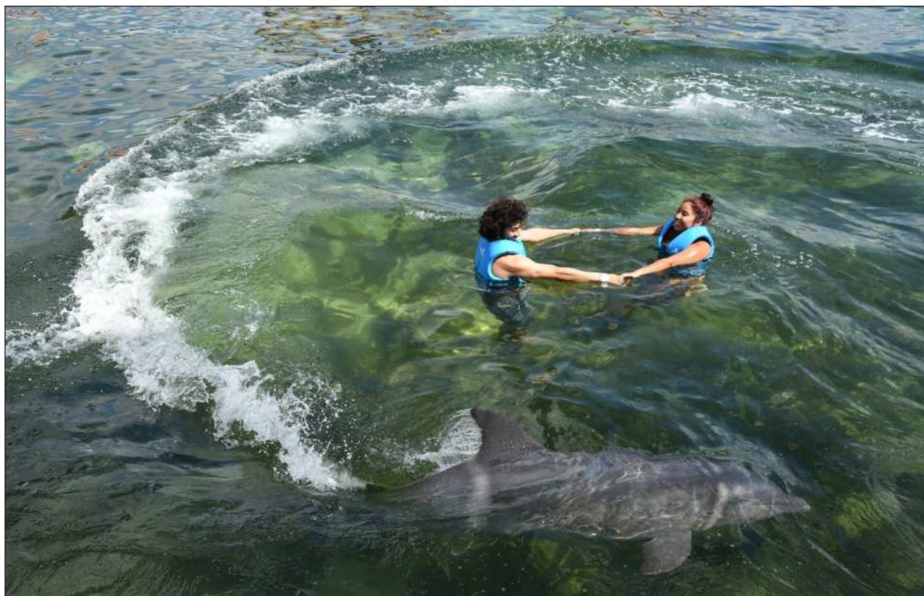
▲ La operación del nado tradicional continúa sin cambios significativos, pero preocupa la falta de un reglamento claro.

La situación se agrava por la recesión económica en Estados Unidos