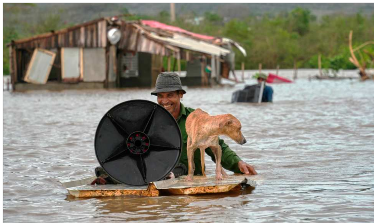
▲ El Insmet pronosticó el desarrollo de 11 organismos tropicales, cinco de los cuales podrían alcanzar la categoría de huracán.

“La temperatura superficial del mar en la franja tropical del Atlántico Norte ha registrado un cierto en-