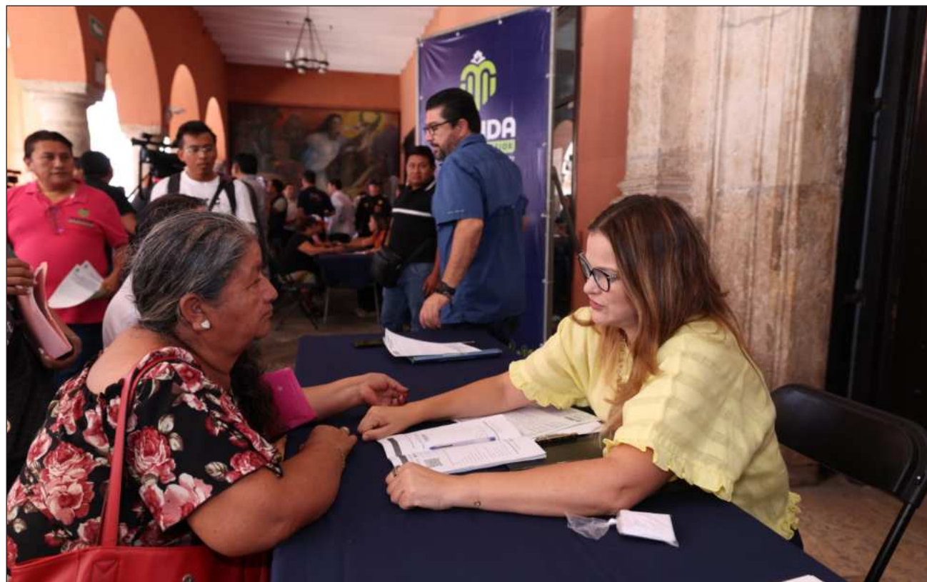
▲ Entre las principales demandas que la población ha expresado se encuentran temas relacionados con infraestructura urbana, servicios públicos y atención social, especificó la presidenta municipal.

La munícipe también destacó que este ejercicio de