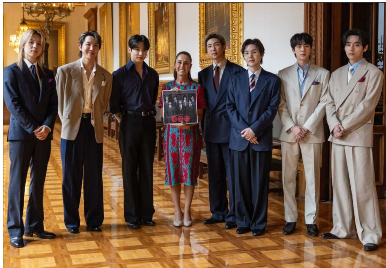
▲ Sheinbaum Pardo y BTS salieron por uno de los balcones del costado derecho de Palacio Nacional para saludar.

Después Kim Tae-Hyung, apodado V, tomó el micrófono y dijo: No hablo español muy bien, voy a intentarlo, extrañamos muchísimo a México, la energía aquí es increíble. Muchas gracias por