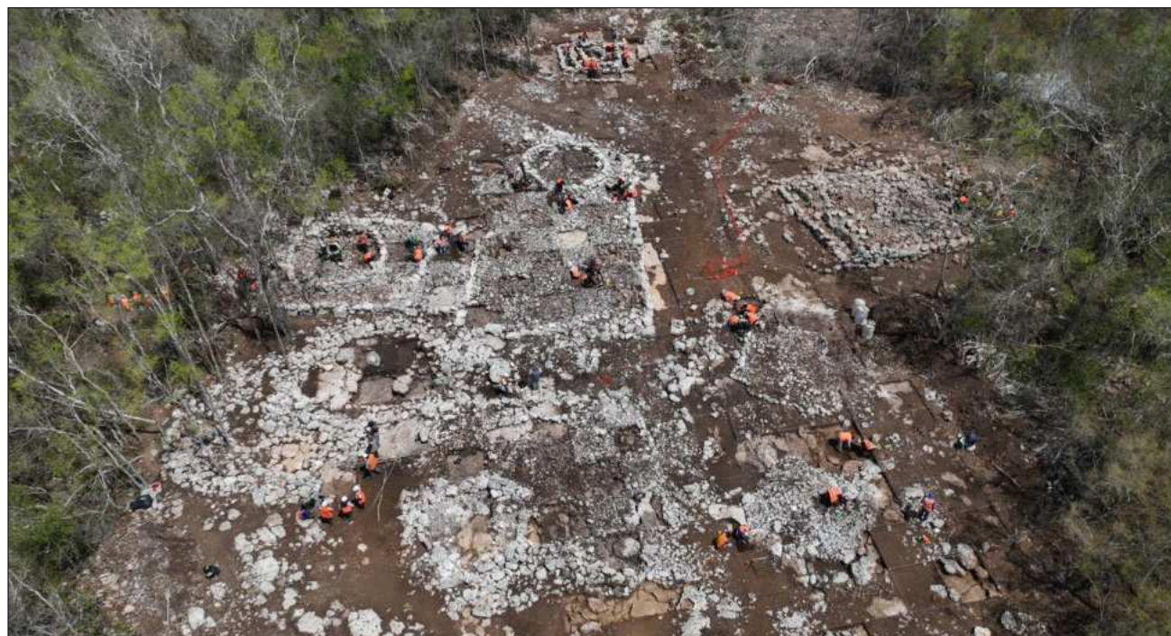
▲ El conjunto doméstico fue explorado por especialistas y personal capacitado durante el acompañamiento que el Instituto Nacional de Antropología e Historia realiza en la construcción del servicio ferroviario de carga del Tren Maya.