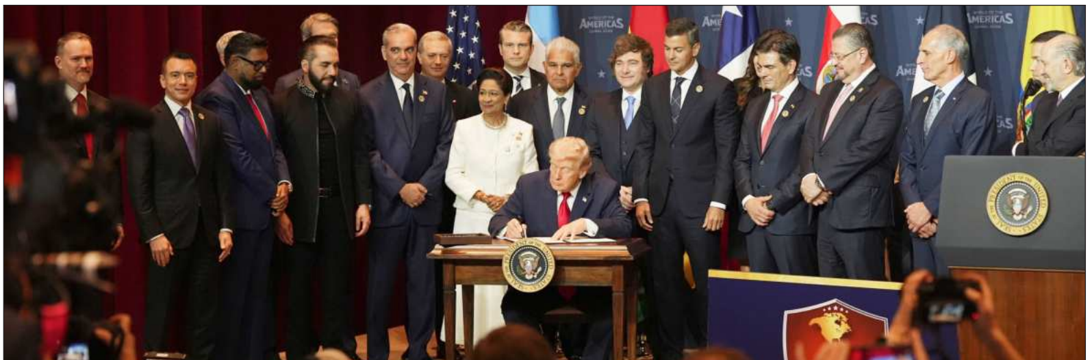
▲ "Las corrientes políticas de extrema derecha están representadas por la administración de EU con sus agencias, aliados y auxiliares".