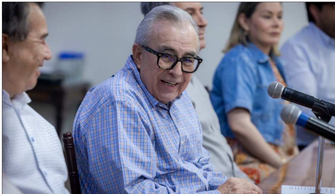
▲ Sobre la relación con Washington, la Presidenta destacó como muestra de entendimiento reciente el acuerdo en materia de transporte aéreo alcanzado con Estados Unidos, en el que México logró que se reconociera al AIFA dentro del esquema bilateral. Foto

"No hay una situación donde nosotros veamos que ha cambiado la relación con Estados Unidos", señaló, al tiempo que pidió actuar con