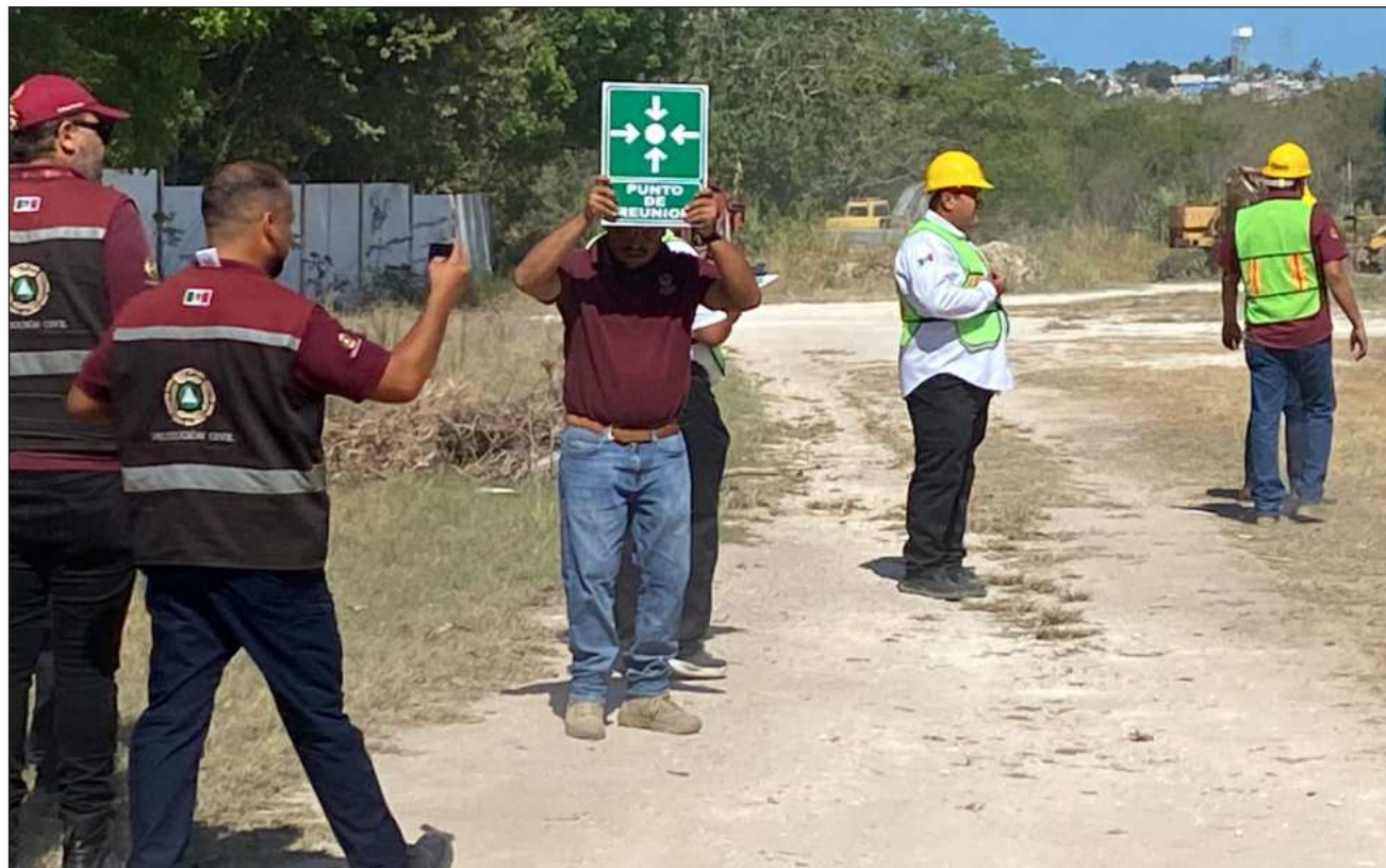
▲ En este Simulacro Nacional participaron dependencias federales, estatales, empresas y prestadores de servicios.

Las acciones también se replicaron en las plataformas de Pemex