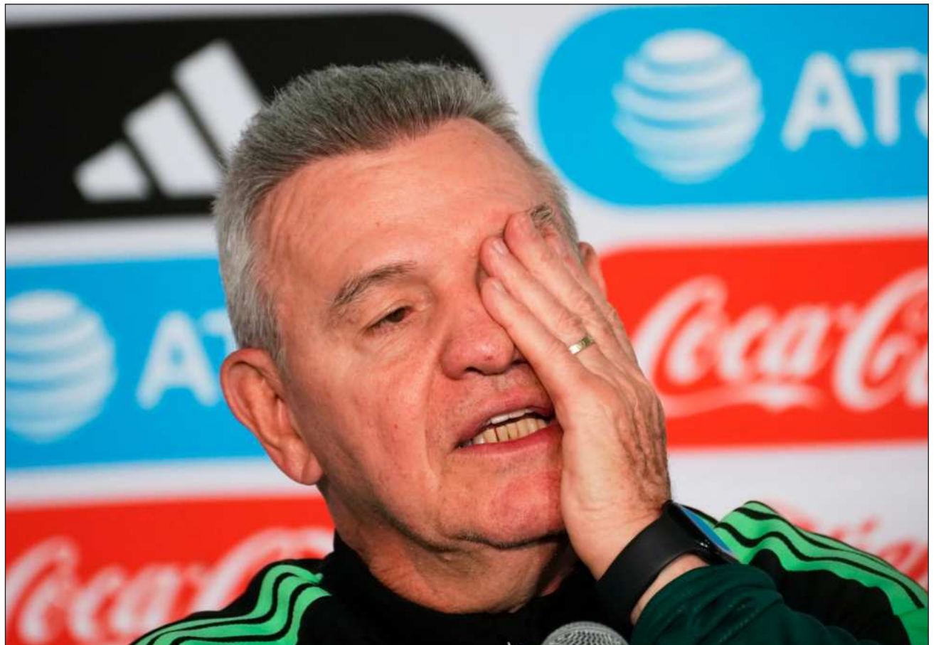
▲ “Están citados todos los convocados para estar cenando todos juntos a las 8 de la noche”, dijo Aguirre ante la prensa.

El pronunciamiento ocurre después de que la presidenta de México, Claudia Sheinbaum, anunciara que en los FIFA Fan Fest no habrá venta de alcohol, mientras que el gobernador del estado de Nuevo León, Samuel García, promovió la entrega de cerveza gratuita en actividades relacionadas con dicho torneo.