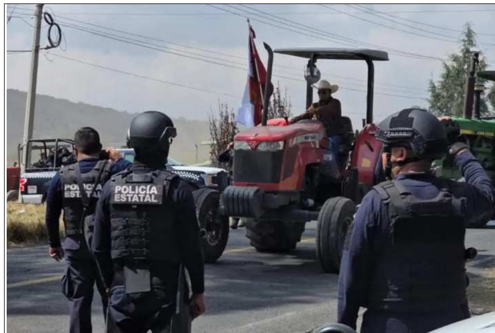
▲ Las autoridades federales indicaron que los bloqueos se realizan en Baja California, Chihuahua, Guanajuato, Morelos, Sinaloa, Tlaxcala, Veracruz y Zacatecas.

Las autoridades federales indicaron que los bloqueos, cierres o liberación de casetas de cobro en carretera, se realizan en Baja California, Chihuahua, Guanajuato, Morelos, Sinaloa, Tlaxcala, Veracruz y Zacatecas.