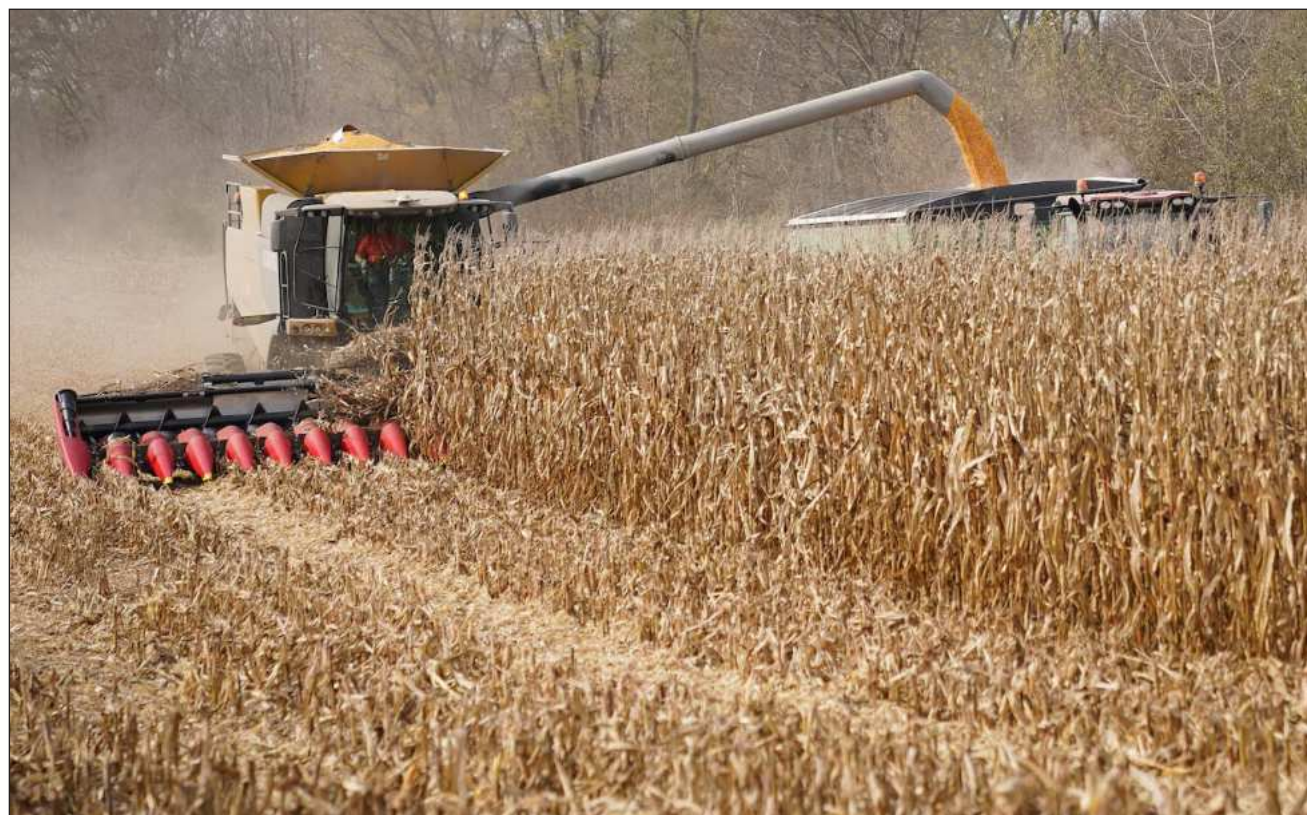
▲ La venta de maíz de EU a México representa un negocio redondo que supera 5 mil mdd, el cual está en gran parte controlado por corporaciones trasnacionales, como Archer Daniels Midland, Bayer, Bunge, Cargill, DeBuce y Bartlett Grain, entre otras.

México es el principal cliente de Estados Unidos en cuanto de maíz se trata. Muy atrás están Japón, que entre enero y febrero compró 2 millones 460 mil 108, y Corea del Sur, con un millón 198 mil 203 toneladas. En el cuarto y quinto sitios están Colombia, con 697 mil