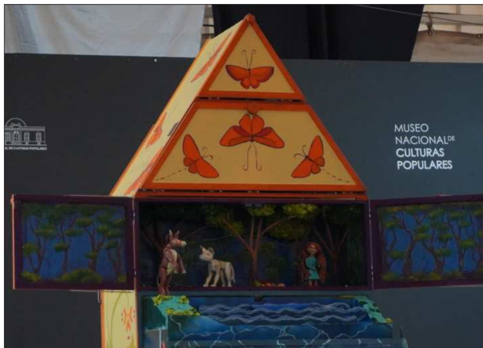
▲ La obra Ga ñomújí yombaro/El aleteo de las mariposas aborda cómo vamos dejando de lado el conocimiento de nuestros antecesores.

Además de la historia en torno a su abuela, Marinclán tomó en cuenta el entorno de las mujeres mazahuas, el bosque del pueblo y notó que en Michoacán son comunidades madereras. “Para crear la obra empecé a involucrarme con colectivos que