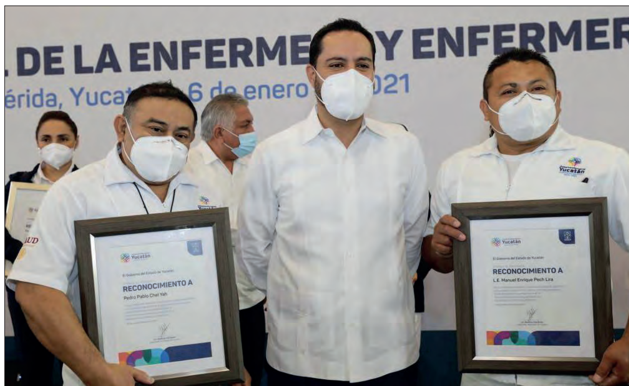
▲ En su día, 33 enfermeros y enfermeras recibieron un reconocimiento por parte del gobernador, Mauricio Vila Dosal.

Por otro lado, detalló que la pandemia del COVID-19 ha agilizado los trámites de pensión de los miembros del Sindicato.