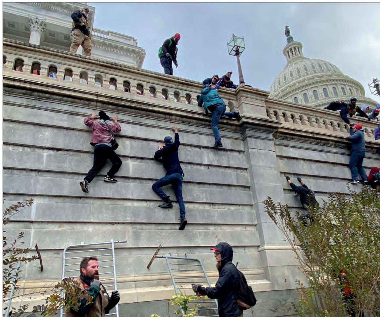
▲ Anteriormente, Donald Trump pidió a sus partidarios que fueran al Congreso para presionar a los republicanos para que se opusieran a la certificación de la victoria de Joe Biden en las elecciones.

Entiendo que les duela, que estén lastimados. Tuvimos una gran elección y nos robaron