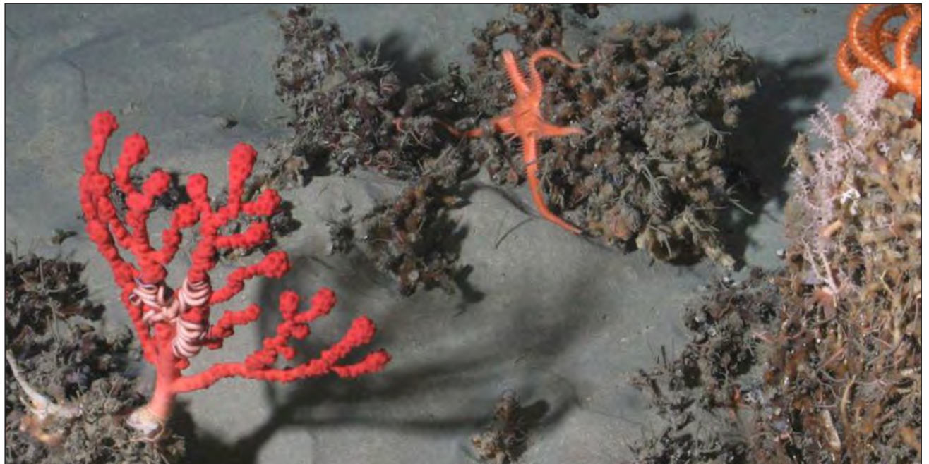
▲ Los científicos descubrieron además un campo de emisiones termales del fondo marino en las Azores. En la imagen, corales de agua fría y estrellas de mar.