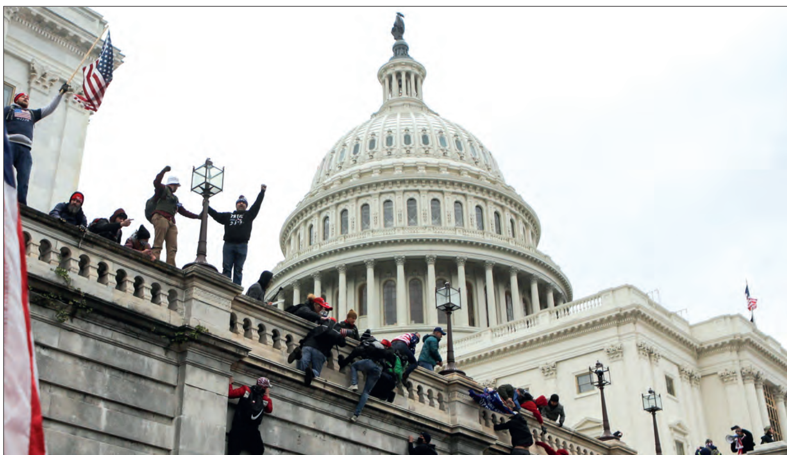
▲ If there is any justice to be had, Trump must be removed from office immediately, arrested and tried for sedition.