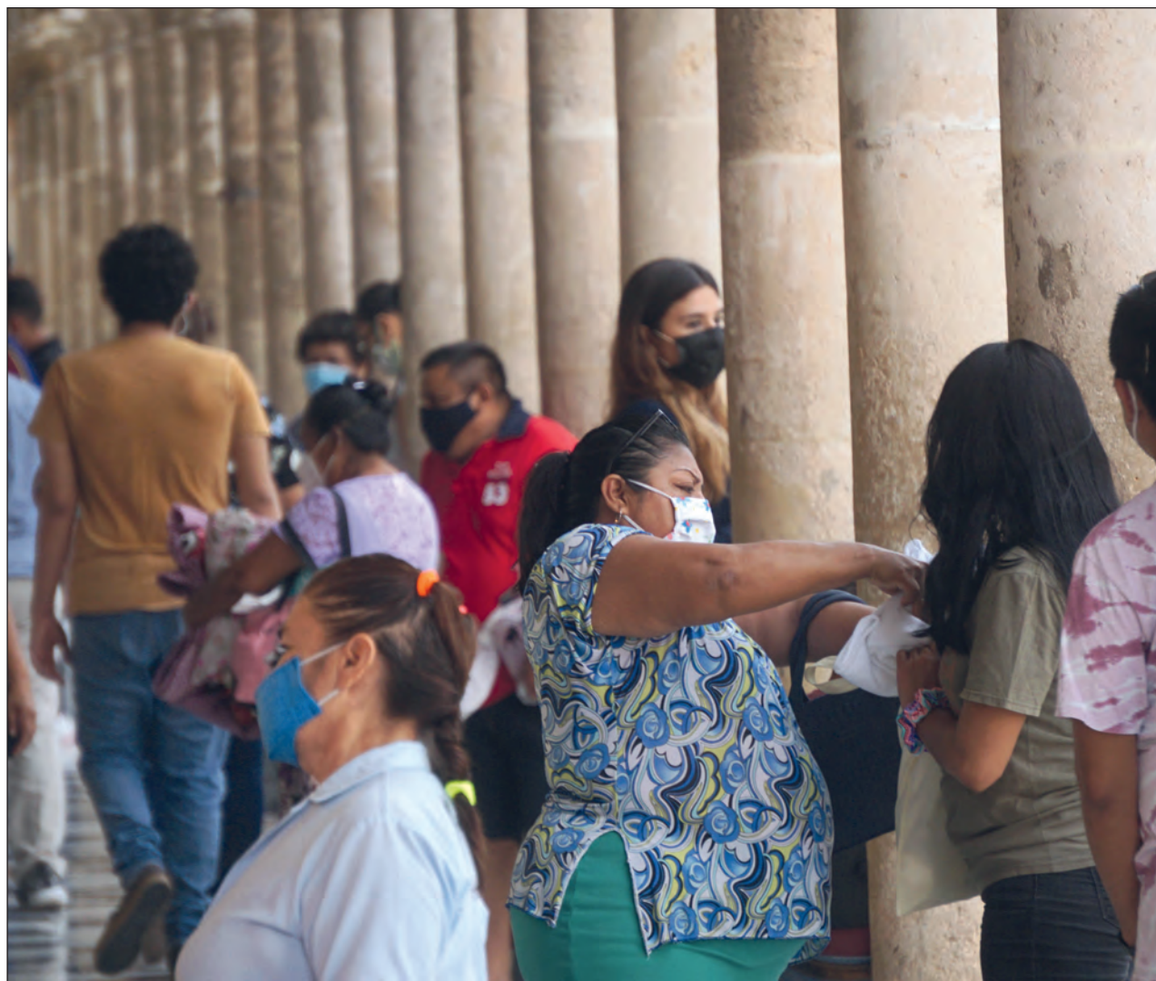
▲ Las mujeres componen el 37.4 por ciento de la Población Económicamente Activa de Campeche.

Sin embargo, la funcionaria federal sostuvo que la violencia de género persiste y aún hay personas que piensan que la obligación de una mujer es atender su casa, a los hijos.