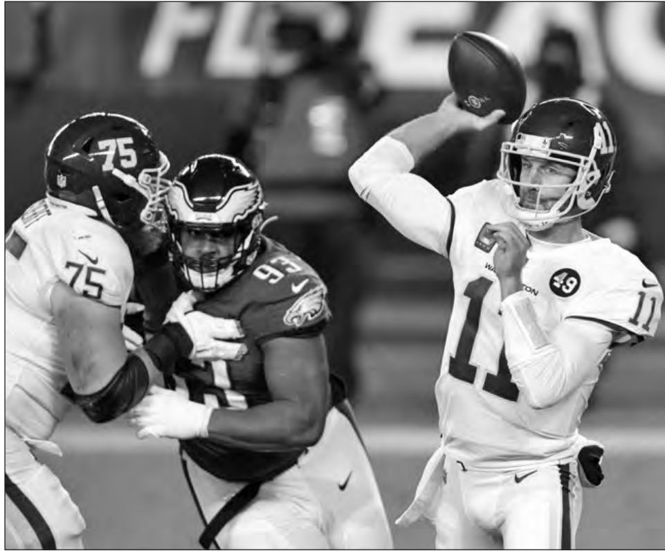
▲ Alex Smith y Washington buscarán sorprender a Tom Brady y los Bucaneros en los playoffs.

perando las expectativas y demostrando que el entrenador Ron Rivera estaba en lo correcto al decidir que el ataque funcionaría mejor con un capitán experimentado.