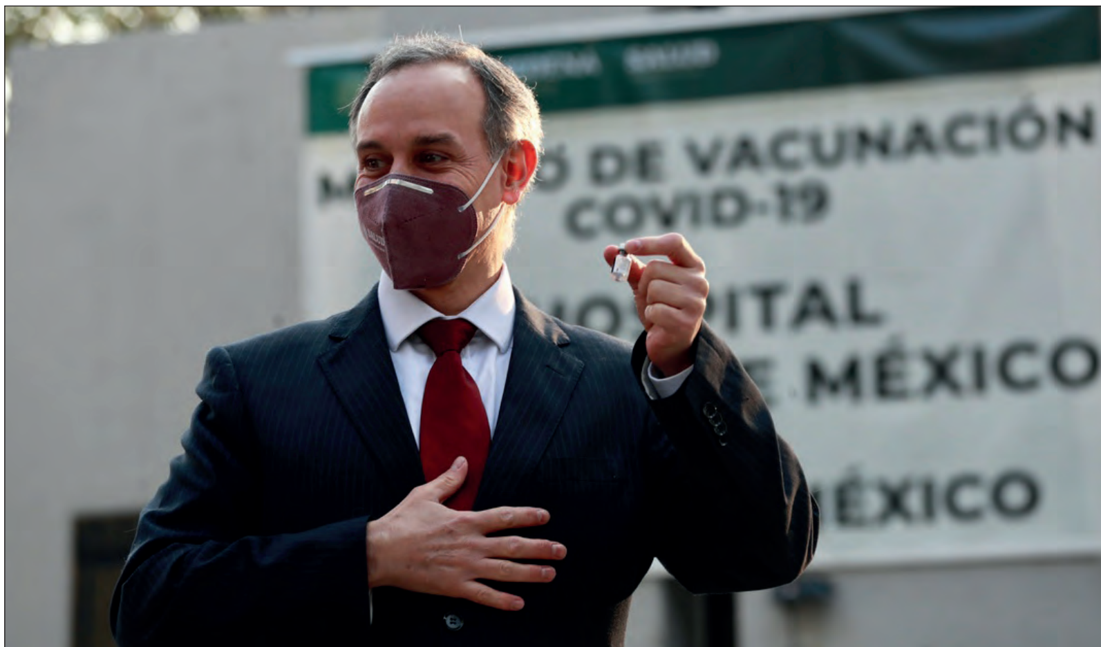
▲ Una y otra vez, la oposición arremete contra todos los colaboradores de AMLO, como el subsecretario de Salud Hugo López-Gatell, que ha sido un escollo para imponer el caos que pretende con el manejo de la pandemia.