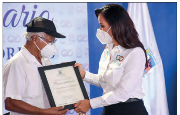
▲ La alcaldesa entregó reconocimientos a portomorelenses distinguidos por su contribución a la sociedad.

Durante la VI Sesión Solemne, la alcaldesa y los representantes de los tres poderes del estado entregaron reconocimientos a