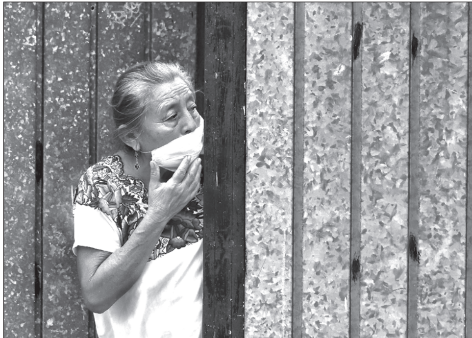
▲ Activista maya refiere que al no permitir candidaturas indígenas es una violación de los derechos ciudadanos.

"Exigimos el reconocimiento de los derechos de los pueblos originarios indígenas mayas sin discriminación alguna, obstáculos jurídicos o legales; tenemos el derecho de votar y ser votados en puestos de elección popular", aseguró.