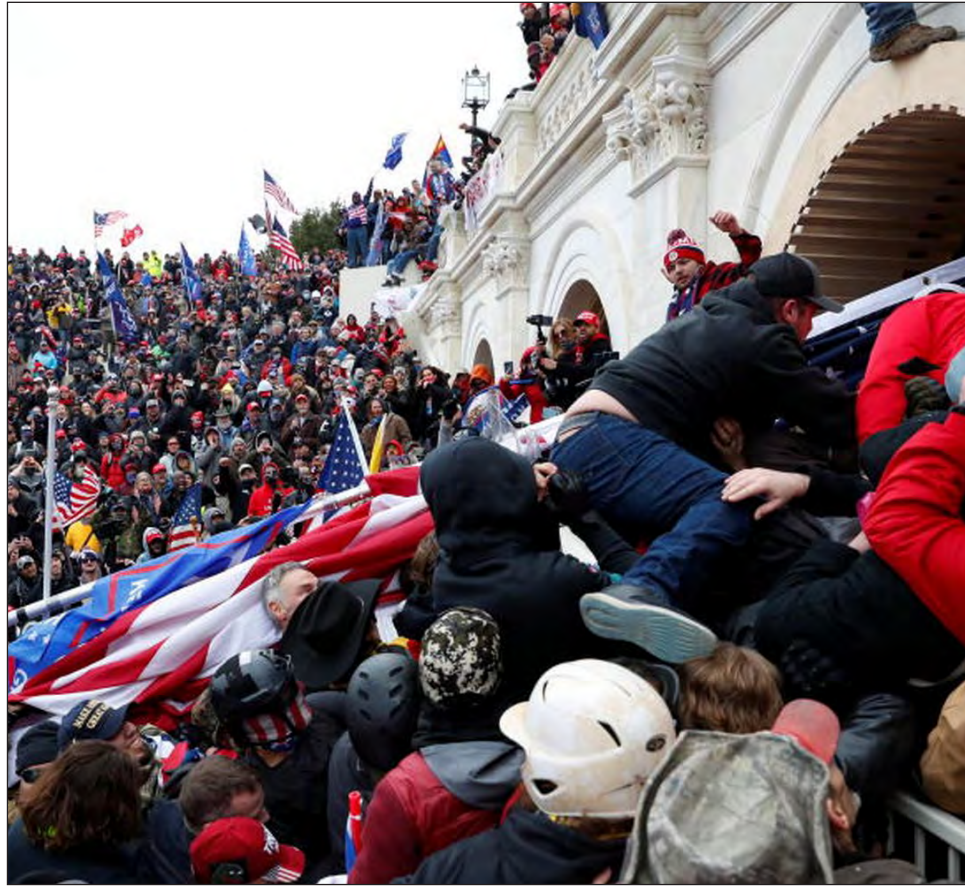
▲ Twitter dijo que requirió la eliminación de los tuits de Trump "como resultado de la situación violenta sin precedentes y en curso en Washington, D.C.".

La empresa dijo que si tuits, en los que el presidente promueve afirmaciones infundadas sobre la elección, no eran eliminados la cuenta permanecería bloqueada, por lo que el presidente no podría tuitear más desde @realDonaldTrump.