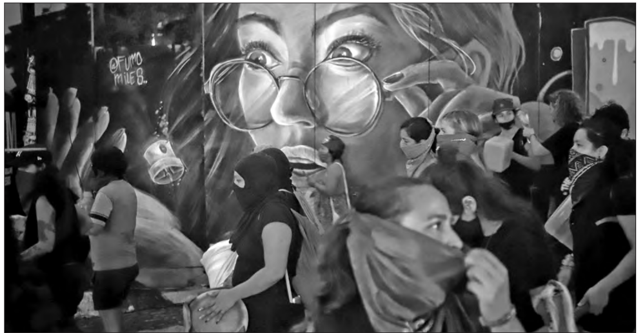
▲ En Quintana Roo, colectivos feministas mantienen tomado el congreso local desde hace 39 días para exigir que se despenalice el aborto.

Roo, donde colectivos feministas mantienen tomado el congreso local desde hace 39 días para exigir que se despenalice el aborto, durante la emergencia sanitaria por COVID-19 se han incrementado las solicitudes de acompañamiento para interrumpir un embarazo.