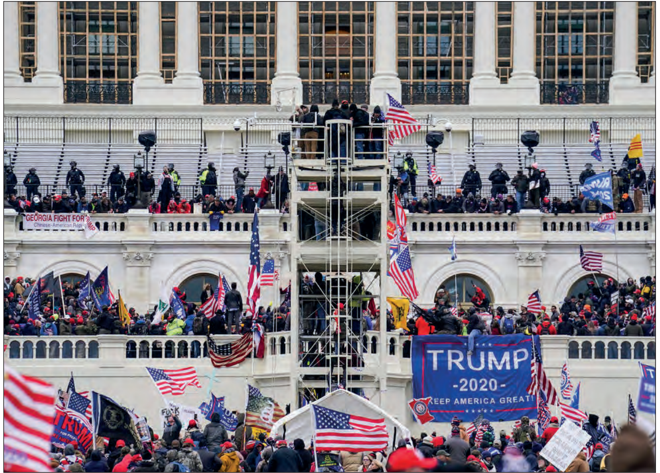
▲ Jo'oljeak miércolese' yanchaj xwo'okinil ichil Capitolio, tumen máaxo'ob táakmuk'tik Donald Trumpe' ma' ki'imak u yóolo'ob ikil yaan ka'ach u je'ets'el u náajalil Joe Biden ti' le ts'ook yéeytambal yanchajo', ti'al u beetik u jala'achil Estados Unidos.

"Kin na'atik ku yaatal ta wóole'ex, beeta'an a yaj óolale'ex. Yanchaj yéeytambal ka okolta'abo'on. Jujump'iitil úuchik u ya'abtal u wóowolal knáajal (yéeytambalo'ob)