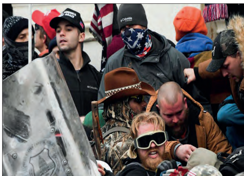
▲ Las protestas en contra de la certificación de Joe Biden dejan saldo de una mujer muerta luego de recibir un disparo en el hombro.