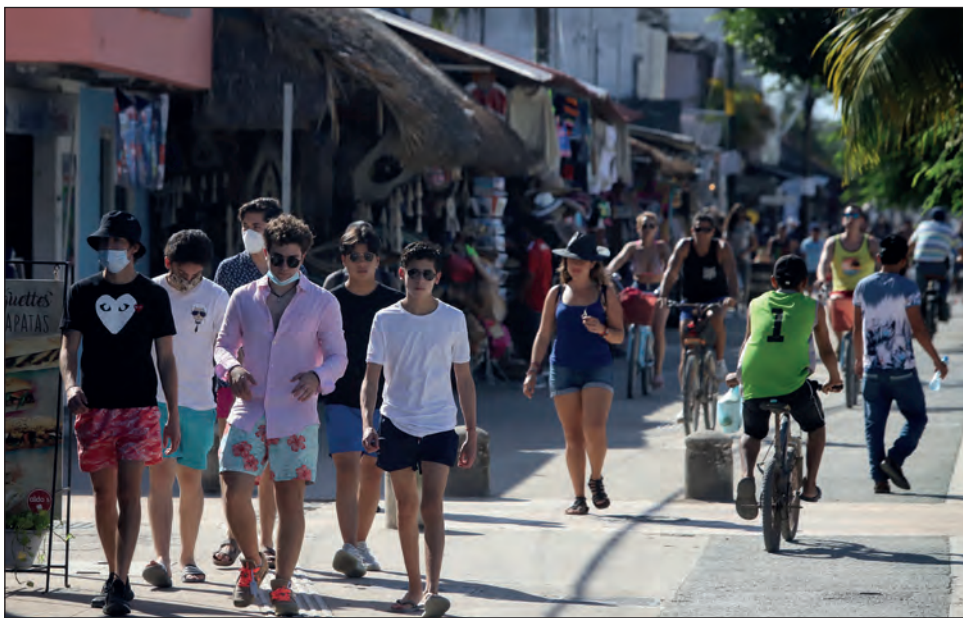
▲ De acuerdo con el Consejo de Promoción Turística de Quintana Roo, se espera que en el segundo semestre de este 2021, los números de crecimiento empezarán a acercarse a los de años anteriores.