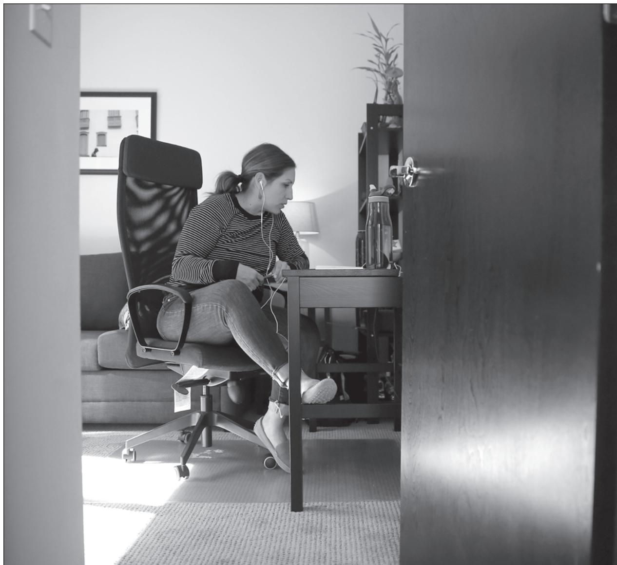
▲ La ONU expuso que se ha documentado el envío de videos pornográficos no solicitados y amenazas y contenido sexista contra las usuarias cuando están en reuniones en línea.

Por lo que respecta a la ocupación hospitalaria, destacó que la tasa nacional es de 55 por ciento para camas generales, y de 46 por ciento para camas con ventilador. Reportó con más de 70 por ciento de ocupación de camas generales a la Ciudad de México (88 por ciento); estado de México (83 por ciento); Hidalgo (77 por ciento); Guanajuato (80 por ciento), Nuevo León (79 por ciento) y Baja California (74 por ciento).