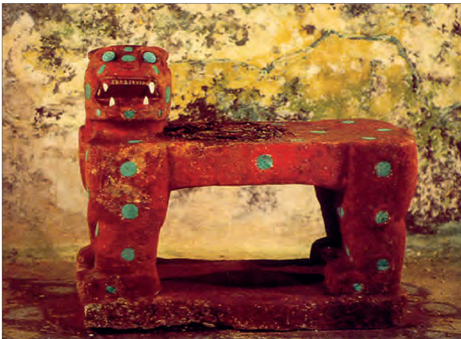
▲ Anteriormente, quienes visitaban Chichén Itzá podían acceder a las pirámides, incluso ingresar a la subestructura de la pirámide del castillo y observar el Chac mool y el Trono de Jaguar Rojo sin embargo, las autoridades decidieron revertir esta medida para evitar el deterioro de las estructuras.