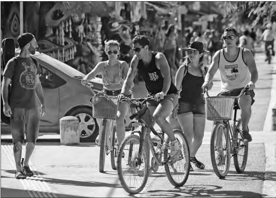
▲ La cadena hotelera Marriott anunció que abrirá en febrero de este año su primer hotel en Tulum, Aloft.