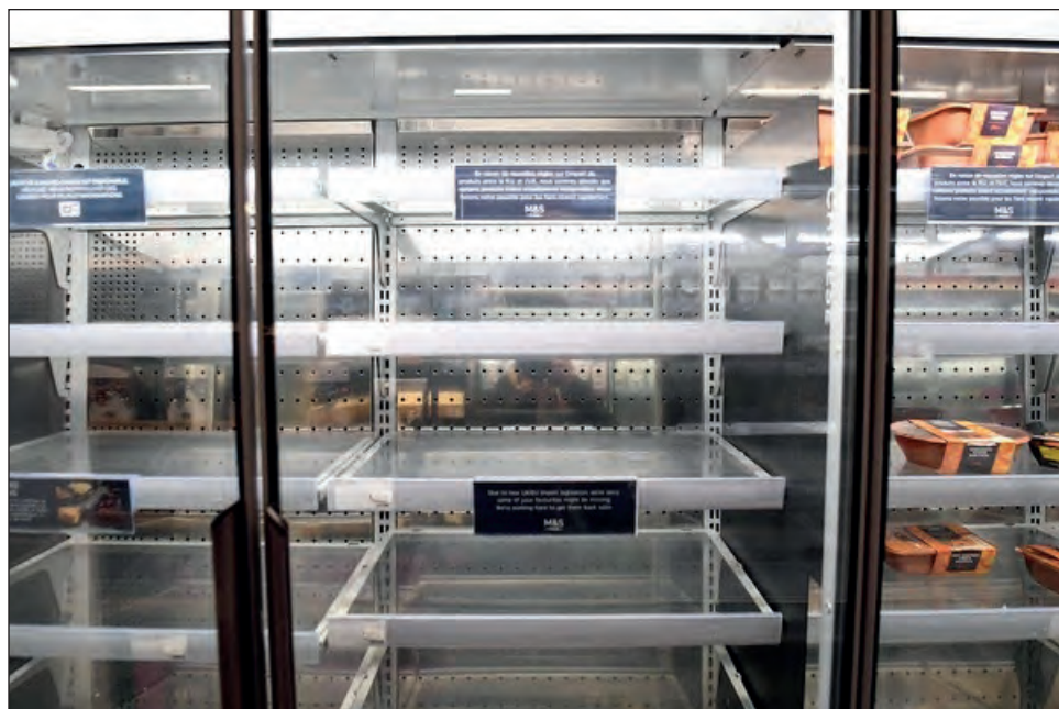
▲ Ante la entrada en vigor del Brexit, las tiendas británicas 'Marks & Spencer' en Francia reportaron falta de suministros.

Irlanda del Norte goza de disposiciones aduaneras específicas. Sin embargo, los productos agroalimen-