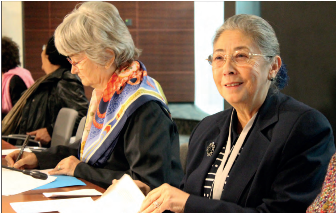
▲ Crear el Registro Nacional de Archivos, como se tiene en Francia, puso a México en la comunidad internacional.

para su crecimiento. La documentación está en buen estado, sin embargo, los espacios son limitados para lo que debe resguardar, que son todos los documentos de gobiernos anteriores. Es necesario que se piense en estas instituciones como lo que son verdaderamente: el corazón de la administración. Es ahí donde se resguarda la sabiduría de la administración pública, en ellos encontramos cómo se ha gobernado, cómo han trabajado las anteriores administraciones; nunca le hacemos caso, siempre se gobierna como hasta el día de hoy. Todos los días inventamos México y no hay antecedentes a acciones que se vienen repitiendo desde hace 50 años porque los archivos no son tomados en cuenta, sabemos lo que se hizo hace uno o dos sexenios, pero muy poca gente recuerda si hubo una acción referente a esa necesidad que sigue siendo perenne en el estado.