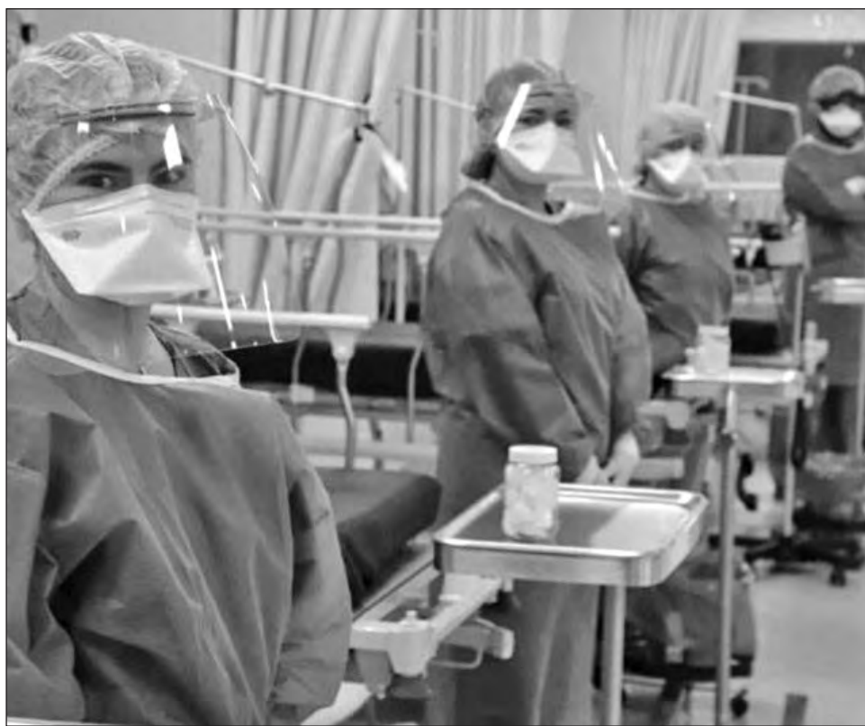
▲ En Quintana Roo hay cerca de 9 mil profesionales de enfermería; 80% de éstos son mujeres.

“Eso no quiere decir que por tradición no sigamos celebrando y felicitándonos en enero, sobretodo por este pasado 2020 que fue tan difícil, muy duro para el