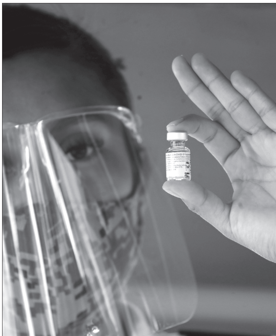
▲ El gobierno federal inició el padrón del personal médico que será inmunizado.

La mutación, que se transmite con más rapidez, “no es catastrófica en el sentido de que está fuera de control y no se puede hacer nada”, dijo.