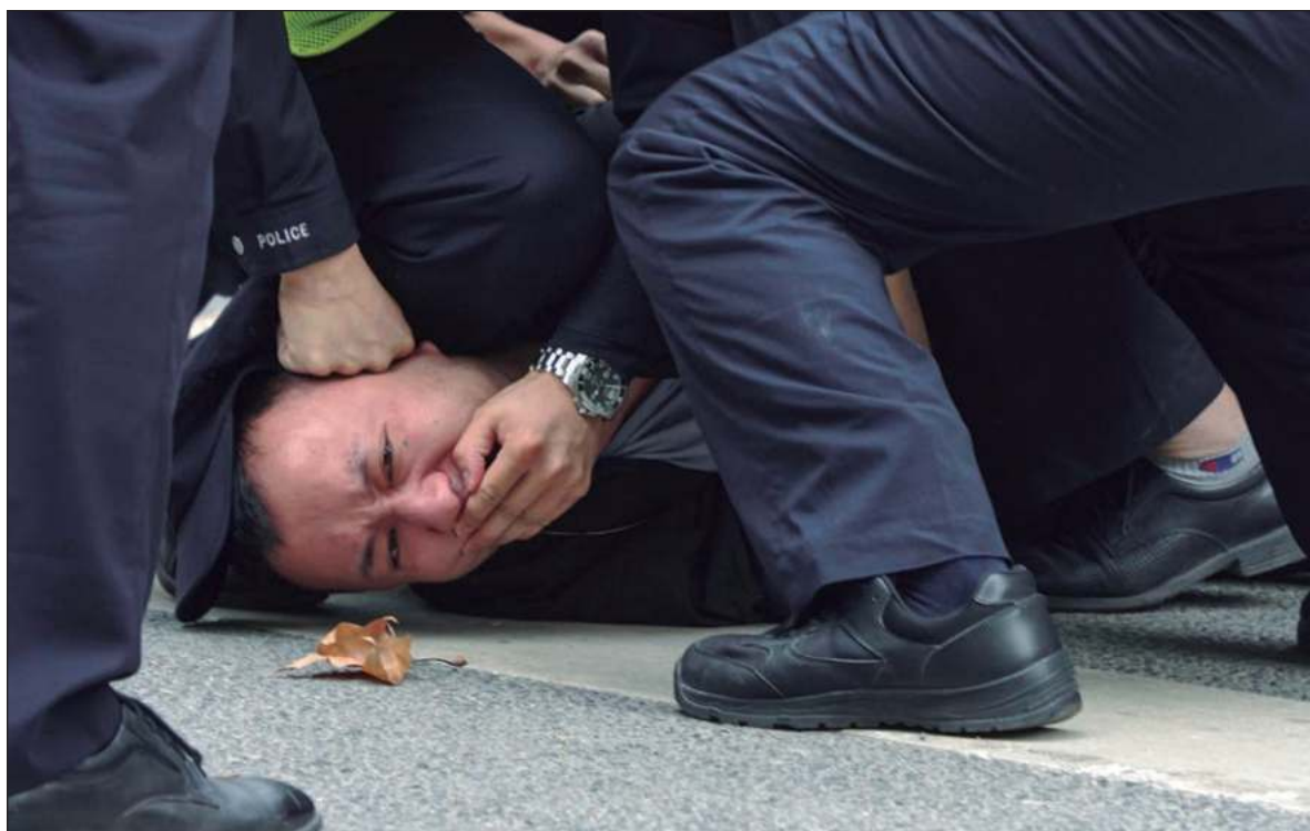
▲ "During the past few months, we have seen how this axis of dictatorships has met its match in populations fed up with increased oppression, who believe that fighting is the only possible recourse".

EACH HAS HAD its breaking point, and each is undergoing a strong challenge to its power and hold over its population.