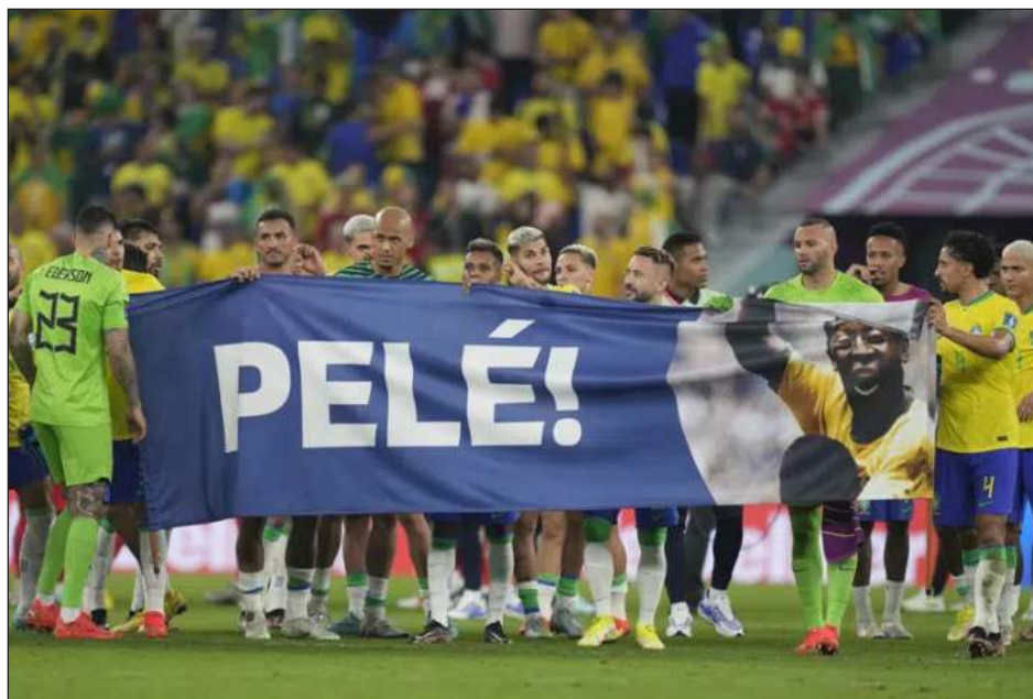
▲ Los jugadores de Brasil sostienen una pancarta en honor de Pelé.

“No quiero que se malinterprete. Traté de ocultarme, pero sé que hay cámaras”, dijo Tite sobre su celebración. “Lo hice más por un sentimiento de felicidad por el equipo, por el resultado y no porque estamos faltándoles al respeto