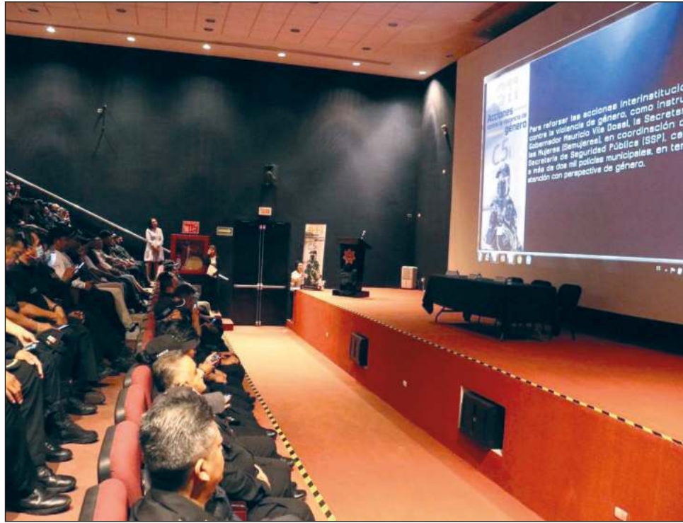
▲ El taller sobre perspectiva de género ante situaciones de violencia, impartido por la SSP y Semujeres, busca reforzar las acciones interinstitucionales.

“Trabajando de la mano, seguimos avanzando en la construcción de un estado más seguro e igualitario para las mujeres; gracias por sumar esfuerzos con nosotras, estamos seguras que brindarán una atención más efectiva y sin revictimizar”, detalló.