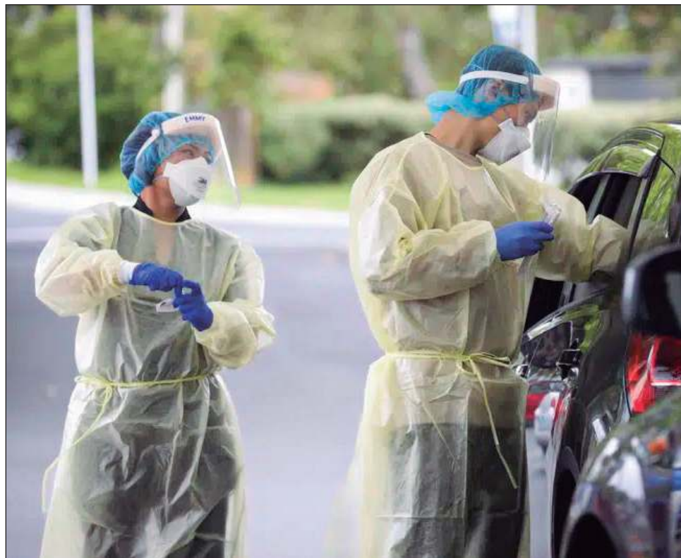
▲ Una de las cuestiones analizadas será si el gobierno adoptó la estrategia adecuada al imponer estrictos confinamientos y controles de cuarentena fronterizos.

Pero con el tiempo, los inconvenientes de ese en-