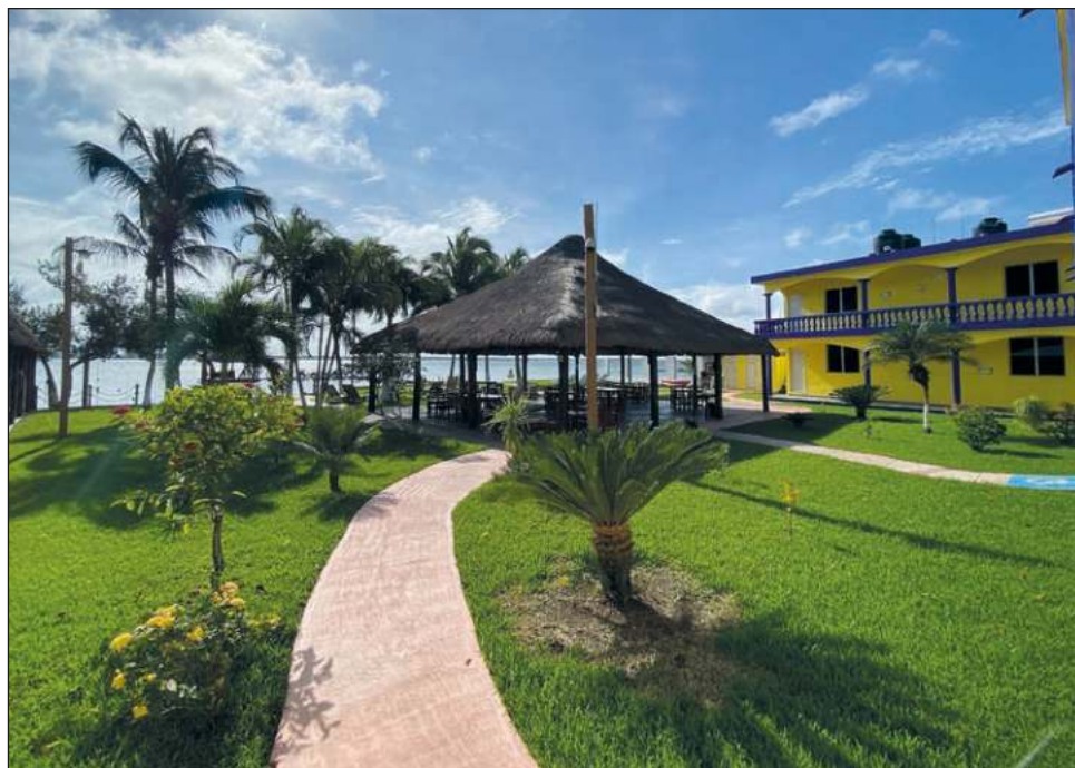
▲ El cobro por Impuesto al Hospedaje pasará de 3 a 5 por ciento a partir de 2023, lo cual —afirman hoteleros— ocasionará pérdida de competitividad.

Desde el norte y hasta el sur del estado, los hoteleros