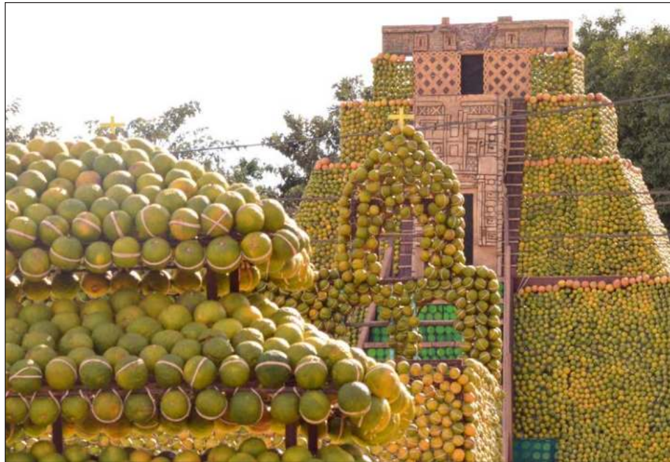
▲ En la Feria de la Naranja, los expositores también presentarán productos elaborados con el cítrico, y se llevarán a cabo actividades como shows infantiles y de comedia.

El alcalde resaltó que llevan 36 años celebrando esta feria y solamente estuvo interrumpida debido a la pandemia, pero ahora el esfuerzo continúa para