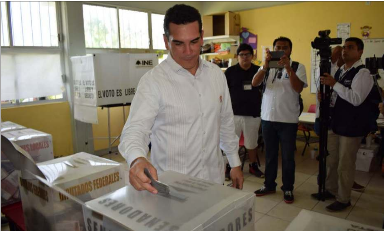
▲ El Presidente recordó que en contra de Alejandro Moreno Cárdenas hay varias investigaciones y “lo que yo tengo como criterio es que actúen con libertad las autoridades de justicia porque ya no hay consigna contra nadie”.