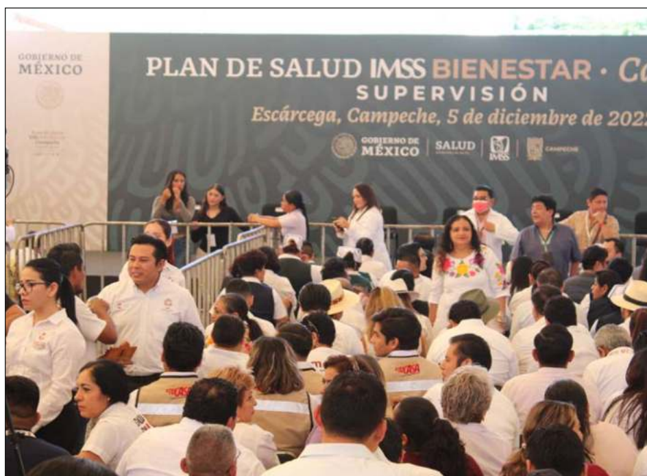
▲ Hospital en Escárcega, que cuenta con nuevo modelo de atención, podrá asistir al menos a 200 mil personas de la cabecera municipal, Calakmul y Candelaria.

Dio a conocer que Campeche se integra al IMSS Bienestar, lo mismo que otros estados como Colima, Tlaxcala, Baja California Sur, Sonora, Sinaloa, Querétaro y Veracruz, que contempla la rehabilitación de hospitales.