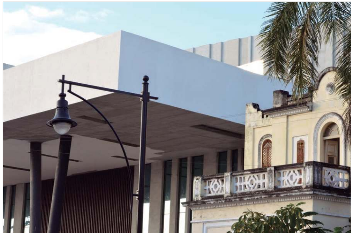
▲ “Mucha gente de la que aquí vivimos, aunque ahora tengamos más parques, restaurantes, hoteles, bares, y demás virtudes de una ciudad moderna, preferimos la parsimonia de la vida tropical”.

Nosotros pudimos comprar casa aquí, pero al nivel de precios que estamos llegando por esta presión especulativa, no estoy seguro que mis hijos (nacidos aquí) puedan hacer lo propio en Mérida... A menos que reviente la burbuja inmobiliaria, porque claramente hay más oferta que demanda; eso, además de la crisis económica que se derivó del confinamiento por Covid-19 explica tantas casas, apartamentos, lotes y locales comerciales vacíos, en venta o renta. A mi juicio no hay garantía de éxito en esta vorágine, pero eso no la detiene. A menos que se intervenga decididamente, los