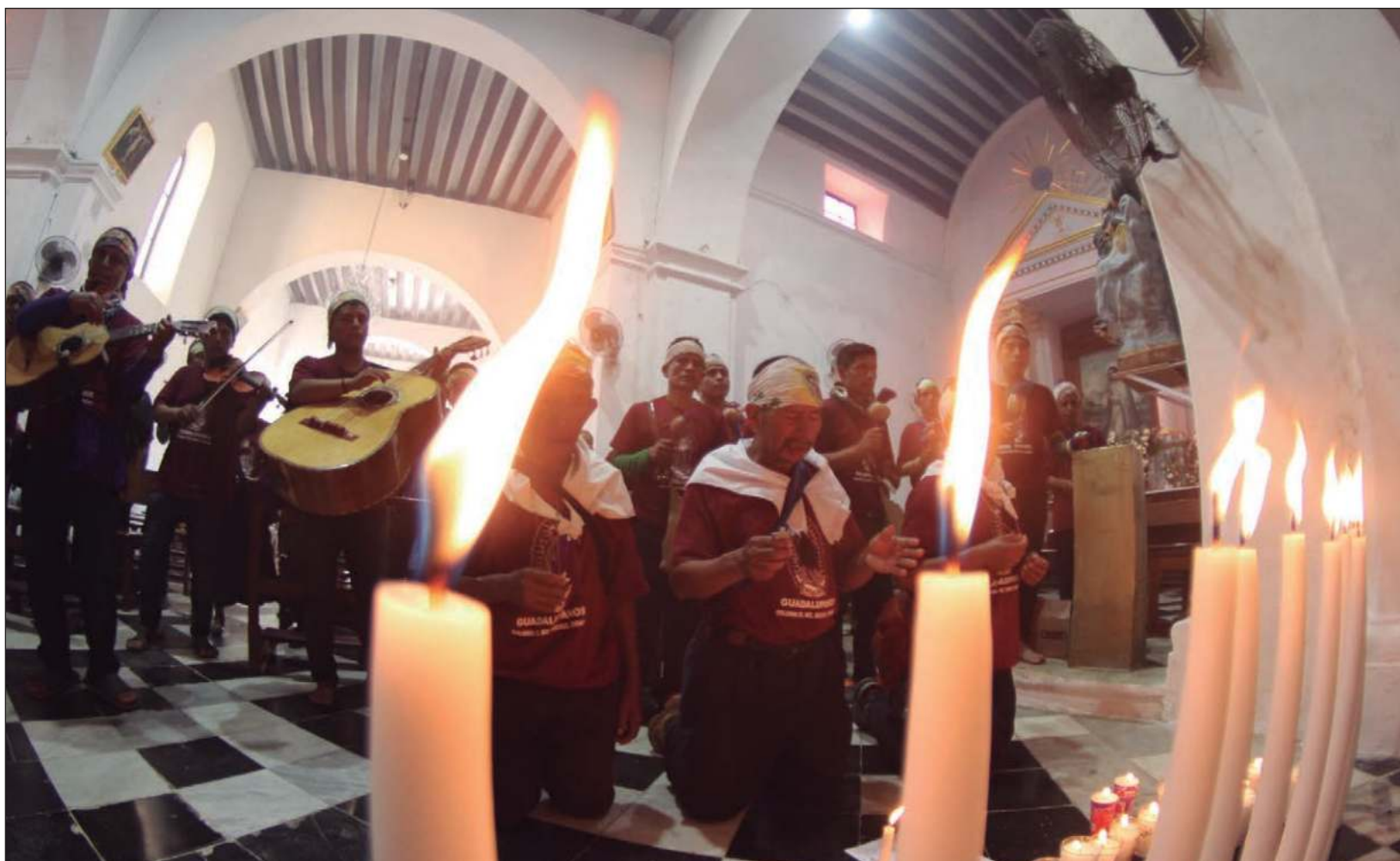
▲ Peregrinos de diversas partes del país comienzan a llegar al santuario guadalupano en San Francisco de Campeche. Algunos se encuentran de paso, mientras otros tienen en esta ciudad su destino. En la imagen, antorchistas provenientes de Oxchuc, Chiapas, en escala hacia Yucatán.