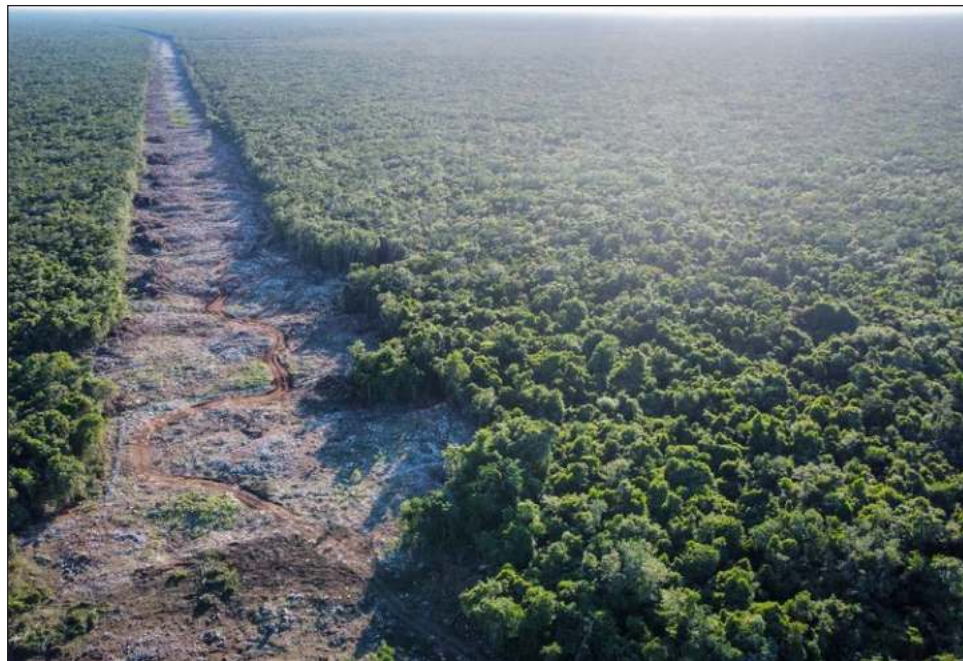
▲ El presidente Andrés Manuel López Obrador anunció que construirán un puente atirantado de 80 metros para brincar una cueva localizada en el tramo.

“Todo impacta y todo está medido, pero es mínimo el efecto que tiene, porque donde va a entrar el pilote no hay nada que signifique afectar un manto acuífero, una cueva, mucho menos un sitio arqueológico, que los