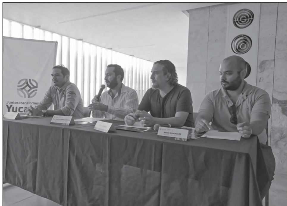
▲ Los artistas interpretarán temas de Caifanes, Jaguares, La Barranca, San Pascualito Rey y Monocordio en sala de conciertos del Palacio de la Música.

“El Palacio de la Música es la primera sede de este innovador programa que buscará replicarse en diversos foros culturales del país. Es algo que surgió platicando con Chema, que buscaba hacer un concepto diferente y lanzarlo acá”, comentó Maleck Abdala Hadad, director general del inmueble durante