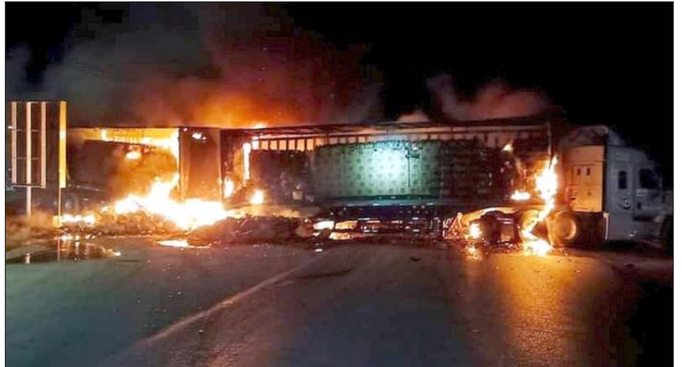
▲ Pistoleros bloquearon las vialidades, incendiaron autos y camiones que previamente habían sido despojados con violencia; además, en varios municipios arrojaron poncha-llantas y aceite quemado en las carreteras para evitar la persecución de agentes y militares.

Como medida de seguridad para la población que circulaba por esas vías, la división Caminos de la GN confirmó que los crimina-