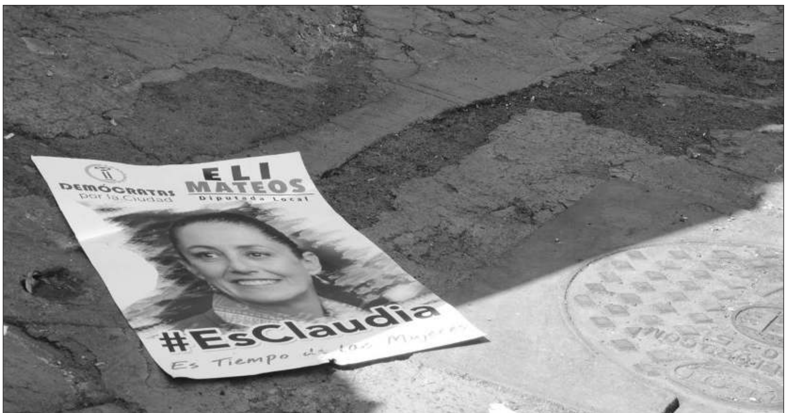
▲ "¿Cómo impedir que un ciudadano, en ejercicio de sus derechos, pinte una barda de su propiedad con el letrero que se le antoje o que haga propaganda a una precandidatura deseada? ¿Cómo probar que ese flujo de propaganda corresponde a una orden concreta de la precandidata, así sea la evidentemente favorecida?".