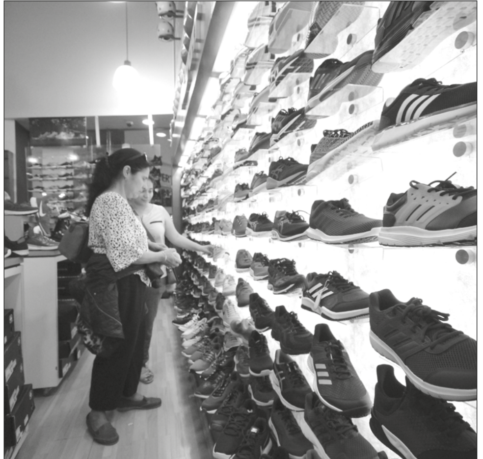
▲ La Condusef recomienda a la población hacer compras inteligentes y ponerse un límite, sin olvidar comparar precios antes de realizar cualquier adquisición.

El aguinaldo es la paga extra de al menos 15 días del salario de tu ingreso mensual y de acuerdo a la Procuraduría de la Defensa del Trabajo (Profedet) es una de las prestaciones obligatorias de ley y debe pegarse a más tardar el 20 de diciembre de cada año.