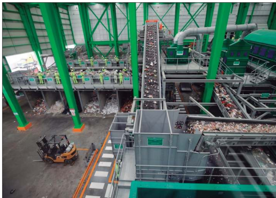
▲ La infraestructura para el manejo de residuos tiene un importante rezago, según indica el programa de la Semarnat, pues apenas hay 47 plantas de tratamiento.

Plantea que para cambiar el paradigma de gestión se requiere abordar la problemática desde un enfoque medioambiental, social, económico, financiero,