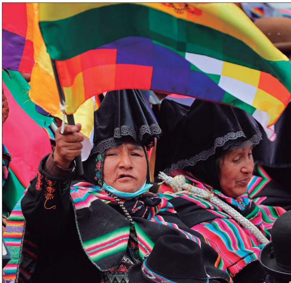
▲ El ministerio de Descolonización de Bolivia anunció proyectos para el fortalecimiento y revalorización de conocimientos y saberes de los pueblos originarios.

En el caso de los esse eja su medio de vida, las aguas de los ríos, están contaminadas, lo que deja en una situación crítica para la salud y existencia.