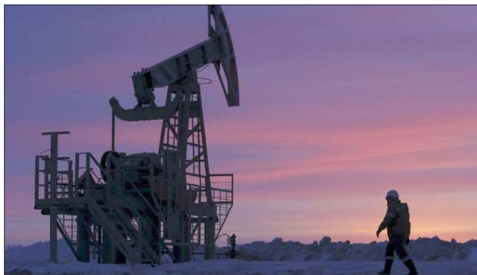
▲ Rusia es el segundo exportador mundial de crudo y le resultaría fácil encontrar nuevos compradores al precio de mercado, por ello prevén que sumistre a un valor igual o inferior a 60 dólares el barril.

La puesta en marcha del mecanismo coincide con la entrada en vigor de un embargo de la UE al petróleo ruso suministrado por mar, varios meses después