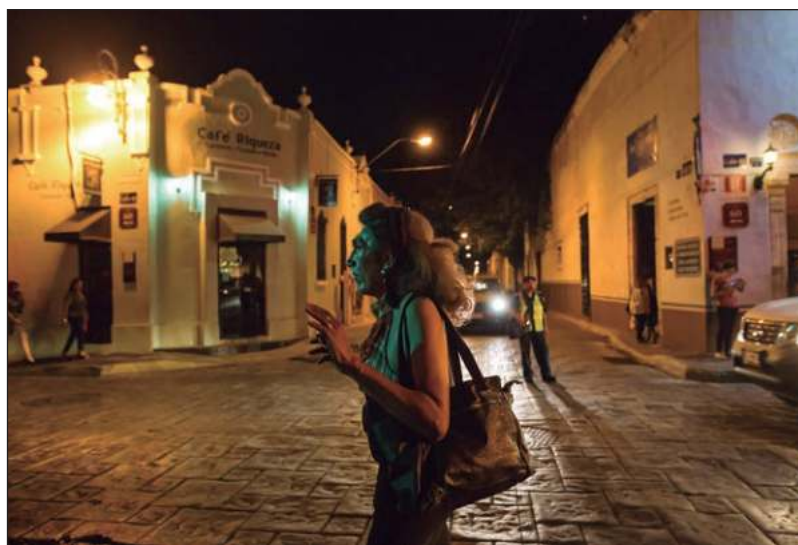
▲ “A principios del siglo XXI, la mayor parte del Centro Histórico estaba en franco deterioro, muchos predios abandonados, muchas casonas al borde del colapso, muchas calles oscuras y malolientes”.

¿Estamos frente a un panorama desolador? Tampoco lo creo. Yo estudié con profesores que insistían en la importancia de los programas