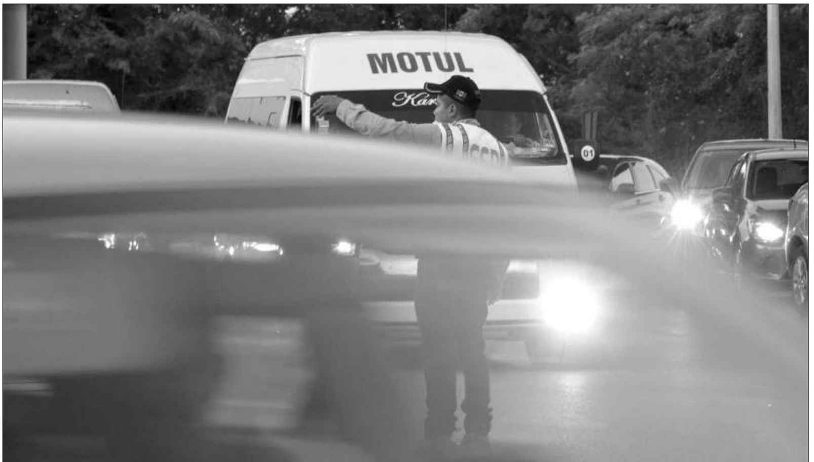
▲ “¿Qué estamos haciendo para evitar que Mérida se convierta en la urbe del caos? El tráfico nos dice que el gobierno debe tener más planeación”.