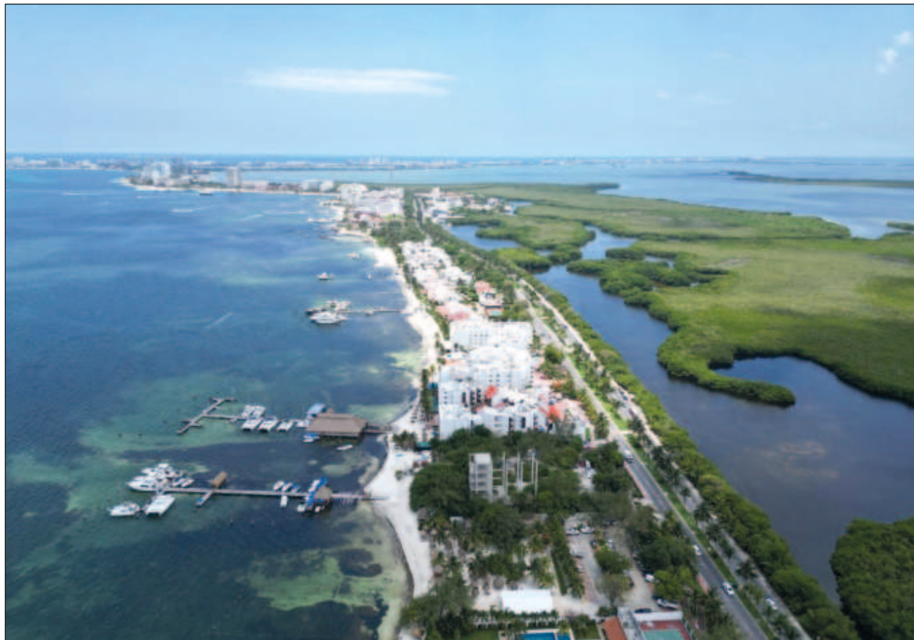
▲ Ambos territorios, San Buenaventura y Playa Delfines, están en el municipio de Benito Juárez.

Dicho estudio puede ser consultado en las oficinas de la Comisión Nacional de Áreas Naturales Protegidas de la Semarnat, ubicadas en avenida Ejército Nacional número 223, colonia Anáhuac, demarcación territo-