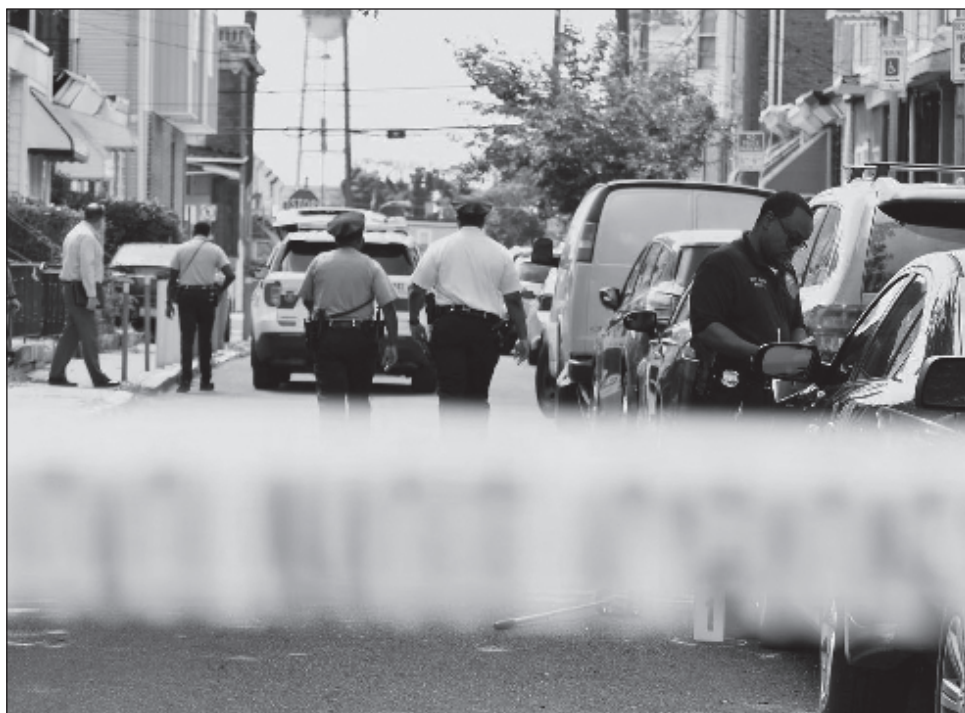
▲ Las múltiples balaceras alrededor de Estados Unidos dejaron más de una decena de muertos y casi 60 heridos, incluidos niños de apenas dos años.

“Atravesamos problemas para obtener información de los presentes”: sargento