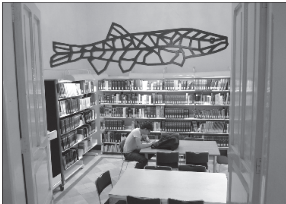
▲ El asunto se originó luego de las reformas en 2021 a la Ley General de Bibliotecas (LGB), que fueron impugnadas por editoriales como Larousse, Planeta y Trillas.

El asunto se originó luego de las reformas de junio de 2021 a la Ley General de Bibliotecas (LGB), que fueron impugnadas en un centenar de amparos promovidos por editoriales como Larousse, Planeta y Trillas; productoras y distribuidoras, entre ellas Univision, Sony Music, Warner, Universal; además de grupos como el Centro Mexicano de Protección y Fomento a los Derechos de Autor. Todas estas aseguraban que la nueva ley facilitaría la piratería de sus obras, pues afirmaban que las bibliotecas públicas, res-