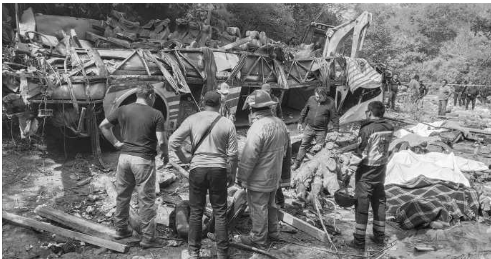
▲ A través de redes sociales, el ayuntamiento de Tlaxiaco difundió una lista con los nombres de las personas que fueron internadas en el Hospital del Instituto Mexicano del Seguro Social de Tlaxiaco. Se reportó que dos de ellas fallecieron.