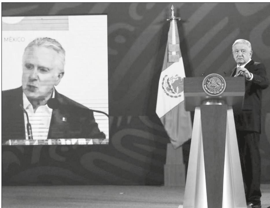
▲ El Presidente indicó que el diputado panista debería reclamarle al grupo “del bloque conservador” quienes fueron los que decidieron que su candidata sea Gálvez y no Creel.

“Valoraré (asistir), porque no quiero especulaciones, que lo aprovechen para sus discursos. Si son capaces de inventar un tuit, como Carolina Viggiano, no quiero darles elementos. Pero por supuesto que me verán en reuniones de unos y otros. Eso no quiere decir que voy a participar ni que voy a estar. Cuando lo haga, lo diré públicamente en mi voz.