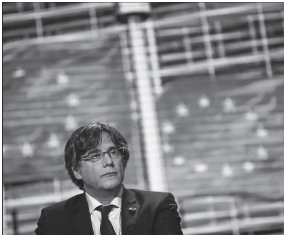
▲ Con esta decisión, que ampara las resoluciones previas del Parlamento europeo, Puigdemont y sus colaboradores no podrán regresar a España sin la amenaza de ser detenidos.

El Tribunal General de la Unión Europea (TGUE) decidió confirmar la retirada de la inmunidad parlamentaria al ex presidente de Cataluña, Carles Puigdemont, y a otros dos ex consejeros del gobierno catalán, Tomi Comín y Clara Ponsatí, que actualmente fungen como europarlamentarios y que, al mismo tiempo, tienen varias causas pendientes con la justicia española por su participación en la declaración unilateral fallida de independencia de octubre del 2017. Con esta decisión, que ampara las resoluciones previas de las instituciones jurídicas del Parlamento europeo, Puigdemont y sus colaboradores no podrán regresar a España sin la amenaza de ser detenidos por las sendas órdenes dictadas por el Tribunal Supremo español y que siguen vigentes.