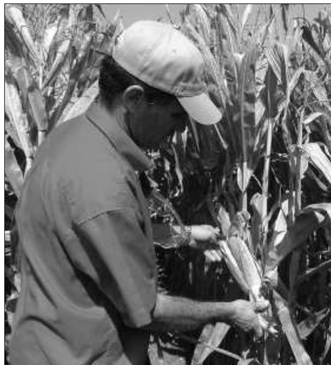
▲ El generoso financiamiento corporativo llevó a científicos a usar su prestigio y sus credenciales para persuadir (...) acerca de la inocuidad de sustancias tan venenosas como la nicotina.

Lo que hacen hoy Bayer-Monsanto, BASF, Cargill, Syngenta, Corteva y DuPont puede equipararse con algunos de los episodios más siniestros del imperialismo, como las guerras del opio acometidas por Gran Bretaña y Francia entre 1839 y 1860 para obligar al gobierno chino a legalizar el comercio de ese estupefaciente altamente adictivo; o la desindustrialización forzosa de India perpetrada por el imperio británico para convertir al subcontinente en un cliente