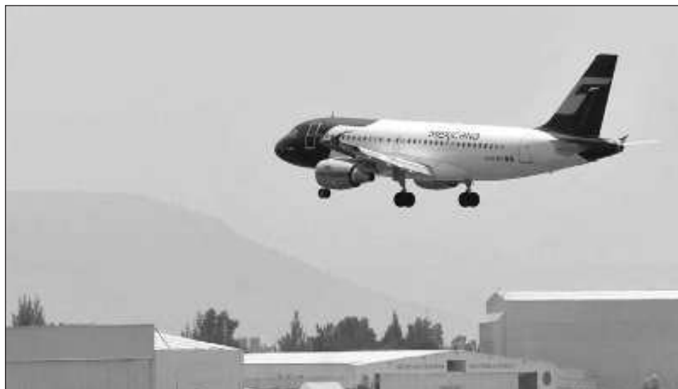
▲ AMLO señaló que ya se tiene el registro de varias probables marcas. “¿Qué creen que pasa? Aquí dije que era posible que se llamara Maya, y fueron ese mismo día o al día siguiente a registrar la marca”, dijo.

“Les hice un llamado a los abogados y a los trabajadores, y no. Estamos esperando, tengo una reunión el sábado para decidir esto, y aquí vamos a informarles que lamentamos mucho, pero no vamos a poder comprarles la