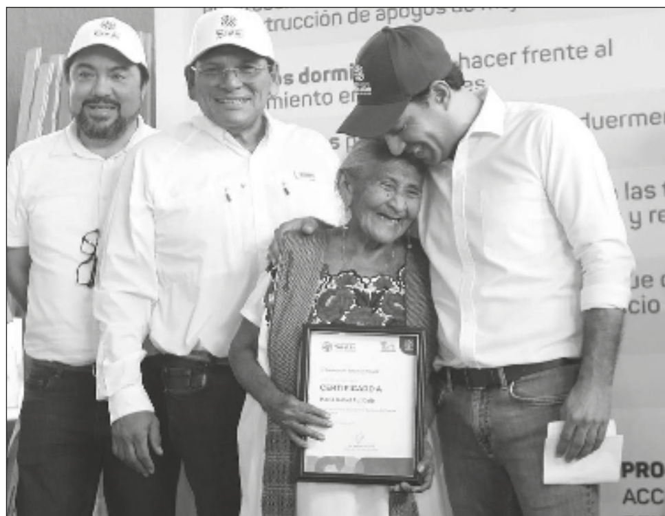
▲ El gobernador distribuyó 70 certificados para acciones de Vivienda Social, con el objetivo de reducir la condición de vulnerabilidad de las familias que más lo necesitan.

A fin de respaldar a las mujeres artesanas de esta demarcación, para fortale-