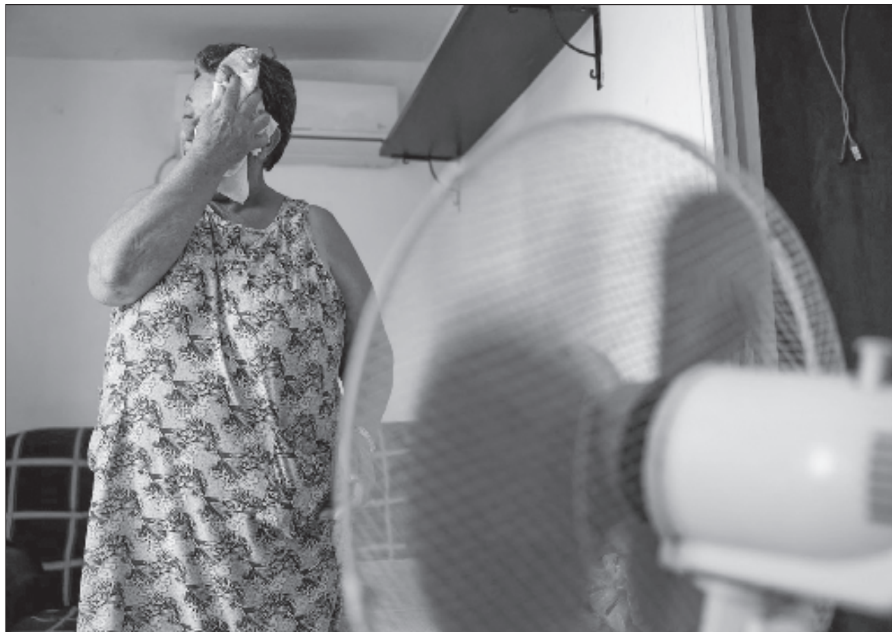
▲ A principios de junio NOAA había señalado el comienzo de El Niño, un fenómeno climático vinculado con el aumento de las temperaturas en el océano Pacífico oriental ecuatorial, y su efecto podría causar un efecto lluvioso en el sur de EU.

La combinación de El Niño temprano y el cambio climático han llevado a advertencias de científicos que han vaticinado este como uno de los años más calurosos registrados.