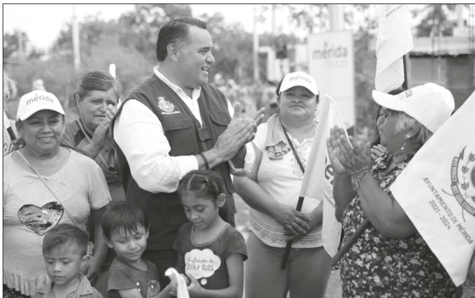
▲ “Recordemos que Mérida tiene casi 600 colonias con muchas necesidades que hemos atendido y que nos permiten trabajar para alcanzar el rezago cero, por eso, nuestras acciones llegan hasta los últimos rincones”: Renán Barrera.

Decenas de vecinas y vecinos recibieron a Barrera Concha y externaron su beneplácito por las obras, para las cuales se tomaron en cuenta las verdaderas necesidades de la población.