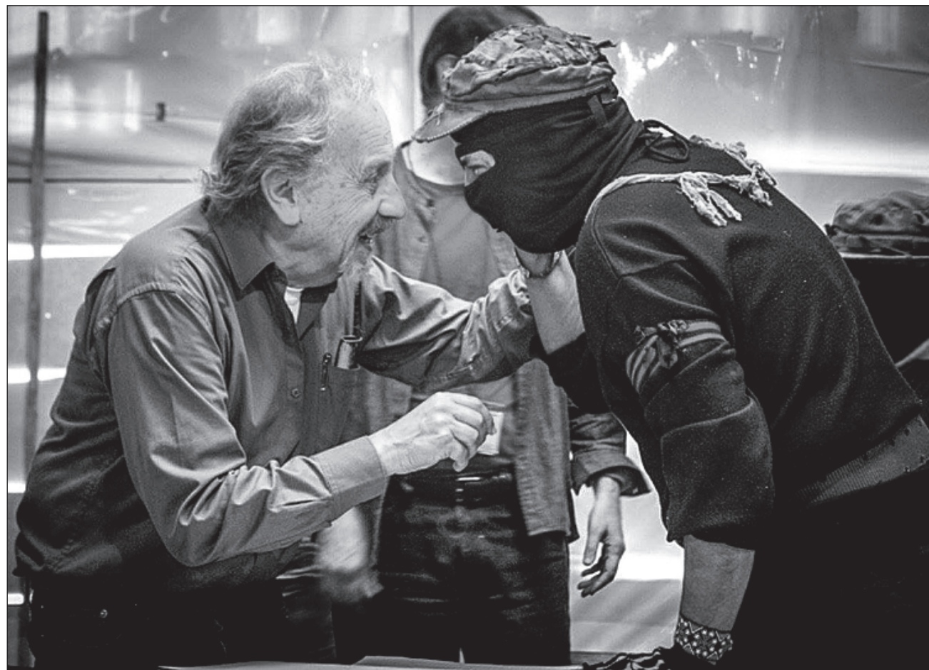
▲ “Fue un hombre que supo colocarse a la altura de los acontecimientos que iba viviendo”.

En el ensayo que lleva por título Adolfo Gilly, el movimiento trotskista y la revolución socialista en América Latina , Mignon indicó de Gilly: Es uno de aquellos hombres