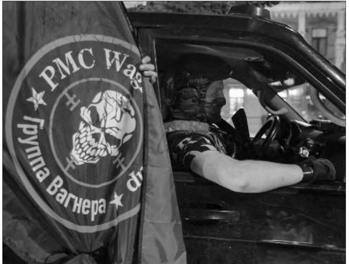
▲ "Wagner operates in roughly 30 countries, according to the Center for Strategic and International Studies, and it is accused of numerous human rights violations, including extrajudicial killings".

A DAY LATER , his troops seized control of the southern Russian city of Rostov-on-Don and began their march to Moscow, with the stated aim of removing the military leadership. Some observers saw parallels with the Russian army's revolt against Tsar Nicolas II in 1917 in protest against the mismanage-