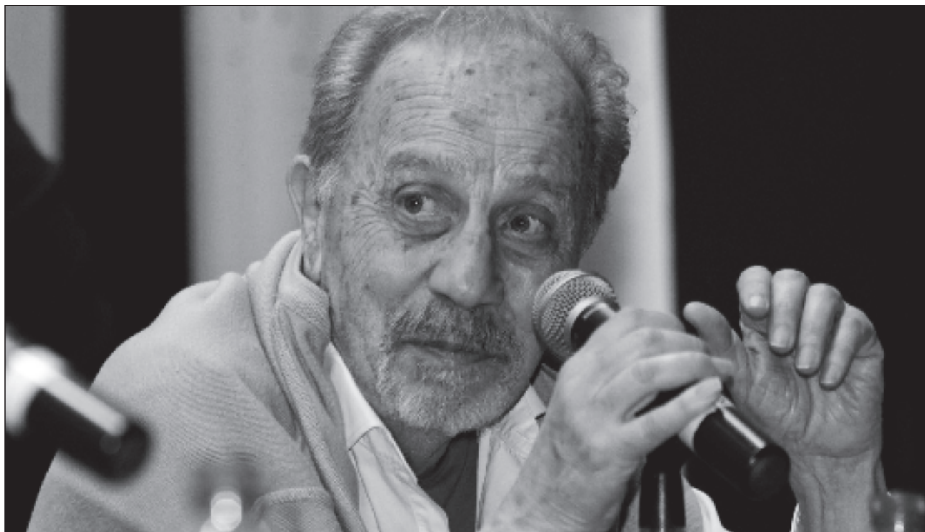
▲ Mondragón resalta a Gilly como un intelectual comprometido con el pensamiento crítico y con los movimientos sociales, las luchas revolucionarias, “siempre estuvo muy cerca de donde estaban los movimientos sociales”.

“El suyo es un pensamiento muy rico; nos deja un legado no sólo académico y teórico, sino como ejemplo de vida. Creo que fue maestro de vida de muchas generaciones, y cuando digo maestro, lo digo en el sentido más profundo de la palabra”.