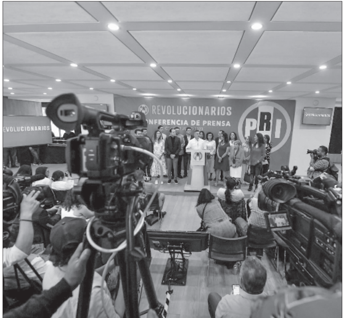
▲ "El capitán Alito se va quedando solo en el PRI tanic que hace agua por todos lados. El desenlace previsible, por lo mismo pudo ser instrumentado".

EN AGOSTO DE 2019 asumió la presidencia nacional del tricolor, Alejandro Moreno, previamente ungido en reunión privada en su natal Campeche por el verda-