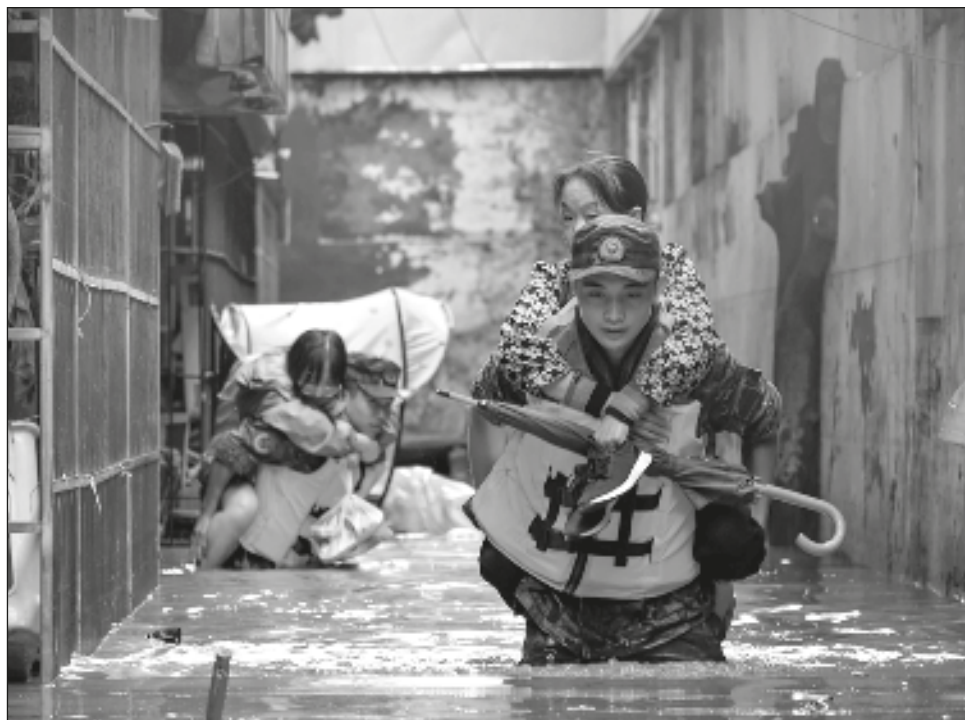
▲ Las lluvias torrenciales en China provocaron inundaciones y desastres geológicos, perturbando las vidas de más de 130 mil personas en 19 distritos y condados.

"Las intensas precipitaciones, principalmente en áreas a lo largo del río Yangtsé, provocaron inundaciones y desastres geológicos, perturbando las vidas de más de 130 mil personas en 19 distritos y condados", dijo la agencia de prensa estatal Xinhua.