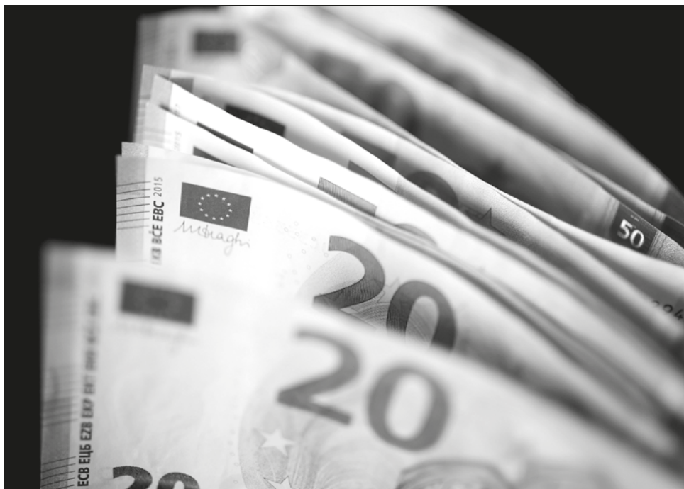
▲ El euro podría caer a 0.98 dólares en agosto si Rusia deja de enviar gas a Alemania, según calcula Nomura Securities, una sociedad financiera japonesa.

El precio del barril de petróleo se desplomaba este martes alrededor de 9 por ciento y caía a mínimos desde el pasado mes de mayo en torno a los 100 dólares como consecuencia del temor a que el impacto de la inflación sobre