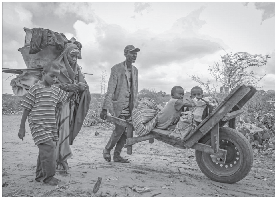
▲ Somalia compraba el 90 por ciento de su trigo a Rusia y Ucrania, y ahora tiene problemas para conseguir suministros en un contexto de precios disparados.

La guerra en Ucrania ha desviado de forma repentina millones de dólares de otras crisis. Somalia, que sufre escasez de comida debido principalmente a la guerra, podría ser la región más vulnerable. Ha recibido la mitad de financiamiento humanitario que el año pasado, mientras los donantes, en su mayoría occidentales, envían más de mil 700 millones de dólares para responder a la guerra en Europa, Yemen, Siria, Irak, Sudán del