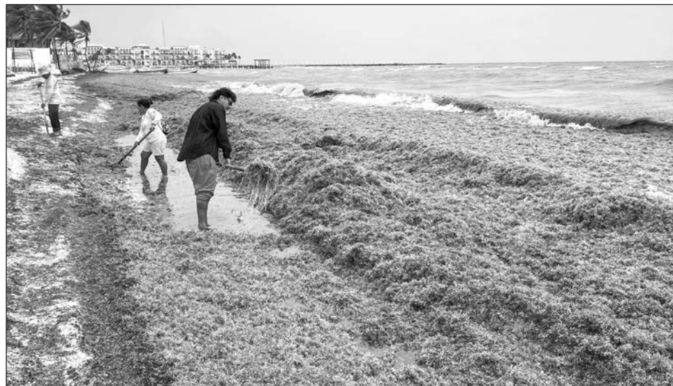
▲ Al 31 de mayo del presente año se han recolectado 18 mil 600 toneladas de sargazo en las playas de Quintana Roo, según datos de los 11 municipios y de la Semar.

“En este contexto de recuperación en el sector del turismo en las costas del Caribe Mexicano es que se presentan los pronósticos de recalde de