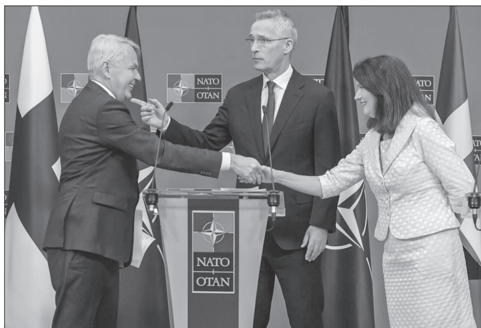
▲ En la imagen, los ministros de Exteriores Pekka Haavisto, de Suecia, y Ann Linde, de Finlandia, flanquean a Jens Stoltenberg, secretario general de la Otan, luego de la firma de los respectivos protocolos de acceso, que tuvo lugar en Bruselas.

Los 30 embajadores y representantes formales aprobaron oficialmente las decisiones de la cumbre de la OTAN de la semana pasada, en la que la alianza tomó la histórica decisión de invitar a Finlandia, vecino de Rusia, y Suecia, un