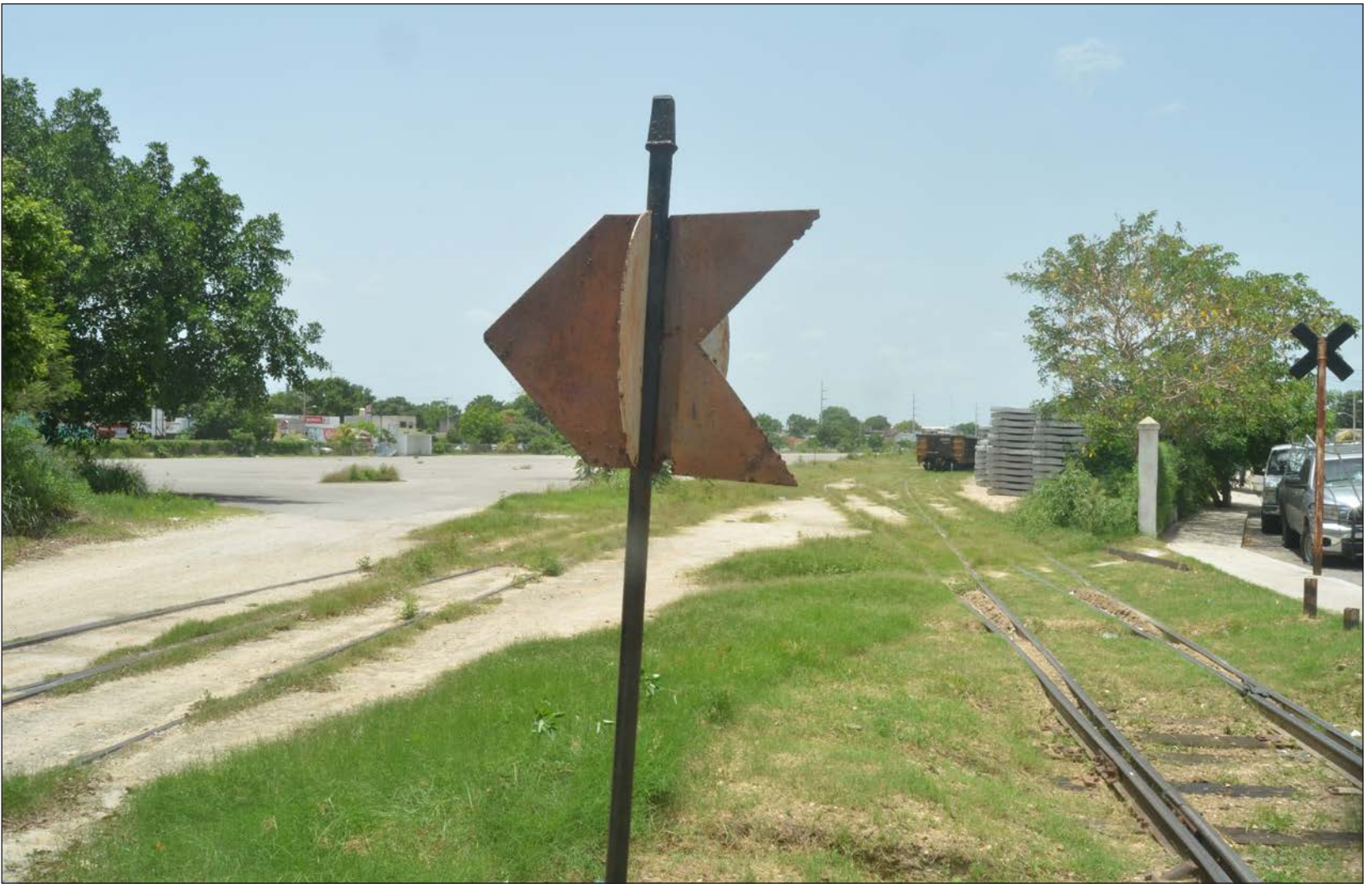
▲ El colectivo Gran Parque La Plancha elaboró desde 2016, en conjunto con universidades y otras asociaciones, el proyecto de un espacio público que brinde servicios ambientales y sea un lugar de esparcimiento para los habitantes de Mérida y permita el disfrute de la naturaleza.