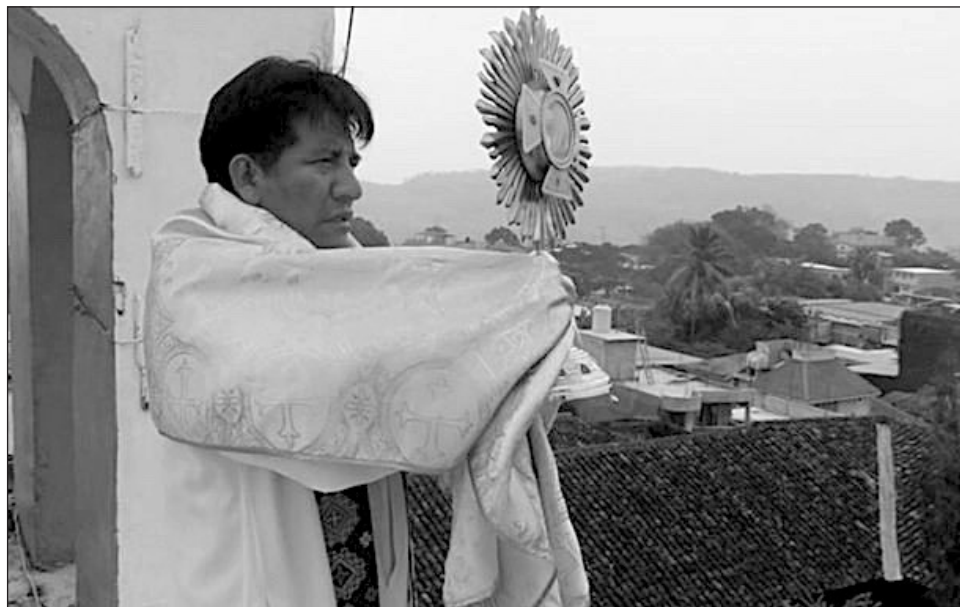
▲ La Diócesis de San Cristóbal, a la que pertenece el presbítero, instó a las autoridades a que “cesen la represión, intimidación y persecución para nuestros hermanos y hermanas que luchan por la construcción de un mundo diferente y mejor”.

Sostuvo que la función mediadora en varios conflictos en la que ha participado la diócesis ha traído “muchas veces la ingratitud de alguno de los actores involucrados cuando solamente