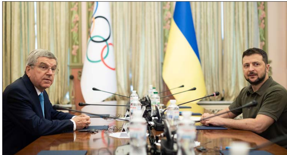
▲ El presidente del COI, Thomas Bach, sostuvo una reunión con el mandatario ruso, Volodymyr Zelensky, a quien le aseguró que los deportistas no están solos.

Bach sostuvo que no ha llegado el momento para modificar la posición del COI