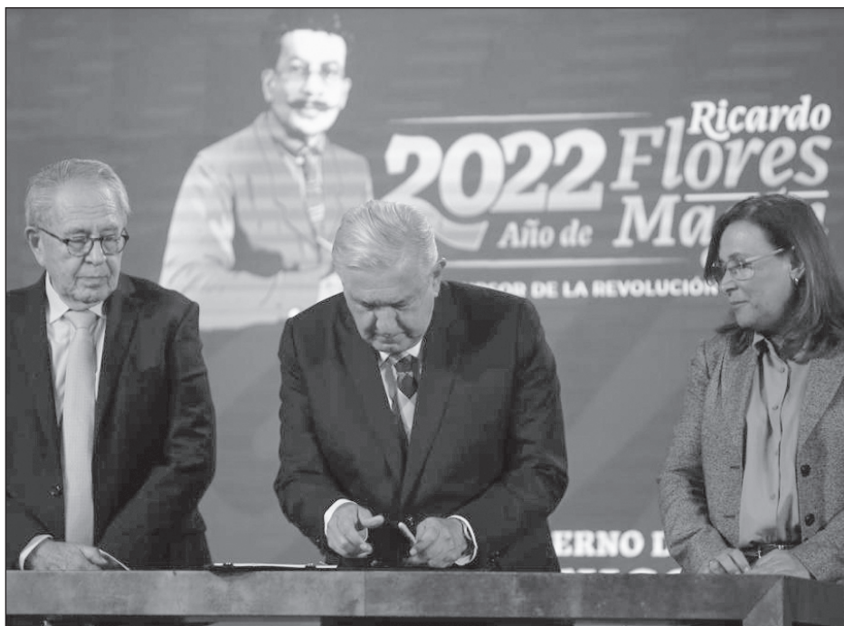
▲ Durante la conferencia matutina de este martes, el Presidente y miembros de su gabinete delinearon las razones para tomar esa decisión.

Sin embargo, la Unidad sí proponía la procedencia de la medida cautelar solicitada bajo la figura de tutela preventiva, “porque desde una perspectiva preliminar se considera que el evento es probablemente ilícito, y ante el riesgo y temor fundado que pueda realizarse otro con similares e iguales características es que se justifica su dictado, porque se aprecia una posible estrategia encaminada a posicionar a Morena y a las personas que buscan una candidatura de dicho instituto político fuera de los plazos legales para ello, en detrimento de la equidad en la contienda de las próximas elecciones locales, en Coahuila y el Estado de México, y de la elección federal para nombrar al Presidente de la República, en razón de lo cual se propone la tutela preventiva”.