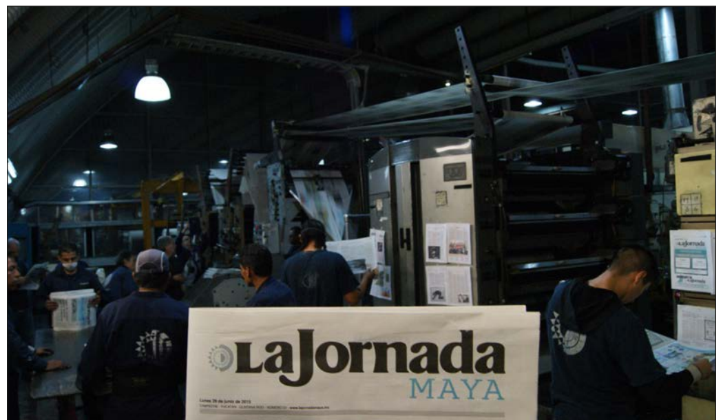
▲ Llegamos a este día enteros pero marcados. Con habilidades adquiridas, pero con mucho por mejorar para ofrecer cada día un periódico que manifieste el respeto a la inteligencia del lector.

Como medio, creemos igualmente en que el ejercicio del periodismo debe aportar a la construcción de una mejor sociedad. Nos duele saber de asesinatos y persecución a colegas, porque entendemos que son también portadores de ese credo. Por eso es que nuestra promesa es continua: la edición de mañana saldrá mejor. Tiene que serlo, porque nos debemos a ti, lector, pero igualmente a quienes han hecho periodismo antes, y quienes nos faltan. Tú, que seguramente también llevas marcas y buscas en nuestras notas una explicación del mundo; nosotros, que también buscamos compartir nuestras reflexiones y enriquecer mutuamente nuestra comprensión del acontecer diario.