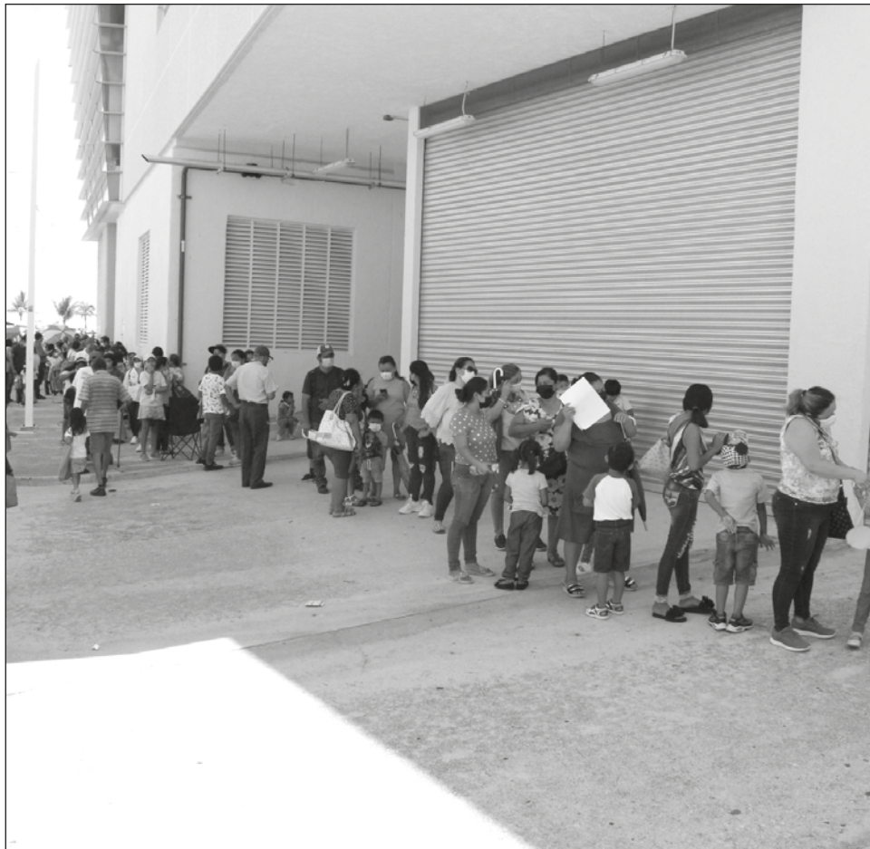
▲ La jornada de inmunización tendrá lugar este jueves y viernes.

Igualmente señalan que darán prioridad a los menores con comorbilidades, alguna discapacidad y a quienes les entregaron fichas en la pasada jornada que no pudo terminarse por el desabasto de dosis disponibles. Las medidas de sanidad se mantendrán en dicha jornada para contener la propagación del virus.