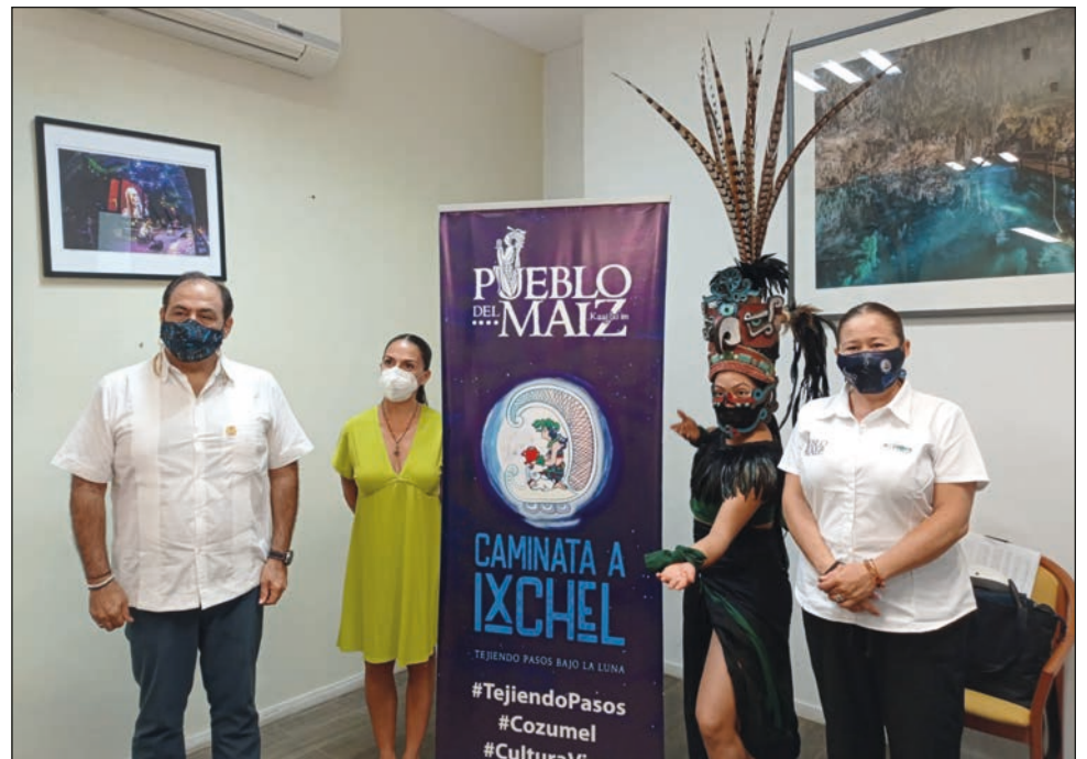
▲ La caminata se llevará a cabo el sábado 16 y domingo 17 de julio, según dio a conocer el colectivo Pueblo del Maíz en conferencia de prensa.