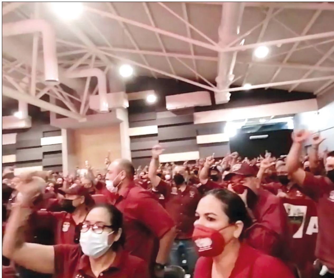
▲ La Sección 42 del STPRM celebró este martes su Asamblea General Ordinaria, sin dar acceso a medios.

Transcendió que directivos de Petróleos Mexicanos se niegan a confirmar estos hechos, por las repercusiones que este acontecimiento pudiera tener en el entorno internacional, derivado que la empresa ENI México es de capital italiano.