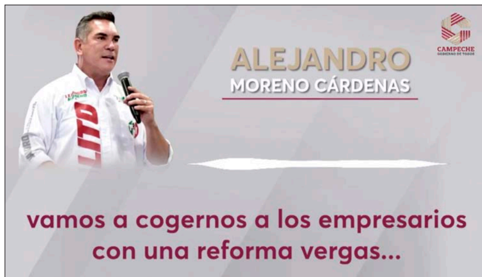
▲ En el audio presentado este martes, el ex gobernador de Oaxaca, José Murat, presume a Alejandro Moreno que tiene detenida la Ley Minera en el Congerso de la Unión.

Aunque el audio fue muy corto en esta ocasión,