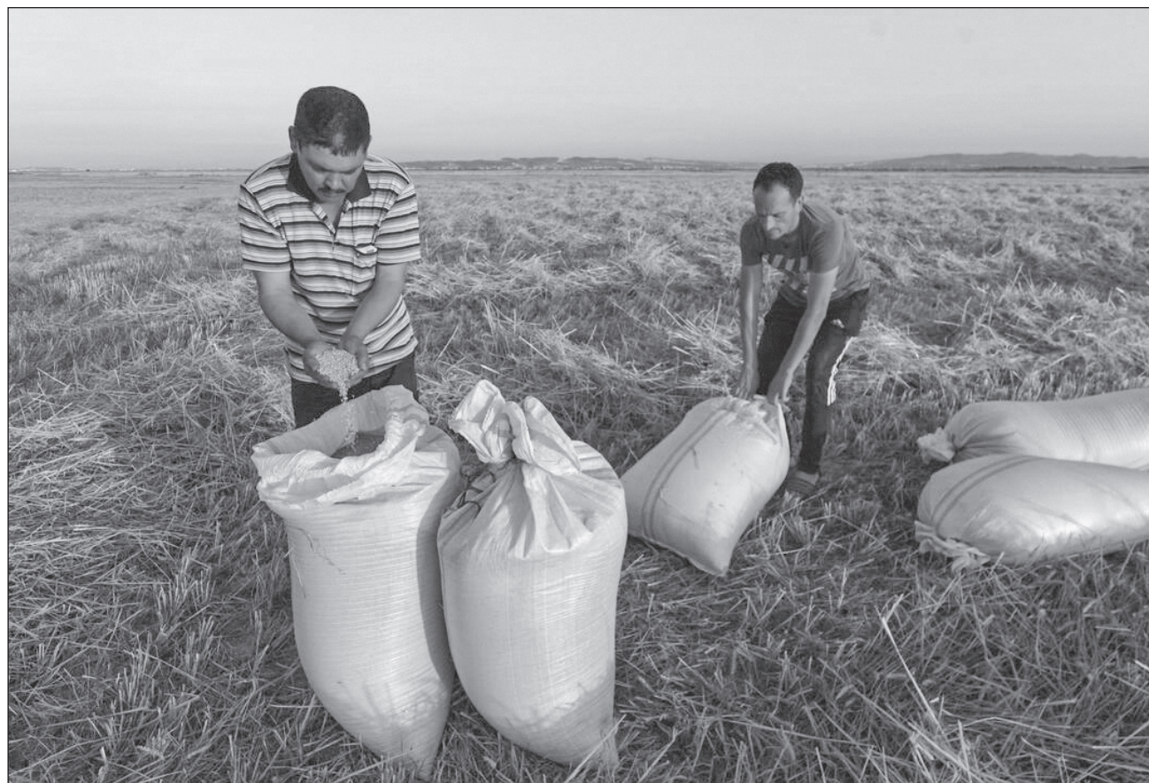
▲ Entre 2012 y 2016, Túnez importó alrededor de un 33 por ciento de su trigo duro, 71 por ciento de su cebada y 85 por ciento de su trigo blando o harinero, según la FAO, la Organización de Naciones Unidas para la Alimentación y la Agricultura.

Desde abril, el gobierno ha anunciado medidas que buscan alcanzar la plena au-