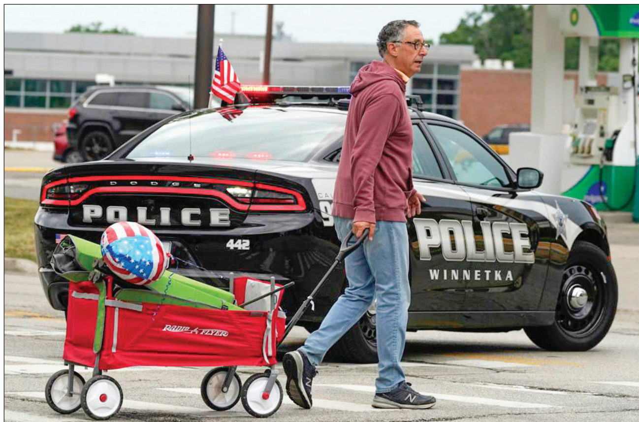
▲ La alcaldesa de Highland Park, Nancy Rotering, lamentó que haya "armas de guerra" que la gente pueda comprar legalmente en Estados Unidos para cometer crímenes como el ocurrido en esta localidad.

Representaba en sus videos diversas formas de asesinar, y en uno de los últimos muestra una decapitación, informó NBC. La web de videos youtube cerró la página del joven el lunes por la noche.