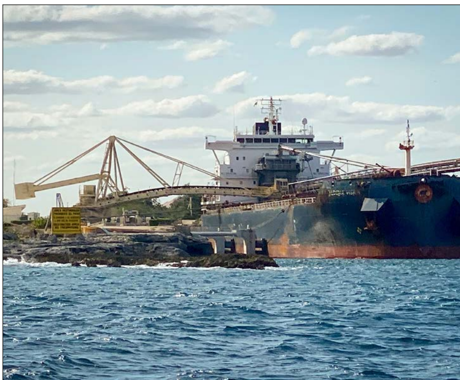
▲ La Profepa clausuró la planta debido a “acciones en contra del aprovechamiento indebido de los recursos naturales y del deterioro del medio ambiente”.

Informó el retorno de las brigadas de jóvenes de gorras y chalecos amarillos en lugares públicos para recordar el uso de los hábitos, como la sana distancia, el uso del alcolgel, el lavado frecuente de manos, el uso del cubrebocas, etc.