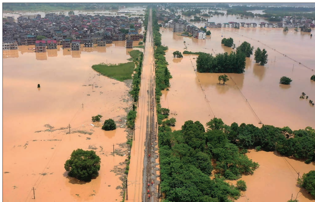
▲ La inestabilidad del tiempo está causando problemas en otras partes del mundo en episodios que, según los científicos, tienen todas las características del cambio climático y se espera un calentamiento aún mayor para este siglo.

La temperatura media en el país alcanzó los 21,3 grados Celsius (70,34 Fahrenheit) en junio, 0,9 C (1,8 F) más que un año atrás, y el dato más alto desde 1961. No hay señales de alivio a la vista, ya que en julio se prevén temperaturas y precipitaciones más altas de lo habitual en gran parte del país, apuntó la agencia.