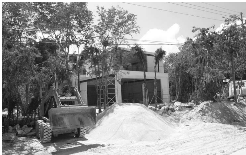
▲ En el caso del sector inmobiliario, el conflicto entre Rusia y Ucrania ha afectado los costos de materiales como el acero y el concreto, imprescindibles para las edificaciones.

Respecto a las casas de interés social, confirmó que es un producto que lamentablemente se ha detenido,