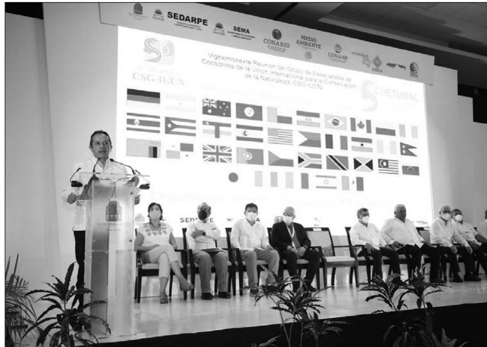
▲ En su intervención, el mandatario Carlos Joaquín destacó el trabajo de la comunidad Chacchoben en beneficio de la conservación del cocodrilo y su hábitat.

El titular del Ejecutivo precisó que las acciones de conservación, implementadas desde el inicio de la administración, y el esfuerzo cooperativo de diversos actores ha permitido la recuperación de sus poblaciones.