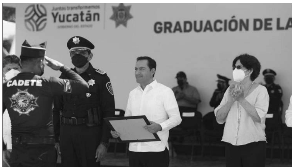
▲ La policía de Yucatán, indicó el gobernador Mauricio Vila durante la graduación de 116 elementos, es la que goza de la mayor confianza entre los ciudadanos según el Inegi.

“Sin su esfuerzo, trabajo y dedicación, no sería lo que es hoy la corporación;