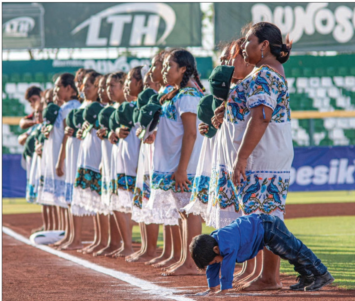
▲ “Al jugar luchan contra varios paradigmas, entre ellos, claro, el machismo. También lo hacen contra el racismo, al portar con orgullo sus hipiles, tal y como lo hicieron sus madres y las madres de sus madres”.

Fueron testigos de esta explosión de alegría miles de familias