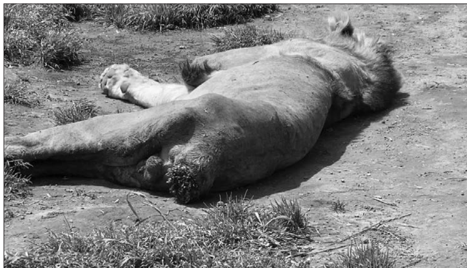
▲ Las imágenes evidencian que los felinos se comen sus propias colas porque tienen hambre o porque padecen de estrés, aseguraron activistas que difundieron las fotografías.

Las imágenes evidencian que los felinos se comen sus propias colas porque tienen hambre o porque padecen de estrés. "Se las muerden ellos mismos por ansiedad y hambre, y sus lenguas son abrasivas y están cubiertas de una especie de pequeñas espinas (papilas), que les permiten cazar y devorar presas. Son demasiado ásperas y por eso, sin querer, ellos mismos se arrancan sus co-