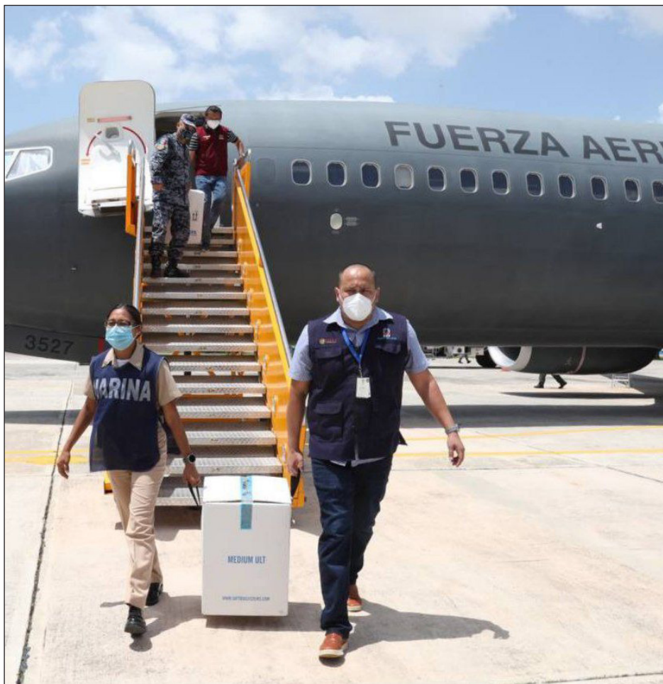
▲ Las vacunas llegaron a la Base Aérea Militar Número 8 a las 13:51 horas.

Hay que mencionar que se proporcionarán estas vacunas a la población previamente registrada y seleccionada, por medio de las plataformas del Gobierno de la República, que tiene a su cargo la planificación y los protocolos de la estrategia, mientras que el gobierno del estado apoya con estas tareas.