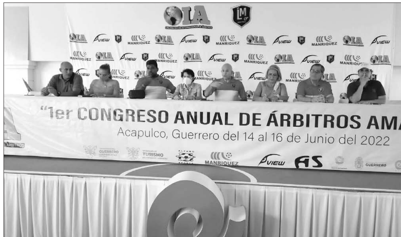
▲ Durante el primer congreso anual de árbitros amateurs, llevado a cabo en Acapulco, estuvieron presentes más de 200 silbantes aficionados, que no cuentan con un salario fijo y carecen de garantías para realizar su trabajo.

China ha mantenido severas restricciones fronterizas durante la pandemia, así como estrictas cuarentenas al detectarse casos positivos de Covid-19 dentro del país. Recurrió a una burbuja para albergar los Juegos Olímpicos de Invierno en febrero, lo que implicó acordonar varias zonas de Beijing, pero ha cancelado competiciones internacionales de menor jerarquía.