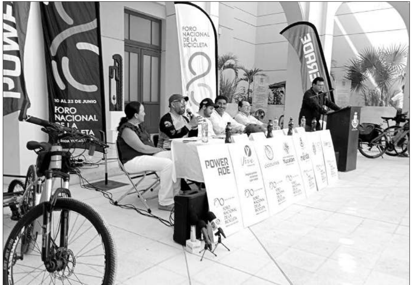
▲ Dentro de las sedes donde se desarrollarán las actividades del foro está la sala de conciertos del Palacio de la Música, la Universidad de la Artes de Yucatán (UNAY), el Edificio Central de la UADY, entre otras.

La iniciativa es impulsada por varias empresas, instituciones y asociaciones civiles como Powerade, Bepensa, Fundación Vive, el Gobierno del estado de Yucatán y el ayuntamiento de Mérida, así como la UADY y Cicloturixes. Dentro de las sedes donde se desarrollarán las actividades