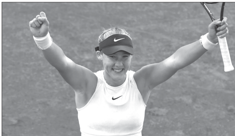
▲ Mirra Andreeva celebra tras su victoria ante Aryna Sabalenka en Roland Garros.

Ninguno de los cuatro hombres que quedan en el cuadro ha ganado el Abierto de Francia, y este será el primer partido por el título en París sin Rafael Nadal, Novak Djokovic o Roger Federer desde 2004.