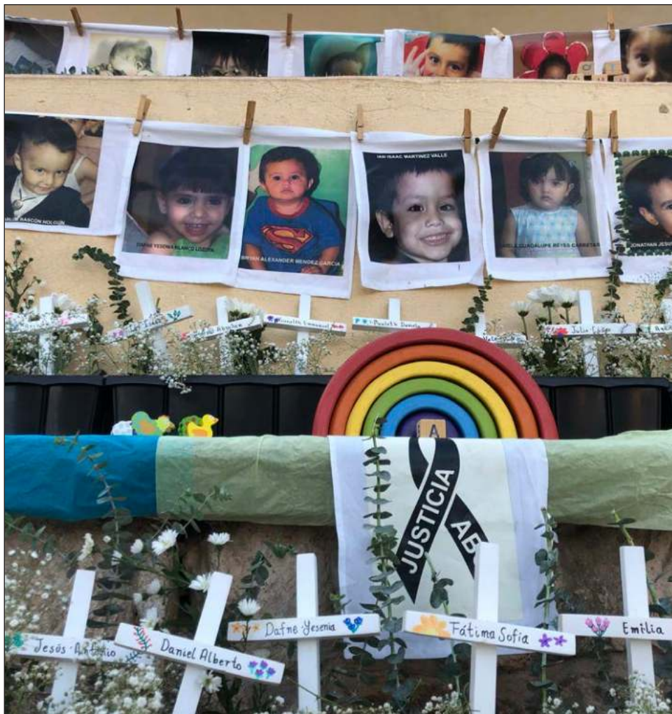
▲ Las 24 niñas y los 25 niños que perdieron la vida el 5 de junio de 2009 durante el incendio en la guardería ABC tenían entre cinco meses y cinco años de edad.

La organización invitó a la ciudadanía a reflexionar sobre la importancia de garantizar un desarrollo adecuado para la primera infancia y crear espacios que no vulneren sus derechos.