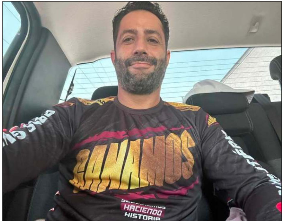
▲ De acuerdo con el presidente del Consejo Municipal Electoral, a pesar de que la ventaja sea amplia, en este caso mayor a 42%, se debe esperar el cómputo final.

Burgos Méndez dijo que este conteo se inicia con las secciones en las que los funcionarios de casillas no mostraron el acta de escrutinio.