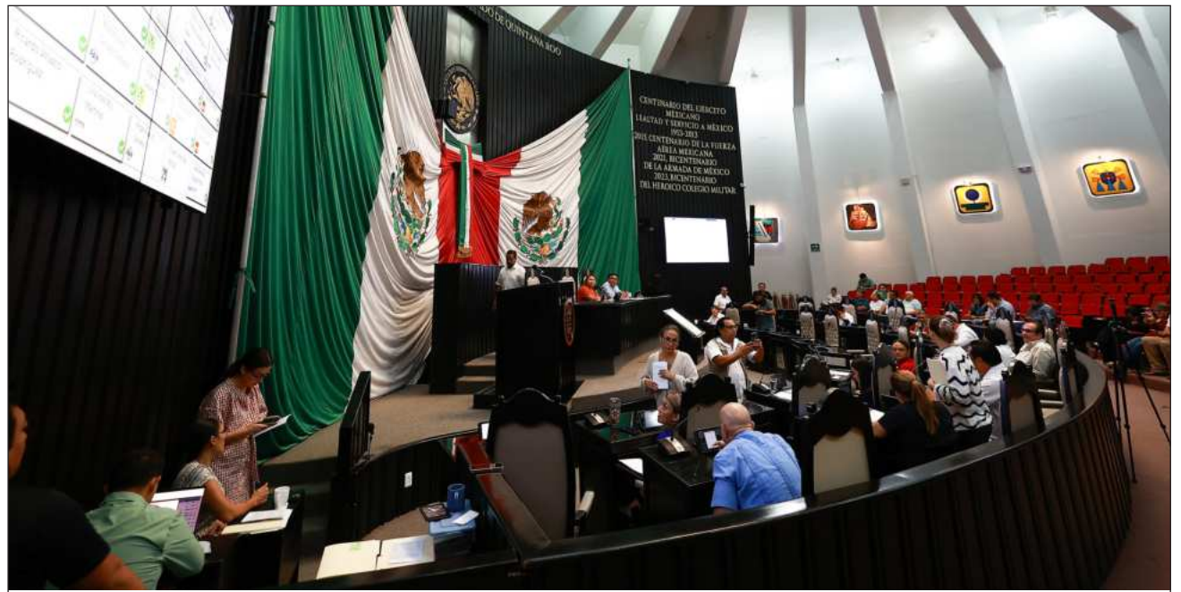
▲ Q. Roo ocupa la posición 12 sobre presupuesto ejercido con un total de 610 trabajadores adscritos.

presupuesto ejercido con un total de 610 trabajadores adscritos, y en el caso de Campeche hay 247 trabajadores con un presupuesto de 206.5 millones de pesos y en