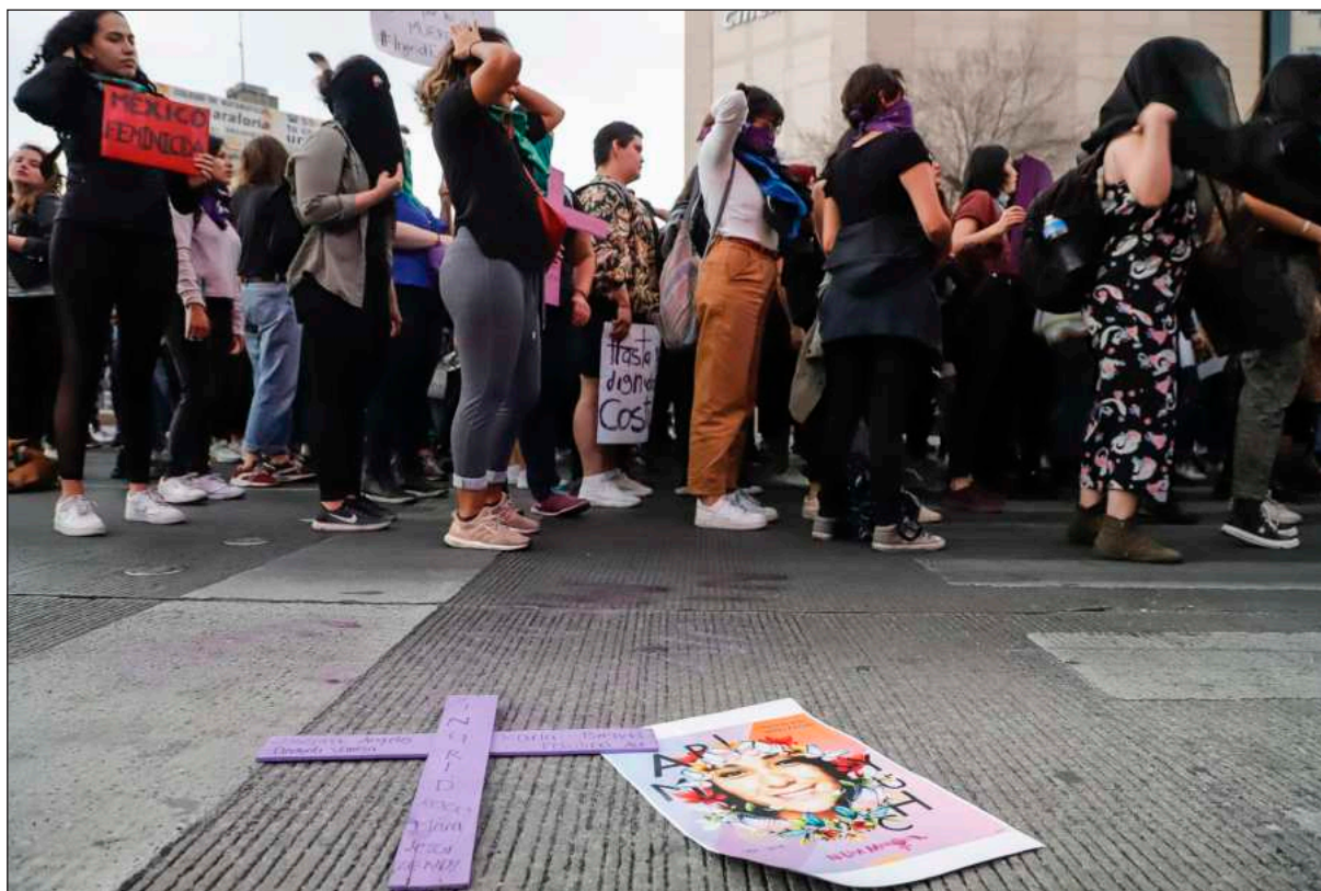
▲ “Será clave que, al revisar los delitos del pasado, que fueron clasificados como homicidio, se reconozca en las sentencias que se trata de feminicidios desde la perspectiva que se incluye ya en los códigos penales”.

LE PREGUNTÉ A la abogada y activista Sayuri Herrera qué sig-