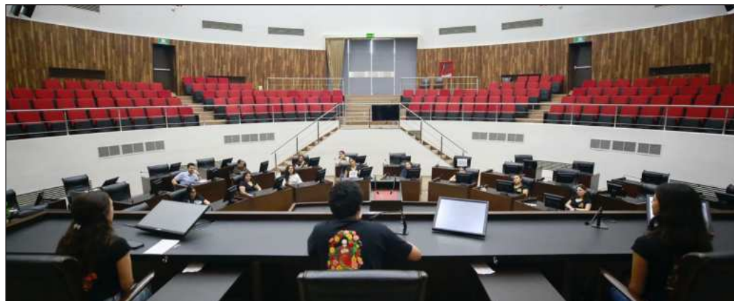
▲ La ciudadanía debe hacer el ejercicio de distinguir entre las responsabilidades del Legislativo y quienes ahí trabajan de la productividad de los legisladores locales.

Sin embargo, la ciudadanía debe hacer el ejercicio de distinguir entre las responsabilidades del Legislativo y quienes ahí trabajan de la productividad de los legisladores locales, sobre la cual existe una percepción negativa generalizada y que tampoco distingue partidos políticos. Las imágenes de diputados durmiendo en sus curules, luciendo en tribuna su vocabulario más florido y una magnífica capacidad para elaborar sofismas, la idea de que las votaciones son por consigna y no porque cada uno haya revisado la iniciativa o punto de acuerdo en cuestión, o los escándalos que involucran a más de uno, no entran a las encuestas que miden el destino del dinero público.