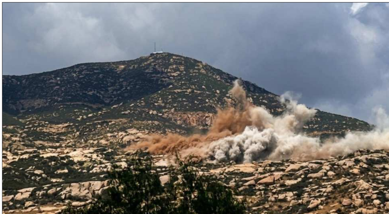
▲ La montaña sagrada del pueblo kumiai se encuentra en Tecate, en una zona compartida por Baja California y California, por donde se realiza el trazo del cerco fronterizo; la zona afectada se encuentra en Tecate Peak.

AHORA, ¿CÓMO HABLAR de Dios? Pues tan sencillo como esto: hablar de Dios es hablar de amor, pues Dios es eso amor: nos dio a Cristo para enseñarnos ese amor. A todos los que creemos en ese Cristo RESUCITADO les deseo felices Pascuas.