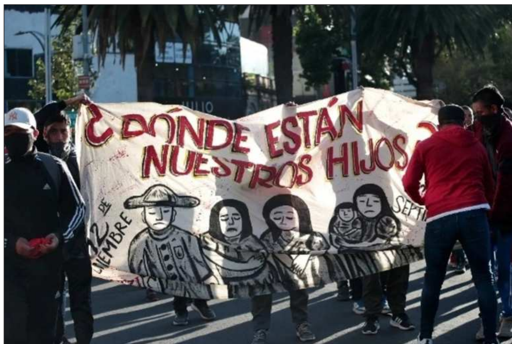
▲ El tema de las desapariciones no puede convertirse en un diálogo de sordos, ni en la imposición de una narrativa; es urgente que se garantice la justicia a las víctimas y sus familias.

El tema de las desapariciones no puede convertirse en un diálogo de sordos, ni en la imposición de una narrativa. Si se ha logrado que las autoridades ya no recurran a esta "práctica" para acallar a la oposición, algo que es una diferencia fundamental con los gobiernos anteriores, magnífico; pero también es urgente que se garantice la justicia a las víctimas y sus familias; hacia ahí es donde debieran dirigirse los esfuerzos de la Cuarta Transformación.