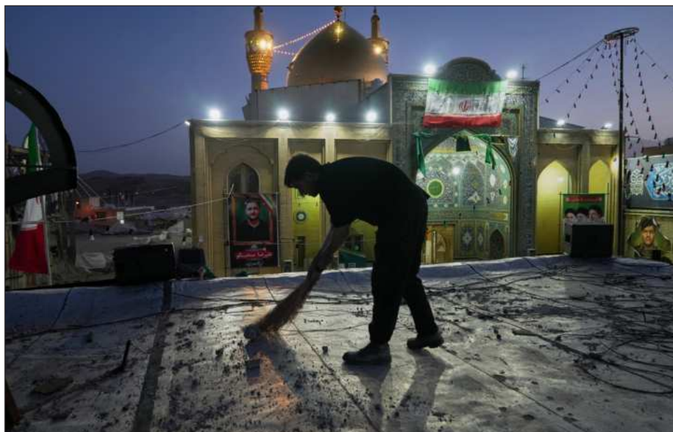
▲ La guerra que estalló en febrero con ataques israelíes y estadounidenses contra Irán.

El petróleo subió el lunes en el comercio asiático con un alza de 1.86 por ciento en