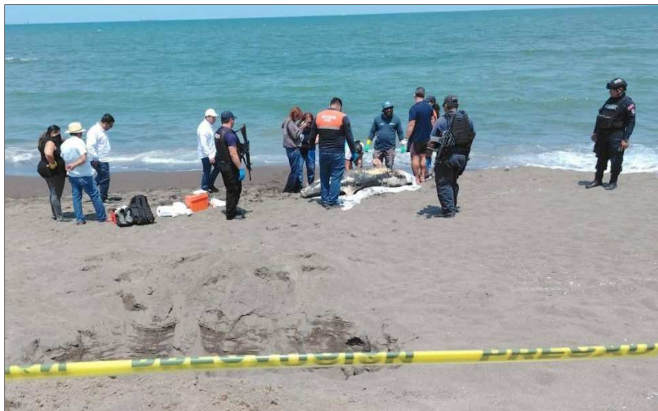
▲ Ciudadanos consideraron que los gobiernos estatal y federal han vulnerado el derecho humano a un medio ambiente sano; así como a los derechos de las comunidades a la salud, al trabajo y al territorio, por lo que lanzaron diversas exigencias.

Consideraron que los gobiernos estatal y federal han