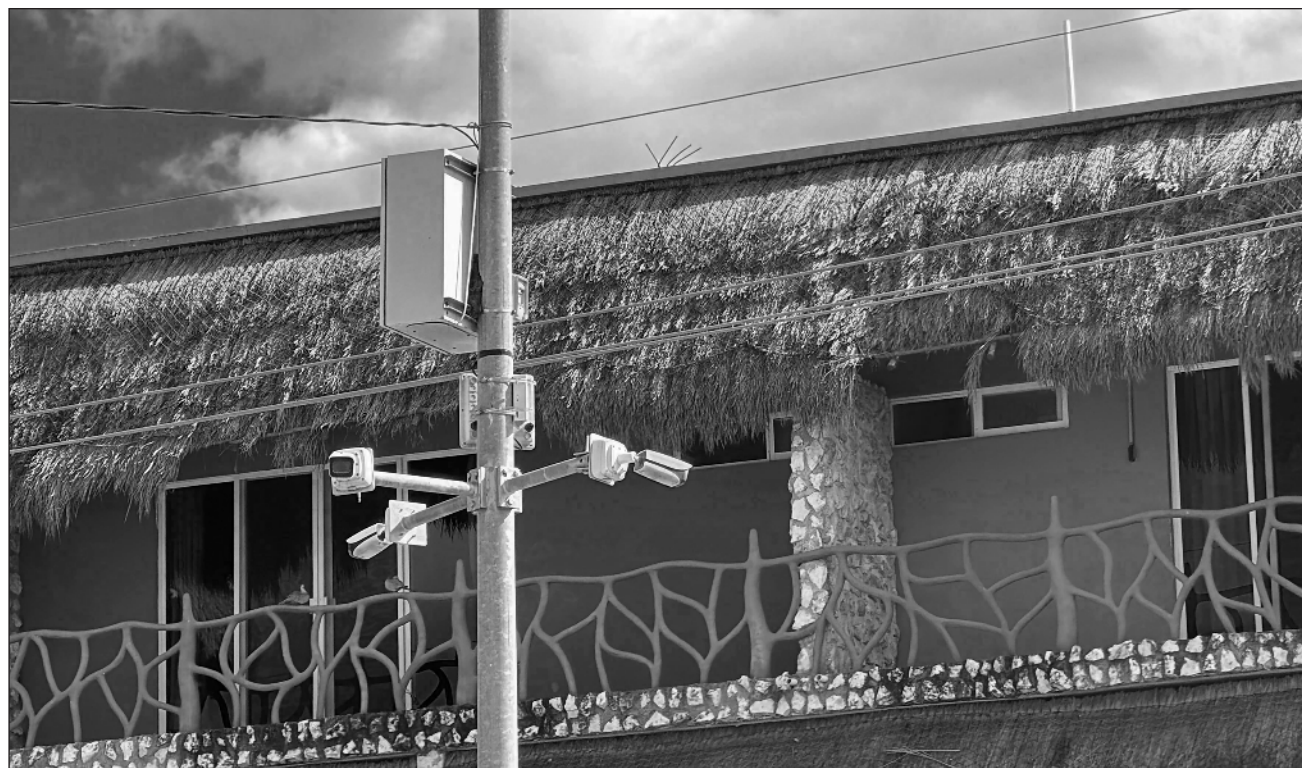
▲ Alrededor de mil 100 cámaras pertenecen al sector empresarial y fueron integradas mediante la firma de cartas responsivas, mientras que otras 340 forman parte de los sistemas oficiales C2 y C5.

El funcionario explicó que el sistema permite realizar “patrullajes virtuales” durante todo el día, con per-