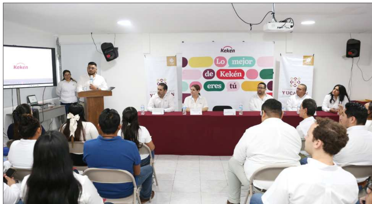
▲ Más de 50 colaboradores de la Planta Procesadora Umán concluyeron su capacitación como técnicos en calidad e inocuidad.

Moo Tun, coordinador de calidad de la empresa agroalimentaria, enfatizó que este tipo de capacitaciones busca dotar a los colaboradores de herramientas integrales que les permitan desempeñar mejor sus funciones diarias.