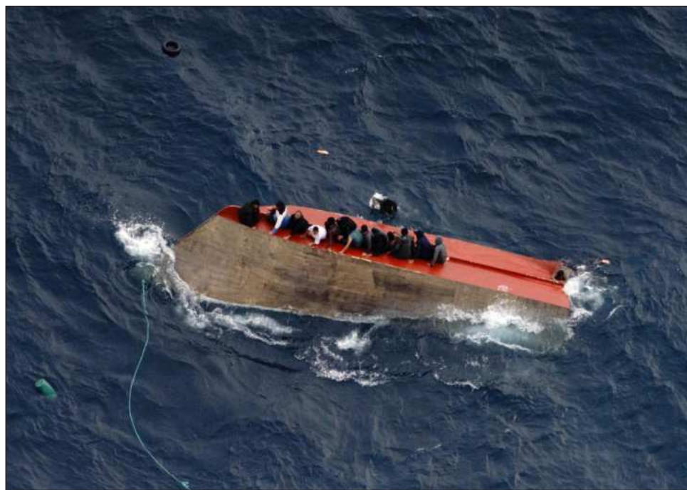
▲ Según las reconstrucciones de video, en la embarcación viajaban 105 migrantes.

En un video publicado en X por Sea-Watch, y que