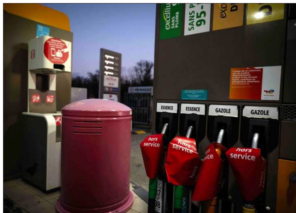
▲ Las empresas de consumo suelen caer en una guerra debido a una combinación de aumento de los costos, interrupción de cadenas de suministro y reducción del gasto de los hogares.

El estrecho de Ormuz (la ruta de tránsito más importante del mundo para el petróleo crudo y punto vital