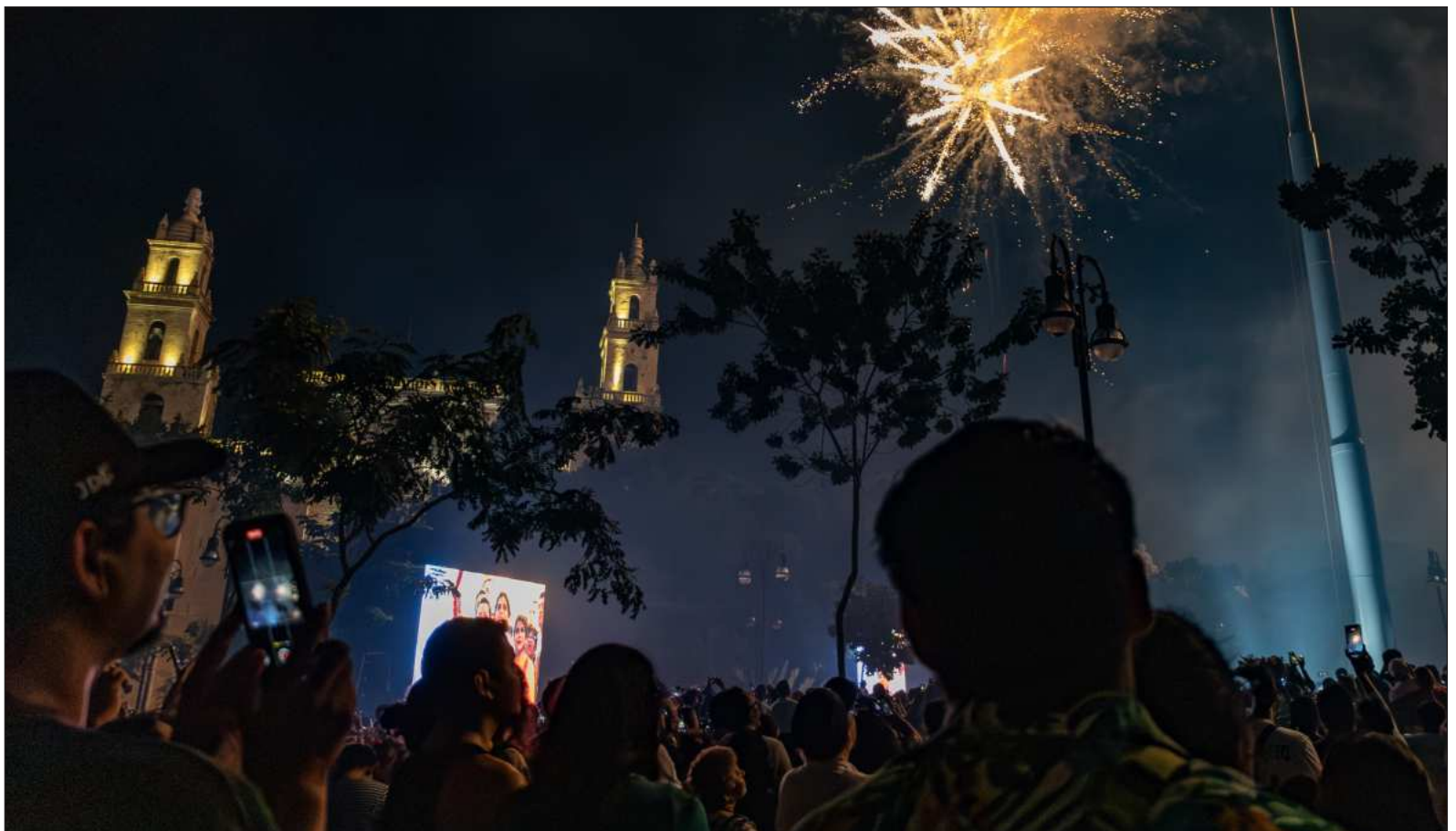
▲ "La gente espera las vacaciones de Semana Santa y la de Pascua, para volar destapados a la playa. Lo ideal sería darnos el tiempo de reflexionar".