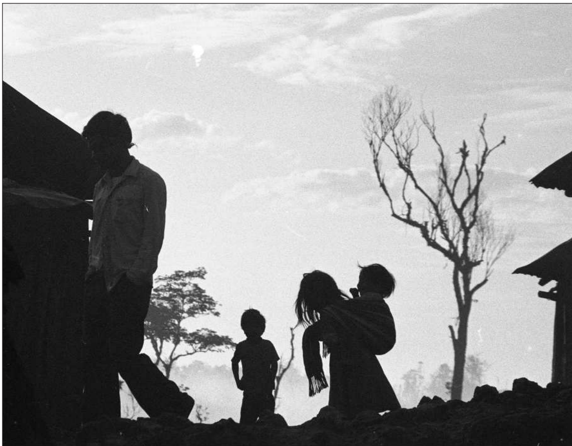
▲ "Bien pudiera pensarse que al fallar el máximo tribunal en contra del amparo y dejarlo sin efecto beneficiará a las comunidades indígenas".

Cabe destacar aquí que esta última ley es un proyecto. No existe. Y no hay visos de que se configure en un futuro por lo menos mediato, por lo que el sector turístico se presenta como blanco de asociaciones que pueden surgir al no haber una definición clara sobre la propiedad de la cultura y patrimonio maya.