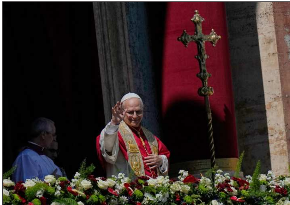
▲ La celebración religiosa de este año se enmarcó en la guerra de EU contra Irán

“Nos estamos acostumbrando a la violencia, nos resignamos a ella y nos volve-