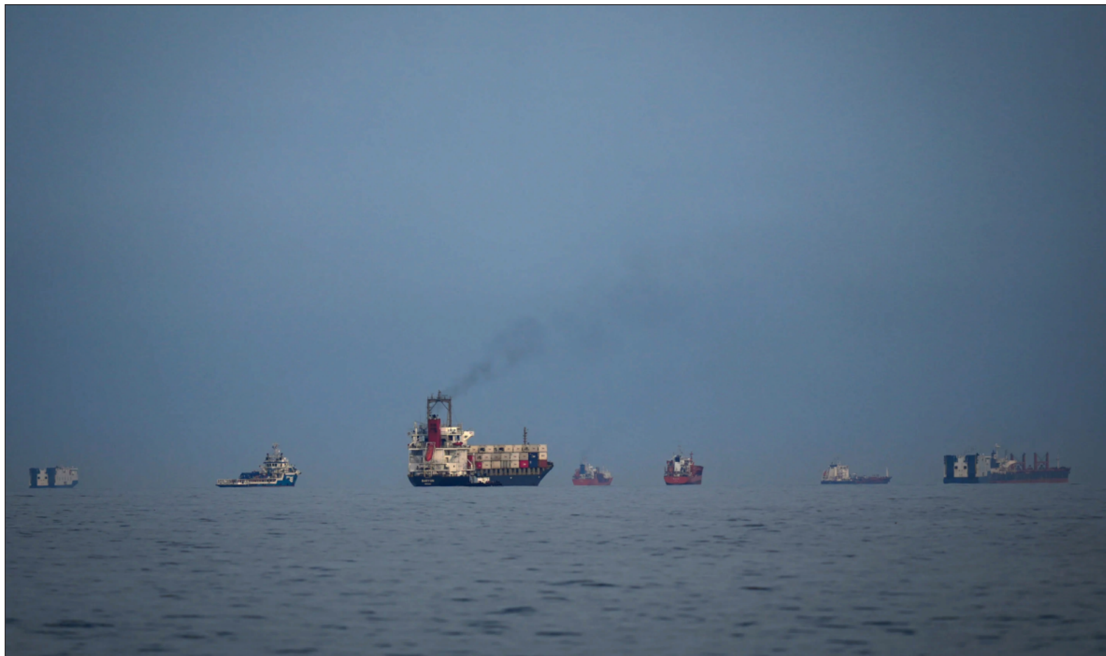
▲ "El Parlamento de este país aprobó una ley que prohíbe el paso de buques de aquellos países socios de Estados Unidos e Israel".