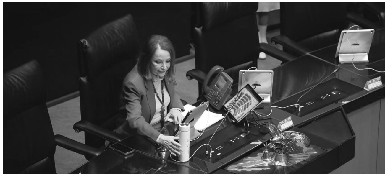
▲ Castillo expuso que ha habido diversas modificaciones legales para combatir el feminicidio, pero en las legislaciones de los estados hay diferencias en el tipo penal, así como sanciones no homologadas y criterios diversos para la investigación.

En lo que se refiere a la propuesta presidencial de reforma al artículo 73 Constitucional, para facultar al Congreso de la Unión a expedir la Ley General en Materia de Feminicidio, precisó que desde que llegó el martes pasado al Senado se turnó a comisiones, a fin de avanzar en el proceso legislativo, luego de las vacaciones de Semana Santa.