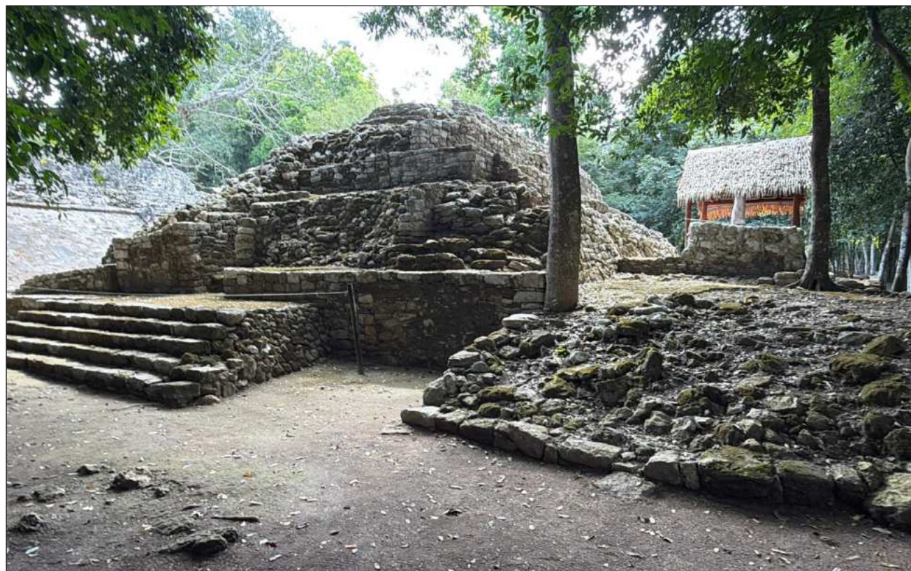
▲ Los visitantes ya pueden subir de nueva cuenta las escalinatas de la pirámide Nohoch Mul.

Los platillos elaborados con ingredientes locales permiten a los visitantes