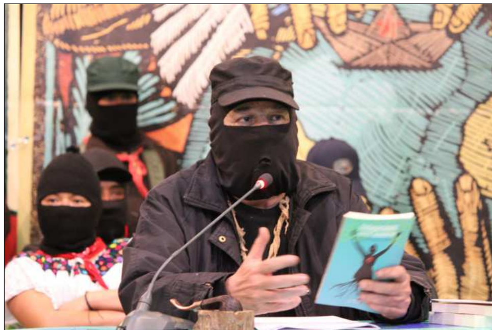
▲ “No son un número a manosear en los medios de comunicación como está ocurriendo en estos días, sino personas con nombre, historia, parientes”, afirmó el capitán Marcos.

Y sí, abundó, “tal vez por fin el equipo de fútbol de México llegue al quinto