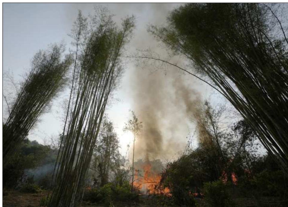
▲ La geografía montañosa de la zona la hace doblemente vulnerable a la contaminación.

La situación es aún peor hacia el oeste, en Pai, destino popular entre mochileros co-