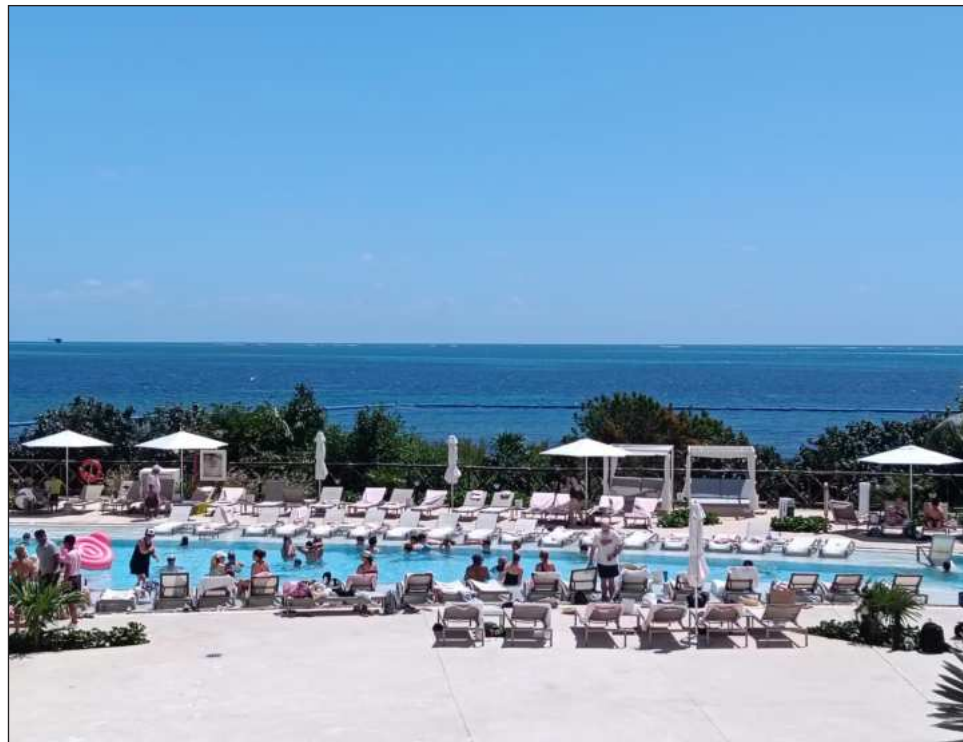
▲ La región vive un dinamismo en esta primera semana del periodo vacacional.

“El pasado sábado se superaron las 749 operaciones aéreas en los cuatro aeropuertos internacionales del estado, siendo el segundo día con mayor número de operaciones en el año. Asimismo, en marzo se registró un incremento importante en la conectividad que esperamos se mantenga en abril, sobre todo en esta Semana Santa y Semana de Pascua, cuando esperamos más de un millón 200 mil turistas”, compartió el funcionario estatal.