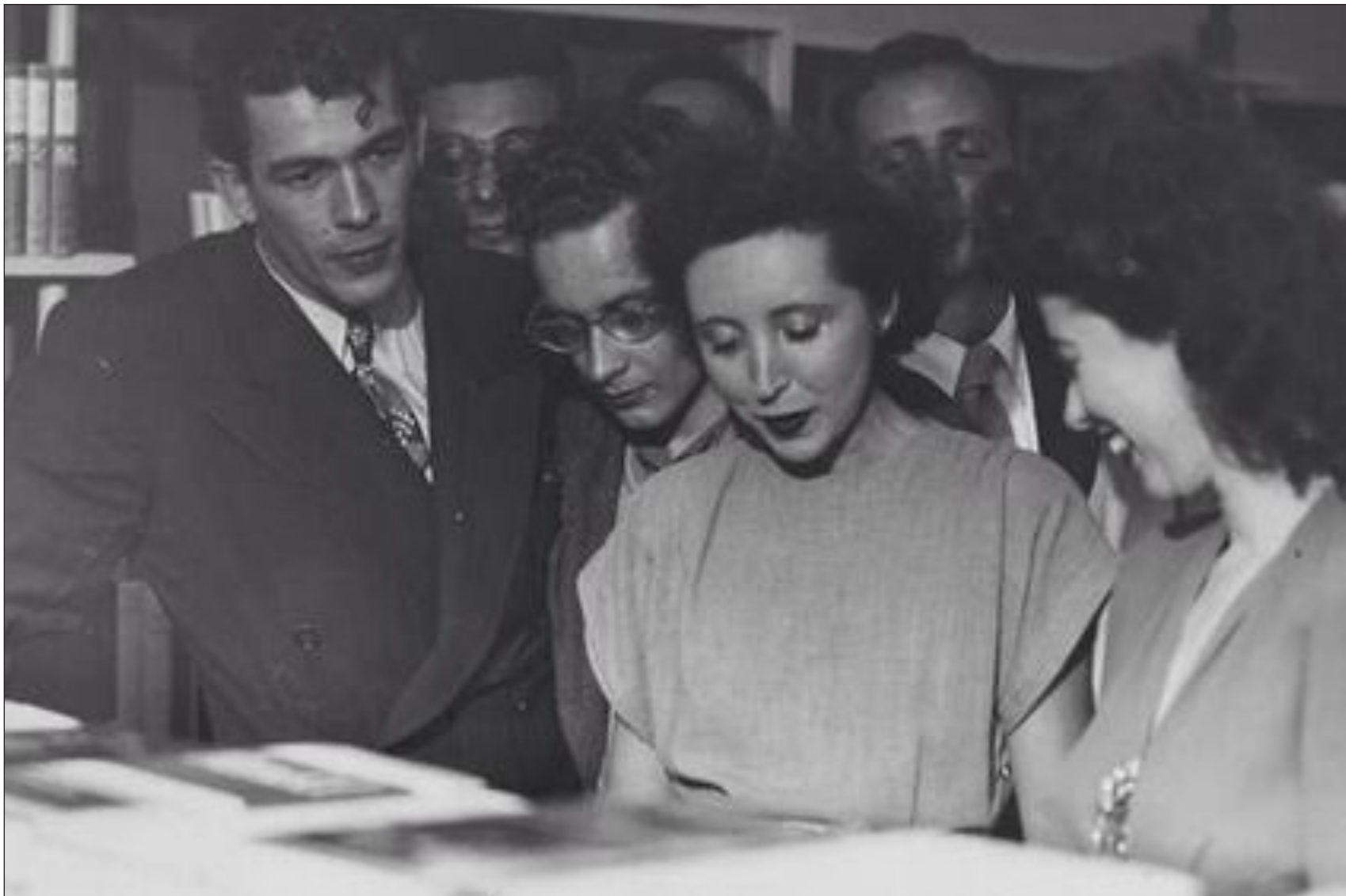
▲ "Anais Nin se regodeó en sus complejas relaciones sexuales con hombres y mujeres que relató en frecuentes sesiones de psicoanálisis. Condenaba la vida amorosa burguesa por su falta de imaginación".

De ascendencia cubana, Anais Nin escribió a partir de