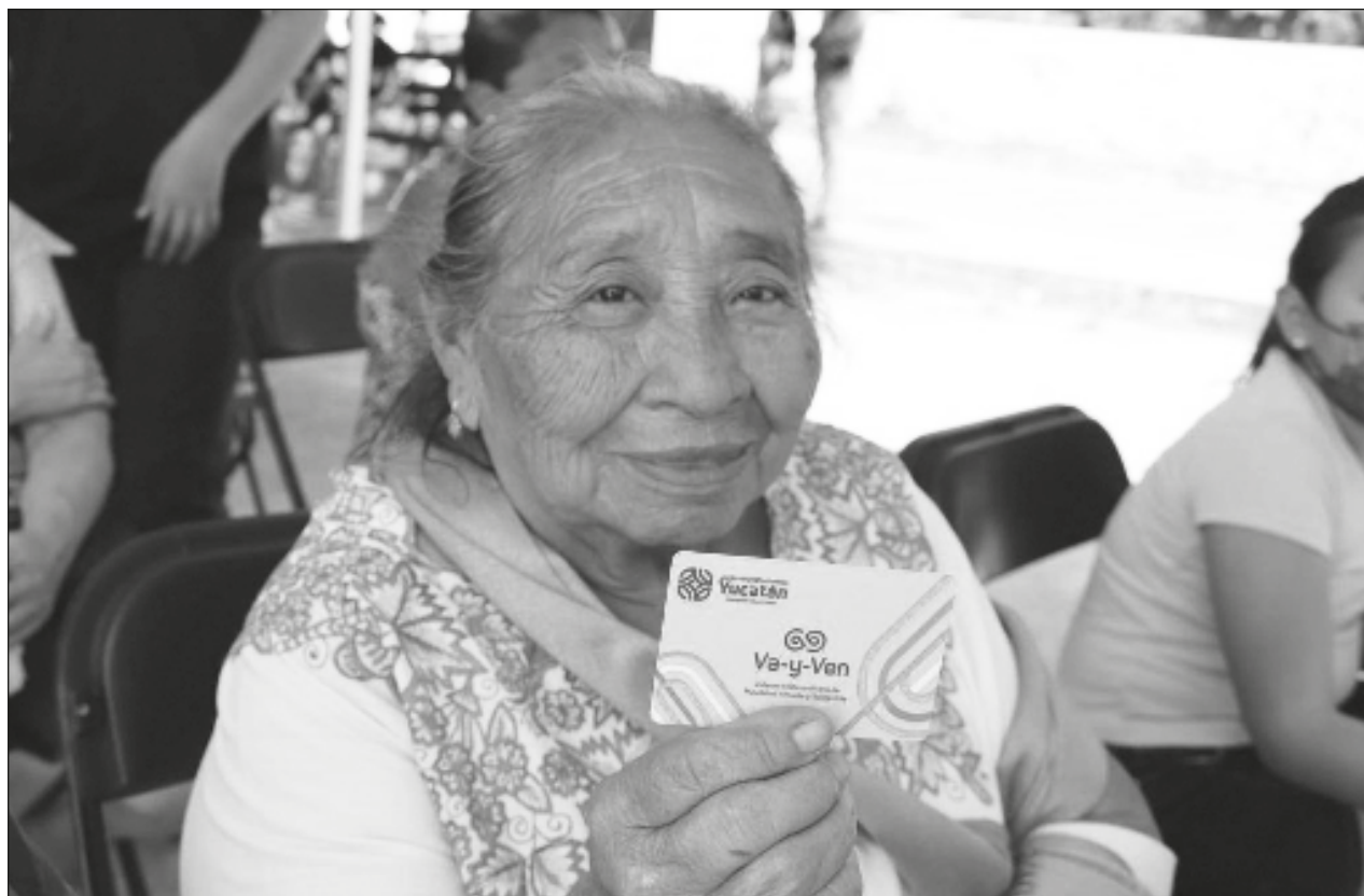
▲ Además de ser un nuevo trayecto en el sistema Va y ven, la ruta de Circuito Metropolitano ahora también cuenta con la tarifa social para estudiantes y adultos mayores, la cual no se aplicaba desde su creación.

Una de las razones que causa la falta de interés por aprender esta lengua —y en general las lenguas indígenas—, advirtió, es la discriminación; “cuando bajas del pueblo a la ciudad lo primero es que te miran de arriba abajo”.