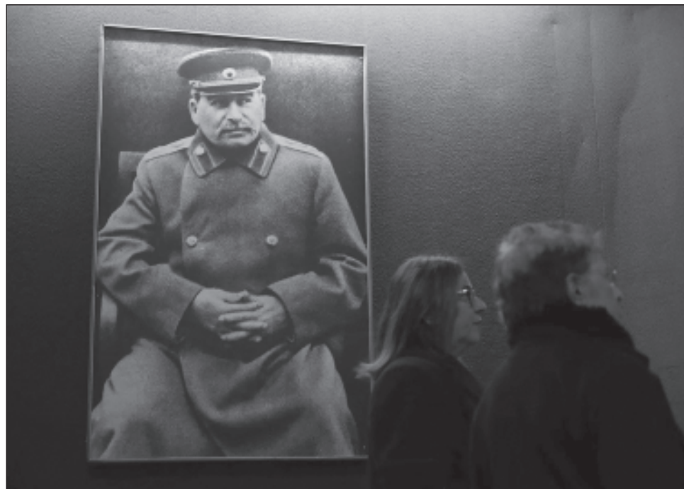
▲ Más de mil admiradores de Stalin se reunieron en la plaza Roja de Moscú para depositar miles de flores en su tumba, situada en los muros del Kremlin.

Algunos llevaban banderas rojas de la Unión Soviética, y otros retratos del implacable dirigente nacido en Georgia en 1878 con el nombre de Iósif Dzhughashvili.