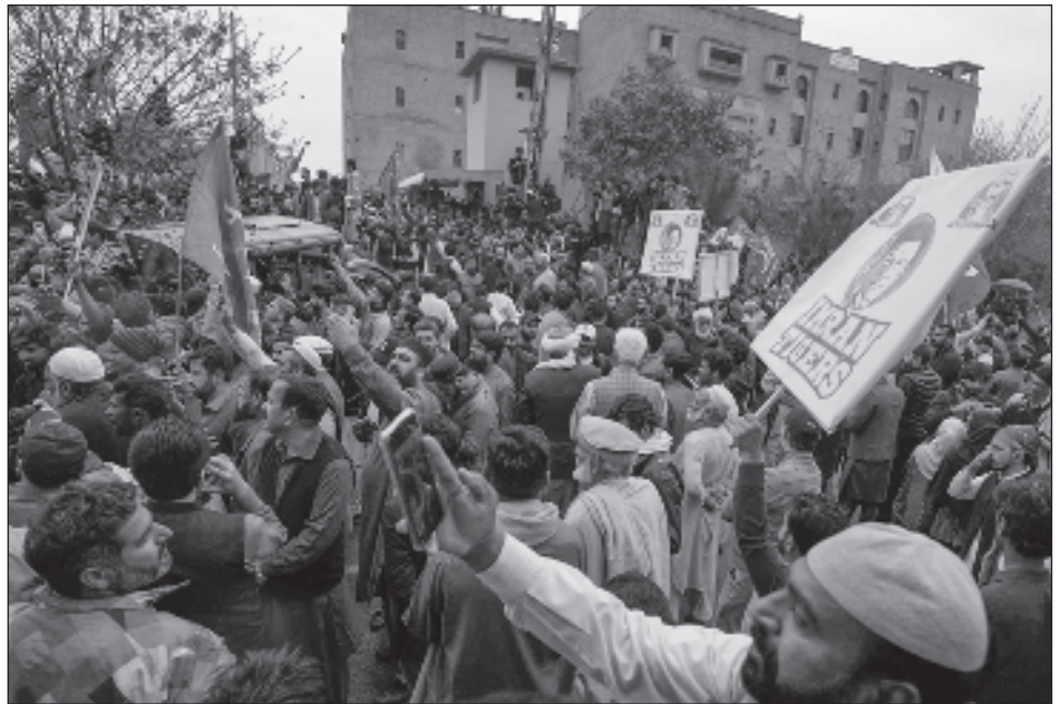
▲ Cientos de seguidores protegieron a Imran Khan de ser detenido este domingo.

“Le estamos pidiendo a él (Khan) que venga con nosotros”, dijo el jefe de policía Akbar Nasir al canal paquistaní Dawn News TV.