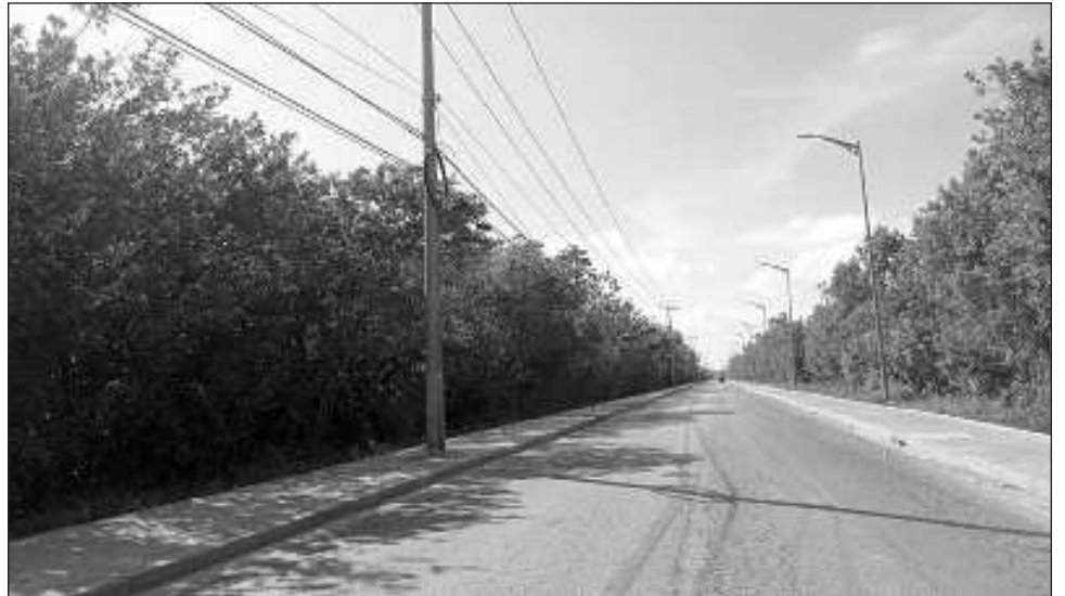
▲ Con las adecuaciones el acceso principal a Puerto Morelos podrá duplicar su anchura, garantizando mejores flujos hidrológicos y calidad de vegetación.

"Será una molestia de 10 meses para los ciudadanos, pero va a resultar algo bueno, con un bulevar, una avenida, con el doble de capacidad del que existe