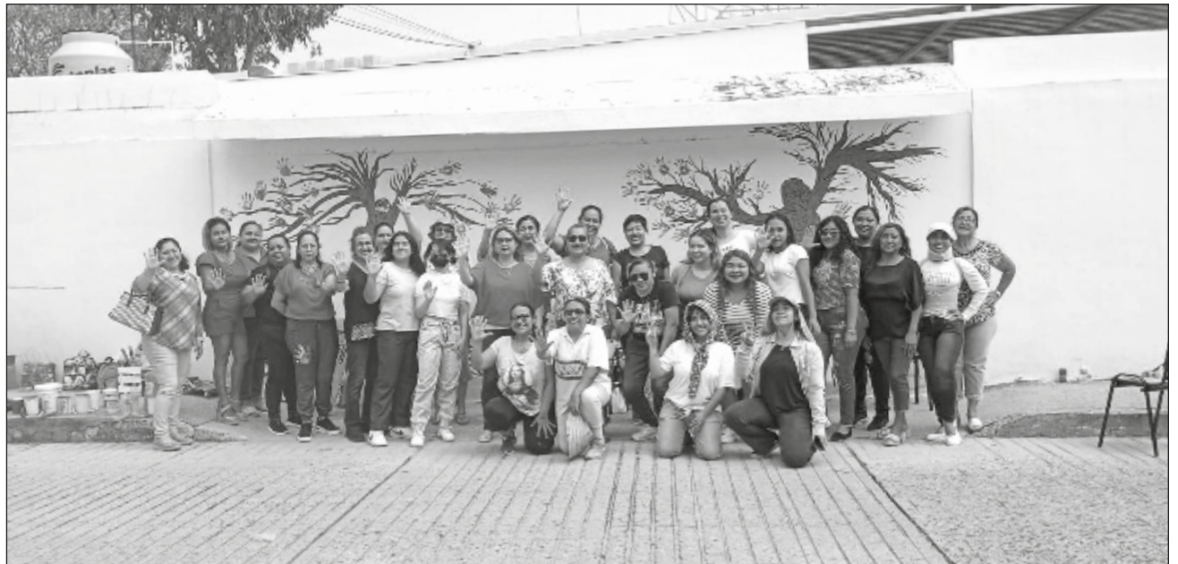
▲ La obra representa la silueta de dos mujeres, en forma de tronco de un árbol, cuyas raíces se unen en forma de corazón y sus hojas son las manos de las participantes.