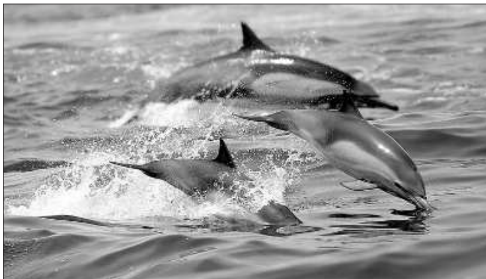
▲ El tratado alcanzado el sábado por los integrantes de Naciones Unidas también sienta las bases de los estudios de impacto ambiental para actividad comercial en los océanos.

El tratado también sienta las bases de los estudios de impacto ambiental para actividad comercial en los océanos.