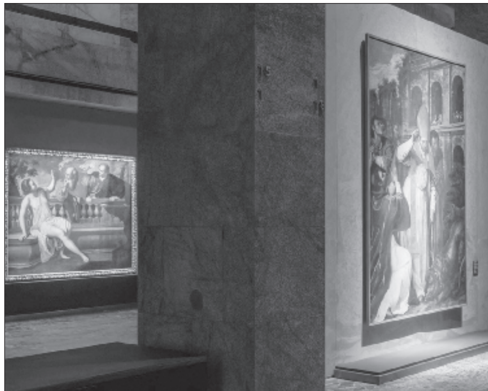
▲ La exposición Artemisia Gentileschi se agrega a las siete muestras destinadas a la artista desde la primera monográfica en Florencia, en el año 1991.

La exposición se agrega a las siete muestras destinadas a la artista desde la primera monográfica en