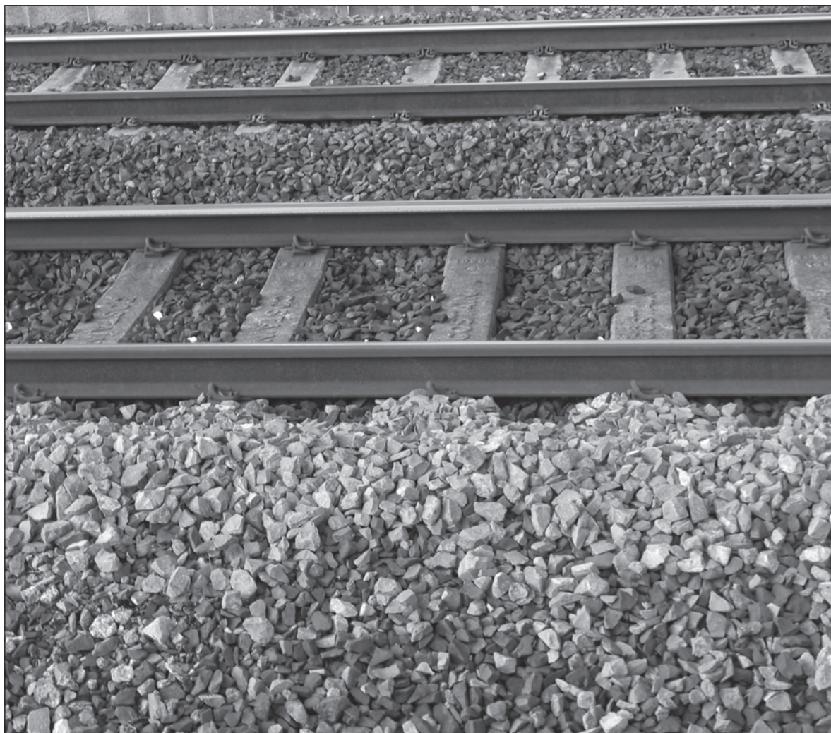
▲ Las operaciones para manipular el balasto que se usará en el Tren Maya “van a fragmentar la barrera coralina y levantar sedimento marino que asfixiará corales y pastos marinos y su fauna asociada. Por otra parte, se talarían varias centenas de hectáreas de manglar para ensanchar el camino de Puerto Morelos”.

El SAM está conectado por un corredor marino que se extiende desde el norte Quintana Roo, México a las Islas de Honduras, abarcando además manglares, pastos marinos, el arrecife y el mar abierto. Estos sitios están interconectados por las corrientes, transportando crías de un sin número de especies. El corredor del SAM abarca más de mil kilómetros y es utilizado como ruta migratoria de fauna marina incluyendo tortu-