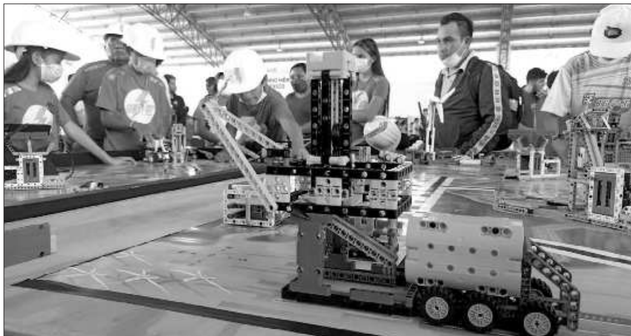
▲ En la octava fase regional del FIRST LEGO League participaron más de 400 niños de 50 escuelas de todo el país, del estado fueron 20; estudiantes de la telesecundaria Juana de Asbaje integran el equipo U Muukiik, que significa fuerza del viento.

Las y los estudiantes de U Muukiik realizaron un estudio en su pueblo para determinar cuál es la principal problemática, donde resaltaron la falta del suministro de agua y energía eléctrica; y por eso decidieron desarrollar, con ayuda de los legos y el conocimiento en robótica, una maqueta donde plasmaron algunas casas mayas de su comunidad, que es alimentada a través de energía eólica para dotar de energía el alumbrado público y abastecer de agua a la población.