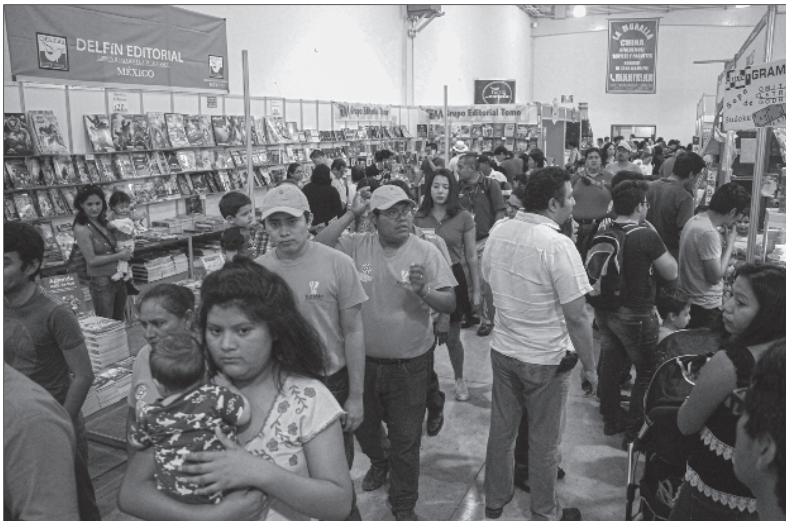
▲ “Los temas que serán tratados en los foros versarán sobre el suicidio, la formación de escritores en lengua materna”, entre otros.