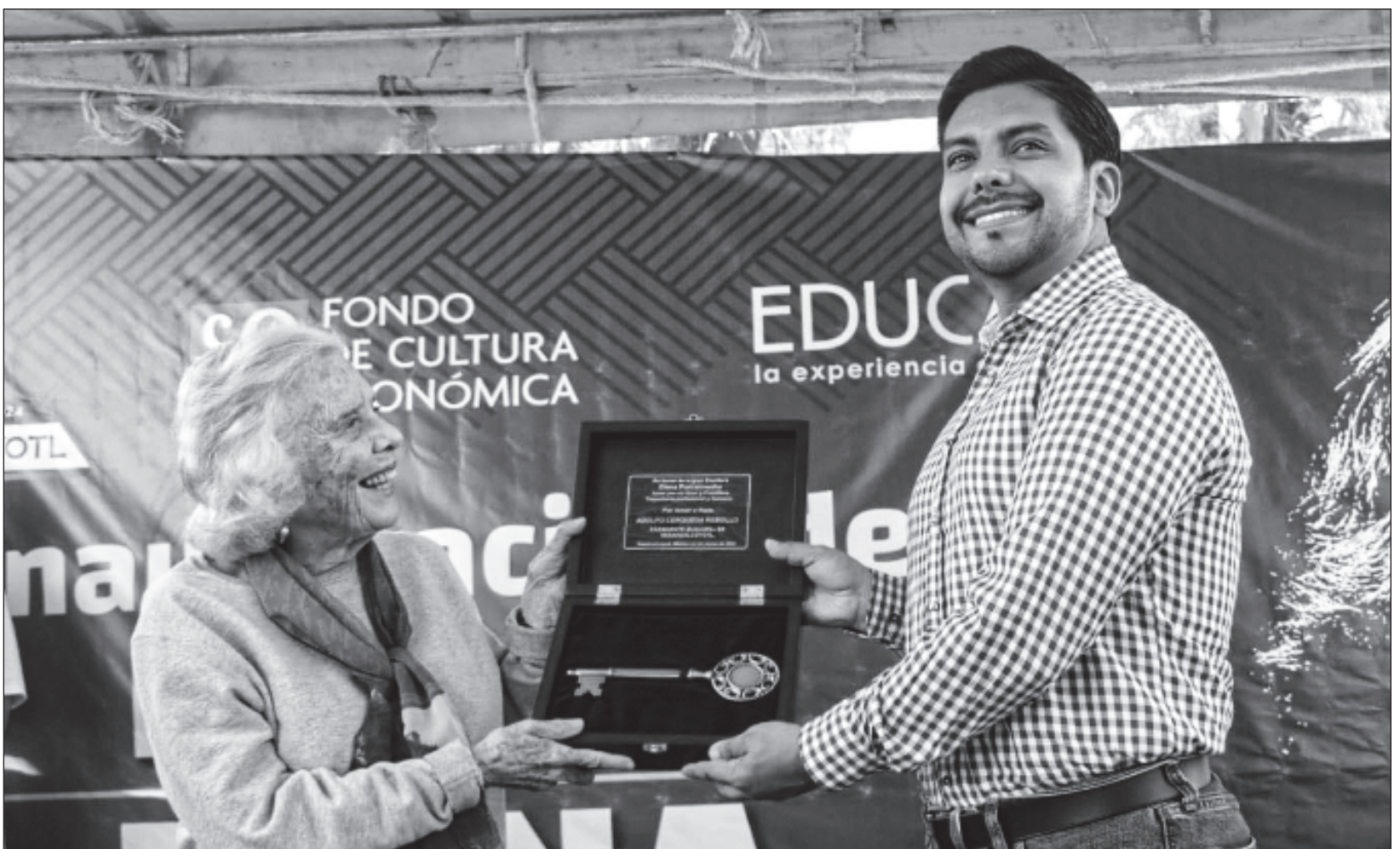
▲ La autora tuvo ánimo para recorrer el centro cultural y firmar, por poco más de media hora, decenas de libros.

La librería Elena Poniatowska es la número 117 del FCE en el país. Cuenta con 25 mil 300 ejemplares y 5 mil títulos, tanto de esa editorial como de otras. Su catálogo fue diseñado “con énfasis en libros de bajo precio, de menos de 50 pesos, para atender a la población de Ciudad Neza”, indicó el personal del FCE a La Jornada .