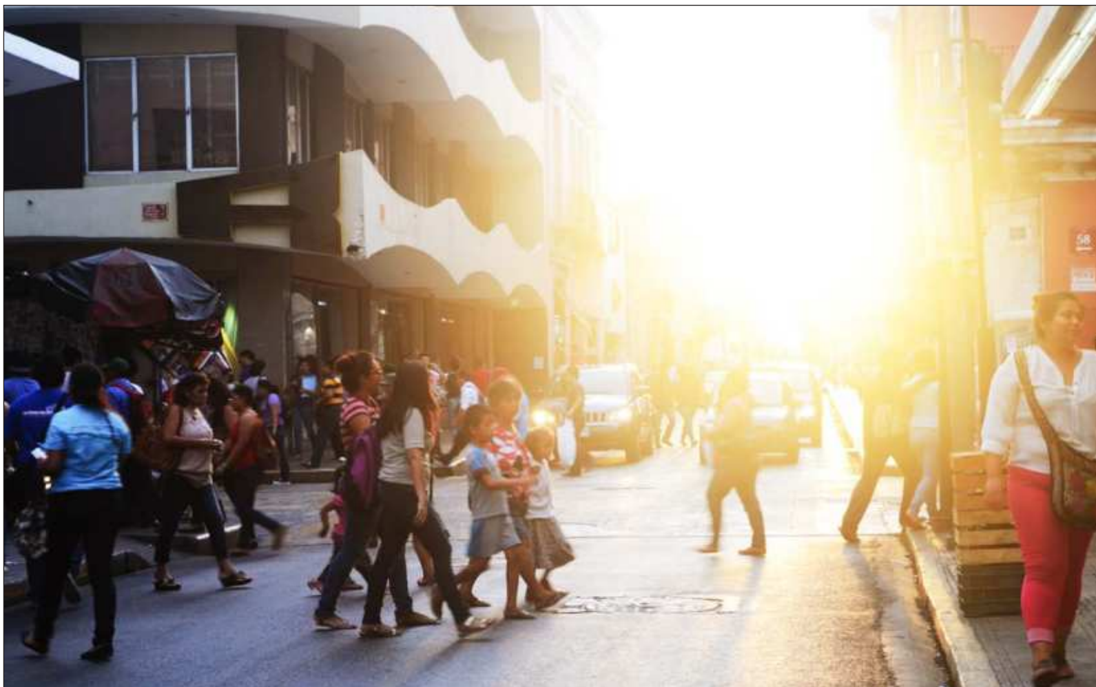
▲ "Nuestro estado ya es, con mucho, la Suiza de México. No tenemos montañas, pero sí inversión, paz, calidad de vida, respeto por las leyes".