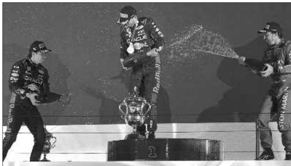
▲ Desde la izquierda, Sergio Pérez, Max Verstappen y Fernando Alonso celebran en el podio del Gran Premio de Bahrein.

Los seguidores de Alonso han catalogado esta temporada como “Misión 33”, confiando que pueda lograr la 33a. victoria de su carrera. Su último triunfo fue hace 10 años con Ferrari. Alonso, quien se incorporó a Aston Martin, tras romper de malas formas con Alpine, apretó el puño al cruzar la meta y se abrazó con sus mecánicos. “Terminar en el podio en la primera carrera del año es algo asombroso”, dijo Alonso. “Lo que Aston Martin hizo durante el invierno para te-