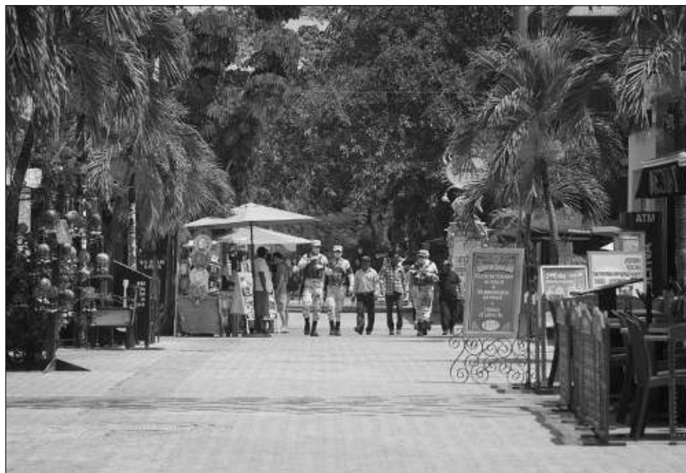
▲ La gobernadora anunció el aumento de 33 por ciento en el Impuesto Sobre la Nómina, 66 por ciento en el Impuesto al Hospedaje y un nuevo rubro enfocado a la venta de bebidas alcohólicas.

El documento destaca que esta política “está yendo en contrasentido al gobierno del presidente An-