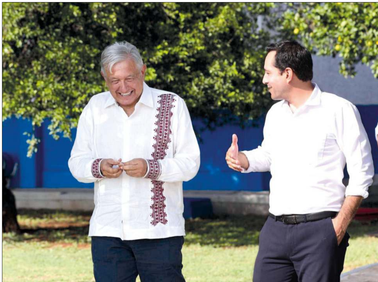
▲ Los mandatarios se comprometieron a mantener abiertos los canales de comunicación y la colaboración para seguir promoviendo acciones y programas que representen beneficios para las familias que viven en el sureste del país.

En la reunión, se mencionó que toda el área se divide en cuatro secciones, con áreas verdes, andadores techados,