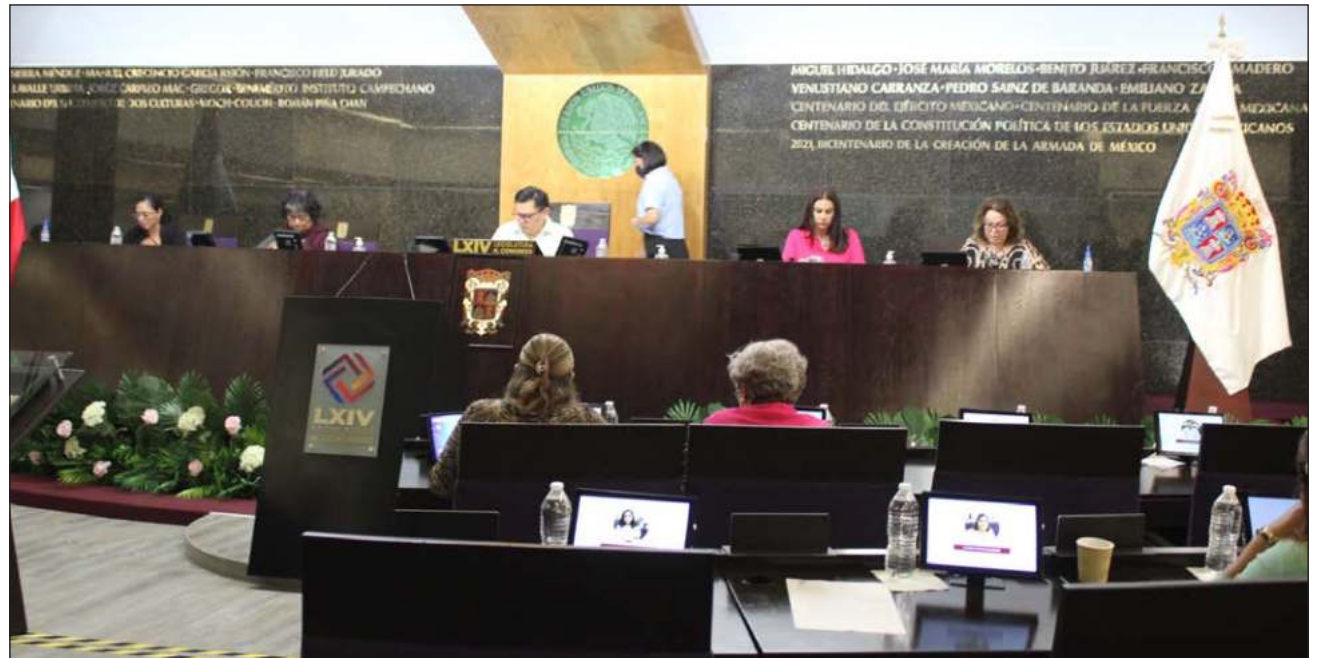
▲ Será a mediados de diciembre cuando comiencen las comparecencias y los alcaldes tengan que acudir a la capital para ser cuestionados por los legisladores; allí deberán defender junto a sus asesores y tesoreros los proyectos de operatividad de 2023.

Como ejemplo, el municipio de Campeche que proyectó un ingreso aproximado a los mil 500 millones de pesos en el 2022, para este año aumentó a poco más de mil 800 millones de pesos; de la misma manera Carmen, de mil 645 millo-