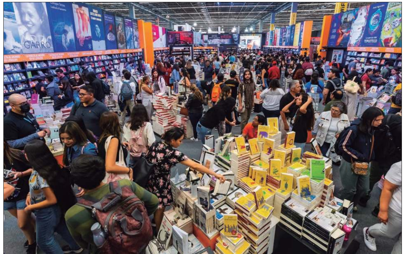
▲ A pesar de los conflictos con los gobiernos federal y de Jalisco, la FIL recobró sus indicadores, tanto en lo que toca a asistencia de público como de participación de editoriales y cantidad de eventos.

Al respecto, Padilla López aseguró que estos conflictos no afectarán la realización de las ediciones siguientes y que esperan que las relaciones con