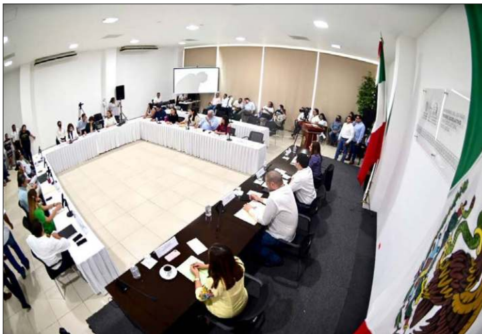
▲ El paquete fiscal enviado por el gobierno del estado ampliará el presupuesto para la implementación de programas de salud mental y prevención de adicciones en jóvenes.

Tras estos comentarios, la bancada del Partido Acción Nacional (PAN) y el Partido Verde aprobaron el proyecto propuesto, con lo que resultó aprobado por mayoría; en esa sesión aprobaron las iniciativas para la Ley de Ingresos y el Presupuesto de Egresos del Estado para el Ejercicio Fiscal 2023, la Ley General de Hacienda del Estado de Yucatán y el Código Fiscal del Estado, así como iniciativas para modificar la Ley de Ingresos de Izamal y Tixkokob para el Ejercicio Fiscal 2022 y rechazaron a Tekax contratar empréstitos destinados a cumplir con los pagos de los laudos durante los ejercicios fiscales 2021-2024.