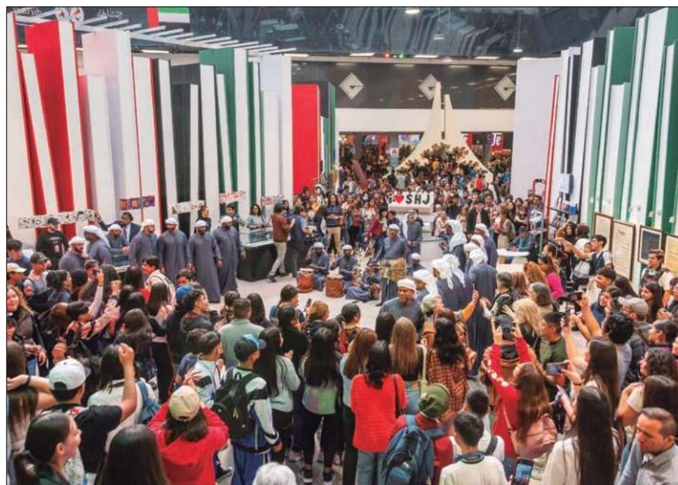
▲ El pabellón del emirato árabe Sharjah recibe a los visitantes con una muestra de su caligrafía, música y bailes; una probadita de arte islámico.

Un recorrido sin prisa tan sólo por las áreas de exposición y venta de libros, para ver y comprar, si alcanza el presupuesto que se