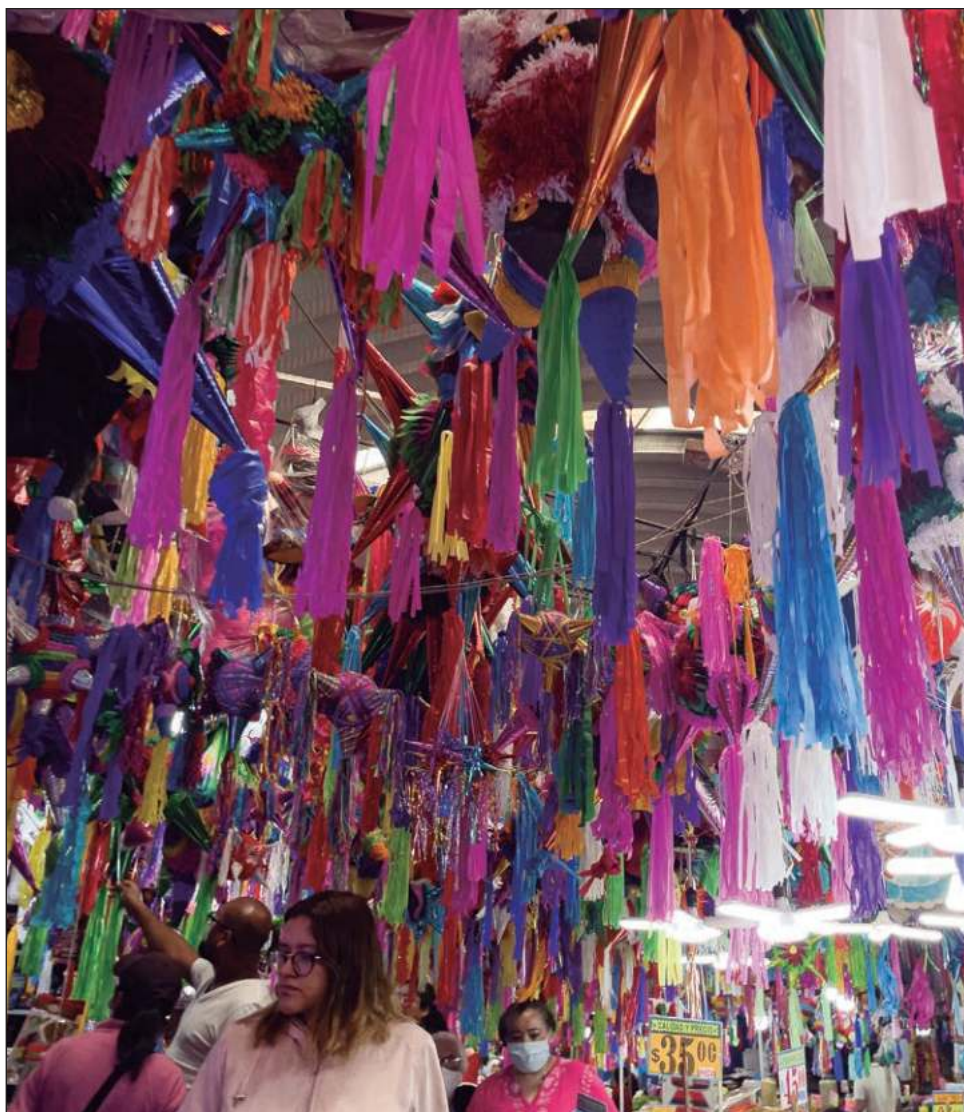
▲ Al hacer compras para el hogar, las familias buscan más opciones. La agencia de mercados Kantar indicó que toman productos más pequeños en las categorías básicas.

“En conclusión, al disminuir tamaño sigo comprando marca propia (de las tiendas), sin dejar de lado los productos premium [...], pero a través de la asequibilidad que darán los tamaños más pequeños”, refirió Lupita Quevedo.