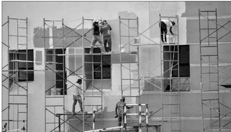
▲ El gobierno de Campeche tiene obras programadas en las cuales participarían constructores del Carmen . En la imagen, trabajos en el estadio Nelson Barrera Romellón.

"Muchos de los agremiados han tenido que recurrir a la venta de sus activos, para poder cumplir con sus compromisos fiscales, sin embargo, tenemos buenas