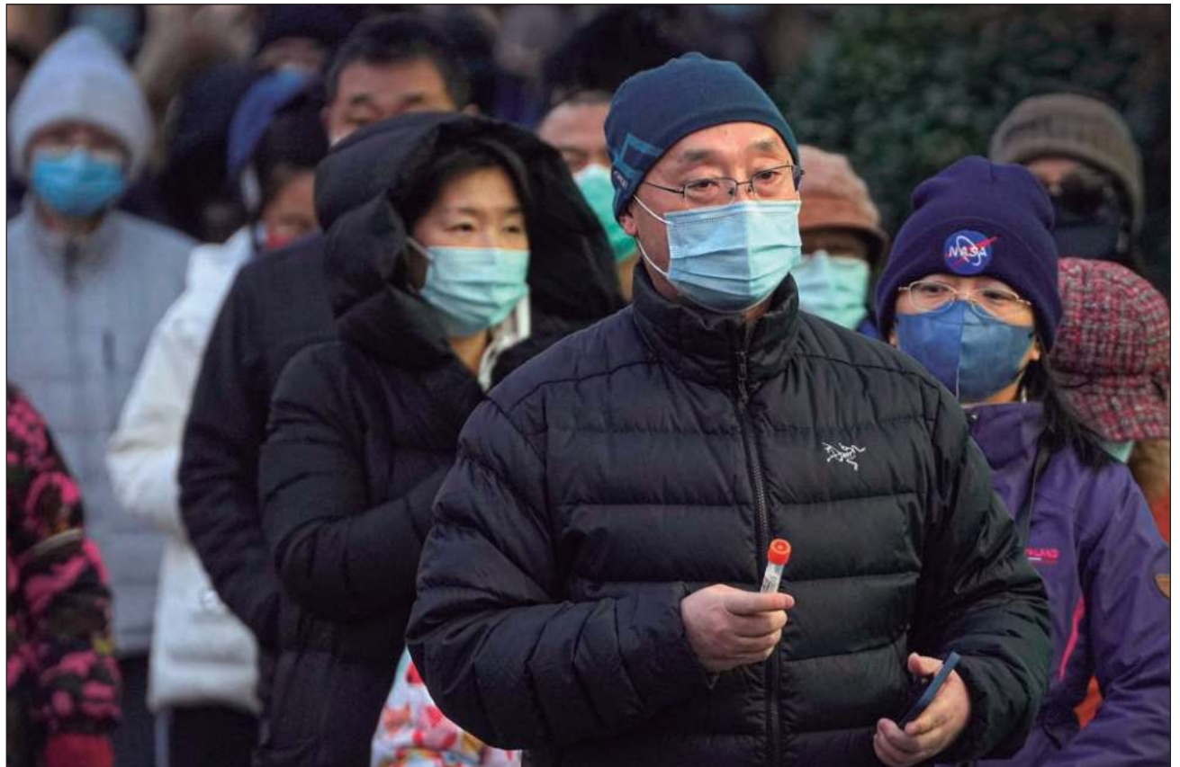
▲ Los habitantes podrán volver a utilizar los transportes públicos y acceder a ciertos lugares (como los parques y las atracciones turísticas) sin tener que presentar un test PCR negativo de menos de 48 horas.

Los habitantes de este centro financiero de China podrán volver a utilizar los transportes públicos y acceder a ciertos lugares (como los parques y las atracciones turísticas) sin tener que presentar un test PCR negativo de menos de 48 horas, indicaron las autoridades en un mensaje en la red social WeChat.