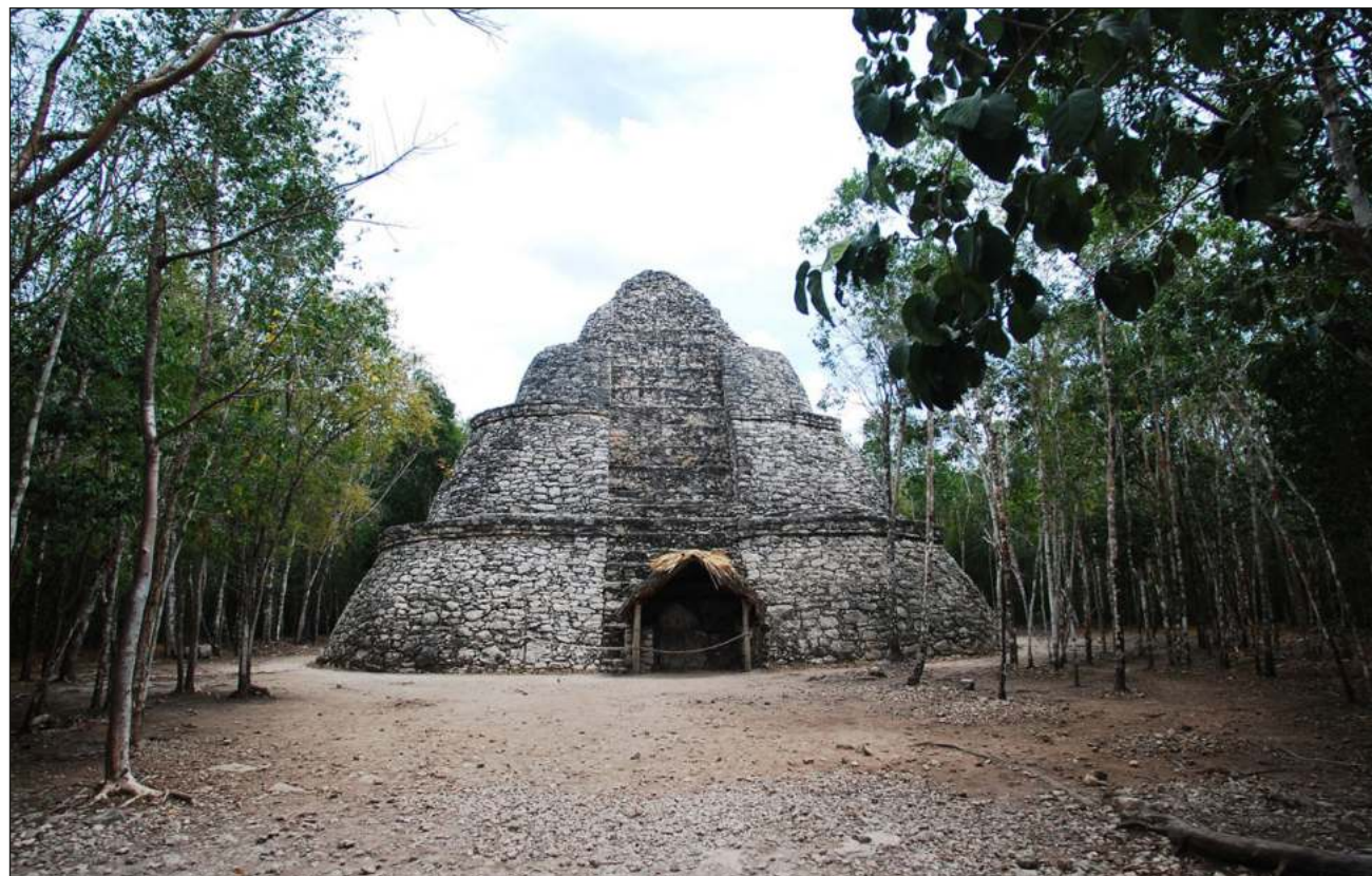
▲ Jejeláas ba'alo'ob k'a'abéet ti'al u yúuchul xíinximbale' táan u p'ata'al tu beel ti'al le winala'.

"U ajmeyajilo'ob Cobá máako'on kaambanaja'ano'on tu beel, jejeláas t'aano'ob kt'anik: maayat'aan, káastelant'aan, iglés, francés, alemán, ti'al beyo' u tsikbaltáal tuláakal máax ka taalak u xíimbalto'on, je'el tu'uxak bíin u kaajalo'ob", tu ya'alaj.