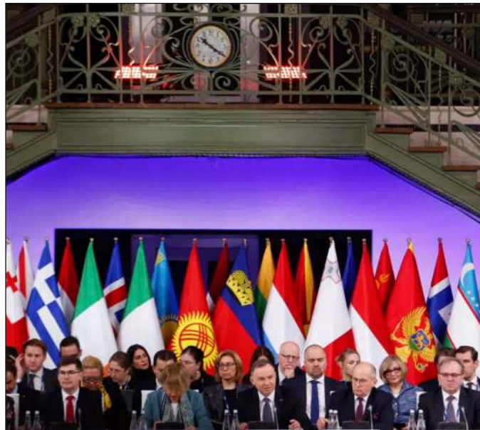
▲ El ansia de dominio mundial de Occidente y las nostalgias imperiales del Kremlin continúan en un estira y afloja que tiene como víctimas directas a miles de soldados.

Conforme se desvanece cualquier perspectiva de una solución pacífica al conflicto en Ucrania, es necesario recordar que la guerra que ha devastado a este país es el resultado trágico del choque de dos necesidades. Por un lado, la desmesura del presidente Vladimir Putin y su obsesión con restaurar el imperio ruso; por otro, la cerrazón de Occidente, su empeño en reducir a la he-