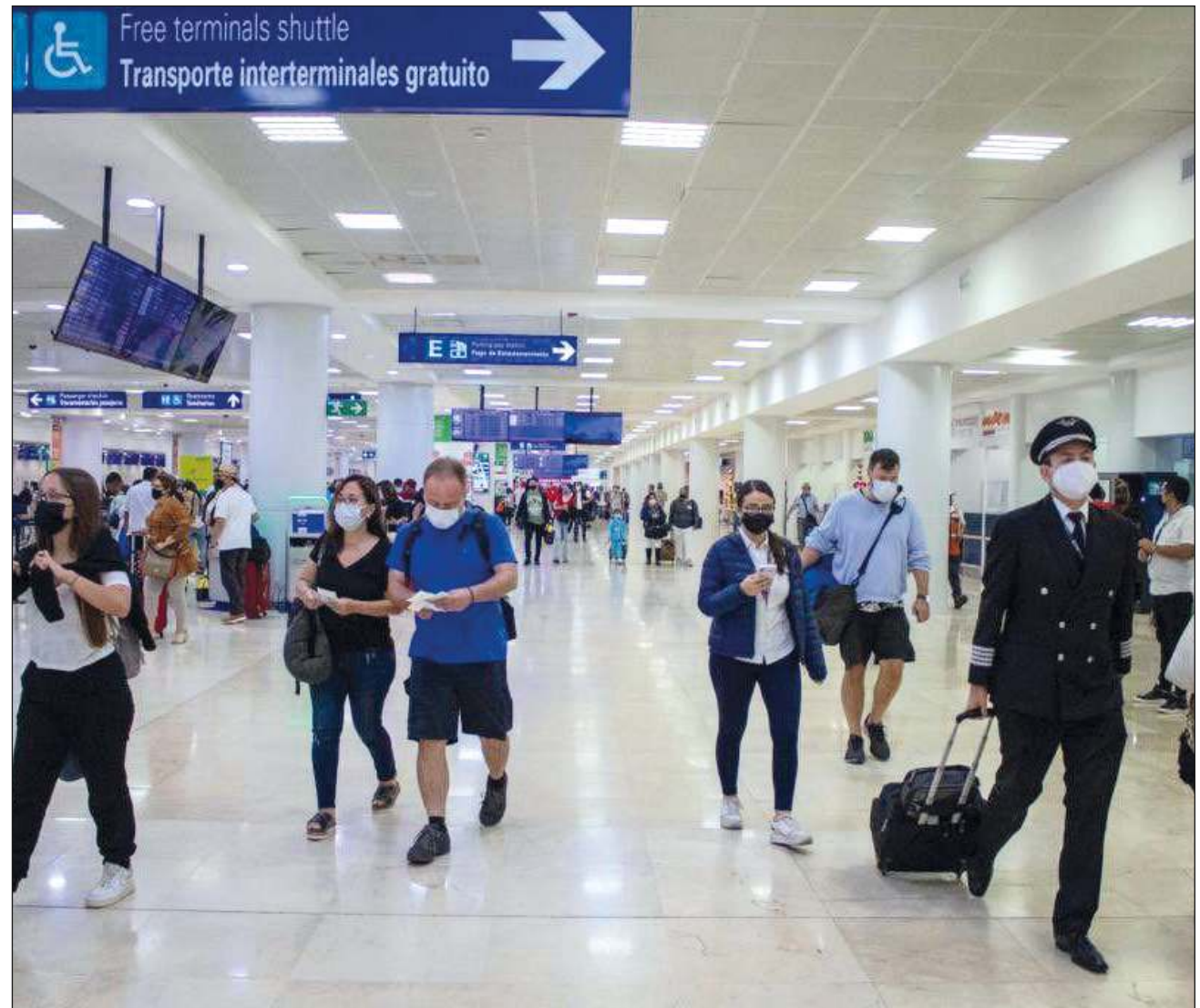
▲ Aeropuertos del Sureste reportó el domingo 4 de diciembre un total de 617 operaciones aéreas.

En cuanto al número de visitantes, la misma asociación reportó 67 mil dos visitantes registrados en Cancún, 9 mil 713 en Puerto Morelos y 8