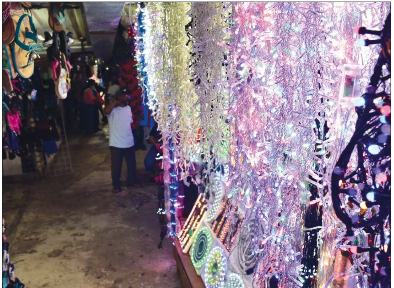
▲ Hay optimismo entre los comerciantes yucatecos por las celebraciones decembrinas, debido a que en este año se podrán realizar posadas, reuniones familiares, de empresas y entre amigos sin restricciones.

Rodríguez Gasque expuso que los productos que registran la principal demanda en diciembre por las celebraciones de navidad son: ropa, calzado, electrónicos, electrodomésticos, accesorios para dama, juguetes, bicicletas infantiles, perfumes, teléfonos celulares, artículos decorativos para los pesebres, luces multicolores, piñatas, entre otros.