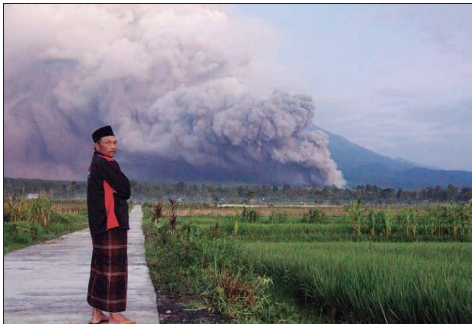
▲ Las lluvias del monzón erosionaron y finalmente provocaron el derrumbe del domo de lava en lo alto del monte Semeru, de 3 mil 676 metros de altura, lo que provocó la erupción, indicó el vocero Abdul Muhari de la Agencia Nacional de Gestión de Desastres.

El incremento de actividad del volcán el domingo