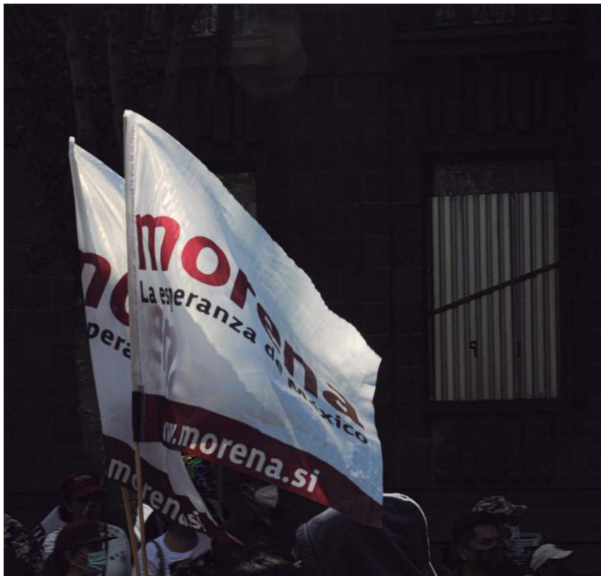
▲ "La pregunta no es quién puede ganar el voto de Morena, sino quién de Morena puede convertir su frágil mayoría relativa en una mayoría victoriosa (...) tomemos de la encuesta de moda lo bueno e informativo".

TOMEMOS DE LA encuesta de moda lo bueno e informativo, Morena va adelante y sólo cuatro actores políticos tienen en este momento el tamaño para ser viables a la gubernatura; y descartemos el resto que no informa, sino de hecho distorsiona percepciones. Que la grilla de café sea buena. Un buen alcalde, un delegado federal, un senador y un secretario estatal de educación deben ser contrastados.