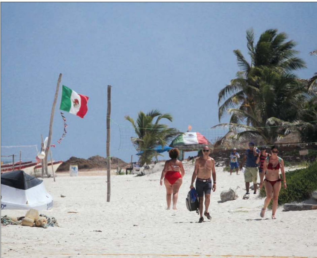
▲ Ya es visible el crecimiento en el número de turistas que llegan a los destinos de Quintana Roo.

También reconoció que el anuncio del Instituto Nacional de Antropología e Historia (INAH), que sigue informando que la zona arqueológica está cerrada, baja el flujo de turistas, pero dejó claro que los ejidatarios siguen permitiendo el paso de los visitantes a los vestigios.