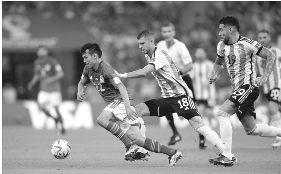
▲ El Tri tuvo un triunfo, una derrota y un empate en el mundial.

Martino no respondió a los reclamos de los aficiona-