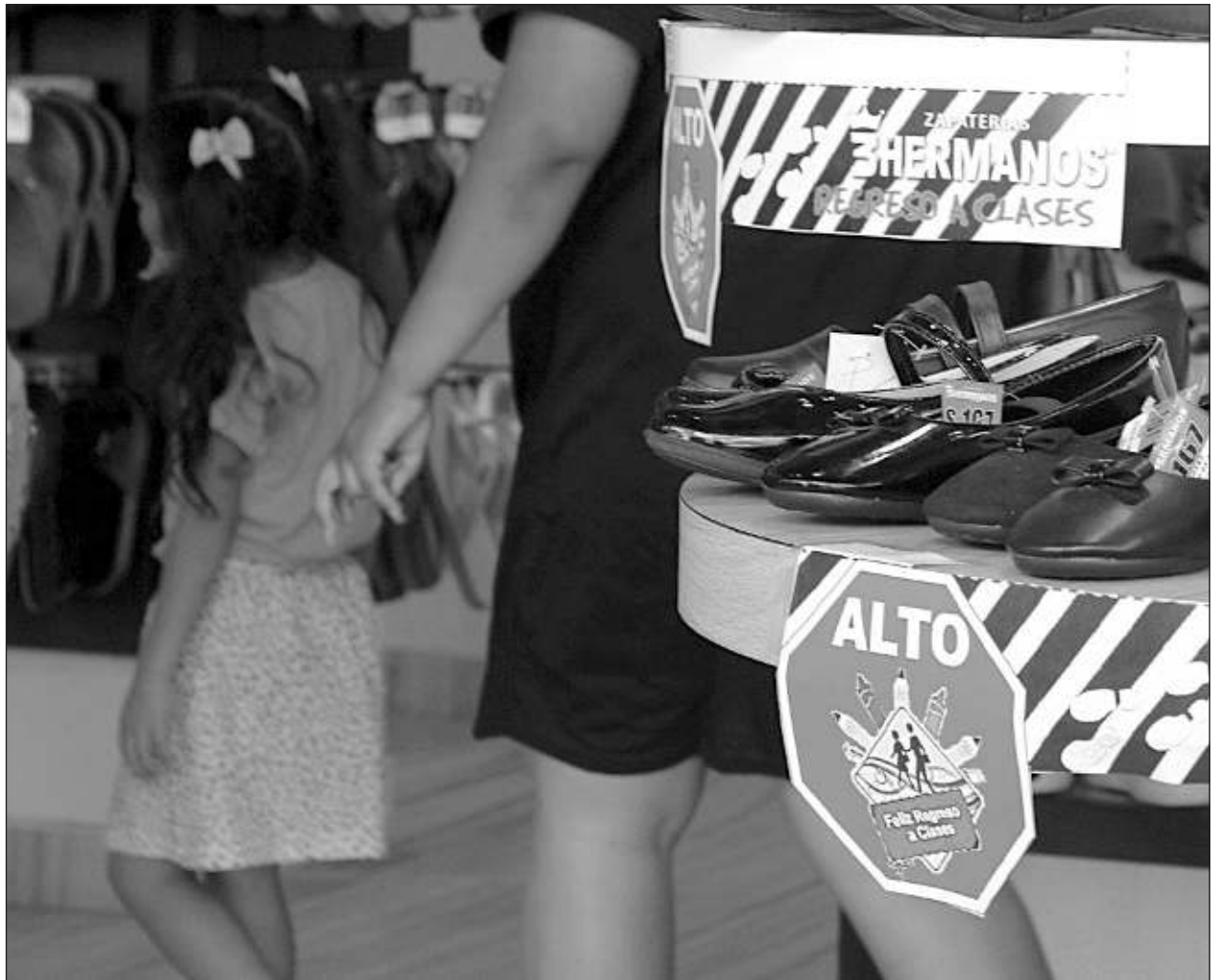
▲ La previsión de la Canaco Carmen es que conforme las empresas vayan cumpliendo con el pago de aguinaldos irá aumentando la liquidez en la Isla, lo que se traducirá en una mayor derrama económica durante el mes de diciembre.

“Hoy muchas personas e inversionistas han volteado a ver hacia Isla Aguada, como con una visión positiva de negocios, considerando su potencial turístico y las oportunidades de desarrollo con que se cuenta, lo cual ha dado como resultado, resultado favorable para la economía de la población”.