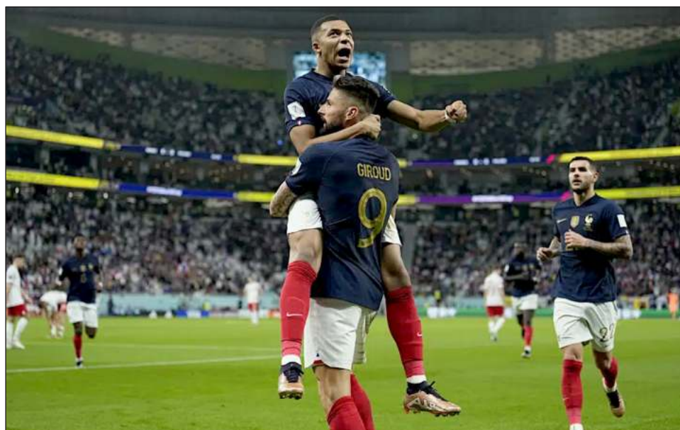
▲ Giroud (9) y Mbappé guiaron a Francia a un cómodo triunfo ante Polonia.

Polonia maquilló el resultado con un penal ejecutado