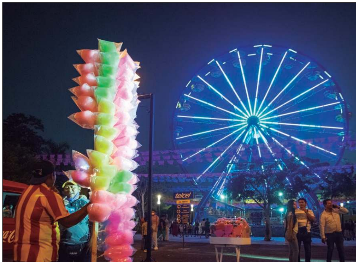
▲ "La opción Xmatkuil no solo trae diversión al sur, sino flujo de servicios y derrama económica. Pero ello no es casual, se trata de un ejercicio bien planificado, bien diseñado y con buena puesta en marcha".

EL PASADO 15 de octubre el escenario Xmatkuil volvió a lo grande con la presentación del grupo icónico de Rock Guns N' Roses. El concierto fue considerado por la prensa especializada como "el concierto de la gira", por encima de escenarios como la CDMX, Guadalajara y Monterrey, remarcando dos aspectos: 1) el ambiente generado por el