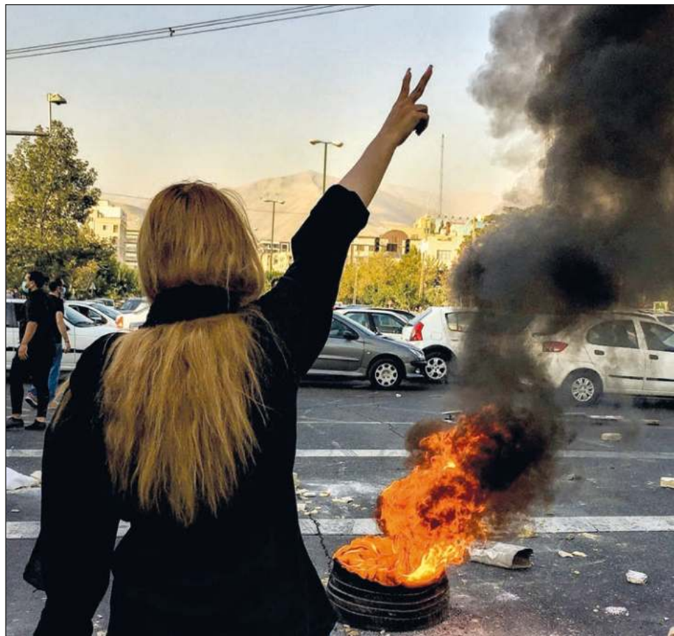
▲ Desde septiembre se ha reportado un descenso en el número de agentes de la policía de la moral en todas las ciudades y un aumento de las mujeres en público sin velo.

Montazeri, el fiscal general, no dio más detalles sobre el futuro de la policía de la moral ni sobre si su cierre era permanente y a nivel nacional. Sin embargo, agregó que el poder judicial iraní "seguirá vigilando".