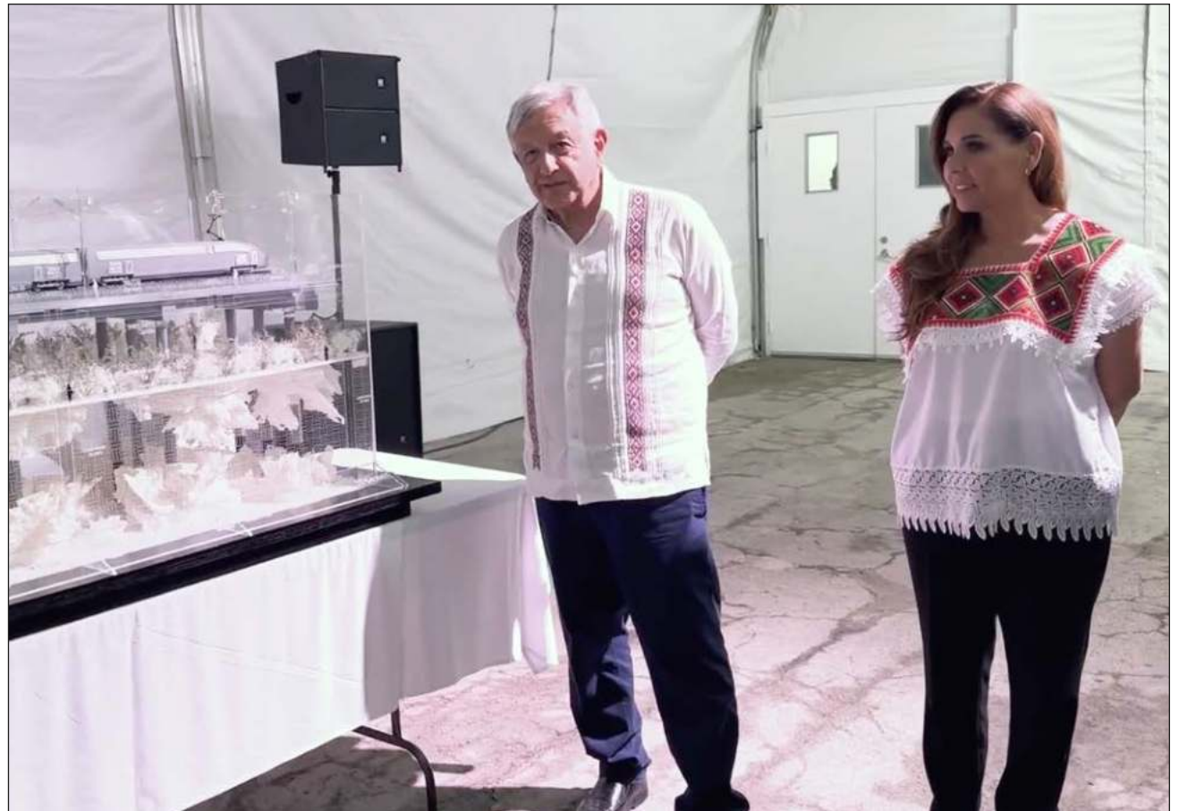
▲ Andrés Manuel López Obrador y la gobernadora de Quintana Roo, Mara Lezama, supervisaron los avances del Tren Maya, así como del Aeropuerto Internacional Felipe Carrillo Puerto y el Parque del Jaguar de Tulum.

Durante la reunión en Tulum el presidente conoció la maqueta y escuchó de parte de los ingenieros militares la solución que se aplicará en este tramo, que "es único porque tiene cavernas, ríos subterráneos y el propósito es no causar daño a la naturaleza", señaló López Obrador,