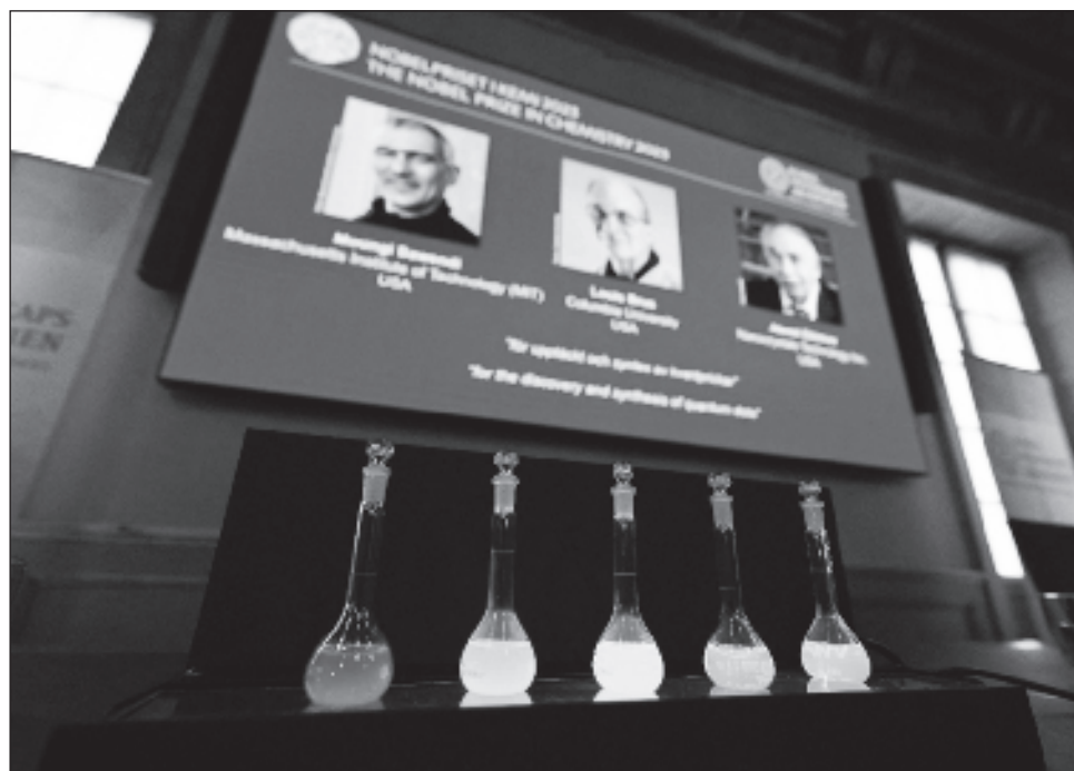
▲ Los puntos cuánticos son unos nanocristales de semiconductores, de entre 2 y 10 nanómetros de diámetro. Un nanómetro es una milmillonésima parte de un metro.

damente lo ocurrido. Lo importante es que eso no afectó en nada la atribución de los premios", agregó.