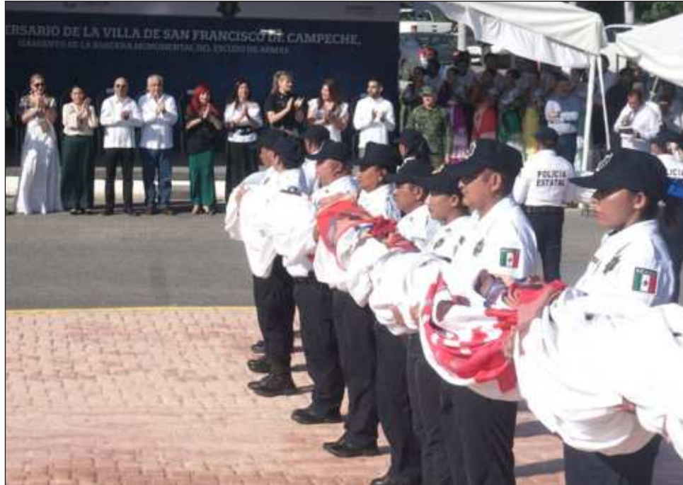
▲ La gobernadora Layda Sansores encabezó la ceremonia de conmemoración del 483 aniversario en un evento celebrado al pie del asta bandera monumental en la avenida Costera donde se izó el pabellón con el Escudo de Armas del Estado.

Por cuestiones de logística, ya no caminaron por el Circuito Baluartes, por lo que agentes bloquearon los accesos laterales al interior del Centro Histórico para no entorpecer el gallo de aniversario, que finaliza-