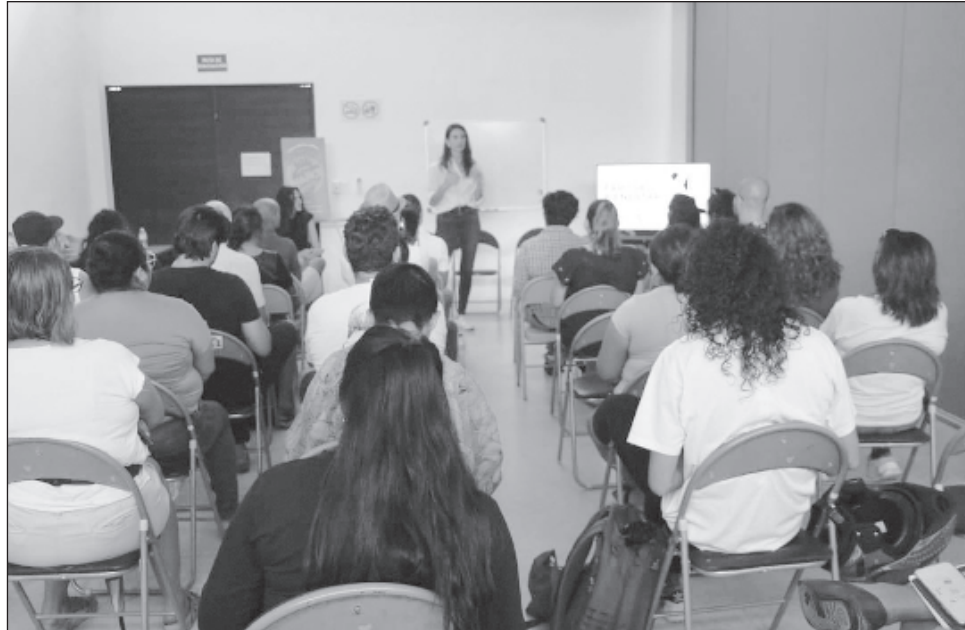
▲ Como parte del trabajo que se realiza en Villas Otoch, se lanzó una nueva convocatoria llamada FARO del Bienestar, una sesión de trabajo personal y on line , en la que ayudarán a expertos para que puedan aplicar impartir algún proyecto o taller.

En el caso de Chetumal, enfatizó, ya se trata de un hecho, se está únicamente en