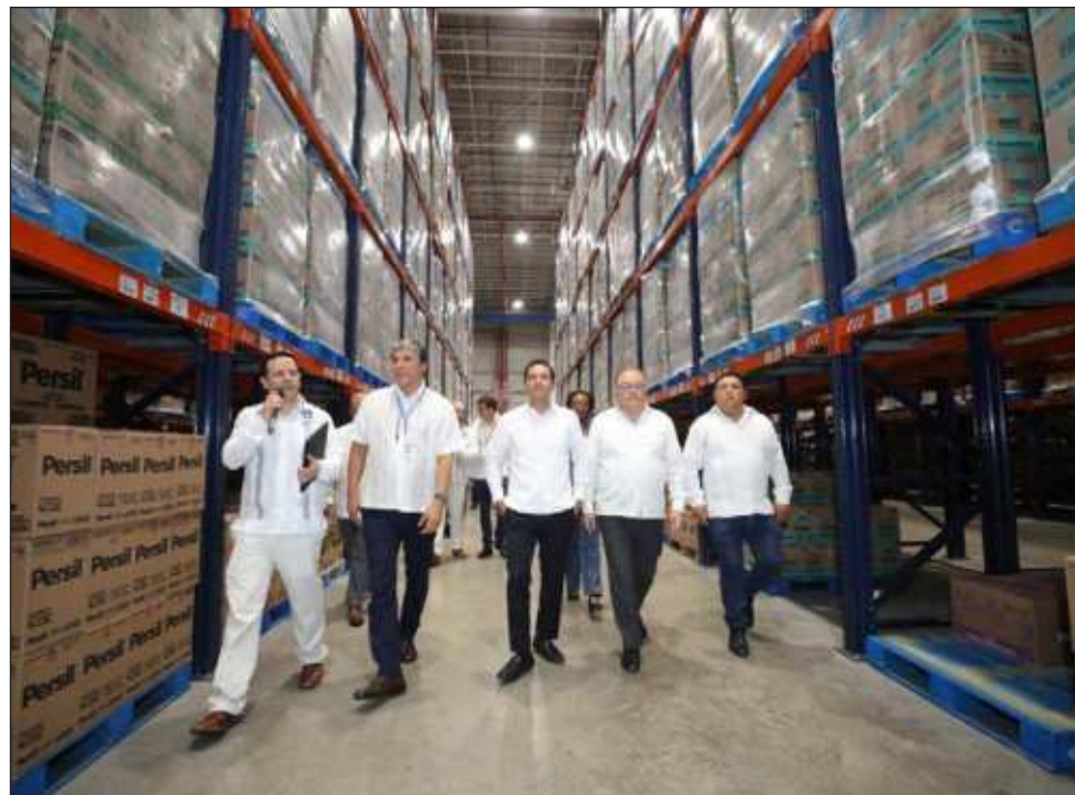
▲ Desde el Centro de Distribución de la firma, el gobernador Mauricio Vila afirmó que empresas como Walmart ofrecen certeza jurídica, seguridad y mano de obra bien calificada.