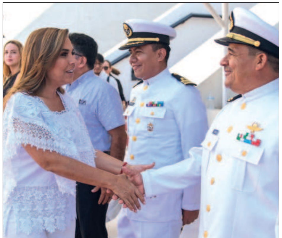
▲ La gobernadora destacó que Quintana Roo es una de las 17 entidades del país que posee litorales, y la presencia de los marinos proporciona seguridad a la población.

“Hoy más que nunca reconocemos la labor de nuestras y nuestros marinos y con su ejemplo, refrendamos el compromiso conjunto por el que buscamos que México y Quintana Roo sean, tanto en tierra como en mar, la esperanza de un mejor porvenir para nuestras futuras generaciones”, afirmó Mara Lezama.