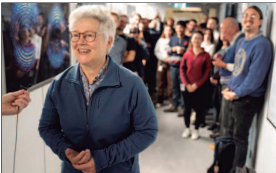
▲ “Este premio significa mucho. Es el más prestigioso y estoy muy feliz de recibirlo. Es increíble”, afirmó la profesora, quien no dejó de dar clases al escuchar la noticia.

Ferenc Krausz (Hungría, 1962), director del Instituto Max Planck de Óptica Cuántica, al enterarse de la noticia, afirmó: “no estoy seguro de estar soñando o si es la realidad”.