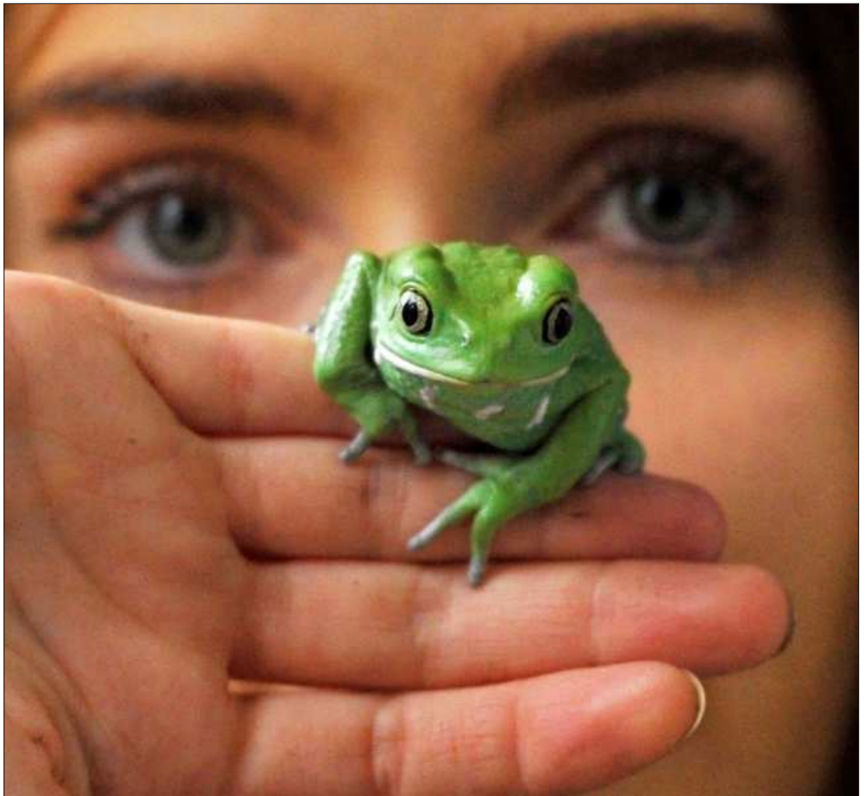
▲ K'a'amkach cháako'ob, búulkabilo'ob yéetel u ka'antal k'áak'náabe' je'el u k'askúuntik k'áax tu'ux kaja'an le ba'alche'obo'.

"Yaan k'iine' ya'abach ti' le k'eexilo'obo' jach séeba'an u yúuchulo'ob, le beetik ma' tu yantal mix u k'iinil u náata'al tumen le ba'alche'obo'", tu ya'alaj Kelsey Neam, máax táaka'an tu múuch'il Grupo de Especialistas en Anfibios de la Comisión para la Supervivencia de las Especies de Unión Internacional para la Conservación en la Naturaleza (IUCN).