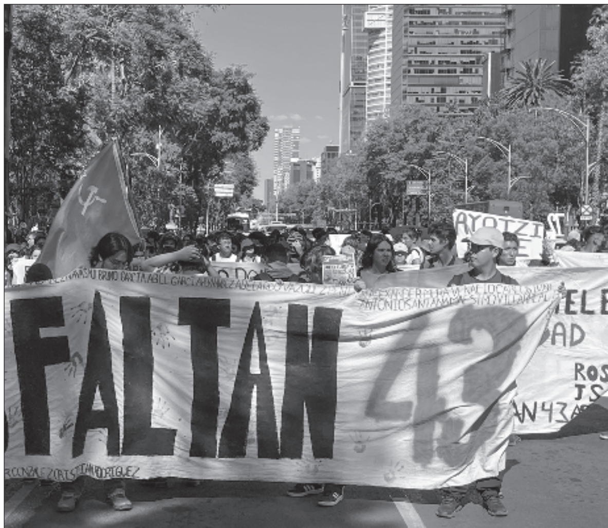
▲ “La recomposición narrativa (la nueva “verdad obradorista”) y la exoneración de los máximos mandos políticos y militares conllevan un intento de aplastamiento (...) de la estructura de defensores jurídicos”.

TAN CIERTO ES eso que no hay ninguna voz seria que les haya imputado el haber dado instrucción alguna al respecto en esas horas precisas. Pero, como en el caso de García Harfuch, los puntos claves están en el antes y el después: Peña Nieto y Cienfuegos son responsables de las condiciones de mafiosidad institucionalizada que estalló en Iguala una noche trágica y, sobre todo, junto con Jesús Murillo Karam, del armado criminal de la “verdad histórica” que puso todo el poder del Estado al servicio de una insostenible coartada.