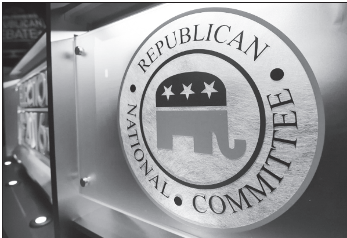
▲ "It will be difficult to dislodge the extreme right once it is in power. They weaken or destroy the very institutions that enhance democracy and limit the scope for any opposition to work effectively". Foto crédito

SIMILAR MOVES ARE taking place in other countries governed by IDU members.