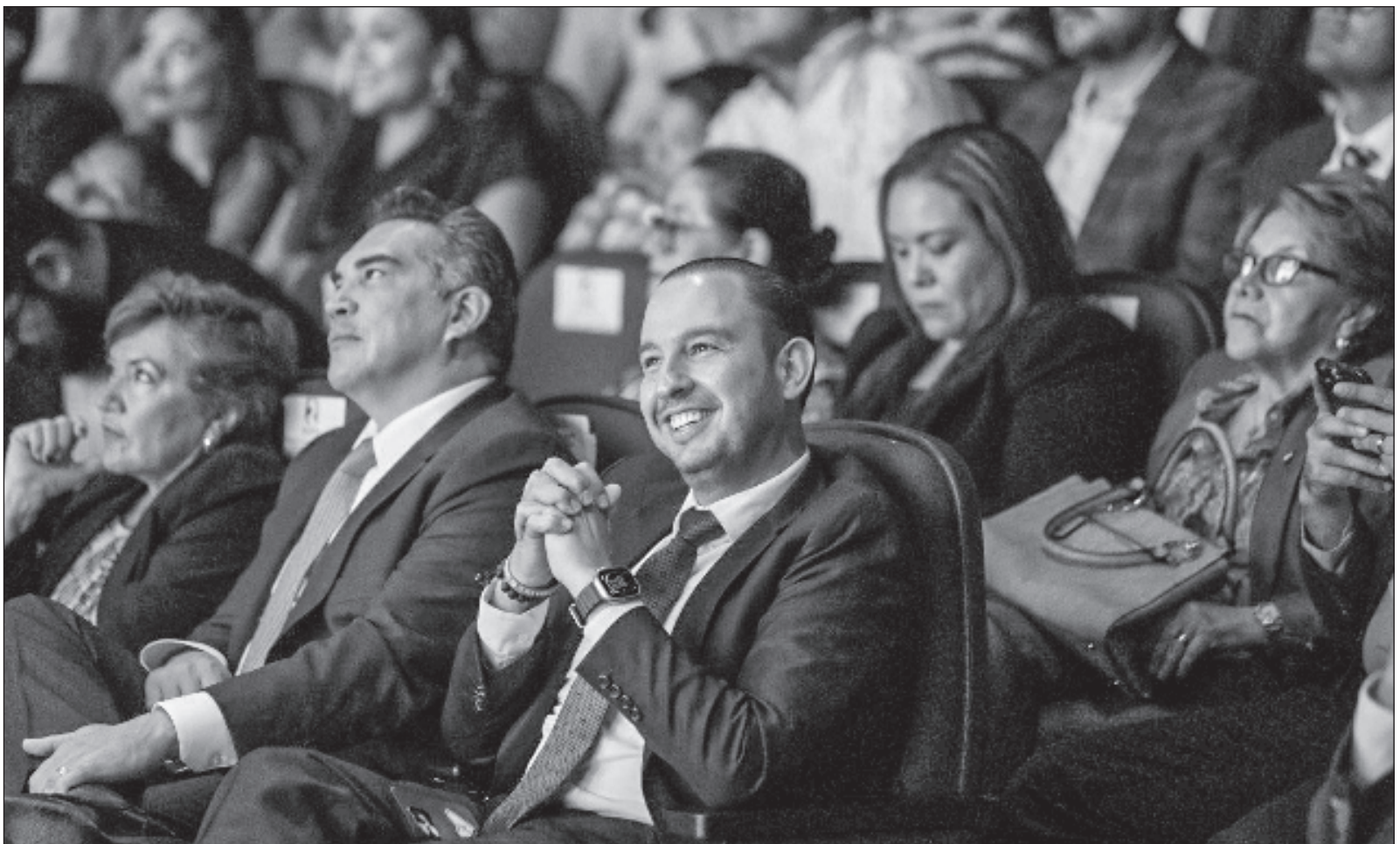
▲ "A pesar del odio expresado por la mayoría de los participantes del Consejo Nacional del PAN hacia el PRI prevaleció el interés acordado por las cúpulas de mantener la alianza que incluye también al 'izquierdista', y no menos odiado por militantes panistas, PRD".