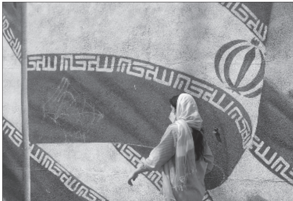
▲ Activistas dijeron que las fuerzas de seguridad habían prohibido a los padres de Geravand publicar su foto en redes sociales o hablar con grupos de derechos humanos.

Si bien las autoridades han negado las afirmaciones de los grupos de derechos humanos de que Geravand entró en coma el domingo después de un enfrentamiento con agentes que hacían cumplir el código de vestimenta islámico, el grupo de derechos humanos iraní-kurdo Hengaw publicó su fotografía inconsciente en un hospital de Teherán donde fue llevada después del incidente.