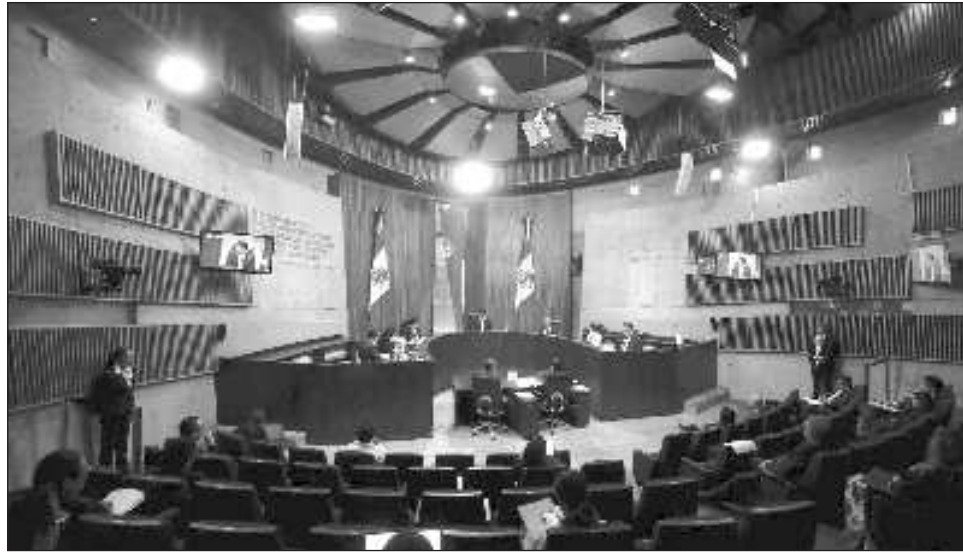
▲ El 20 de julio, el Consejo General del INE aprobó por unanimidad ejercer su facultad de atracción para determinar fechas homologadas en la conclusión de los periodos de precampañas.