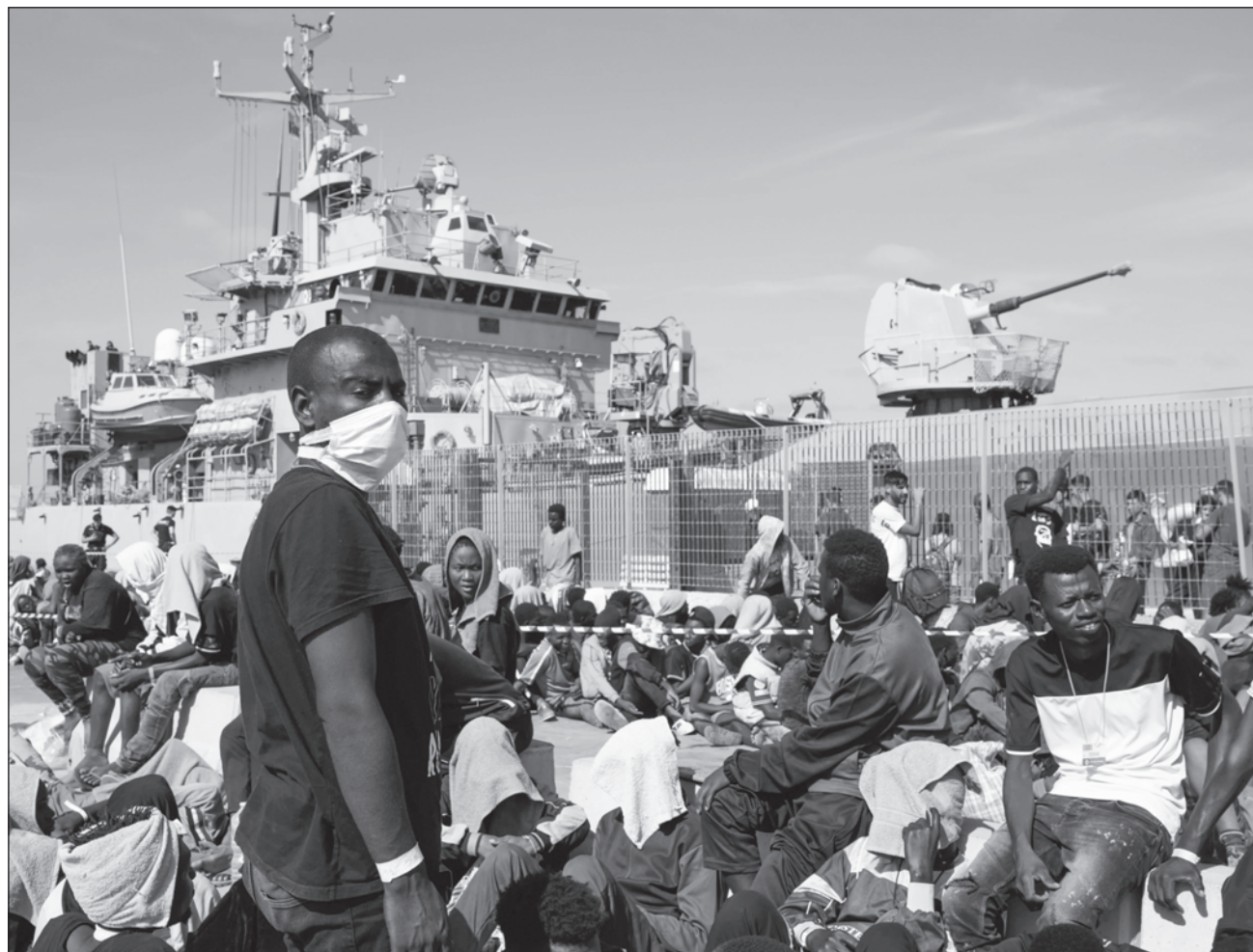
▲ Esta reforma del pacto migratorio incluye una propuesta para extender el período de detención de los migrantes irregulares.

El acuerdo alcanzado en Bruselas deberá ser negociado con los legisladores del Parlamento Europeo