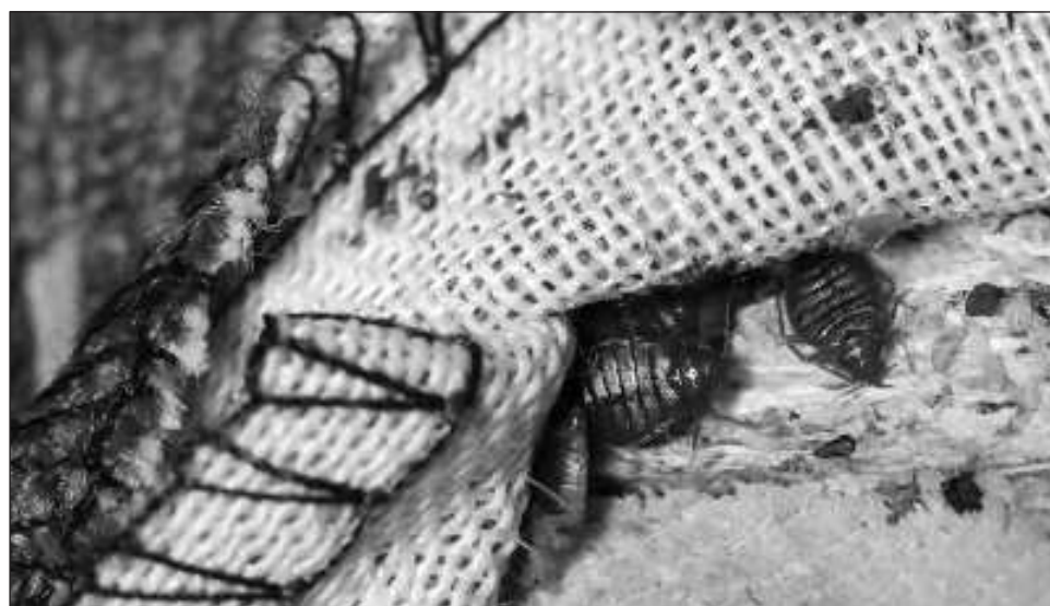
▲ Este insecto, que se alimenta de sangre humana, desapareció casi por completo de la vida cotidiana en los años 1950, pero resurgió en las últimas décadas por los cambios en el modo de vida.

En Francia, las chinches protagonizan desde hace días videos virales en las redes sociales que denuncian