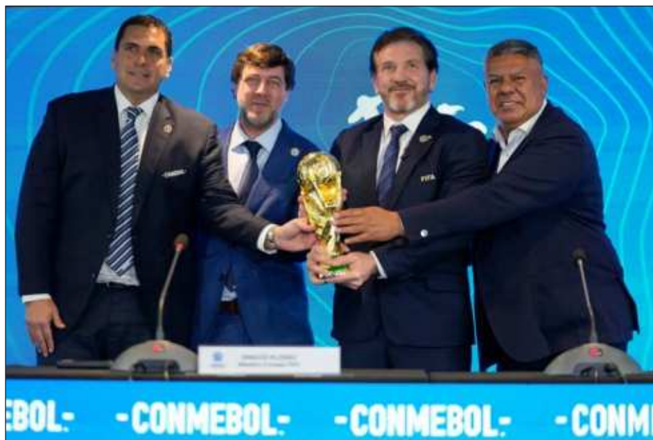
▲ En 2030 el balón rodará primero en Uruguay, país sede del primer torneo de fútbol del orbe en 1930; también se llevarán a cabo inauguraciones consecutivas en Argentina y Paraguay.

Así las cosas, en 2030 el balón rodará primero en Uruguay, país sede del primer torneo de fútbol del orbe en 1930; también se llevarán a cabo inauguraciones