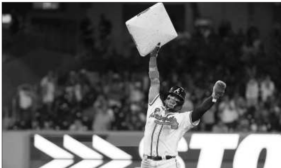
▲ Acuña, de los Bravos de Atlanta, sostiene la almohadilla en lo alto después de un robo de base en contra de los Cachorros de Chicago durante la 10ma entrada del juego de béisbo.

Los fanáticos que suelen poner atención al béisbol sólo en la posttemporada se toparán con un deporte distinto. Los jugadores están corriendo mucho más que hace un año gracias a las nuevas reglas que también prometen tener un impacto en los playoffs. Hubo 3 mil 503 bases robadas en la temporada regular, un incremento dramático de más