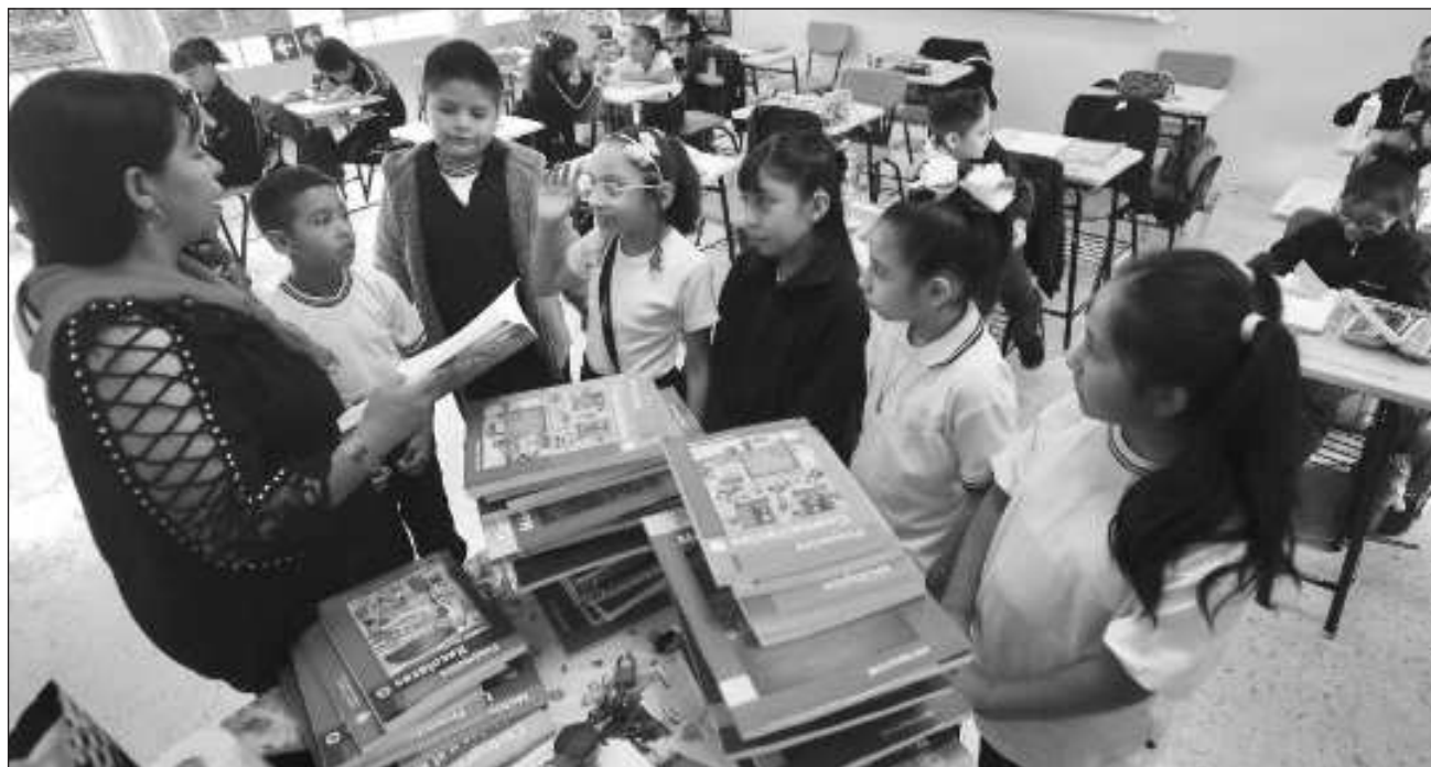
▲ La primera sala de la SCJN detalló que la demanda promovida no aduce en ninguna forma violaciones a la Constitución.

En el proyecto en el cual se analizó el recurso de queja presentado por la Consejería Jurídica del Poder Ejecutivo en contra de la controversia constitucional presentada