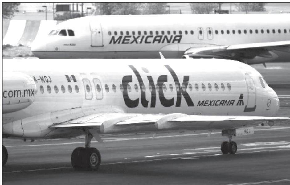
▲ Además de la fecha programada para su despegue, el presidente Andrés Manuel López Obrador no dio más detalles sobre la nueva aerolínea militar.

En este marco, comentó que ya se va la secretaria de Energía Rocío Nahle quien, en su concepto, es una "extraordinaria servidora pública" pues según logró la "hazaña" de construir una refinería en cinco años que permitirá refinar 340 mil barriles diarios. "Ella se encargó, tiene todo nuestro apoyo, no nos vamos a meter en la parte electoral. Si van otros, a todos los respetamos, los consideramos buenos, pero en el caso especial de Rocío deja produciendo esta nueva refinería." Mencionó que la