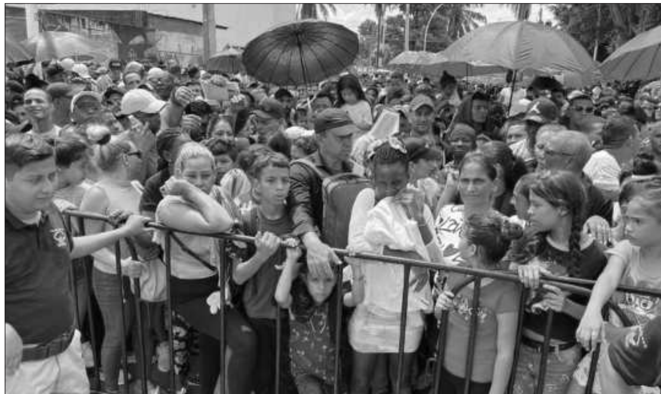
▲ Los récords de peticiones de asilo reflejan el “aumento sin precedentes de personas migrantes en Centroamérica y México”, como advirtió la OIM la semana pasada; la saturación es palpable en Tapachula, en el límite sur de México.

Le sigue Honduras, con 31 mil 055 peticionarios,