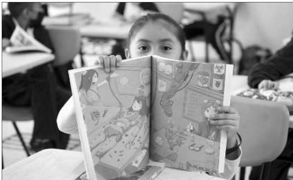
▲ En principio está la decisión de la primera sala de la SCJN, de desechar el recurso de amparo del gobierno de Chihuahua mediante el cual se buscaba impedir la distribución de los libros de texto gratuitos.

En el contexto de enfrentamiento entre poderes, la decisión del juez y magistrados resulta controversial, por decir lo menos, aunque se demuestre que está apegada a derecho. Pero quienes pierden cuando una dependencia realiza mal su labor y los juzgadores no siguen la consigna porque incurrirían en un delito grave, somos quienes componemos la ciudadanía.