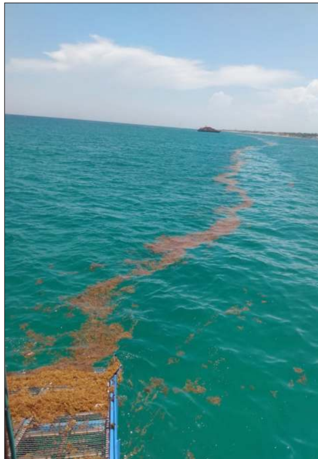
▲ El Instituto Oceanográfico del Golfo y Mar Caribe realizó una evaluación para cuantificar los recales que pudieran arribar a las playas del estado de Quintana Roo.

De esta manera, como resultado de un trabajo conjunto, la Semar, Semarnat, el gobierno del estado de Quintana Roo y sus municipios costeros reafirman su compromiso de implementar acciones de manera permanente que contribuyan a disminuir la arribazón de sargazo en las playas del Caribe mexicano, disponiendo de los recursos humanos, materiales y financieros necesarios en coordinación con los tres órdenes de gobierno, concesionarios y sociedad civil.