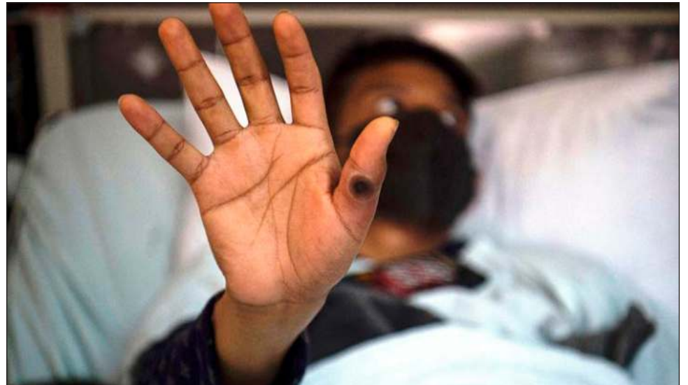
▲ La RepaVIH pidió asegurar el acceso a la prueba diagnóstica temprana para hombres gays y bisexuales y garantizar la confidencialidad, así como los apoyos necesarios.

El comunicado de Gaylatino también exige información transparente y oportuna sobre los pacientes infectados con la enfermedad