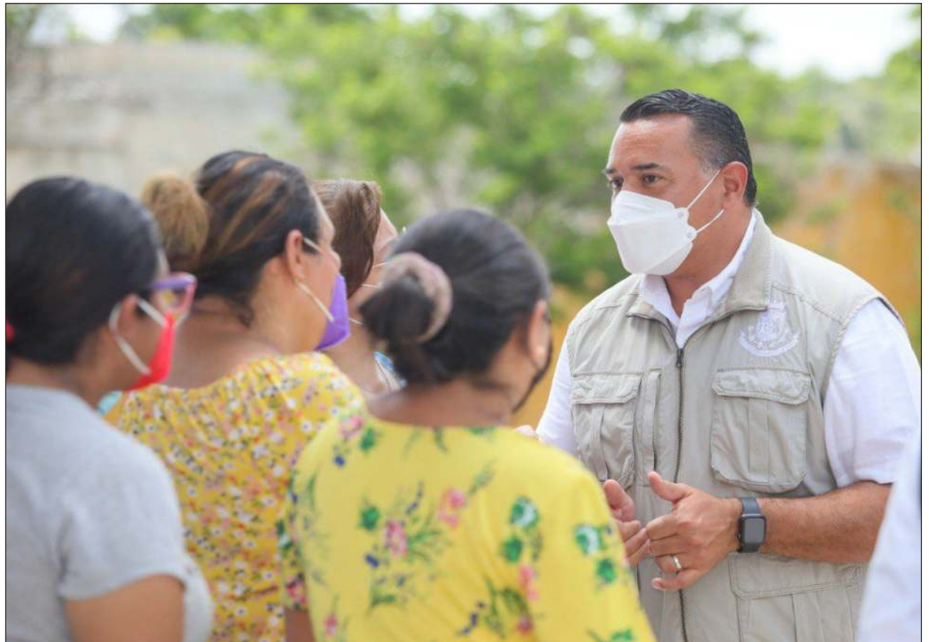
▲ El alcalde Renán Barrera Concha subrayó que el Instituto Municipal de la Mujer se sumó a la Feria Violeta del INAIIP Yucatán como parte de sus acciones para la prevención de la violencia contra las mujeres en entornos laborales.

En el marco de la Feria Violeta que organizó el INAIIP Yucatán, el presidente municipal informó que el Instituto Municipal de la Mujer (IMM) se sumó a esta actividad como parte de sus acciones para la prevención de la violencia contra las mujeres en entornos laborales.