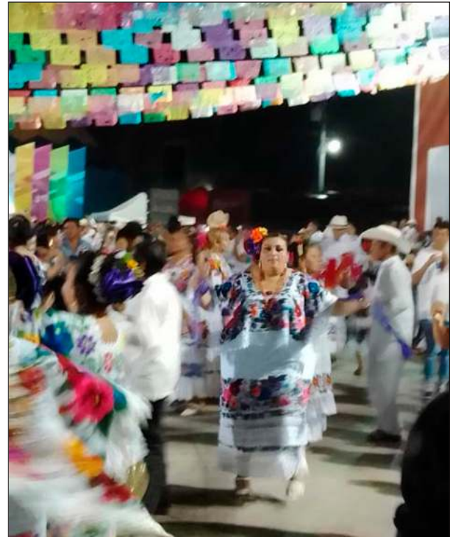
▲ Los bajos del palacio municipal recuerdan los versos de Aires del Mayab: "Vámonos a la jarana, vamos a ganar lugar, que hoy en la noche y mañana tenemos que zapatear"... Pero uno concluye que la canción está equivocada al decir "ponte tu terno bonito". Porque este atuendo, multicolor y sus finas puntadas, no puede ser menos que espectacular, y no se pone o se viste: se luce, y punto.