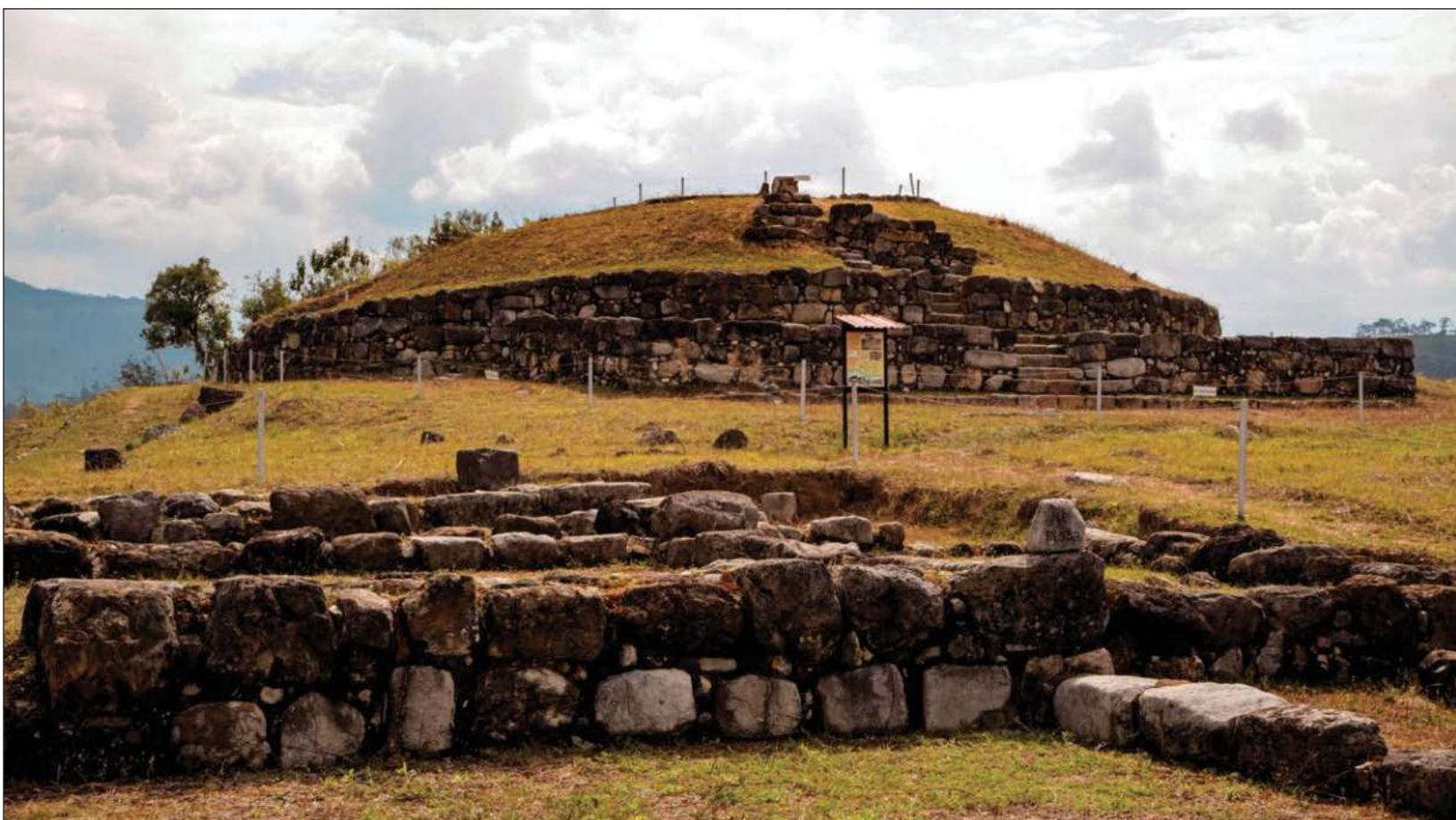
▲ Arqueólogos japoneses y peruanos descubrieron la tumba de un sacerdote de 3 mil años de antigüedad, junto a instrumentos musicales hechos de conchas marinas, en un sitio ceremonial del norte de Perú. Hallamos a uno de los primeros líderes del antiguo Perú de 3 mil años de antigüedad en el sitio arqueológico