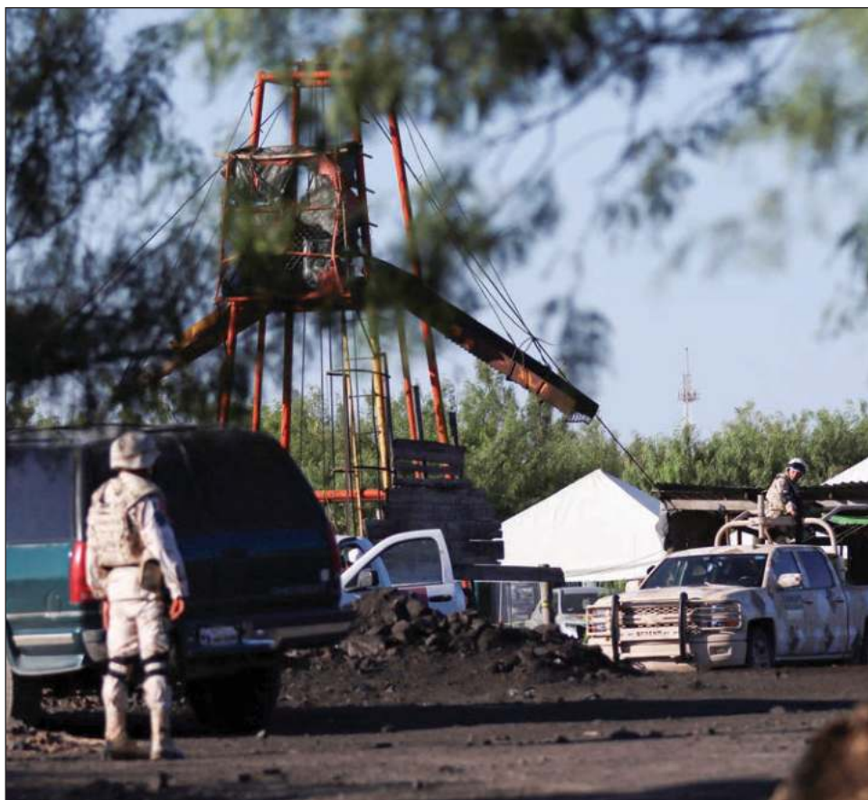
▲ Un derrumbe en la mina de El Pinabete dejó a 10 mineros atrapados.

El pasado 11 de agosto la fiscalía solicitó audiencia judicial por los hechos ocurridos en El Pinabete, a la cual se citó a Solís y sus dos coacusados, quienes no acudieron a comparecer ante el juez, por lo cual se solicitó al juez que librara las órdenes de aprehensión.