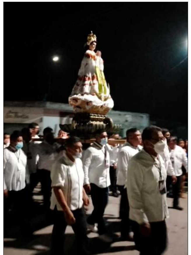
◀ El tronar de los voladores advierte, y las notas lastimeras del himno Oh, María se escuchan por las calles de Sucilá, Yucatán. Ya se acerca la procesión con la Virgen de la Natividad, cuya imagen encabeza la vaquería que da inicio a su fiesta tradicional, este 3 de septiembre. La festividad vuelve, después de dos años de no poder celebrarse. Este 2022 reunió a centenares de familias y visitantes.