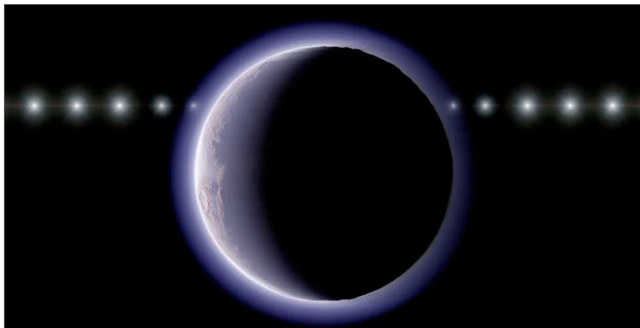
▲ El hallazgo ofrece una nueva perspectiva sobre los objetos más lejanos y fríos, en una región conocida como el Cinturón de Kuiper.

Con apenas unos 500 kilómetros (unas 300 millas) de diámetro, este mini Plutón es a todas luces el objeto más pequeño del Sistema Solar hasta ahora con una atmósfera claramente detectada y retenida por la grave-