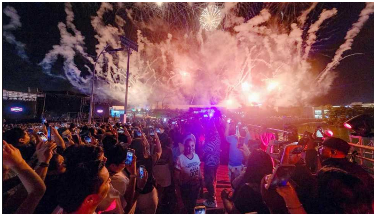
▲ La agrupación interpretó algunos de sus mayores éxitos como Cómo te atreves , Besos en guerra y No se va .

El disparo de salida de la contienda estuvo a cargo de la gobernadora