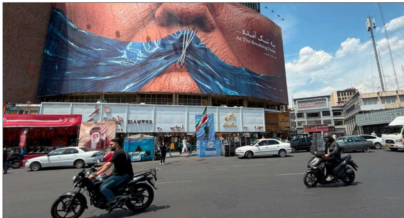
▲ Washington mantiene un bloqueo naval a los puertos iraníes desde el 8 de abril y escolta barcos de países que no están involucrados.

Pero el presidente estadounidense, Donald Trump,