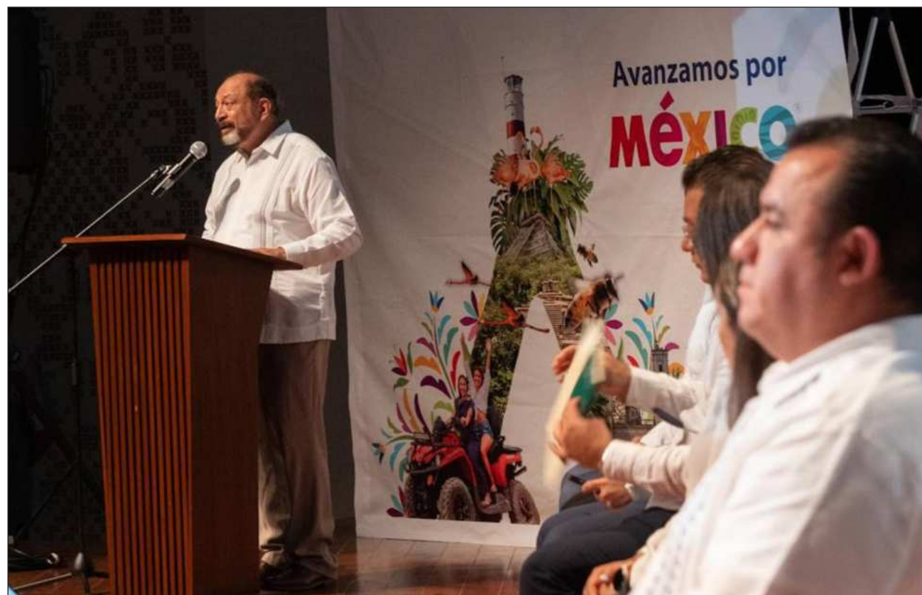
▲ La alianza Avanzamos por México entre Sectur y el banco BBVA busca mejorar la experiencia de los visitantes.

Ante prestadoras y prestadores de servicios turís-