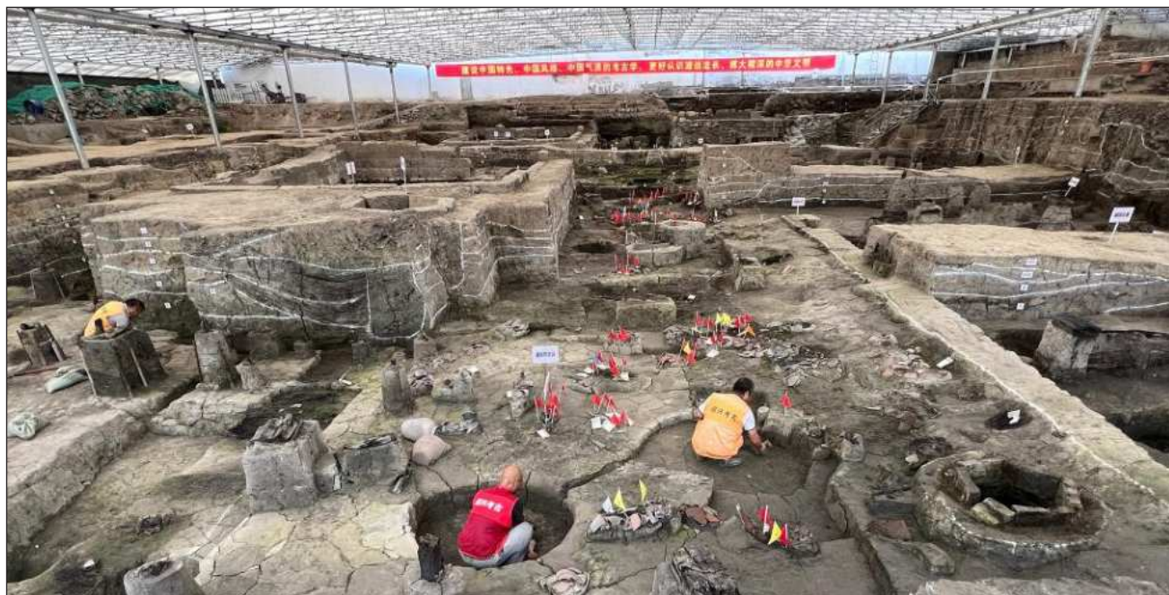
▲ El proyecto identificó más de mil nuevos yacimientos con restos de herramientas de piedra.

Destaca avances que ayudan a resolver cuestiones históricas de larga data, que van desde la actividad humana prehistórica y la urbanización neolítica hasta la política