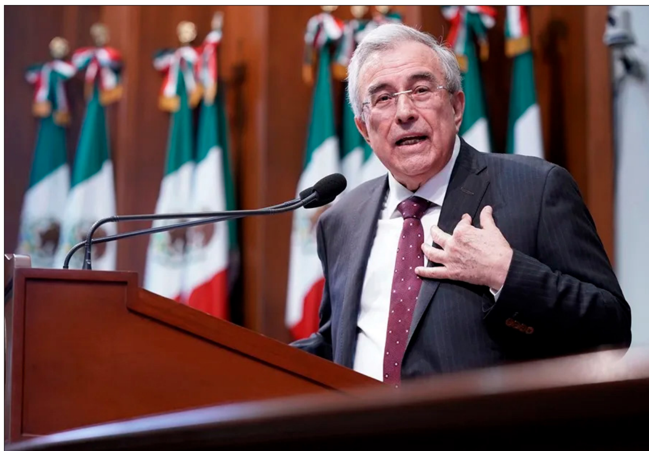
▲ "No tenemos ningún indicio ni dato de que pueda ser atacado (Rocha Moya) o de que tenga alguna amenaza", señaló Harfuch.

Cuestionado sobre si el gabinete de Seguridad tenía sospechas previas sobre el mandatario, respondió: "Por supuesto que no teníamos ningún indicio. Desde el inicio de la administración de la presidenta Claudia Sheinbaum Pardo hemos presentado resultados y detenciones, y nunca hemos tenido obstrucción por parte de funcionarios del gobierno estatal para realizar las operaciones".