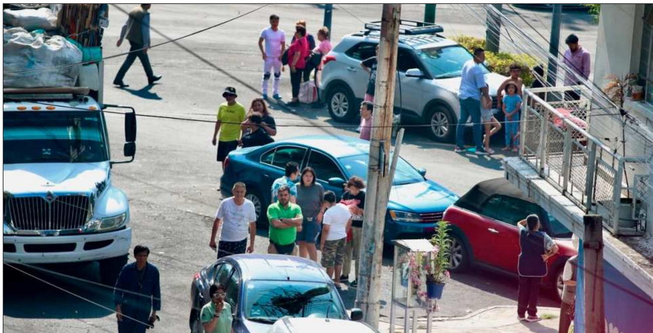
▲ La presidenta Claudia Sheinbaum Pardo informó a través de sus redes sociales que hasta ayer no se reportan daños materiales ni víctimas por el sismo de magnitud 5.6 con respecto epicentro cerca de Pinotepa Nacional.

“Tras el sismo de Magnitud 6 de esta mañana, activamos los protocolos de seguridad y atención. Seguimos trabajando en las 16 alcaldías para verificar condiciones y garantizar la seguridad de la ciudadanía”, escribió la jefa de Gobierno.