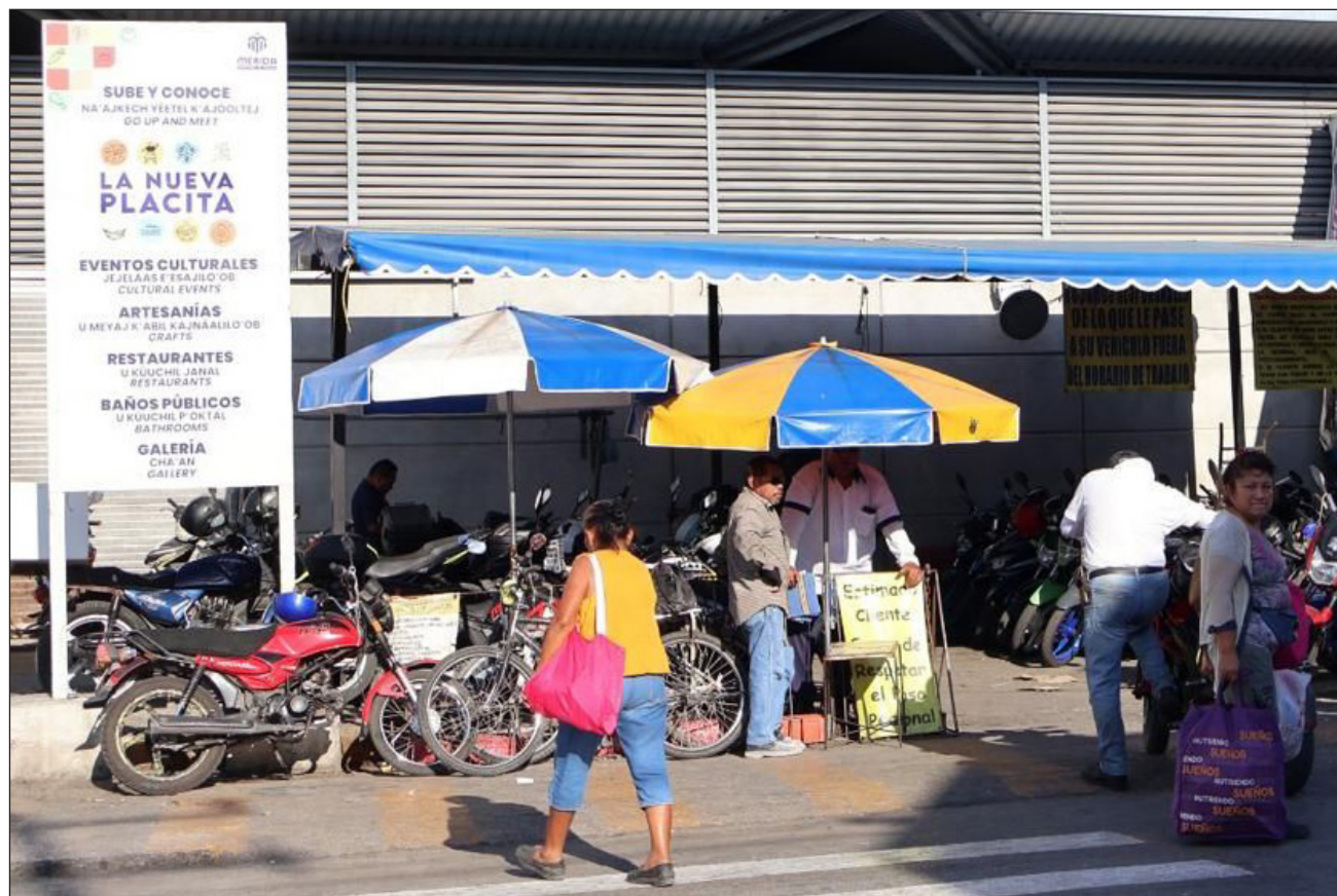
▲ En el proyecto participarán las empresas Novo Dordisk, Gel, la Universidad Modelo y Defensa.

Dijo que se realizará la recuperación de aceras, la colocación de malla sombra, depósitos de basura, jardineras