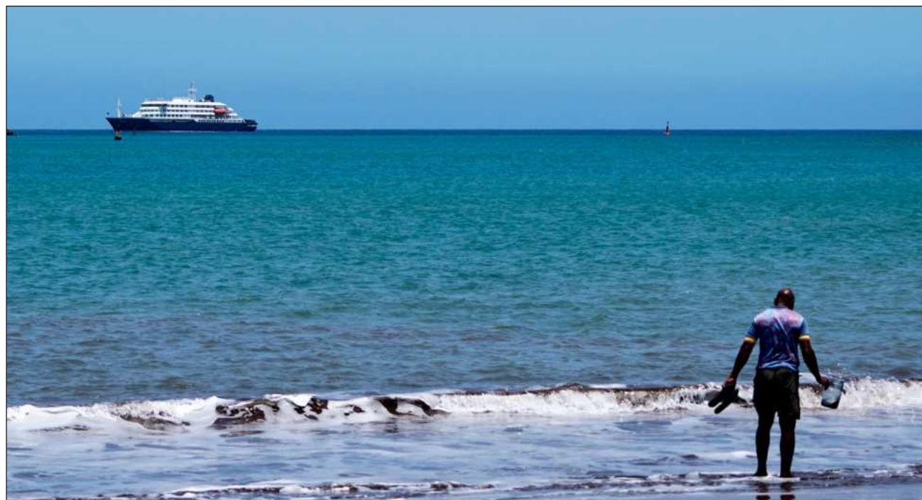
▲ La naviera examina la posibilidad de llevar a los pasajeros a las islas de Las Palmas y Tenerife, en Canarias, después de que las autoridades de Cabo Verde no accediera a la autorización para evacuarlos en su país.

“A bordo se están aplicando estrictas medidas de precaución, incluidas medidas de aislamiento,