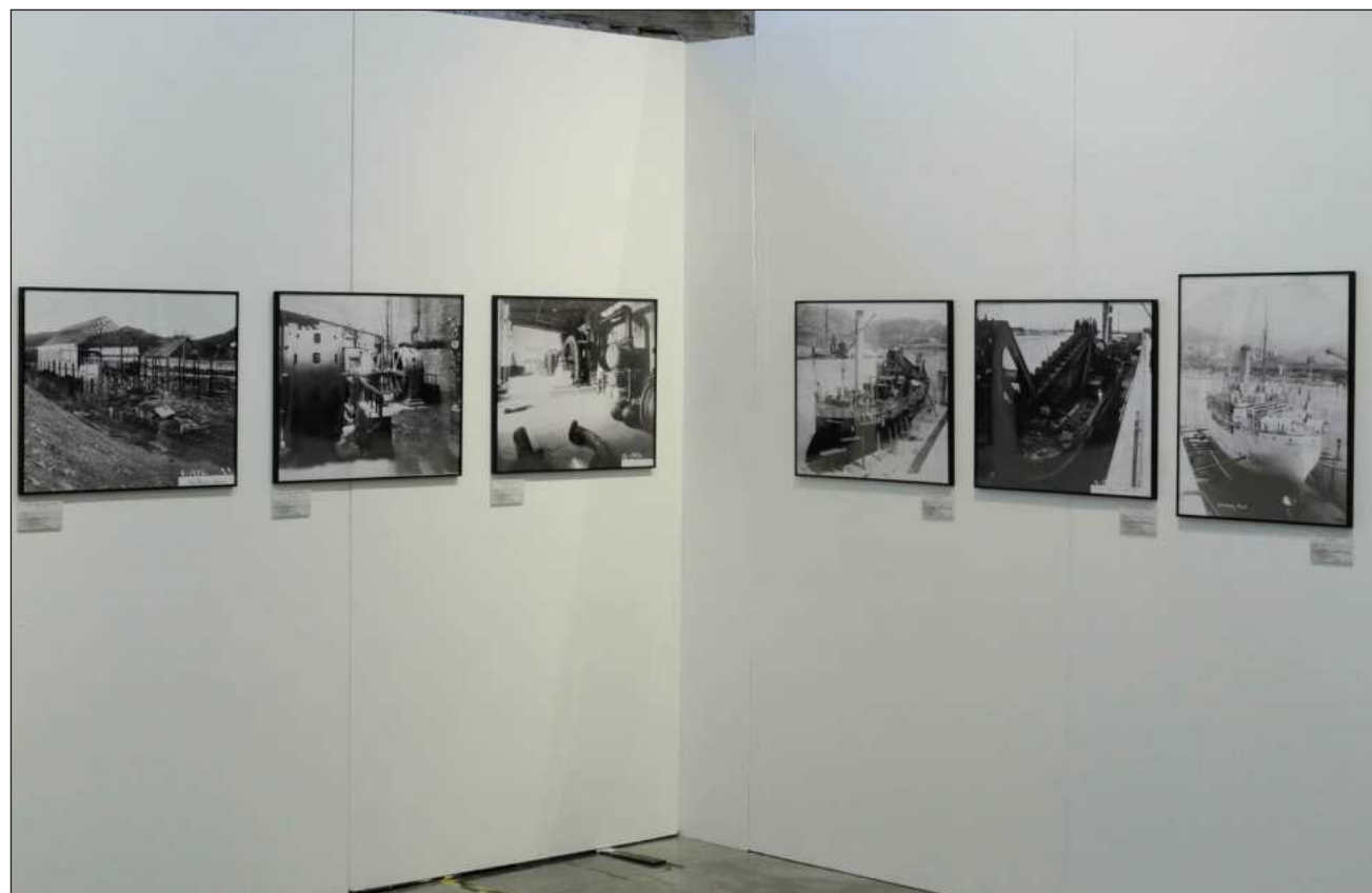
▲ La muestra estará abierta hasta el 30 de mayo en la antigua sede del Senado-Casona de Xicoténcatl con entrada libre.

En entrevista con La Jornada , el coleccionista comentó: "mi búsqueda empezó hace 22 años. Quería coleccionar e investigar imágenes sobre la industria