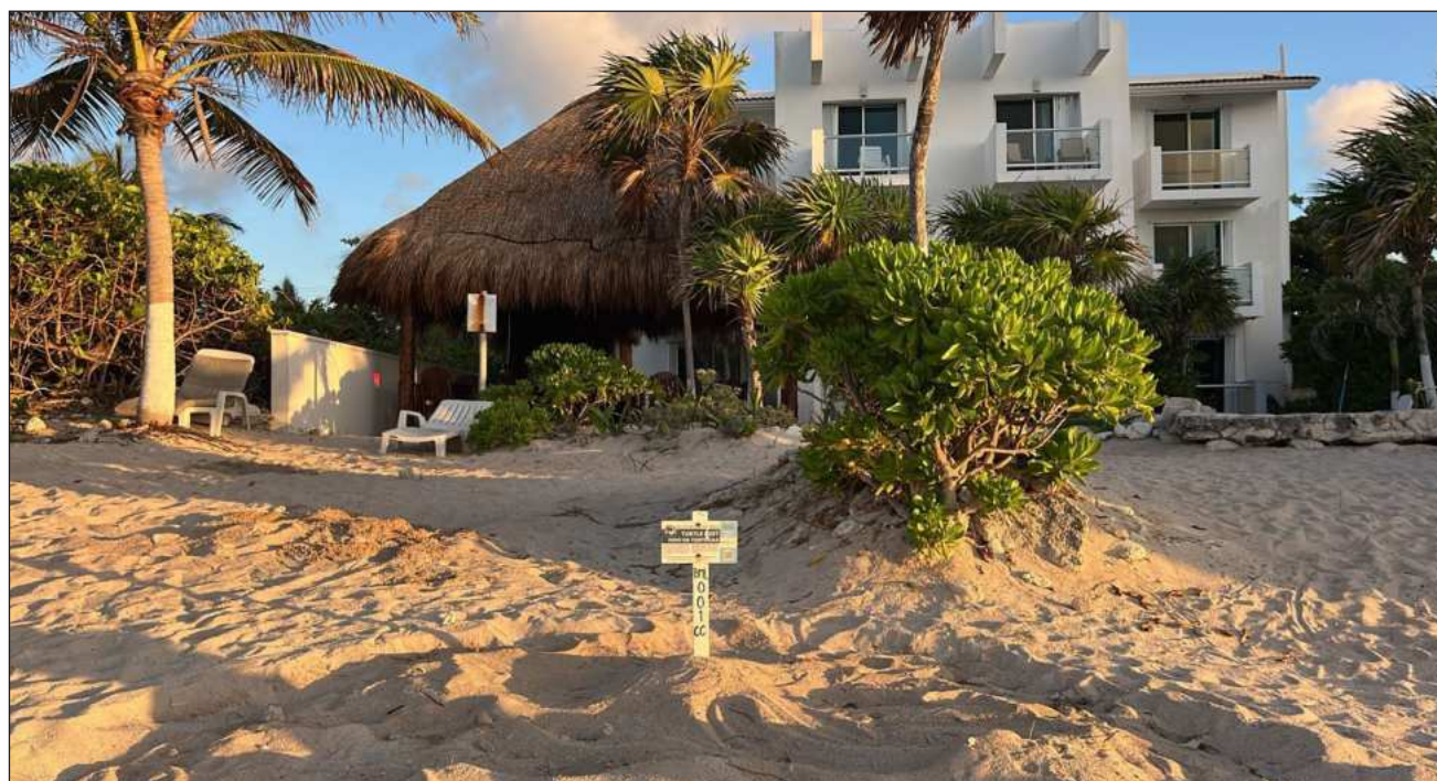
▲ Esperan que el presente ciclo mantenga una tendencia superior al año pasado, con 770 nidos.

El hallazgo es resultado del trabajo en programas de conservación