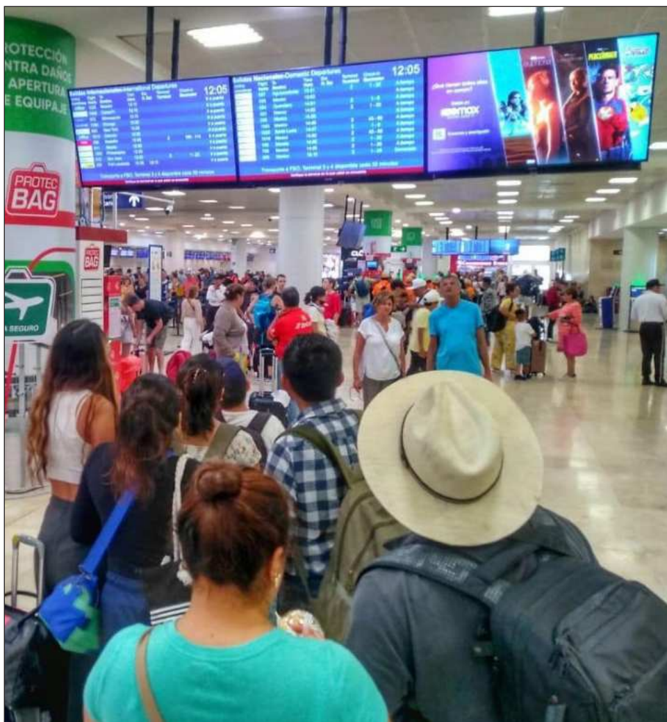
▲ La colaboración entre el sector público y privado busca proteger la reputación del Caribe Mexicano como un destino seguro y hospitalario, sostuvo el titular de Sedetur.

"Estamos convencidos de que vamos a seguir siendo uno de los destinos predilectos para nuestros mercados