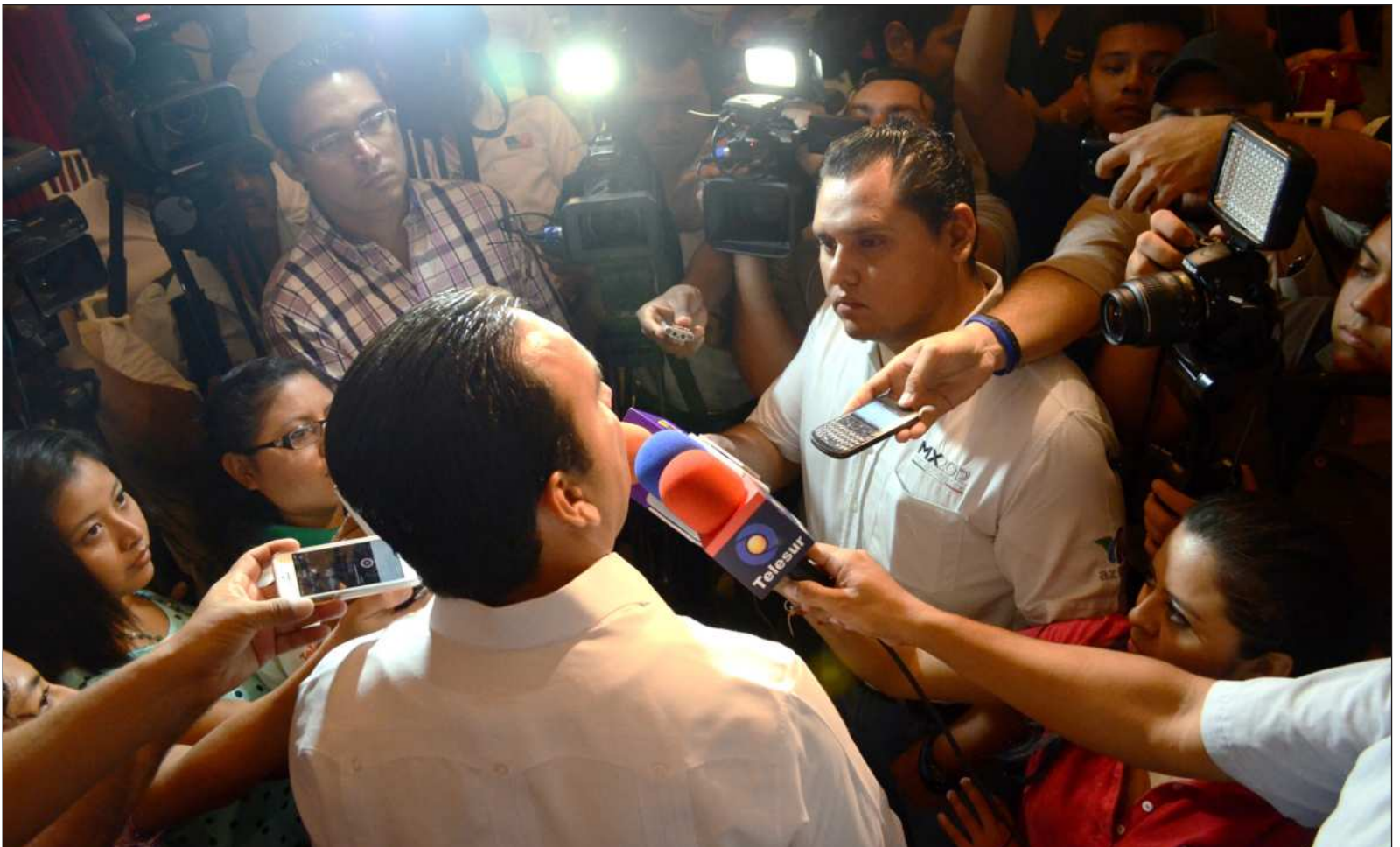
▲ “El periodismo es una actividad que debe hacerse en libertad. Y el Estado debe garantizar esa libertad”.