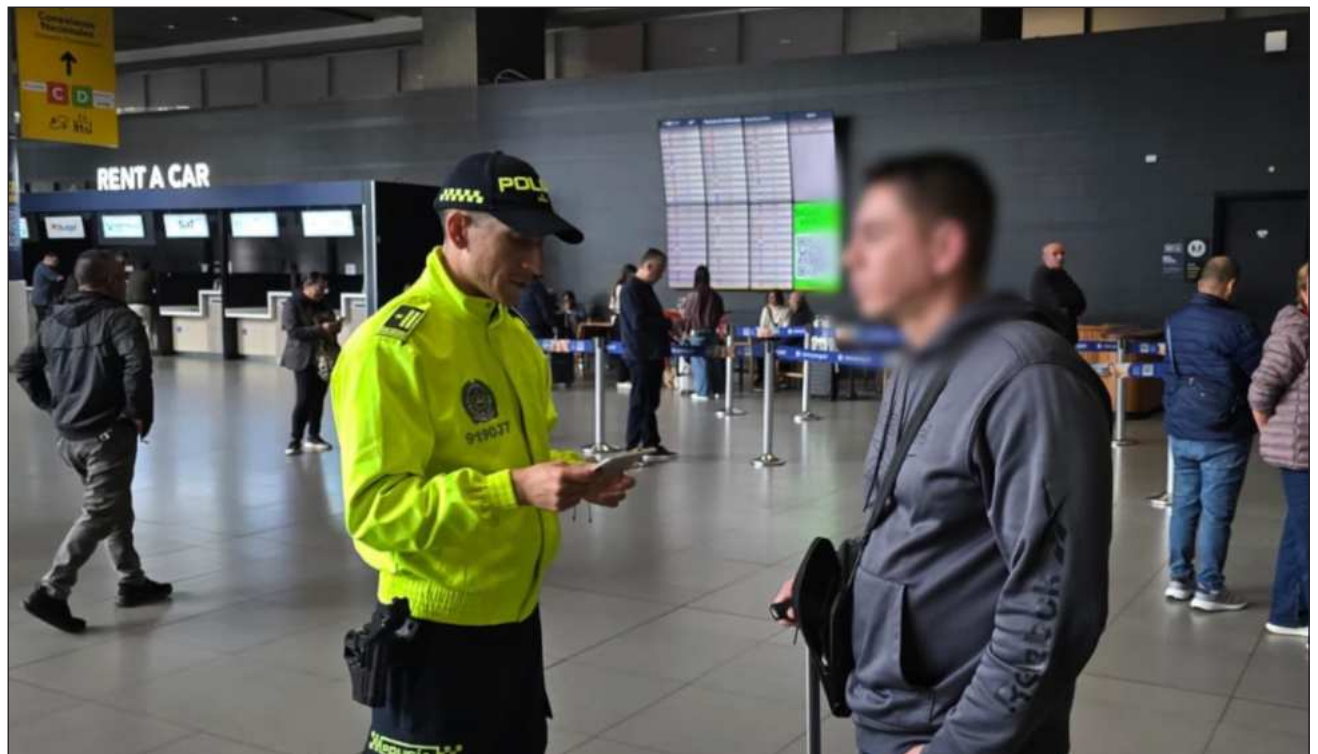
▲ De acuerdo con el comunicado de las autoridades colombianas, el ahora detenido facilitaba su expansión delictiva transnacional, robusteciendo las caminos y el tráfico de sustancias ilegales, específicamente el fentanilo.

“La @PoliciaColombia, en coordinación con @