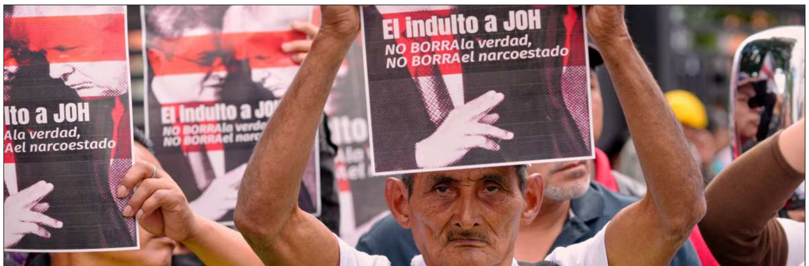
▲ "El implacable persecutor de narcos por todo el mundo, que ha destruido más de 23 embarcaciones en el Caribe y el Pacífico, asesinó a 177 personas venezolanas y depuso al presidente Nicolas Maduro, dejó en total libertad al peor narcotraficante hondureño de toda su historia".

En política no existen las coincidencias: el expediente en contra del gobernador Rocha Moya es la respuesta directa en contra de la caja de pandora que abrió el gobierno del estado de Chihuahua con su colaboración con la CIA. Y todo parece indicar que se trata del expediente que previamente anunció el narcotraficante JOH en sus charlas con NAZ, el ultraderechista presidente hondureño.