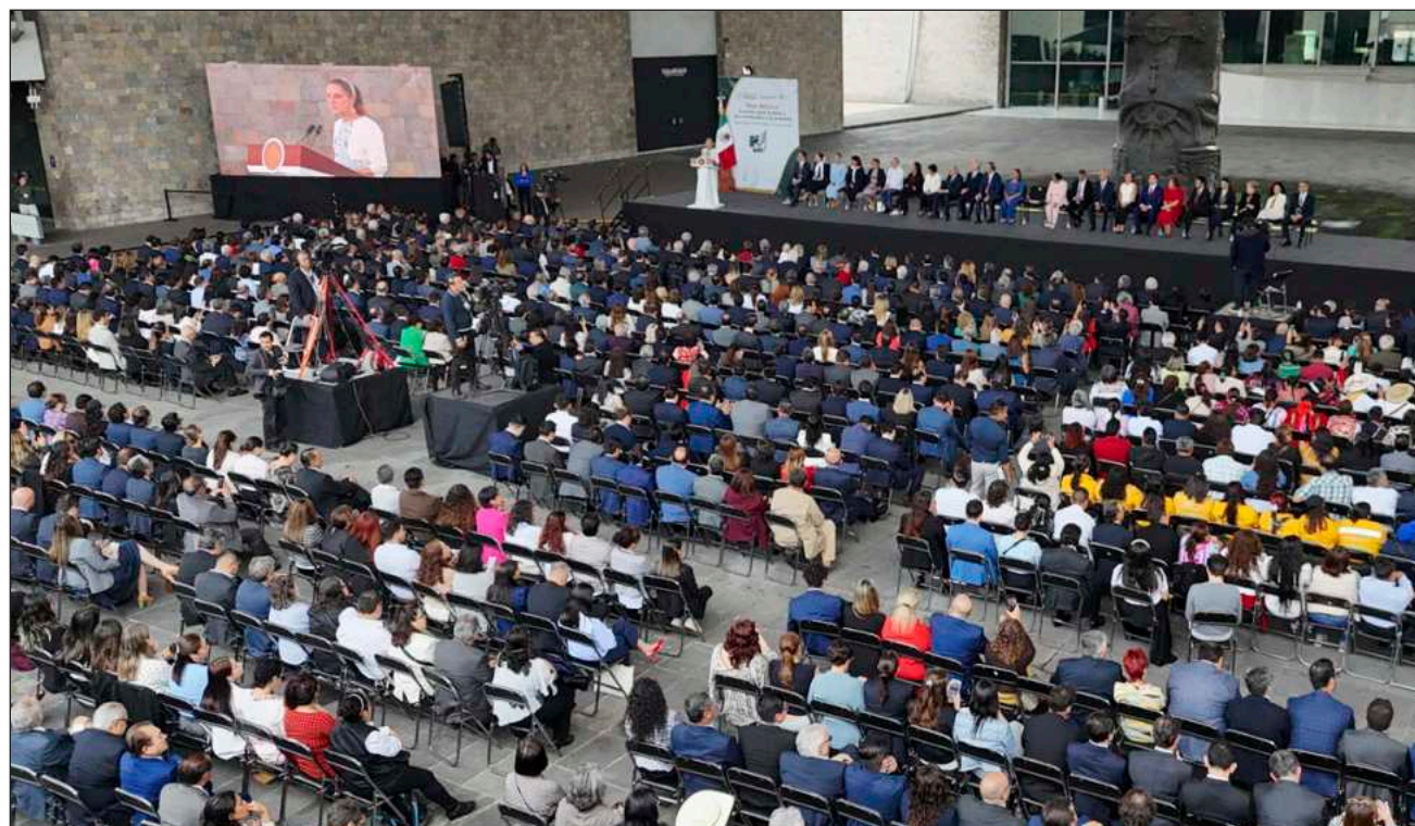
▲ “Estamos acelerando procesos, simplificando mecanismos y fortaleciendo la certeza jurídica”, anunció Sheinbaum.

Aprovechó para hacer un recordatorio: “todas y todos