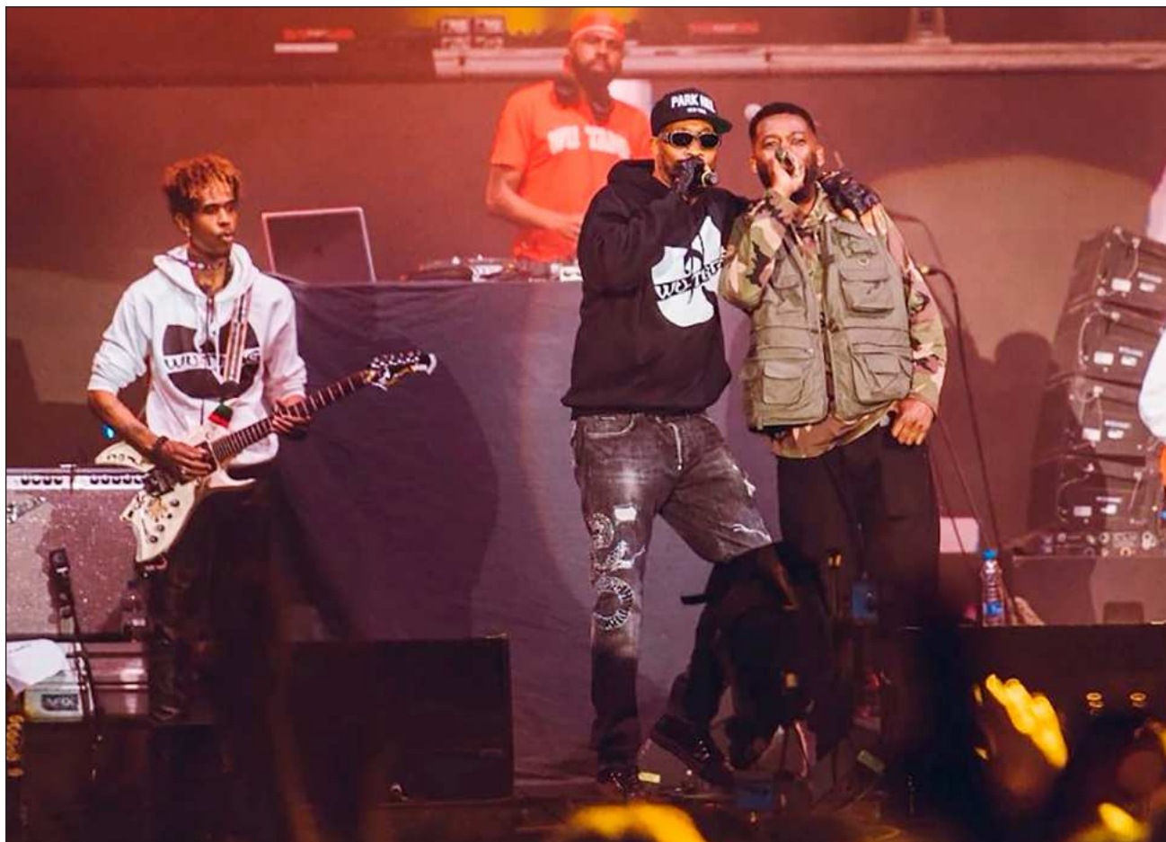
▲ Formados en 1992, los inspiró a dejar a su barrio en la historia, convocando a nueve de los mejores raperos.

Hay muchas obras más que prueban la calidad de los numerosos integrantes del clan, como Only Built 4 Cuban Linx (1995), de Raekwon, Supreme Clientele (2000), de Ghostface Killah y Tical , de Method Man (1994), cada uno con su estilo personal (años). Hasta un disco subastado en Sotheby's a un magnate maligno forman parte de la historia del grupo.