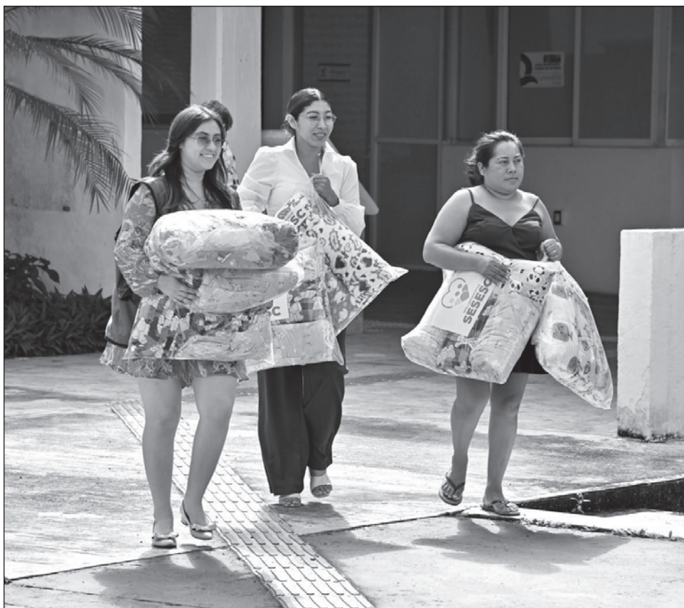
▲ Lo recaudado será distribuido en zonas que registran mayor prioridad, con especial atención a niñas, niños, personas mayores y personas con discapacidad.