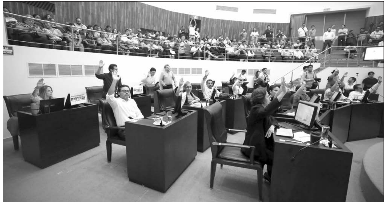
▲ Pese a los argumentos y protestas de la oposición, la mayoría de Morena y sus aliados lograron la aprobación de los paquetes fiscales, definiendo así el rumbo económico de Yucatán para 2026; ganó el juego del presupuesto pero perdió en el empréstito.