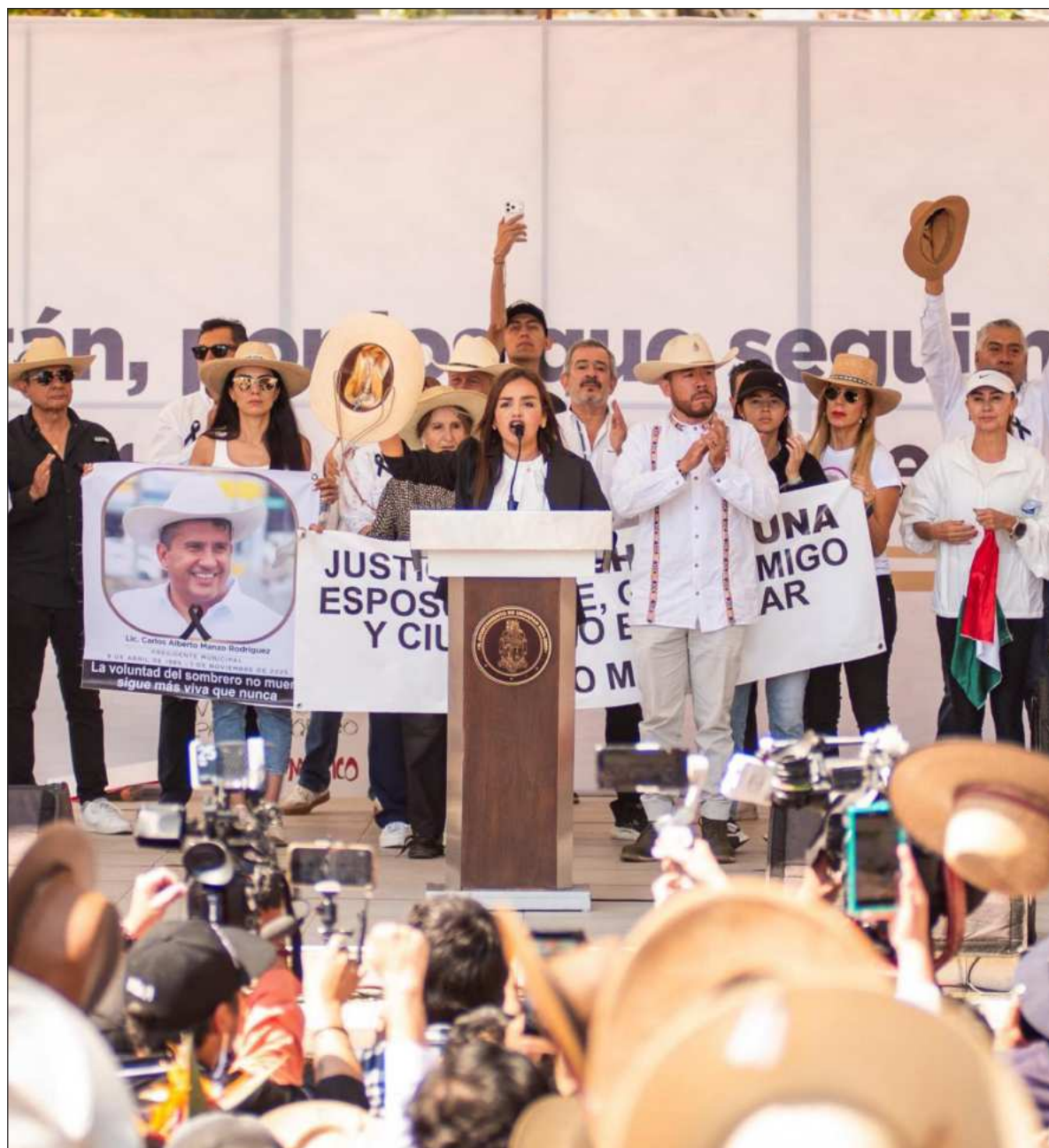
▲ “Es positivo que la viuda de Carlos Manzo haya solicitado el registro de la marca del nombre y del movimiento, para evitar que la oposición de ultra derecha, hartos quemados, la usen y contaminen”.

BASTÓ UN VIDEO de 43 minutos de duración, donde el ex presidente López Obrador presentó su libro Grandeza para desarticular la guerra sucia de la oposición, evidenciarlos, atemorizarlos y enloquecerlos de ira y de rabia. Así no le son útiles a los intereses norteamericanos que sirven. “Hay que apoyar mucho, mucho, mucho a la presidenta porque todavía es temporada de zopilotes y hay buitres y hay halcones”, apuntó Andrés Manuel López Obrador (AMLO) con dedicatoria especial. Dejó claro su respeto y apoyo irrestricto a la presidenta Sheinbaum, “la mejor presidenta