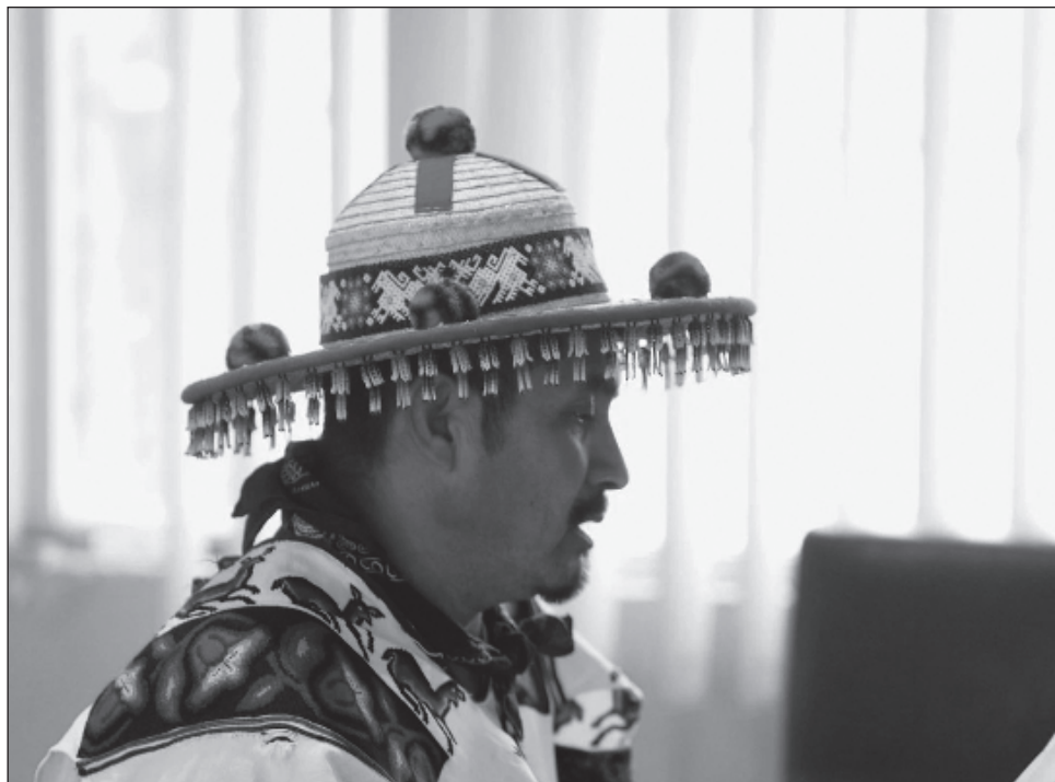
▲ El Consejo Regional exige, hoy más que nunca, que Wirikuta y los demás lugares sagrados vivan libres de amenazas, así como la cancelación de concesiones mineras.

La inscripción de la Ruta wixárika por los sitios sagrados a Wirikuta como Patrimonio mundial cultural y natural de la Unesco, el pasado 12 de julio, durante la 47 sesión del Comité del Patrimonio Mundial, es “una herramienta estratégica que fortalece la protección de Wirikuta y muchos otros lugares sagrados a lo largo de nuestras rutas ancestrales para evitar su deterioro y destrucción”, afirmaron integrantes del Consejo Regional Wixárika por la Defensa de Wirikuta.