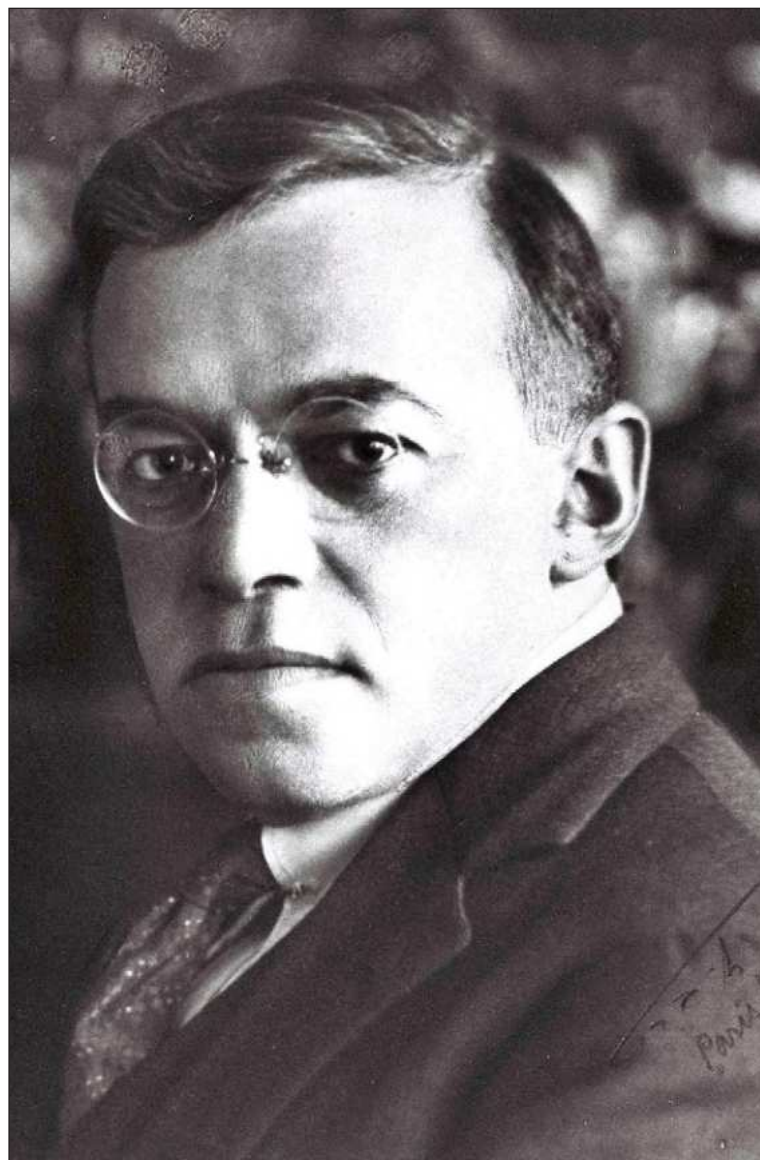
▲ "En 1925 Zeev anunció la creación de la Alianza de Sionistas Revisionistas, con sede en París, la cual se caracterizó como un movimiento de ultraderecha". En imagen Vladimir Jabotinsky.

Más tarde, la organización Betar en Palestina se convirtió en el grupo Irgún Zvai Leumi (Organización Militar Nacional), como brazo político-militar de los sionistas revisionistas y Zeev se erigió como su líder máximo en el exilio. Posteriormente los revisionistas del Irgún se dividen, formándose la organización terrorista Stern, conocida como el Gang Stern, cuyo dirigente máximo fue Abrahám Stern y, posteriormente, Yitzhak Shamir. Ambas organiza-