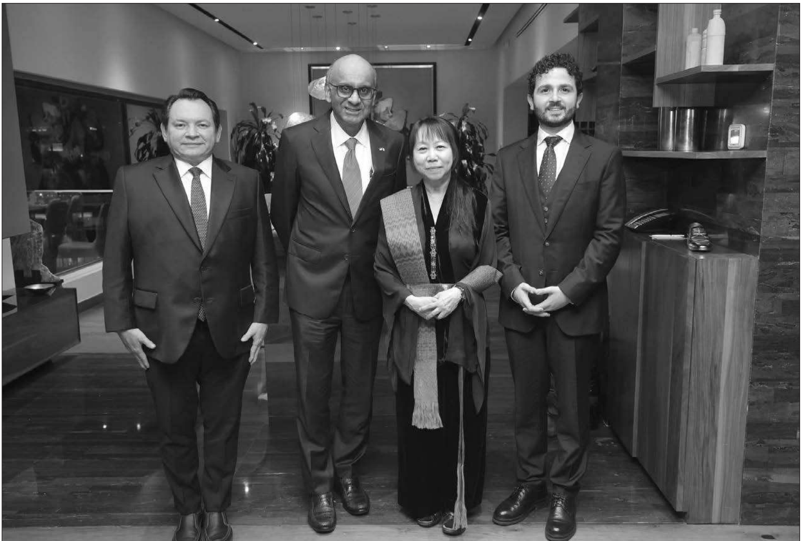
▲ La reunión, organizada por el embajador Gerald Singham, convocó a un grupo de gobernadores para dialogar sobre oportunidades de cooperación e inversión.

El evento concluyó tras una sesión de intercambio productivo entre la delegación singapurense y las y los líderes estatales invitados.