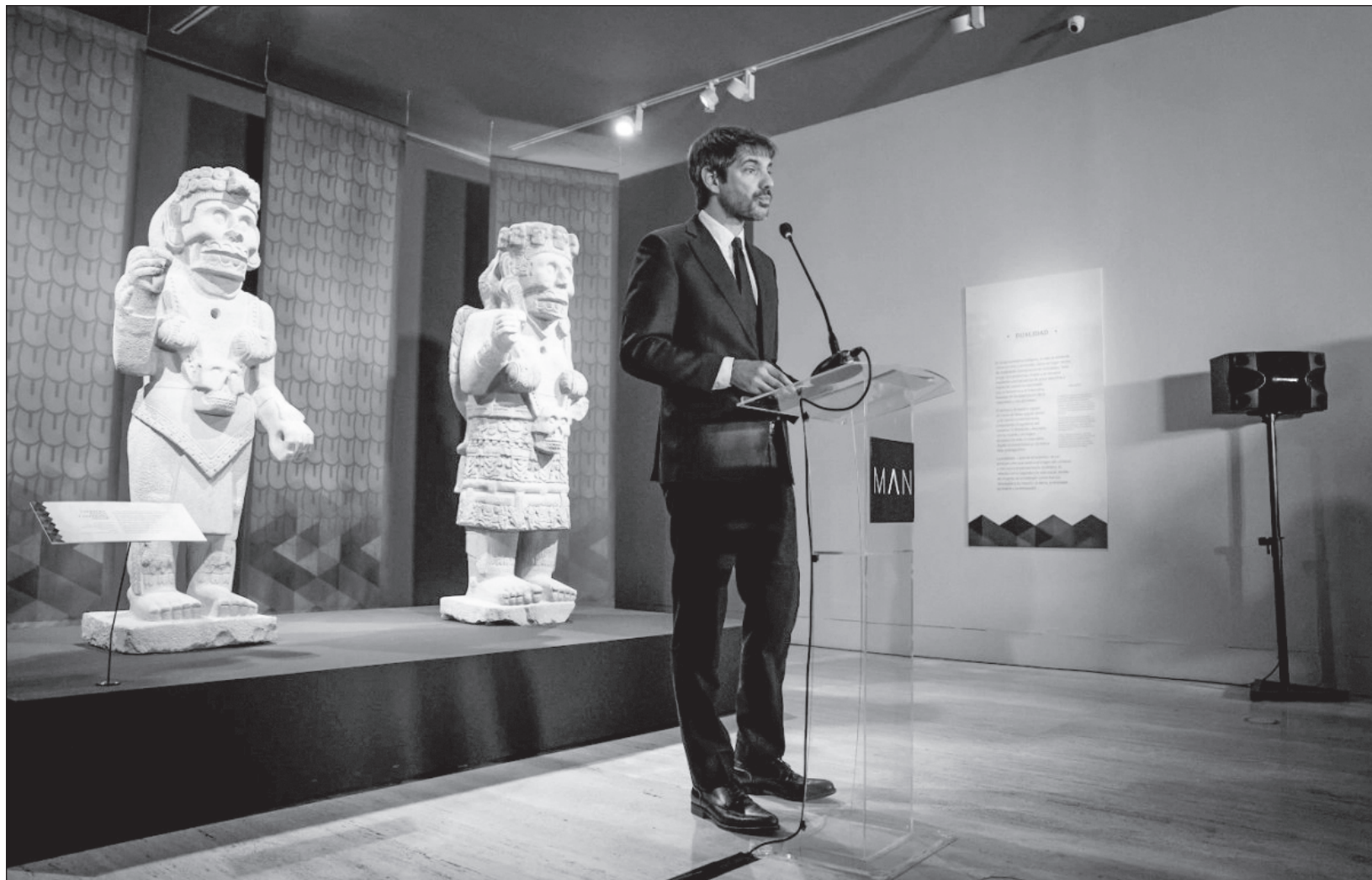
▲ El político español, de la coalición izquierdista Sumar, aprovechó para enviar un “cariñoso saludo” a la presidenta Claudia Sheinbaum.