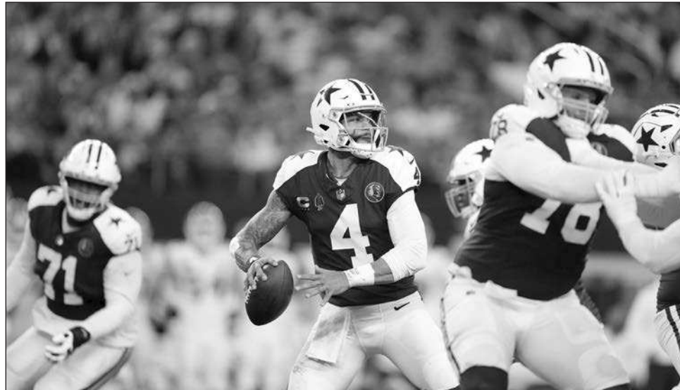
▲ Dak Prescott y Dallas vencieron a Filadelfia y Kansas City en sus últimos dos partidos.

Mientras tanto, los Vaqueros están avanzando hacia la postemporada gracias a una defensiva revitalizada. Están por encima de .500 por primera vez este año gracias a tres victorias consecutivas, incluida una sobre Filadelfia, para potencialmente desafiar a las Águilas (8-3),