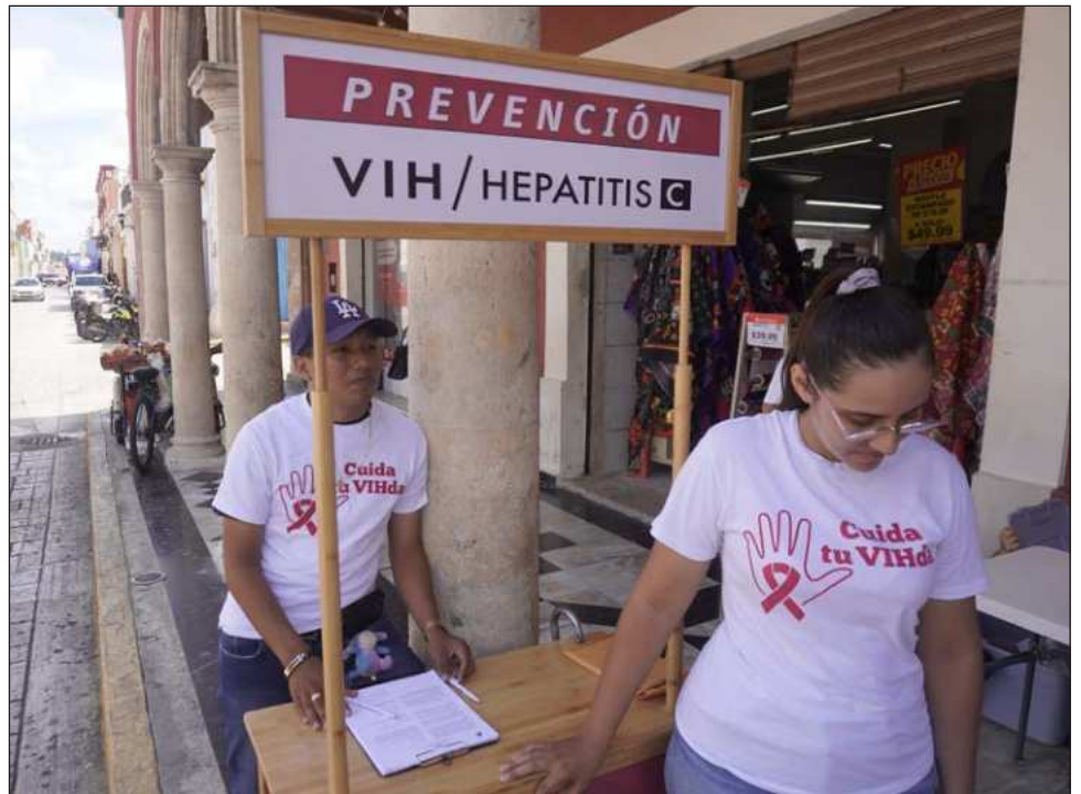
▲ De acuerdo con la encargada del programa estatal, la mejor manera de prevenir más casos es mantener informado y actualizar lo necesario.

En este evento participaron la Guardia Nacional, Policía Estatal Preventiva, Sistema DIF Municipal, Fiscalía General del Estado de Campeche, Secretaría de Salud, entre otras.