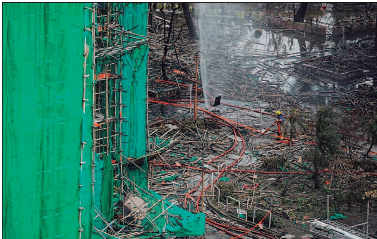
▲ Las llamas se propagaron rápidamente a través de las mallas plásticas que cubrían andamios de bambú instalados para las obras y que no cumplían las normas de resistencia al fuego; hay 15 personas detenidas por homicidio involuntario.

El siniestro en Tai Po es el incendio de un edificio residencial más mortífero desde 1980