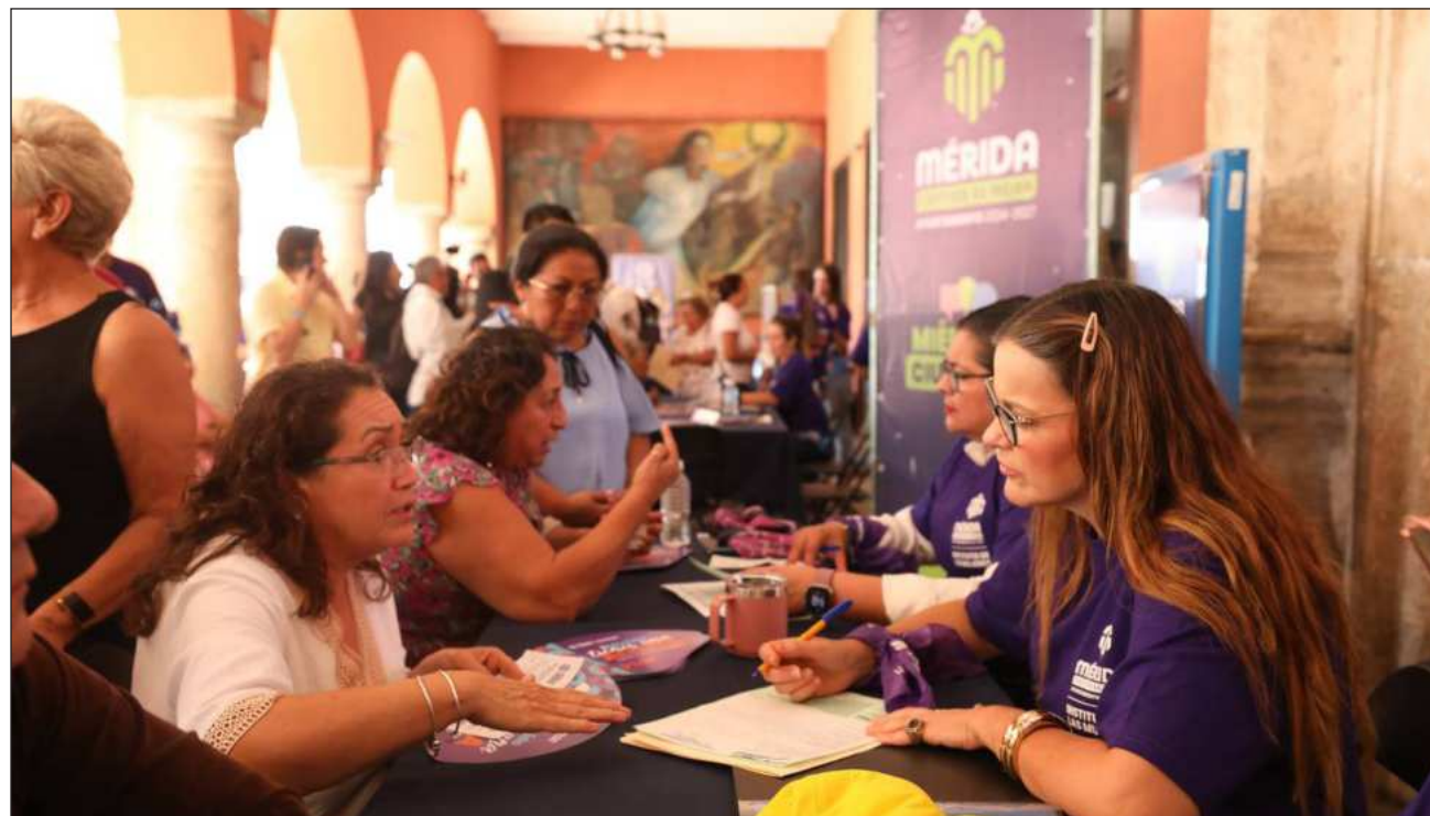
▲ De acuerdo con la presidenta municipal de la capital yucateca, “nuestro estilo de gobernar es estar cerca, escuchar y atender, y más contando con mujeres chambeadoras que aman a Mérida”.

Dicha actualización incluye la renovación del Código de Ética de las personas servidoras públicas, la creación de Comités de Ética, nuevos Lineamientos de actuación, así como Códigos de Conducta específicos para cada dependen-