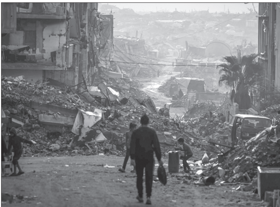
▲ La reapertura del paso fronterizo de Rafah, entre Gaza y Egipto, forma parte del plan de paz de Donald Trump para el enclave palestino, así como una demanda de larga data de varias agencias de la ONU y otros organismos humanitarios.

Y eso también se traduce en que los equipos médicos gazatíes y de organizaciones como MSF se pasen “días enteros, meses, esperando medicamentos que no llegan, equipos esenciales que han estado retenidos” porque “las autoridades israelíes consideran sospechosos o susceptibles de que tengan un doble uso, como generadores pequeños, como sillas de ruedas, muletas”.