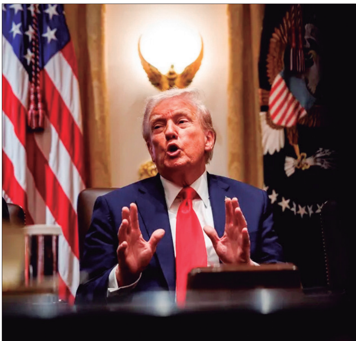
▲ “La explícita doctrina extorsionadora de Trump ha quedado clara en Argentina”.