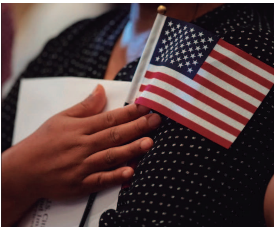
▲ La administración del presidente Donald Trump ha intensificado recientemente las políticas anti migratorias, principalmente con Cuba, Venezuela y Haití.

Horas antes el martes, funcionarios de Estados Unidos confirmaron que el ex presidente Juan Orlando Hernández, quien cumplía una sentencia de 45 años en prisión por tráfico de drogas, había sido liberado luego de recibir un indulto por parte de Trump.