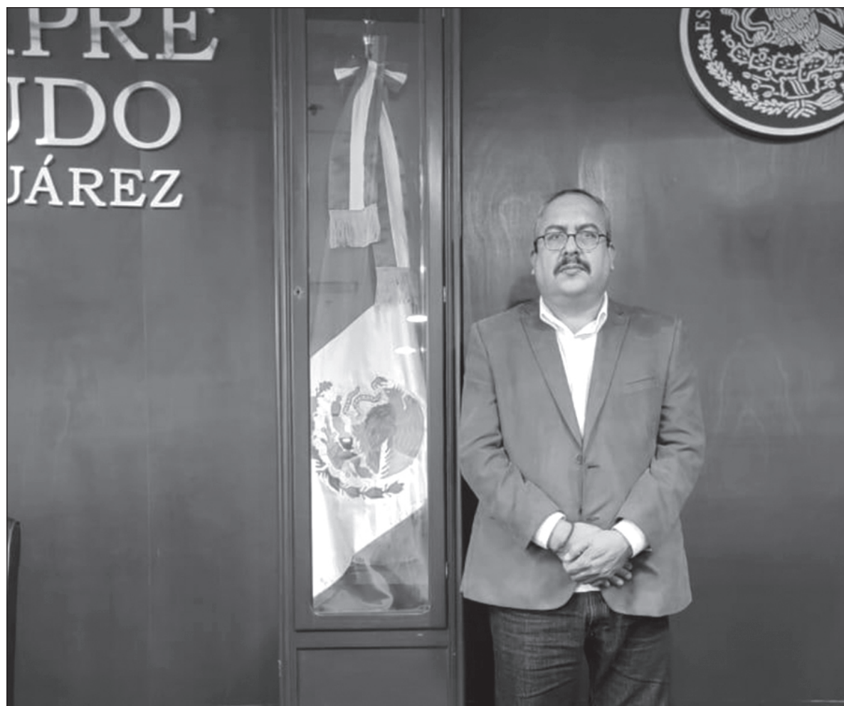
▲ “Los indígenas inconformes reclamaban que sus tierras y su poblado habían sido invadidos y ellos desplazados por la construcción de dicha obra, sin que la Comisión Nacional del Agua los indemnizara conforme a derecho”.

No nos equivocamos. El tiempo que estuvo ocupando el departamento jurídico, todavía en calidad de becario, desempeñó el puesto de manera eficiente, lo que le valió que al terminar su servicio social se le extendiera el nombramiento oficial, devengando el sueldo