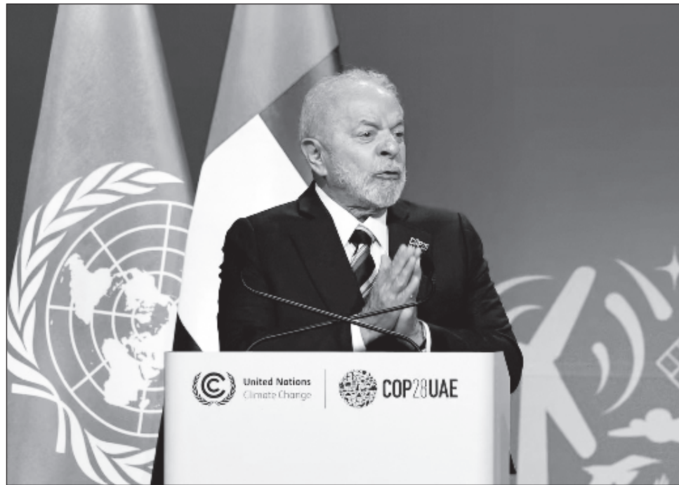
▲ Brasil fue invitado a sumarse al grupo formado por los 13 miembros de la Organización de Países Exportadores de Petróleo y otros 10 productores de crudo, encabezados por Rusia.

"Brasil no participará en la OPEP, [pero] Brasil sí participará en la OPEP+, es tan