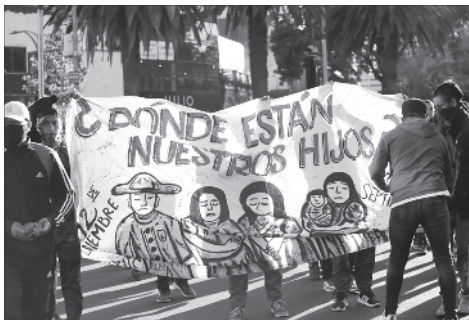
▲ El Presidente ratificó que la Sedena ya ha entregado toda la información de la que dispone del caso, asegurando que los cuestionamientos de los asesores de los padres de los normalistas sobre el incumplimiento de las fuerzas armadas son puras conjeturas.

Instó al Estado parte a garantizar la investigación inmediata, imparcial y exhaustiva de las denuncias de desapariciones forzadas, pero también de las desapariciones cometidas por personas o grupos que actúan sin la autorización, el apoyo o la aquiescencia del Estado. También pidió a México actuar con la debida diligencia en todas las etapas del proceso, perseguir y sancionar a los responsables con las penas adecuadas.