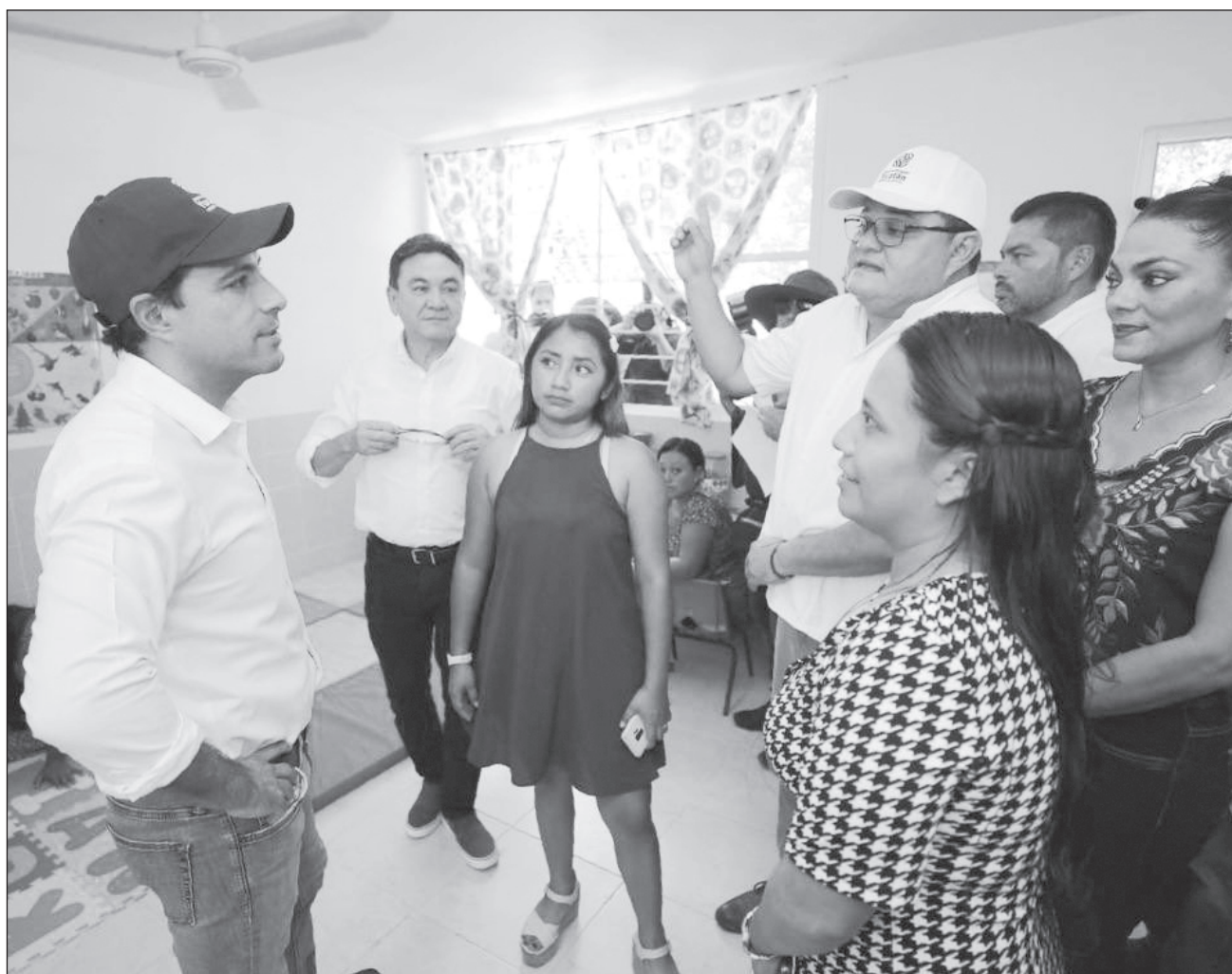
▲ Las aulas de educación inicial indígena incluyen baño, mobiliario y equipamiento del espacio.

El gobierno del estado construyó en total 64 preescolares de educación inicial indígena a través de una inversión de 35 millones de pesos en comunidades de población maya hablante de 33 municipios del interior del estado.