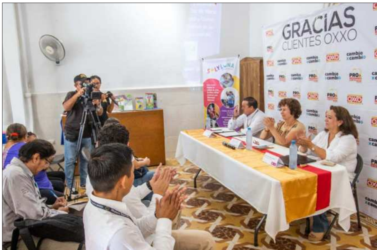
▲ Te'ela' ku chiikpajal máaxo'ob táakpaj te'e súutuk k'a'ayta'ab moltaak'in.

Beyxan, taak'in kun much'bile' yaan u k'a'abéetkunsal ti'al u ma'anal nu'ukulo'ob je'el u yáanta'ajo'ob ti'al u ka'ansa'al u péeksik u chi', u kama'ach, u yaak' yéetel u kaal meken paalal, ti'al beyo' u béeytal