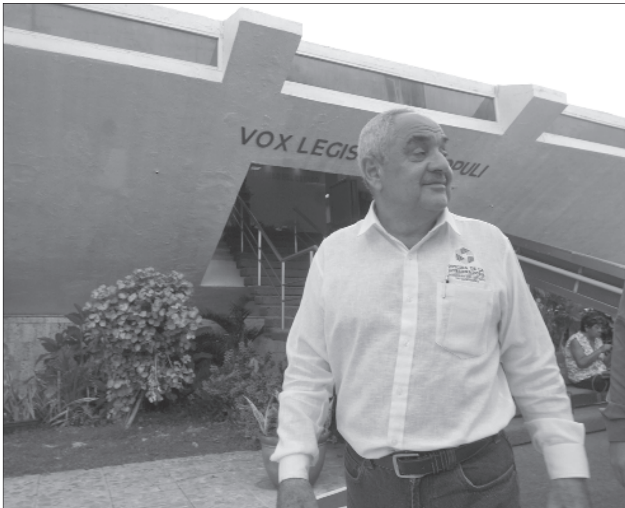
▲ Las cámaras empresariales como la Canacintra y algunos diputados, incluso del PRI, ven con buenos ojos la llegada del ex jefe de la oficina de la gobernadora al puesto encargado de la política interna del estado.

Cuestionados por la reunión que se daba en el inmueble, y el posible riesgo en el que estuvieron ese día, se negaron a responder y cortaron abruptamente la entrevista para ingresar al salón de sesiones.