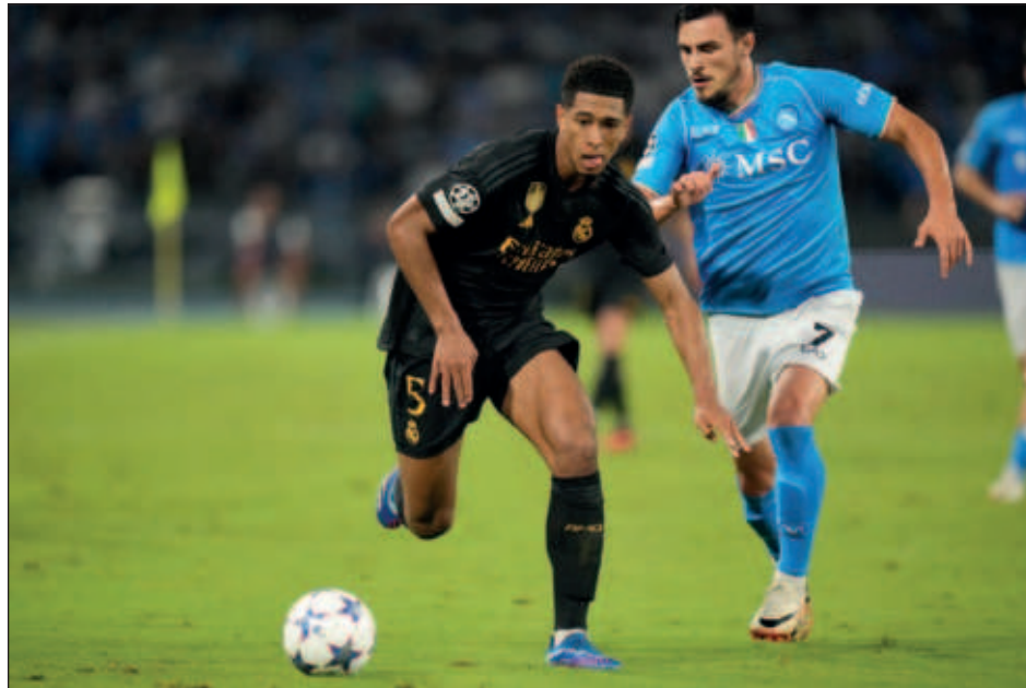
▲ Fue el segundo encuentro consecutivo de la Liga de Campeones en el que Bellingham ha desempeñado un papel crucial para el conjunto blanco. Ante el Union de Berlín, aportó el tanto de la victoria.

nico madridista, rindió un homenaje a Bellingham, al decir que le parece difícil creer que el mediocampista tiene apenas 20 años.