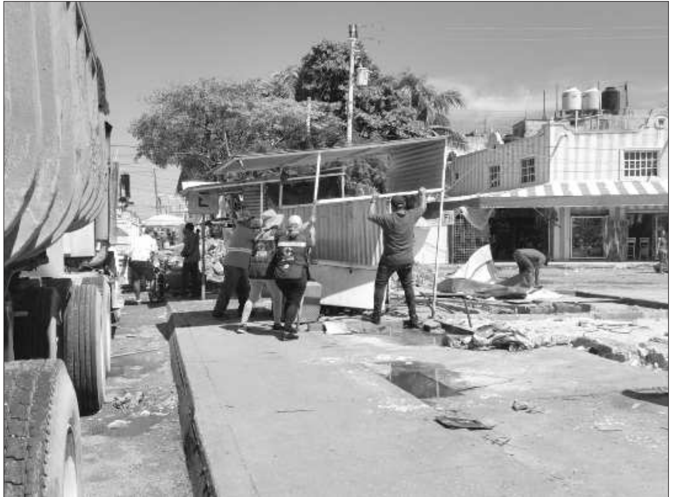
▲ En el lugar del retiro se encontraban elementos de la Policía Municipal, sin embargo, no se presentaron incidentes, ya que los comerciantes del sector sólo presenciaron el desmantelamiento de los espacios comerciales.

Cabe destacar que en el lugar se encontraban elementos de la Policía Municipal, sin embargo, no se