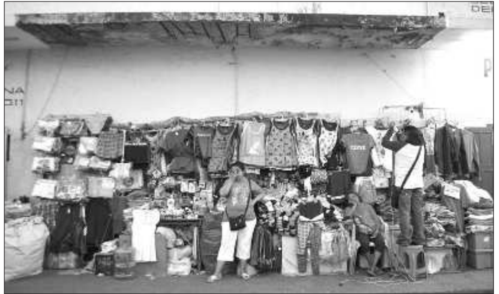
▲ En la primera mitad de 2023, la economía nacional mostró un crecimiento de 3.6 por ciento con respecto al mismo periodo de 2022.

Por su parte, el indicador coincidente, que refleja el comportamiento de la economía en curso, se ubicó por arriba de su tendencia de largo plazo, al registrar un valor de 101.2