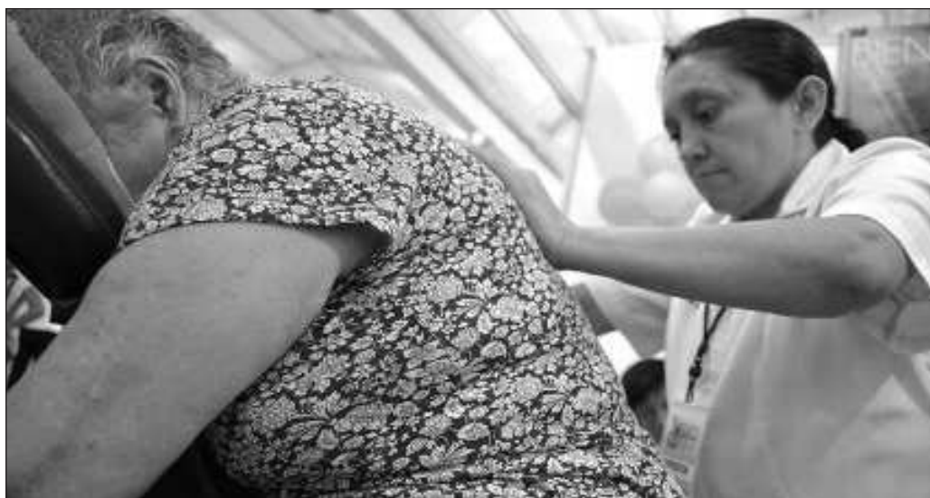
▲ Dada la cantidad de horas que en promedio dedican las mujeres a las tareas de cuidados, éstas tienen efecto en su salud tanto física como mental, y estas afectaciones impactan en por lo menos el 22% de ellas.

Hay pues, dos pendientes cuya resolución impactaría positivamente en la productividad del país. El primero es operar para transformar la percepción negativa de las estancias y guarderías -casos como la ABC se quedaron en el imaginario colectivo -a fin tanto de crear empleos como incorporar a más mujeres a la economía formal. El otro es crear políticas de atención a las personas que se desempeñan como cuidadoras ya sea en lo económico, acceso preferente a la atención médica y medicamentos para ellas y sus dependientes, y mecanismos para brindarles atención a la propia salud, de manera que también se deje de romantizar la abnegación femenina asociada a la labor de cuidadora, que tiene un efecto de desgaste en quienes la desempeñan.