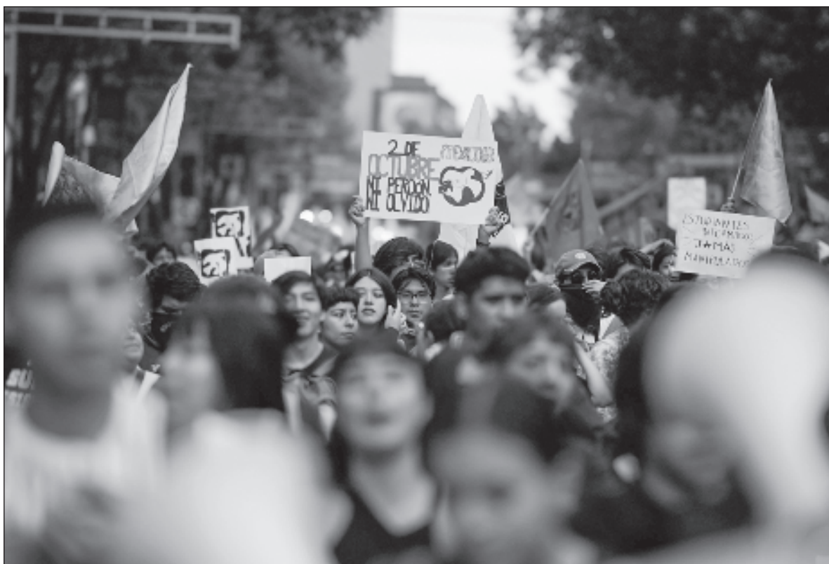
▲ “Espero que se ponga un firme ‘¡hasta aquí!’ a ese engendro que hemos dado en llamar crimen organizado”.

Aunque excedo en unos cuantos el límite de caracteres que me otorga este espacio, me permitiré cerrar con la idea de que quizá haya llegado el momento de promover la instalación de un Congreso Constituyente, y formular una nueva carta magna, acorde a las condiciones de este milenio, y no a las de principios del siglo XX.