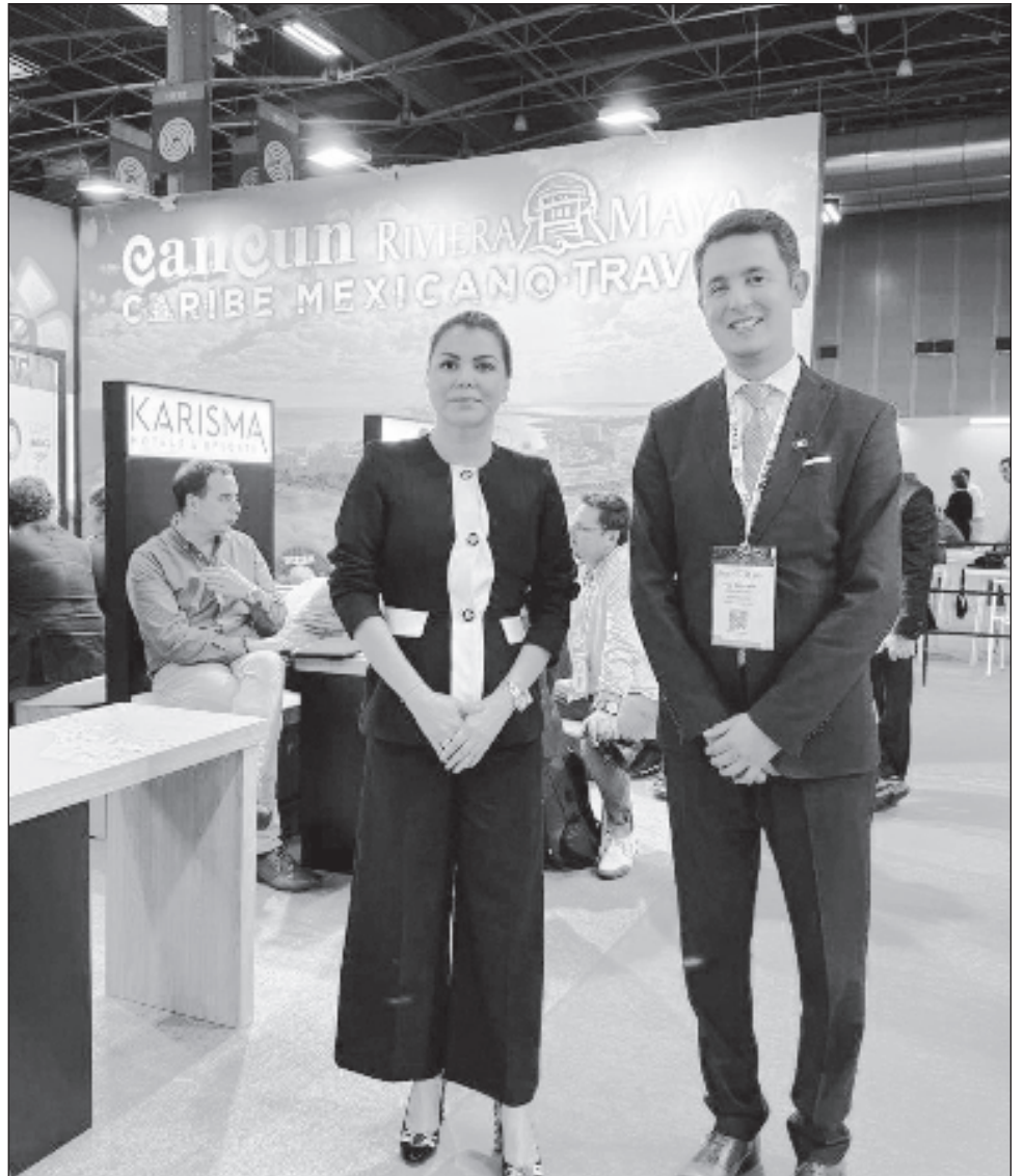
▲ La IFTM Top Resa se lleva a cabo en París Porte de Versailles y se presentarán empresas locales e internacionales relacionadas con los sectores de viajes.

Más allá de integrarse a una feria, es la posibilidad de generar catálogos de productos especializados, de insertarse en el Portal de Caribemexicano.travel, de llevar los aforos especializados en la materia.