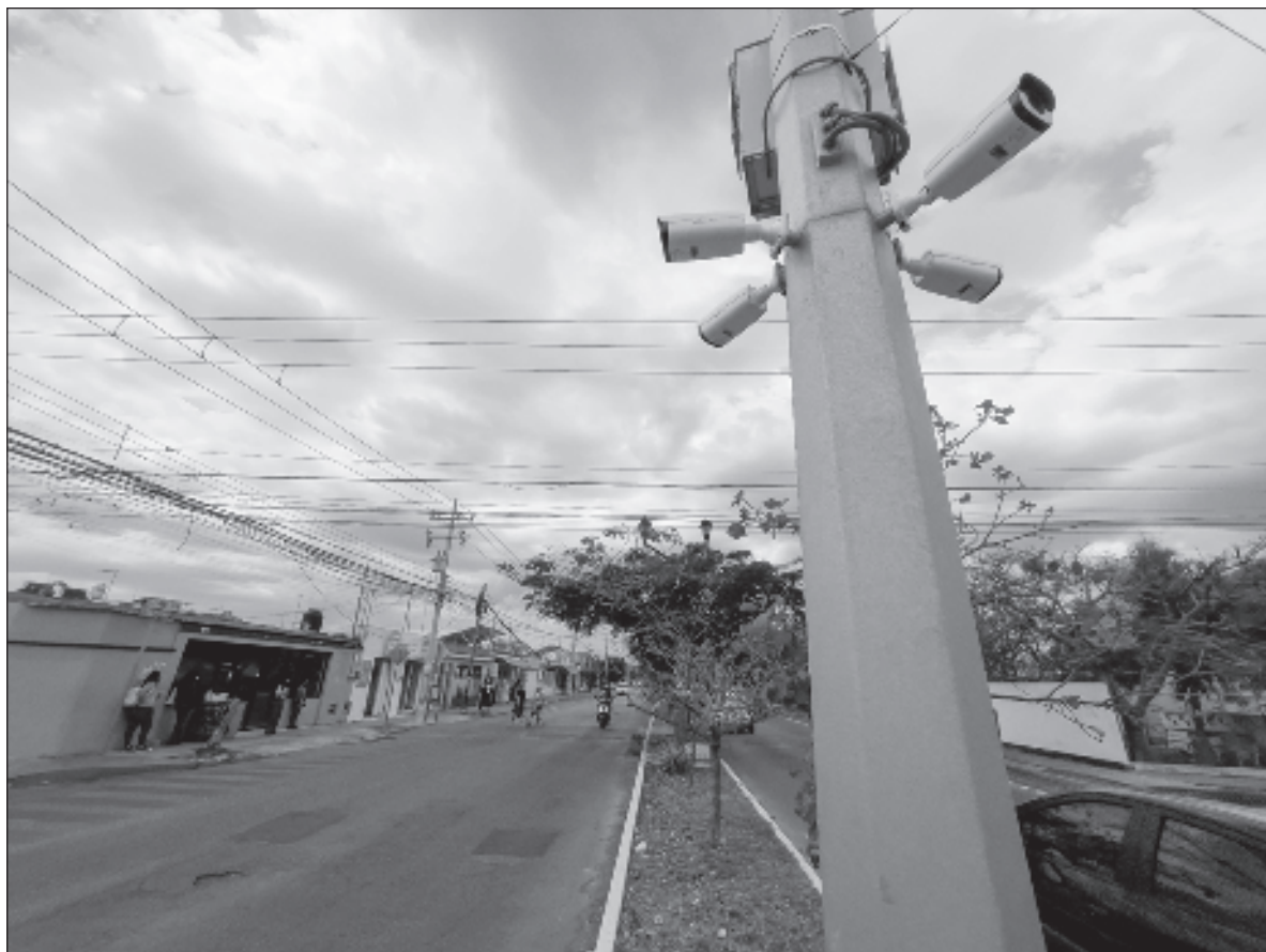
▲ “Los niveles de seguridad de Yucatán no se deben al azar: es el resultado de varios factores, entre los que se encuentra la cultura de los habitantes y la profesionalidad de sus fuerzas policiales”.

De acuerdo con el Censo de Población y Vivienda 2020 del Inegi, en una década la población de Yucatán incrementó 18.7 por ciento, lo que representa 365 mil 321 personas, al pasar de un millón 955 mil 577 a dos millones 320 mil 898 habitantes. Entre 2000 y 2010, la población incrementó 17.9 por ciento. Del total de la población yucateca según el censo más reciente, 995 mil 129 personas (43.9 por ciento) viven en Mérida.