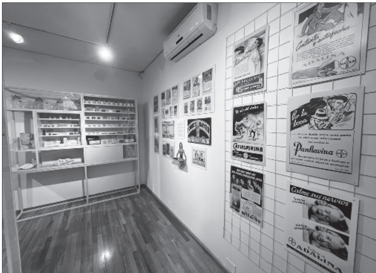
▲ El curador señaló que se logra una conexión con los visitantes, porque se presta a la nostalgia.

Con estas piezas, relacionadas con la medicina, la herbolaria, los medicamentos y remedios, el MODO invita a los visitantes a redescubrir los medicamentos, que actualmente nos parecen algo cotidiano, a conocer su nacimiento y su relevancia en