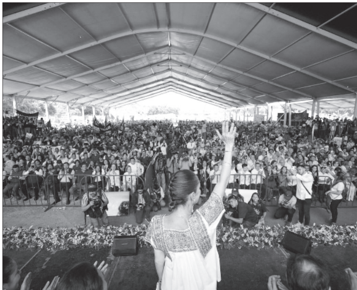
▲ Sheinbaum aseguró "que el mejor homenaje que se puede hacer a quienes participaron en el movimiento estudiantil de 1968" es ganar la Presidencia, gubernaturas, senadurías y diputaciones en 2024. Foto redes sociales Claudia Sheinbaum

LA PRETENSIÓN DE que los seguidores de una opción progre-