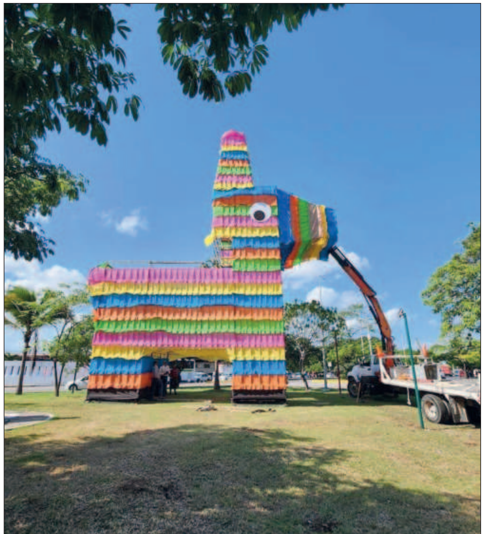
▲ Este evento cultural, artístico y gastronómico tiene como objetivo, fortalecer la tradición de Día de Muertos y promover el potencial turístico de la subdelegación.

Se estarán presentando los repertorios de invierno de las compañías municipales, seguirán las tardes de baile, las posadas, se repetirá la colocación de villas navideñas y glorietas decoradas en varias partes de Cancún, entre otras.