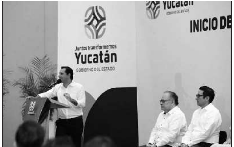
▲ Mauricio Vila encabezó el inicio de las Jornadas de Capacitación, señaló que “todos sabemos que los monopolios y la falta de competencia en los mercados tiene un amplio impacto negativo”.

Al recordar que sólo Yucatán y Jalisco se han sumado a este convenio, Vila Dosal señaló que estas capacitaciones son de suma im-