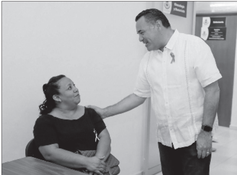
▲ En el Centro de Atención Médica a la Mujer se ofrecen servicios integrales de salud, como estudios de mastografía, consulta y ultrasonido ginecológico y sicología.

Ante usuarias del CAMM, el alcalde recordó que, aunque el tema de la salud no es de competencia municipal, el ayuntamiento promueve el autocuidado entre la población, con el propósito de elevar