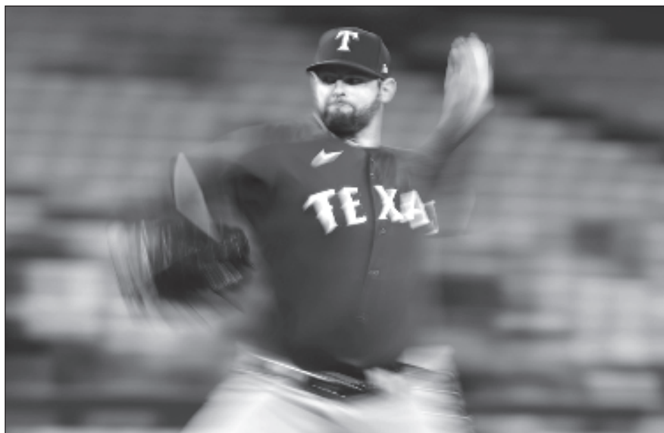
▲ Montgomery toleró seis hits espaciados en siete innings , y los Rangers de Texas derrotaron el martes 4-0 a los Rays de Tampa Bay, al comenzar la serie de comodines de la Liga Americana; "es bueno hacer tu trabajo y ayudar a que el equipo gane", dijo.

Tampa Bay, que usó jerseys de los Devil Rays