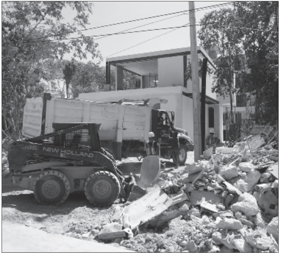
▲ Ante las megaobras, Tulum requerirá estrategias de planeación.

Exhortó a las nuevas generaciones que se interesen por esta materia a que lo hagan con consciencia, porque hoy con la tecnología se pierde esa esencia de arquitecto de gabinete o de obra. "Tulum es más turístico, pero la idea es que esta carrera de arquitectura pueda integrarse a las materias de la universidad".