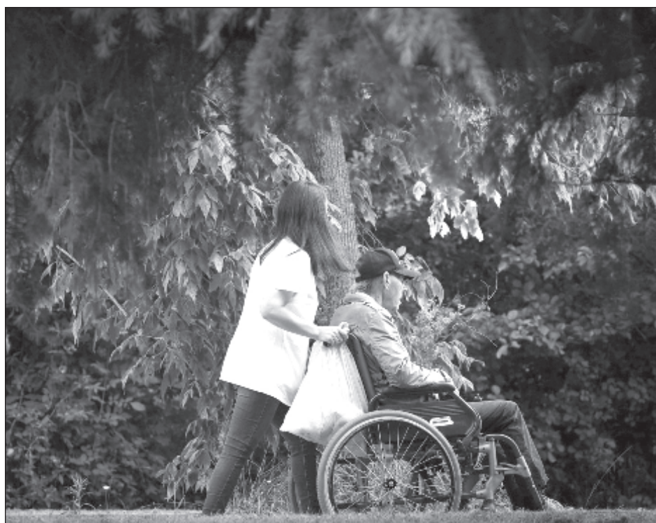
▲ El Inegi dio a conocer que las mujeres mexicanas dedican casi 38 horas a la semana a diversas actividades de cuidados por las que no reciben pago alguno.