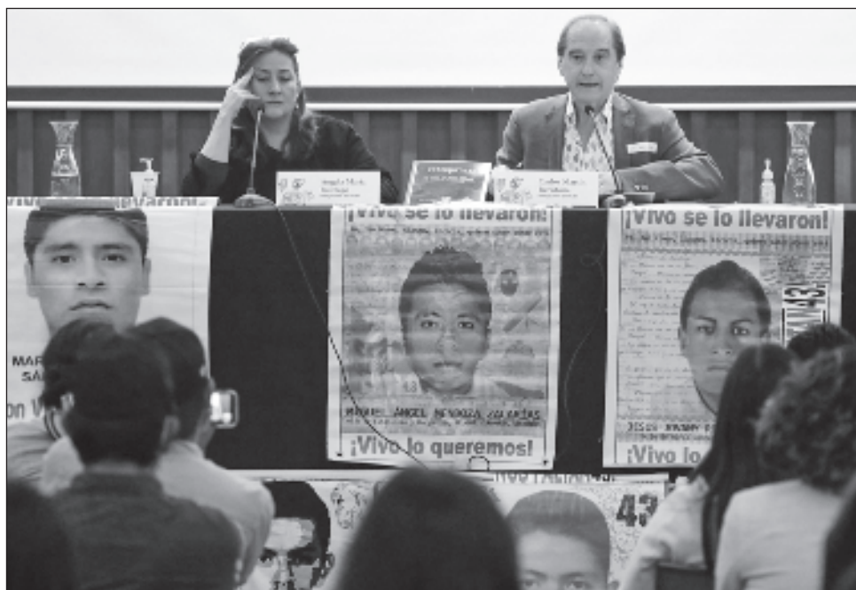
▲ En una nota aclaratoria difundida este martes, los investigadores pidieron a las autoridades que escuchen a las víctimas, ellas “tienen voz propia, no es hora de confusión y ruido. La verdad se empeña porque hay quien la empuja como lo hacen las familias”.

En una nota aclaratoria difundida, pidieron también