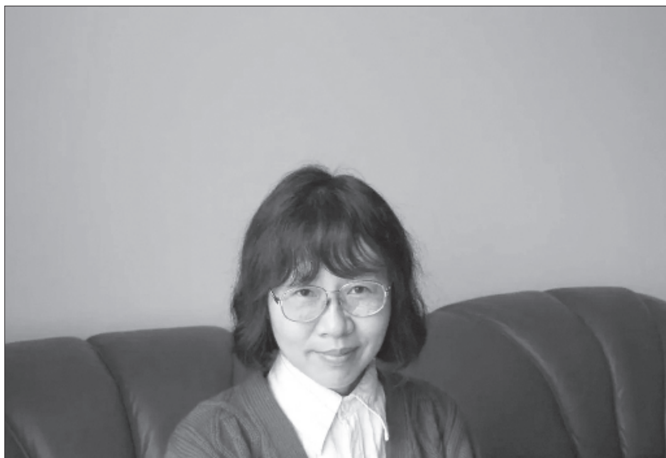
▲ La empresa de juegos de azar en línea Betsson, con sede en Estocolmo, destacó que es la primera vez que sitúan a la autora de ficción vanguardista Can Xue (Changsha, China, 1953) en la punta de las previsiones. Foto Hermida Editores

Gran cantidad de autores con calidad quedó fuera de las previsiones, como el poeta, cantante, compositor y novelista brasileño Chico Buarque, ganador en 2019 del Premio Camões, máximo reconocimiento a literatura en portugués.