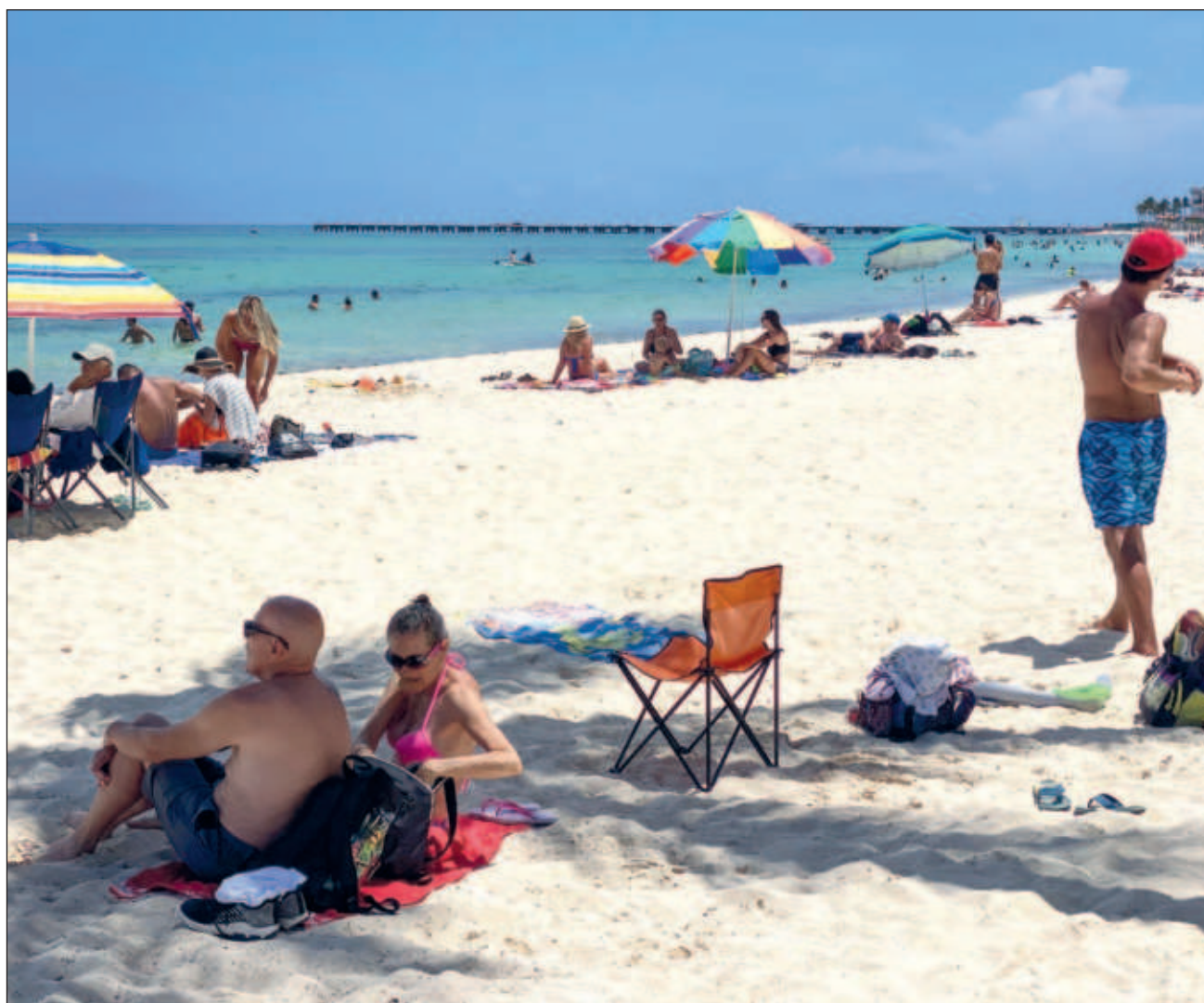
▲ De Canadá, México captó 1.6 millones de turistas, de los cuales 914 mil 835 entraron por Cancún.

De Europa fueron captados 1.5 millones de viajeros en el país, de los cuales 62 por ciento voló al Caribe Mexicano.