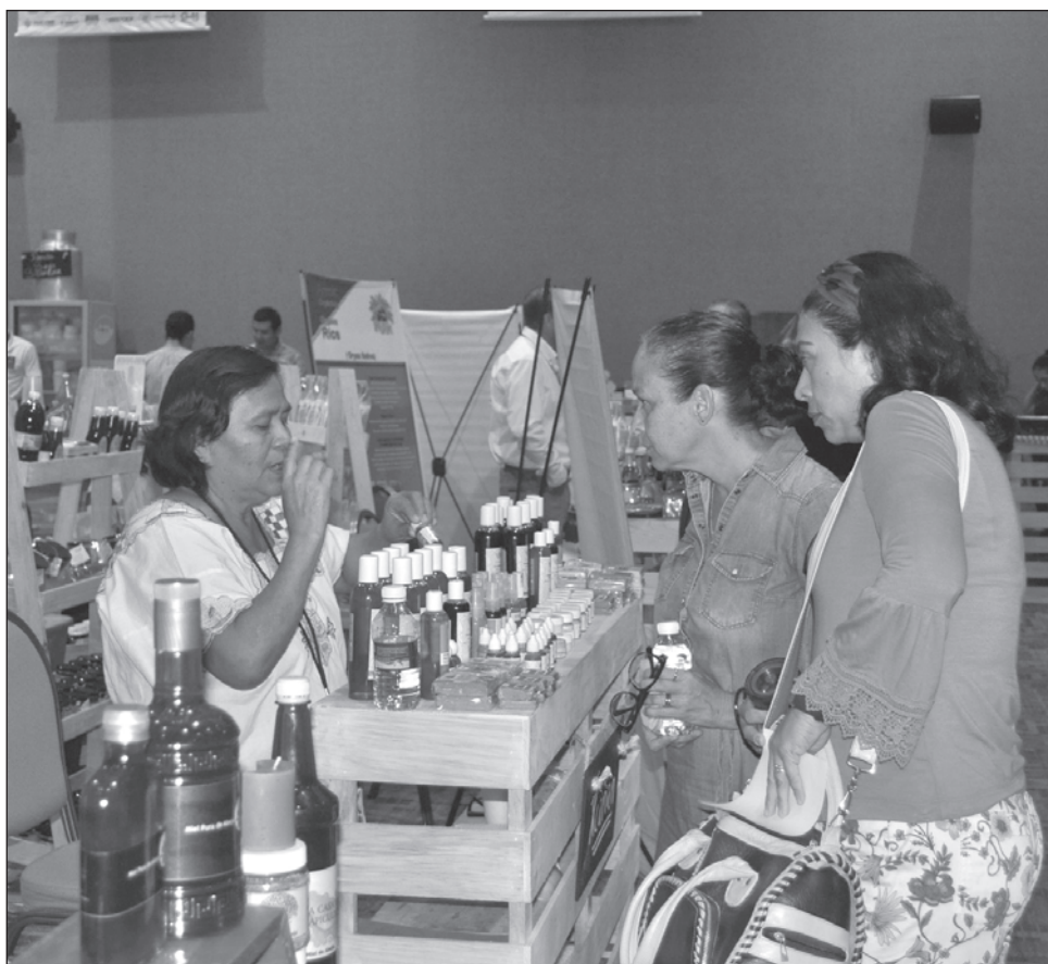
▲ “Como ha sucedido en ediciones anteriores, contaremos con las catas, las degustaciones de productos, talleres y conferencias de interés”.