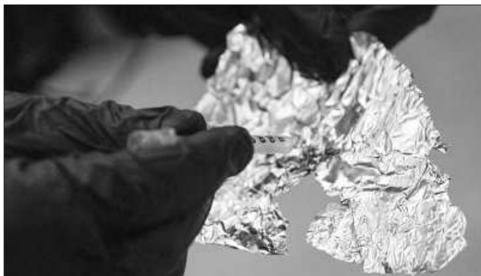
▲ Los cárteles de Sinaloa y el de Jalisco Nueva Generación son dos de los destinatarios de las sustancias producidas por los sancionados, entre los que destacan Wang Shucheng y Du Changgen.

Además la Oficina de Control de Activos Extranjeros (OFAC), del departamento del Tesoro, sancionó a 28 personas y compañías. Veinticinco están radicadas en China (incluidos los