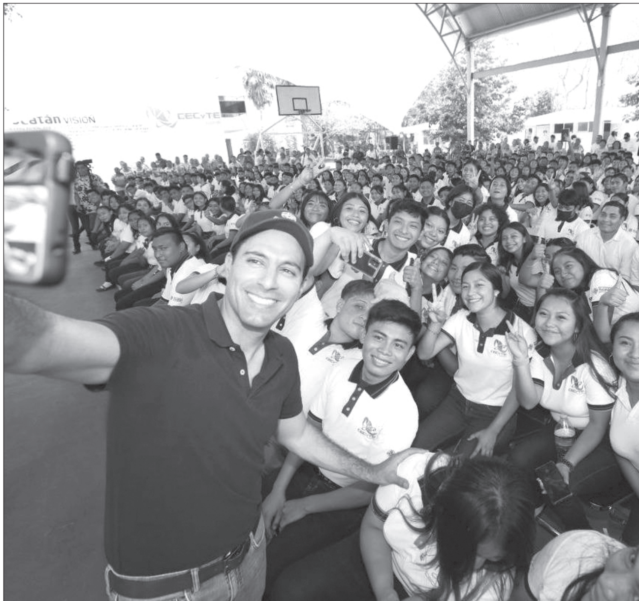
▲ El gobierno de Mauricio Vila Dosal atiende el problema del rezago educativo y las demandas de la población de contar con un servicio educativo y de modalidad escolarizada en su propia comunidad.

Como lo instruyó el gobernador Mauricio Vila Dosal, se estaría atendiendo el problema del rezago educativo y las demandas de la población de contar con un servicio educativo y de modalidad escolarizada en su propia co-