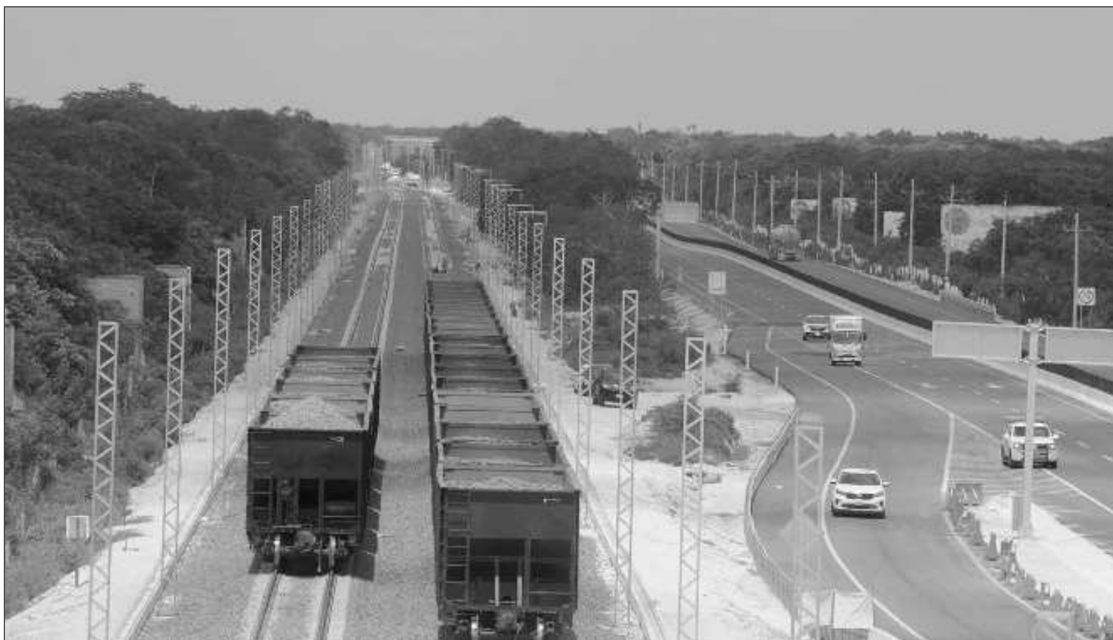
▲ "Siglos después reapareció la necesidad de agilizar el transporte de mercancías de un océano a otro en territorio nacional".