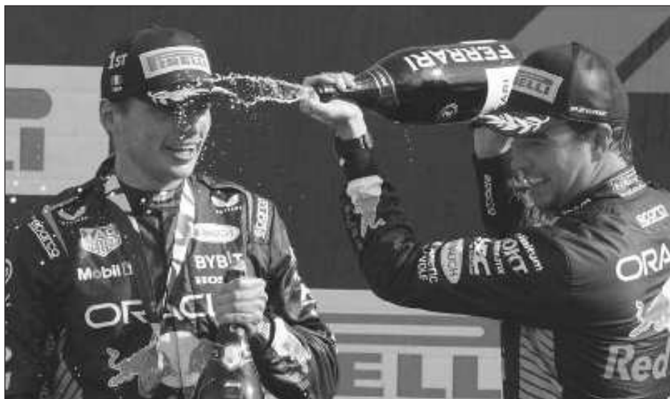
▲ Sergio Pérez baña con champán a su compañero Max Verstappen, ayer en Monza.

El récord parecía inminente después de que Verstappen comenzó a ampliar su delantera en el primer lugar y se colocó con cinco segundos de ventaja cinco vueltas después.