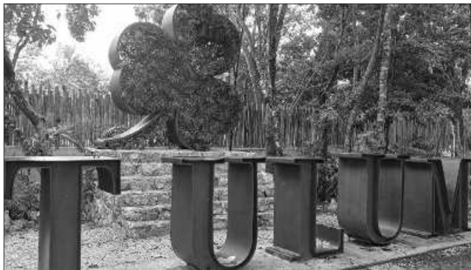
▲ A diferencia de los empresarios, el sector inmobiliario no considera al Tren Maya y el nuevo aeropuerto como un riesgo para mermar la plusvalía de la zona.

Ante la sensación del sector empresarial del ramo