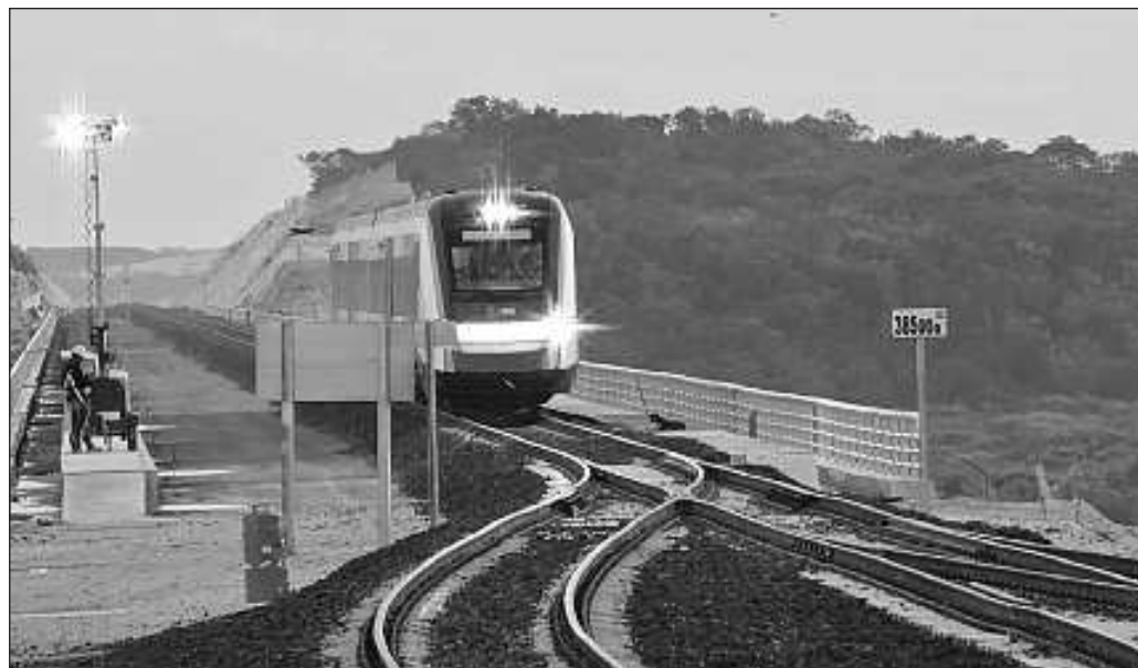
▲ Aún falta por concluir y probar cómo funcionarán los convoyes en los tramos que atraviesan Quintana Roo y conectan con Campeche, cerrando el circuito del Tren Maya.

Aún falta por concluir y probar cómo funcionarán los convoyes en los tramos que atraviesan Quintana Roo y conectan con Campeche, cerrando el circuito del Tren Maya. Es todavía bastante lo que deben avanzar los trabajos. Mientras, la presencia de gente de las poblaciones al paso del ferrocarril nos da otro mensaje: estas personas están cifrando sus esperanzas en que el tren sea ya una realidad, la que ya intuyen en el horizonte.