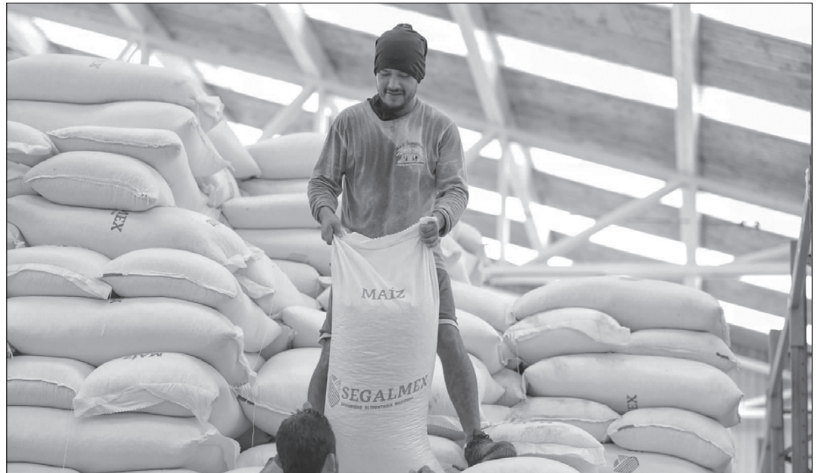
▲ “La evaluación de los programas de desarrollo social en México no debe ser vista como un acto coercitivo ni inquisidor. Al contrario, las evaluaciones son ejercicios cuyos resultados permiten la mejora continua de los procesos”.

EN 2022, EL PPG fue evaluado la Universidad Autónoma de Chapingo, instancia que coordinó el proyecto denominado Evaluación de Procesos a tres Programas prioritarios de apoyo al campo para las entidades Puebla, Jalisco, Zacatecas y Sinaloa. La evaluación contó