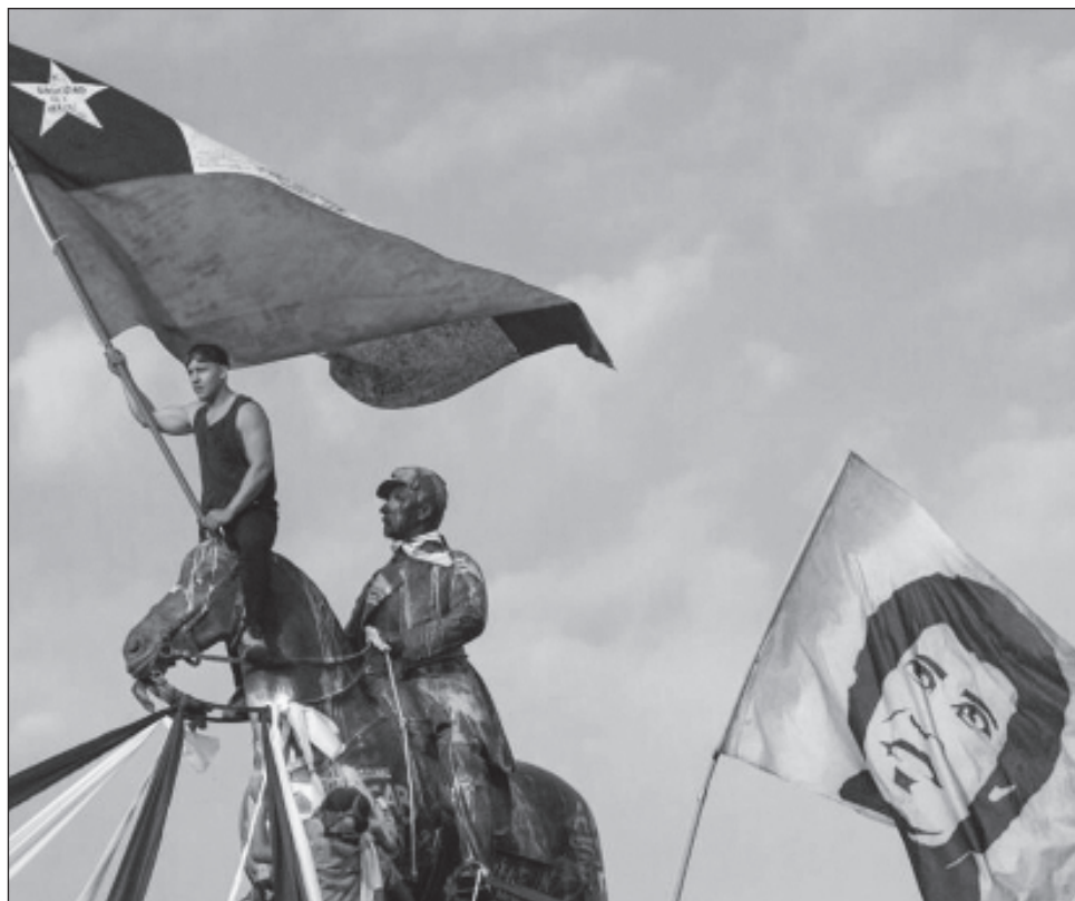
▲ La abogada reconoció que “el proceso político de la Unidad Popular sí es un espacio para deliberar. Además de la revolución francesa y la guerra civil Española, no existe otro proceso político que haya sido más analizado, revisado y reflexionado que éste”.

Se requiere “un país con una memoria colectiva que no se distorsione”, asegura Hertz