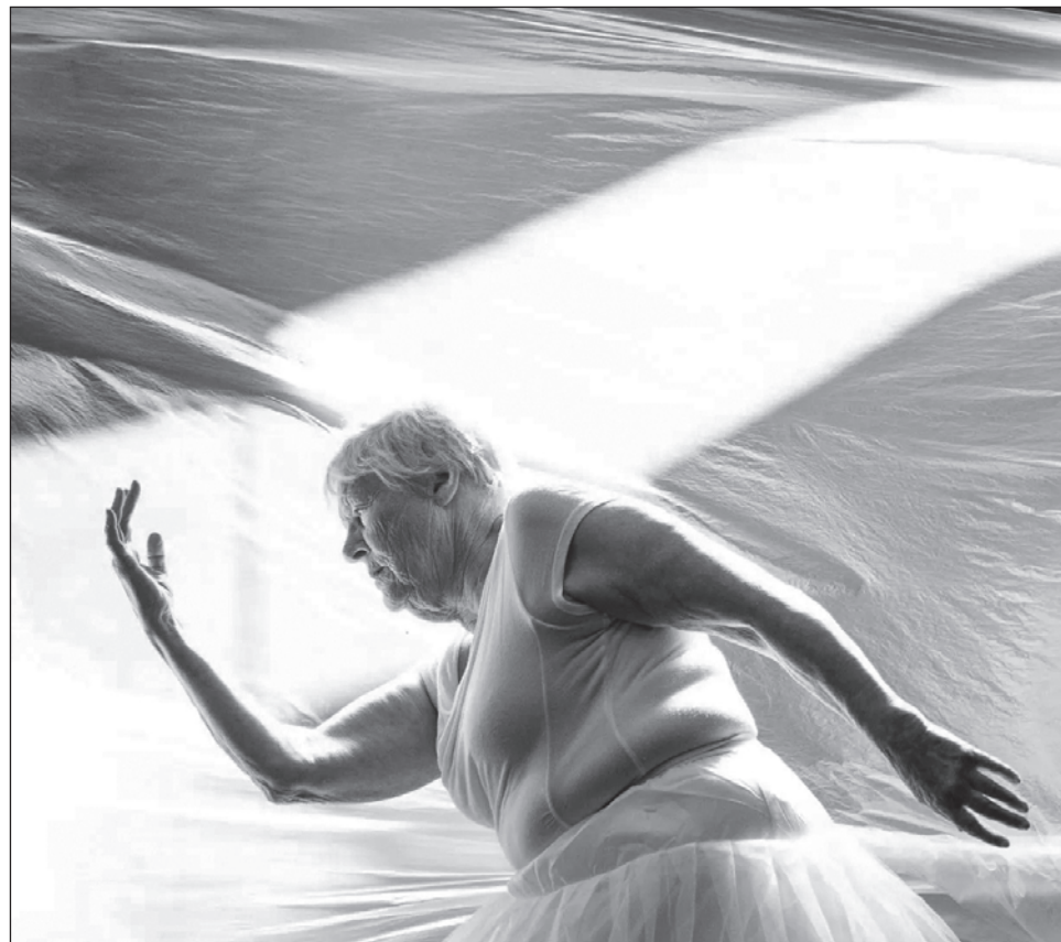
▲ Los integrantes la compañía de danza Prime, asentada en Edimburgo, Escocia, tienen entre 64 y 80 años y presentan obras emotivas, como la más reciente, El viaje de la vida infinita .

De la mano de la compañía taiwanesa B. Dance, los miembros de Prime crearon