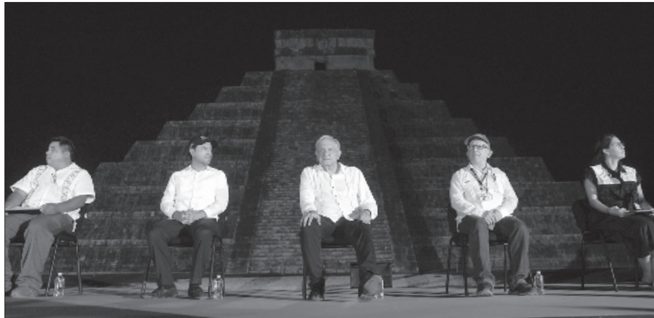
▲ El presidente Andrés Manuel López Obrador realizó una inauguración simbólica de la zona Chichén Viejo.

Decenas de arqueólogos de distintas entidades del país recibieron al mandatario federal, quien llegó acompañado del gobernador