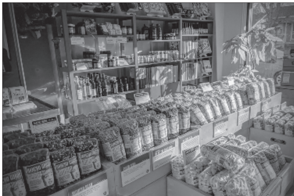
▲ El empresario comenzó con una operación muy pequeña, vendiendo su producto en mercados de granjeros y ahora envía el producto acompañado por recetas.

"Empecé con un par de clientes y ahora el club ha llegado a 22 mil miembros, quienes reciben un envío