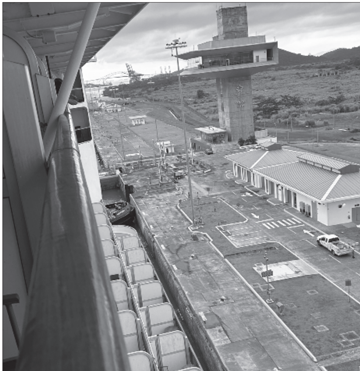
▲ Títanica obra construir la represa más grande del mundo en aquella época, diseñar y construir el canal de esclusas más imponente jamás imaginado y resolver problemas ambientales de enormes proporciones

En la actualidad, inaugurado oficialmente el 15 de agosto de 1914, el Canal de Panamá es una