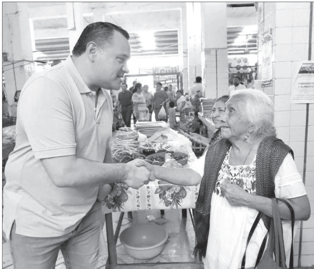
▲ A la fecha ya se realizaron dos de los cuatro Foros, con la asistencia de más de 70 personas.

Informó que, para ratificar ante las familias el compromiso democrático de velar por el bienestar de todas y de todos, se programaron cuatro foros informativos sobre el nuevo mecanismo de Presupuesto Participativo Diseña tu Ciudad, mediante el cual la población decidirá sobre el destino de un porcentaje del presupuesto de egresos de cada año para el desarrollo de obras y servicios.