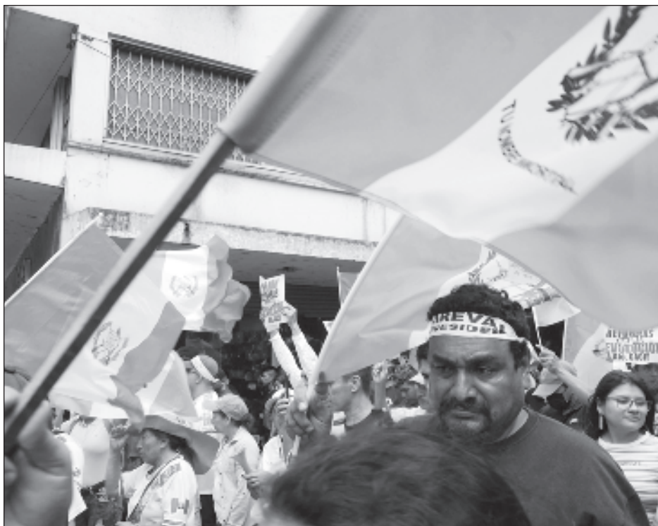
▲ El presidente electo denunció que detrás de los ataques estaba una intención de “golpe de Estado”, que buscaba que él no pueda asumir el poder el 14 de enero de 2024.

Erdogan se ha mostrado receptivo con la postura de Putin. En julio pasado dijo que Putin tenía “ciertas expectativas de los países de Occidente” sobre el acuerdo del Mar Negro y que era “fundamental que estos países tomaran medidas en ese sentido”.