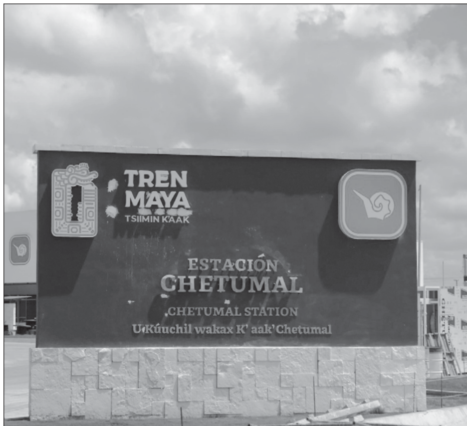
▲ La gobernadora destacó a Kohunlich, con sus impresionantes mascarones que se relacionan con la deidad del Sol y de Venus, que podrán ser visitadas por los turistas.

“Los corales se restablecen y vuelven a recuperar sus algas y se mejoran, por así decirlo. Pero lo que pasó el año pasado fue una ola de calor sin precedente que causó una mortalidad muy alta en muchos de los corales. Entonces este año estamos previendo que va a haber mucho calentamiento y va a haber también otra afectación”, adelantó.