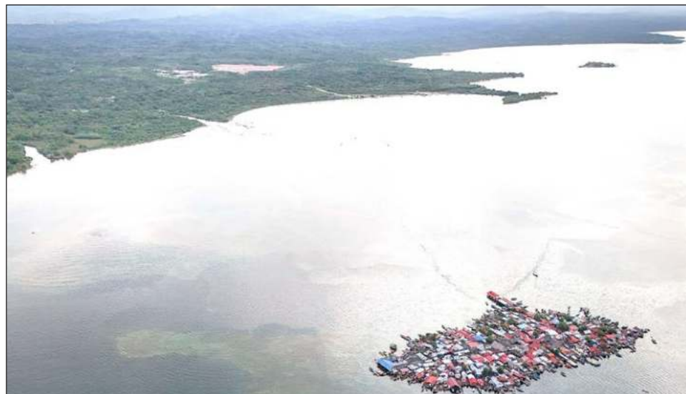
▲ El archipiélago de Guna Yala, también conocido como San Blas, está conformado por 365 pequeñas islas caribeñas casi al nivel del mar. Allí habita el pueblo guna, una de las siete etnias de Panamá.

Esta mudanza, la primera en el país por la crisis climática, tiene como destino la