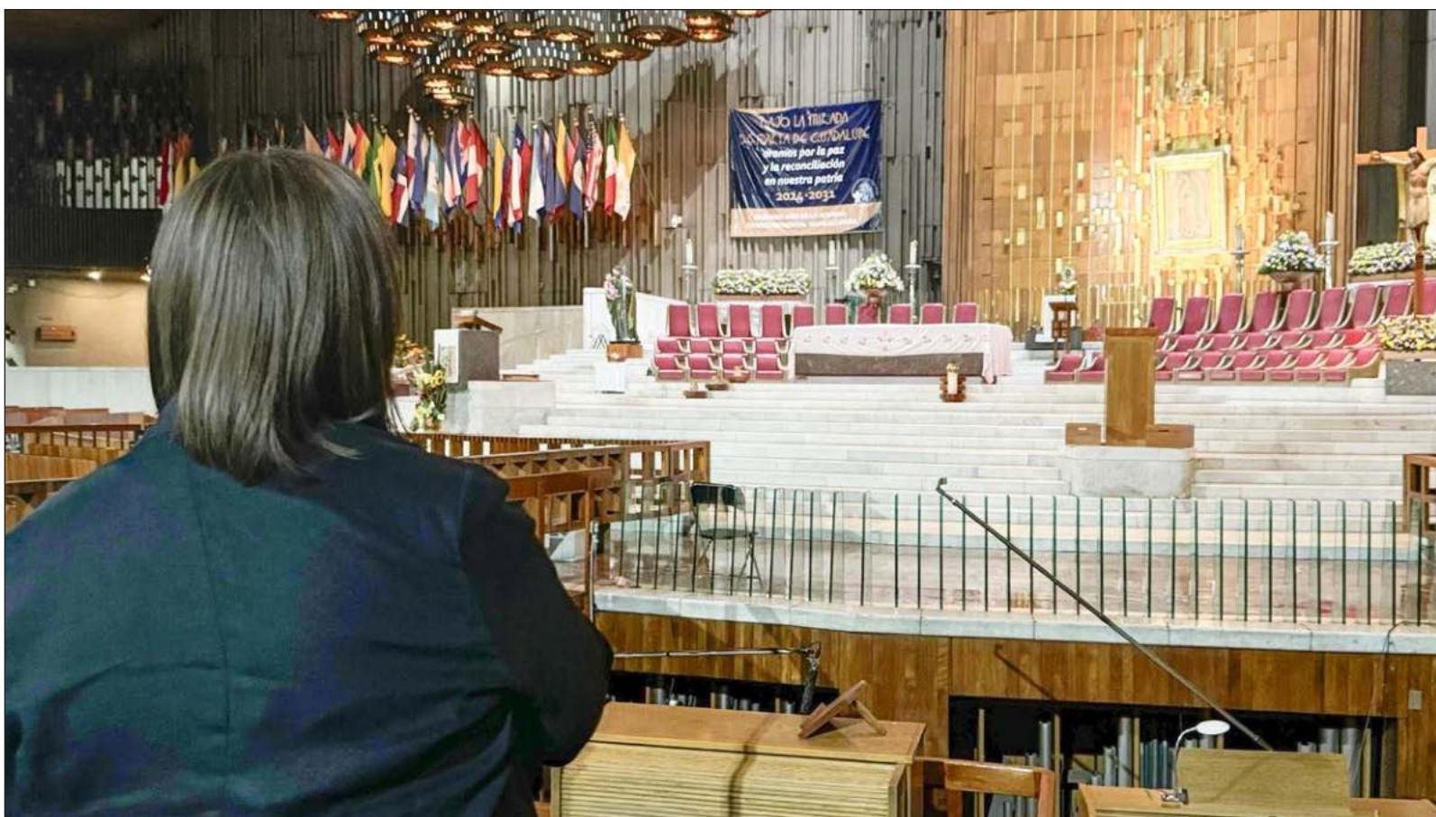
▲ “La fotografía de Xóchitl Gálvez en la basílica de Guadalupe recuerda el final de películas mexicanas donde Sara García o Marga López van a dar gracias a la Virgen por los favores recibidos (...) con un final feliz, que en esta ocasión no se dio para la candidata hidalguense”.