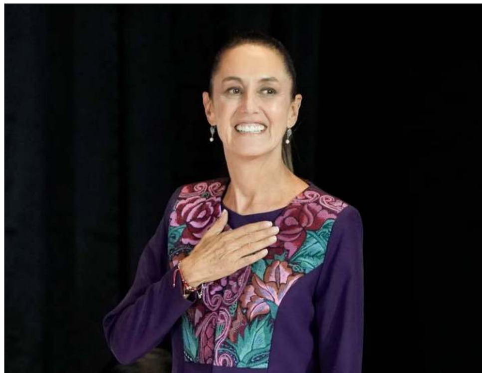
▲ "No llego sola, llegamos todas", afirmó Sheinbaum al dirigirse a las mujeres en su discurso de victoria, en el que prometió estar a la "altura de nuestra historia".

El uso de métodos científicos y tecnología reflejó la impronta de Sheinbaum en la gestión del Covid que,