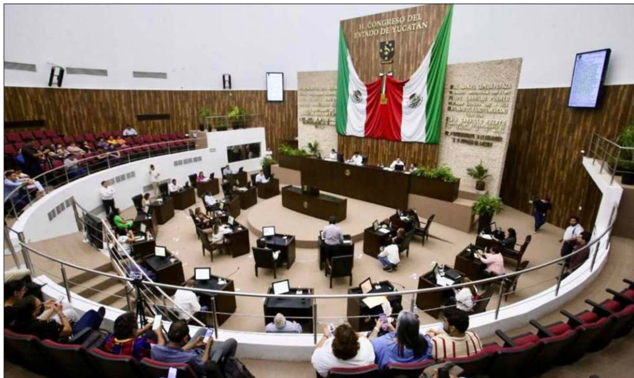
▲ En la legislatura pasada, Morena en Yucatán inició con cuatro representantes y en esta comenzará con 16, es decir, que el partido guinda incrementó su presencia en el congreso local en 400 por ciento.

El PREP reporta que la coalición Sigamos Haciendo Historia (Morena, PT y PVEM) obtuvo 13 distritos, Morena sin coalición ganó un distrito, mientras que la alianza del partido guinda con el verde logró uno y la unión Morena-PT uno más.