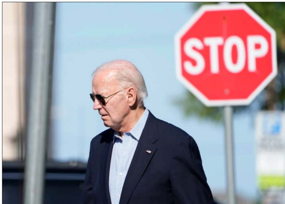
▲ El impacto del número de 2 mil 500 significa que la frontera entre EU y México podría cerrarse para inmigrantes que buscan asilo de manera efectiva e inmediata.

La Casa Blanca está anunciando a los legisladores que el presidente Joe Biden se prepara para aprobar una orden ejecutiva que suspenderá las solicitudes de asilo en la frontera entre Estados Unidos y México una vez que el número de encuentros diarios llegue a 2 mil 500 entre los cruces fronterizos, y la frontera se reabrirá una vez que esa cifra se reduzca a mil 500, según varias personas familiarizadas con las discusiones.