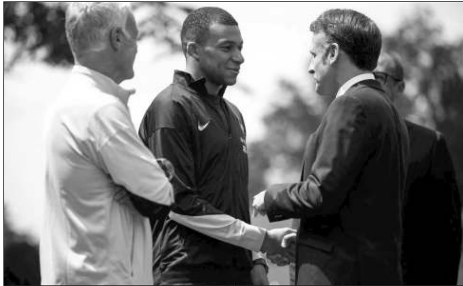
▲ El presidente francés Emmanuel Macron (derecha) saluda al delantero Kylian Mbappé junto al técnico nacional Didier Deschamps, el lunes en Clairefontaine.

Desembarca en la capital española para unirse a