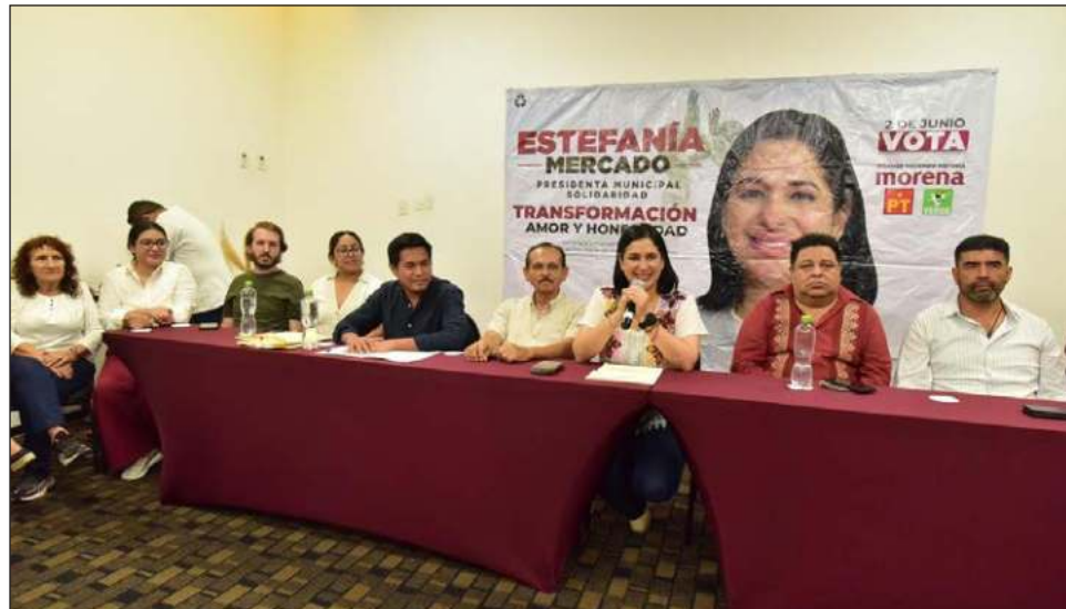
▲ Al obtener 55% de los votos, Estefanía Mercado de Sigamos Haciendo Historia marca el regreso de Morena al municipio de Solidaridad.

De acuerdo con el PREP, las 11 presidencias municipales en disputa serán de Morena y sus aliados, con el resultado más apabullante en Isla Mujeres, donde Atenea Gómez alcanzó 80 por ciento de la votación. En Benito Juárez, Ana Paty Peralta obtuvo 71 por ciento de los votos; Lázaro Cárdenas será para Nivardo Mena, con