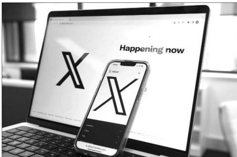
▲ Esta regla permite explícitamente a los usuarios compartir contenido para adultos "mientras sea producido y distribuido de forma consensuada", señaló X en sus nuevas normas.

Hasta este lunes, la red social nunca había prohibido formalmente los videos o fotos eróticas o pornográficas en su sitio, pero tampoco las había autorizado oficialmente.