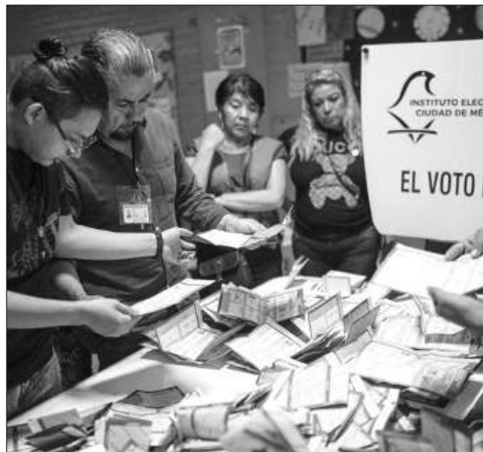
▲ Un día después de la jornada electoral, espero que este país pueda reencontrar la capacidad de dialogar para resolver lo urgente, discutir lo importante, y acordar lo necesario.

El ejemplo más nítido y reciente de este fenómeno es el asesinato, transmitido en vivo, del candidato del PRI y la alianza opositora, en Coyuca, Guerrero. El crimen vota y vota. El crimen decide quién gobierna en los municipios, quién manda en las policías y cómo se orienta el raquítico presupuesto público de cientos de alcaldías. Esa es nuestra realidad, y la política ha llevado la seguridad a su terreno. Así, tocar el tema de seguridad parece un tema contra el gobierno, y la defensa de las políticas públicas de seguridad cae en oídos sordos de la oposición.