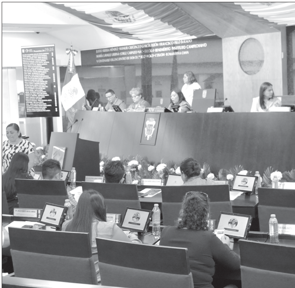
▲ Los resultados propician a que las curules plurinominales se queden en Morena y Movimiento Ciudadano, pues no habrá otra fuerza política en el Legislativo de Campeche.

Los virtuales ganadores han publicado en sus perfiles de Facebook mensajes de agradecimiento y compromiso para los siguientes tres años de administración pública y que arrancarán el próximo 1 de octubre.