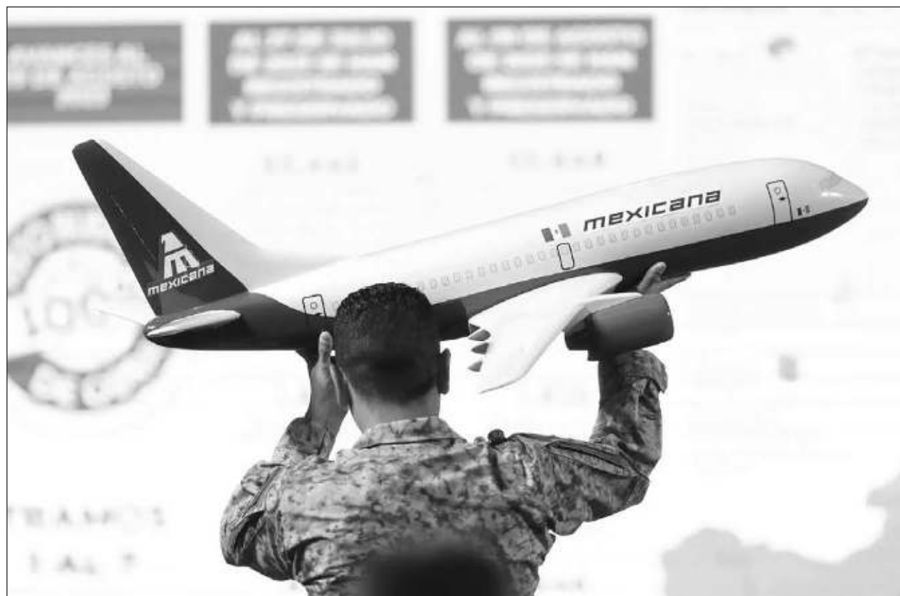
▲ Mexicana de Aviación retomó sus operaciones el pasado 26 de diciembre, luego de que el presidente Andrés Manuel López Obrador, entregara su control al Ejército, "será la primera aerolínea" que usará los aparatos E2 de Embraer en México.

Mexicana de Aviación ya vuela a 18 destinos y acumula más de 3 mil 280 horas de vuelo desde que reinició sus actividades, afirmó la vicepresidente de Ventas