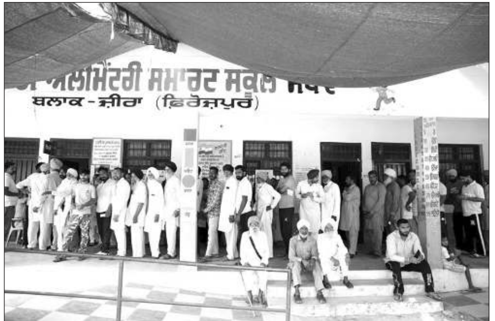
▲ Las elecciones terminaron el sábado con la séptima y última ronda del proceso electoral, que duró seis semanas y tuvo una participación de 58 por ciento.

“Tenemos más de 30 millones de jóvenes en América Latina que ni estudian ni trabajan, y los jóvenes constituyen precisamente el público objetivo y más perverso para las redes criminales”, alertó.