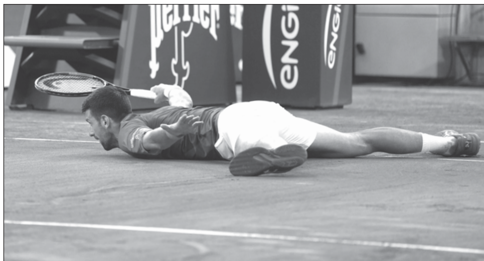
▲ Novak Djokovic, durante su partido contra Francisco Cerúndolo en el Abierto de Francia.

Djokovic rompió un empate con Roger Federer en cuanto a la mayor cantidad de triunfos en las grandes citas del tenis -y también quedó como la raqueta masculina con más presencias de cuartos de final en los "Slams",