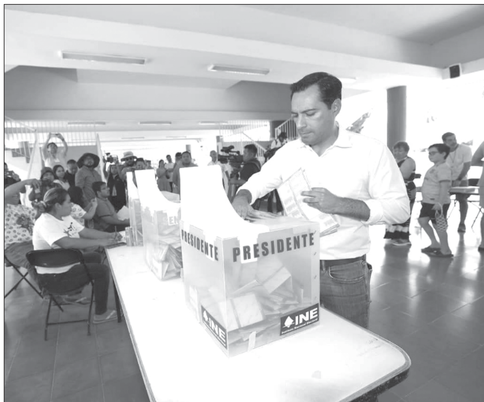
▲ En el actual proceso electoral, a Mauricio Vila su partido le brindó la posibilidad de estar en el Senado de la República por los próximos seis años.

Vila Dosal mencionó que al retomar el cargo como gobernador continuará trabajando en las acciones, obras y proyectos que sigan impulsando la transformación de Yucatán y generen mejores condiciones de vida para sus habitantes.