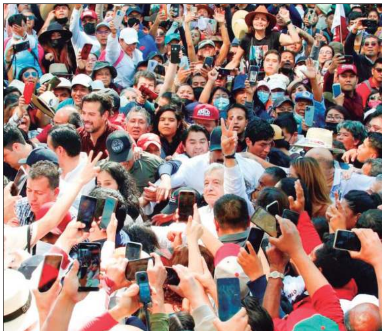
▲ "Fue sólo, por un auténtico levantamiento popular expresado en las urnas en 2018, un alud de votos que no pudo ser ignorado, que llegó a la presidencia López Obrador. Y entonces comenzó a cambiar la historia".

FUE SÓLO, POR un auténtico levantamiento popular expresado en las urnas en 2018, un alud de votos que no pudo ser ignorado, que llegó a la presidencia López Obrador. Y entonces comenzó a cambiar la historia y se inició lo que podemos considerar como antecedentes inmediatos de la definición del nuevo rumbo que tomamos en México el domingo pasado. Sobre las obras efectivamente realizadas, las leyes e insti-