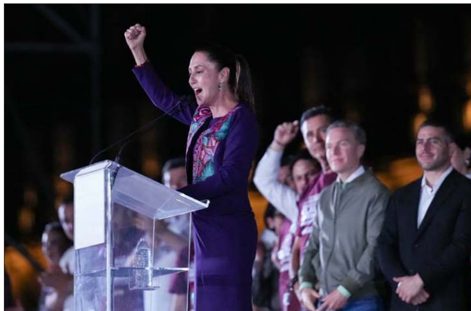
▲ Mandatarios del mundo y dirigentes de instituciones saludaron a la que será la primera presidenta de México, Claudia Sheinbaum, abanderada de Sigamos Haciendo Historia .

El primer ministro de Canadá, Justin Trudeau, hizo