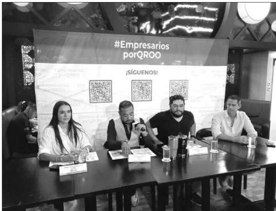
▲ Paneles, conversatorios e inteligencia artificial dentro de los negocios formarán también parte del Congreso de la Federación Mundial de Contratistas.

"Estos temas son para la productividad en la em-