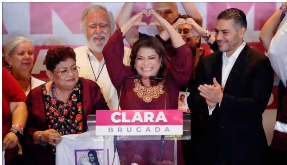
▲ Con una diferencia de al menos 12 puntos, la candidata de los partidos Morena, Verde Ecologista y del Trabajo, Clara Brugada Molina, se convertirá en jefa de Gobierno de la Ciudad de México para el periodo 2024-2030.