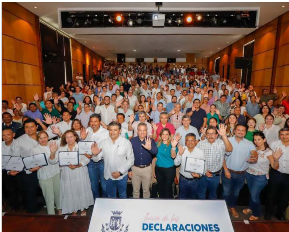
▲ “Debido a que mayo es el mes establecido por la citada Ley para la presentación de esta declaración en su modalidad anual, es de vital importancia que el personal esté preparado”: Ruz.

Finalmente, mencionó que todas y todos los servidores públicos municipales, independientemente de su nivel jerárquico, que ingresaron al Ayuntamiento antes del presente año 2024, realizaron su declaración de manera anual.