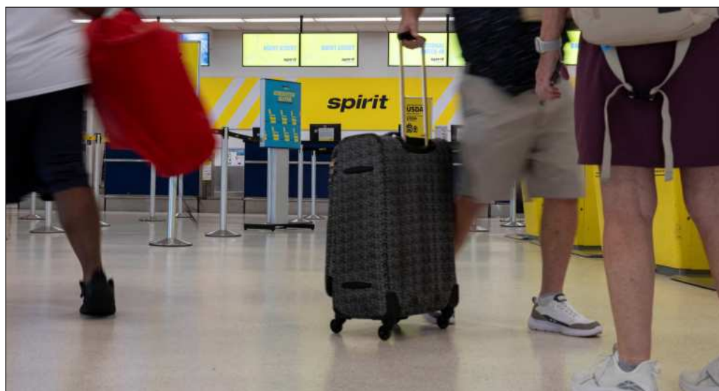
▲ El efecto de la desaparición de Spirit fue inmediato: la salida del mercado de la low-cost sirve como ejemplo de la espiral inflacionaria desatada por las decisiones de Trump.

Sin tener ninguna responsabilidad en las conductas erráticas del mandatario estadounidense ni participación en las iniciativas imperiales de Washington, México también resiente los efectos del trumpismo: debido a la guerra contra Teherán y la incertidumbre global sembrada por el magnate, entre enero y marzo el producto interno bruto de nuestro país cayó 0.8 por ciento respecto al trimestre inmediato anterior, retroceso acompañado por una menor confianza de los consumidores en la economía. Aunque a primera vista la crisis energética europea y los sobresaltos económicos de México parezcan eventos aislados, con una mirada de conjunto se vuelve evidente que ambos hechos constituyen una advertencia acerca de la necesidad global de reducir la exposición a las decisiones tomadas en la Casa Blanca y a reforzar un auténtico multilateralismo que evite al mundo quedar a expensas de la oligarquía estadounidense.