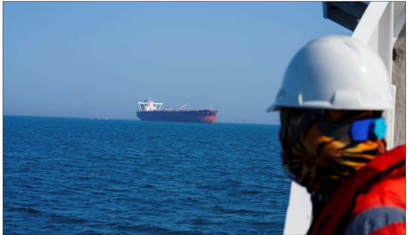
▲ El grupo quiere transmitir “un mensaje doble”: que la salida de los Emiratos no alteraría el funcionamiento de la OPEP+.

También se produce tras la decisión de Emiratos Árabes Unidos de abandonar la OPEP, lo que sacude la alianza de 65 años que produce cerca