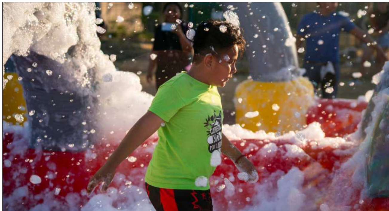
▲ Más que una carrera, fue una verdadera fiesta familiar donde los pequeños participaron en dinámicas, circuitos y actividades diseñadas para aprender, de forma divertida, la importancia de cuidar el agua.

“La Carrera Kids por el Agua es un espacio donde las niñas y los niños no solo se divierten, sino que también descubren cómo pueden cuidar su entorno desde hoy. Creemos en su capacidad para generar cambios positivos y queremos acompañarlos