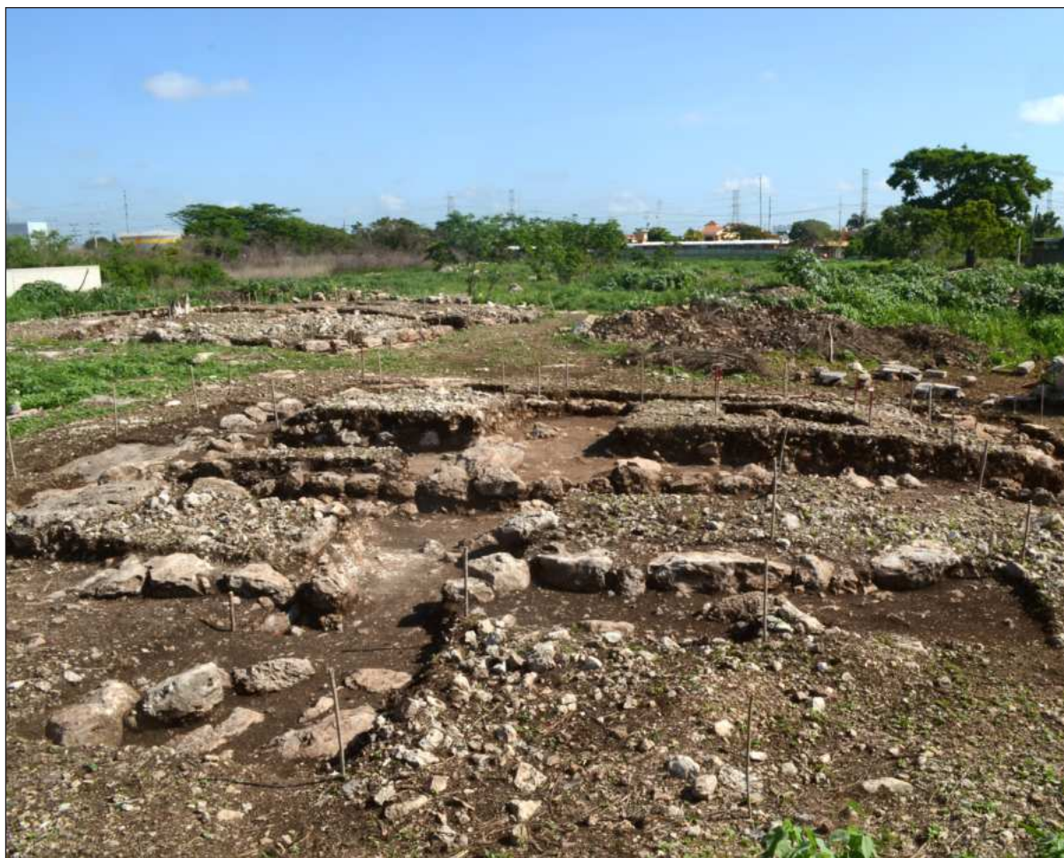
▲ "La propuesta de la localidad, emergida desde lo comunitario para coadministrar activamente el sitio de Mayapán, reconoce la complejidad de formas de relación, valoración, y la consideración de beneficios laborales y de dinamización económica".

Siga nuestras investigaciones en: http://orga.enesmerida.unam.mx/ ; https://www.facebook.com/ORGA.UNAM/ ; https://www.instagram.com/orgaunam/ y @ORGA_UNAM_