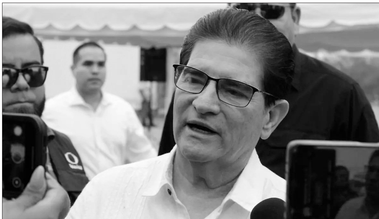
▲ Sergio Méndez en reiteradas ocasiones hizo llamados a madres y padres de familia para fortalecer la prevención social y evitar que menores de edad fueran captados por grupos delictivos. Incluso, el llamado era para reformar la ley.

El funcionario concluyó sus funciones el pasado viernes 1 de mayo al cumplir 5 años