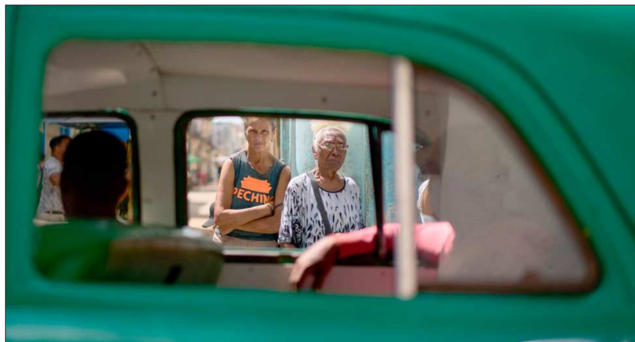
▲ Cuba y EU enfrentan su peor momento en décadas, luego de que Trump impusiera un cerco energético a la isla.

El discurso del mandatario publicado por medios de prensa oficiales el domingo se produjo el sábado, en un encuentro con grupos de solidaridad con la isla y llegó un día después de que el mandatario Donald Trump firmara una nueva