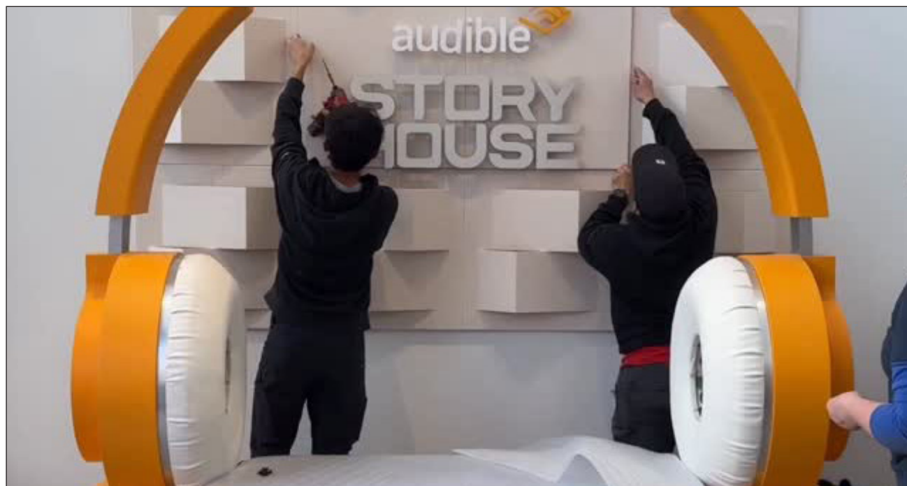
▲ Los audiolibros se presentan en forma de tarjetas que pueden insertarse en lectores y escucharse a través de auriculares.

Según explicó en una presentación realizada el