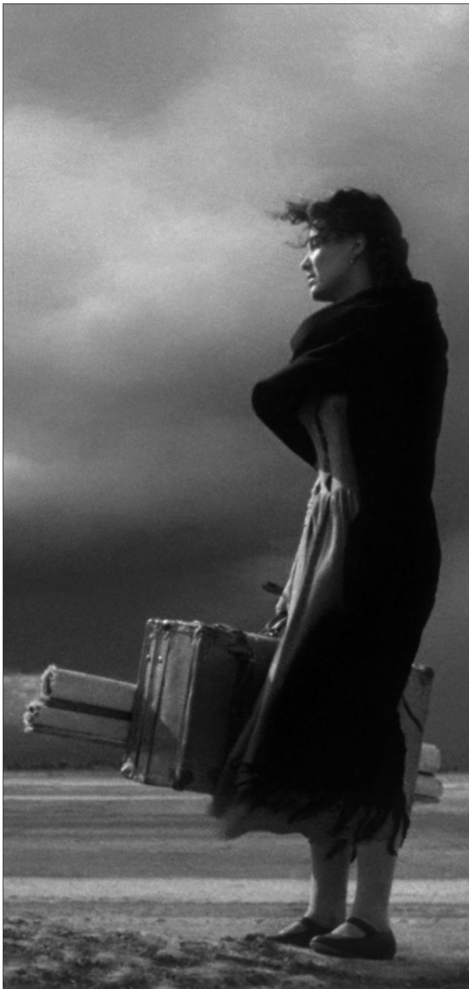
▲ "Gabriel Figueroa también llevó a la 'pantalla de plata' grandes obras de la literatura: Macario y La rosa blanca, de B. Traven, protagonizadas por Ignacio López Tarso".

A mis 94 años me tocó admirar la Época de Oro del cine Mexicano, así como entrevistar a las luminarias de entonces: María Félix, Dolores del Río, Pedro Vargas, Mario Moreno Cantinflas , Jorge Negrete, Prudencia Grifell y a Sara García gracias a Juan de la Cabada, Elena Garro y Josefina Vicens, quienes crearon a las malévolas Señoritas vivanco y nos acompañan hasta el día de hoy en el firmamento del cine nacional.