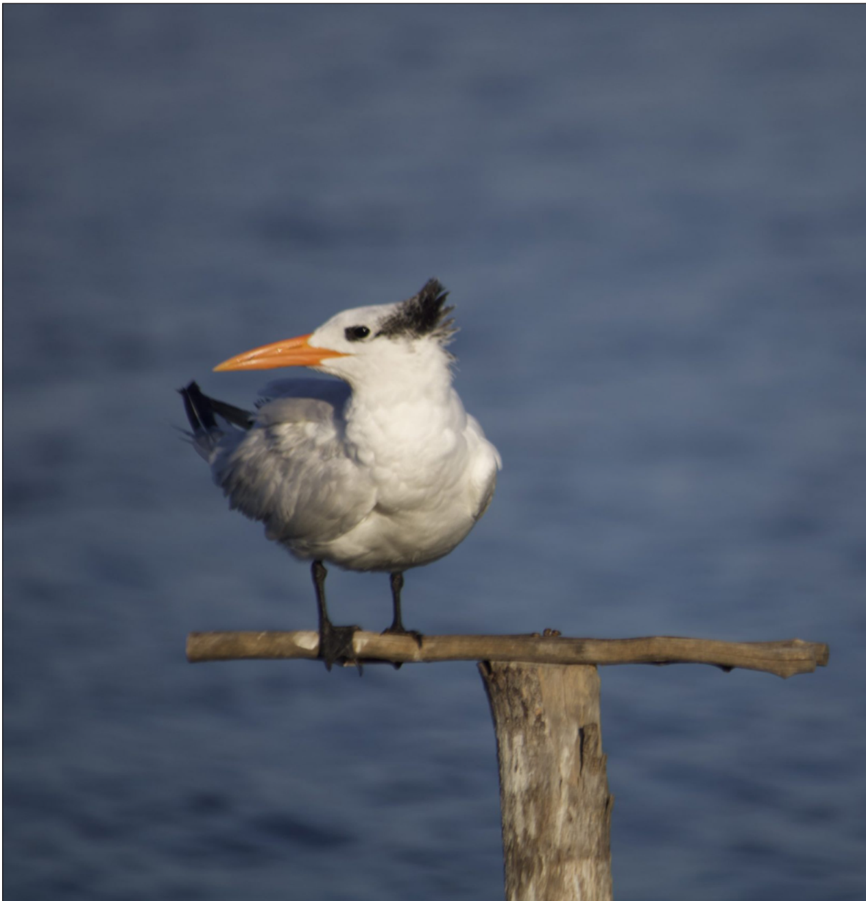
▲ Uno de los problemas que enfrenta la especie es la proliferación de fauna callejera en la zona.

Sostuvo que la zona de mayor incidencia de saqueo de huevos y ataques a las hembras, es el área costera de la Villa Isla Aguada, ya que por su cercanía con las playas.