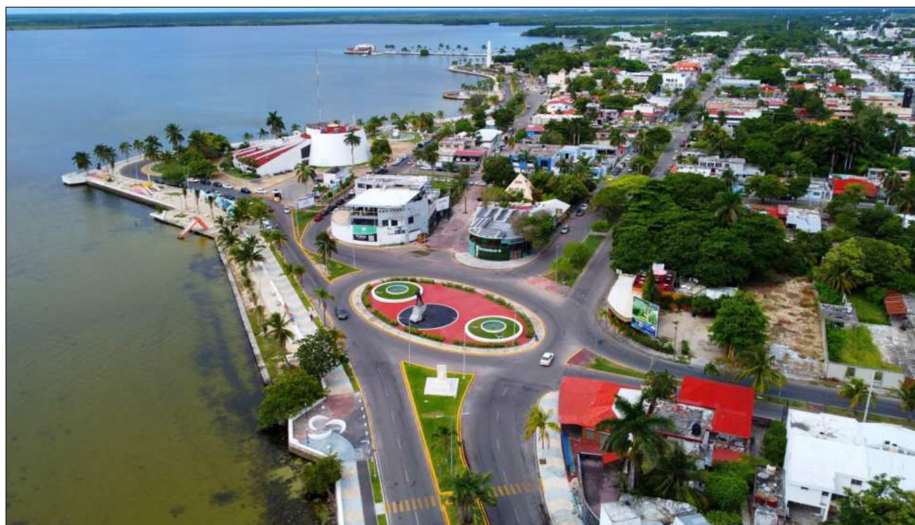
▲ Los avances representan un paso clave para la economía del sur de Quintana Roo, asegura la Sede.

Hasta el momento, 17 empresas han mostrado un interés formal en el polo