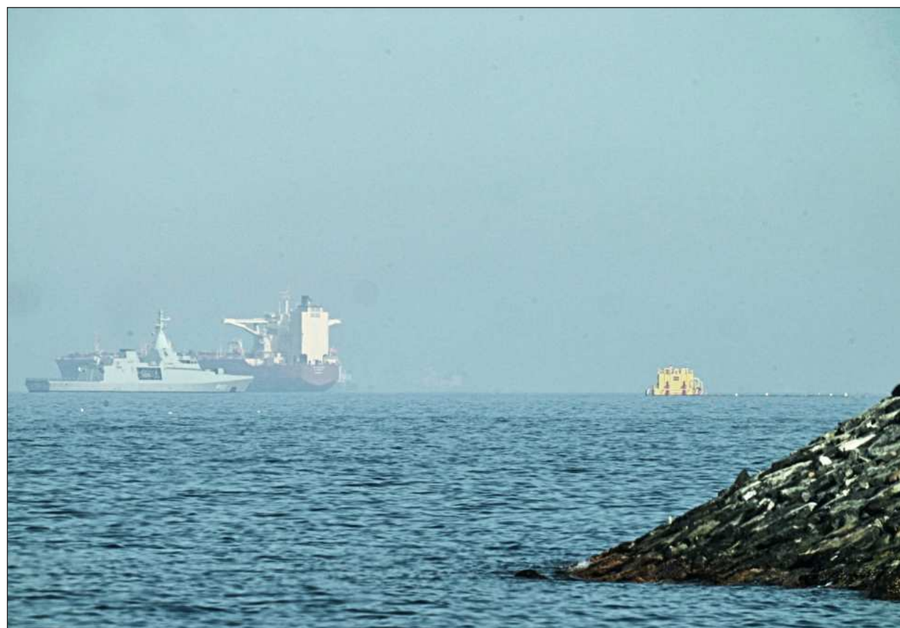
▲ La iniciativa involucraría la participación de destructores con misiles guiados, más de 100 aeronaves y 15 mil soldados.

Proyecto Libertad comenzará el lunes por la mañana en Medio Oriente, afirmó Trump, que añadió que sus representantes están teniendo conversaciones con Irán que podrían conducir a algo "muy positivo para todos".