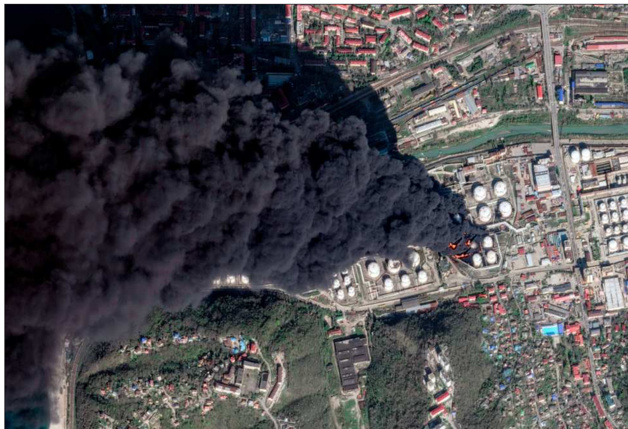
▲ Las terminales de exportación petrolera en la región de Leningrado, fueron el principal objetivo de los ataques ucranianos.

Según la fuerza aérea de Kiev, Rusia lanzó 268 drones