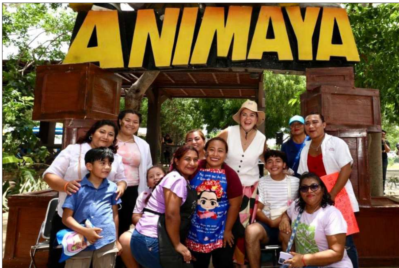
▲ Animaya se vistió de fiesta con un programa que incluyó presentaciones artísticas y espectáculos.

Destacaron los personajes e imitadores de artistas infantiles, así como la participación de Guerreras K-pop, el Show de Mario Galaxy y un espec-