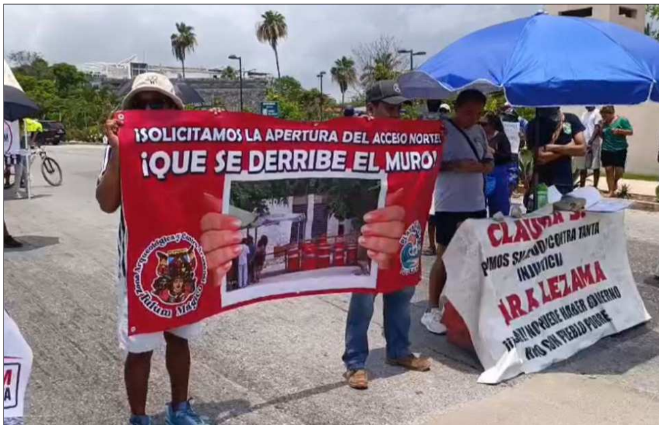
▲ La protesta estuvo integrada por defensores de playas libres, artesanos y vendedores de tours.

Los manifestantes cerraron de forma alternada los carriles, generando afectaciones viales