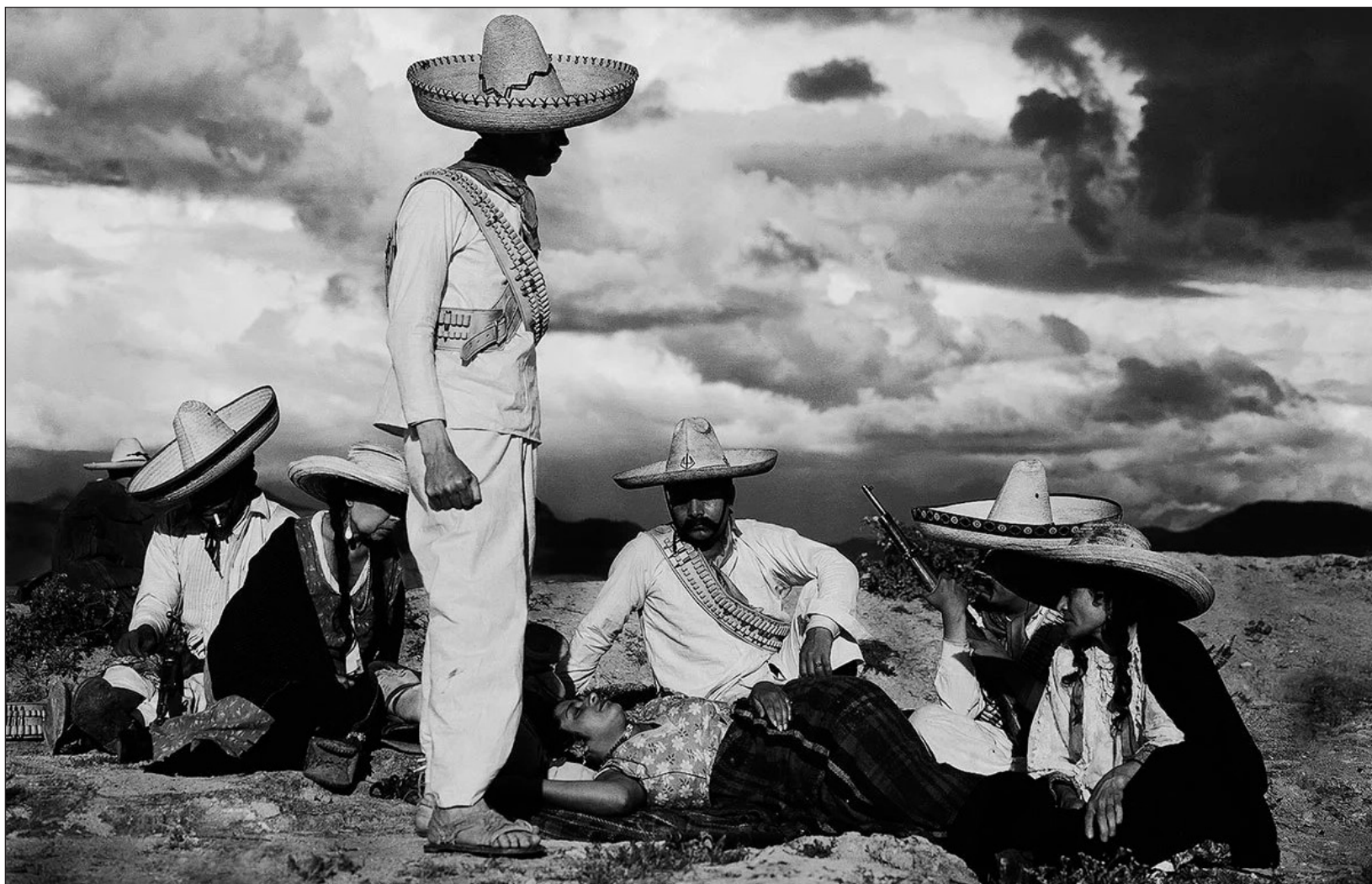
▲ “El cine nacional no pudo apartar sus luces ni sus sombras de la mirada de Gabriel Figueroa, quien inició la Época de Oro del cine mexicano”. Foto Gabriel Figueroa

“Ser maestro de diario o de tres veces por semana, a ir a dar cátedra, para mí es muy difícil”, contaba Figueroa