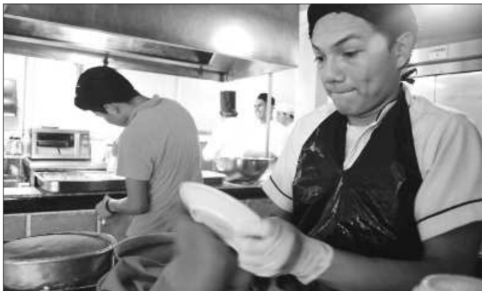
▲ El pasado 28 de febrero, la Comisión de Trabajo y Previsión Social del Senado de la República aprobó el cambio para que el pago se eleve de 15 a 30 días.

“Si esto es aprobado ya finalmente y aumenta, tendríamos que producir en las empresas un mes más de trabajo para poder pagarlo, es decir, se trabajan 12 meses en un año y tendríamos que cubrir 13 meses. Es una realidad que para muchas pequeñas y medianas em-