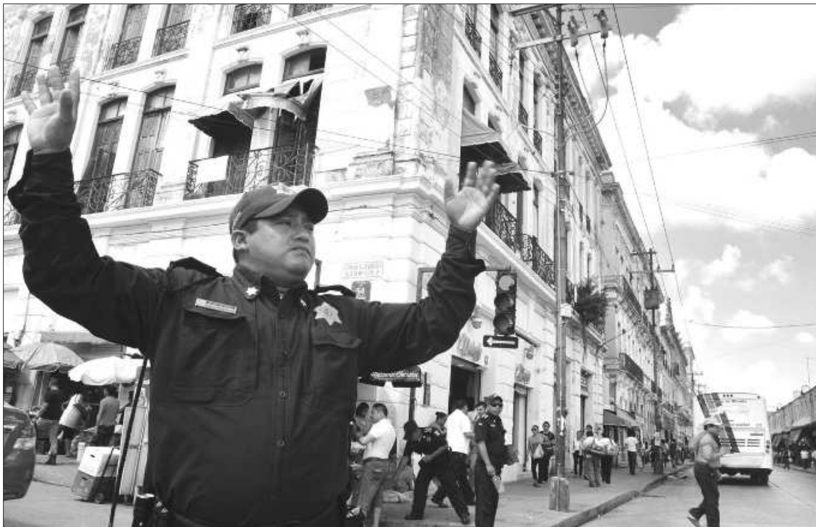
▲ Mediante el programa Yucatán Seguro, el gobierno del estado está dotando de equipamiento, tecnología y fuerte capacitación a la policía.