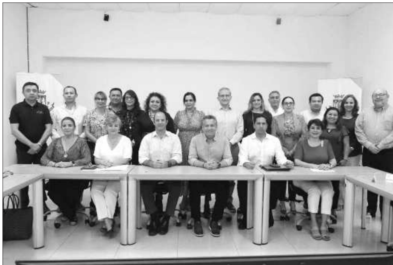
▲ El Consejo Consultivo del Presupuesto y Ejercicio del Gasto del Municipio de Mérida está integrado por 22 elementos: 10 funcionarios Públicos Municipales y 12 representantes de cámaras, colegios, instituciones y ciudadanos.

El Consejo Consultivo del Presupuesto y Ejercicio del Gasto del Municipio de Mérida está integrado por 22 elementos: 10 funcionarios Públicos Municipales y 12 representantes de cámaras, colegios, instituciones y ciudadanos, es decir un poco más del 50 por ciento de sus integrantes son parte de la sociedad civil.