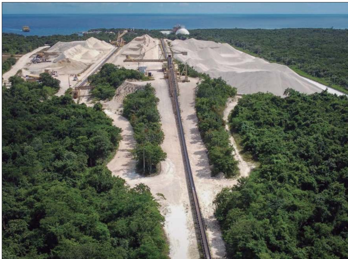
▲ “Más de dos décadas de extracción masiva de roca caliza, con permisos, concesiones y dictámenes favorables en materia de impacto ambiental obligan a revisar los procedimientos de evaluación de la autoridad”.

Algo más de dos décadas de extracción masiva de roca caliza, con permisos, concesiones y dictámenes favorables en materia de impacto ambiental obligan a revisar los procedimientos de evaluación de la autoridad ambiental. Quizá se debe a la avalancha de manifiestos de impacto de las múltiples obras y acciones públicas y privadas que se emprenden año con año en el país, pero lo que parece estar sucediendo es que