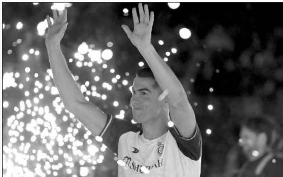
▲ Cristiano Ronaldo acordó la rescisión de su contrato con el Manchester United en noviembre, previo al inicio del Mundial de Qatar, donde jugó como capitán del representativo de Portugal. Foto Afp

Impecablemente vestido con traje oscuro, camisa blanca y corbata azul ce-