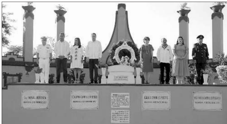
▲ La ceremonia oficial en memoria del gobernador socialista Felipe Carrillo Puerto tuvo lugar en el Cementerio General, en el monumento levantado donde fue fusilado en 1924.

prócer yucateco encabezó la repartición de 664 mil 835 hectáreas a más de 34 mil campesinos de la región; construyó carreteras como estrategia para el desarrollo agrícola y comercial; además de haber propuesto iniciativas de leyes que buscaban transformar diversos ámbitos del Estado, e incluso algunas de