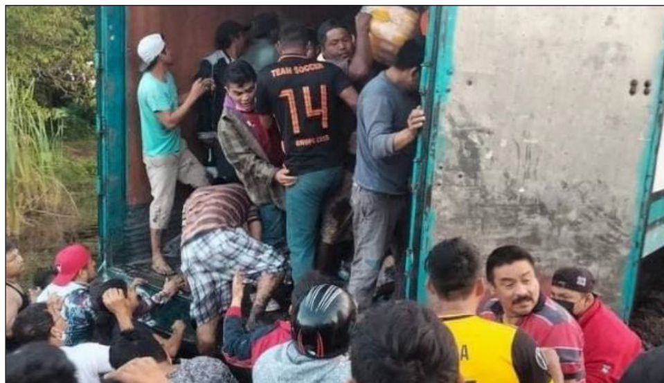
▲ En los saqueos, los perpetradores obtienen abarrotes, materiales de construcción, animales de granja, cervezas, electrodomésticos y diversos comestibles.

Cabe destacar que los actos de rapiña, desde septiembre del 2021, son calificados como delito de robo simple, sancionado con prisión de seis meses a dos años, aunque ha quedado sólo en ley, pues las autoridades policíacas al llegar al lugar de los hechos perma-