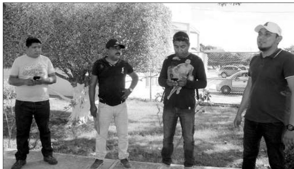
▲ La Secretaría de Desarrollo Territorial, Urbano y Obras Públicas ha indicado a los ex trabajadores que el motivo de su baja es que no hay recursos para recontratarlos.

Estos aprovecharon que había decenas de trabajadores haciendo fila para cobrar su nómina y otros trabajos, pidieron el apoyo a los medios de comunicación para dar a conocer su situación y sobre todo, manifestar su molestia pues todos se cuestionaban “en dónde encon-