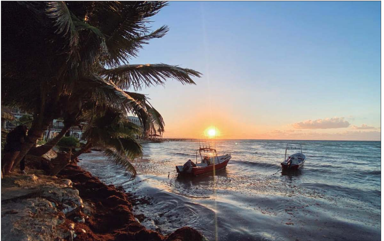
▲ “Girasoles abriendo sus pétalos, como brazos que se desperezan, para darle la bienvenida al sol y a sus rayos, que son su alimento. El cenit, y ver cómo tu sombra desaparece, se aventura sin el lastre de tu cuerpo para luego recapacitar y regresar de la mano con el ocaso”.