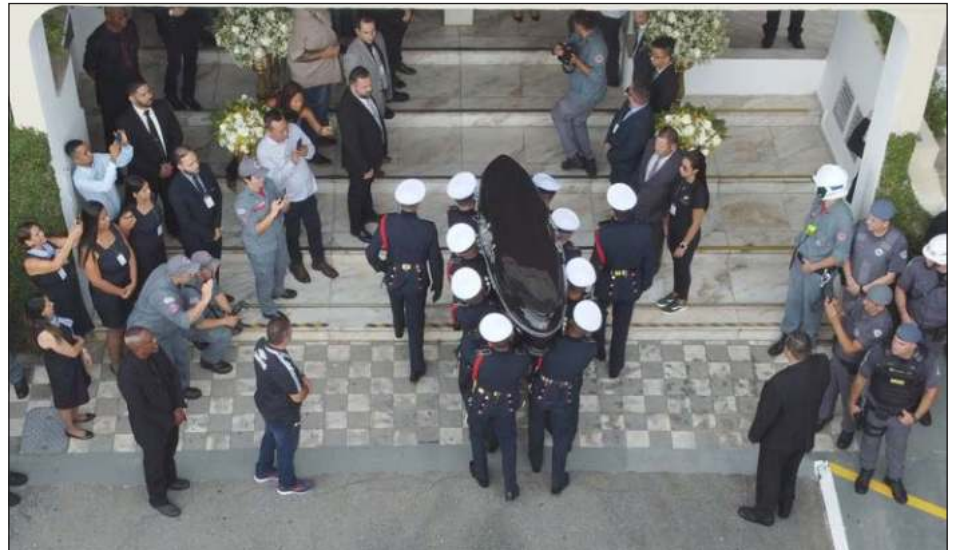
▲ El mandatario brasileño, junto con la primera dama Janja, visitó el velorio en el centro del terreno del estadio donde Edson Arantes do Nascimento jugó durante casi toda su carrera.

El cuerpo de Pelé permanecerá en el primer piso en un mausoleo que recuerda un estadio de fútbol, inclusive con césped sintético en el suelo, e imágenes del Rey alrededor del féretro.