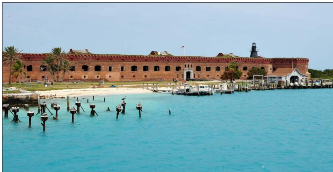
▲ El parque "cerrará temporalmente el acceso al público mientras las autoridades y personal de salud evalúan, proveen cuidados médicos y coordinan el transporte hasta Cayo Hueso para aproximadamente 300 migrantes", señala un comunicado.

"Como cualquier otro lugar en los Cayos de la Florida, el parque ha visto recientemente un incremento