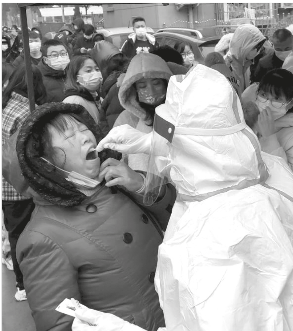
▲ Las autoridades chinas habían anunciado antes que, a partir del 8 de enero, los viajeros procedentes del extranjero ya no tendrían que hacer cuarentena a su llegada al país.

Las autoridades chinas habían anunciado antes que, a partir del 8 de enero, los viajeros procedentes del extranjero ya no tendrían que hacer cuarentena a su llegada al país, lo que allanó el camino para que la población volviese a salir del país.