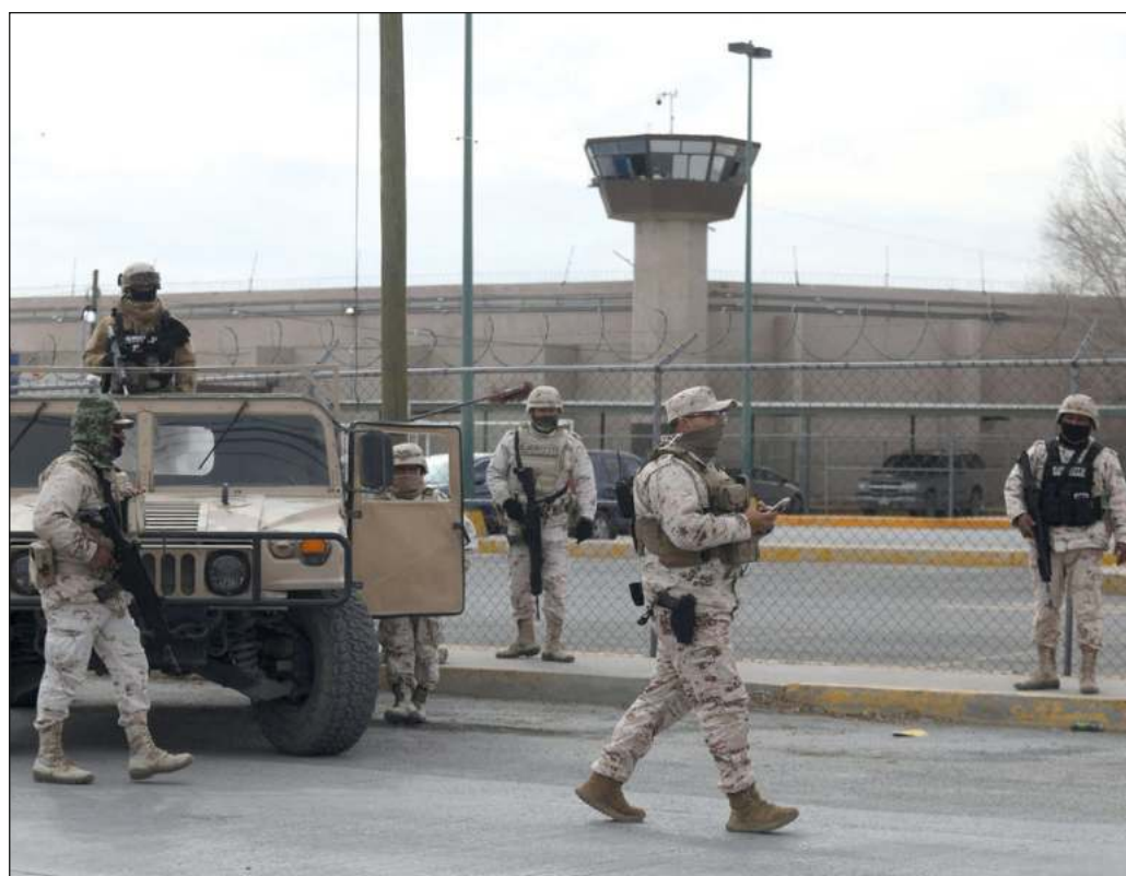
▲ En el Cereso 3 de Ciudad Juárez, es un secreto a voces que los grupos del crimen organizado actúan con total impunidad y no enfrentan ningún impedimento para conducir sus actividades criminales.