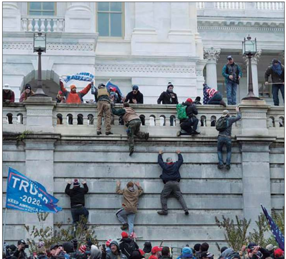
▲ Este viernes se cumplen dos años del asalto al Capitolio, en Washington.

El jefe de Policía detalló las medidas adoptadas, entre las que destacan la incorporación de un nuevo director de Inteligencia o la capacidad de la Unidad de Disturbios Civiles. El Congreso aprobó una legislación para permitir al jefe de la USCP que declare un estado de emergencia.