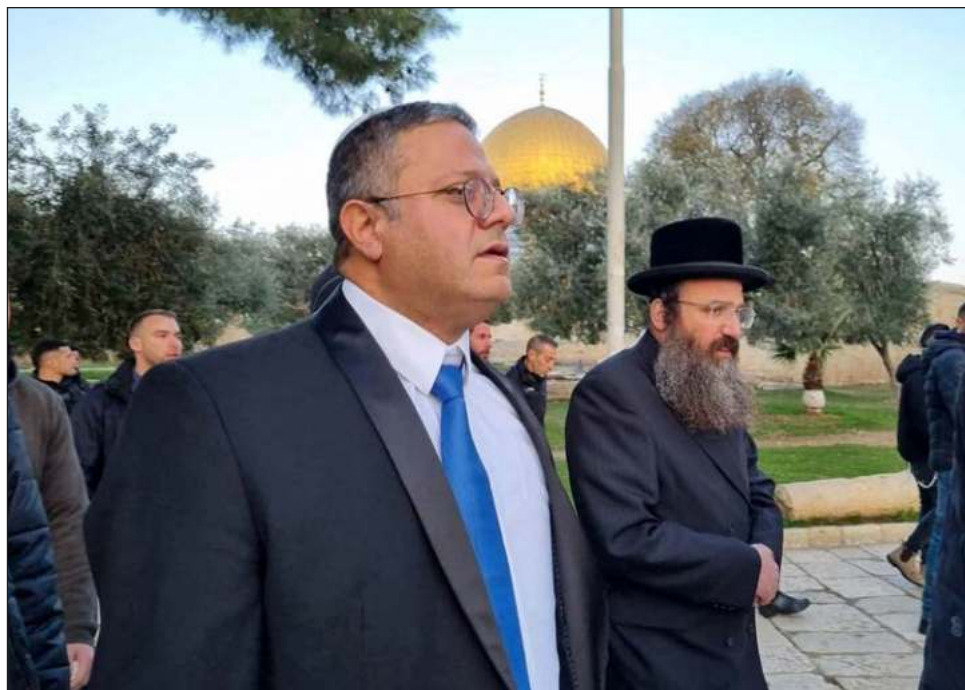
▲ Ben Gvir, miembro del gobierno más derechista que ha tenido Israel, estuvo acompañado por miembros de las fuerzas de seguridad, mientras un dron sobrevolaba la explanada.

Itamar Ben Gvir, que estuvo allí varias veces como