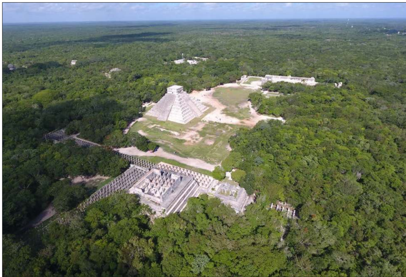
▲ Comerciantes, guías de turistas y pobladores de las comunidades de Pisté, X-Calakooop y San Felipe mantienen bloqueados desde el lunes los accesos a estos pueblos, impidiendo el paso a la Zona Arqueológica de Chichén Itzá.

También informaron que la Zona Arqueológica de Chichén Itzá permanecerá abierta al público, y el despliegue de 50 elementos de la Guardia Nacional que custodiarán las instalaciones federales del sitio.