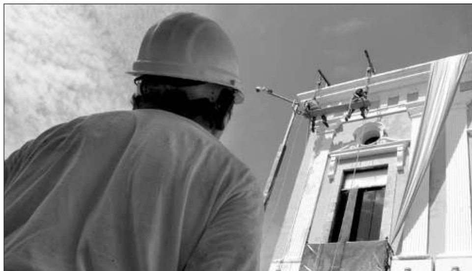
▲ El aumento al salario de los trabajadores al servicio del estado y los municipios se hará efectivo a partir de la primera quincena de enero.

Producto de la labor coordinada entre Vila Dosal y el dirigente sindical, la Secretaría de Administración y Finanzas (SAF) informó que dicho incremento es para trabajadores con base que alcanzan un sueldo mensual de menos de 21 mil pesos, mientras que los per-