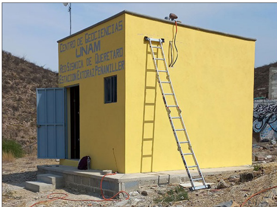
▲ El sistema está integrado por 10 estaciones de banda ancha y de periodo intermedio, así como 20 acelerómetros de bajo costo que podrán caracterizar los movimientos del terreno.