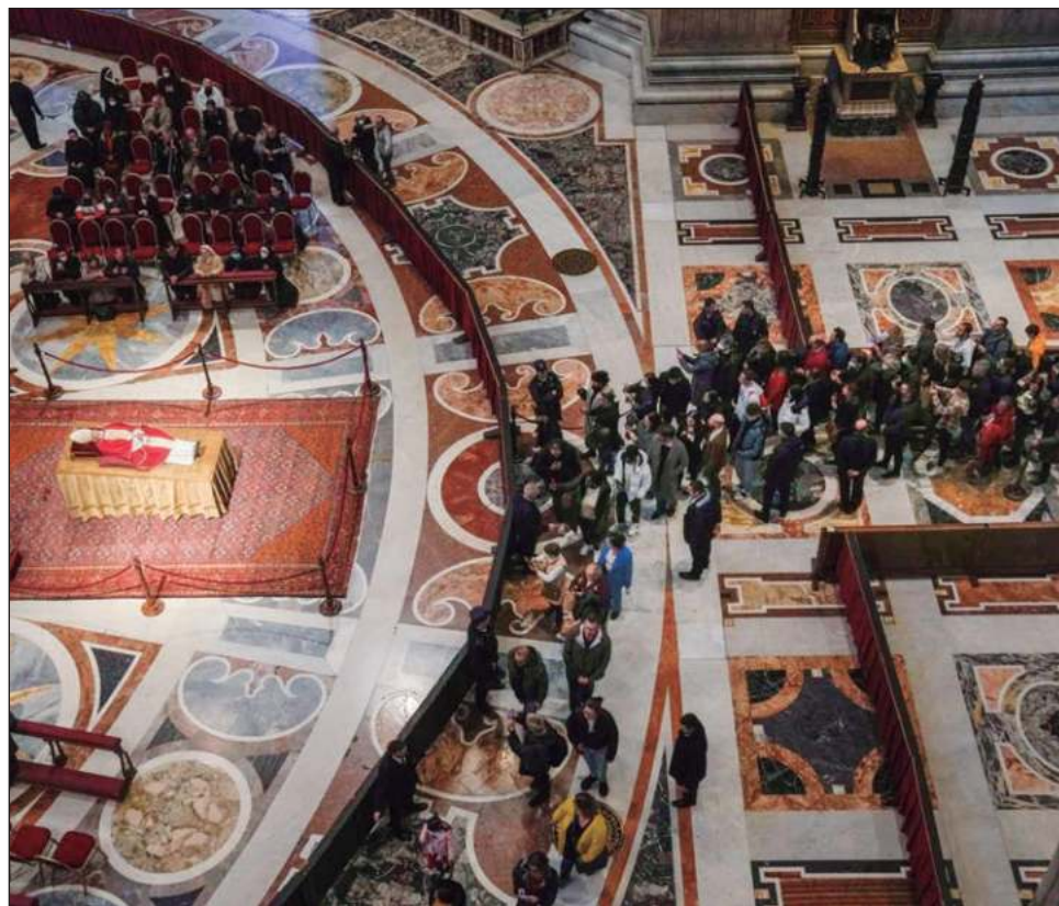
▲ El cuerpo del papa emérito yace en la Basílica de San Pedro, en Ciudad del Vaticano.

Unas 25 mil personas pasaron frente al cuerpo del pontífice en las primeras cinco horas del martes, in-