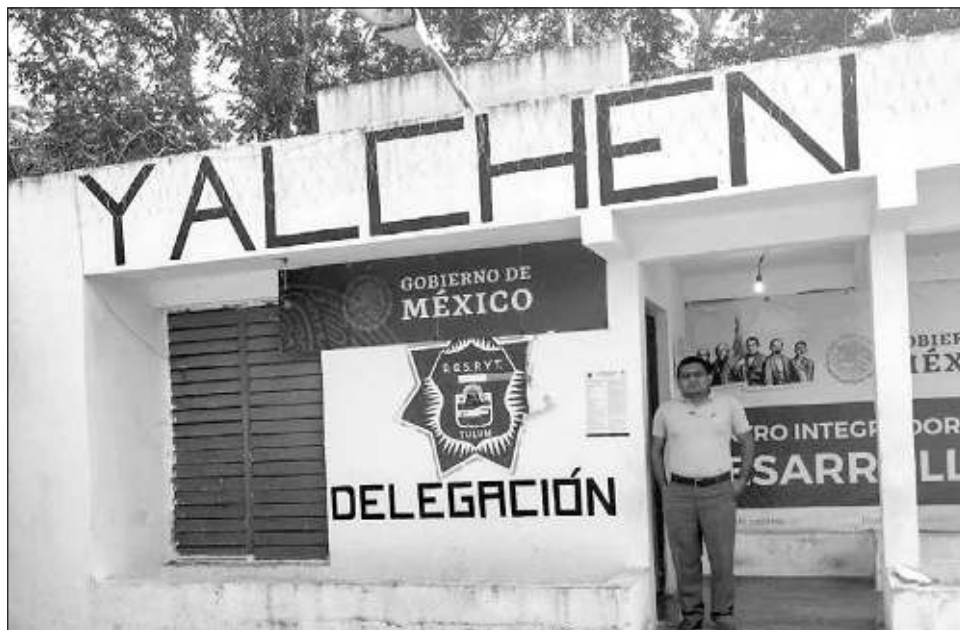
▲ El municipio de Felipe Carrillo Puerto recibió recursos federales para atender a San Silverio y Yalchén, además de negarse a ceder las localidades a Tulum.