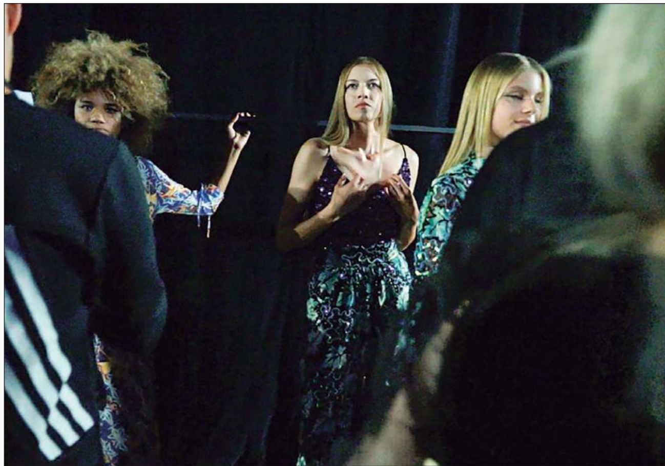
▲ El pago por el trabajo que realizan las y los modelos depende de la política de los clientes o compañías y tardará en ser entregado entre uno o tres meses, y a algunos hay que recordarles el incumplimiento.

Las agencias, sostiene Souza, sólo fungen como contacto entre las modelos y los clientes, aunque, admite, se necesita un contrato de exclusividad "para que sólo