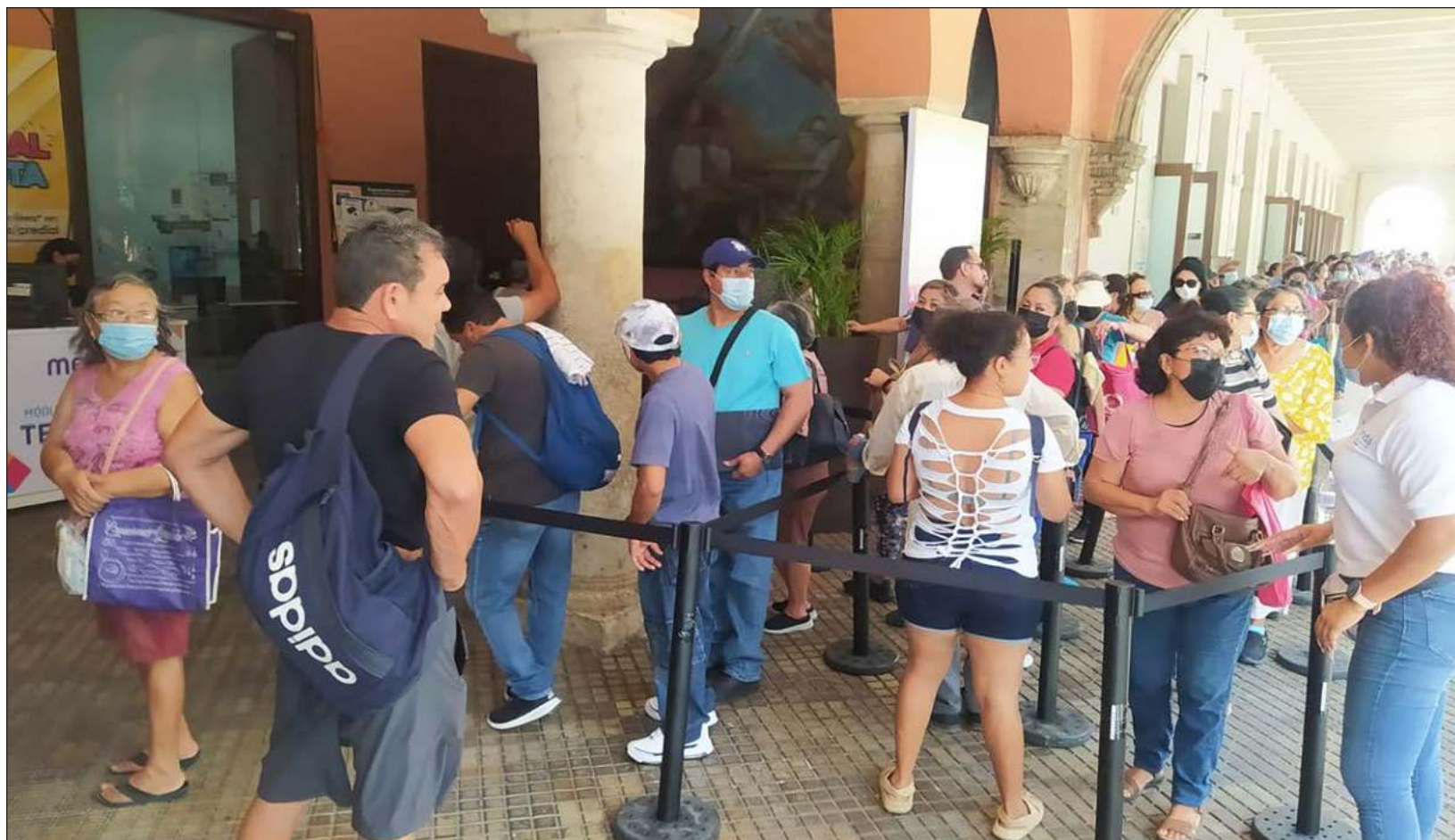
▲ Quienes realicen el pago del impuesto predial en enero obtendrán un descuento de 30%, lo cual resulta atractivo para muchos meridianos que suelen realizar largas colas en los módulos de la Tesorería. Quienes opten por pagar en línea tendrán un beneficio adicional.

En este caso, quienes poseen el predio y realizarán obras de rescate o remodelación pueden acudir a la Dirección de Finanzas y Tesorería Municipal para registrar su inmueble y solicitar el estímulo que puede librarles del pago del predial.