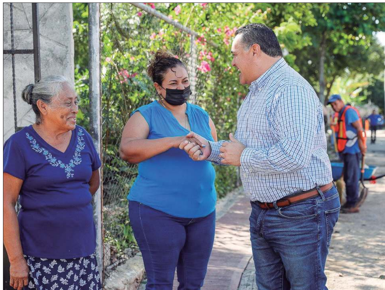
▲ En la presente administración se han realizado en la comisaría seis acciones de vivienda.