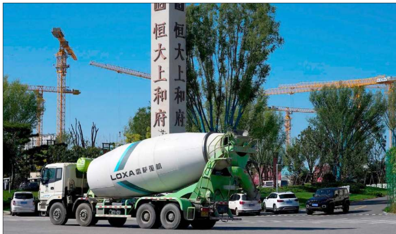
▲ Durante 2022, el gigante inmobiliario chino entregó 301 mil unidades residenciales a compradores de vivienda, según indicó su presidente Hui Ka Yan en un correo. En la imagen, un camión de cemento pasa junto a un desarrollo de Evergrande en Beijing.

En un correo electrónico visto por AFP, el presidente Hui Ka Yan dijo al personal que “2023 es un año clave para Evergrande para cumplir con su responsabilidad corporativa y hacer todo lo posible para garantizar la entrega de los proyectos de construcción”.