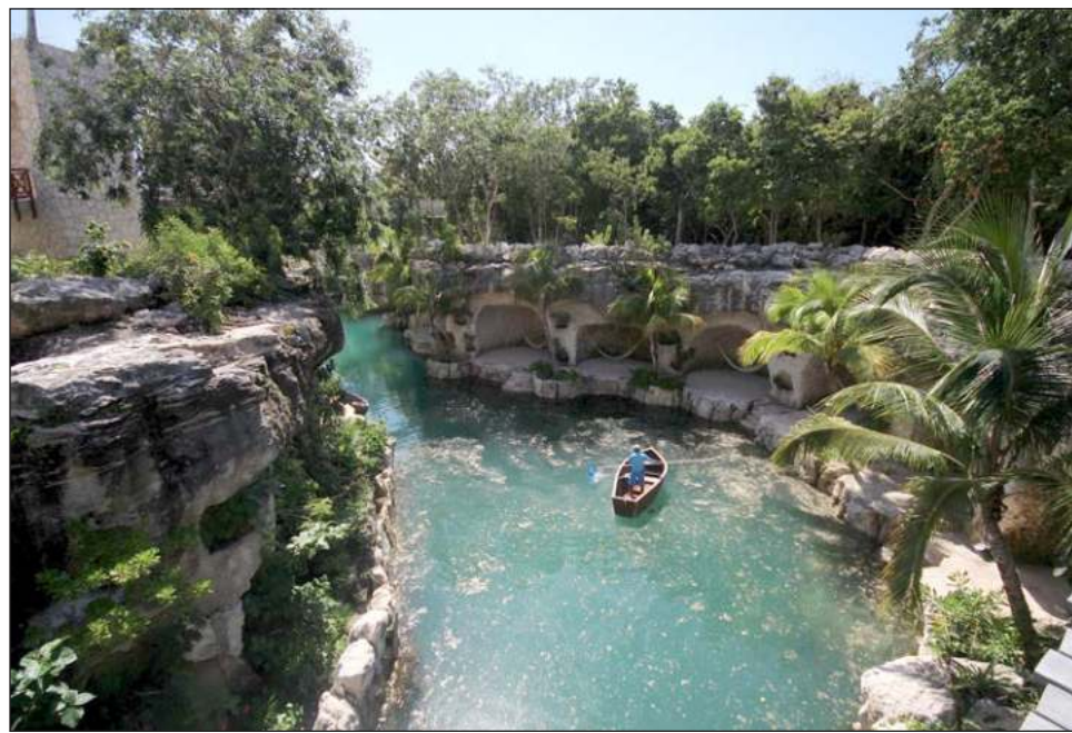
▲ Actualmente, el costo de la entrada a Xcaret, que incluye el acceso a la zona arqueológica de Polé, es de 2 mil 300 pesos para un adulto y mil 500 por niño.

Ese acuerdo fue renovado en 2018, último año de la administración del entonces presidente Enrique Peña Nieto y antes de que se venciera el plazo en 2019. El INAH ratificó en ese