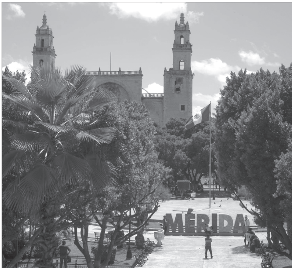
▲ La baja incidencia delictiva es clave en la calificación de Mérida.

Además, este estudio aborda la gestión integral del riesgo que deben tener las ciudades resilientes y presenta recomendaciones de política pública.