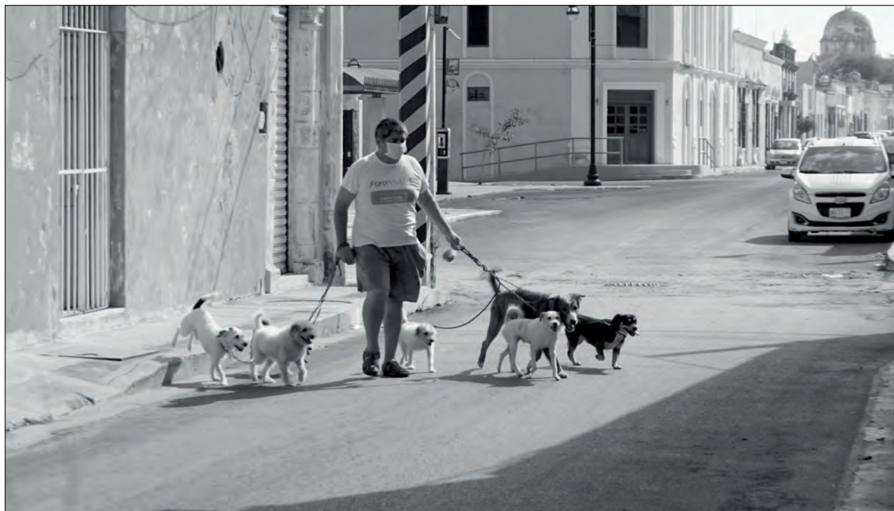
▲ Aunque la pirotecnia disminuyó en comparación con 2019, en ciertas zonas de Mérida fue la suficiente como para alterar a los animales domésticos y provocar que escapan de su casa.

De los 35 animales reportados, únicamente dos canes han vuelto con sus familias