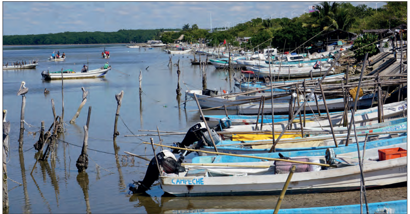
▲ En la pesca ribereña abundan el equipo deteriorado, desconocimiento de mejores prácticas y bajo nivel de conocimientos técnicos y administrativos entre quienes la practican.

El Programa Nacional de Pesca y Acuicultura