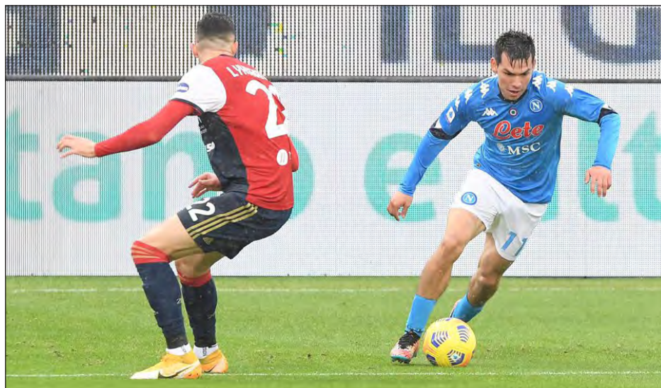
▲ Hirving Lozano fue uno de los artífices de la goleada del Nápoles.

Lozano, con otra actuaciones sobresaliente, contribuyó a la paliza de 4-1