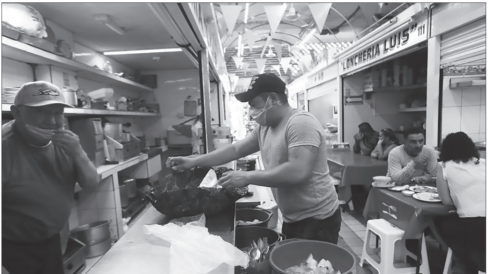
▲ Mediante el programa Hambre cero el gobierno de Yucatán pretende garantizar el acceso de la población a una vida sana y fomentar el autoconsumo.