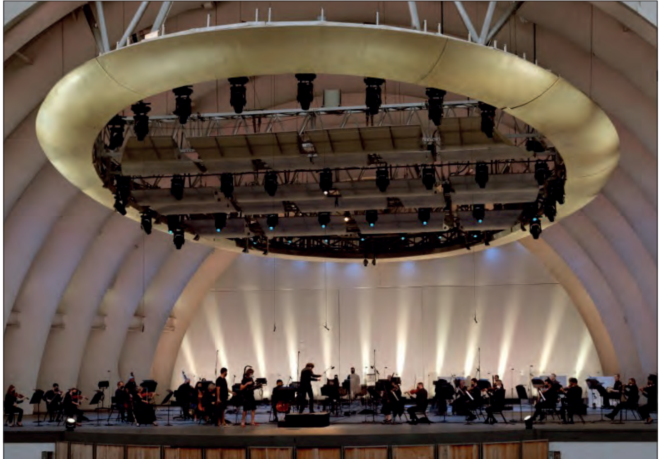
▲ Ante la emergencia sanitaria, los artistas hacen un viaje introspectivo y buscan nuevas formas de expresión.

De los encuestados por la Dirección de Difusión Cultural de la UNAM, más de 10 por ciento se definieron empleados en las siguientes áreas: autoempleo, institución gubernamental de arte y cultura, institución educativa e institución cultural o artística independiente.