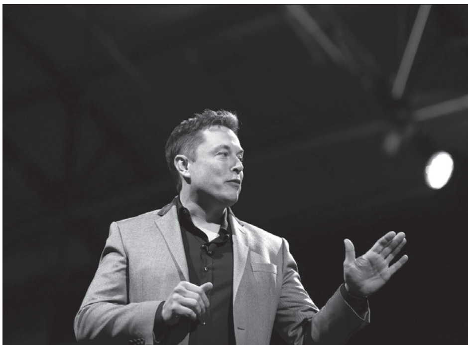
▲ Elon Musk, dueño de Tesla, aparece en el listado de Bloomberg como el segundo hombre más adinerado, con una cartera de 170 mil millones de dólares.