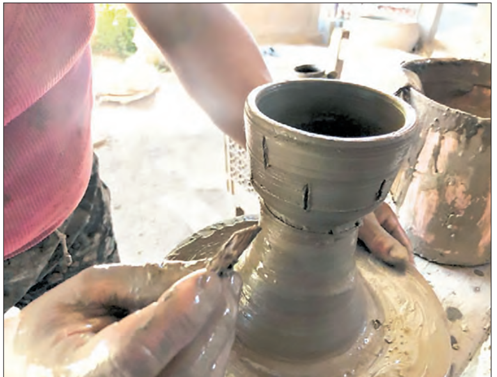
▲ El barro con el que están realizadas las piezas proviene de los cerros de Chihuitán.

Para elaborar una pieza de alfarería, el proceso es extenso y laborioso, el barro lo adquieren de los cerros de la localidad de Chihuitán, Oaxaca, casi a 40 minutos de Ixtaltepec; posteriormente, se tritura y se prepara con arena, se deja reposar durante un día y después, con un torno de madera, comienzan a elaborarse las piezas. Hay algunas que tardan hasta dos días, especialmente las enormes ollas; después se introduce a un horno de leña a altas temperaturas y, finalmente, se pasa al proceso de diseño según las necesidades del cliente.