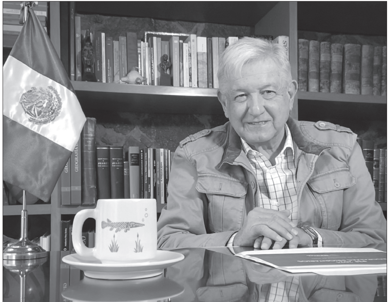
▲ En su mensaje a través de YouTube, el Presidente resaltó que México es el primer país de Latinoamérica en comenzar el proceso de vacunación contra el COVID-19.