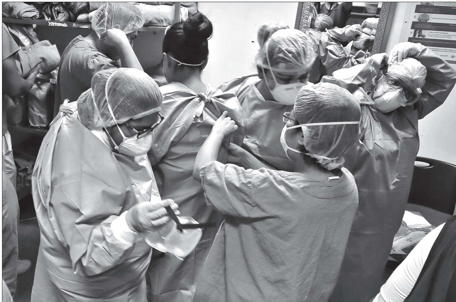
▲ Hay reyes magos vestidos de trabajadores de la salud, que, a pesar de todo el dolor que viven a diario, reparten el oro de la salud, el incienso del amor a los que sufren y fallecen solos, la mirra para todos nosotros al saber que hay más gente buena.