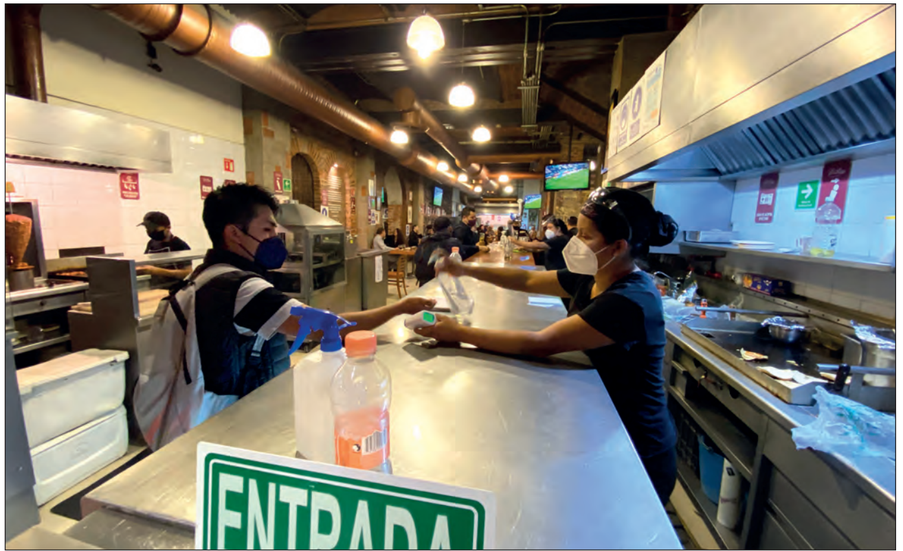
▲ Un sector particularmente golpeado por la pandemia es el de los restaurantes. Tanto ventas como afluencia de clientes repuntaron poco en diciembre, a comparación de 2019.

“Estas acciones nos afectan a todos y generan más crisis en medio de una situación que ya es complicada. Aunque este incremento es algo que se espera al inicio de cada año, cuando venimos de un año atípico en el cual las empresas se han visto gravemente perjudicadas, el gobierno federal ha tenido otra oportunidad de apoyarnos que ha dejado ir, como ha sido su costumbre a lo largo de esta pandemia”, precisó Roberto G. Cantón, presidente de la Canirac.