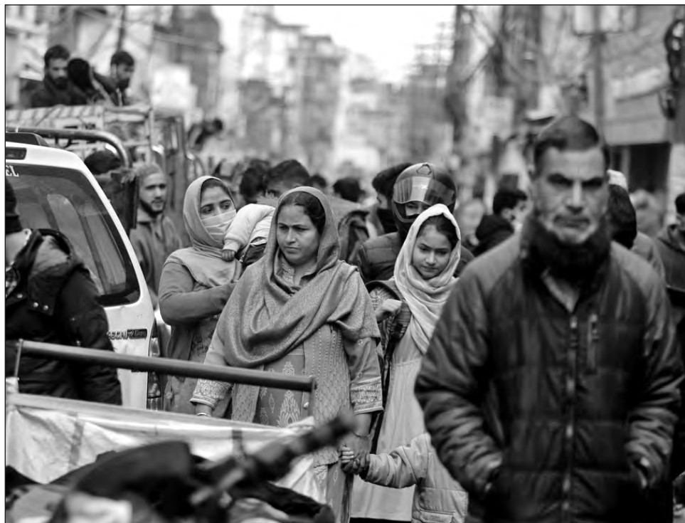
▲ La India, con mil 300 millones de habitantes, registra 150 mil muertes asociadas a la pandemia de COVID-19.

India desea inmunizar hasta a 300 millones de personas de aquí a mediados de 2021.