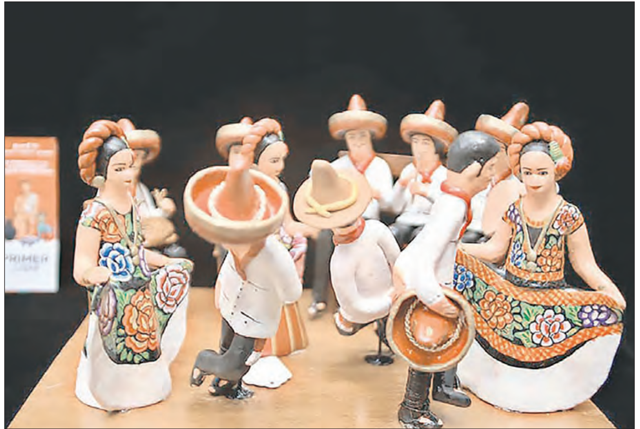
▲ Sa' Xquidxe, Fiesta del Pueblo, es la pieza que ganó en la categoría de Barro Policromado.

Con la pandemia, su taller, al igual que otros de la localidad, sufrió modificaciones en la elaboración de