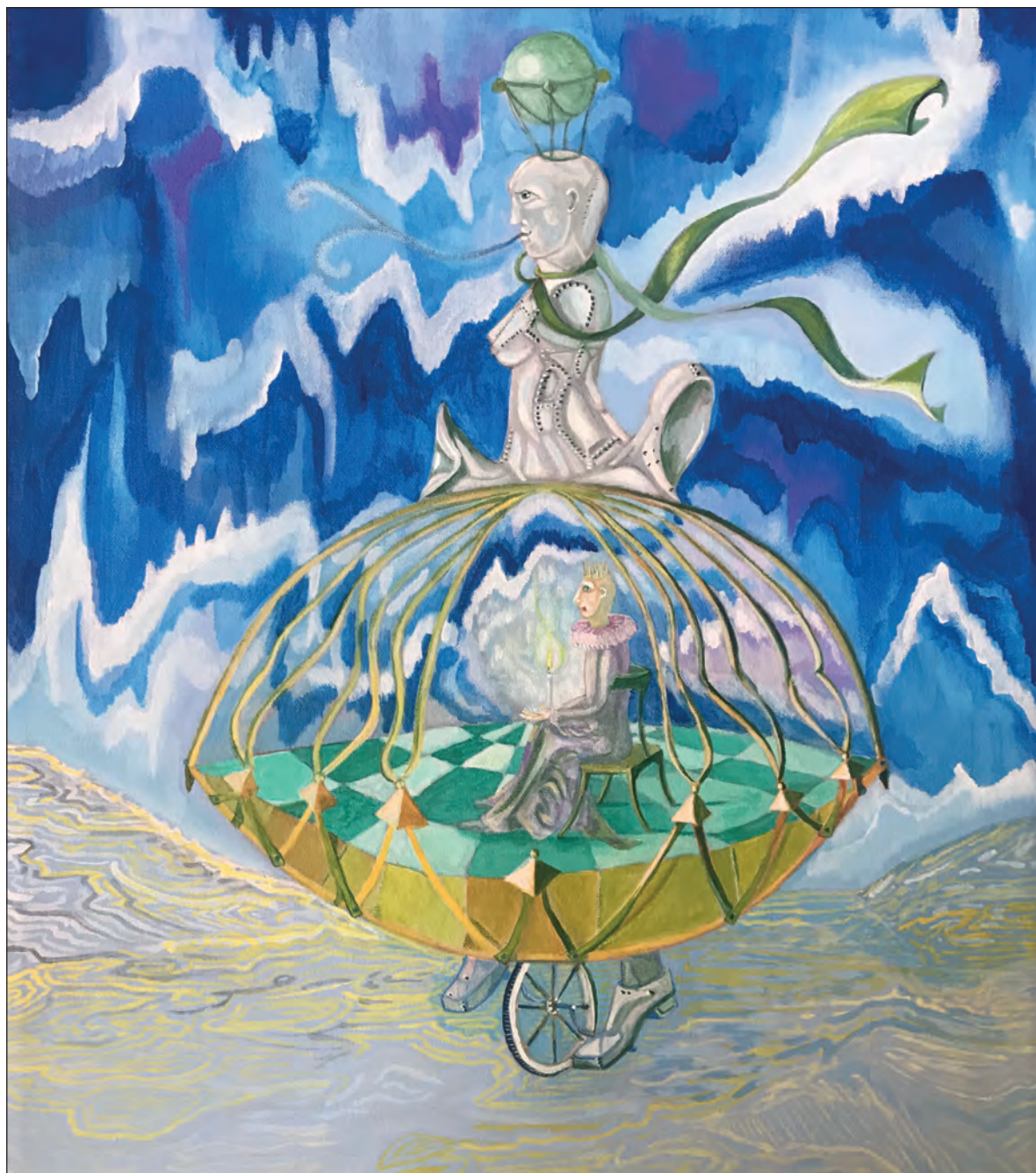
▲ En obras como Cuarentena , David Serrano invita a que observemos el encierro desde nuestra propia reclusión.

Serrano hace un llamado de atención, busca que observemos el encierro desde nuestra propia reclusión, que recorramos el laberinto desde la confusión individual. El personaje-sujeto, a partir de la identificación simbólica, se desplaza hacia otro territorio perdiendo su condición, y es esa acción-movimiento la que lo convierte en sujeto; el instante en el que la obra logra su máximo tensión, es decir, el personaje entra en un estado de enajenación dando paso a Los cobardes , El farsante , El descarado . Los personajes, en la dinámica que propone Serrano, pierden su condición primera, asumiendo todo el peso existencial del mundo: El miedo , El baile de la incertidumbre , La trampa , El Caos , Las atrapadas , por citar nombres de sus obras como ejemplo representativo. La tensión, en este pasaje procesual, traslada la escena al territorio de la identificación real, el personaje deja de ser payaso, bufón o figura mitológica para convertirse en el sujeto que asume los dolores, la angustia del ser humano, de ello dan cuenta la obra El farsante y El señor de la melancolía . El artista (re) crea un laberinto por el que deambula el personaje, ahora sujeto, confrontado con la incertidumbre, la desesperanza, el dolor, la frustra-