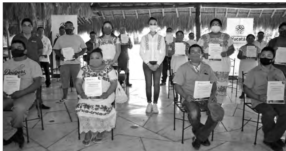
▲ El programa Apoyos de Capacitación para la Empleabilidad brinda a los yucatecos más oportunidades para superarse.

En ese sentido, la beneficiaria externó su deseo de que este programa siga apoyando a más personas y empresas, para que entre todos