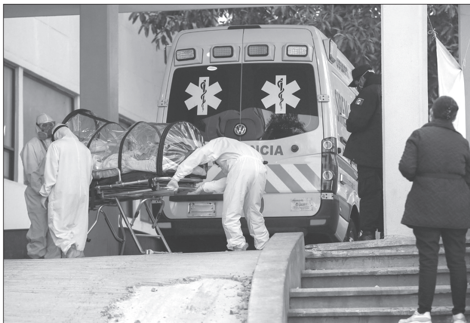
▲ Cada vez más nosocomios de la CDMX reportan ocupación total, por lo que se ven obligados a rechazar nuevos ingresos. Tal es el caso del Hospital General, el Centro Médico Nacional Siglo XXI y el del Parque de los Venados.