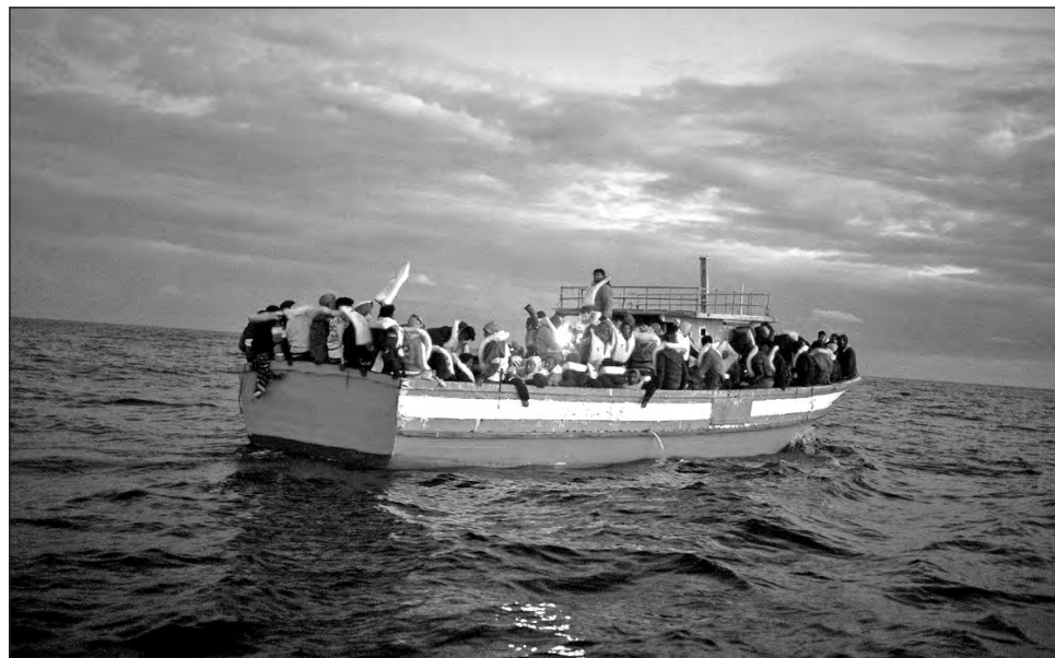
▲ Durante 2020 un total de 88 naufragios en el Mediterráneo causaron la muerte de al menos dos mil 170 migrantes que intentaban llegar a España, más del doble que en 2019.

"Estas cifras son una vergüenza", declaró la portavoz de Caminando Fronteras, Helena Maleno, en una rueda de prensa para presentar los datos, resultado de un análisis exhaustivo junto a comunidades migrantes, servicios de rescate, redes de familiares y defensores de derechos humanos. Además, del total de fallecidos, 2 mil 82 personas están desaparecidas y sólo han sido recuperados 88 cuerpos.