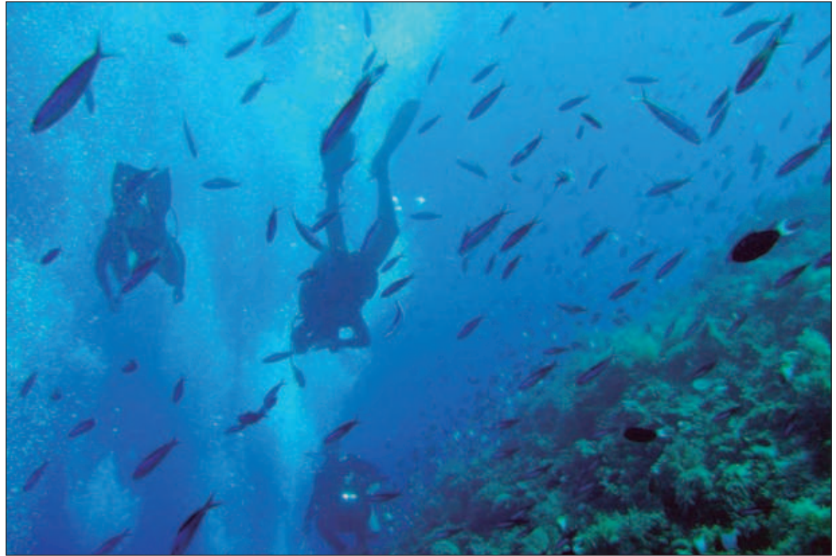
▲ “Durante los años de bachillerato me acompañaron los programas de las exploraciones submarinas de Cousteau, influyendo en definitiva en la carrera que quería estudiar, Biología marina”.