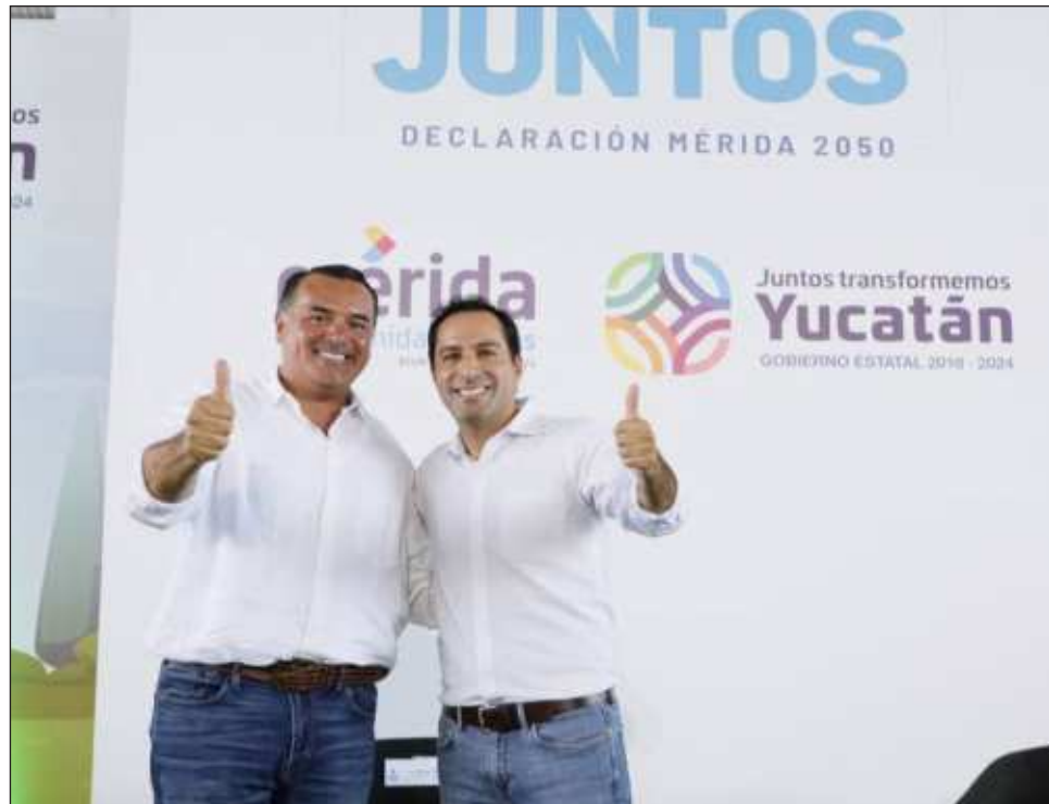
▲ El gobernador señaló que históricamente el desarrollo del sur del estado ha sido menor a otras zonas, por lo que desde que era candidato, junto con Barrera Concha, determinaron trabajar en equipo y hacer las cosas diferentes en esta región.

Al dirigir su mensaje, el gobernador señaló que históricamente el desarrollo del sur del estado ha sido menor a otras zonas, como el norte, el oriente y el poniente, por lo que desde que eran candidato, junto con Barrera Con-