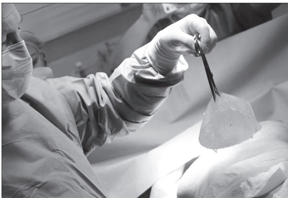
▲ La Organización Mundial de la Salud prevé un aumento del 45 por ciento en este padecimiento para 2030 a nivel internacional.