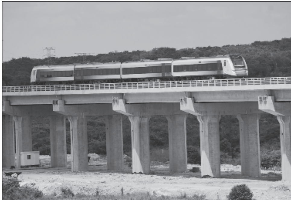
▲ Sansores San Román destacó que es el tramo 2, que corresponde a Campeche, el más avanzado del Tren Maya y está a cargo del grupo Carso, por lo que hizo un paréntesis para reconocer a empresarios como, “que son los que México necesita”.

La mandataria Sansores San Román también destacó que es el tramo 2 que corresponde a Campeche es el más avanzado y está a cargo a cargo del grupo Carso, e hizo un paréntesis para reconocer a empresarios como a Carlos Slim, que son los que México necesita, y los hay,