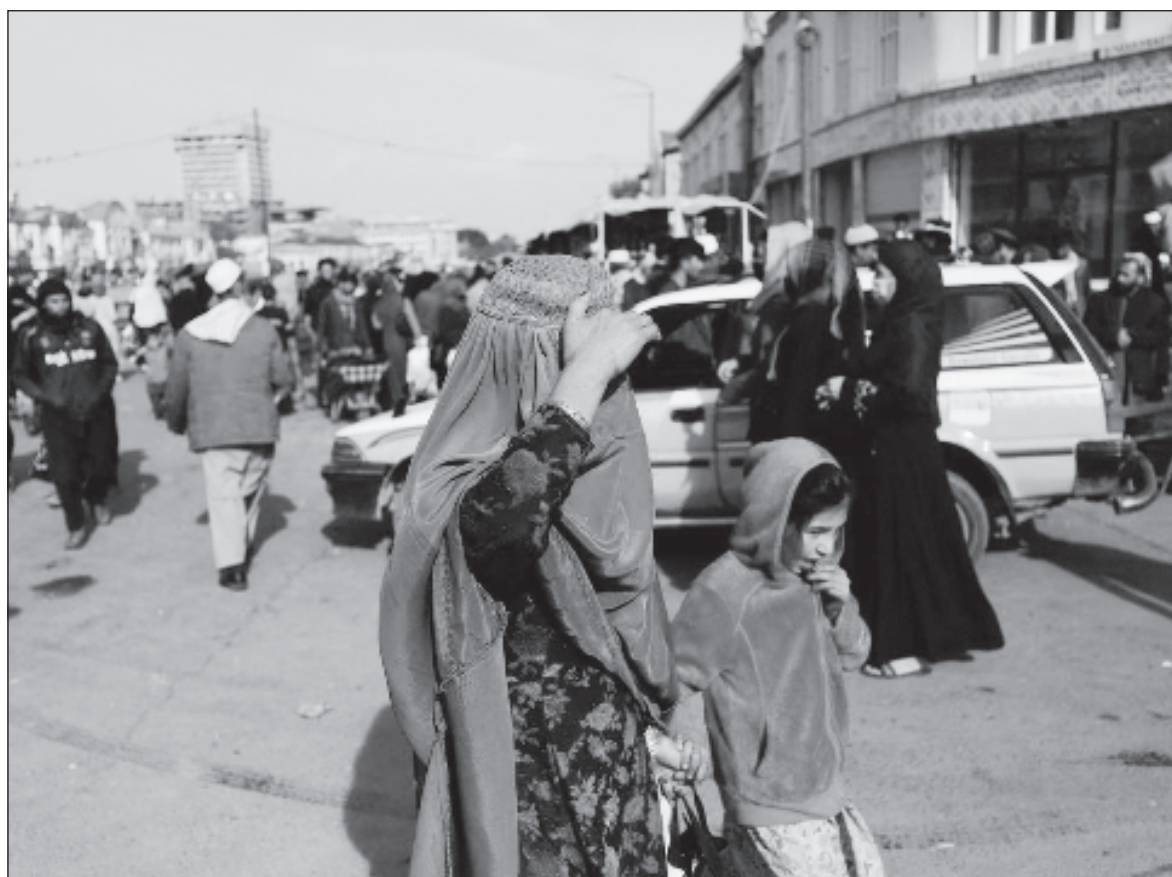
▲ "Religious practices which promote the dominance of males are partly to blame. Such is the case in Iran and Afghanistan where radical religiosity deprives women from the full enjoyment of human rights".