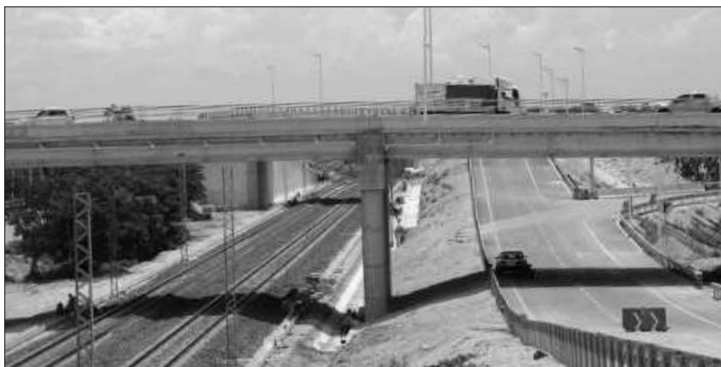
▲ En unos cuantos meses, el Tren Maya quedará concluido y los empleados de las constructoras regresarán a sus lugares de origen, o también buscarán trabajo en el ferrocarril.

En unos cuantos meses, el Tren Maya quedará concluido y los empleados de las constructoras regresarán a sus lugares de origen, o también buscarán establecerse en algún punto del recorrido del ferrocarril si tienen la oportunidad de integrarse a la plantilla de la nueva empresa, que seguirá requiriendo personal para dar mantenimiento a las vías, paradas y estaciones, así como para realizar las maniobras de carga y descarga que se requieran. Pero también quienes hayan visto un espacio para iniciar un negocio vinculado al paso del tren y de los nuevos transportes podrán encontrar la oportunidad de desarrollarse como empresarios. Es cuestión también de estar preparados.