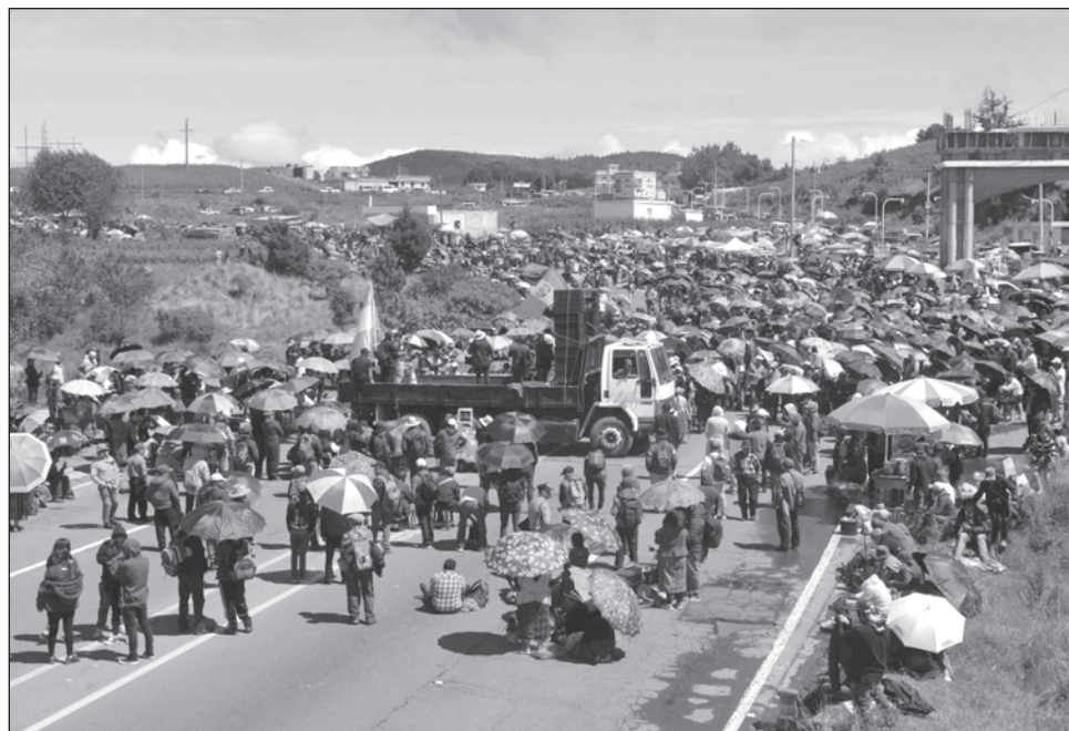
▲ Indígenas y campesinos anunciaron un paro nacional ante la arremetida de la fiscalía contra el proceso electoral que ha incluido allanamientos y órdenes de aprehensión.

Arana —una de las autoridades indígenas que convocaron a la protesta nacional— aseguró que las manifestaciones se mantendrán hasta que