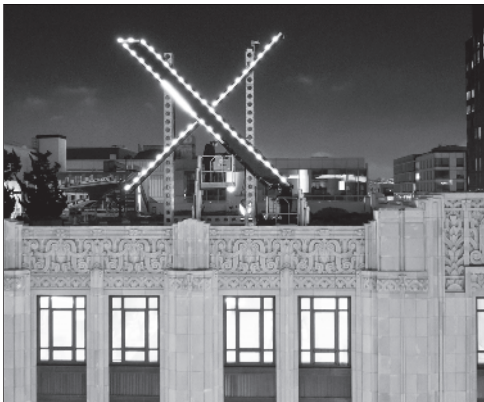
▲ El caso parece ser el primero de lo que podrían ser numerosas disputas de marcas con la empresa de Musk sobre la letra X, que se utiliza mucho en empresas de tecnología.

La X figura en cientos de marcas federales propiedad de empresas como Microsoft y Meta Platforms. El mes pa-