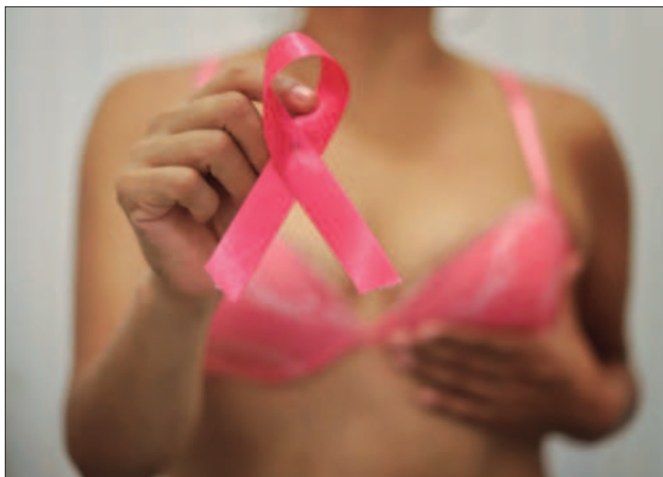
▲ Raíces de Amor, Movimiento 7-11 y Grupo Marakame organizaron eventos con causa en apoyo tanto a la prevención como a mujeres que ya padecen cáncer.

Si bien este mes se hace énfasis sobre el cáncer de mama, el cervicouterino y el de ovario han crecido, por lo que invitó a las mujeres a que acudan constantemente a revisiones con su ginecólogo, sobre todo porque se ha tenido una mayor incidencia en jovencitas,