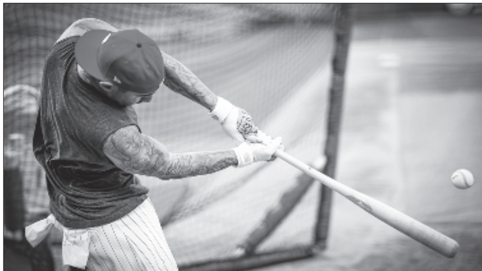
▲ La ofensiva de Filadelfia incluye a Bryce Harper y Trea Turner.

Bravos, Astros, Orioles, que tienen una admirable historia,