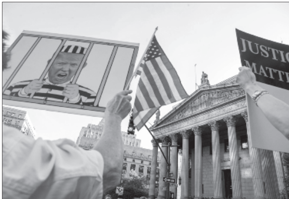
▲ La fiscal pide al menos 250 mmd en multas, una prohibición permanente contra el ex presidente y sus hijos Donald Jr y Eric de dirigir negocios en Nueva York y una restricción de cinco años a sus actividades inmobiliarias y las de su insignia Trump Organization.

"Esto no es lo habitual, y así no es como las partes sofisticadas tratan entre sí",