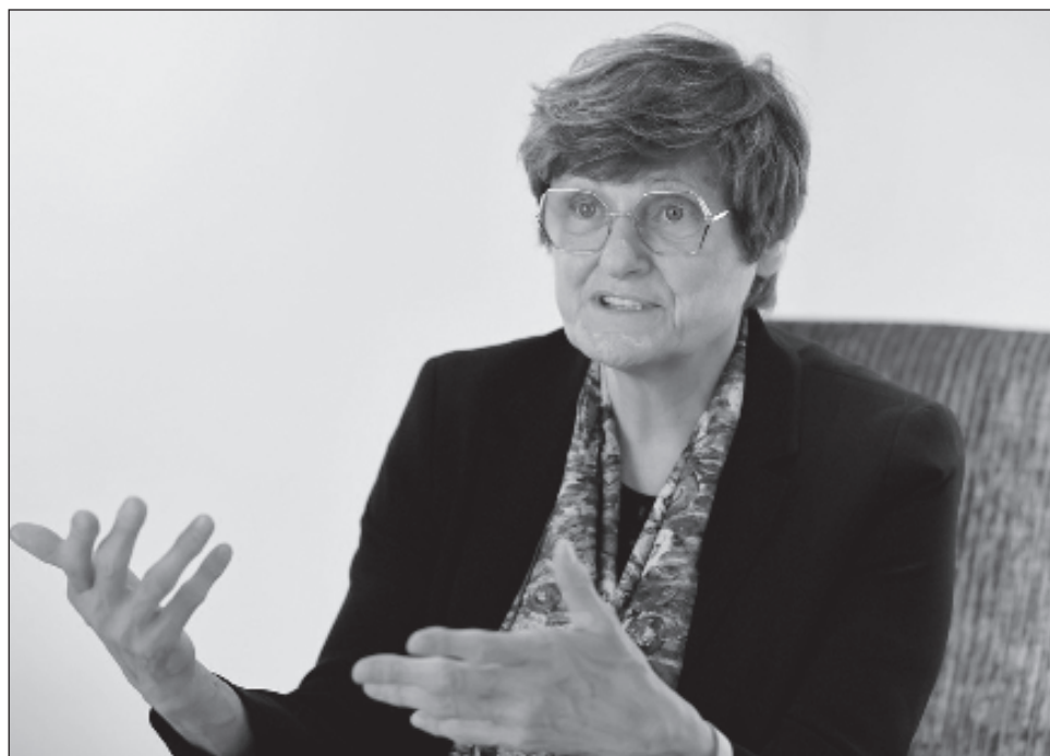
▲ Karikó, que también tiene nacionalidad estadounidense, es la primera húngara en ganar un Nobel y la décimo tercera mujer en recibir el de Medicina, de 227 galardonados desde 1901.

“A través de sus innovadores hallazgos, los galardonados de este año han cambiado fundamentalmente nuestra comprensión de cómo el ARNm interactúa con nuestro sis-