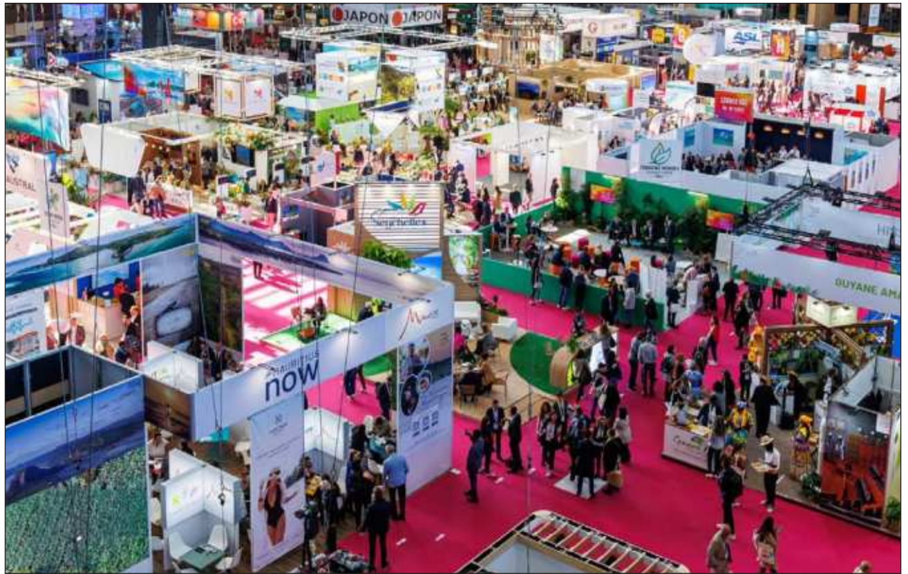
▲ El director general de Turismo y Economía destacó la labor coordinada que está haciendo el presidente de Tulum en las diferentes áreas como seguridad, limpieza, las playas, el desarrollo de las comunidades mayas, entre otros.

Expuso que tienen la aplicación móvil web que es visittulum.travel y la página en las redes sociales visit oficial, donde los viajeros pueden planificar sus viajes, concretar reservas, así como también sugerir o calificar a los estable-