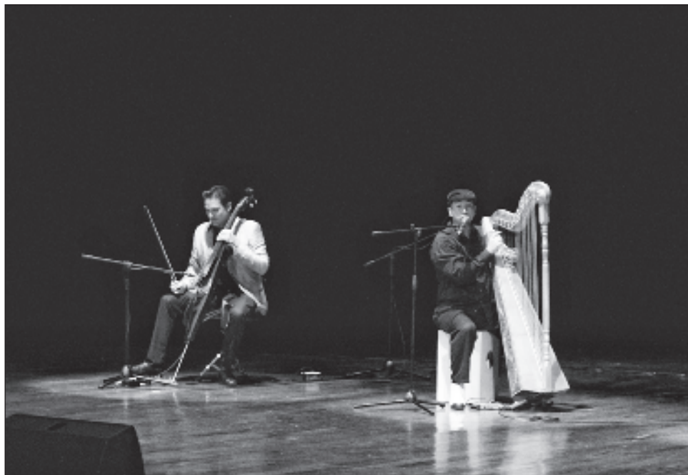
▲ Durante los tres días que dura el evento, del 5 al 7 de octubre, se recorrerá con la música distintas partes de México pero también del mundo, pues se contará con la participación de músicos extranjeros invitados, desde de Colombia y Chile.

Durante los tres días que dura el evento, del 5 al 7 de octubre, se recorrerá con la música distintas partes de México pero también del mundo, pues se tendrán músicos extranjeros invitados, como de Colombia y Chile.