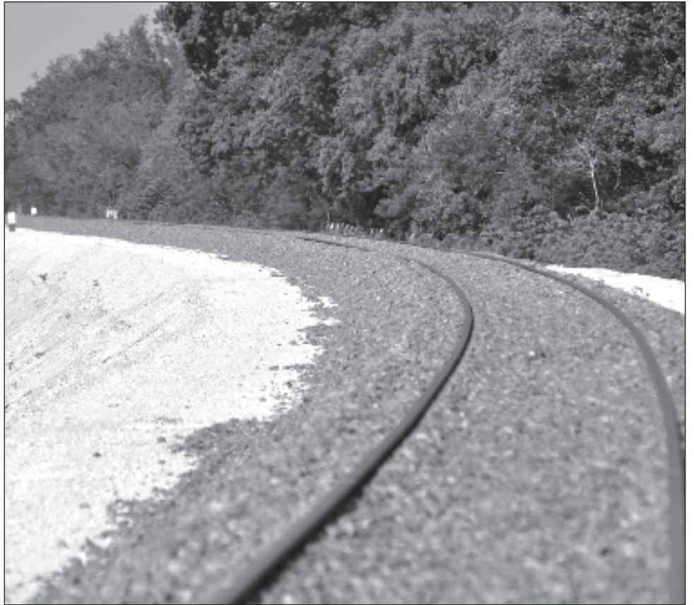
▲ El militar a cargo de la obra detalló que en los 234 kilómetros de vía sencilla sólo se realizan ya trabajos de nivelación, y que el proyecto generó 27 mil empleos.

En el subtramo sur, agregó, la construcción de la vía tiene 100 por ciento de avance, al igual que las obras de drenaje y los puentes.