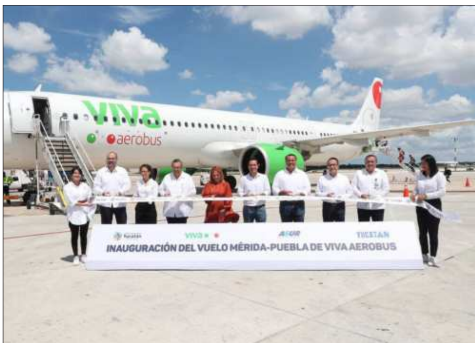
▲ A partir del 16 de diciembre también iniciará operaciones un vuelo más de Viva Aerobus con la ruta Mérida al AIFA con frecuencia de un vuelo diario.