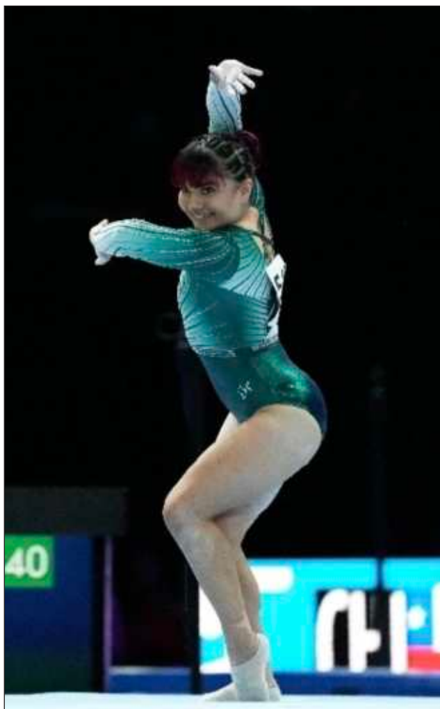
▲ Alexa Moreno cosechó dos plazas para los Juegos Olímpicos de París 2024 en el mundial de Amberes.

Otros que se expresaron de forma similar son: Bam Adebayo, quien está comprometido con el equipo, mientras que DeMar DeRozan, Devin Booker, Bradley Beal, Jaylen Brown, Donovan Mitchell, Khris Middleton, Julius Randle, Zach LaVine, Aaron Gordon, Fred VanVleet y Brook Lopez expresaron que jugarán si les preguntan. Kyrie Irving señaló la semana pasada y Draymond Green, en una ocasión anterior, que quieren otra oportunidad en los Olímpicos.