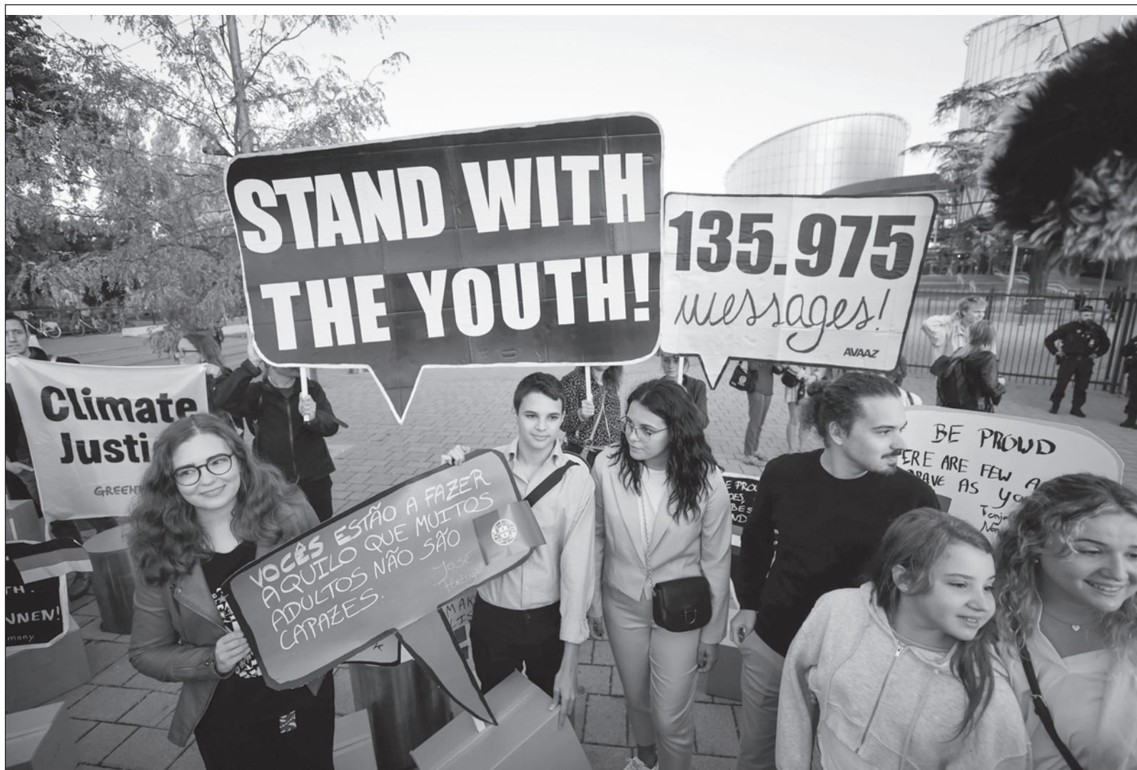
▲ "La crisis del cambio climático se explica en gran medida por la intervención humana, tanto que nombramos Antropoceno a la era geológica que estamos viviendo".