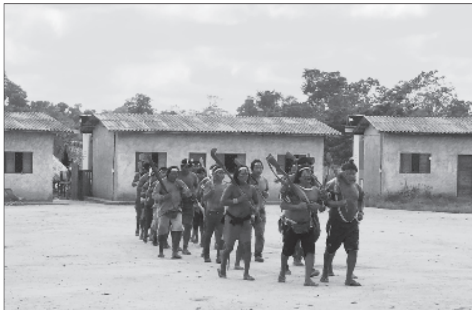
▲ Se estima que más de 10 mil personas que no son indígenas habitan dentro de los dos territorios. La Agencia Brasileña de Inteligencia señaló que son hasta 2 mil 500 personas indígenas las que viven en 51 aldeas de la zona.

Grupos originarios estiman que más de 10 mil personas no indígenas habitan dentro de los dos territorios. ABIN señaló que hasta 2 mil 500 personas indígenas viven en 51 aldeas de la zona.