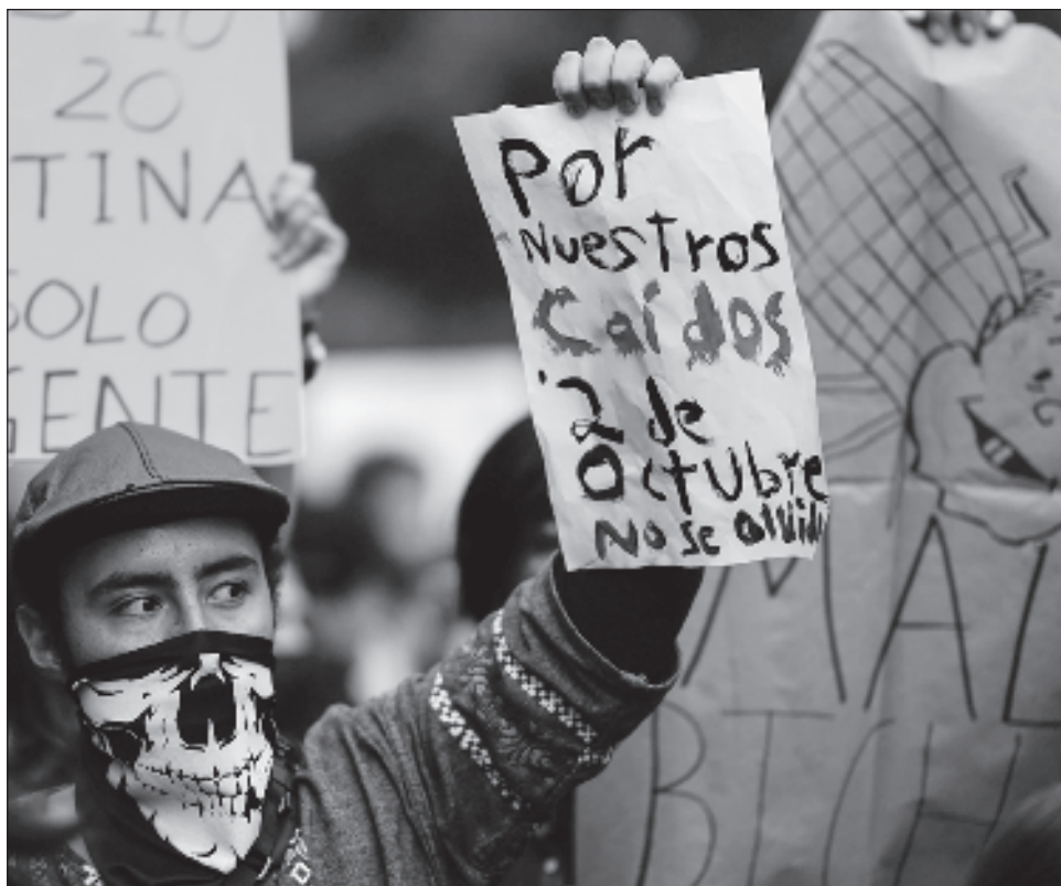
▲ Jóvenes estudiantes de diversas casas de estudio han mostrado en pintas, cárteles y mantas su indignación ante aquellos hechos represivos y su clamor de justicia.

"Menos policías, más educación", "En la guerra contra el narco, los muertos son los estudiantes", "Eres fruto de esta tierra bañada en sangre", "Los estudiantes saldremos a marchar mientras nos sigan reprimiendo", fueron algunos de los mensajes expresados.