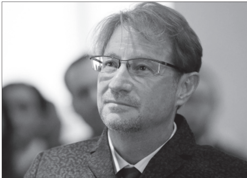
▲ Desde 2021, México presentó a Israel un total de cinco solicitudes de extradición formales contra el escritor y ex conductor de televisión.

Desde 2021, México presentó a Israel un total