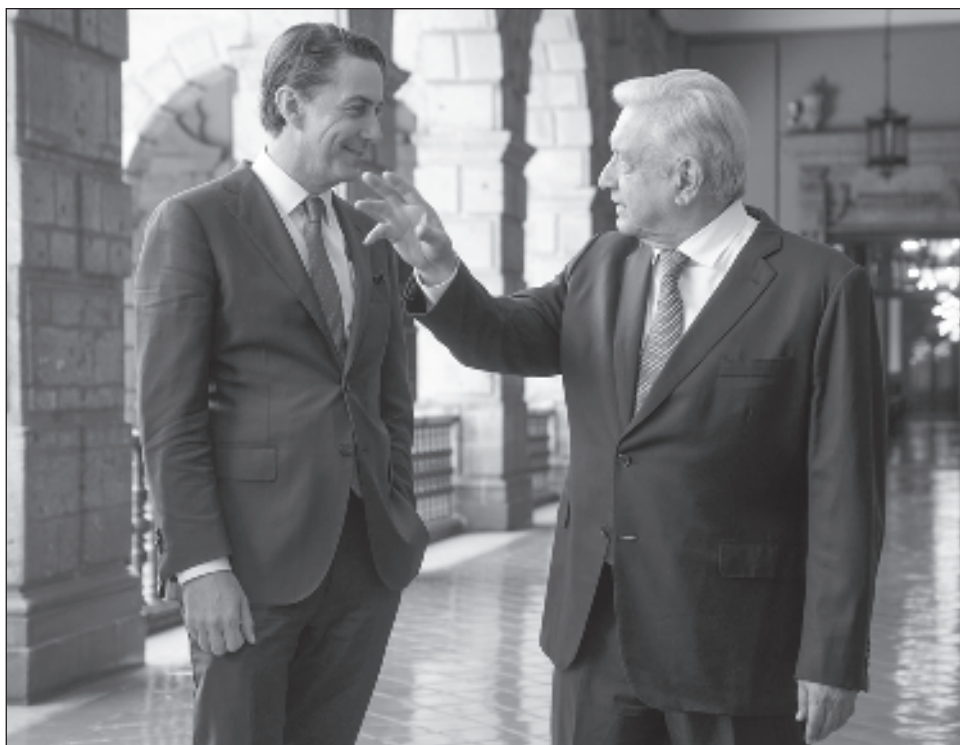
▲ En su conferencia de todos los días, López Obrador expuso a medios que una delegación de funcionarios de Estados Unidos lo visitaría en Palacio Nacional.

"Vienen representantes, viene un asesor económico de la Casa Blanca, del Presidente Joe Biden. Va a haber un encuentro entre grupos de trabajo de Estados Unidos y México estos días para tratar diversos temas".