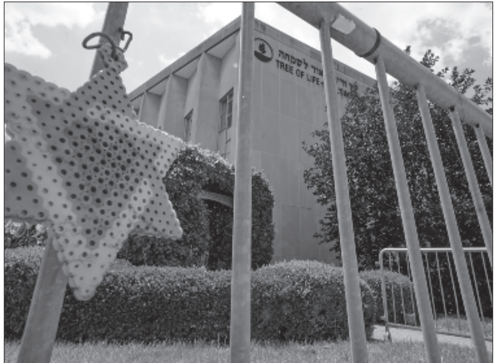
▲ El delito de homicidio tenía como agravante la calificación de acto antisemita.

El tema de la pena de muerte fue central en este caso. Desde 2019, el fiscal federal de Pittsburgh había advertido que pediría la pena de muerte contra el autor del asesinato, citando su "ausencia de remordimiento" y "su odio y desprecio" hacia los judíos.