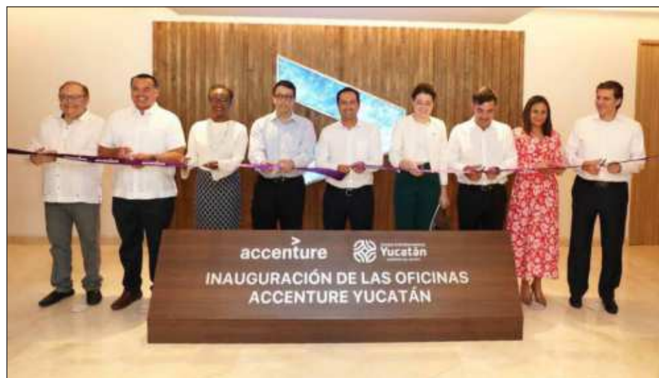
▲ En su mensaje, el gobernador Mauricio Vila Dosal resaltó que la función de su administración ha sido poder crear más empleos mejor pagados; y que todas las personas, con base en sus aptitudes, tengan la oportunidad de poder superarse.

En presencia del CEO Accenture en Growth Markets,