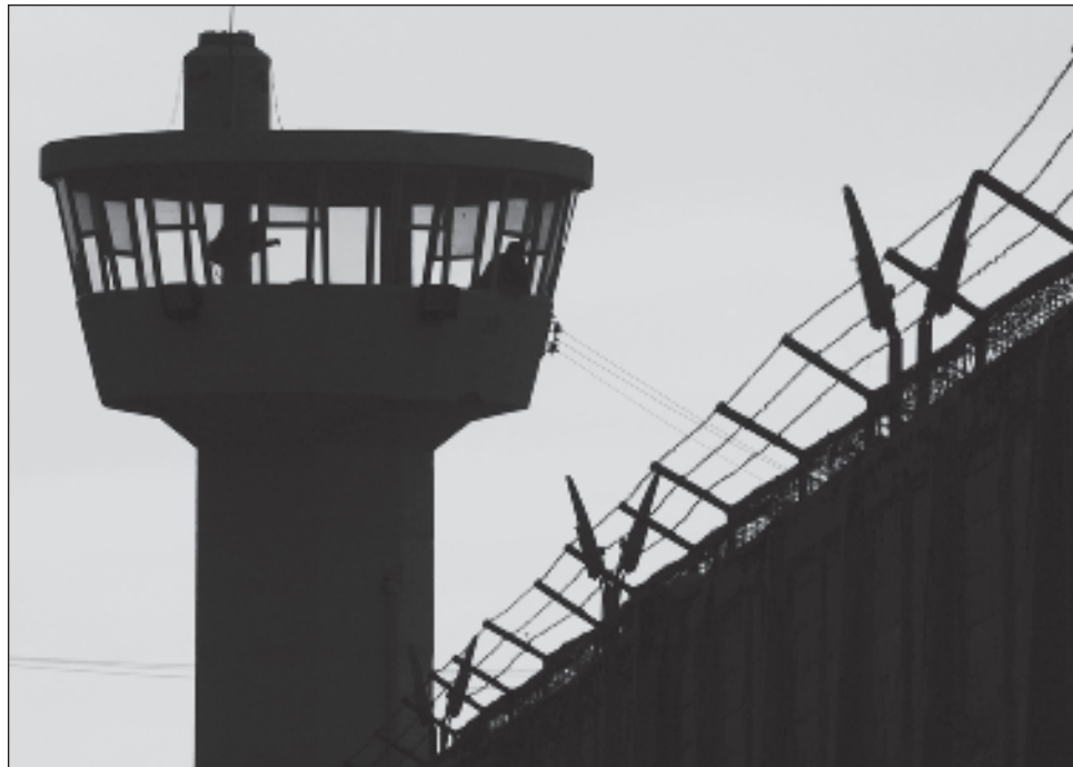
▲ El Diagnóstico Nacional de Supervisión Penitenciaria es una herramienta de evaluación anual que aplica la CNDH en las 32 entidades federativas.

En el Cereso de Mérida, que tiene una capacidad para 2 mil 180 hombres y 100 mujeres, y al momento de la supervisión la ocupación era de mil 156 y 19, respectivamente, se encontraron áreas de oportunidad, como la insuficiencia de personal de seguridad y custodia; de-