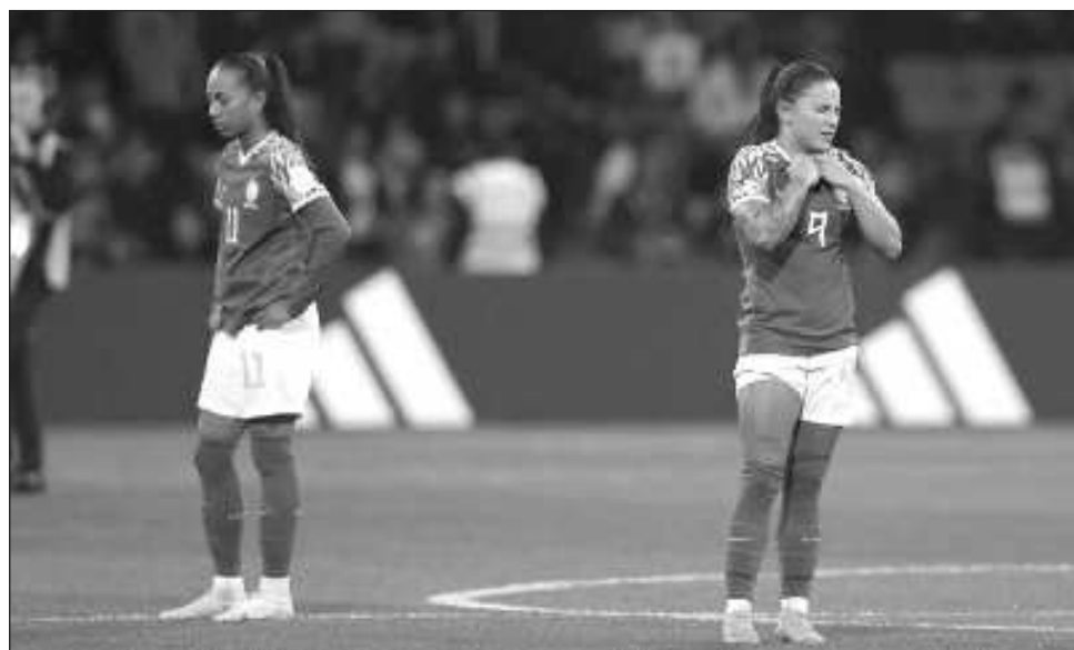
▲ Brasil no pudo vencer a Jamaica y quedó eliminado de la copa mundial femenil.

Jamaica certificó el miércoles una inédita clasificación a la fase de elimina-