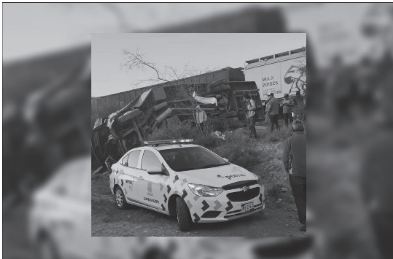
▲ Los reportes indican que el conductor de la unidad de transporte público, de la empresa Flecha Azul, intentó ganarle el paso a la locomotora, sin embargo, fueron impactados por el tren.

fueron llevados al hospital regional número 2 del Instituto Mexicano del Seguro Social, al nosocomio general de San Juan del Río y a la clínica particular de San José, de la ciudad de Querétaro.