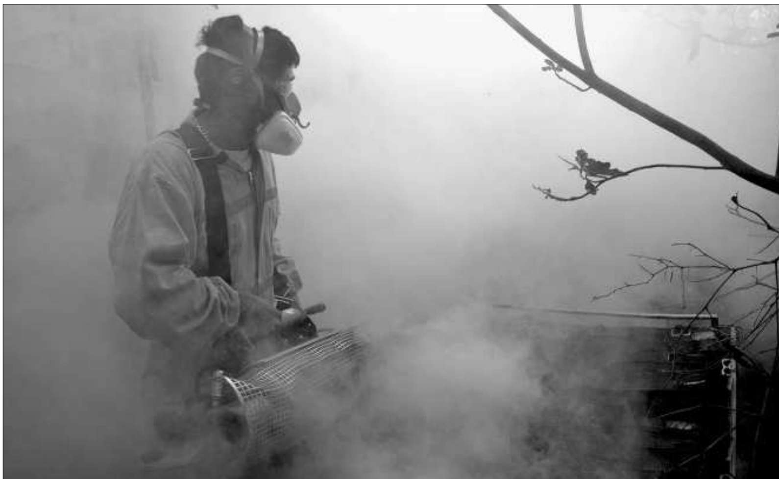
▲ "La derecha conservadora mexicana no defiende ningún valor ideológico del conservadurismo: ni la doctrina social del cristianismo, ni los valores morales".