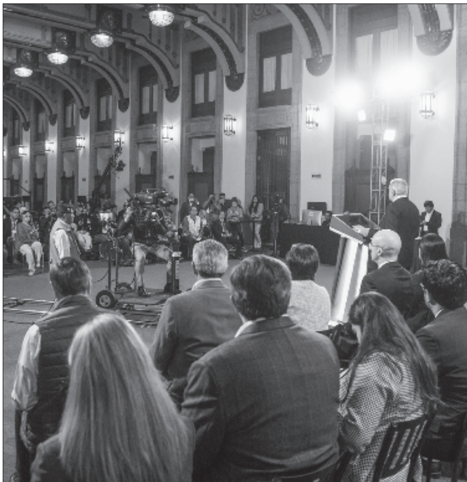
▲ Andrés Manuel López Obrador calificó de “Santa Inquisición” los recursos judiciales presentados en contra de sus presentaciones diarias.

— Muchísimos, es como la Santa Inquisición