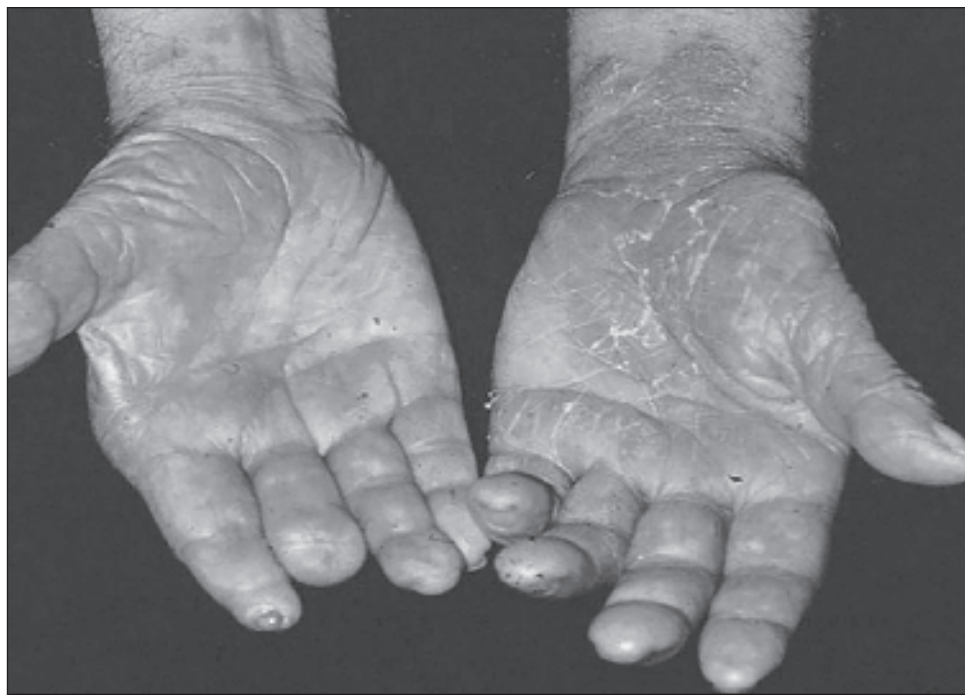
▲ Los principales síntomas, que deben considerarse alerta, son lesiones cutáneas, como manchas o placas pálidas o rojizas y pérdida de sensibilidad en la zona afectada.

Estos municipios resaltan porque actualmente el