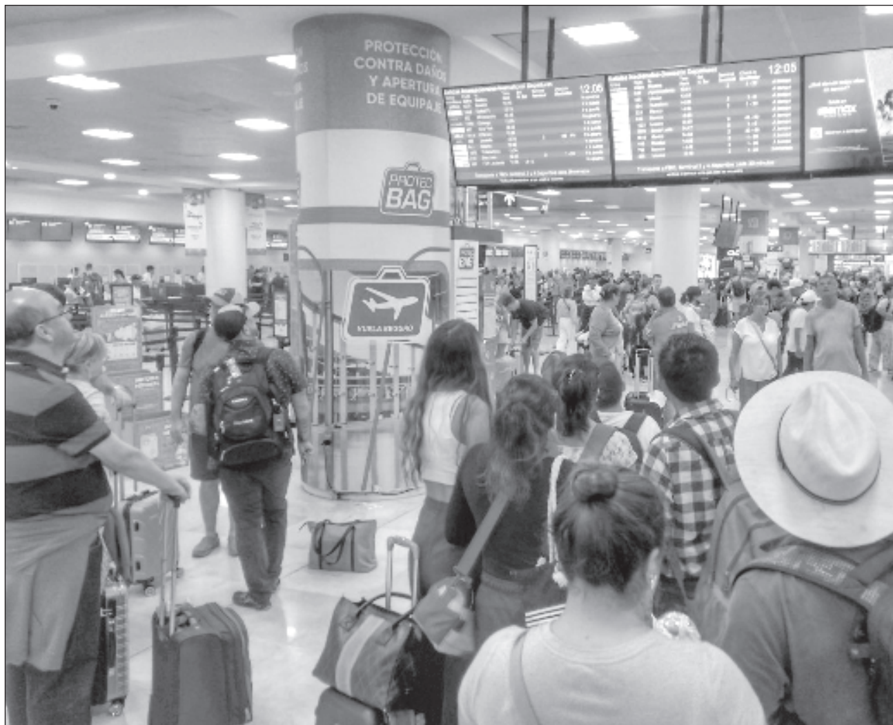
▲ En los primeros seis meses del año, la llegada de turistas estadounidenses vía aérea alcanzó 6 millones 583 mil turistas, sólo 1.1% por debajo de lo registrado en enero-junio de 2022, pero superando en 17.7% las llegadas 2019.

De acuerdo con un boletín de la Secretaría de Turismo (Sectur) federal, durante enero-junio de 2023, al aeropuerto de Cancún arribaron 4 millones 835 mil turistas internacionales, un incremento de 0.2 por ciento respecto a los primeros seis meses de 2022. Esta terminal aérea concentra 44.6 por ciento del total de pasajeros de todo el país.