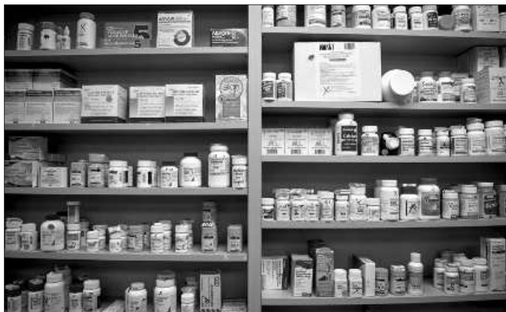
▲ "En la actualidad, el gran inconveniente de un almacén de medicamentos, por mejor construido que sea, es que la materia con la que trabaja tiene fecha de caducidad".

El derecho a la salud se garantiza cuando las personas tienen acceso a la atención profesional, con especialistas que le brinden información clara y suficiente, cuando las pruebas, análisis y procedimientos exploratorios se realizan oportunamente y cuando el medicamento llega a sus manos puntualmente, sin tener que esperar por meses a que les sea surtida una receta porque el fármaco que requieren está en la Ciudad de México.