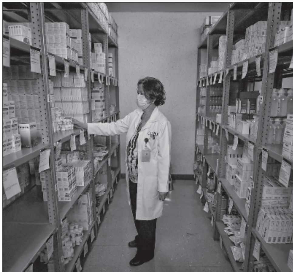
▲ En los 14 estados donde se federalizó la atención de la salud, el abasto de medicamentos ya supera el 90 por ciento en promedio.

López Obrador dijo que “para darle una salida definitiva al desabasto, les voy a proponer al sector salud, que se tenga una especie