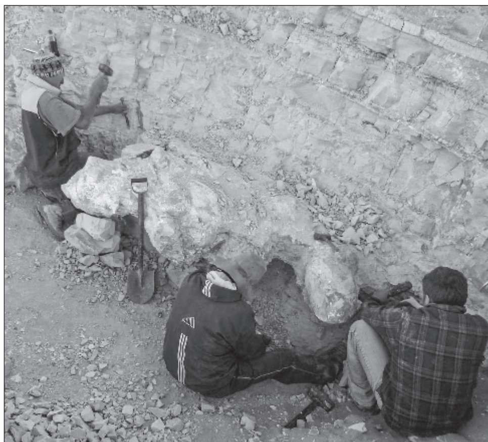
▲ El registro fósil de los cetáceos es de gran importancia. a la hora de documentar la historia evolutiva de la vida de los mamíferos.

Bautizado como P. colossus , el animal se ha modelado a partir de un esqueleto parcial, que incluye 13 vértebras, 4 costillas y 1 hueso de la cadera, descubierto en el sur de Perú y cuya anti-