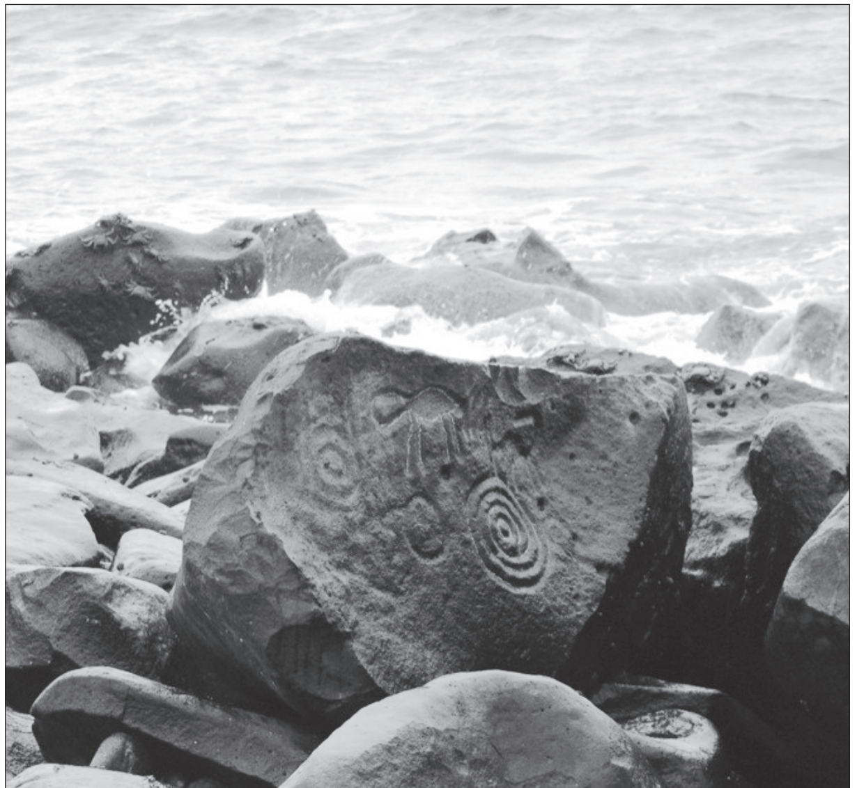
▲ Wooje' beeta'ab úuchik u bin u póola'al u yáax yáal le tuunicho'obo'.

Te'e k'áaxo', kaxta'an manal 20 u péel kaajtalilo'ob káaj u jéets'elo'ob lik'ul u ja'abil'ob' 7000 tak 5500 ma'ili' okok u jatsk'iinilo'ob Nuestra Era, ba'ale' p'ool meyaj beeta'an te'e tuunicho'obo', ku tukulta'abe' ya'abach ja'abo'ob paachil ka'aj beeta'abij.