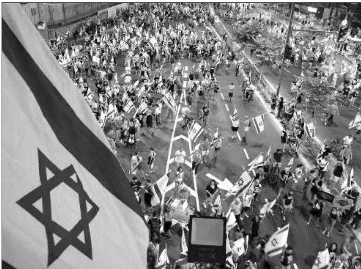
▲ "Millions of Israelis oppose the bill, including dozens of business leaders. Even Mr. Netanyahu's own defense minister, Yoav Gallant, has called several times for delaying the legislation in order to seek broad consensus. Mr. Netanyahu tried to dismiss Mr. Gallant earlier this year for criticizing the overhaul, but never went through with the firing".

MR. NETANYAHU HAS promised new laws that could render the judiciary relatively impotent. Legislation that passed first reading in March sits ready and