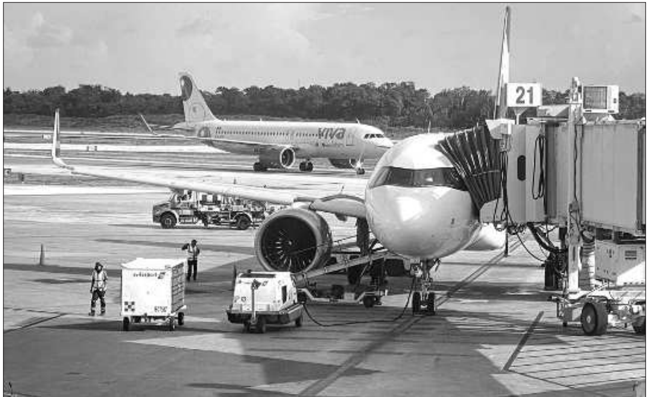
▲ Los pasajeros tendrán la oportunidad de volar en aeronaves Airbus A320 y A321 que forman parte de la flota más joven de la aerolínea en México, y la cuarta de Norteamérica, con una edad promedio de 5.2 años.

Los pasajeros, además, tendrán la oportunidad de volar en aeronaves Airbus A320 y A321 que forman parte de la flota más joven de México, y la cuarta de Norteamérica, con una edad promedio de 5.2 años.