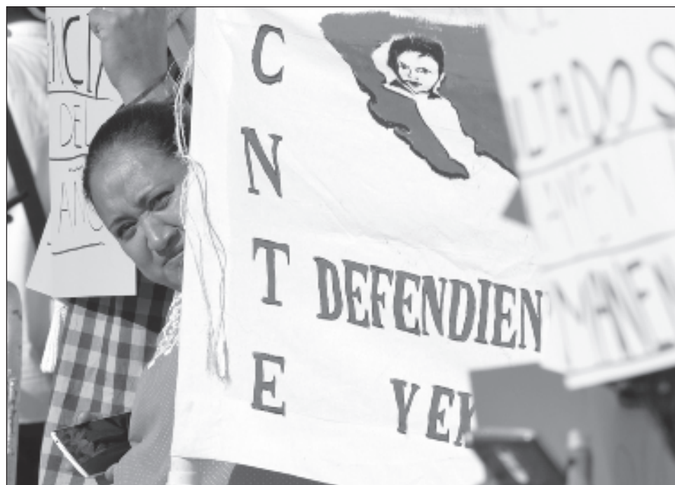
▲ Entre los 11 docentes reinstalados hubo una inversión de al menos 22.5 millones de pesos por los sueldos caídos, los años de despido y los pagos retroactivos.

Entre los 11 docentes hubo una inversión de al menos 22.5 millones de pesos por los sueldos caídos, los años de despido y los pagos retroactivos, pero no se pueden dar cantidades exactas por docente por su seguridad y porque tenían diferentes sueldos, la CNTE destacó que lo importante es que ya lograron la reinstalación de todos, a través de un esfuerzo de Coordinadora y la Secretaría de Educación (Seduc).