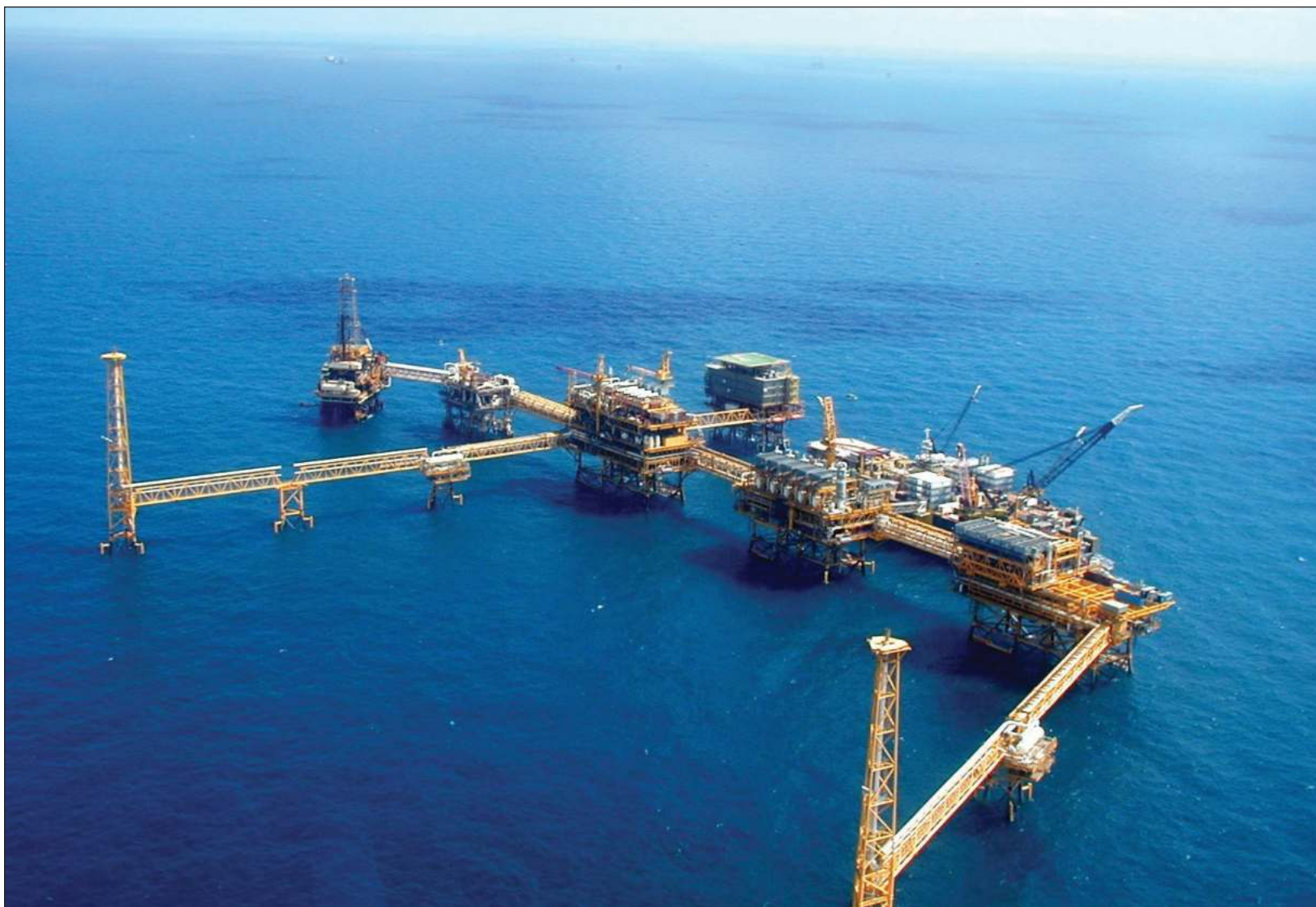
▲ Trabajadores petroleros manifestaron que Pemex no sólo los expone a la inseguridad que se registra en la Sonda de Campeche por los ataques piratas, sino que además, a quienes se encuentran en las instalaciones que son saqueadas, los someten a investigación.