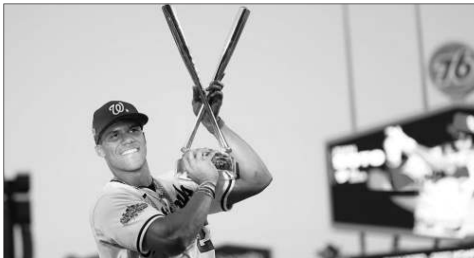
▲ Juan Soto ganó este año el Derby de Jonrones en Dodger Stadium, a donde regresará para enfrentarse a los Dodgers como integrante de los Padres de San Diego.

Los Yanquis, líderes de la Liga Americana, que hicieron un muy buen trabajo en días anteriores al sumar