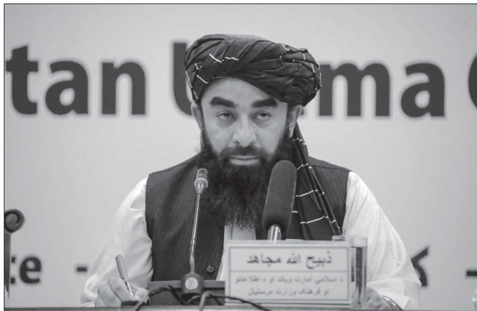
▲ En un comunicado, el portavoz de los talibanes, Zabiullah Mujahid, señaló que el ataque de Estados Unidos “repite la experiencia fallida de los últimos 20 años”.

Estos ataques “repite la experiencia fallida de los últimos 20 años y van en contra de los intereses de Estados Unidos, Afganistán y la región. Repetir esas acciones dañará las posibles oportu-