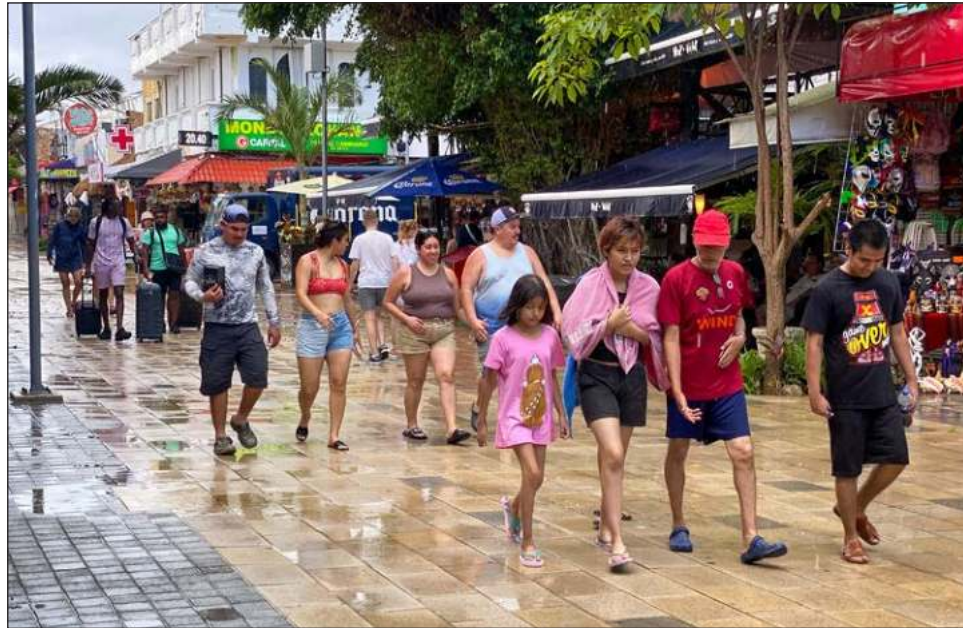
▲ Durante julio la ocupación hotelera alcanzó un 80% como promedio, teniendo su mejor repunte el pasado fin de semana, cuando alcanzó los 84 puntos porcentuales.

“Estamos viendo signos claros de recuperación con el alza sostenida de la ocupación hotelera y afluencia de miles de visitantes deseosos de visitar el Caribe Mexicano luego del confinamiento y las restricciones provocadas por