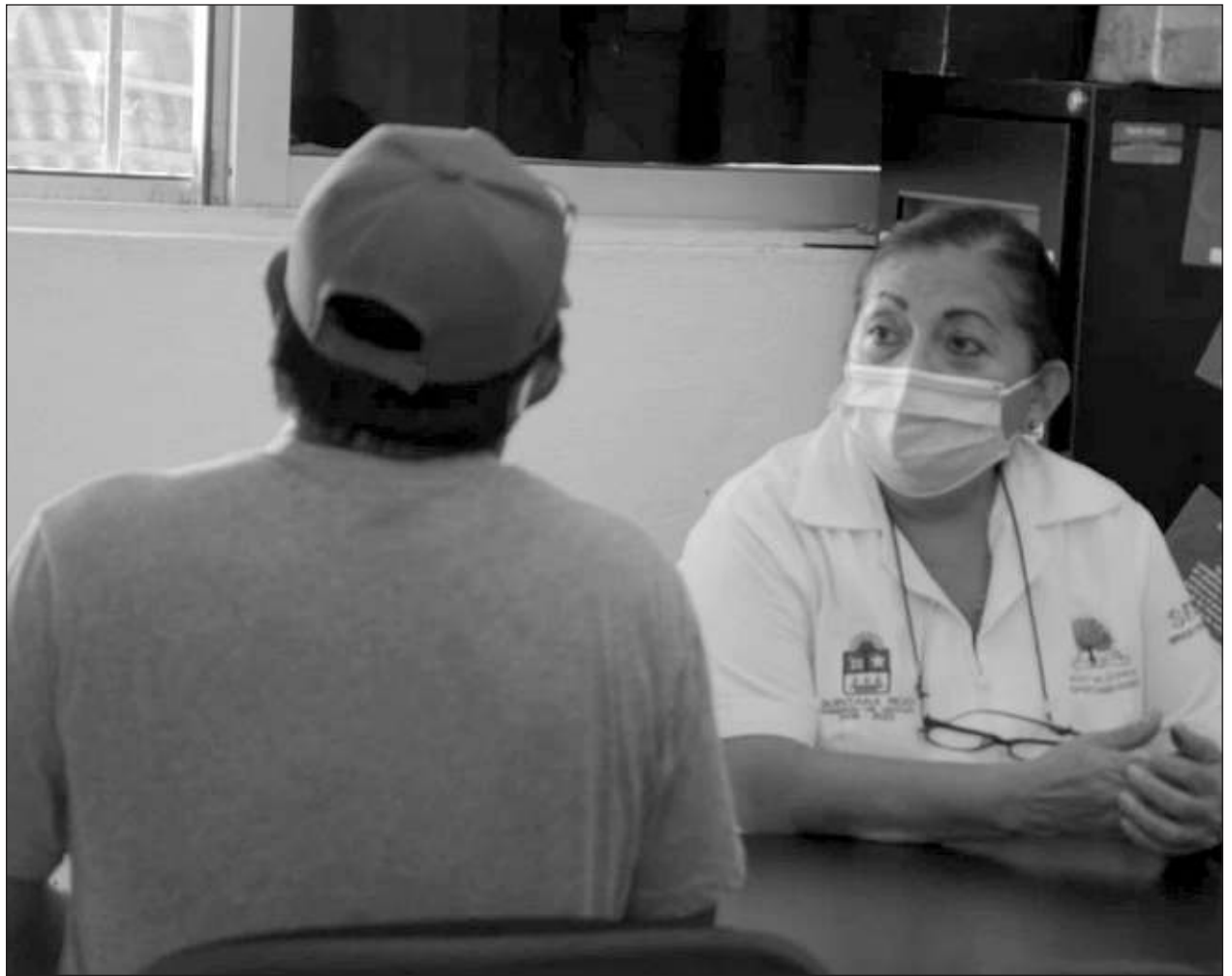
▲ Por el cáncer de próstata mueren al día más hombres que mujeres por cáncer de mama.

Destacó que un niño tratado a tiempo tiene 80 por ciento de probabilidades de salir adelante, por lo que si se identifica la enfermedad se debe atender a tiempo.