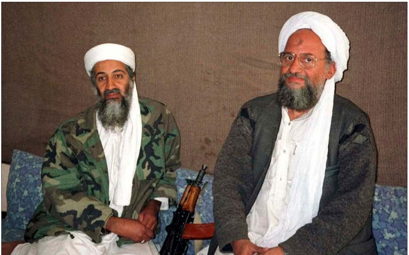
▲ “A 21 años de la caída de las torres gemelas, la Casa Blanca aún no comprende a las agrupaciones fundamentalistas, pues en múltiples ocasiones ha sido demostrado que asesinar a líderes como Zawahiri y Osama bin Laden, no detiene, sino fortalece la lucha yihadista global”.