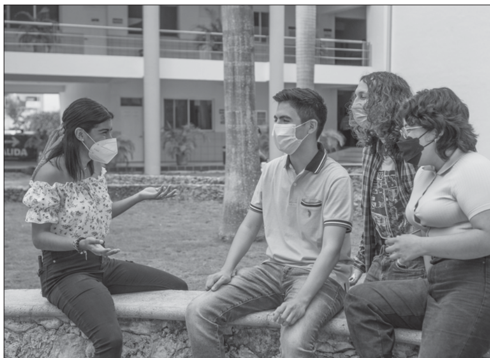
▲ El diplomado internacional Educación en Culturas de Paz, Ciudadanías y Derechos Humanos iniciará el próximo 6 de agosto.