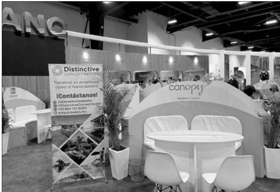
▲ Cancún ha estado en muchas postulaciones tanto nacionales como internacionales, lo que le ha permitido la confirmación de congresos desde 2023 hasta 2026.

Dio a conocer que para 2023 prevén la llegada de 20 mil visitantes a través de este segmento y estarían dejando una derrama económica de cerca de 90 millones de pesos. “En recuperación franca en el ámbito de los congresos internacionales, el Caribe Mexicano está teniendo una muy buena recuperación; las postulaciones, que son las competencias que hacemos a nivel mundial para la atracción de los congresos mundiales, aperturaron más rápido de lo que habíamos pensado y nos dio oportunidad de ganarle terreno a otros destinos”, apuntó.