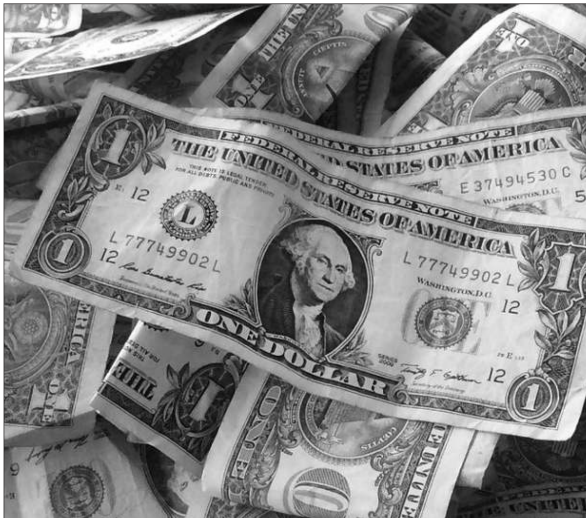
▲ Durante julio, nuestros paisanos enviaron 5 mil 15 millones de dólares; un incremento del 15.6% anual.

LOS DESENCUENTROS DEL presidente López Obrador con jueces, magistrados y ministros del Poder Judicial vienen de tiempo atrás. “Yo padecí de un presidente de la SCJN (Mariano Azuela) abyecto y servil al poder de Vicente Fox que me inició un proceso de desafuero”, declaró en alguna ocasión. En el tiempo presente, ese poder es uno de los representantes del conservadurismo no exento de corrupción. Cada día pone piedras (rocas) en el camino de Andrés Manuel. Vienen más desencuentros. Oficializó la expropiación por causa de utilidad pública de un millón 93 mil 118 metros cuadrados para la construcción del tramo 5 del Tren Maya, declarado como obra de seguridad nacional. La superficie de propiedad privada se localiza en los municipios de Benito Juárez, Puerto Morelos, Solidaridad y Tulum. Fracasaron las conversaciones con los dueños,