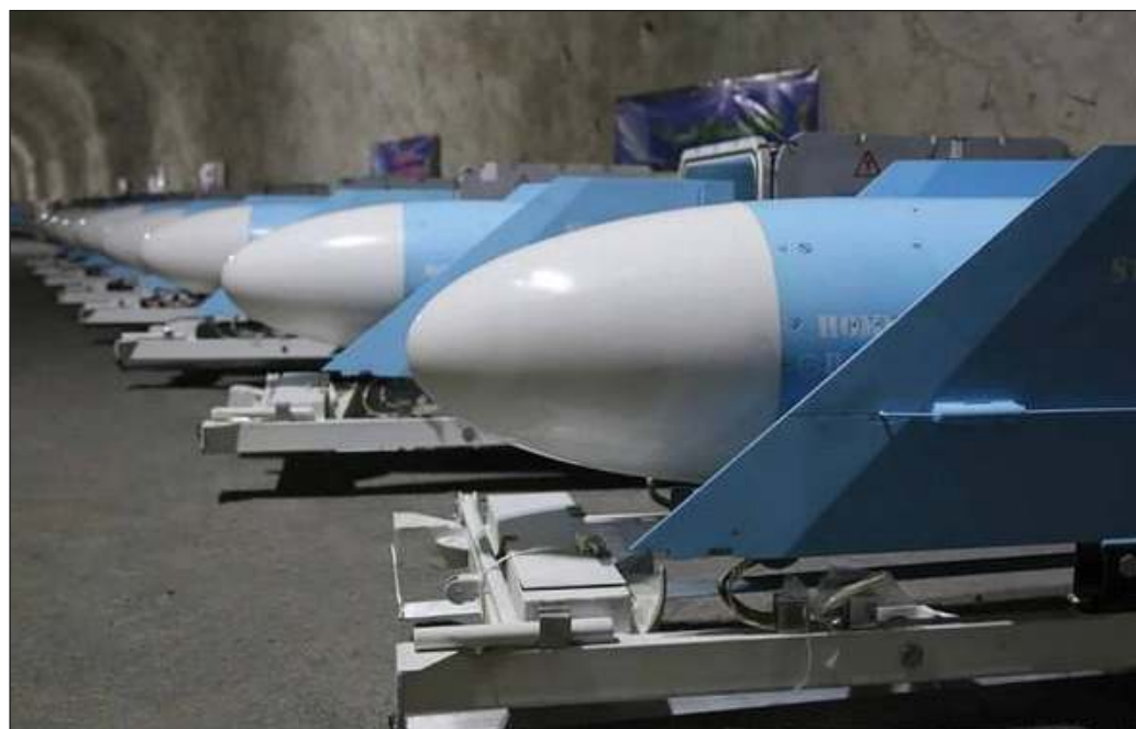
▲ Actualmente, el Tratado de Reducción de Armas Estratégicas limita las cabezas atómicas a mil 550 y a 700 sistemas de lanzamiento balístico de mil 500 kilómetros de alcance.