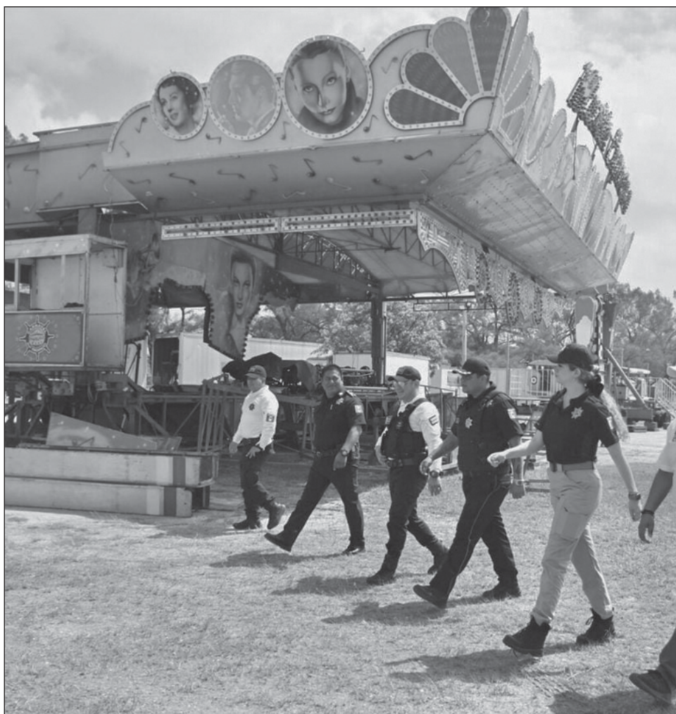
▲ Según la Dirección de Seguridad Pública, durante la Feria disminuyó la incidencia de robos en la zona y en los estacionamientos.