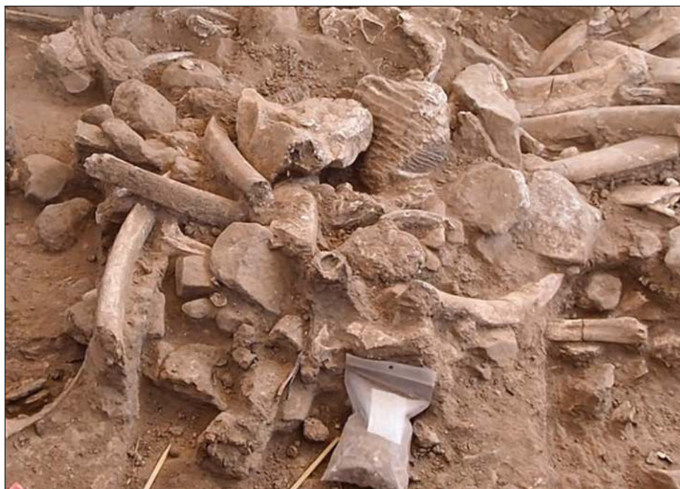
▲ El paleontólogo Timothy Rowe señaló que el yacimiento “no es un sitio carismático con un hermoso esqueleto de lado. Está todo reventado. Pero esa es la historia”.

“Lo que tenemos es increíble”, dijo en un comunicado