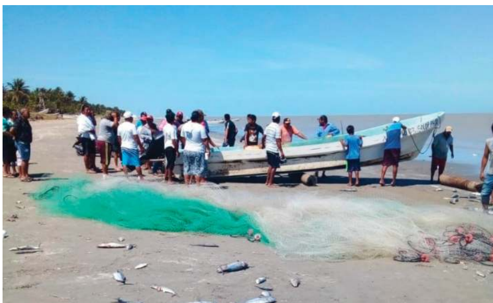
▲ De manera reciente se tuvo conocimiento del robo de al menos tres motores de 60 hp en las comunidades de Emiliano Zapata y de Nuevo Campechito.

se planteó la necesidad de armar una operación para sacar de la isla a los piratas.