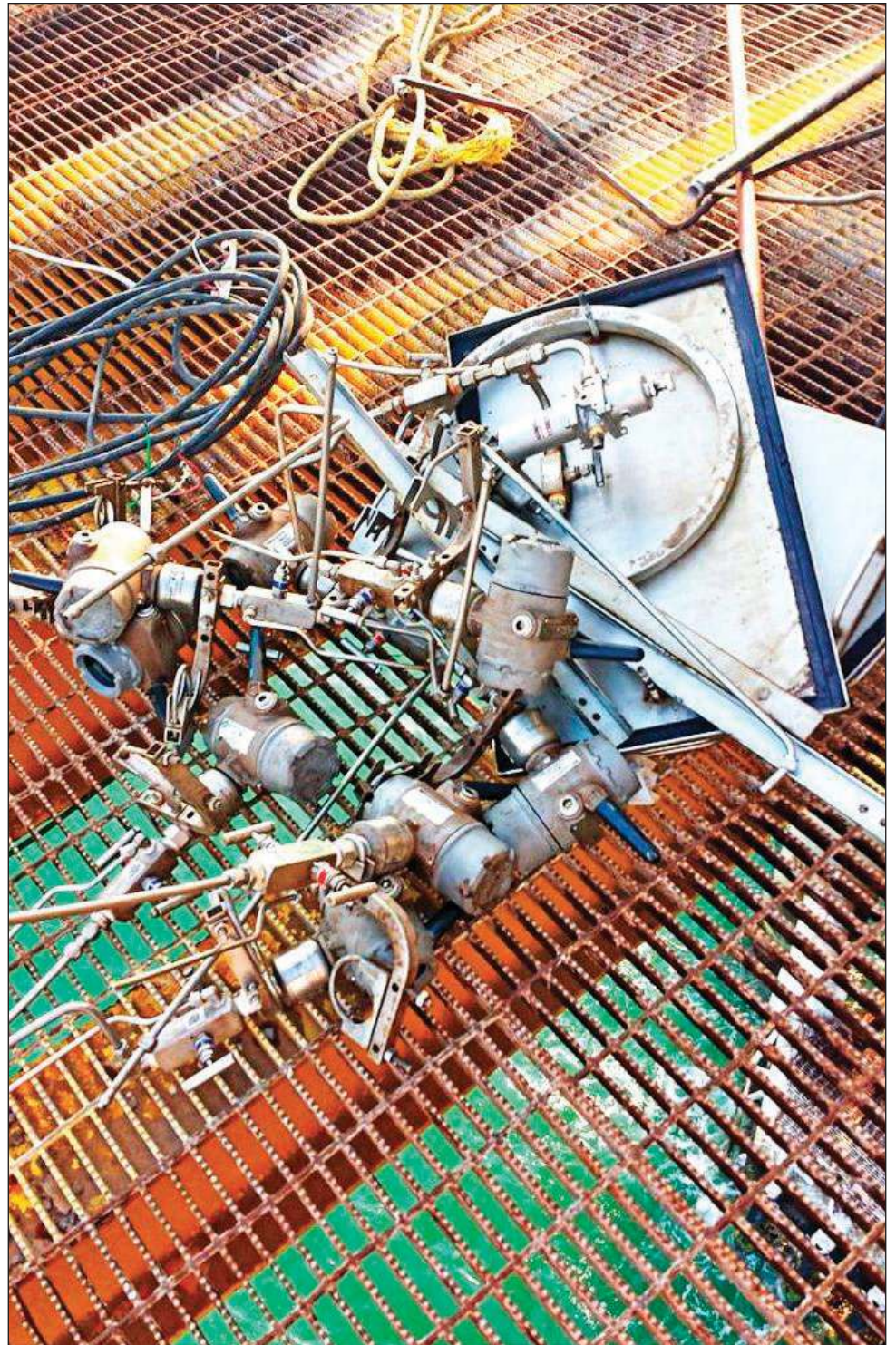
▲ El jueves 14 de julio se registró el mayor histórico en robos a instalaciones marinas perpetrados en una sola noche, al ser saqueadas cinco de ellas.

“No esperen a que se presente un muerto de entre los