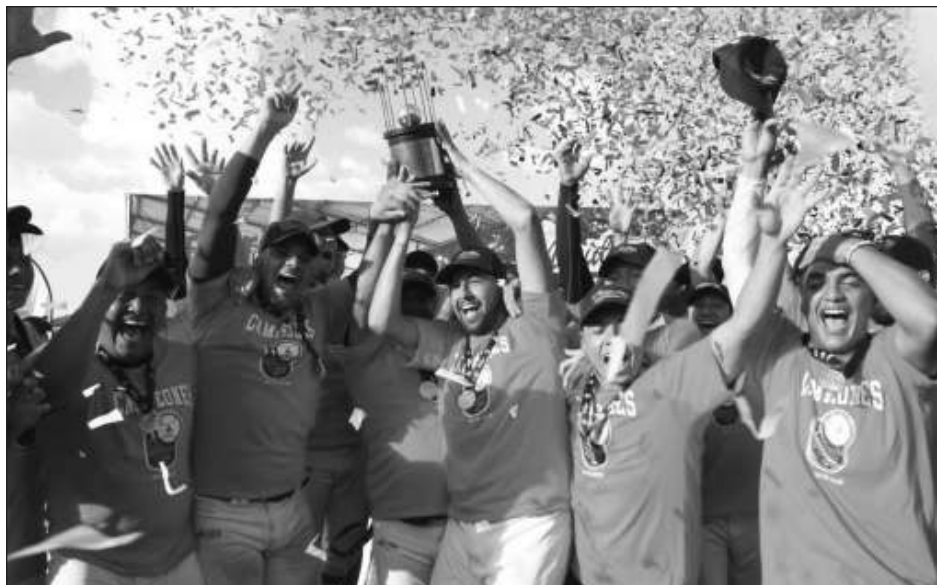
▲ Los Azulejos de la Dolores Otero son los actuales campeones de la Liga Meridana.

Antes, a partir de este sábado, comenzará la lucha por conseguir dos boletos.