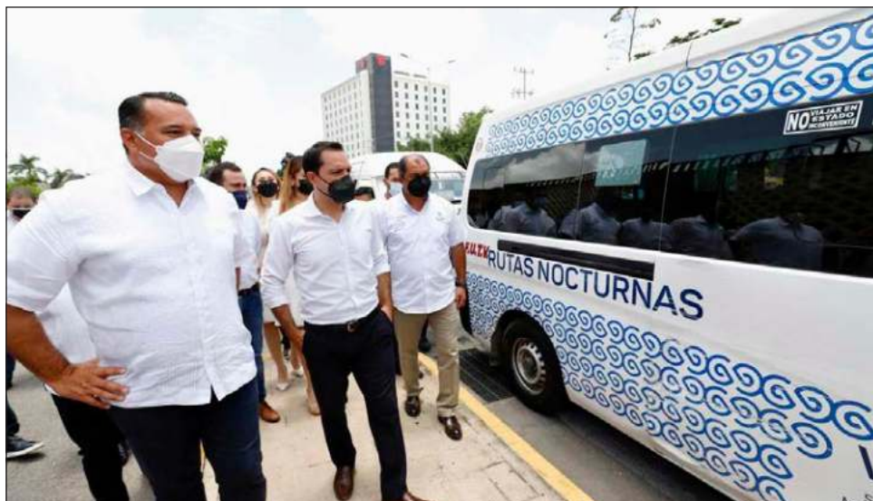
▲ Durante la presentación de las rutas nocturnas, el gobernador Mauricio Vila Dosal reconoció que el primer mes habrá ajustes, y por tal motivo el servicio será gratis en ese lapso.

Además, de los taxis colectivos del Frente Único de Trabajadores del Volante (FUTV), la ruta del periférico Va y Ven también se mantendrá en operaciones en este nuevo horario nocturno. Las unidades conta-