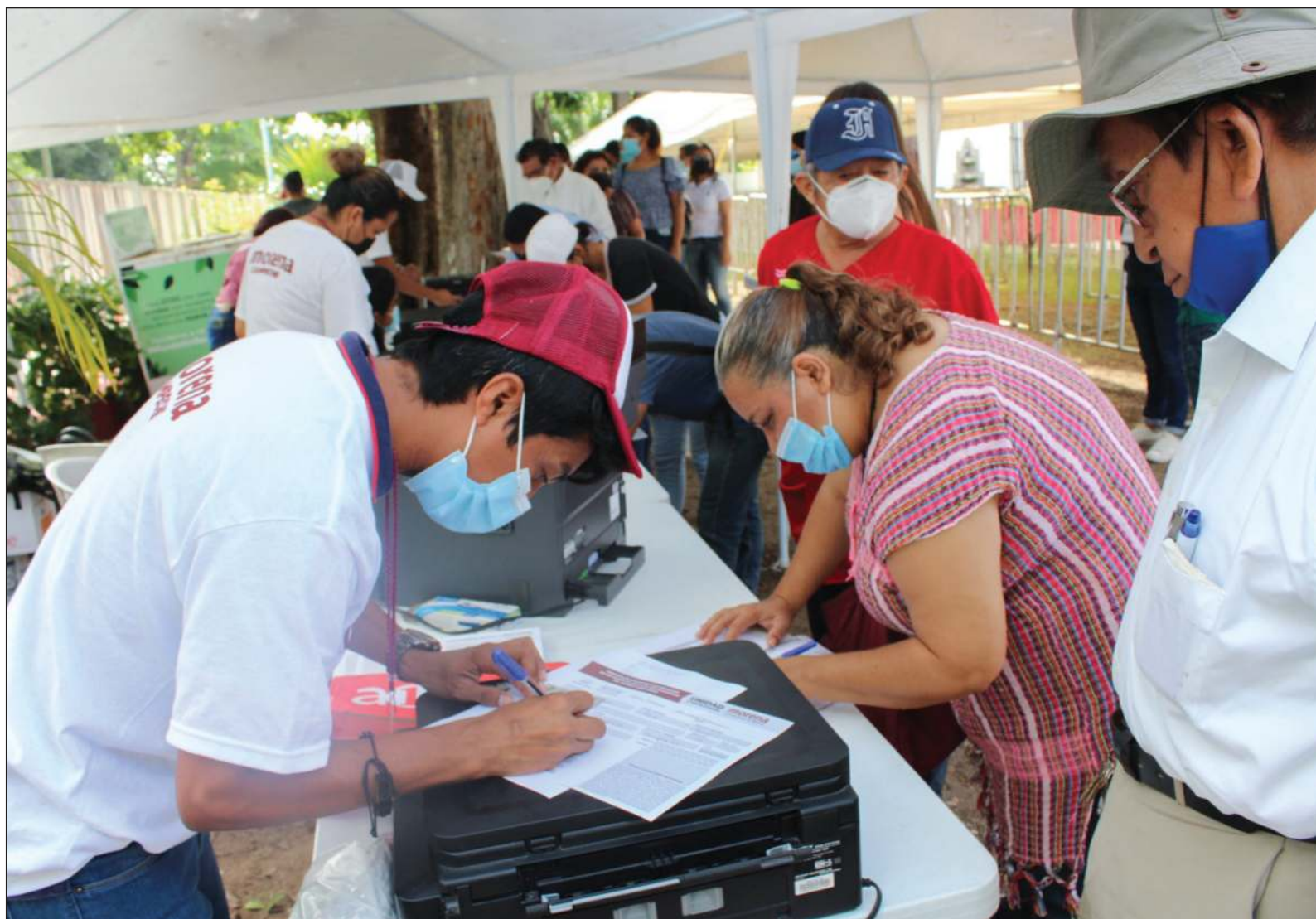
▲ “En esa aquelarre para mantener el control, no le importó escarbar en la pobreza para que, a cambio de un mísero pago, hombres y mujeres votaran por titeres en manoseadas listas. Cien, doscientos, quinientos pesos por poner una tacha en el nombre que yo te indique”.