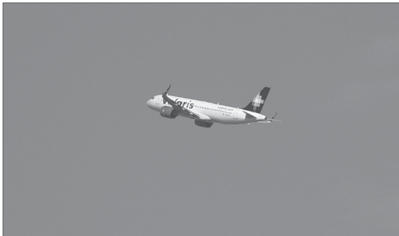
▲ El lunes, en el último vuelo de Volaris en la entidad (Campeche-CDMX), el avión salió con todas sus plazas vendidas.