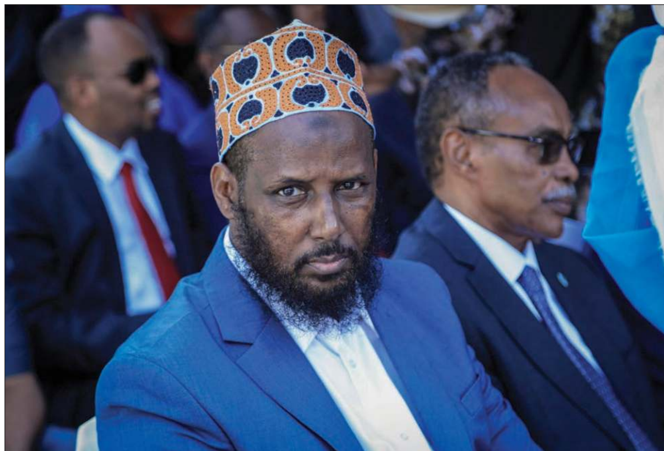
▲ Mukhtar Robow alguna vez elogió a Osama bin Laden y trató de imponer un estado islámico en Somalia. En 2008, Estados Unidos le impuso sanciones y lo calificó de "terrorista internacional con denominación especial".

Nunca se ha aclarado la razón que hubo detrás del arresto de Robow y el actual presidente de Somalia ha dicho varias veces que la detención no tuvo fundamentos legales. El gobierno no hizo comentarios sobre el nombramiento. Robow, que se cree