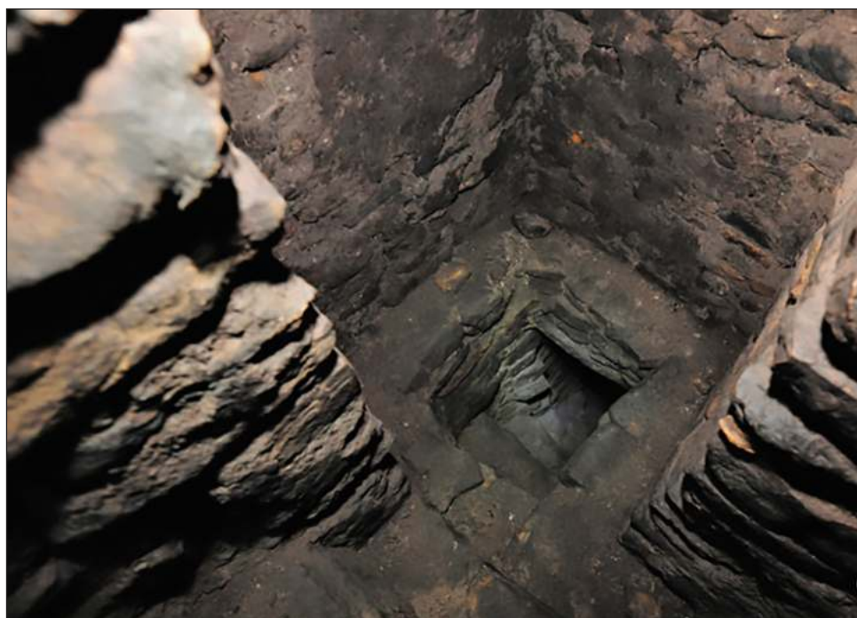
▲ Dentro de la cámara, los investigadores encontraron pelotas que tienen el glifo de la diosa lunar, lo cual indica que dentro hay alguna persona relacionada con la Luna.

“Ahí se convertía a los gobernantes y otros personajes del reino maya de Po’p no sólo en dioses, sino en estrellas, para formar parte, por ejemplo, de las bolas de hule usadas en el juego de