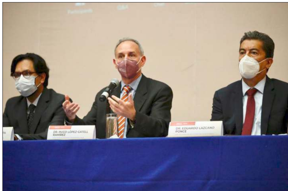
▲ Durante la emergencia sanitaria aumentó la utilización de servicios médicos privados, particularmente en los consultorios adyacentes a farmacias.

Arantxa Colchero, investigadora de la Dirección de