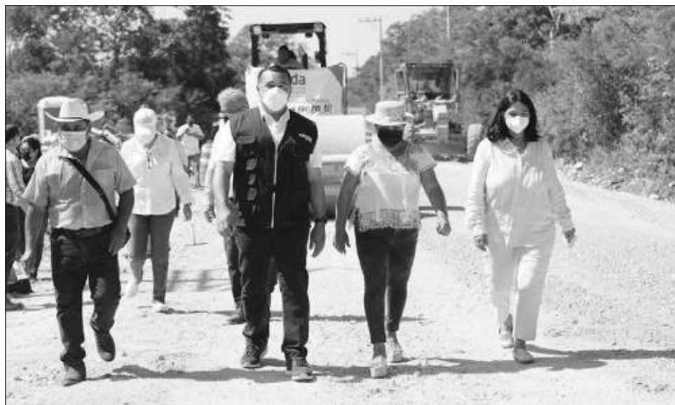
▲ La rehabilitación del tramo Komchén -Kikteil tiene un avance del 45%.

En el recorrido, informó que el ayuntamiento realiza una inversión de 7 millones 874 mil 390 pe-