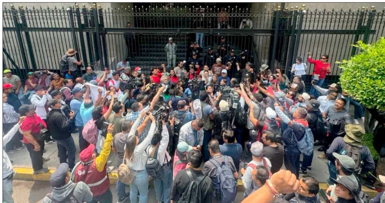
▲ Profesores de la CNTE inician una conferencia de prensa frente a la Secretaría de Gobernación, en la Ciudad de México.

Durante la reunión en la Segob, encabezada por los titulares de las dependencias Rosa Icela Rodríguez y Ma-