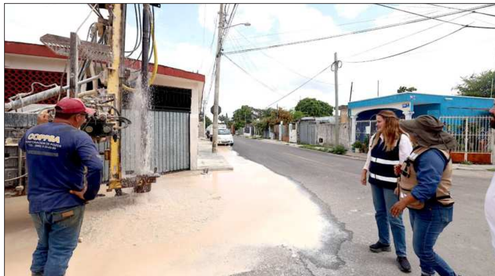
▲ La presidenta municipal escuchó reportes sobre inundaciones, afectaciones a vialidades y acumulación de agua, e instruyó reforzar las labores de desazolve de pozos existentes y la reparación de baches en puntos con mayores daños.

La presidenta municipal destacó que actualmente se construyen 120 nuevos pozos de absorción en diferentes sectores de Mérida con mayores problemas de acumulación de agua, además de continuar con labores de