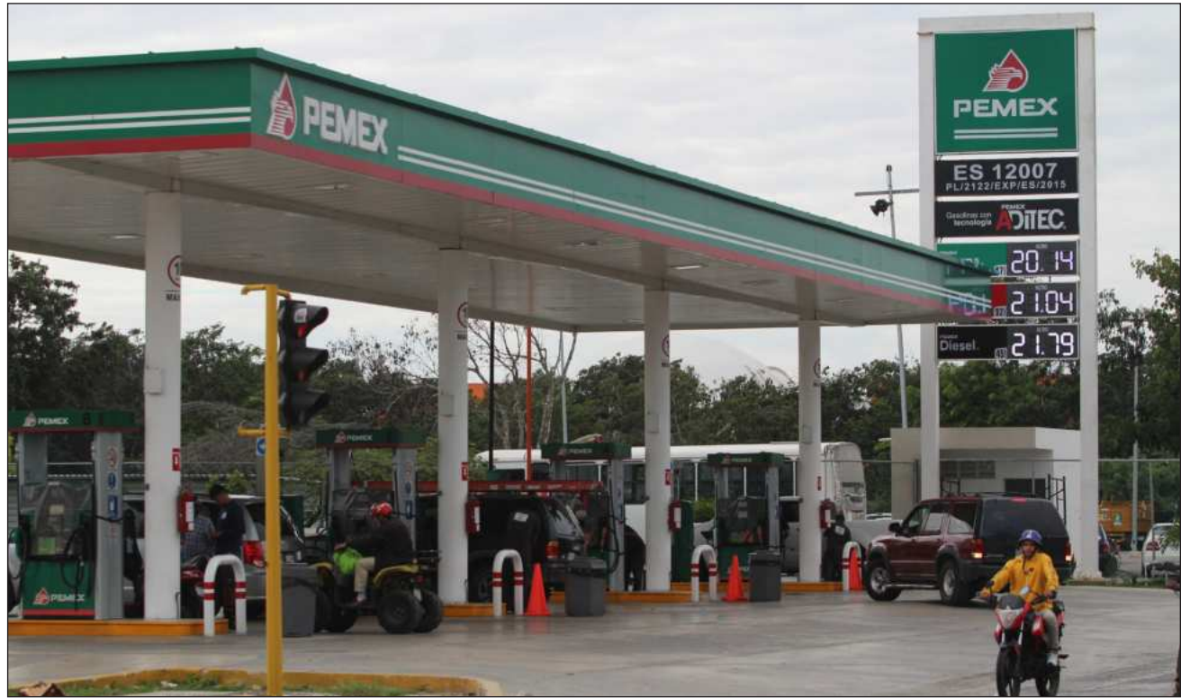
▲ Volatilidad del diesel, vital para el transporte de carga, persiste pese a los beneficios fiscales.

De manera general, opinó, el panorama económico en