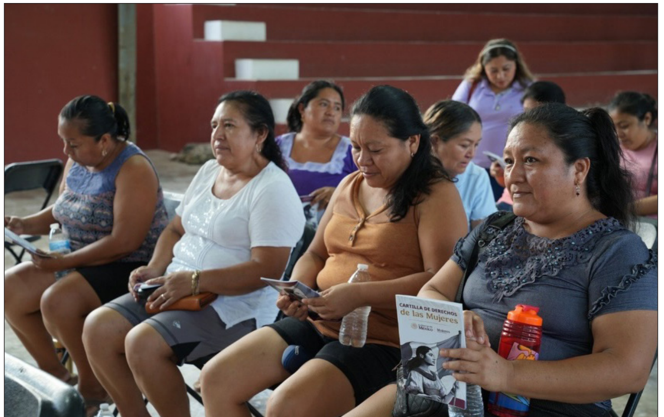
▲ Los 35 millones 147 mil 901 pesos facilitarán el desempeño de los 32 Centros Libre que actualmente operan en 29 municipios de Yucatán y que ofrecen asesoría jurídica y apoyo sicoemocional a las yucatecas.

Estos recursos facilitarán el desempeño de los 32 Centros Libre que actualmente operan en 29 municipios de