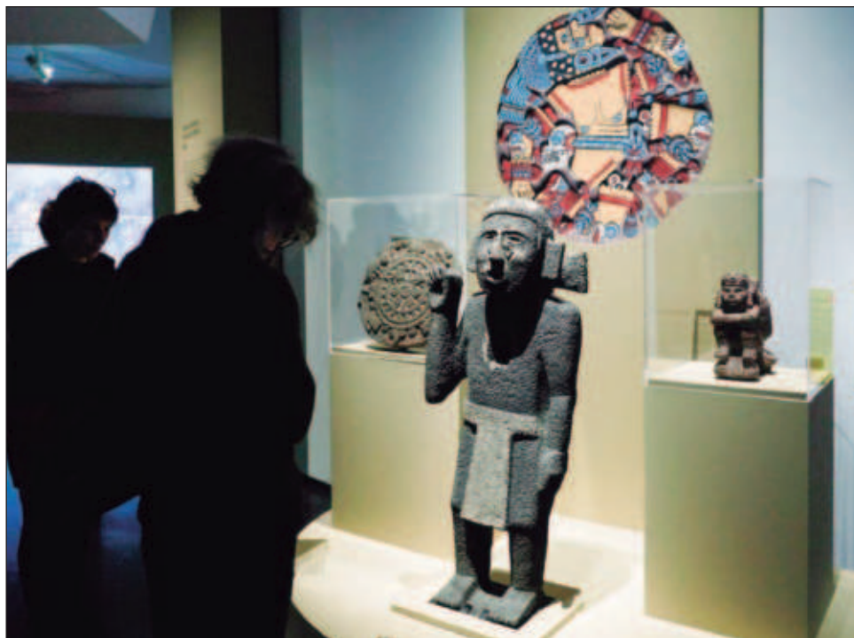
▲ La muestra histórica permanecerá abierta hasta el próximo 8 de septiembre de este año.

Cipactli, un ser mitológico mitad cocodrilo y mitad pez retratado en la exposición, encarna esa dualidad.