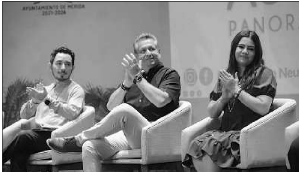
▲ El alcalde de Mérida informó que el ayuntamiento también abrió el Centro de Orientación para la Primera Infancia (COPI), a cargo del DIF y especializado en la atención de las infancias.

Explicó que la respuesta a la importancia de que Mérida cuente con una institución de este tipo fue muy rápida, ya que tan solo en esta administración se han atendido a más de 70 mil personas a través del Departamento de Psicología, lo que es