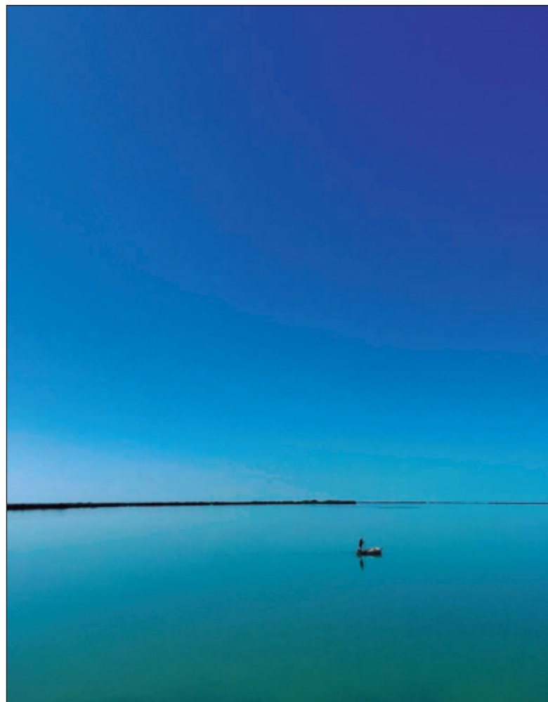
▲ “En barcos con mandíbulas cuajada de arpones, la paloma compartió brisas con gaviotas caníbales, aquellas que hablan todas las lenguas del mundo”.

Las misiones de las palomas mensajeras, por lo general, eran ríspidas y rápidas: llevar instrucciones de un frente de batalla a otro, esquivando en el cielo proyectiles y almas perdidas; solicitar medicamentos o tipos de sangre específicos entre un hospital a otro, intercambiar información confidencial entre naciones en guerra... Los años y los miles de kilómetros invertidos por la que convalece en Oxxutzcab son to-