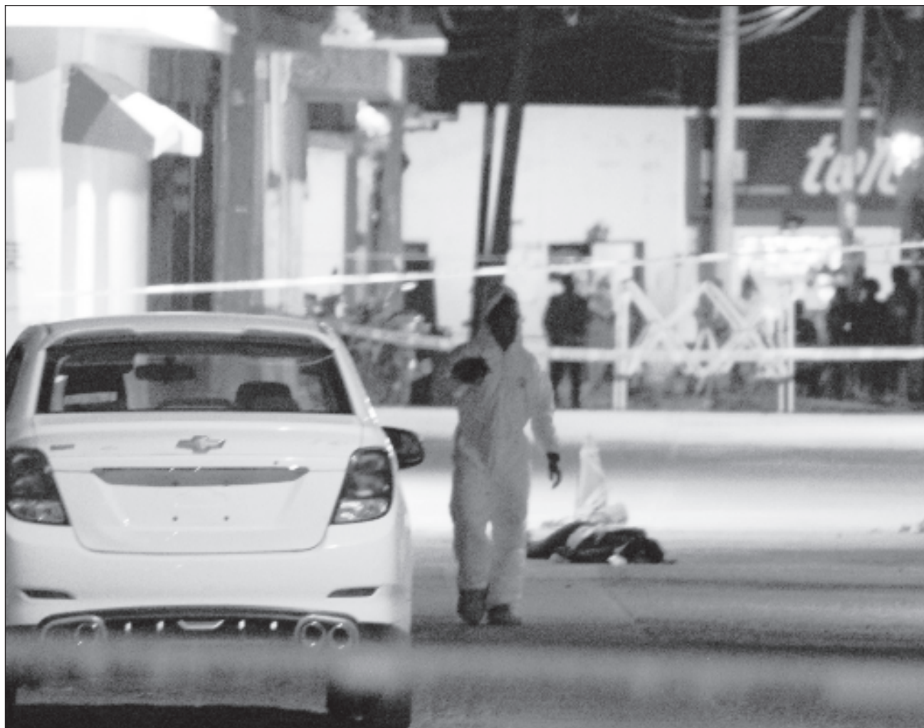
▲ El gobierno federal detalló que le corresponde brindar protección sólo a aspirantes a la Presidencia de la República, así como a las nueve gubernaturas que están en juego y a los que van por una curul en el Congreso de la Unión.

En tanto para los aspirantes locales, como la candidata a la alcaldía de Celaya, se dio