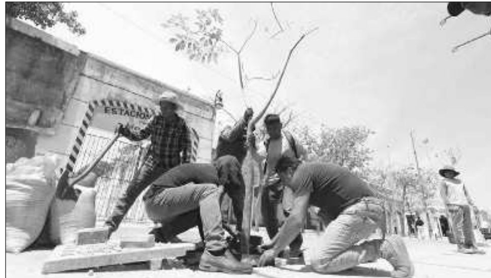
▲ El gobierno del estado sembrará 150 ejemplares de la especie maculís rosas.

La plantación de estos árboles contempla el tramo de la calle 60 que va de la 45 a la 61 y parte de la 47 por el parque de Santa Ana y se realizará poco a poco. Los maculís que se plantarán nacieron en bolsa y fueron cultivados en sol y es la especie más apta para el Corredor Turístico y Gastronómico pues, cuando crezcan, compondrán un atractivo túnel de floración rosada.