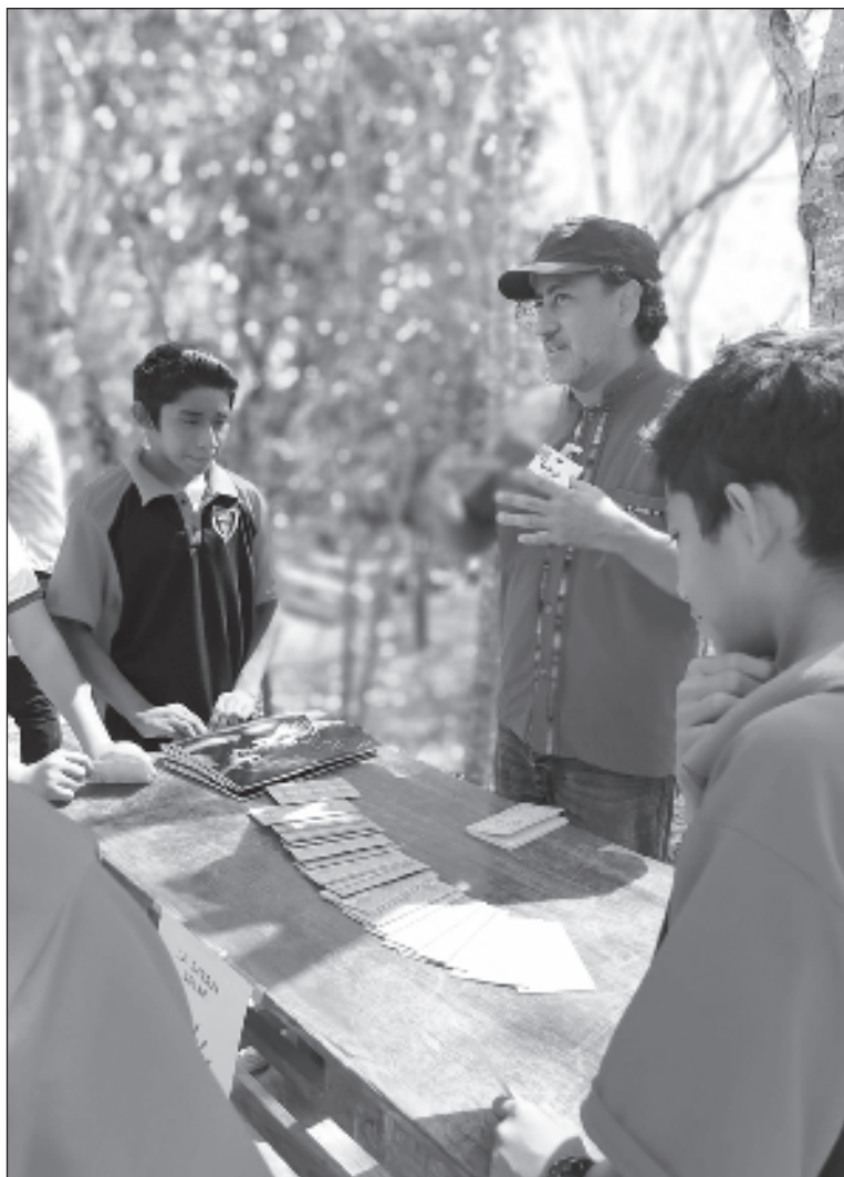
▲ “El plantel tiene un total de 50 alumnos: 26 son hombres y 24 mujeres, cuenta con tres docentes y tres aulas, sin laboratorios”.

Se tuvo también el taller sobre la Diversidad de chiles que hay , y que todos ellos vienen de su ancestro el Chile silvestre que tenemos en Yucatán el Chile Maxito, un chile chiquito, casi sin pulpa y lleno de semillas, su función asegurar su reproducción. La Química se construye con modelos, donde