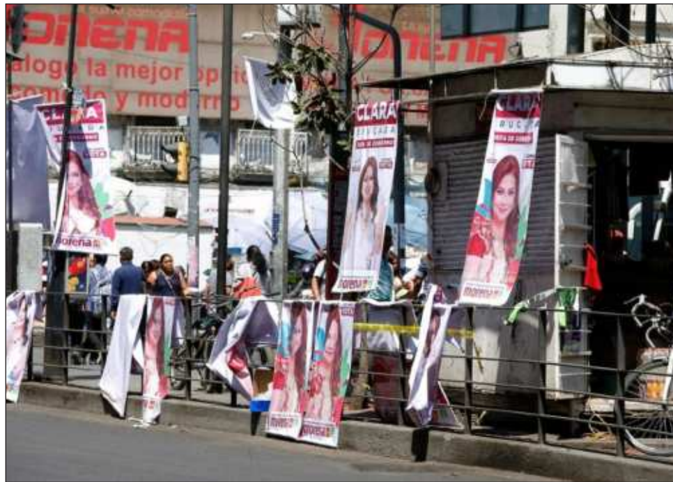
▲ Con el rostro cubierto, las cuadrillas retiran pendones, carteles y mantas, se trasladan en autos y operan en cuestión de minutos y durante la madrugada.

En sus redes sociales difundió un video en el que se puede observar a