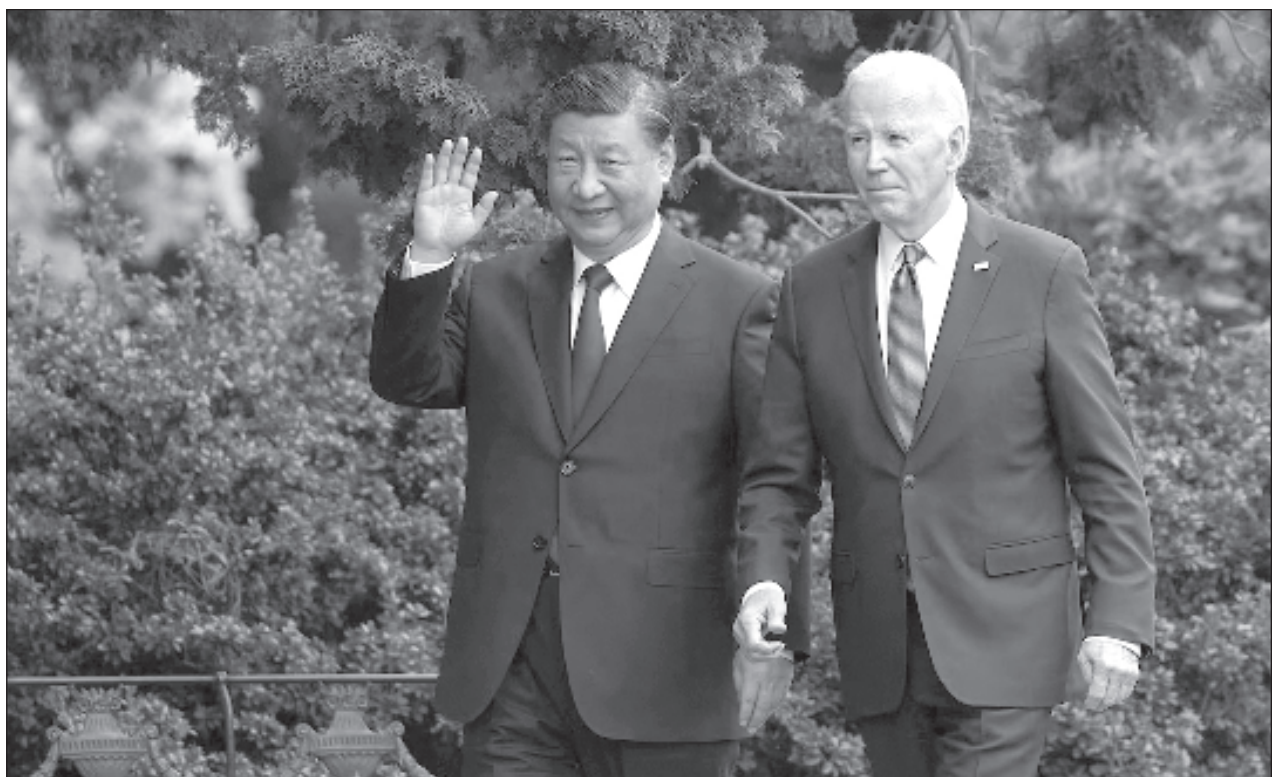
▲ El presidente Joe Biden y el presidente chino Xi Jinping realizaron de manera "sincera y constructiva" la primera conversación entre los líderes desde que su cumbre durante noviembre en California, destacó la Casa Blanca.

En la cumbre de noviembre, Biden y Xi también acordaron que sus gobiernos mantendrían conversaciones formales sobre las promesas y los riesgos de la inteligencia artificial avanzada.