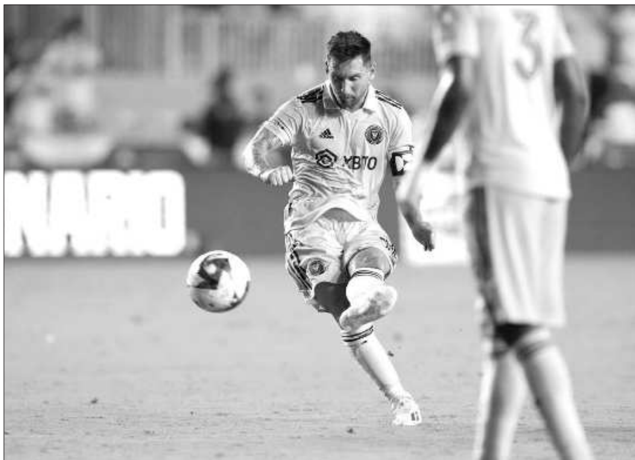
▲ En las últimas semanas, Lionel Messi realizó un trabajo específico de recuperación en los entrenamientos con el objetivo de estar listo para los cuartos de la Copa de Campeones; este torneo otorga al ganador el pase para el Mundial de Clubes 2025.

“Hay que pensar que estamos recién a principios de abril y esto recién empieza,