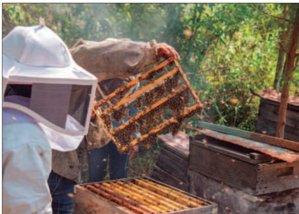
▲ En Chiapas existen 161 mil 822 colmenas repartidas entre 4 mil 778 apicultores.