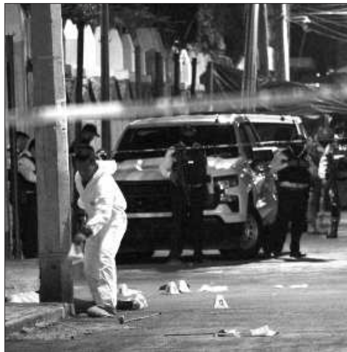
▲ El clima en Guanajuato y en varias otras entidades había mandado ya bastantes señales de advertencia. El resultado fue que en la primera jornada fue abatida la candidata.

La violencia política, en cualquier expresión y sea quien sea la víctima o su filiación partidista, siempre será condenable; no importa si se trata de candidatos registrados, precandidatos o personas que únicamente hubiesen expresado su intención de participar en la contienda. Lo importante en la democracia es ofrecer al pueblo los mejores perfiles disponibles para cada cargo y