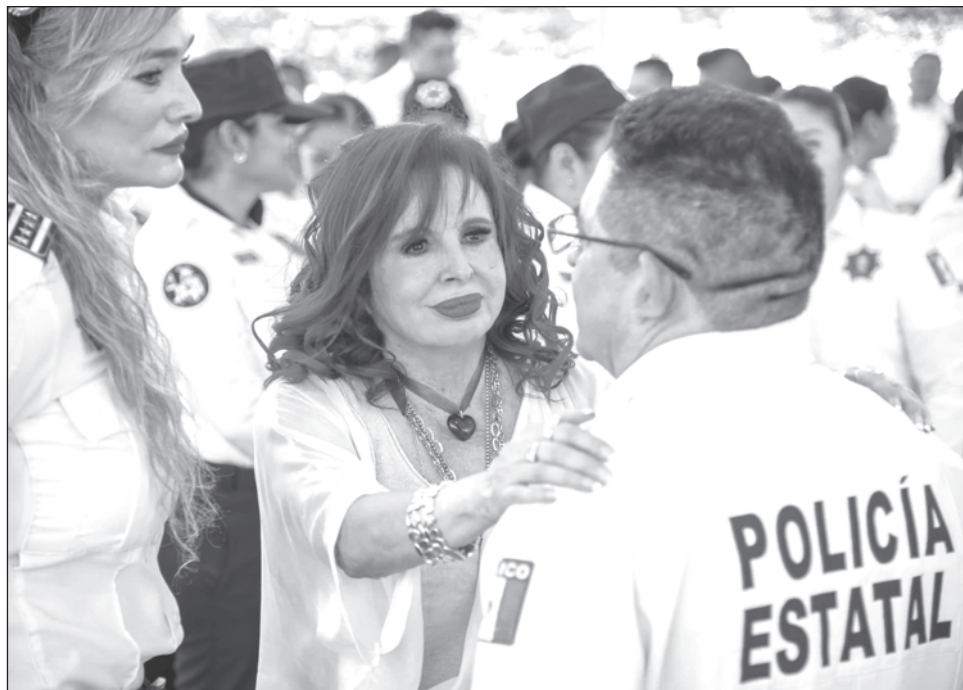
▲ Sansores anunció la creación de una “nueva policía” que se integrará con los elementos que abandonen la protesta y con egresados de la Academia.

Sansores culpó a Alejandro Moreno Cárdenas ( Alito ), ex gobernador del estado, y a Eliseo Fernández, ex alcalde de Campeche municipio, de ser los autores intelectuales de esta manifestación contra Marcela Muñoz Martínez y sus mandos policiales, y al menos a nueve elementos de los cuales mencionó al Chevy, al Cheetos, y al Charmin, de ser los agentes que controlan a todo el grupo de manifestantes bajo amenazas.