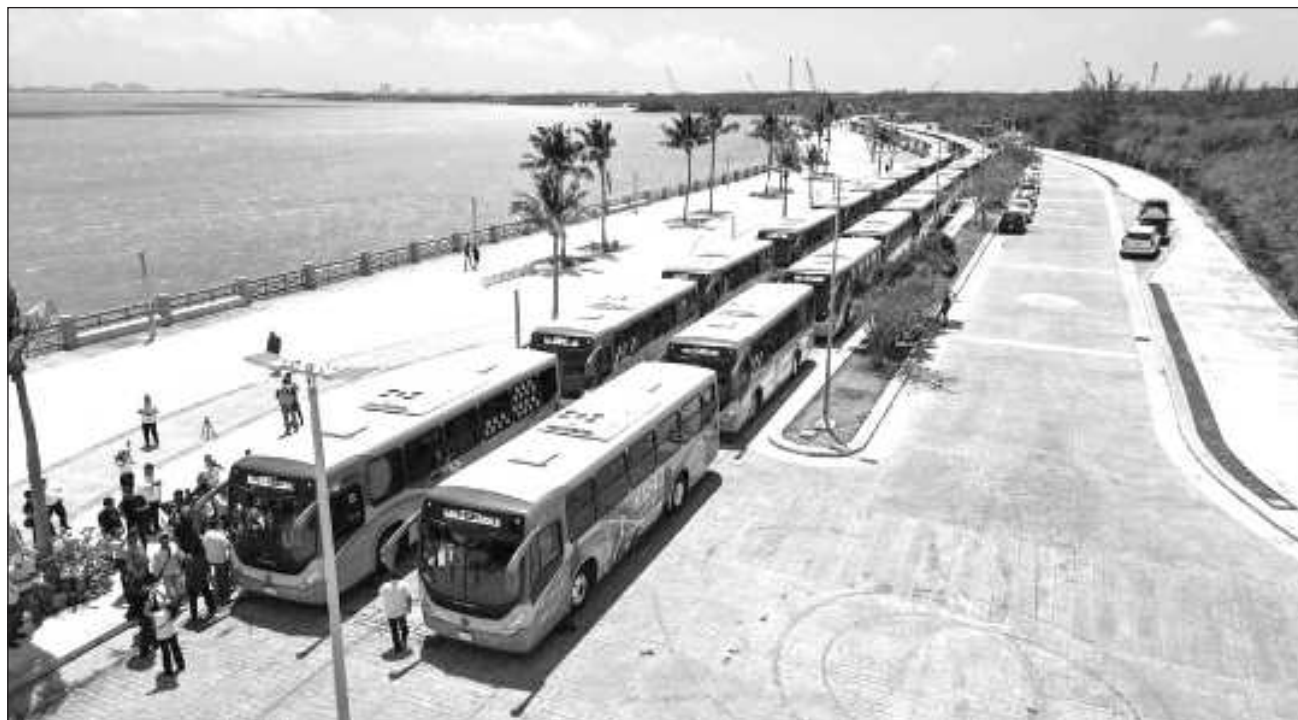
▲ Las 100 nuevas unidades son modernas, con aire acondicionado y cámaras de seguridad.

“Son parte del sistema, lo que estamos haciendo ahorita es ordenando. Los mototaxis están ya en un proceso, sacando sus permisos, los que están saliendo a las avenidas principales los estamos deteniendo, en lo que va del año tenemos más de 40 en el corralón. Los taxis prestan un servicio básico para la ciudad junto con las plataformas digitales, que ya