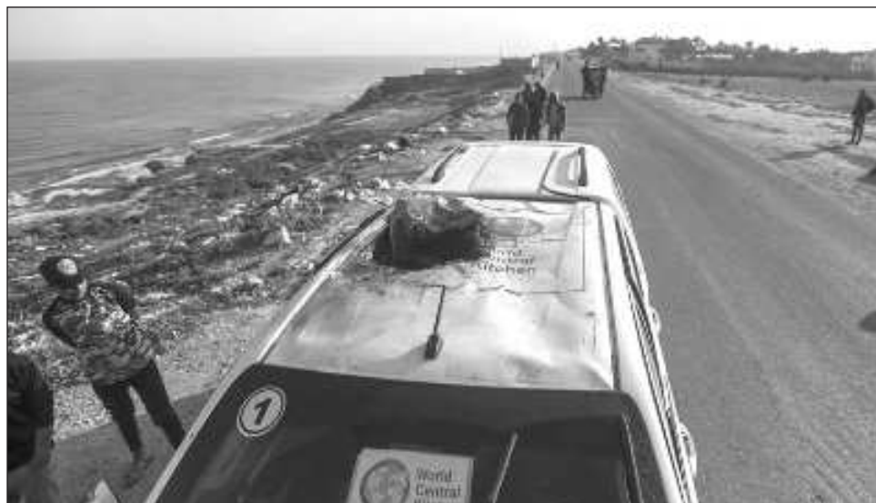
▲ Los trabajadores del equipo de World Central Kitchen “trabajaban para apoyar nuestros esfuerzos humanitarios de entrega de alimentos en Gaza”, informó la ONG en redes sociales.

“Nos han llegado noticias de que miembros del equipo de World Central Kitchen