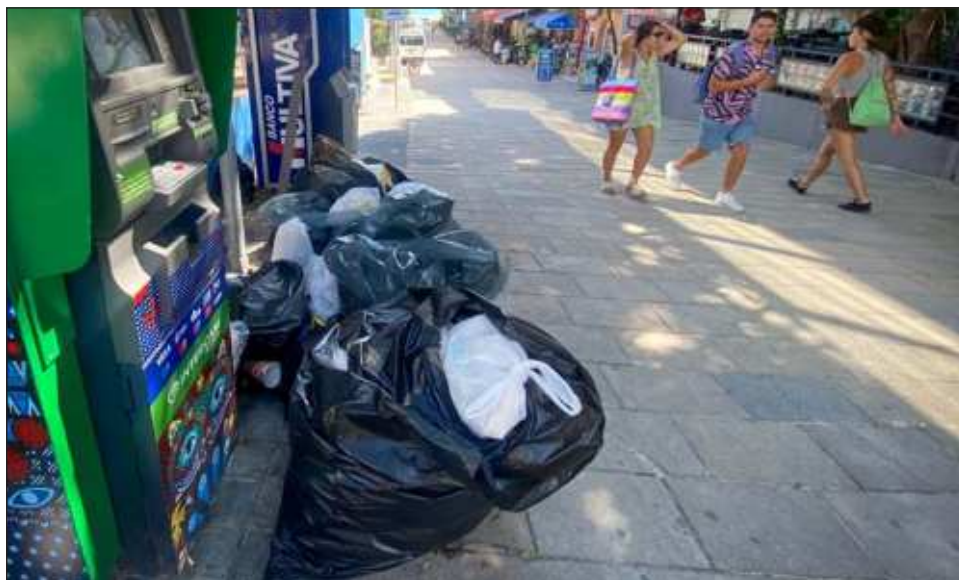
▲ Con motivo de la temporada alta se están recolectando hasta más de mil 500 toneladas diariamente, por lo que se tiene que aumentar la frecuencia del ruteo.

“Lo que nosotros siempre hemos recomendado a la ciudadanía es hacer una buena separación de los residuos, eso a nosotros nos ayuda en todos los sentidos, que puedan separar lo orgánico, de lo