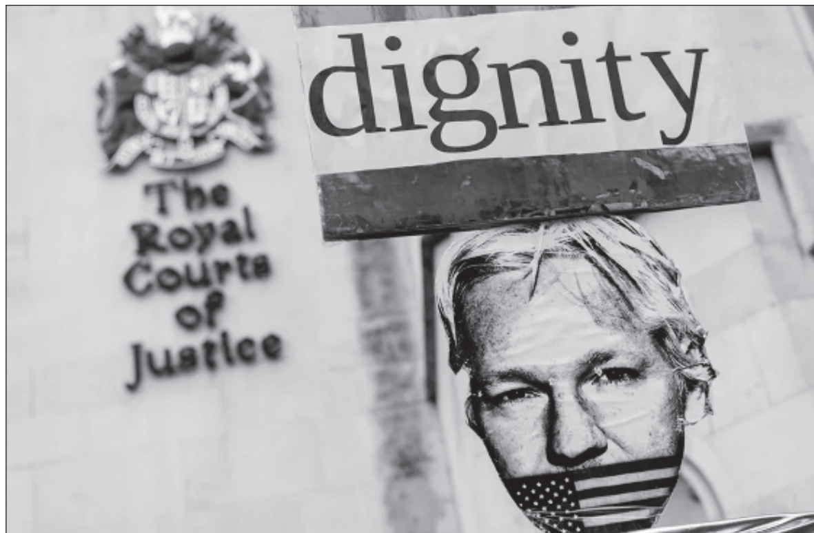
▲ "Lo ocurrido con Julian es un mensaje para todos aquellos que se atreven a publicar o revelar secretos de estado, vídeos, cables diplomáticos, información que las élites que gobiernan el planeta no quieren que vean la luz".

El pasado 26 de marzo de 2022, el Tribunal Superior del Reino Unido emitió una decisión sobre la posibilidad de que el periodista Julian Assange pudiera apelar su extradición a Estados Unidos. Como hemos explicado en artícu- los anteriores, Estados Unidos está tratando de llevar a juicio al fun- dador de WikiLeaks y periodista australiano, por exponer crímenes