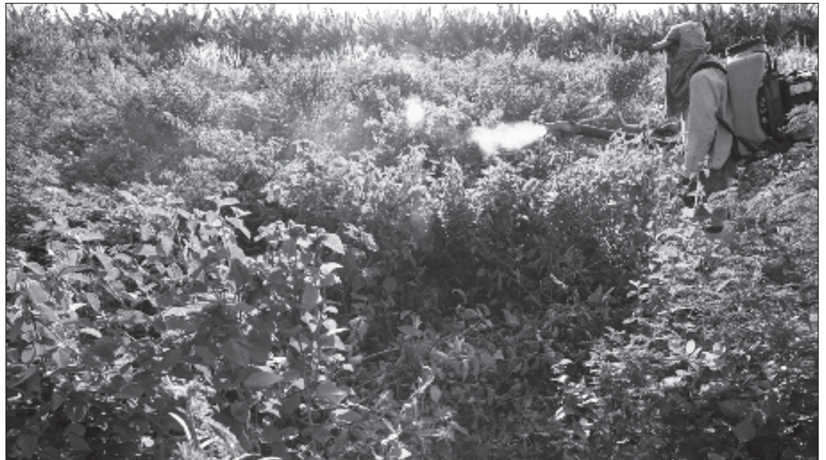
▲ "Las semillas de los cultivos transgénicos contaminan los cultivos locales, el uso excesivo y entonces poco regulado de un poderoso herbicida dañaba otros cultivos, especies de flora silvestre diversas, y polinizadores, y se temía que los residuos de estos herbicidas podrían ser responsables de severos daños a la salud humana".

Cuando empezaron las pugnas entre Monsanto y los pequeños productores locales, que por cierto ganaron algunos casos en las cortes, los argumentos parecían claros y más o menos directos: las semillas de los cultivos transgénicos contaminan los cultivos locales, el uso excesivo y entonces poco regulado de un poderoso herbicida dañaba otros cultivos, especies de flora silvestre diversas, y polinizadores, y se temía que los residuos de estos herbicidas podrían ser responsables de severos daños a la salud humana. Monsanto, sus abogados, y una tropa de expertos que - financiados por el gigante de la industria química - orientaban sus indagatorias para concluir (de una manera por cierto poco científica, al tratarse de encontrar evidencias que demostraran la validez de conclusiones previamente determinadas), generaron toneladas de información que pretendía demostrar más allá de toda duda razonable que sus agroquímicos, y sus organismos genéticamente modificados, eran