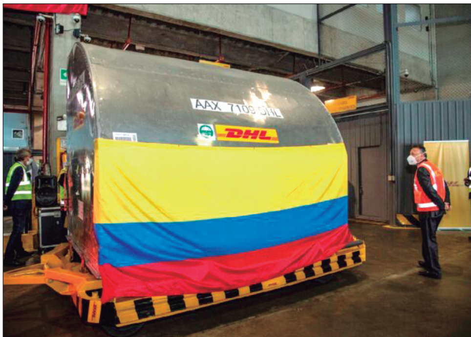
▲ Perú, El Salvador y Bolivia serán los siguientes países a los que llegarán vacunas a través del mecanismo Covax.

El objetivo de la OMS es bajar los niveles de contagio y ayudar a prevenir la emergencia de variantes del coronavirus. 244 millones de dosis