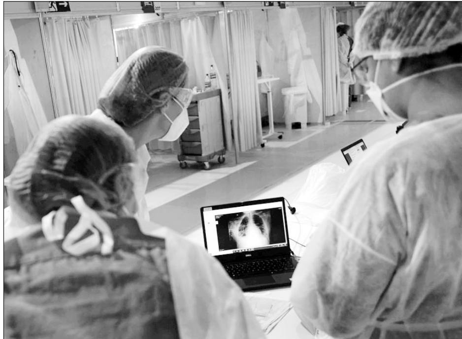
▲ A la fecha se han ofrecido 149 teleconsultas en especialidades de pediatría, medicina interna y ginecología.

El proyecto se aplica en los hospitales integrales de Isla Mujeres, Kantunilkin y José María Morelos y cuentan con el equipamiento médico y tecnológico para implementar una red de interconexión con cuatro hospitales generales del estado: Cancún, Playa del Carmen, Felipe Carrillo Puerto y Chetumal, para realizar consultas de segundo nivel de atención y consulta externa en atención a los pacientes con diabetes, hipertensión arterial, mujeres embarazadas, atención