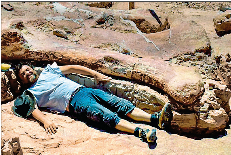
▲ En 2014 fueron encontrados una escápula muy completa, algunos huesos de las patas traseras, una parte del fémur y lo que sería el peroné del animal.

“Por la antigüedad de este material de 140 millones de