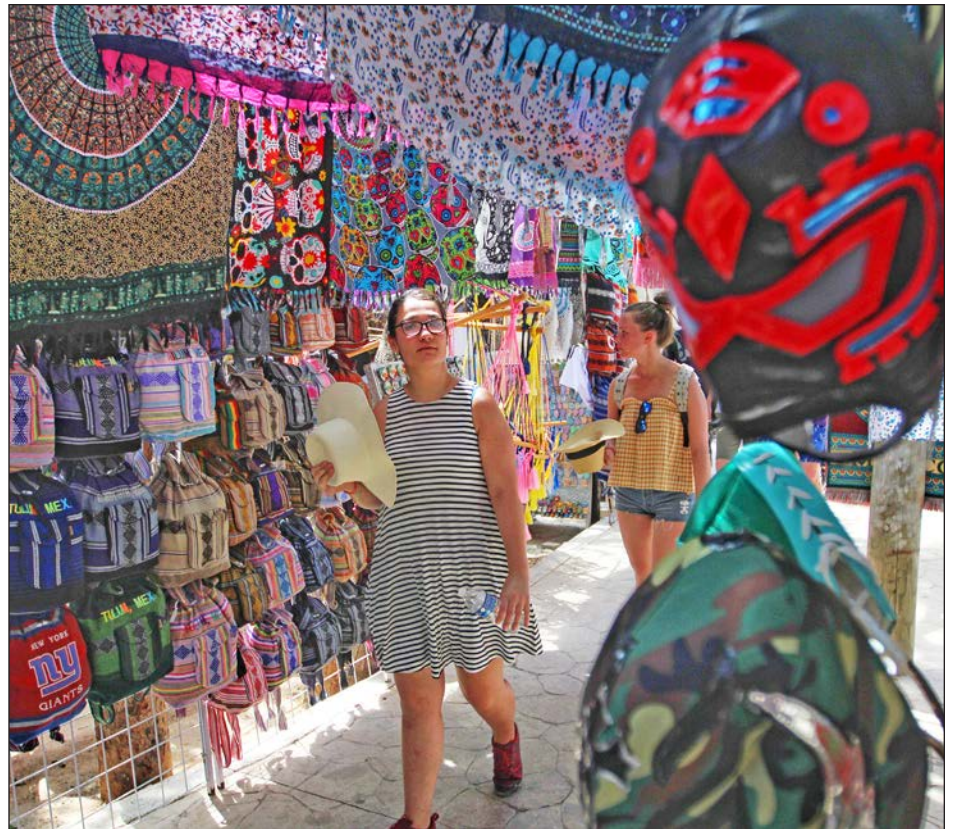
▲ Con estos apoyos, los artesanos mayas podrán adquirir materias primas de calidad que les permitan hacer sus obras para el turismo nacional e internacional.

"Se buscará qué trámites causan más conflictos y cuáles son los que más se prestan a la corrupción. Hasta ahora los más denunciados son los relacionados con la propiedad. Tulum no ha cumplido con la ley de participación ciudadana, hay que buscar soluciones comunes y este tipo de ejercicios deben ser recurrentes y propiciados por la iniciativa privada y la sociedad civil. Es necesario que el Cabildo se comprometa a armar la comisión anticorrupción", asentó.