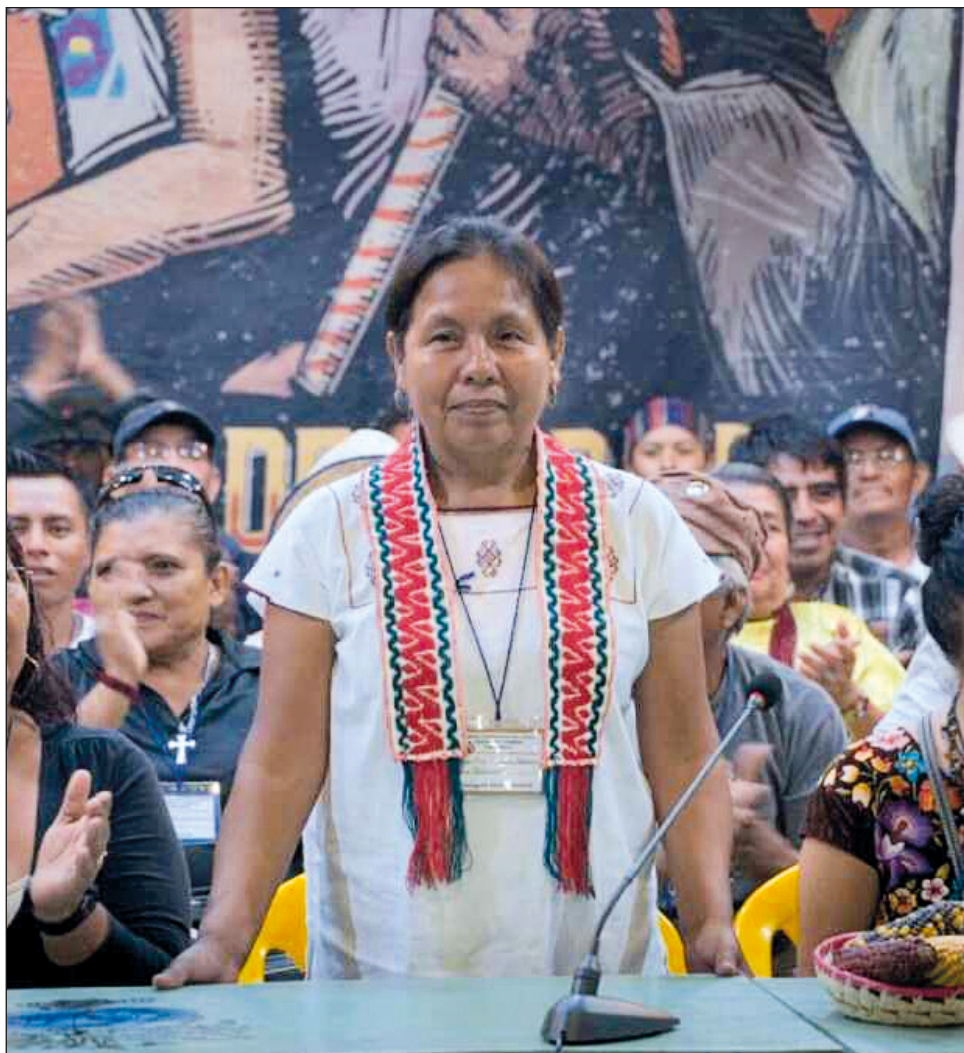
▲ En medio de las amenazas de los megaproyectos extractivistas, las mujeres indígenas se abren camino con la convicción de que un mundo mejor es posible.

El documental estará disponible de manera gratuita en www.ambulante.org el 10 de marzo a partir de las 19 horas hasta agotar 2000 visualizaciones.