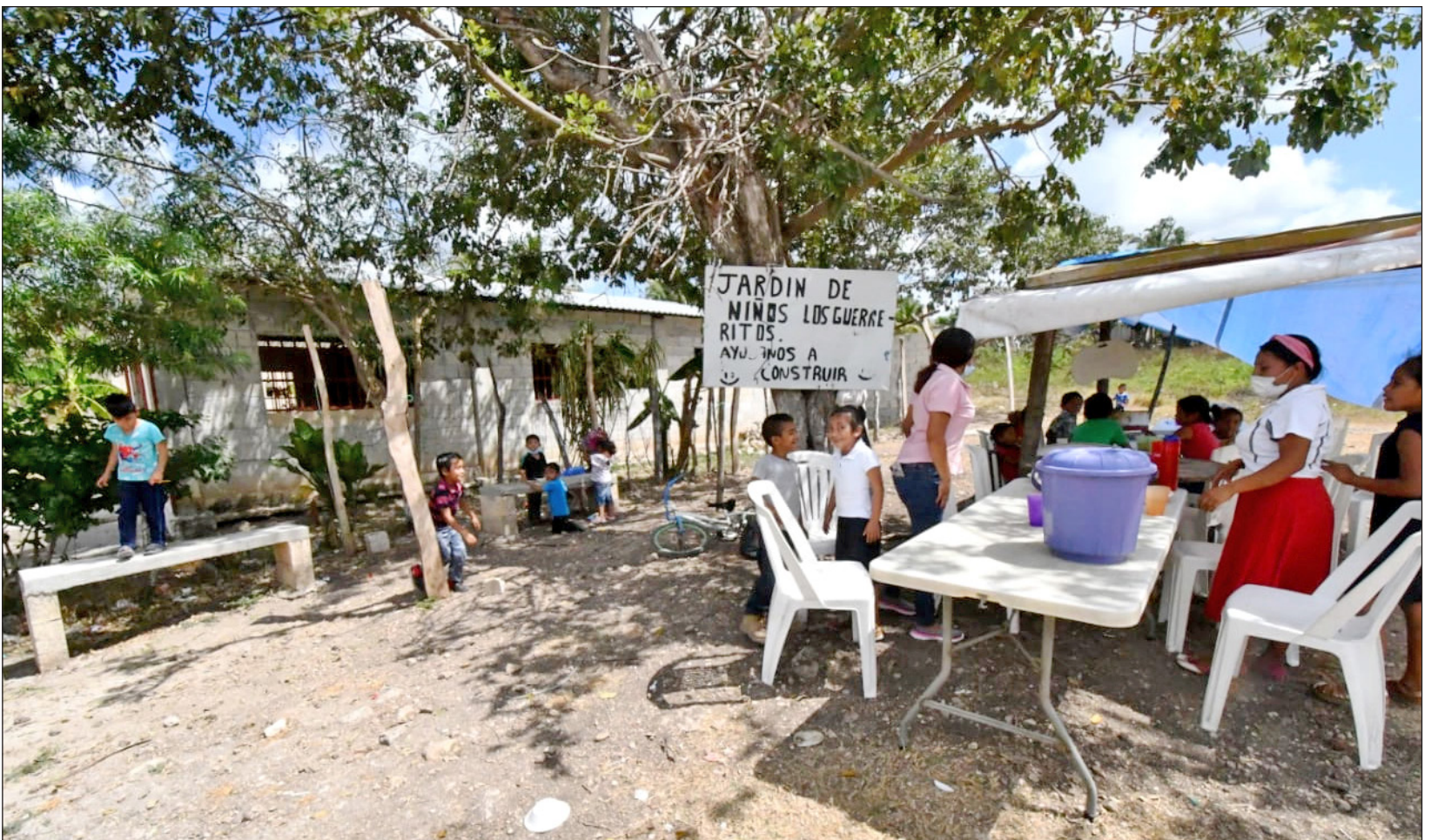
▲ La participación de los padres de familia es importante, pues aunque no tienen la posibilidad de adquirir equipo para las clases en línea, ayudan preparando alimentos para los pequeños, destacó la docente encargada de la escuela.

Cuando fue publicada la labor que hacen los fines de semana, el pasado lunes, les sirvió para que fueran localizados por representantes del gobierno estatal, ahora esperan que sean buenas noticias para los niños.