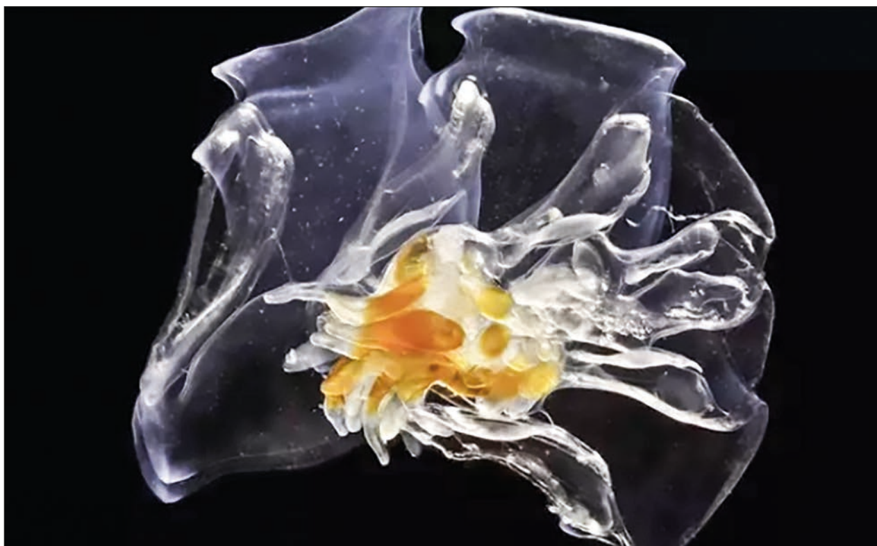
▲ Los científicos encontraron que 4°C de calentamiento redujeron la transferencia de energía en las redes tróficas del plancton hasta en 56 por ciento.

Se estima que el precio por el dron, el mando, los goggles, los cables y la batería sea de alrededor de 33 mil 500 pesos.