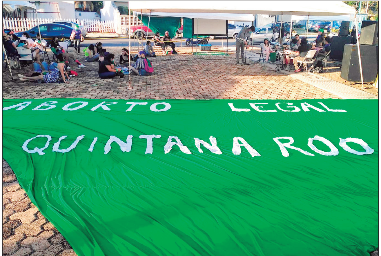
▲ Tras la votación, y conforme al acuerdo signado con el Poder Legislativo, las integrantes de la Red Feminista Quintanarroense desalojaron la sede del Congreso.

Tras la votación y conforme se habían comprometido en el acuerdo firmado