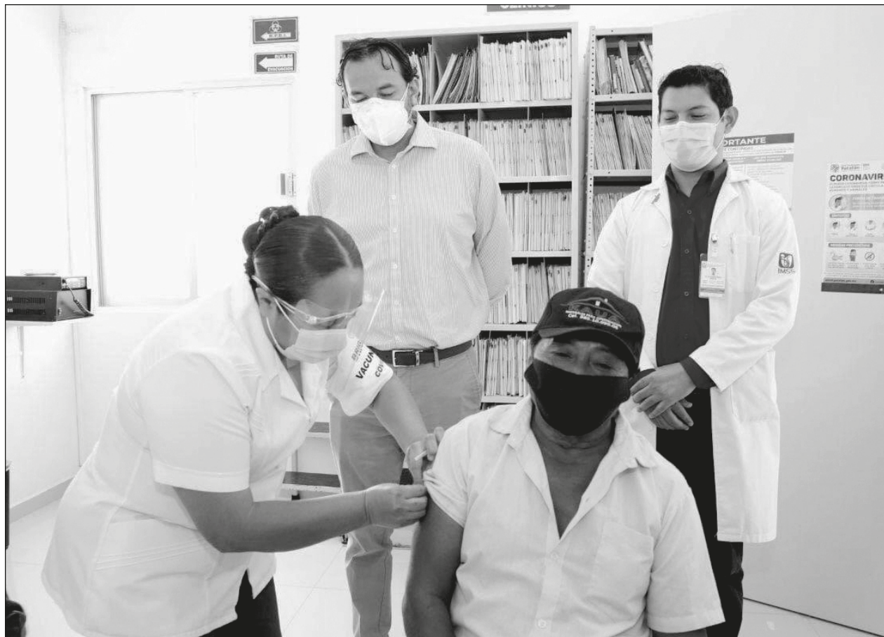
▲ El lote de vacunas que se aplica en Kaua corresponde al embarque que llegó a Yucatán el domingo 14 de febrero con 15 mil 630 dosis.

El Acuerdo Nacional por la Democracia es un exhorto del gobierno federal a que las y los gobernadores se mantengan de manera horizontal y respetuosa durante el próximo proceso electoral.