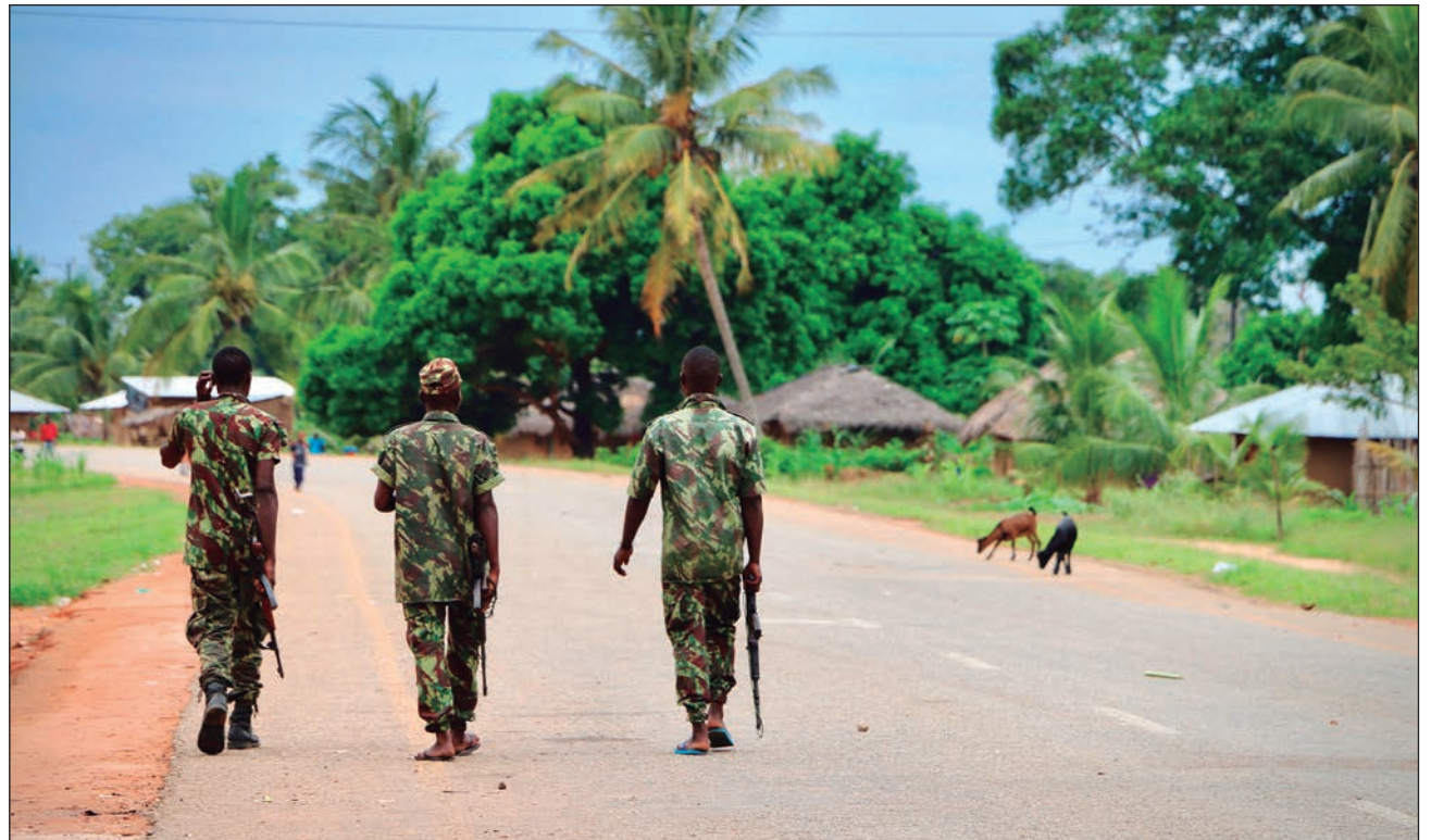
▲ La ONG asegura que en el país africano la población está atrapada entre las fuerzas de seguridad, la milicia privada que lucha junto al gobierno y el grupo armado de oposición Al Shabaab.

“Ninguno respeta el derecho a la vida ni las reglas de la guerra. Los tres han cometido crímenes, causando la muerte de cientos de civiles. La comunidad internacional no ha abordado esta crisis, pese a que se ha convertido en un conflicto armado en toda regla en los últimos tres años”, denunció.