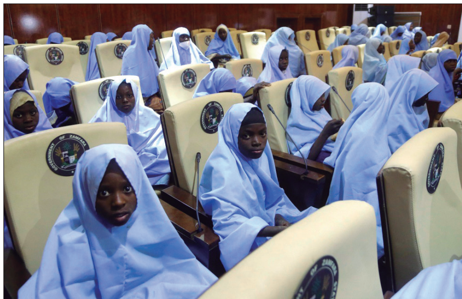
▲ Las autoridades reunieron a las jóvenes y les entregaron ropa limpia y un hiyab de color celeste.

Las jóvenes, de entre 12 y 16 años, visiblemente cansadas, llegaron el martes por la mañana en varios minibuses a Gusau (capital de Zamfara).