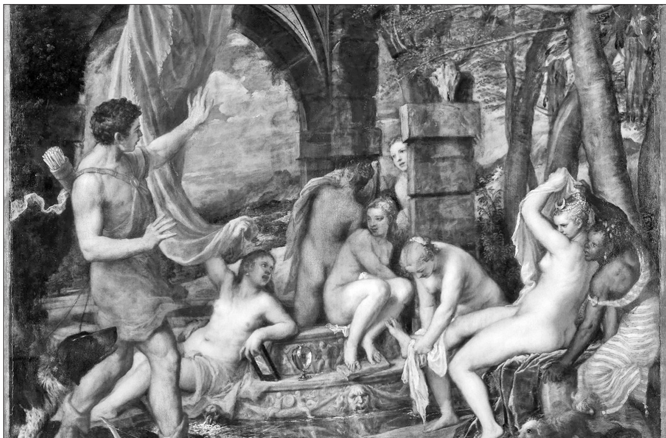
▲ La obra pictórica de los siglos XVI y XVII es rica en la representación de algunos relatos clásicos que transitan de la belleza y la crueldad del amor, a la severidad y la furia, la armonía y el sosiego, el tormento y la pasión. Foto fragmento de Diana y Acteón , de Tiziano

Para abordar una herencia cultural tan profunda, que está tan imbricada en la sociedad occidental, el Museo del Prado reunió y puso a dialogar a algunas de las piezas más grandes de este género de los siglos XVI y XVII.