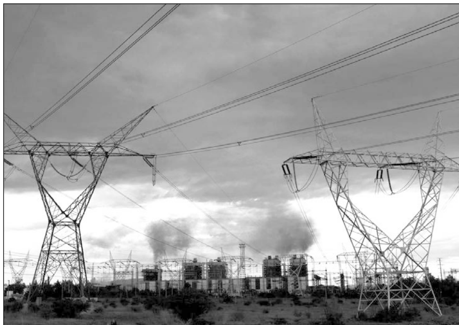
▲ La oposición alega que la reforma viola la Constitución y tratados internacionales, mientras que la iniciativa considera que se recupera la rectoría del Estado en el sector energético.

Esa iniciativa preferente del presidente Andrés Manuel López Obrador se aprobó con 68 votos a favor de Morena y sus aliados y 58 en contra del PAN, PRI, MC y PRD, durante un debate de casi cuatro horas, en una sesión digital, en la que el bloque opositor insistió en que la reforma viola la Constitución y tratados internacionales y contaminará el ambiente, mientras que el grupo mayoritario refrendó que se recupera la rectoría del Estado sobre sus recursos eléctricos, y se