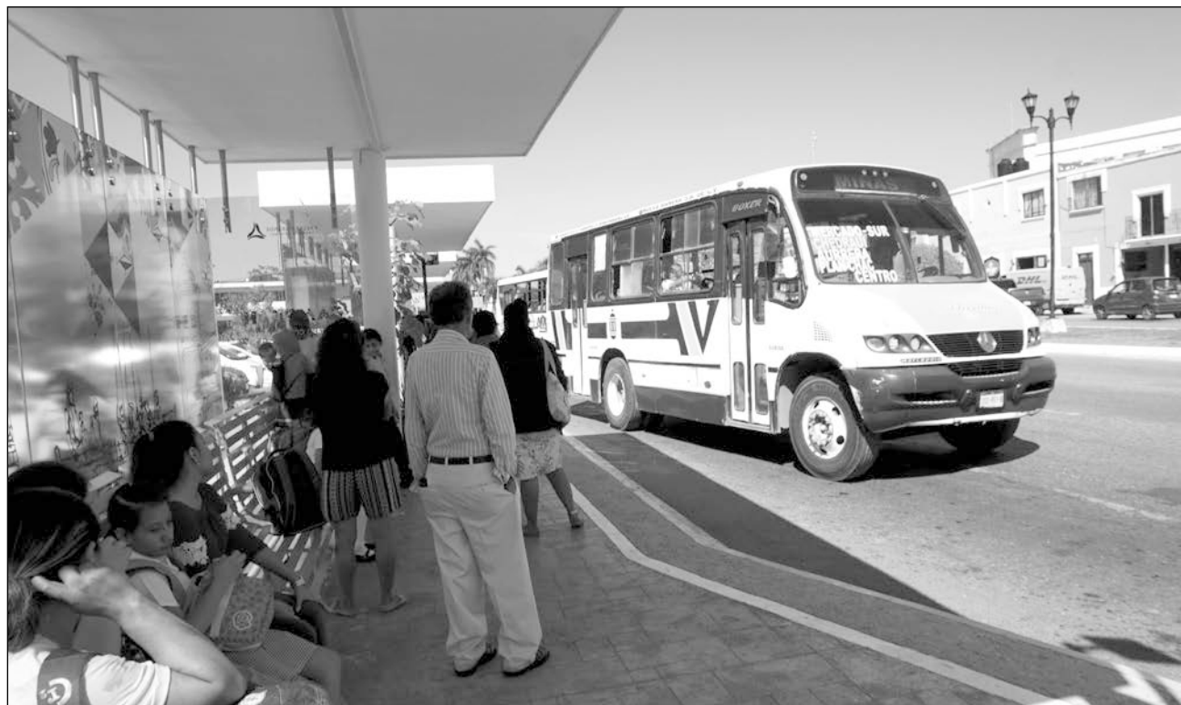
▲ Son 10 unidades de transporte público las que cuentan con el servicio de Internet para los pasajeros.

Grupo Comí también abarca las rutas de Maya-