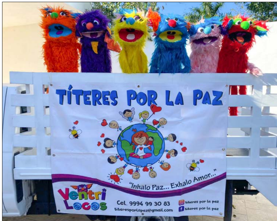
▲ Todos los juegos, canciones y títeres están enfocados en dar un mensaje de amor a los niños, a que se relajen y se apropien de valores positivos.

Para mayores informes, se puede visitar la página de Facebook de Títeres por la Paz , o al 9994993083.