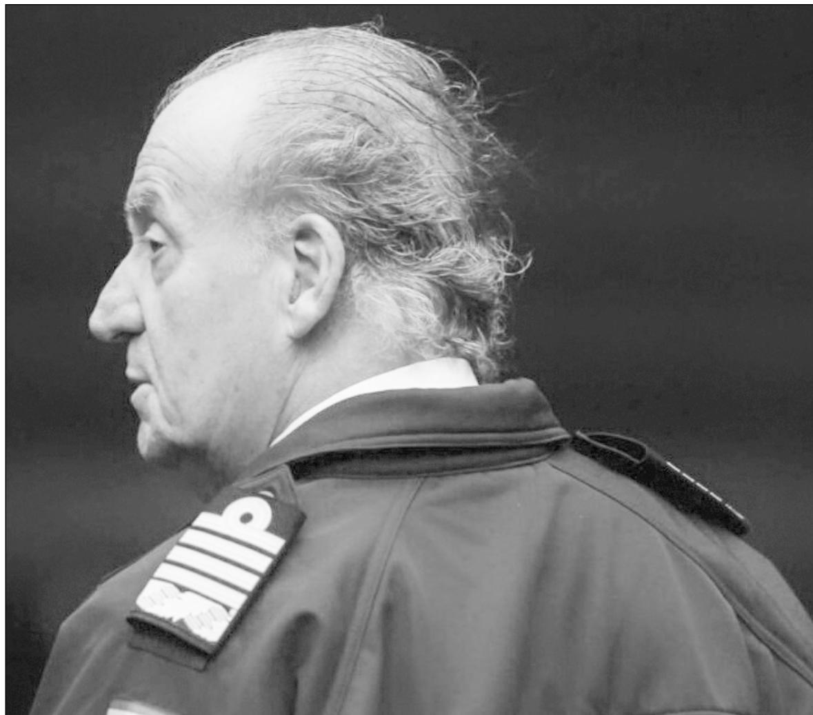
▲ Juan Carlos's legacy could have been brilliant. Instead, he will likely go down in history as a caricature.

JUAN CARLOS WENT on national television late that night to order the troops back to the barracks and the Civil Guard officers to relinquish their control over the Parliament buildings.